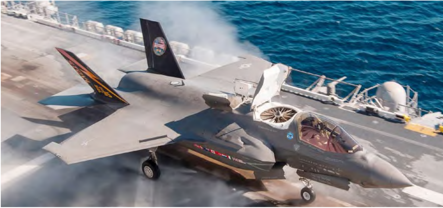
طائرة إف-35 الأميركية

♦ أمن السواحل: إغلاق مضيق البوسفور أمام السفن بسبب الضباب الكثيف