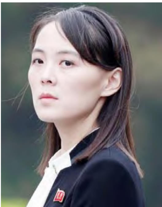
شقيقة الزعيم الكوري الشمالي

قالت وزارة الوحدة في كوريا الجنوبية إن شقيقة زعيم كوريا الشمالية كيم جونج أون زارت المنطقة منزوعة السلاح بين الكوريتين أمس الأربعاء لتقديم العزاء في لي هي-هو السيدة الأولى السابقة في كوريا الجنوبية.