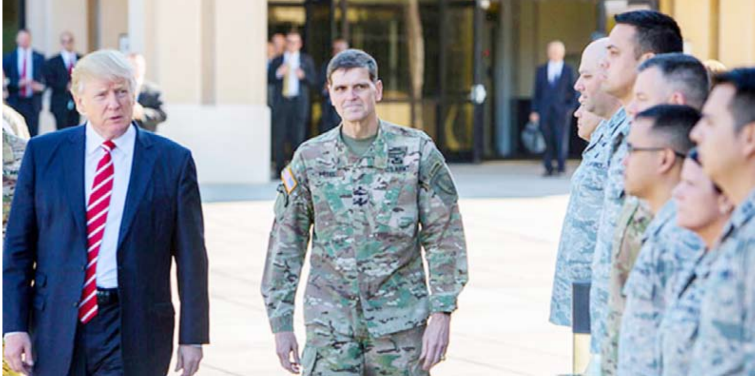
ترامب في إحدى القواعد العسكرية

وتبدل القوى الأوروبية جهوداً لانتقاد الاتفاق النووي وتخفيف تصعيد الوضع. ويقود الرئيس الفرنسي إيمانويل ماكرون هذه الجهود واقترح عقد لقاء بين روحاني وترامب لنزع فتيل الأزمة.