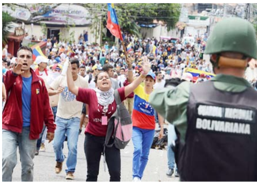
احتجاجات سابقة في فنزويلا

وسرعان ما اعترفت الولايات المتحدة بـ "غوايدو" رئيساً انتقالياً لفنزويلا، وبعثتها كندا ودول من أمريكا اللاتينية وأوروبا، فيما أبدت بلدان بينها روسيا وتركيا والمكسيك وبوليفيا، شرعية الرئيس الحالي نيكولاس مادورو. وعلى خلفية ذلك، أعلن مادورو، قطع العلاقات الدبلوماسية مع الولايات المتحدة، واتهمها بالتدبير لمحاولة انقلاب.