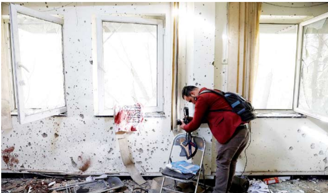
الثر التفجير الدوموي