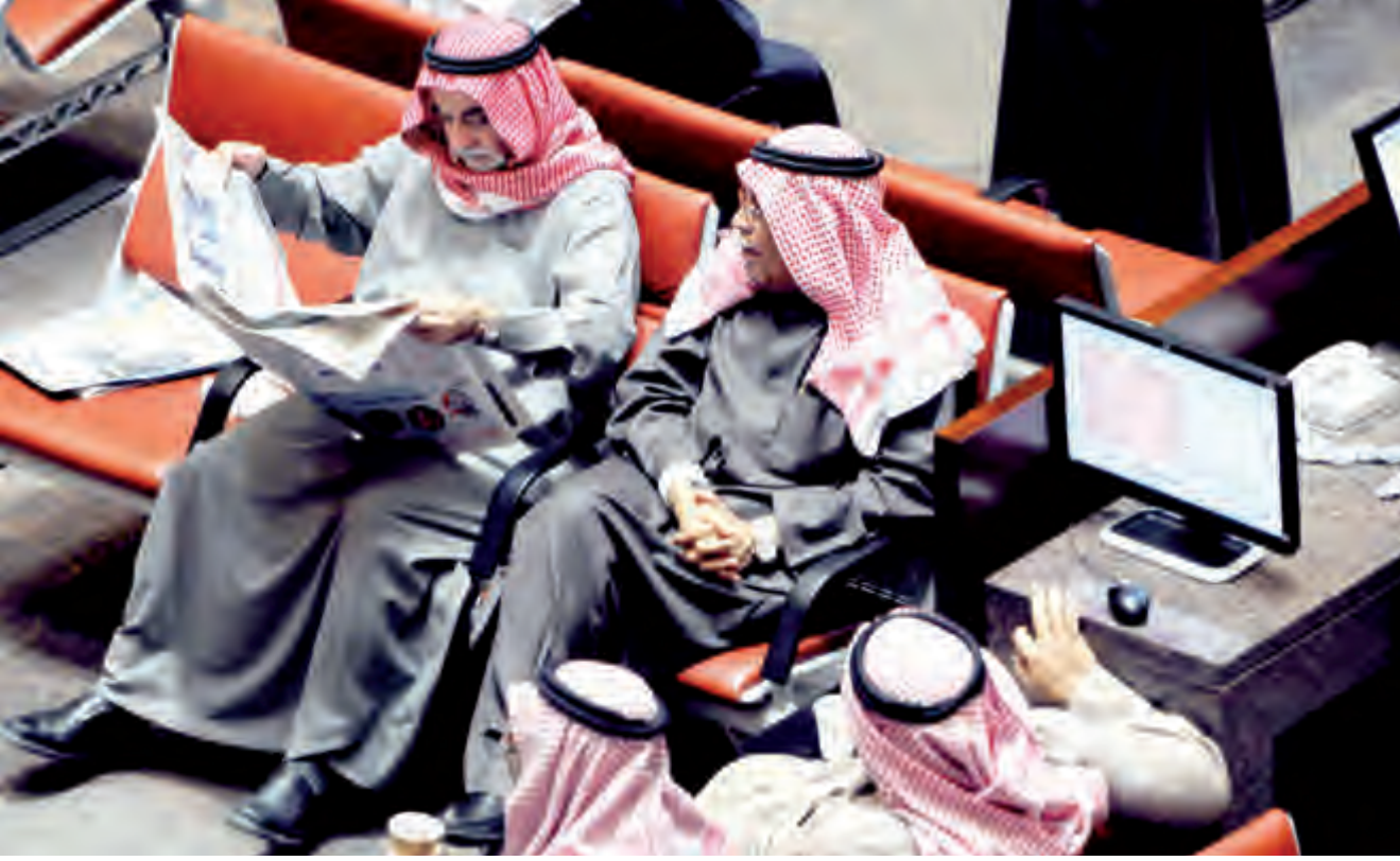
متعاملون في البورصة

انخفض سعر برميل النفط الكويتي 35 سنتا في تداولات اول امس ليلعب 51ر57 دولار أمريكي مقابل 92ر51 دولار للبرميل في تداولات الجمعة الماضي وفقا للسعر المعلن من مؤسسة البترول الكويتية.