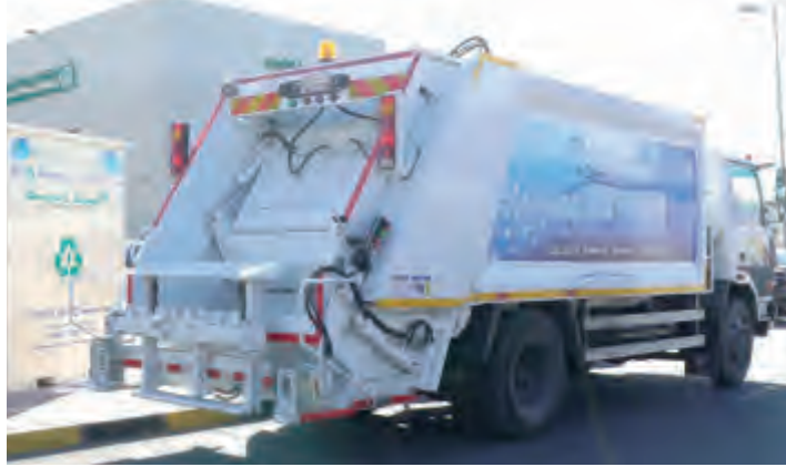
أحدى حاويات تجميع العبوات البلاستيكية

المحافظات. ويحرص «بيتك» بشكل دائم على المساهمة في دعم المشاريع والبرامج الوطنية ذات الأهداف الاجتماعية والتنمية التي تعود بالخير على المجتمع وأفراده ويولي مجموعة من القضايا والمشاريع أهمية كبرى وفي مقدمتها قضايا التعليم والبيئة