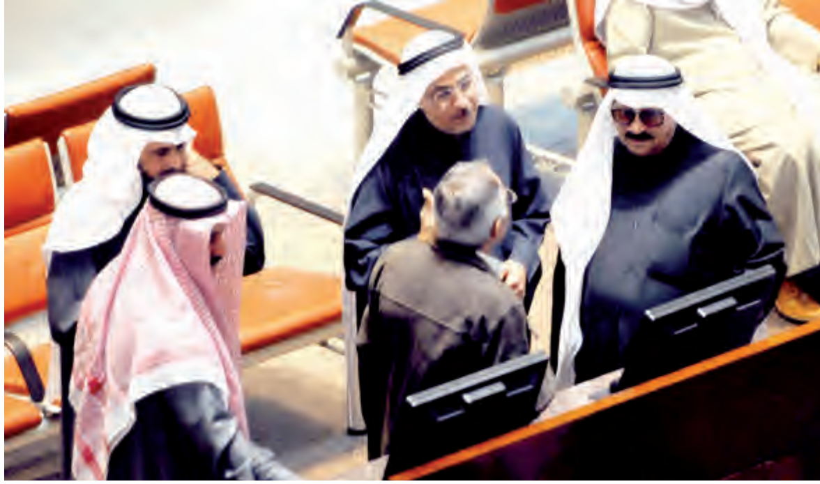
جانب من تداولات البورصة

حين وصلت كمية الأسهم المتداولة إلى نحو 406 مليون سهم تمت عبر 6288 صفقة «الدولار الأميركي يعادل 0,305 دينار». وكانت أسهم شركات «المال» و«المستثمرين» و«إبيار» و«بوبيان دق» و«صكوك» الأكثر تداولاً في حين كانت أسهم شركات «التعمير» و«العقارية» و«حيات كوم» و«سنام» و«وثاق» الأكثر ارتفاعاً.