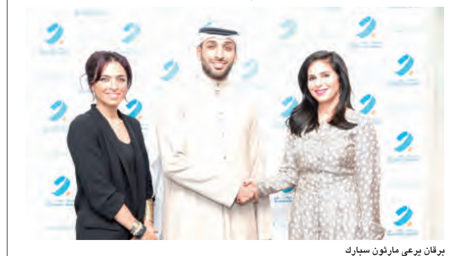
برقان يرعى ماراثون سبارك

سيشارك الحضور في برنامج مثير وممتع مليء بالأنشطة الترفيهية مختلف الفئات العمرية. بنك برقان يود من يمدى أهمية هذه المباريات الرياضية ومدى إيجابية عواطفها على أفراد المجتمع بالأخص وعلى دولة الكويت بشكل عام. وتأتي رعاية ماراثون «سبارك» تحت مظلة روح المواطنة التي يؤمن بها بنك برقان حيث ترفع مثل هذه المحافل الرياضية اسم دولة الكويت كمستضيف لمباريات رياضية بمستوى تنفيذي وتحكمي عالمي كما تساهم بتشجيع الأفراد على الحركة والالتزام بحياته صحية وتلك المبادرات هي الفلسفة التي يسعى البنك لتحقيقها من خلال دعم المباريات المحلية التي تنظم بشكل إيجابي حياة أفراد المجتمع.