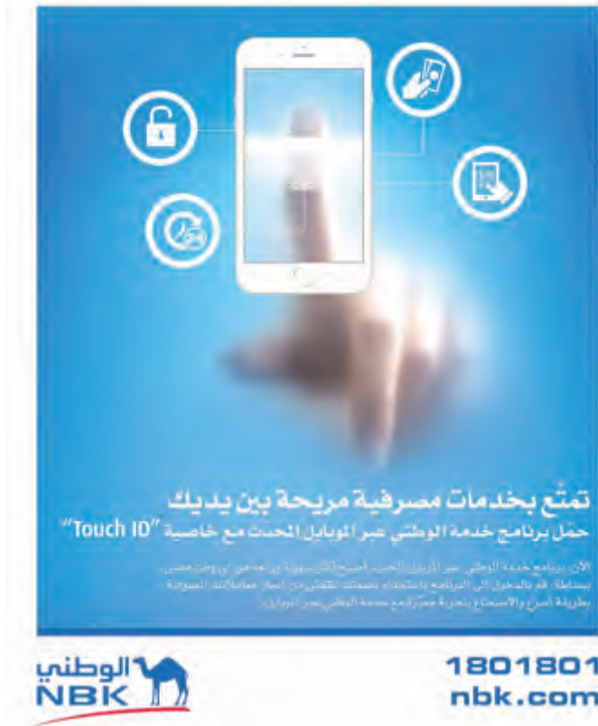
الوطني يطوّر خدمته المصرفية عبر الموبايل

يوفر بنك الكويت الوطني لعملائه أحدث الخدمات المصرفية الإلكترونية التي تعمل على الأجهزة الذكية، ويحرص على تطويرها باستمرار لتتناسب جميع أنظمة التشغيل وتحديثاتها، وذلك في إطار حرص الوطني على تلبية الاحتياجات المصرفية للعملاء داخل الكويت وفي الخارج على مدار الساعة وفي أي مكان وبكل سرعة ومرونة.