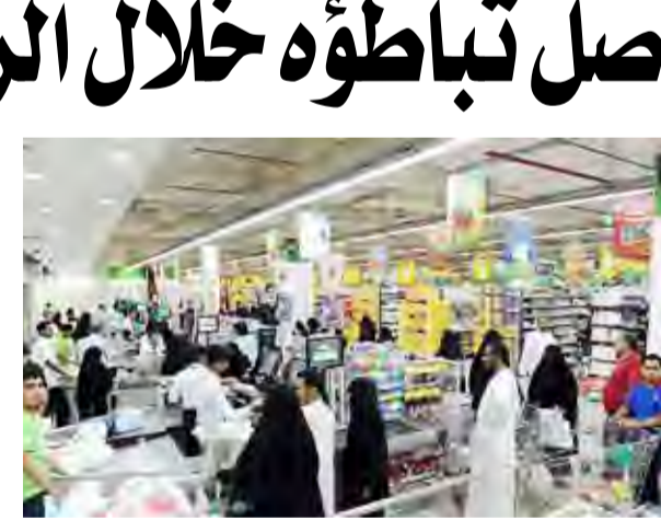
متسوقون في إحدى المجمعات التعاونية

السماح للمستثمرين بالعمل في البلاد من أجل تعزيز بيئة أعمال تنافسية في المملكة والتي تشمل قطاعات التعليم والرعاية الصحية وصناعة البناء، وذلك بعد رفع قيود الملكية الأجنبية في هذه الصناعات. وفي الإمارات العربية المتحدة، وقعت الدولة صفقة بقيمة 3.4 مليار دولار مع الصين لتوسيع العلاقات التجارية والاستثمارية. حيث تعد هذه الصفقة جزء من مبادرة «الحزام والطريق» مع الصين، وتعد هذه المبادرة مشروع ضخم للبنية التحتية الذي يتضمن بناء الطرق والسكك الحديدية وخطوط الشحن بين الصين وأكثر من 60 دولة. وأطلق البلدان عدداً من الاستثمارات الجديدة بما في ذلك تطوير محطة تبلغ مساحتها 60 مليون قدم مربع في طريق الحرير الجديد في دبي معرض إكسبو 2020.