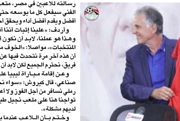
البرتغالي كارلوس كيروش خلال تقديمه لوسائل الإعلام المصرية

واحدًا ويكون لديه دقة قلب واحدة من أجل تحقيق هذا الهدف. ووجه المدرب البرتغالي،