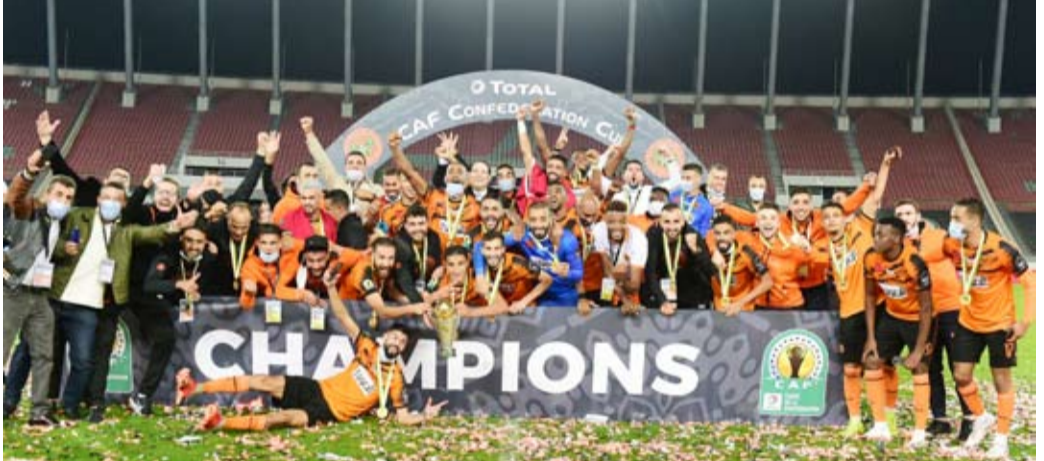
جانب من تتويج نهضة بركان المغربي باللقب الإفريقي

توج نهضة بركان المغربي بلقب الكونفيدرالية الإفريقية، بعد فوزه على بيراميدز المصري (1/0)، في المباراة النهائية على ملعب مولاي عبد الله بالرباط، الأحد.