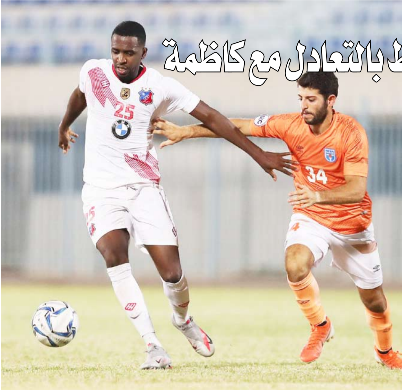
لقطة من مباراة الكويت وكاظمة

واصل نادي الكويت نزيف النقاط بعد التعادل أمام كاظمة بهدف في كل شبكة، وذلك في المباراة التي جمعتهما في ختام المرحلة الثالثة للدوري الكويتي الأحد.