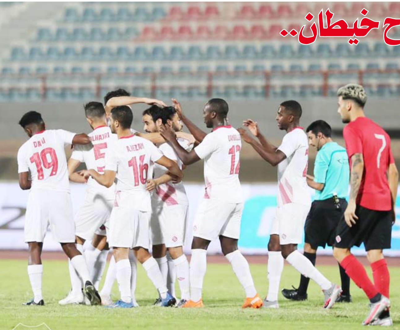
لقطة من مباراة الكويت وخبيطان

بين الفريقين من دون جديد، لتنتهي المباراة بثلاثة أهداف مقابل هدفين. وفي مباراة ثانية، حقق النصر ضمن المرحلة ذاتها، وحصد النصر أول 3 نقاط، ويبقى أبناء الأحمدي بسجل خالي من النقاط.