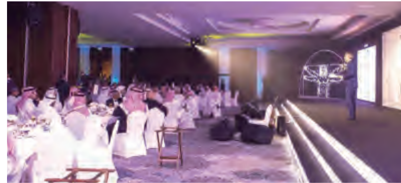
جانب من عمومية إعمار مولز

مجال التدقيق، بتقديم الدعم أيضاً في تقييم البيانات المالية».