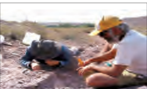
نوع جديد من الديناصورات في الأرجنتين

اكتشف فريق من علماء متحدي الجنسيات في مقاطعة نيوكوين الأرجنتينية ثلاث عينات محفوظة بشكل جيد لنوع جديد من الديناصورات الضخمة تدعى «Lavocatisaurus agriensis». وكانت الديناصورات غير المعروفة، والتي أطلق عليها العلماء اسم «Lavocatisaurus agriensis»، من أكلات