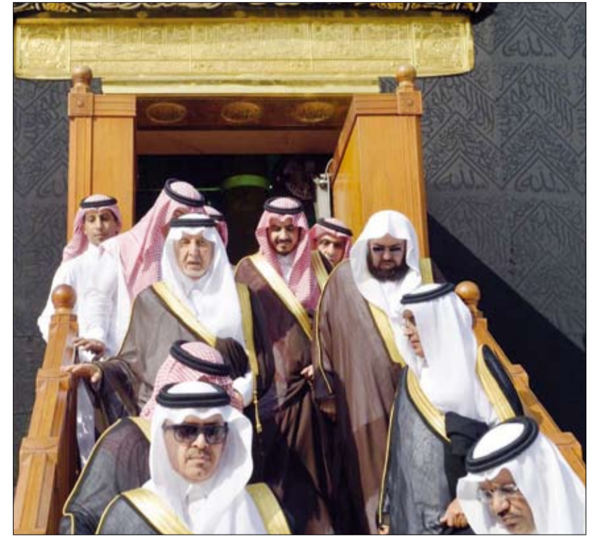
الأمير خالد الفيصل وبعض الدبلوماسيين والمسؤولين العرب والمسلمين خلال غسل الكعبة المشرفة

وشارك في مراسم غسل الكعبة أعضاء السلك الدبلوماسي الإسلامي المعتمدين لدى المملكة بالإضافة إلى وزير الحج والعمرة السعودي الدكتور محمد بن نبتن والرئيس العام لشؤون المسجد الحرام والمسجد النبوي الشيخ الدكتور عبدالرحمن السديس وعدد من الوزراء وسنة بيت الله الحرام. يذكر أن غسل الكعبة سنة نبوية كريمة فعلها الرسول صلى الله عليه وسلم يوم فتح مكة تطهيرا لها.