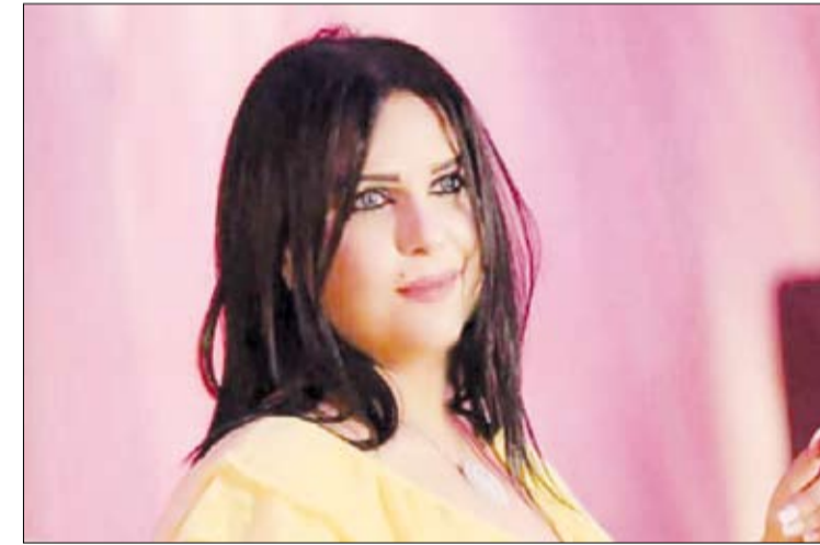
المغنية التونسية الراحلة منيرة حمدي

وقالت وزارة الشؤون الثقافية التونسية ونعاهها عدد كبير من المغنين والملحنين والفنانيين في تونس عبر شبكات التواصل الاجتماعي منهم الممثلة درة زروق والمغنية أماني السويسي.