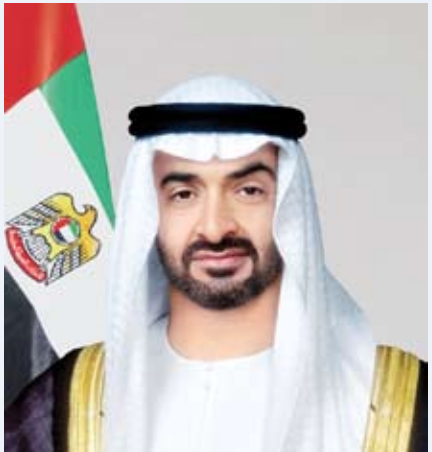
سمو الشيخ محمد بن زايد رئيس الإمارات

وقد شكره سموه على هذه المبادرة الكريمة التي تجسد عمق العلاقات بين البلدين والشعبين الشقيقين. مبادلاً لجلالته التهناني بهذه المناسبة السعيدة، مقدراً سموه هذا التواصل ومبتهاً إلى البراري تعالي أن يديم عليه موفور الصحة والعافية ويحقق لمملكة البحرين الشقيقة وشعبها الكريم كل ما يتطلع إليه من تقدم وازدهار في ظل القيادة الحكيمة لجلالته.