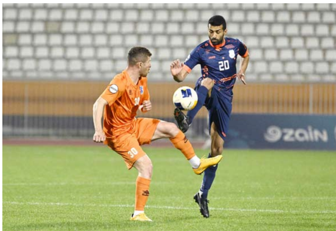
مباراة حماسية بين كازمة واليرموك