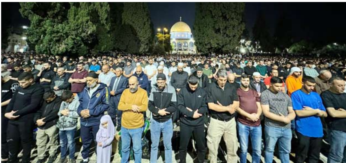
.. واعداد أكبر في صلاتي العشاء والتراويح