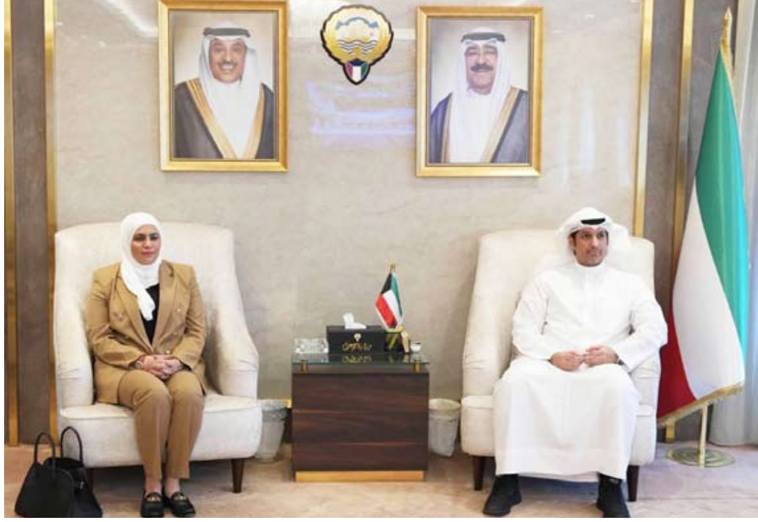
الوزيران عبدالرحمن المطيري ونورة الفصام خلال الاجتماع

ناقش وزير الإعلام والثقافة ووزير الدولة لشؤون الشباب عبدالرحمن المطيري، ووزير المالية ووزير الدولة للشؤون الاقتصادية والاستثمار نورة الفصام، تفاصيل العرض المرئي الخاص بخطة عمل الحكومة والذي سي عقد في 10 أبريل المقبل.