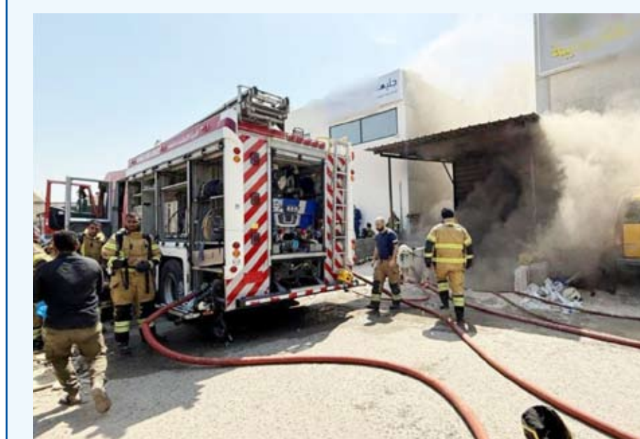
قوة الإطفاء تسيطر على الحريق

تذكرت قوة الإطفاء العام أن فرق إطفاء مراكز الشيوخ الصناعي والشهيد والإسناد سيطرت مؤخراً على حريق سرداب في كراج بمنطقة الشيوخ الصناعية. وأشارت «الإطفاء» إلى أن فرقها باشرت بمكافحة الحريق والسيطرة عليه ولم يسفر الحادث عن أي إصابات تذكر.