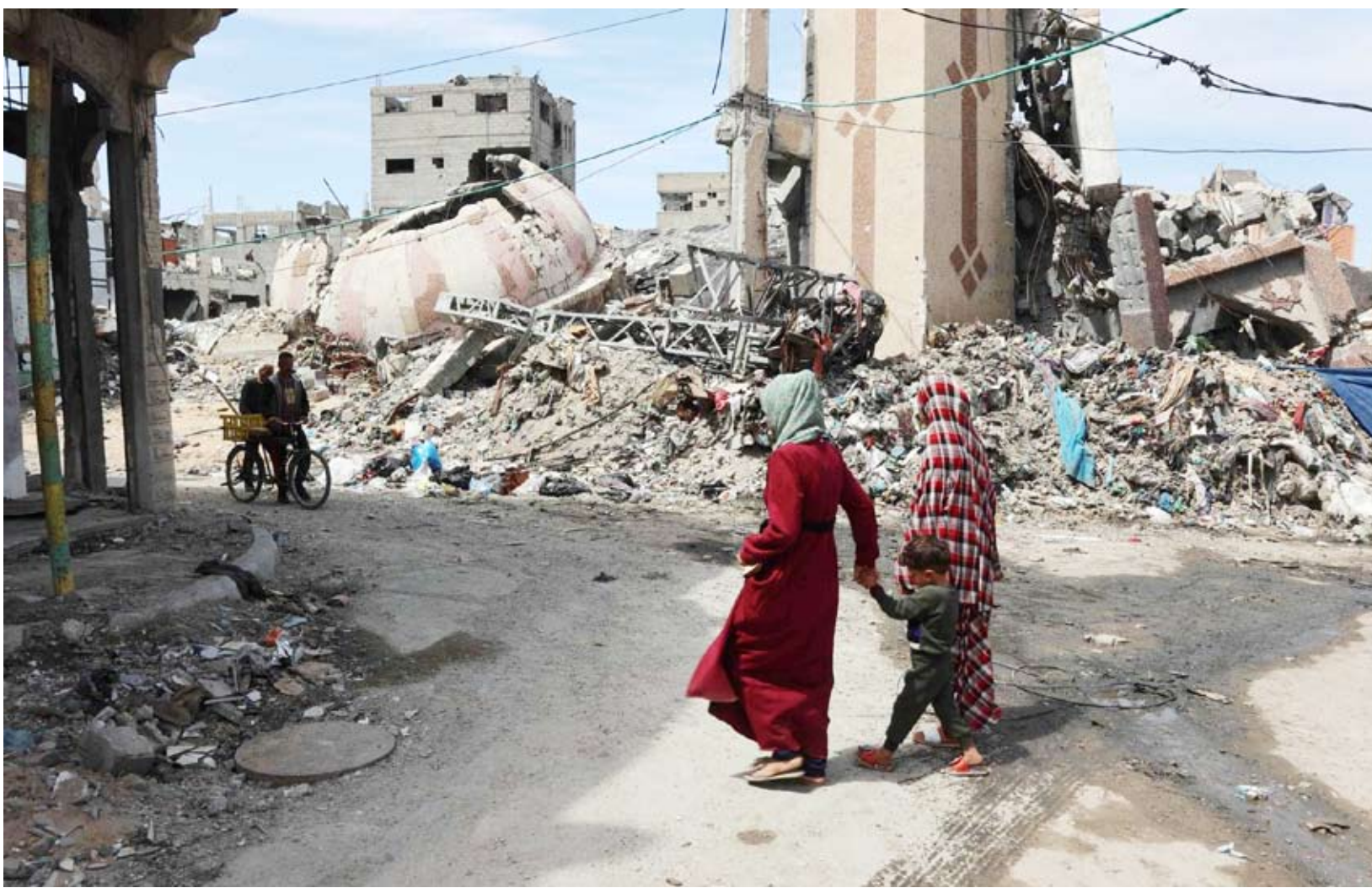
أبنية مدمرة جراء الحرب في غزة

وتتضمن المفاوضات، طلب تقديم ضمانات واضحة بوقف إطلاق النار، ومن ثم التفاوض على بقية التفاصيل، بما يضمن تمديد المرحلة الأولى بتنفيذ ما كان تم الاتفاق عليه من إدخال معدات ثقيلة وخيام وعربات «كرافان» و مواد بناء لإعادة إعمار القطاع الحيوي مثل المدارس والمستشفيات وغيرها.