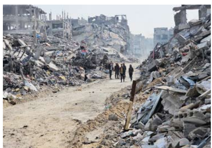
دمار كبير في قطاع غزة

ارتفعت حصيلة ضحايا العدوان الإسرائيلي على غزة منذ السابع من أكتوبر 2023 إلى 50 ألفاً و277 شهيداً، بالإضافة إلى 114 ألفاً و95 مصاباً. وذكرت وزارة الصحة في غزة، في تقريرها الإحصائي اليومي، أن مستشفيات قطاع غزة استقبلت خلال الساعات الـ24 قبل الماضية، 26 شهيداً من بينهم شهيد تم انتشال جثمانه، بالإضافة إلى 60 إصابة. وأوضحت أن حصيلة الشهداء والإصابات منذ استئناف الكيان الإسرائيلي عدوانه على غزة في 18 مارس الجاري، قد بلغت 921 شهيداً، بالإضافة إلى 2,054 إصابة.