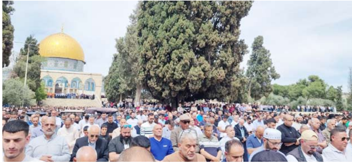
اعداد كبيرة من المصلين في صلاة الجمعة

ذكرت دائرة الأوقاف الإسلامية في مدينة (القدس) أن نحو 75 ألف فلسطيني أدوا صلاة الجمعة الأخيرة من شهر رمضان في رحاب المسجد الأقصى المبارك. كما أدى 100 ألف شخص، مساء الجمعة، صلاتي العشاء والتراويح في المسجد الأقصى المبارك بمدينة القدس المحتلة. وقالت دائرة الأوقاف الإسلامية في القدس: إن 100 ألف أدوا صلاتي العشاء والتراويح في المسجد الأقصى بمدينة القدس المحتلة، في اليوم الثامن والعشرين من شهر رمضان المبارك. وفرضت قوات الاحتلال إجراءات عسكرية مشددة في محيط البلدة القديمة ونصبت حواجز عسكرية ودققت في بطاقات الهوية خاصة الشبان. وذكر شهود عيان أن قوات الاحتلال التي انتشرت بالقرب من أبواب المسجد الأقصى أعادت مئات الشبان ولم تسمح لهم بالدخول إلى المسجد وأداء صلاة الجمعة. يأتي ذلك في حين حالت الإجراءات والقيود التي فرضها الاحتلال دون وصول آلاف آخرين من الفلسطينيين إلى مدينة (القدس) لأداء صلاة الجمعة الأخيرة من شهر رمضان المبارك. وفرضت سلطات الاحتلال قيوداً مختلفة على المصلين منها تحديد الأعمار والجنس من الذكور والإناث وعدم السماح لمن هم دون سن 55 عاماً بالدخول. كما اشترطت على الفئات العمرية المحددة للصلاة الحصول على تصاريح خاصة تخولهم دخول المدينة التي يحاصرها جدار الفصل العنصري وحواجز عسكرية تخضع المواطن الفلسطيني لتفتيش دقيق. ومنذ صباح يوم الجمعة توافد الفلسطينيون من شمال الضفة الغربية إلى حاجز (قلنديا) شمال المدينة وسط إجراءات عسكرية مشددة أعادت الكثيرين منهم كبار في السن إلى مناطقهم بعد منعهم من اجتياز الحاجز. ويسمح الاحتلال للفلسطينيين من جنوب الضفة الغربية بالعبور إلى القدس من خلال حاجز عسكري مقام على مدخل مدينة (بيت لحم) جنوب المدينة.