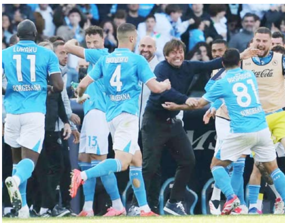
نابولي يرغب في حصد نقاط اللقاء للضغط على المتصدر انتر ميلان

أعلن نادي برشلونة الإسباني غياب لاعبه داني أولمو عن الملاعب لمدة ثلاثة أسابيع بسبب الإصابة. وذكر النادي أن الفحوصات الطبية التي خضع لها اللاعب، البالغ من العمر 26 عاماً، أكدت إصابته بتمزق في عضلات قدمه اليمنى. وتعرض أولمو للإصابة خلال مباراة برشلونة أمام أوساسونا، التي انتهت بفوز الفريق الكتلوني 3-0. أمس الخميس، ضمن المباراة المؤجلة من الدوري الإسباني، الذي يتصدره برشلونة برصيد 63 نقطة.