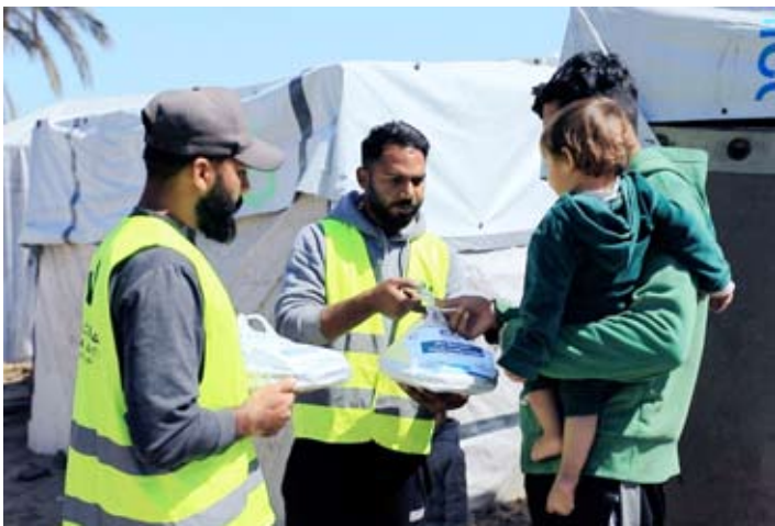
توزيع وجبات الإفطار على الأسر النازحة

الخارجية ووزارة الشؤون الاجتماعية ووزارة الإعلام والقوة الجوية الكويتية التي أسهمت في تسهيل الجهود الخيرية والإغاثية مما يعكس التزام دولة الكويت بنهجها الراسخ في دعم القضايا الإنسانية والإغاثية حول العالم لا سيما القضية الفلسطينية.