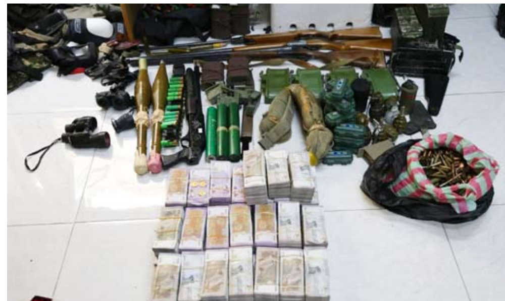
الثور على أسلحة وأموال في دمشق القديمة