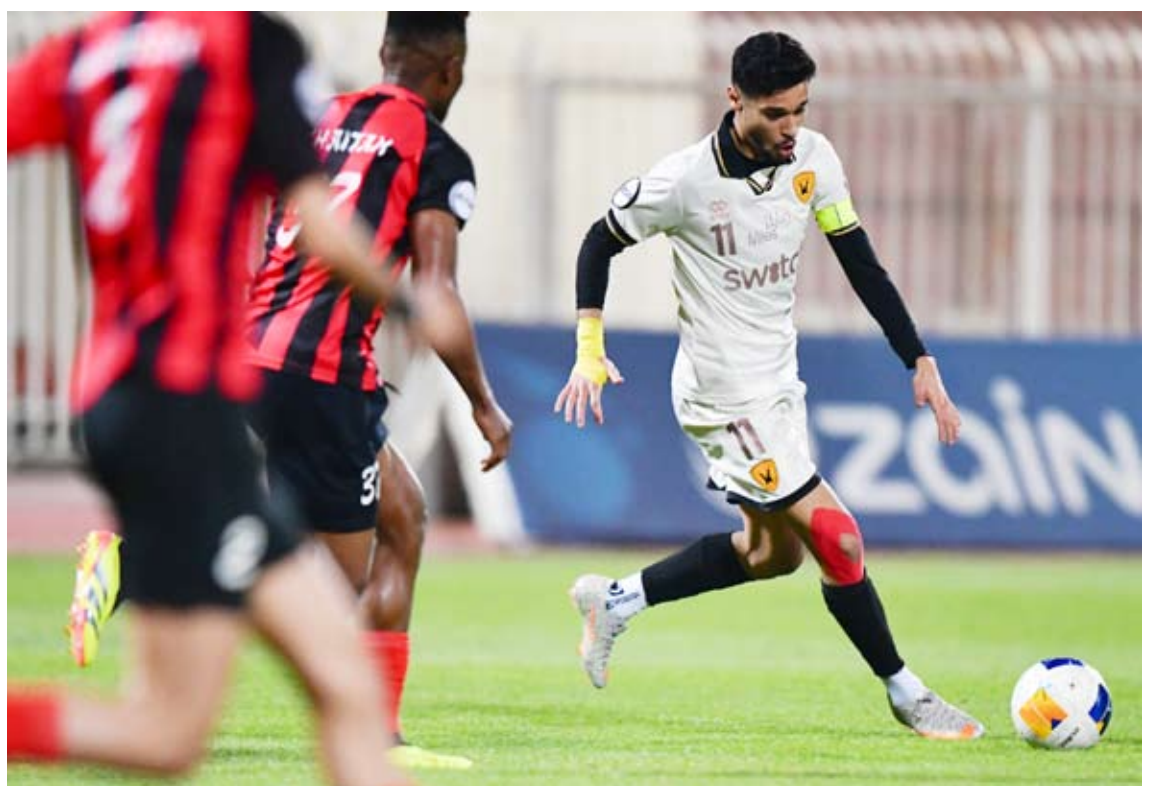
لاعب القادسية محاصر بلاعب خيطان