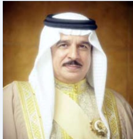
جلالة الملك حمد بن عيسى بن سلمان آل خليفة ملك البحرين

وقد شكره سموه على هذه المبادرة الكريمة التي تجسد عمق العلاقات بين البلدين والشعبين الشقيقين. مبادلاً لجلالته التهناني بهذه المناسبة السعيدة، مقدراً سموه هذا التواصل ومبتهاً إلى البراري تعالي أن يديم عليه موفور الصحة والعافية ويحقق لمملكة البحرين الشقيقة وشعبها الكريم كل ما يتطلع إليه من تقدم وازدهار في ظل القيادة الحكيمة لجلالته.