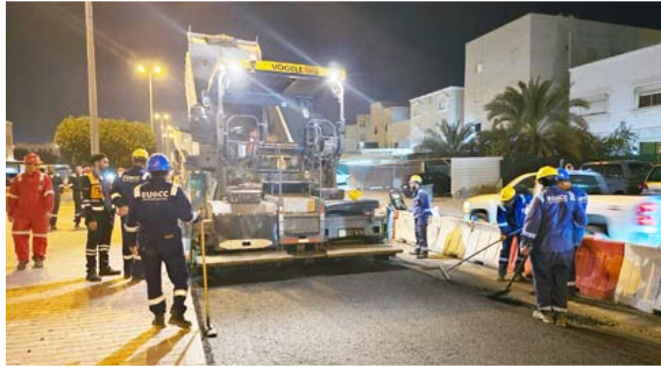
جانب من الاعمال

رياض عواد أعلنت وزيرة الأشغال العامة الدكتورة نورة محمد المشعان بدء أعمال الصيانة الجذرية بمنطقة جابر العلي بمحافظة الأحمد، ضمن العقود الجديدة مؤكدة استمرار الوزارة في تنفيذ مشاريع صيانة الطرق بكل المناطق مع الالتزام التام بضمان الجودة وتحقيق المواصفات العالمية لتطوير بنية تحتية متطورة. وقالت الدكتورة المشعان في تصريح صحفي، بشأن بدء أعمال الصيانة الجذرية في المنطقة، إن الفرق المعنية تولت معاينة المنطقة قبل إجراء أعمال الصيانة والإصلاحات اللازمة لها وستنطلق أعمال الصيانة في المناطق الأكثر تضرراً من الأمل مع