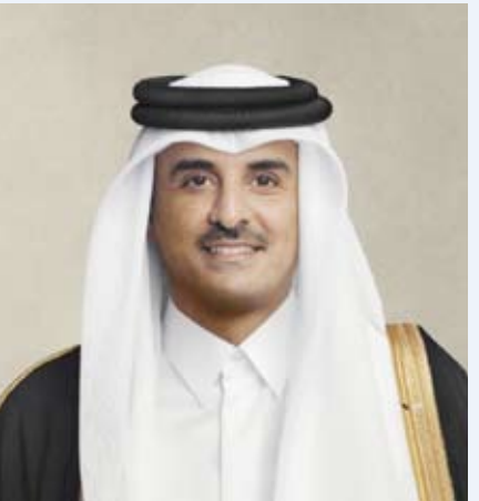
سمو الشيخ تميم بن حمد آل ثاني أمير قطر

خليفة ملك مملكة البحرين الشقيقة، عبر جلالته خلاله عن خالص تهانيه وأطيب تمنياته بمناسبة قرب حلول عيد الفطر السعيد سائلاً المولى عز وجل أن يعيد هذه المناسبة المباركة على البلدين الشقيقين والشعبين الكريمين وعلى الأمتين العربية والإسلامية بوافر الخير واليمن والبركات، وأن يديم على سموه موفور الصحة والعافية.