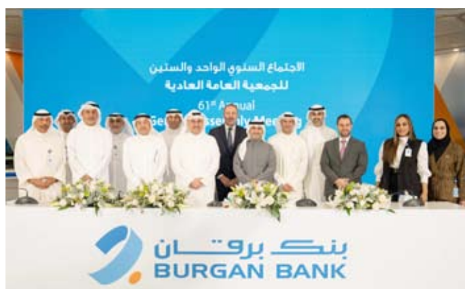
جانب من عمومية برقان

أظهر القطاع المصرفي في الكويت - مرة أخرى - مرونة استثنائية، وحافظ على مكانته كركيزة للاستقرار والنمو. وفيما تواصل الكويت الاستفادة من السياسات المالية الحسنة، وأطر العمل الرقابية القوية، والاستراتيجية الاقتصادية الاستباقية، ساعدت هذه العوامل في الحفاظ على ثقة المستثمرين، وتمكين النمو المستدام خلال فترات التقلب التي شهدتها الأسواق العالمية وما رافقها من ضغوط تضخمية واضطرابات. وأشاد رئيس مجلس إدارة بنك برقان، بالتقدم الذي حققه البنك خلال