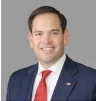
وزير خارجية الولايات المتحدة ماركو روبيو