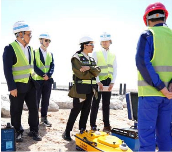
وزيرة الأشغال تتفقد أحد المشاريع

دعت المسؤولين والفرق المعنية إلى إنجاز الأعمال وفق البرنامج الزمني المتعهد به