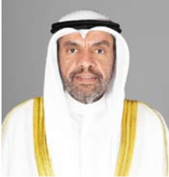
وزير الخارجية عبدالله الجحيا

الاجتماع الوزاري المشترك بين مجلس التعاون والولايات المتحدة الأمريكية على هامش أعمال الاجتماع الـ16 للمجلس الوزاري الخليجي الذي ستستضيفه دولة الكويت بصفتها دولة الرئاسة في شهر يونيو المقبل. وجرى خلال الاتصال بحث آخر التطورات في المنطقة والمستجدات على الساحتين الإقليمية والدولية حيث عبر الوزير الأمريكي ماركو روبيو عن تقدير بلاده لواقف دولة الكويت المنزلة والعدالة فيما يخص القضية الفلسطينية وسورية ولبنان.