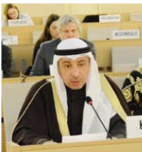
السفير ناصر الهين

الدولية الأخرى في جنيف السفير ناصر الهين، صافته رئيس مجلس سفراء دول مجلس التعاون الخليجي خلال حلقة نقاش بمناسبة إحياء الذكرى الستين لاعتماد الاتفاقية الدولية للقضاء على جميع أشكال التمييز العنصري وذلك ضمن أعمال الدورة الـ58 لمجلس الأمم المتحدة لحقوق الإنسان المنعقدة في جنيف. وشدد السفير الهين على الموقف الثابت لدول مجلس التعاون في مكافحة التمييز العنصري والتعصب وكراهية الأجانب والتزامه بالقيم النبيلة المناهضة لهذه الآفة الخطرة