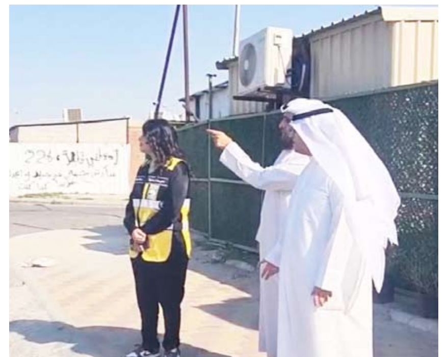
الوزير المشاري اثناء جولته

تفقد وزير الدولة لشؤون الإسكان عبد اللطيف المشاري مؤخراً منطقتي الصليبية وتيماء للوقوف على المخالفات والتعديت على أملاك الدولة فيها وجهود الفرق المختصة في التعامل معها.