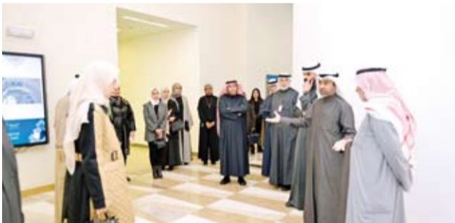
وقد قياديي الجهات الرقابية بالدولة خلال زيارتهم لمدينة صباح

حول كيفية إكمال المشاريع داخل الحرم الجامعي مما يعكس روح التعاون المتصالح بين المؤسسات الحكومية والأكاديمية، وأكد أعضاء الوفد ضرورة الاستمرار في إقامة شراكات إستراتيجية تسهم في تحقيق الأهداف المشتركة بما يتعكس إيجاباً على مسيرة التنمية الوطنية لاقترن إلى أن هذه الزيارة تمثل فرصة حيوية لتعزيز التعاون المستدام في سبيل خدمة الوطن والمواطنين.