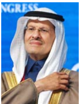
الأمير عبد العزيز بن سلمان

الاستخدامات المنزلية للمواد النفطية والبتروكيماوية. وإذ شرح أن النظام يأتي ليحل محل نظام التجارة بالمنتجات النفطية، الصادر بالمرسوم الملكي رقم (م/18)، في 28 - 1 - 1439 هـ، قال إنه يسهم كذلك في ضمان أمن إمدادات المواد النفطية والبتروكيماوية وموثوقيتها، وتحقيق الاستغلال الأمثل للموارد الخام، ودعم توطين سلسلة القيمة في القطاع، وتمكين الاستثمارات والخطط الوطنية، ويعزز الرقابة والإشراف على العمليات النفطية والبتروكيماوية لرفع مستوى الالتزام بالأنظمة والمتطلبات، ومنع الممارسات المخالفة، من خلال تنظيم أنشطة الاستخدام، والبيع، والشراء، والنقل، والتخزين، والتصدير، والاستيراد، والتعبئة، والمعالجة لهذه المواد، بالإضافة إلى تنظيم إنشاء وتشغيل محطات التوزيع، وتشغيل المنشآت البترولية، ويكفل