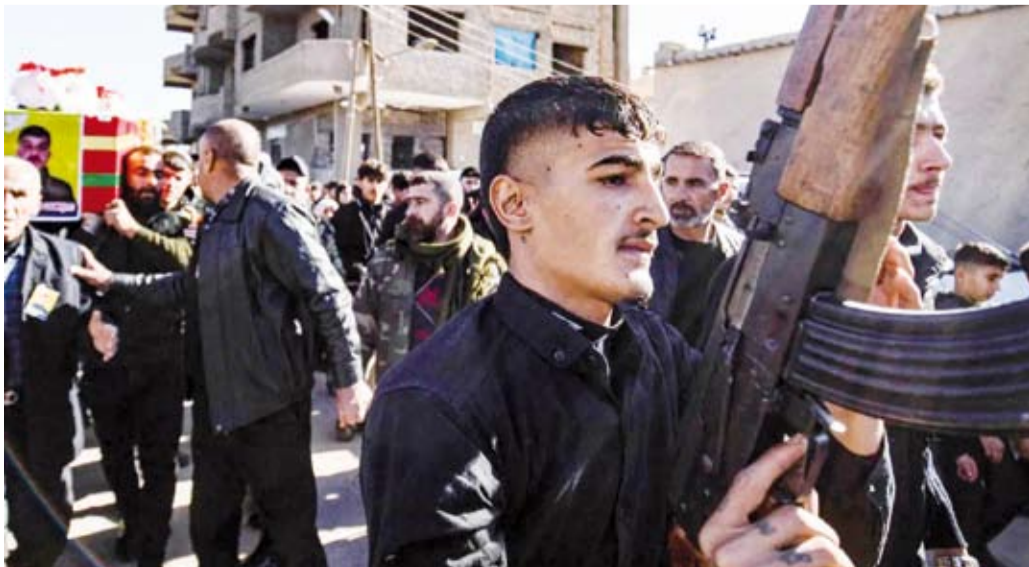
رجال مسلحون خلال جنازة عناصر من قسد لتركيا».

قتل 37 شخصاً، في معارك استخدم فيها الطيران بين القوات الكردية والفصائل السورية الموالية لتركيا في منطقة في شمال سوريا، وفق ما أفاد المرصد السوري لحقوق الإنسان.