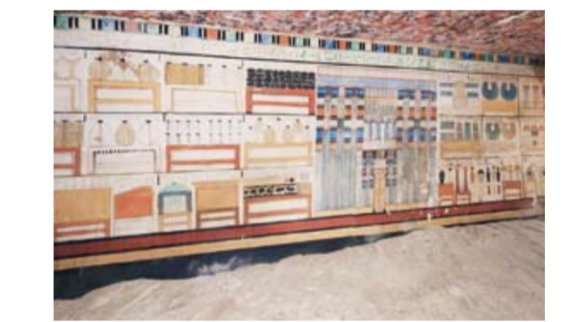
جدران المقبرة تحمل نقوشاً محفورة ومرسومة

اكتشفت في مصر مقبرة أثرية منذ عهد الملك بيبي الثاني (2278 - 2184 قبل الميلاد)، حيث أعلنت وزارة السياحة والآثار المصرية، بأن هذه المقبرة تقع في منطقة سقارة الأثرية بمحافظة الجيزة جنوب غرب القاهرة. وتم الاكتشاف بواسطة بعثة أثرية فرنسية سويسرية مشتركة، إذ كانت المقابر خاصة برجال الدولة من عصر الدولة القديمة، وبنيت من الطوب اللبن، ولها باب وهمي عليه نقوش ورسومات متميزة. وأشار بيان وزارة السياحة إلى أن المقابر تتبع لطبيب يدعى "تيتي نب فو"، عاش خلال عهد الملك بيبي الثاني، وكان يحمل سلسلة كاملة من الألقاب المتعلقة بوظائفه الرفيعة، من بينها كبير أطباء القصر، وعظيم أطباء الأسنان، ومدير النباتات الطبية، علاوة على أنه متخصص في اللغات السامية من العنقريين والنوبيين. وأكد الأمين العام للمجلس الأعلى للآثار المصري الدكتور محمد إسماعيل خالد، أهمية هذا الكشف الذي يُعد إضافة مهمة لتاريخ المنطقة، كونه يكشف عن جوانب جديدة من ثقافة الحياة اليومية في عصر الدولة القديمة من خلال النصوص والرسومات الموجودة على جدران المقبرة. ومن جانبه، أوضح رئيس البعثة الأثرية الدكتور فليب كولينجر، أن الدراسات الأولية تشير إلى أنه من المرجح أن المقبرة تعرضت للسرقة في عصور سابقة، لكن الجدران ظلت سليمة تحمل نقوشاً محفورة ومرسومة بروعة، حيث نُقش على أحد الجدران شكل باب وهمي ملون بألوان زاهية، وصور مناظر للعديد من الأثاث والمتاع الجنائزي، يعلوهما القاب واسم صاحب المقبرة.