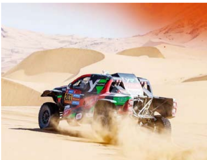
جانب من السباق

فاز السائق السعودي يزيد الراجحي بالمرحلة الرابعة الماراثونية من رالي داكار الصحراوي في السعودية، فيما عانى ناصر العطية، حامل اللقب خمس مرات من مشكلات تقنية.