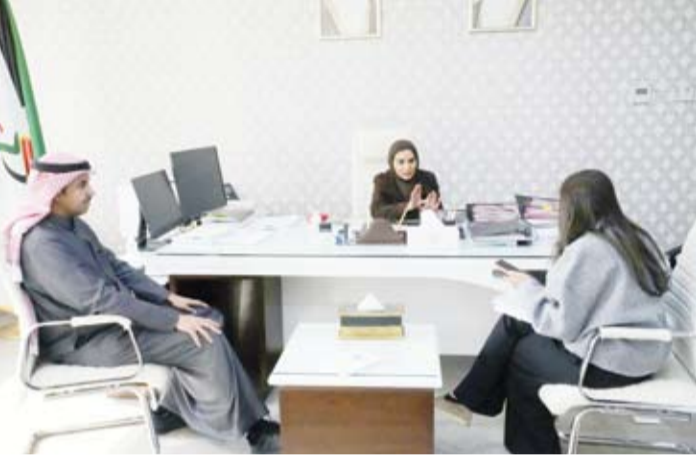
الوزيرة تستمع إلى بعض الاستفسارات والملاحظات من المراجعين

من جهة أخرى، قامت وزير الشؤون الاجتماعية وشؤون الأسرة والطفولة، الدكتورة أمثال الحويلة، بجولتها التفقدية الأسبوعية الى الهيئة العامة لشؤون ذوي الإعاقة، وذلك للإطلاع على سير العمل وتلبية احتياجات المراجعين من ذوي الإعاقة وذويهم والعاملين فيها. وخلال الجولة، استمعت الوزيرة إلى بعض الاستفسارات والملاحظات من قبل المراجعين، وذلك لتحسين الخدمات التي تقدمها الهيئة لمراجعينها. وذكرت أن الفريق قام بدراسة تلك البلاغات والتحقيق فيها بالتعاون مع الإدارات المختصة للوصول إلى نتائج محددة متوافقة مع أحكام القانون إضافة إلى تقديم توصيات لمعالجة الأخطاء التي أدت إلى تلك الوقائع. وبينت أنه سيتم تجديد عمل الفريق لمواصلة مهامه في تلقي البلاغات المتعلقة بشبهات الفساد واتخاذ ما يلزم بشأنها داعية الجميع إلى التعاون مع الفريق عبر إرسال البلاغات إلى البريد الإلكتروني المخصص.