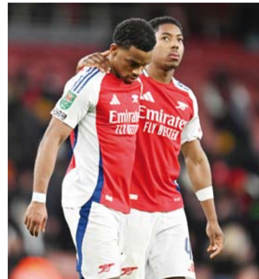
هزيمة غير متوقعة لارستال في كأس الرابطة

للدوري في أوروبا... وتلعب كل الفرق بنفس الكرة، ولم تنتقل أي تعليقات أخرى من هذا النوع..