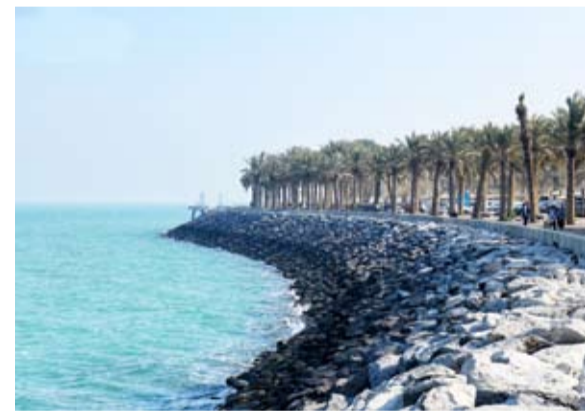
طقس معتدل في النهار

توقعت إدارة الأرصاد الجوية تأثر البلاد بامتداد مرتفع جوي مصحوباً بكتلة هوائية باردة ليكون الطقس في عطلة نهاية الأسبوع معتدلاً نهاراً وبارداً إلى شديد البرودة ليلاً.