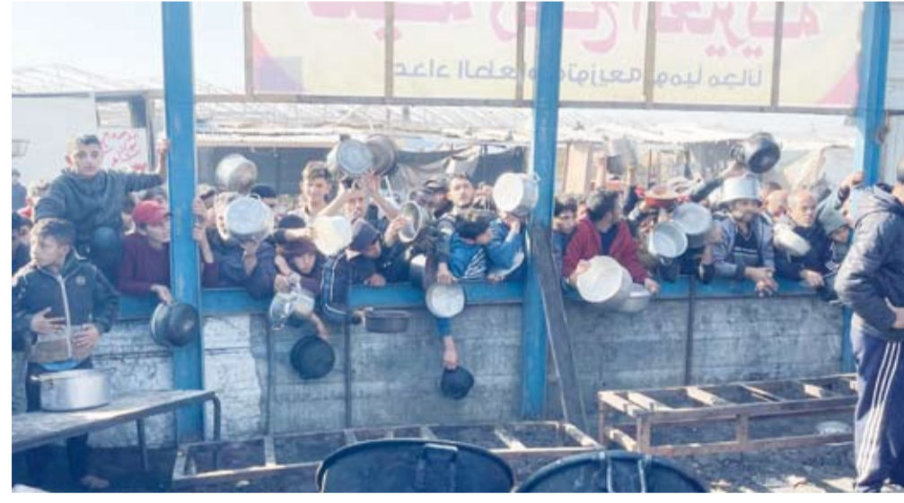
أكثر من مليون فلسطيني يعانون أعراض الهزال الشديد بسبب الجوع

سبيلهم الوحيد لسد رمقهم والنجاة من الموت جوعاً. وتقوم (التكيات الخيرية) على طهي الطعام للنازحين وتوزيعه دون مقابل بدعم من مؤسسات خيرية عربية ودولية لتكون قبلة للجوعى والقراء الذين لا يجدون كسرة الخبز في خيامهم في ظل