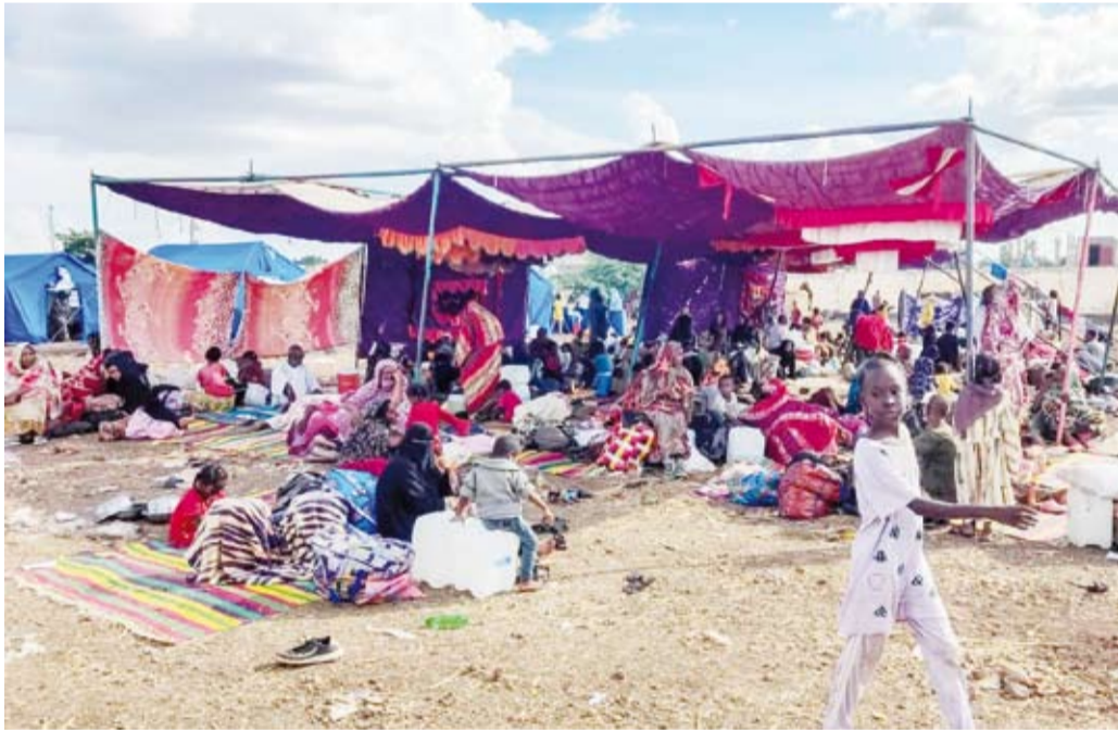
سودانيون فأرون من المعارك في منطقة الجزيرة

غرفة طوارئ جنوب الحزام الأخضر بالعاصمة. وقالت الغرفة: «لليوم الثاني يستهدف القصف الجوي الأحياء المأهولة بالسكان، ما أسفر عن مقتل وإصابة العشرات من المدنيين». وأضافت في بيان على موقعها على «فيسبوك»: «، قتل أيضاً 6 أشخاص، من بينهم أطفال، وأصيب العشرات في سلسلة غارات جوية نفذها الطيران الحربي للجيش السوداني».