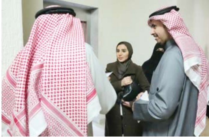
د. أمثال الحويلة خلال جولتها التفقدية

من جهة أخرى، قامت وزير الشؤون الاجتماعية وشؤون الأسرة والطفولة، الدكتورة أمثال الحويلة، بجولتها التفقدية الأسبوعية الى الهيئة العامة لشؤون ذوي الإعاقة، وذلك للإطلاع على سير العمل وتلبية احتياجات المراجعين من ذوي الإعاقة وذويهم والعاملين فيها. وخلال الجولة، استمعت الوزيرة إلى بعض الاستفسارات والملاحظات من قبل المراجعين، وذلك لتحسين الخدمات التي تقدمها الهيئة لمراجعينها. وذكرت أن الفريق قام بدراسة تلك البلاغات والتحقيق فيها بالتعاون مع الإدارات المختصة للوصول إلى نتائج محددة متوافقة مع أحكام القانون إضافة إلى تقديم توصيات لمعالجة الأخطاء التي أدت إلى تلك الوقائع. وبينت أنه سيتم تجديد عمل الفريق لمواصلة مهامه في تلقي البلاغات المتعلقة بشبهات الفساد واتخاذ ما يلزم بشأنها داعية الجميع إلى التعاون مع الفريق عبر إرسال البلاغات إلى البريد الإلكتروني المخصص.