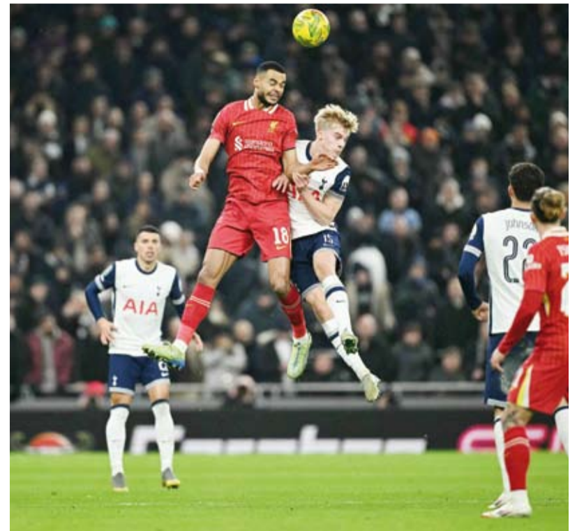
ليفربول يتلقى التلهزيمة الثانية خلال الموسم

سجل لو كاس بيرجفال أول هدف له مع توتنهام هو تسبير ليفرول الفريق إلى الفوز 1-0 صفر على ليفرول في ذهاب الدور قبل النهائي من كأس الرابطة الإنجليزية المحترفة لكرة القدم.