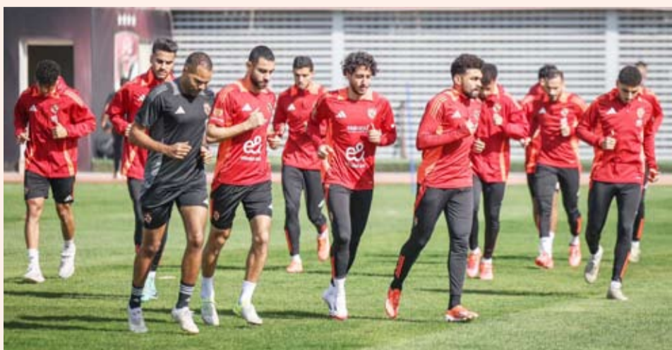
جانب من تدريبات الأهلي المصري