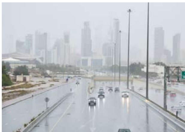
أ مطار الكويت

الطلبات (شهادة إعدام رسمي) 170 ألفاً. وأضافت أن عدد الطلبات لخدمة (الاستعلام عن السفر) بلغ 160 ألفاً وعدد طلبات (الاستعلام عن المطالبات المالية) 130 ألفاً وعدد طلبات (تسديد غرامات جزائية) 90 ألفاً وعدد طلبات (شهادة بالأحكام التي لم يتم تنفيذها) 75 ألفاً وعدد طلبات (الاستعلام عن وكالاتي) 25 ألفاً.