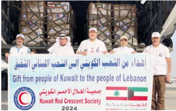
جانب من المساعدات التي تقدمها الجمعية

وتوجه السفير المغامس بغضيم الشكر والامتنان والتقدير لكل من كانت له لمسة إنسانية من خلال الهلال الأحمر الكويتي ولحكومة دولة الكويت الرشيدة التي تدعم العمل الخيري والإنساني منوها بجهود الشركاء الذين اعتبرهم الركيزة الأولى في عمل الجمعية، مبيّناً أن (الهلال الأحمر الكويتي) لا تقوم بذاتها إنما بشرائها الذين يعتبرون أهم قيمة إضافية للجمعية. وفي ذكرى تأسيس الجمعية أشار إلى أن (الهلال الأحمر الكويتي) تستقبل مرحلة جديدة من البذل والعطاء الإنساني وتنسجف في عهدا مليئا بالتحديات الإنسانية التي تستوجب إعلاء القيم الإنسانية وتفعيل الآليات ووضع الخطط والاستراتيجيات لمواجهة.