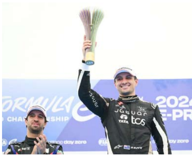
جدة تستقبل الفورمولا إي للمرة الأولى

تستعد محافظة جدة، مع بداية العام الحالي لاستقبال بطولة العالم للفورمولا إي في موسمها الحادي عشر للمرة الأولى، حيث تستضيف بالجولتين الثالثة والرابعة يومي 14 و 15 فبراير المقبل، وستكون هي الوجهة التالية بعد سباق المكسيك في هذه السلسلة من السباقات العالمية.