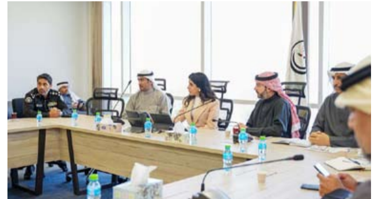
د.نورة المشعان تشدد على ضرورة الالتزام بالبرنامج الزمني لإنجاز T2

عقدت وزير الأشغال العامة د.نورة المشعان أمس اجتماعاً للوقوف على آخر مستجدات تنفيذ أعمال مشروع المطار الجديد (T2) بحضور رئيس الإدارة العامة للطيران المدني الشيخ حمود مبارك الحمود وممثلين عن وزارة الداخلية. وهدت المشعان إلى سرعة إنجاز جميع الأعمال في المطار الجديد بالجودة والكفاءة المطلوبتين وفق المواصفات الفنية المعتمدة والالتزام بالبرنامج الزمني المتعهد به لتشغيل كل الخدمات والمرافق مؤكدة أهمية التنسيق مع الطيران المدني بهذا الشأن.