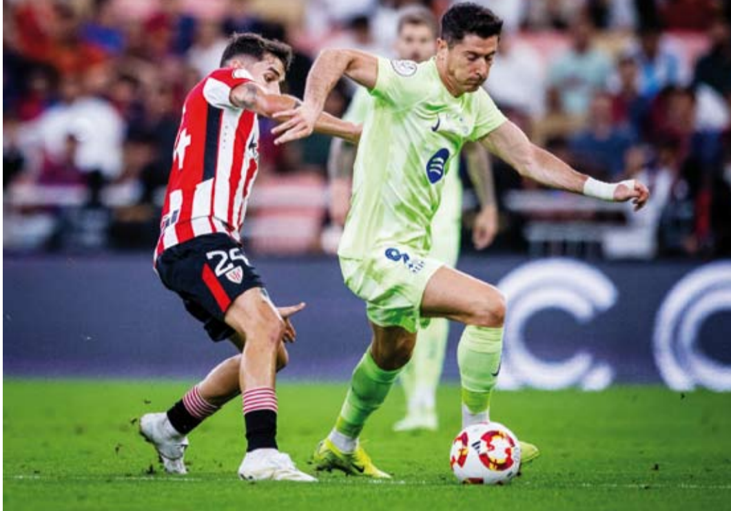
فوز مستحق للنادي الكاتالوني

بلغ برشلونة نهائي الكأس السوبر الإسباني في كرة القدم بفوزه على أتلتيك بلباو 2-0 ضمن الدور نصف النهائي الأربعة على ملعب مدينة الملك عبدالله الرياضية في جدة. وبيد البلاوغرانا بفوزه إلى ثنائية غافي (17) ولامين جمال (53). ويلتقي النادي الكاتالوني في النهائي المقرر الأحد الفائت بين غريمه التقليدي ريال مدريد حامل اللقب وريال مايوركا اللذين يتواجهان الجمعة. وكان العملاق الكاتالوني مني بخسارة فادحة أمام غريمه التقليدي 1-4 في نهائي نسخة عام 2024. وخاض برشلونة اللقاء من دون النهائي ذاتي أولو وبيو فيكتور بعد انتهاء ترخيصهما للعب، لكن المجلس الرياضي الإسباني منح الفريق الكاتالوني الضوء الأخضر قبل ساعات قليلة من انطلاق المباراة لإشراكهما مؤقتاً إلى حين صدور الحكم النهائي في الاستئناف المقدم من إدارة النادي ضد رابطة الدوري الإسباني والاتحاد المحلي للعبة. وبالتالي، بات برشلونة قادراً على إشراكهما بعد تأمله إلى النهائي.