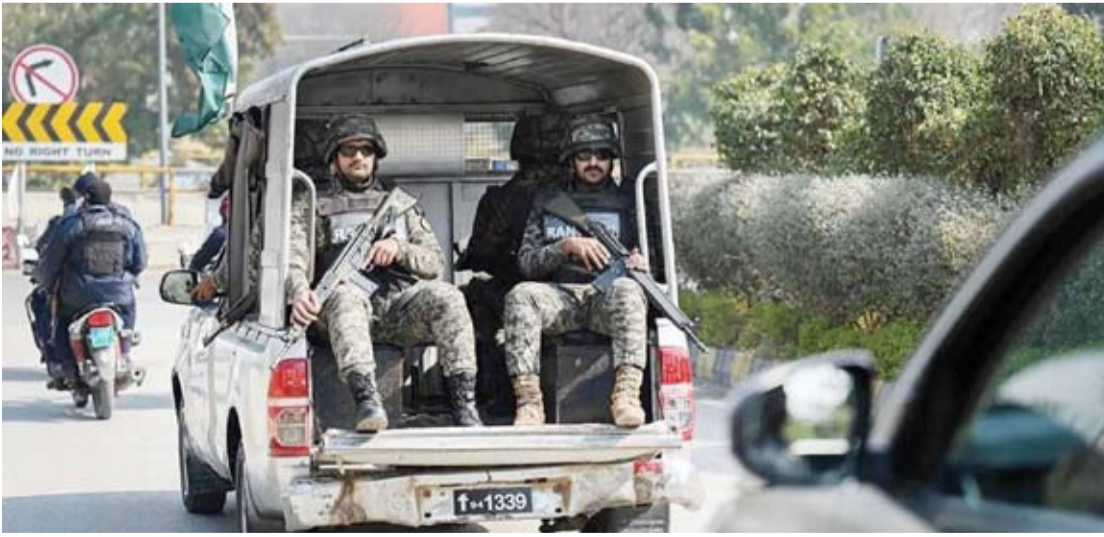
أفراد من الجيش الباكستاني

إقليم خيبر بختونخوا، فيما قتل 3 جنود بنيران الإرهابيين خلال العملية نفسها. وأضاف أن قوات الأمن قضت كذلك على 8 إرهابيين، خلال عملية أمنية نفذتها بمقاطعة مهندي، وعلى 3 إرهابيين آخرين في عملية أمنية أخرى نفذتها بمنطقة كرك في الإقليم للإرهابيين داخل أفغانستان، استخدمت خلالها طائرات حربية ومسيّرة.