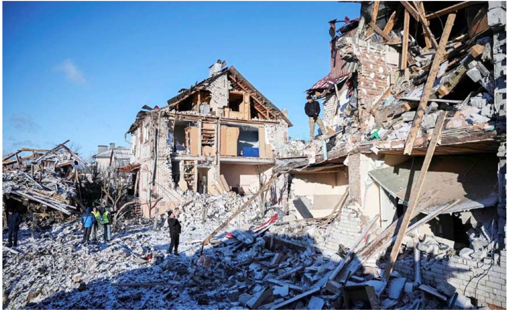
دمار جراء الغارات الروسية على مدينة تشيرنيف

ونشر الحاكم تسجيل فيديو يظهر حريقاً مشتعلاً في مبنى أمامه سيارات مدمرة، وصوره تظهر متطوعين يعملون على مساعدة مدنيين ممددين أرضاً.