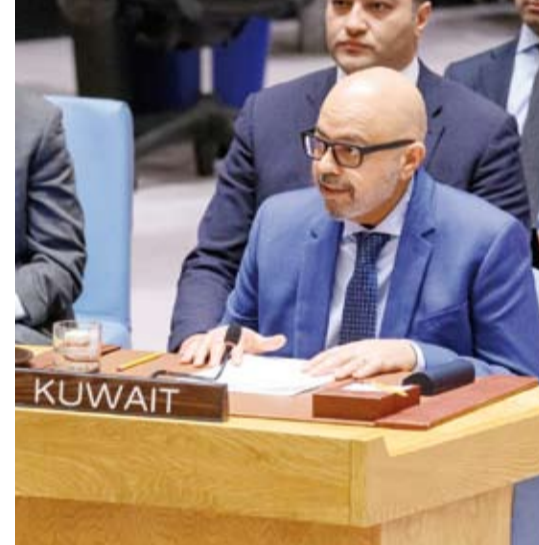
السفير طارق البنائي