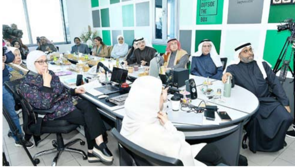
وفد منظمة الصحة العالمية يستمع إلى أعمال اللجنة التنسيقية لمدينة اليرموك الصحية

والروح الوطنية الكويتية والجمعيات التعاونية ودور الديوانيات التي تتم من خلالها مناقشة قضايا كثيرة ليتم استغلالها في التوعية المجتمعية.