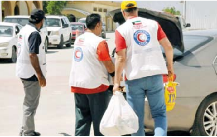
جانب من المساعدات الإنسانية للجمعية وانتشار مشاريعها حول العالم