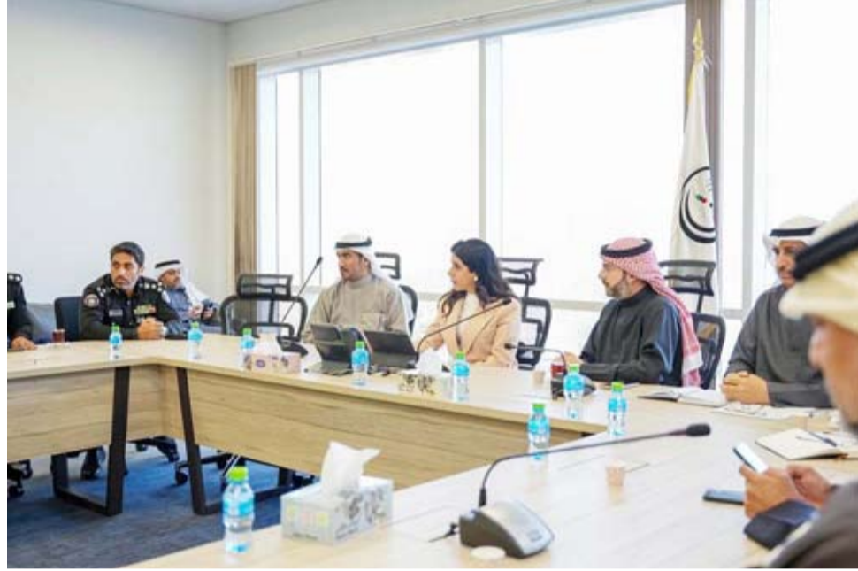
جانب من اجتماع الوزيرة المشعان مع الطيران المدني والداخلية

وأضافت أن المطار الجديد سيساهم في تحويل البلاد إلى مركز