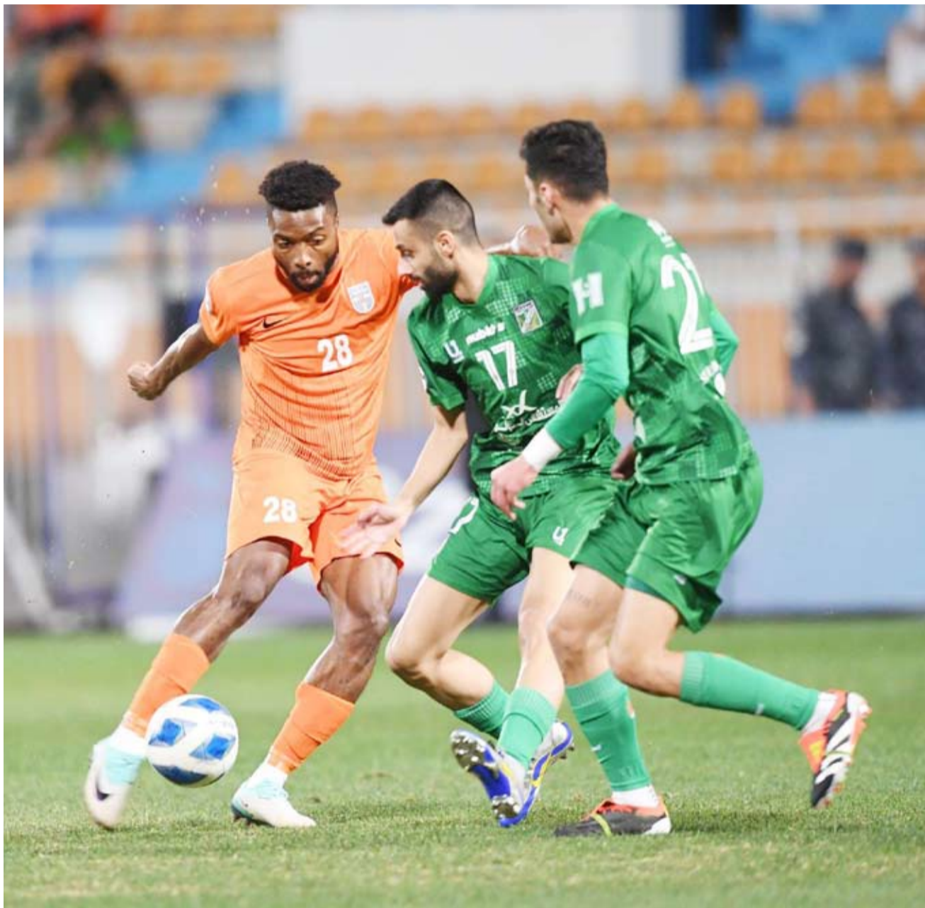
الإدارة حاضرة في لقاءات العربي وكاظمة

جدير بالذكر أن الفحيحيل لم يدخل الميركاتو الشتوي حتى الآن، وسط قناعة الخطيب بالمحترفين الخمسة في صفوف الأشاوس.