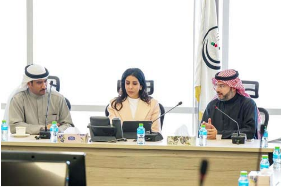
المشعان تستمع الى شرح الداخلية

وأوضحت أن ملف صيانة وإصلاح الطرق السريعة وطرق المناطق يُعد من أولويات القيادة السياسية بهدف خلق بنية تحتية متطورة تساهم في تنمية الكويت وتحقيق «رؤية الكويت 2035»، مشيرة إلى وجود تنسيق بين وزارة الأشغال ووزارة الداخلية ممثلة في إدارة المرور في شأن أعمال الصيانة ومواعيد إغلاق بعض حارات الطرق لإنجاز أعمال الصيانة المطلوبة.