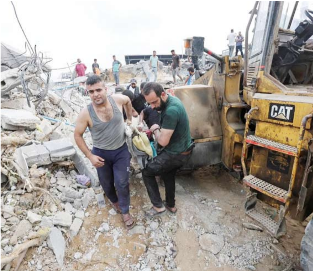
غارة جوية على ماوى للنازحين

فيما يعتقد الرب، أن المقترح سواء القديم أو الجديد سيخضع لمناقشات مكثفة وخاصة مع احتمال قرب الاتفاق على هدنة في قطاع غزة، وحديث دوائر عديدة، لا سيما أميركية، عن اليوم التالي للحرب.