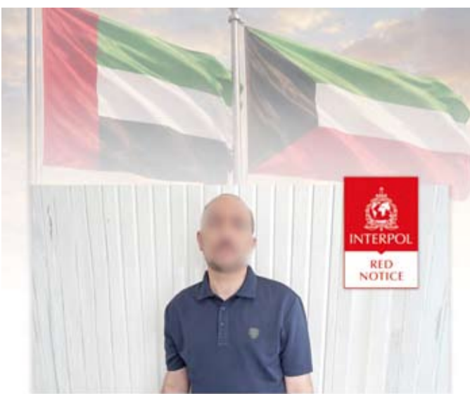
ضبط المتهم الهارب

بالمحررات الرسمية عقب سداد الرسوم الفعلية إلكترونياً ومن ثم تقديمها لجهة عمله للاستيلاء على الفروق المالية. وأفادت أن عملية الضبط تمت بعد متابعة أمنية وتحريات مكثفة وتبادل للمعلومات بين الجانبين الكويتي والإماراتي حيث تم ضبطه واتخاذ الإجراءات القانونية اللازمة بحقه تمهيداً لتسليمه إلى دولة الكويت لاستكمال تنفيذ الحكم القضائي الصادر بحقه. وأشادت بمستوى التعاون والتنسيق الأمني القائم مع الأشقاء في دولة الإمارات العربية المتحدة، مؤكدة أن هذا الإنجاز يعكس فاعلية الشراكة الأمنية العربية في ملاحقة المطلوبين وتعقب المتورطين في قضايا الفساد والاعتداء على المال العام. وأكدت وزارة الداخلية، على أن الأجهزة الأمنية مستمرة في أداء واجبها بكل حزم لحماية مقدرات الدولة وترسيخ سيادة القانون.