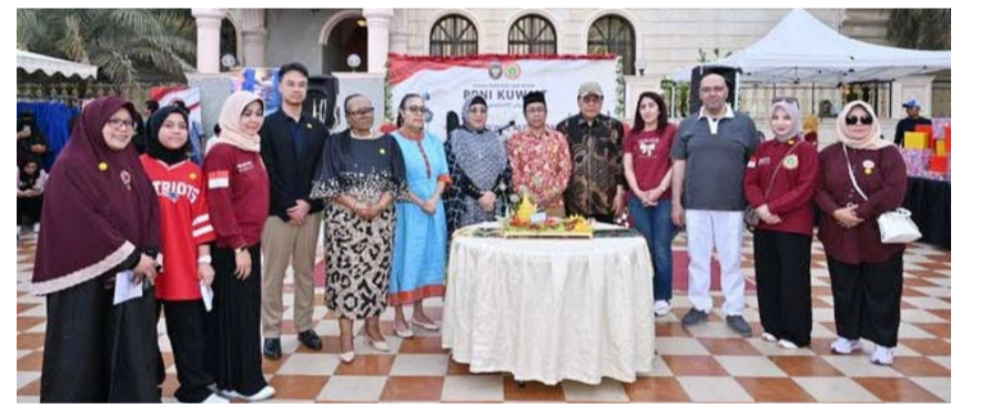
السفيرة الإندونيسية متوسطة الحضور

أكدت سفيرة جمهورية إندونيسيا لدى البلاد، ليندا مارينا، أن الاحتفال بيوم التمريض العالمي وعيد العمال، الذي نظّمته جمعية الممرضين الإندونيسيين في الكويت بالتعاون مع السفارة الإندونيسية، يجسد تقدير إندونيسيا للدور الحيوي الذي يؤديه الممرضون والعاملون الإندونيسيون في دعم القطاع الصحي وسوق العمل في الكويت. وقالت السفيرة، في تصريحات للصحافيين على هامش الحفل، إن عدد الممرضين والممرضات الإندونيسيين العاملين حالياً في الكويت يبلغ نحو 450، إلى جانب وصول دفعات جديدة منذ العام الماضي، مشيرة إلى أن أكثر من ألف ممرض وممرضة إندونيسية تقدموا بطلبات للعمل في الكويت عبر نظام التوظيف المباشر المعتمد من