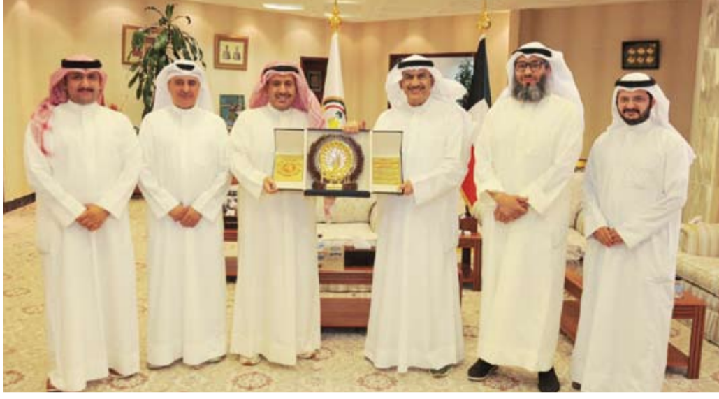
محافظ الجهراء مكرمًا رئيس وأعضاء اتحاد المزارعين