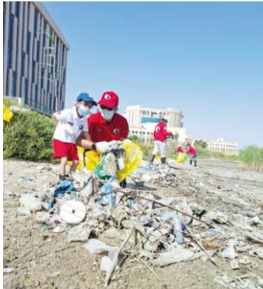
مخلفات بلاستيكية ضارة وأخشاب