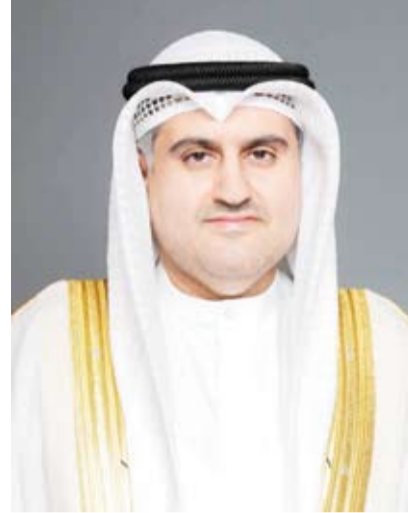
وزير العدل المستشار ناصر السميطة

تدوير دوري للخبراء لترسيخ الشفافية ورفع مستوى الأداء، مؤكداً أن تطوير هذه الإدارة يمثل ركيزة أساسية في مسيرة تحديث منظومة العدالة في الكويت.