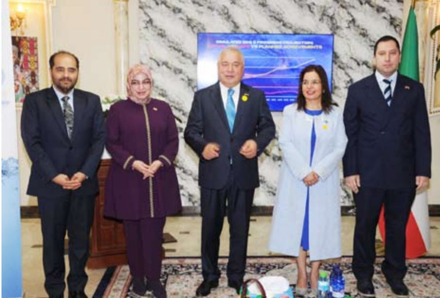
سفراء طاجيكستان وتركيا وصربيا وأميرها الحسن

لا تقتصر على استضافة مؤتمر، بل يتجاوز ذلك إلى بناء منصة عالمية للحوار والتعاون. إن دوشنبه تسعى إلى أن تكون جسراً بين الدول الجبلية والدول الصحراوية، بين دول المنبع ودول المصب، بين الخبرة العلمية والحاجة الإنسانية، وبين التعهد السياسي والتنفيذ العملي. وهنا تبرز أهمية مشاركة دولة الكويت ودول مجلس التعاون الخليجي. فالكويت، بحكم موقعها الجغرافي ومناخها الصحراوي وخبرتها الطويلة في تحلية المياه وإدارة الموارد المحدودة، تمتلك تجربة مهمة يمكن أن تثري النقاش الدولي حول الأمن المائي، وكفاءة الاستخدام، والاستثمار في التقنيات الحديثة، وإدارة الطلب، وحماية البيئة البحرية، وتعزيز الوعي المجتمعي.