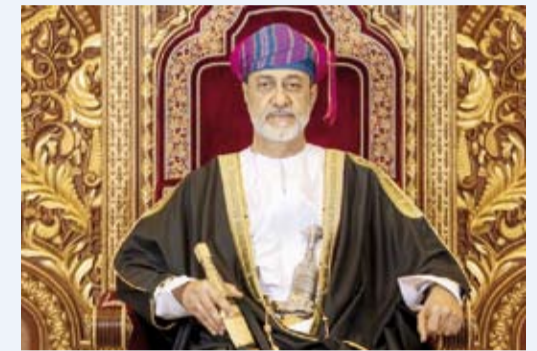
السلطان هيثم بن طارق

أعلنت وزارة الثقافة والرياضة والشباب العمانية، أمس، عن منح المنظمة العربية للتربية والثقافة والعلوم (ألكسو) السلطان هيثم بن طارق سلطان عمان وسام التميز الثقافي العربي من الفئة السامية تقديراً لإسهاماته في دعم الثقافة العربية وتعزيز حضورها وصون الهوية ودعم مسارات التنمية الفكرية والمعرفية في الوطن العربي. ونقلت وكالة الأنباء العمانية عن وزير الثقافة العماني سعود البوسعيدي قوله: إن منح (ألكسو) السلطان هيثم هذا الوسام يؤكد النهج السامي في ترسيخ مكانة المعرفة والثقافة لدورهما الحضاري في تعزيز قيم التسامح والتعايش والتقارب بين الشعوب. ومن المقرر أن تتخلف (ألكسو) في مقرها بتونس يوم الثلاثاء المقبل فعالية رسمية لتكريم السلطان هيثم بن طارق بحضور كبار المسؤولين والمثقفين والمهتمين بالشأن الثقافي العربي. وتعد (ألكسو) إحدى المنظمات التابعة لجامعة الدول العربية وقد أُنشئت عام 1970 وتتخذ من تونس مقراً لها وتهتم بتطوير مجالات التربية والثقافة والعلوم في الدول العربية وتعزيز التكامل الثقافي والمعرفي العربي وصون التراث الثقافي وبناء الشراكات الفكرية والثقافية بين الدول العربية.