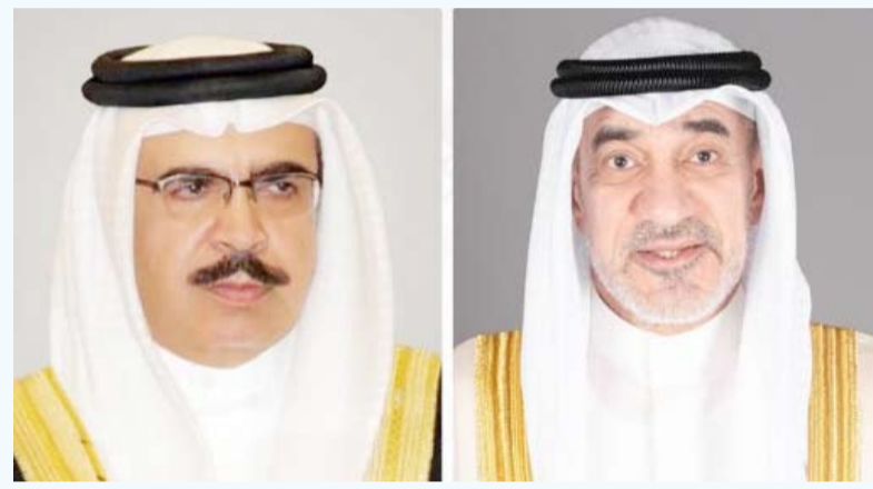
النائب الأول أجرى اتصالاً هاتفياً بوزير داخلية البحرين

أجرى النائب الأول لرئيس مجلس الوزراء وزير الداخلية الشيخ فهد اليوسف اتصالاً هاتفياً بإخيه الفريق أول الشيخ راشد بن عبدالله آل خليفة وزير الداخلية بمملكة البحرين الشقيقة. وأكد اليوسف خلال الاتصال ووقوف دولة الكويت إلى جانب المملكة ودعمها الكامل لكافة الإجراءات الأمنية التي تتخذها للحفاظ على أمنها واستقرارها مشيداً بكفاءة وبقظة الأجهزة الأمنية البحرينية في التعامل مع مختلف التحديات الأمنية. وكانت وزارة الداخلية البحرينية أعلنت أمس أن الأجهزة الأمنية تمكنت من الكشف عن تنظيم مرتبط بالحرس الثوري الإيراني والقبض على 41 شخصاً.