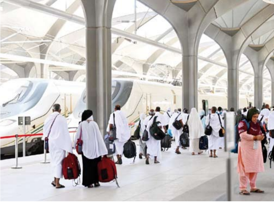
قطار الحرمين السريع يعزز انسيابية الحركة