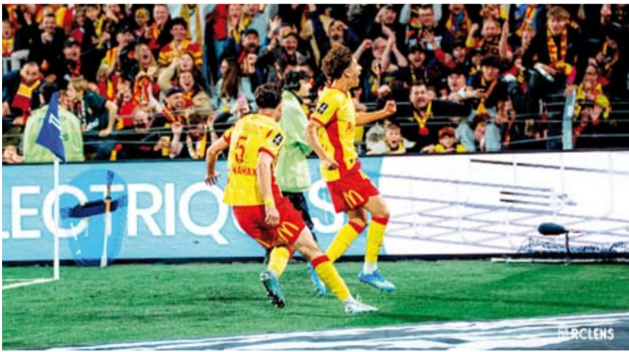
فوز نيم لنس على نانت

وبات نانت، بطل فرنسا عام 2001، متأكدًا من إنهاء الموسم ضمن المركزين الأخيرين، ليهبط من دوري الأضواء للمرة الثالثة منذ تتويجه باللقب.