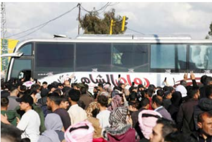
تجتمع أهالي المعتقلين لدى «قسد» بعد إطلاق سراحهم

وانطلقت، دفعة من الموقوفين لدى الدولة من المنتسبين لـ«قسد»، الذين أوقفوا خلال عمليات إنفاذ القانون، باتجاه منطقة المليبية جنوب الحسكة، تمهيداً للإفراج عنهم بإشراف الفريق الرئاسي، وذلك تنفيذاً لاتفاق 29 يناير، وفقاً لمديرية إعلام الحسكة.