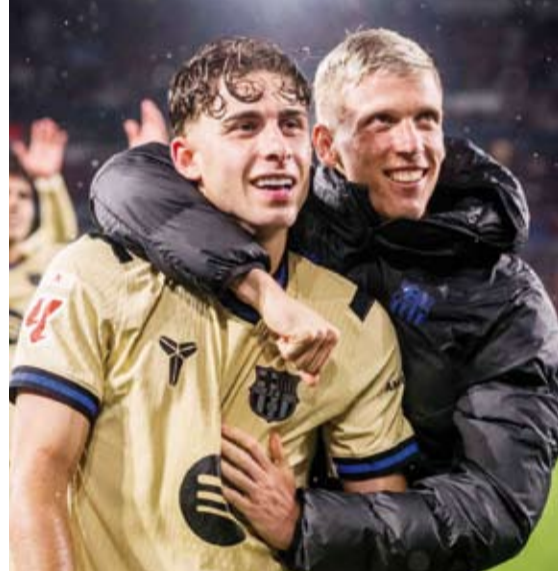
برشلونة الأقرب للفوز بلقب الليغا

تتجه أنظار مئات الملايين من عشاق كرة القدم في أنحاء العالم، اليوم الأحد، صوب ملعب «سويتياي كامب نو»، لتتابع نسخة الأوفر إنارة من «الكلاسيكو» في السنوات الأخيرة التي ستجمع بين برشلونة وريال مدريد في الجولة 35 من الدوري الإسباني. ولا تقتصر المواجهة على الصراع التقليدي بين القطبين، بل تمتد لتكون ليلة التتويج المحتملة لبرشلونة بلقب الدوري الإسباني للموسم الثاني على التوالي، أمام أعين غريمه التاريخي ريال مدريد.