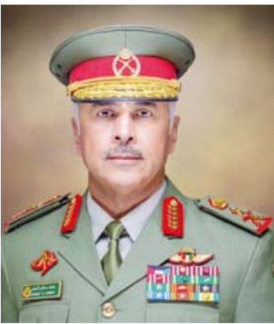
الفريق الركن حمد البرجس

قام وكيل الحرس الوطني الفريق الركن حمد البرجس بجولة ميدانية تفقدية لعدد من مواقع المسؤولية التي تتولى قوة الواجب تأمينها، وذلك للاطلاع على مستوى الجاهزية والوقوف على سير المهام الموكلة إليها. وقالت مديرية التوجيه بالحرس الوطني في بيان صحفي، أول أمس: إن الفريق البرجس أكد خلال الجولة أهمية الحفاظ على أعلى درجات اليقظة والاستعداد وتعزيز التنسيق الميداني بما يساهم في تنفيذ الواجبات الأمنية بكفاءة واقتدار. وأعرب عن شكره وتقديره لمتسوبي الحرس الوطني الذين يواصلون أداء واجباتهم بكل كفاءة واقتدار ضمن منظومة عمل متكاملة تهدف إلى تعزيز الأمن والحفاظ على سلامة المواقع الحيوية. ودعا المولى عز وجل أن يحفظ الكويت وشعبها من كل سوء ومكروه وأن يديم عليها نعمة الأمن والأمان والاستقرار تحت ظل القيادة الحكيمة.