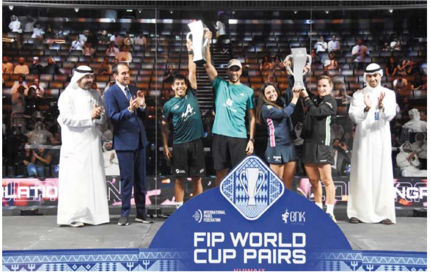
تتويج أبطال كأس العالم للبادل في الكويت 2025

بالشباب والرياضة ودعم مسيرة الإنجازات الكويتية في مختلف المحافل الإقليمية والدولية. كما ثمن الخرافي الدعم والمتابعة المستمرة من الحكومة والجهات الرسمية مشيداً بالجهود المتكاملة التي تبذلها الجهات المعنية في دعم استضافة البطولات الكبرى وتذليل العقبات وتطوير البنية الرياضية بما يعكس تكامل الأدوار بين مؤسسات الدولة والقطاع الخاص ويسهم في ترسيخ مكانة دولة الكويت كمركز رياضي إقليمي ودولي متقدم.