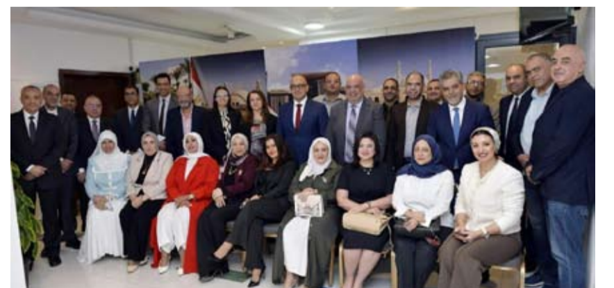
السفير بدير متوسطاً أبناء الجالية المصرية

التقى قنصل جمهورية مصر العربية في الكويت شريف بدير عدد من أبناء الجالية المصرية، بمقر القنصلية وقد حضر اللقاء المستشار أشرف علم الدين رئيس مكتب التمثيل العمالي بالقنصلية. وأكد بدير أن اللقاء يأتي استمراراً لسلسلة اللقاءات التي تعقدتها البعثة مع أبناء الجالية المصرية بالكويت، في إطار اهتمام وزارة الخارجية بتعزيز أواصر التواصل مع المصريين في الخارج، والمتابعة المستمرة والدائمة لهم، والعمل على تلبية احتياجاتهم والاستماع إلى مقترحاتهم. واستعرض القنصل المساعد التي تقوم بها وزارة الخارجية لتطوير العمل القنصلي،