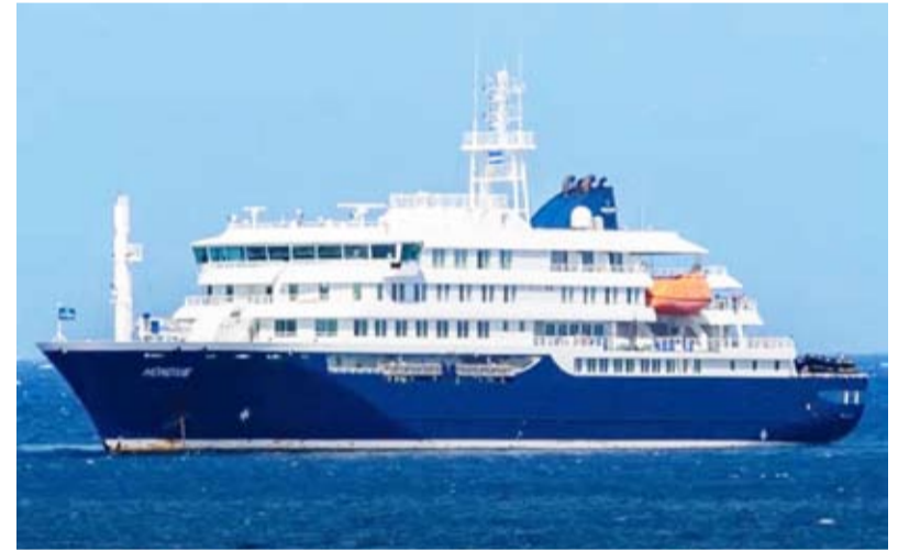
فيروس هانتا تفشى على متن السفينة المتجهة إلى إسبانيا

قال فرناندو جراندني مارلاسكا وزير الداخلية الإسباني أمس إن ألمانيا وفرنسا وبلجيكا وأيرلندا وهولندا أكدت أنها ستقبل طائرات لإجلاء رعاياها من على متن سفينة سياحية تشهد تفشياً لفيروس هانتا متجهة إلى إسبانيا. وأضاف أن الاتحاد الأوروبي سيرسل طائرتين أخريين لنقل باقي المواطنين الأوروبيين، وقال إن الولايات المتحدة وبريطانيا أكدت أيضاً أنه يجري الترتيب لإرسال طائرات ووضع خطط طوارئ من أجل المواطنين من خارج الاتحاد الأوروبي الذين لم تتمكن بلدانهم من إرسال طائرات لنقلهم.