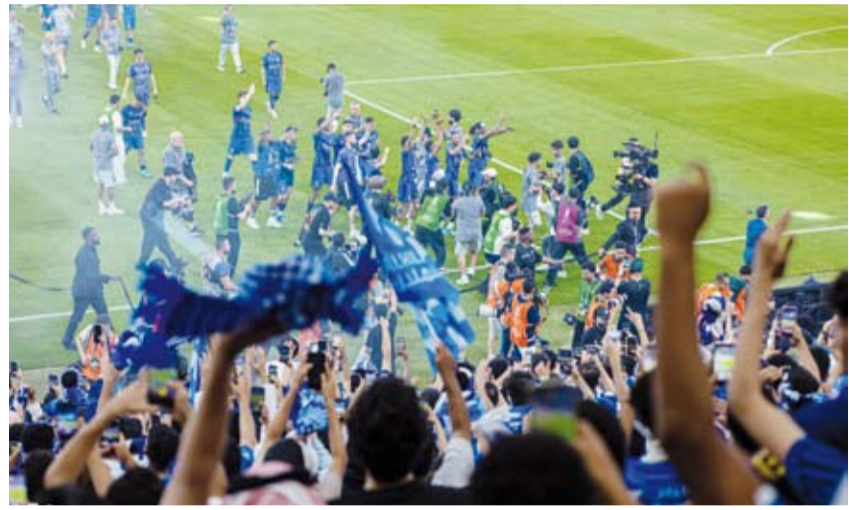
الهلال بطلاً لكأس الملك سلمان

في ليلة كرنفالية رياضية اعتلتها لوحة عملاقة بعنوان «فخر الوطن»، وحملت صورة الملك سلمان وولي عهده الأمير محمد بن سلمان، توج الهلال بطلاً لكأس الملك السعودي للمرة العاشرة في تاريخه، وذلك بعد فوزه على الخلود 2-1 في النهائي الذي جمعهما على ملعب الإنماء بجدة. وجرى النهائي الكبير تحت رعاية خادم الحرمين الشريفين الملك سلمان بن عبد العزيز، وحضور وتشريف الأمير محمد بن سلمان وولي العهد رئيس مجلس الوزراء. كما حضر للنهائي الأمير تركي الفيصل والأمير سعود بن مشعل نائب أمير منطقة مكة المكرمة، والأمير عبد العزيز بن تركي الفيصل وزير