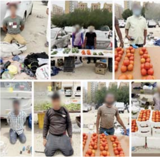
المتهمون مع البسطات

والرقابية في مختلف مناطق البلاد، لضبط المخالفين والخارجين على القانون، والالتزام بحق مرتكبيها.