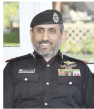
العميد ركن بحري الشيخ مبارك علي يوسف الصباح

أعلنت وزارة الداخلية ممثلة بالإدارة العامة لبحر السواحل السماح لقوارب صيد الهواة وقوارب النزهة بالإبحار خلال النهار اعتباراً من اليوم الأحد من 5 صباحاً وحتى 7 مساءً. وأوضح مدير عام الإدارة العميد ركن بحري الشيخ مبارك علي يوسف الصباح في بيان للوزارة، أول أمس، أن القرار جاء بعد تقييم الأوضاع الراهنة وبما يحقق التوازن بين إتاحة المجال أمام هواة البحر لممارسة أنشطتهم والمحافظة على أمن وسلامة الملاحة البحرية.