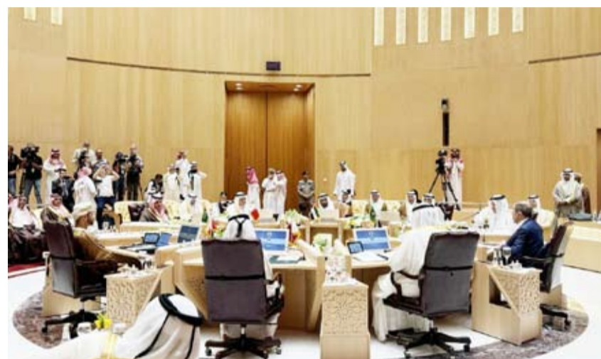
الاجتماع الوزاري المشترك السابع للحوار الاستراتيجي بين مجلس التعاون الخليجي وروسيا في الرياض

أعلن وزير مالية الاحتلال بسلئيل سمو تريتش أن مهمة حياته هي إحباط إقامة دولة فلسطينية، موضحا أن الحرب التي تخوضها إسرائيل ستنتهي «عندما نسحق حماس وحزب الله». وقال زعيم حزب «الصهيونية الدينية» -عبر منصة إكس- إن «مهمة حياتي هي بناء أرض إسرائيل وإحباط إقامة دولة فلسطينية من شأنها أن تعرض دولة إسرائيل للخطر». وأضاف «هذه ليست (مسألة) سياسية، إنها وطنية ووجودية» متابعيا «لهذا السبب أخذت على عاتقي، بالإضافة إلى منصب وزير المالية، مسؤولية القضايا المدنية في يهودا والسامرة، أي الضفة الغربية المحتلة من قبل إسرائيل». وفي إشارة إلى المستوطنين بالضفة، قال الوزير الإسرائيلي «سواصل العمل بكل قوتي حتى يتمتع