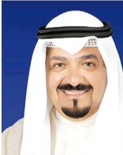
سمو الشيخ أحمد العبدالله

بعث سمو الشيخ أحمد العبدالله رئيس مجلس الوزراء، ببرقية تهنئة إلى الرئيس كيم جونج وون الأمين العام لحزب العمل الكوري رئيس شؤون الدولة لجمهورية كوريا الديمقراطية الشعبية القائد الأعلى للقوات المسلحة لجمهورية كوريا الديمقراطية الشعبية بمناسبة العيد الوطني لبلاده.