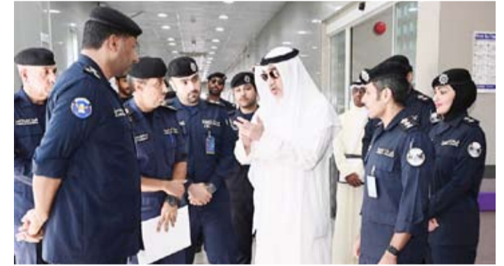
النائب الأول أكد الالتزام بأعلى معايير الجودة في تقديم الخدمات الطبية