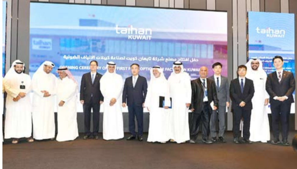
صورة جماعية عقب حفل تدشين المصنع

دشن وكيل وزير التجارة والصناعة زياد الناجم مع وزير (التجارة) خليفة العجيل أمس مصنع شركة (تايبهان كويت) الذي يعد أول مصنع كويتي في منطقة ميناء عبدالله الصناعية لصناعة كابلات الألياف الضوئية (فايبر) والتي تمثل العمود الفقري لأنظمة الاتصالات الحديثة ونقل المعلومات عبر شبكات الاتصالات والإنترنت. وقال الناجم في تصريح صحفي عقب حفل التدشين إن هذا النوع من المصانع يعتبر من المصانع النوعية في البلاد لإسماها أن الدولة تعمل حالياً على تغيير الكابلات النحاسية إلى أخرى ضوئية لما لها من قدرة كبيرة في الاتصال وسرعة في نقل المعلومات والبيانات بصورة آمنة. وأكد أن الوزارة لن تتوان عن دعم وتسهيل إجراءات مثل هذه المصانع لدعم رؤية (كويت جديدة 2035) الهادفة إلى تحويل دولة الكويت إلى مركز مالي وتجاري إقليمي وعالمي جاذب للاستثمار.