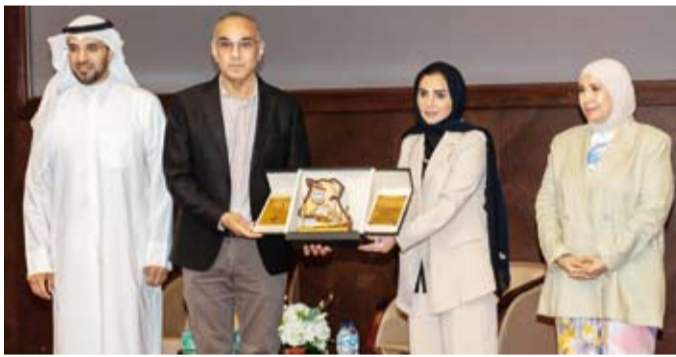
جانب من تكريم الجهات الرسمية المشاركة في الفعالية

أعلنت جائزة سمو الشيخ سالم العلي للمعلوماتية، أمس، إطلاق النسخته التاسعة من مسابقتها الثقافية السنوية (شفت الكويت) بعنوان (كويت الإنسانية) على وسائل التواصل الاجتماعي مستهدفة جميع الفئات الاجتماعية. وقالت رئيس مجلس أمناء الجائزة الشبيخة عابدة سالم العلي لـ (كويتا): إن الجائزة أطلقت المسابقة بعنوان (كويت الإنسانية) بمناسبة مرور 10 سنوات على تسمية الأمم المتحدة دولة الكويت (مركزاً للعمل الإنساني) وأميرها حينذاك