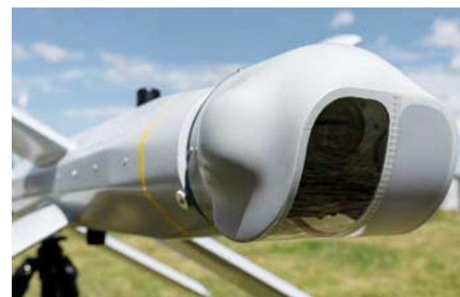
تطوير طائرة مسيرة للبحث والإنقاذ

المشرف على المشروع أن الابتكار يهدف إلى رفع المستوى في عمليات البحث والإنقاذ في جميع الظروف المناخية، أي أن الهدف ليس ابتكار طائرة مسيرة فقط، بل ابتكار شريحة تحتوي على برامج أساسية ثابتة يمكن إضافة معايير جديدة لها. يذكر أن الطائرات المسيرة تستخدم على نطاق واسع في عمليات البحث وإنقاذ المفقودين، ولكن مشغل الطائرة المتوفر حالياً قد يحتاج إلى بذل جهد ووقت لتنفيذ مهام البحث والإنقاذ.