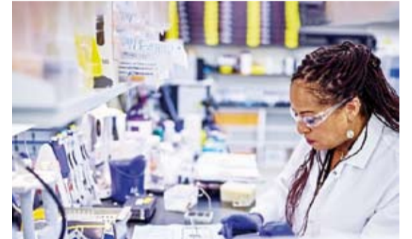
إجراء التجارب لتطوير النهج الجديد

طور علماء أمريكيون نهجاً جديداً فتح آفاقاً كبيرة وأحدث ثورة نحو علاج العديد من الاضطرابات المزمنة، بما في ذلك إصلاح المفصل والتلف بعد التوتبات القلبية ومكافحة رفض عملية الزرع. ووفقاً للفريق العلمي في جامعة "كورنيل" ومعهد "ماساتشوستس" للتكنولوجيا الأمريكية، فإن النهج الجديد يتضمن تصنيع الخلايا التي تفرز وتوصل العلاجات إلى أجزاء معينة من الجسم، وتسمى الخلايا الجذعية المتوسطة، حيث يمكنها أن تتباين (كالخلايا الجذعية) لتصبح خلايا نسيج ضام للغضاريف والأنسجة والدموع والعديد من الأنسجة. وصمم الخبراء منصة (ناقل صغير-مفاعل حيوي صغير) سمحت لهم بالتحكم في العديد من المتغيرات، بما في ذلك خصائص إشارات الخلايا ودرجة الحموضة ودرجة الحرارة والغازات، مع خلق بيئة عالية الجودة ومنسقة للخلايا، وباستخدام المنصة، قام الفريق بزراعة خلايا جذعية من 3 متبرعين مختلفين على التوالي، ثم كرروا التجربة 3 مرات للخلايا من المتبرعين نفسه. وقارن الخبراء نتائجهم بتقنية القارورة المستخدمة حالياً، التي تتضمن استخدام قوارير البوليبسترين لزراعة الأنسجة مع وسائط زراعة الخلايا، والتي كانت بمثابة عنصر تحكم تجريبي، فوجدوا أن النهج المطور قد يجهز تلك الخلايا لإنتاج المزيد من البروتينات العلاجية للاضطرابات المزمنة.