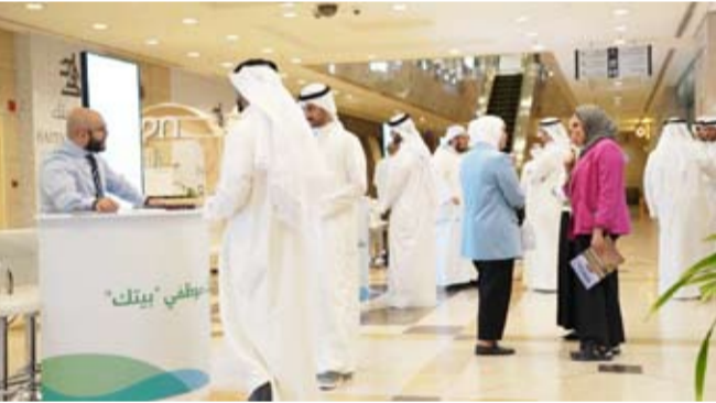
إقبال من الموظفين والموظفات على المعرض