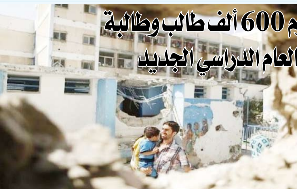
الاحتلال أمن في تدمير البنية التحتية بما فيها المدارس

وطأة سياسات فرض هوية الاحتلال والتهويد. وذكرت أن الأمر ذاته ينطبق على «المناطق المسماة (ج) وحتى على مراكز المدن والمخيم التي باتت مسرحا لعمليات تدميرية ينفذها الاحتلال».