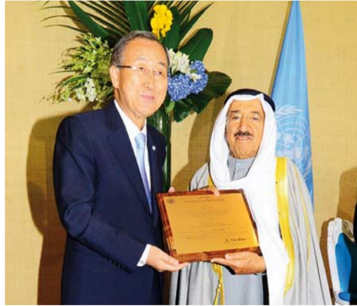
سمو أمير البلاد الراحل الشيخ صباح الأحمد مكرماً من بان جي مون عقائد للعمل الإنساني

في التاسع من سبتمبر عام 2014، كانت دولة الكويت على موعد مع حدث استثنائي غير مسبوق في تاريخ الأمم المتحدة يليق بتاريخها الإنساني المشرف وريادتها في الأعمال الإنسانية والإغاثية لشعوب العالم.