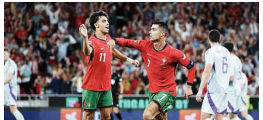
الدون يهدي البرتغال ثلاث نقاط بهدفه رقم 901

قاد النجم البرتغالي كريستيانو رونالدو منتخب بلاده لفوز صعب للغاية على ضيفه اسكتلندا بنتيجة 2-1 ضمن منافسات الجولة الثانية ببطولة دوري أمم أوروبا لكرة القدم. تقدم منتخب اسكتلندا بهدف مبكر بعد مرور سبع دقائق سجله لاعب الوسط سكوت ماكوميني بضربة رأس قوية بعد عرضية من كيني ماكلين من الجهة اليسرى. وقلب منتخب البرتغال الطاولة على منافسه في الشوط الثاني حيث سجل برونو فرنانديز هدف التعادل في الدقيقة 54 بتسديدة بيسراه من خارج منطقة الجزاء بعد تمهيد لكرة من زميله إفاييل لياو. وبدأ