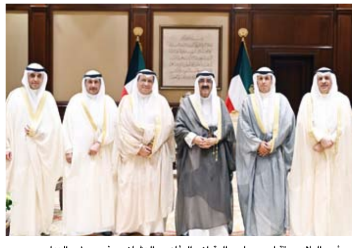
سمو أمير البلاد يستقبل بورسلي والرقدان والرفاعي والعثمان بحضور وزير العدل