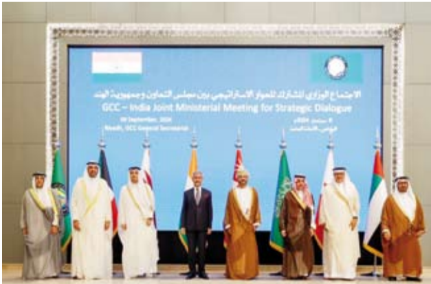
وزراء خارجية دول مجلس التعاون مع وزير الخارجية الهندي