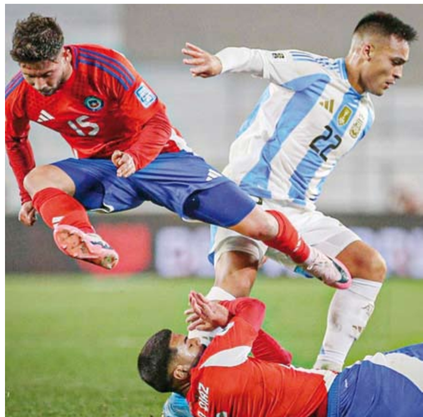
التناغو لتكرار فوزه على كولومبيا

أمريكا، وذلك بداعي الإصابة التي تعرض لها. وتفوق منتخب الأرجنتين الأسبوع الماضي على تشيلي بثلاثة أهداف، بينما انتزع منتخب كولومبيا تعادلاً متأخراً أمام بيرو آخر الترتيب 1-1 بعدما سجل مهاجم ليفربول لويس دياز هدف الإنقاذ قبل ثماني دقائق من نهاية الوقت الأصلي.