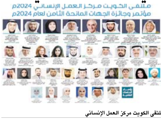
ملتقى الكويت مركز العمل الإنساني

كما قال الدكتور شهاب أحمد العثمان المدير العام لبرنامج الكويت للمسؤولية المجتمعية ومدير عام معهد الإنجاز المنفوق للتدريب والاستشارات الجبهة الشريك لتنظيم الفعالية في دولة الكويت قال فيه: تنشر في الشبكة الإقليمية للمسؤولية الاجتماعية أن تحمل هذه النسخته من الفعاليات اسم «المغفور لها بإذن الله سيدة الجائزة أطلقت المسابقة بعنوان (كويت الإنسانية) بمناسبة مرور 10 سنوات على تسمية الأمم المتحدة دولة الكويت (مركزاً للعمل الإنساني) وأميرها حينذاك (قائداً للعمل الإنساني).