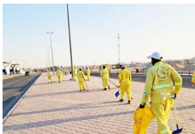
عمال البلدية ينظفون احد شوارع استاد جابر

وأكد العقاب على قيام الفريق الرقابي بإدارة التدقيق ومتابعة خدمات البلدية بتنفيذ جولة ميدانية أسفرت عن تحرير 39 مخالفة تنوعت ما بين مخالفة إقامة إعلان خاص بالنشاط بدون ترخيص وعدد محاضر مخالفة لعرضهم بضاعة أمام المحل بدون ترخيص بالإضافة إلى إعطاء 28 إنذار.