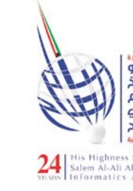
جائزة سالم العلي للمعلوماتية

وأوضحت أن الجائزة أطلقت في الوقت ذاته مسابقة (شفت الكويت) ينسختها الخامسة تحت عنوان (كويت الإنسانية) أيضاً بهدف رفع الوعي بالإنجازات مستحقها في مختلف بقاع الأرض والتي تعد ركناً أساسياً في دعم العمل الخيري والإنساني. من جهته أعرب رئيس اتحاد