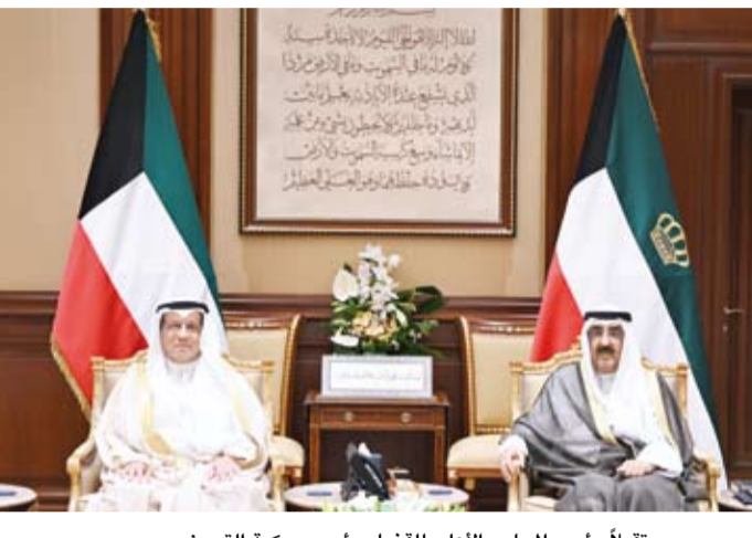
.. وسموه مستقبلاً رئيس المجلس الأعلى للقضاء رئيس محكمة التمييز