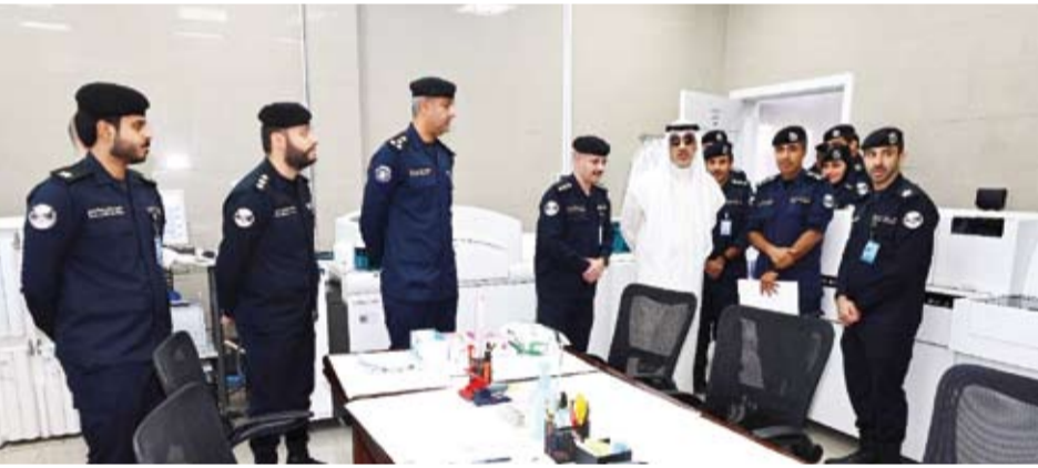
الشيخ فهد اليوسف خلال جولته التفتيشية

وتطوير الأداء بما يتماشى مع تطورات القيادة والوزارة وضرورة توفير بيئة صحية آمنة لجميع الطلبة والعاملين بالأكاديمية.