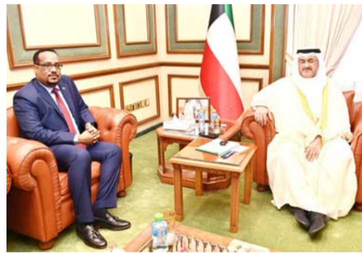
محافظ العاصمة مستقبلاً سفير إثيوبيا لدى الكويت

استقبل محافظ العاصمة الشيخ عبدالله سالم العلي الصباح، في مكتبه سفير جمهورية إثيوبيا لدى دولة الكويت سيد محمد جبريل، حيث رحب المحافظ بالسفير وتبادل الجانبان الأحاديث الودية التي تناولت العلاقات الثنائية بين البلدين الصديقين وسبل تعزيزها في مختلف المجالات ودعمها نحو آفاق أرحب.