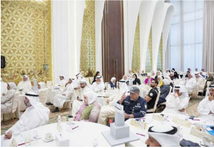
متابعة من قيادي وزارة الاشغال