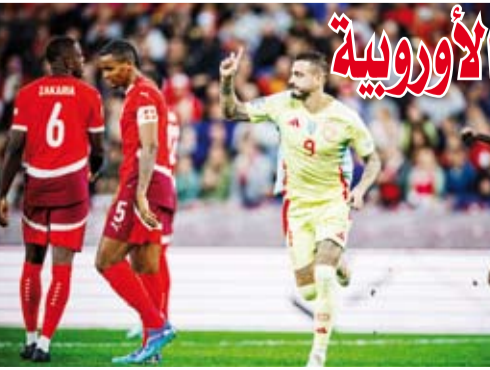
المتادور يواصل التالق

وتقدم المنتخب الإسباني في الدقيقة الرابعة عن طريق خوسيلو، وأضاف فابيان رويز الهدف الثاني في الدقيقة 13. وتأخر المنتخب الإسباني، بطل أمم أوروبا 2024، بالنقص العددي في صفوفه بعد طرد مدافعه روين لي نورماند في الدقيقة 20. وفي الدقيقة 41 سجل زكي أمودني الهدف الوحيد للمنتخب السويسري، فيما أضاف فابيان رويز الهدف الثالث في الدقيقة 77، واختتم فيران توريس الرباعية في الدقيقة 80.