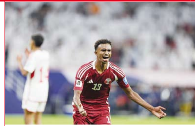
هزيمة مفاجئة أمام الإمارات أربكت حسابات بطل آسيا

تبحث قطر عن نسيان خيبة الخسارة الإماراتية، عندما يحل لاعبو المدرب "تينت" ماركيس لوبيس على كوريا الشمالية في لاوس.