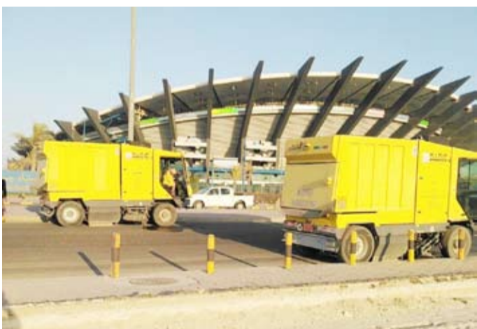
آليات البلدية أمام استاد جابر

تباشر استعداداتها لاستضافة مباراة الكويت والعراق اليوم خلال شهر أغسطس الماضي 1158 بلاغ تلقاها الخط الساخن 139