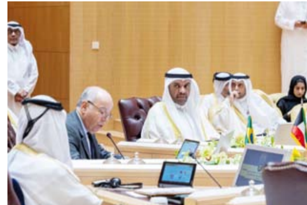
البحر مترأساً وفد الكويت خلال الاجتماع الوزاري مع وزير خارجية البرازيل

البحر، وزير الشؤون الخارجية في جمهورية الهند الدكتور سوبراهمانيام جايشانكر، وذلك على هامش الاجتماع الوزاري المشترك لوزراء خارجية دول مجلس التعاون لدول الخليج العربية المنعقد في مقر الأمانة العامة لمجلس التعاون بمدينة الرياض. حيث تم خلال اللقاء استعراض العلاقات الثنائية الوافية التي تربط البلدين الصديقين وبحث مجالات التعاون المختلفة بينها وأطر تعزيزها كما تم خلال اللقاء مناقشة المستجدات الإقليمية والدولية والتطورات التي تشهدها المنطقة وفي مقدمتها الأوضاع الإنسانية المتدهورة في قطاع غزة وأطر تعزيز التعاون المشترك وحشد الجهود الدولية لحفظ الأمن والاستقرار في المنطقة. كما التقى وزير الخارجية عبدالله