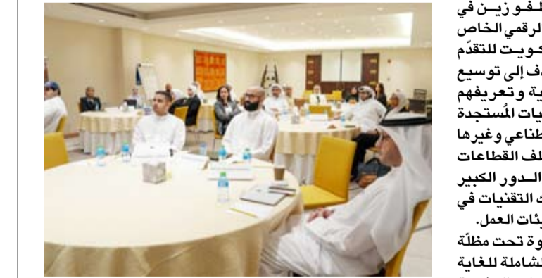
تولي زين اهتماماً بالاستثمار في العنصر البشري

الرقمته والاقتصاد الرقمي وكيف يدفع بنمو المؤسسات ويؤسس لنماذج أعمال جديدة، والتقنيات المستجدة التي ما زالت تحدث تغييرات هائلة في بيئات الأعمال، مثل الذكاء الاصطناعي، والتوليد، وانتشرت الأشياء، والتكنولوجيا المالية، والبيانات الضخمة، والواقع الافتراضي والمُعزز، وتعلم الآلة، والروبوتات، وغيرها.