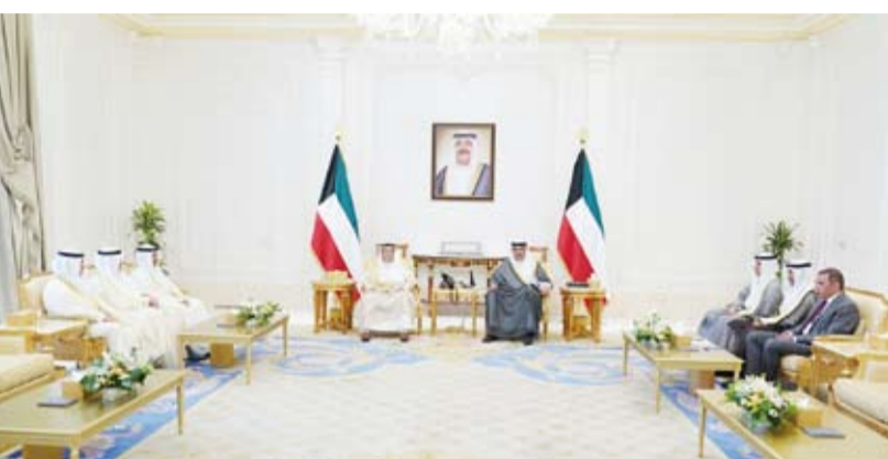
سمو ولي العهد مستقبلاً بورسلي والرقدان والرفاعي والعثمان بحضور الوزير محمد الوسمي

صباح الخالد، ببرقية تهنئة إلى الرئيس كيم جونج وون الأمين العام لحزب العمل الكوري رئيس شؤون الدولة لجمهورية كوريا الديمقراطية الشعبية القائد الأعلى للقوات المسلحة لجمهورية كوريا الديمقراطية الشعبية، ضمنها سموه خالص تهنائه بمناسبة العيد الوطني لبلاده وراجياً لفخامته دوام الصحة والعافية.