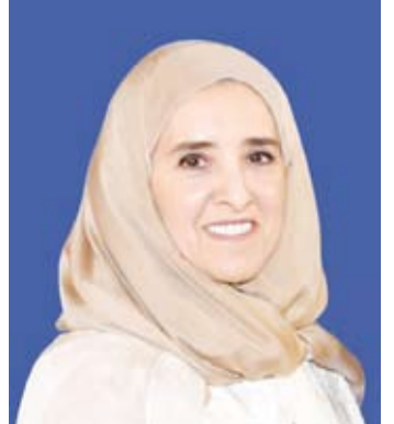
الشبيخة عابدة سالم العلي

المغفور له بإذن الله تعالى سمو الشيخ صباح الأحمد طيب الله ثراه (قائداً للعمل الإنساني). وهنأت الشبيخة عابدة الصباح، صاحب السمو أمير البلاد الشيخ مشعل الأحمد وسمو ولي العهد الشيخ صباح الخالد بحلول هذه الذكرى مبيحة أن الجائزة ومن خلال هذه المسابقة تسعى لإبراز الأعمال الإنسانية التي جعلت الكويت تحظى بتسميتها (مركزاً للعمل الإنساني) وأميرها حينذاك (قائداً للعمل الإنساني). وأكدت أن التكريم الأممي غير المسبوق