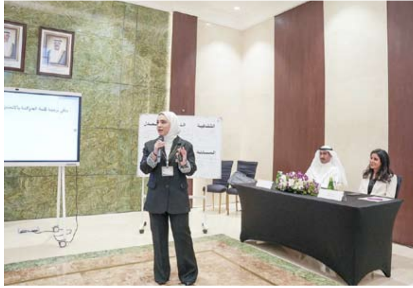
وزير الأشغال تتابع الورشة

قالت وزيرة الأشغال العامة الدكتورة نورة المشعان إنها حرصت على تطبيق مبادئ وأسس الحوكمة لضمان سلامة واستدامة العمل الإداري والفني في الوزارة.