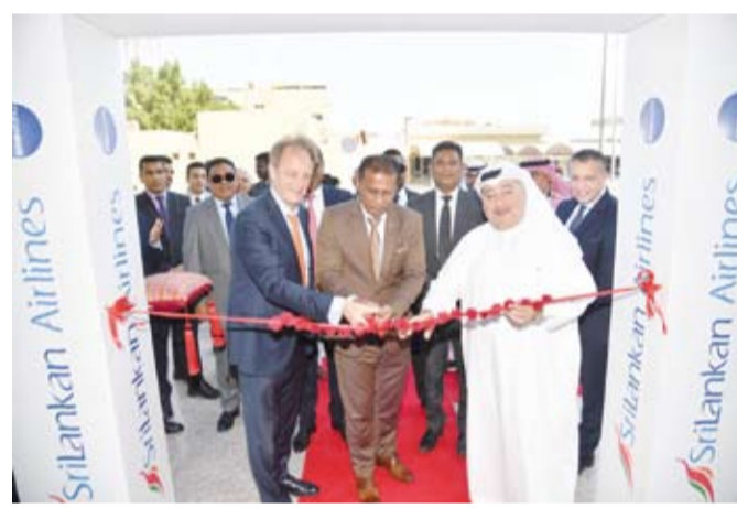
تدشين مكتب الخطوط السريلانكية

المدني، وكذلك التوسعات الجديدة والتي سيكون لها مردود إيجابي في فتح الكويت وتنشيط السياحة للبلاد بشكل أكبر. أكد السفير السريلانكي في الكويت كاندبيان بالا أن العلاقة بين الكويت وسريلانكا متميزة وأسهمت الخطوط السريلانكية في التقارب بين الشعبين وتنمية التعاون التجاري بين البلدين الصديقين، موضحاً أن علاقتنا مع الكويت قائمة على الشراكة بين البلدين وقال السفير إن افتتاح المكتب الجديد للخطوط الجوية السريلانكية بالكويت خطوة مهمة وخاصة، مشيداً بالدور الكبير الذي تقوم به مجموعة بوخمسين للطيران في هذا الإطار والذي يشجع السياحة إلى دولتنا.