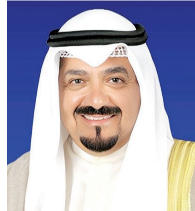
سمو الشيخ أحمد العبدالله

جمهورية إثيوبيا الفيدرالية الديمقراطية الصديقة، ضمنها سموه خالص تهنأته بمناسبة انتخابه رئيساً لجمهورية إثيوبيا الفيدرالية الديمقراطية الصديقة وأداء فخامته اليمين الدستورية. كما بعث سمو الشيخ أحمد العبدالله رئيس مجلس الوزراء، ببرقية تهنئة إلى الرئيس يويري كاجوتا موسيفيني رئيس جمهورية أوغندا الصديقة بمناسبة العيد الوطني لبلادها.