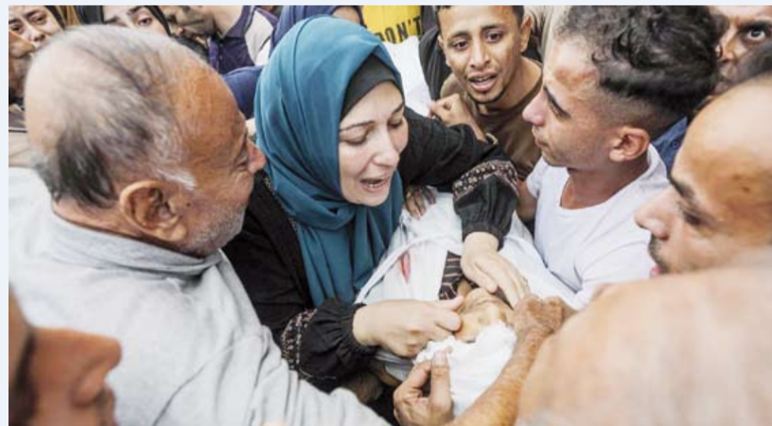
أم فلسطينية تنعى ابنها

استشهد 16 فلسطينياً، بينهم 9 من عائلة واحدة، جراء غارات إسرائيلية على حي الشجاعية شرق مدينة غزة، وعلى مخيم النصيرات والبريج وسط قطاع غزة.