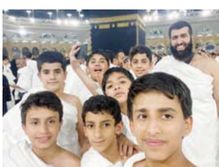
جانب من رحلة العمرة لفريق حافظ الوحي

تأكيداً لدورها الديني والتربوي والثقافي وانطلاقاً من مسؤوليتها المجتمعية، نظمت الحكمة الكويتية الخيرية رحلة إلى المملكة العربية السعودية الشقيقة لعدد 24 طالباً كويتياً من طلبة حلقات حفظ القرآن الكريم المتميزين لمدة 17 يوماً زار خلالها الطلبة والمشرفون من فريق «حفاظ الوحي» المدينة المنورة وأمضوا فيها 12 يوماً وفي مكة المكرمة يومين و3 أيام في الطائف.