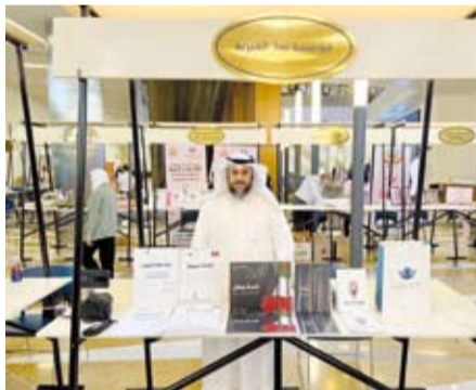
جناح «نماء الخيرية»

شاركت نماء الخيرية بجمعية الإصلاح الاجتماعي بالمعرض الصحي التوعوي الثالث عشر الذي تنظمه حملة «كان» الوطنية للتوعية بمرض السرطان، تحت شعار «صحتك بفحصك»، الذي أقيم في كلية العلوم الحياتية بجامعة الكويت أمس.