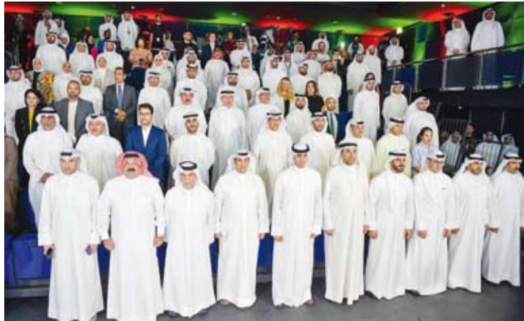
حضور مميز للعرض المرئي

وقال الوزير المطيري إنه «تم إنشاء هيكل تنظيمي للبطولة يضم 19 لجنة تضم خبراء وشباب كويتيين حيث تضم فرق العمل في اللجان والشركات العاملة من 500 شاب وشابة من طاقاتنا الوطنية التي نفخر بها بالإضافة إلى فريق عمل لضبط الجودة وإدارة المخاطر لتكون هذه التجربة نقلة نوعية لهم في مجال التنظيم والإدارة وتتم الاستفادة منها في مختلف الفعاليات المستقبلية».