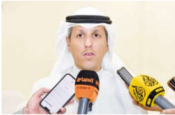
د. محمد الوسمي

أكد وزير العدل ووزير الأوقاف والشؤون الإسلامية، الدكتور محمد الوسمي، أمس، أن الكويت تسعى إلى المحافظة على القيم الإسلامية من خلال ترسيخ المبادئ الإسلامية وخدمة القرآن الكريم. وجاء ذلك في تصريح للوزير الوسمي لـ (كونا) عقب زيارة تفقدية لمبنى دار القرآن الكريم في منطقة سعد العبدالله الذي سيتم افتتاحه قريباً.