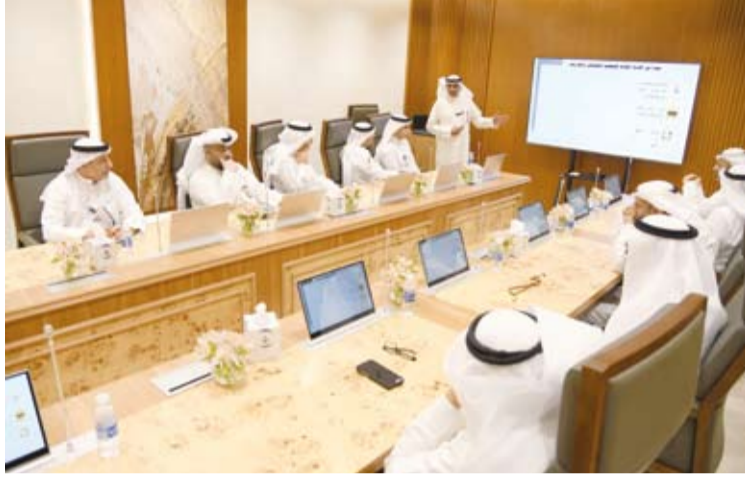
د. حسن الفجاء يقدم عرضاً تفصيلياً عن هيئة التعليم التطبيقي والتدريب

كما أن الهيئة استطاعت من خلال الاتفاقيات وبروتوكولات التعاون مع سوق العمل أن تفتح آفاق رحبة لأبنائنا الطلبة لتعيين من خلال الدورات والبرامج المنتهية بالتوظيف. وفي نهاية اللقاء أعرب الوزير عن سعادته بلقاء مدير عام الهيئة العامة للتعليم التطبيقي والتدريب وقياداتها، مؤكداً حرصه على استمرار هذه اللقاءات بشكل دوري لضمان تحقيق الهيئة لرسالتها في بناء كوادر وطنية قادرة على قيادة مسيرة التنمية المستدامة في البلاد. واختتم اللقاء بتقديم هدية تذكارية من إنتاج طلبة الهيئة للوزير وشكره على هذه الزيارة التي أثلجت صدور منتسبي الهيئة.