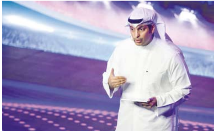
الوزير المطيري أثناء العرض المرئي حول خليجي 26

أكد وزير الإعلام والثقافة ووزير الدولة لشؤون الشباب عبدالرحمن المطيري أن بطولة كأس الخليج العربي لكرة القدم وعبر تاريخها تجسد العلاقات المتجددة والروابط الأخوية التي تجمع دول المنطقة قيادة وشعبا.