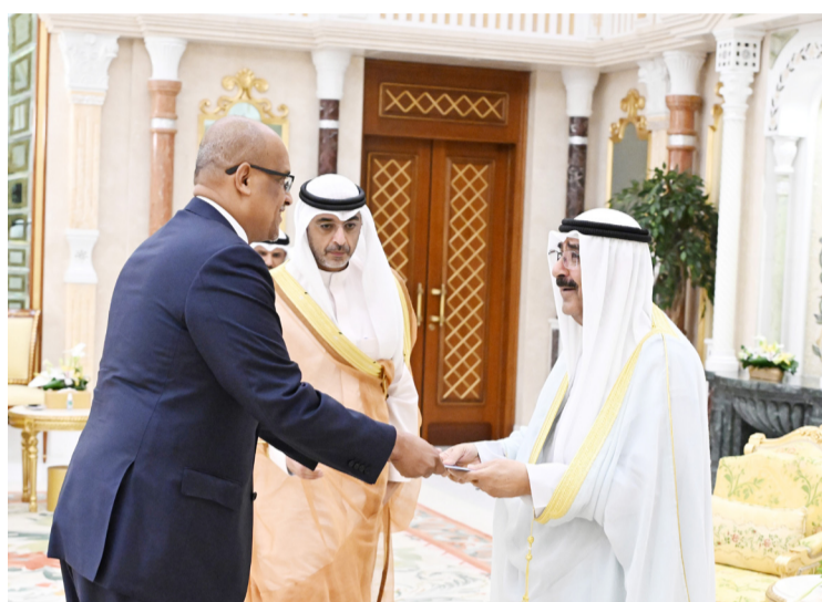
.. وسموه يتسلم أوراق اعتماد سفير الصومال