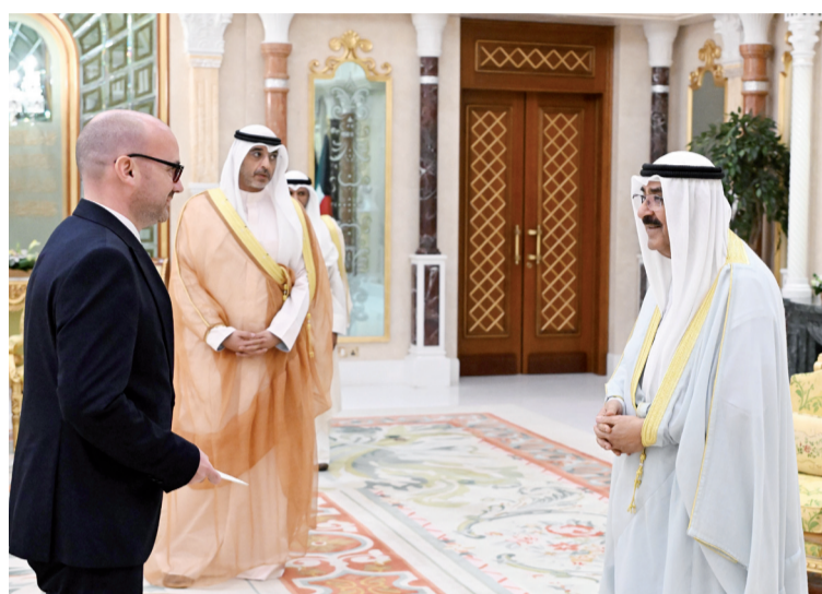
أمير البلاد يتسلم أوراق اعتماد سفير فرنسا