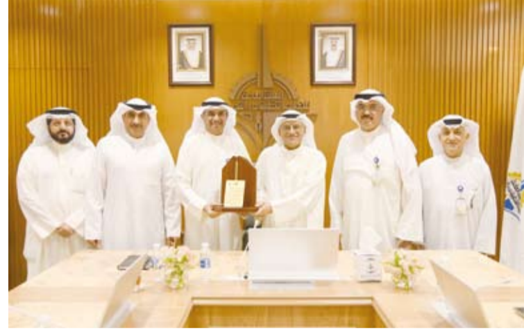
د. ناصر الجلال يتسلم برعاً خلال زيارته لـ «التطبيقي والتدريب»

وتحرص على تطبيق القوائيم والنظم التي تصدرها الدولة، وتحرص الهيئة أيضاً على تطبيق نظام الحوكمة وتحقيق أعلى درجات النزاهة والشفافية والتعاون مع الجهات الرقابية في الدولة. كما تحرص الهيئة على جودة التعليم من خلال الإبتعاث للجامعات المميزة لمبتعثيها.