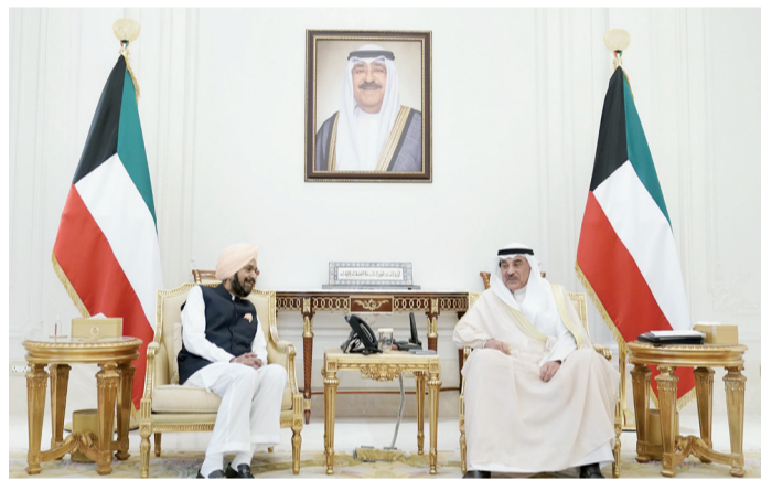
ولي العهد يستقبل راجا راندير سينغ

الأولمبي الآسيوي حسين المسلم ونائب مدير عام المجلس الأولمبي الآسيوي فينود تيواري. من جهة أخرى، بعث سمو ولي العهد الشيخ صباح الخالد، ببرقية تهنئة إلى الرئيس تاي أتسقى سيلاسي رئيس جمهورية إثيوبيا الفيدرالية الديمقراطية الصديقة، ضمنها سموه خالص تهنأته بمناسبة انتخابه رئيساً لجمهورية إثيوبيا الفيدرالية الديمقراطية الصديقة وأداء فخامته اليمين الدستورية، متمنياً سموه لفخامته كل التوفيق والسداد. كما بعث سمو ولي العهد الشيخ صباح الخالد، ببرقية تهنئة إلى الرئيس يويري كاجوتا موسيفيني رئيس جمهورية أوغندا الصديقة، ضمنها سموه خالص تهنأته بمناسبة العيد الوطني لبلادها وراجيا لفخامته دوام الصحة والعافية.