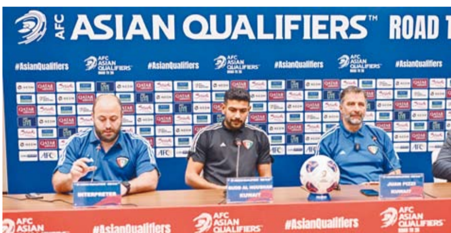
جانب من المؤتمر الصحفي المنتخب الكويت