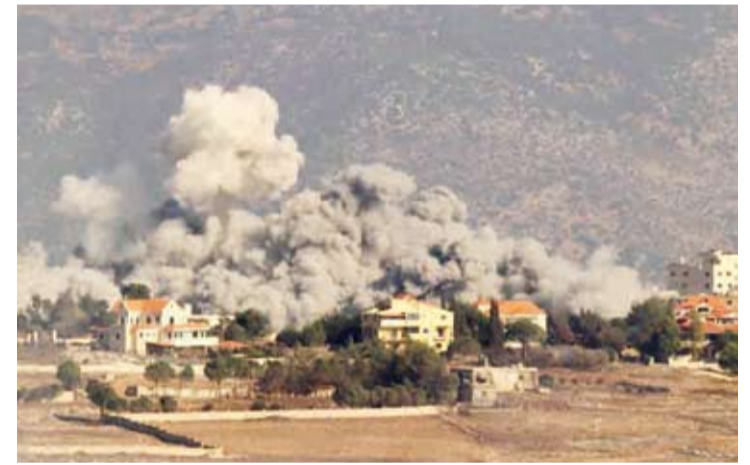
تواصل الغارات الجوية على مناطق لبنانية

أكد رئيس حكومة تصريف الاعمال اللبنانية نجيب ميقاتي، أمس، استمرار المساعي العربية والدولية لوقف عدوان الاحتلال الإسرائيلي على بلاده لافتاً إلى أن تعنت الاحتلال «والسعي لتحقيق ما يعتبره العدو مكاسب وانتصارات» هو الذي يعيق نجاح هذه المساعي. ونقل المكتب الإعلامي لرئيس الحكومة