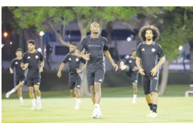
العنابي القطري أتم استعداداته لثالث الجولات

ينشد المنتخب القطري لكرة القدم تحقيق فوزه الأول في الدور الثالث من التصفيات الآسيوية المؤهلة إلى نهائيات كأس العالم 2026 في الولايات المتحدة الأمريكية وكندا والمكسيك، عندما يستقبل منتخب قبرغيزيا، اليوم الخميس، على استاد الثمامة في ثالث جولات المجموعة الأولى.