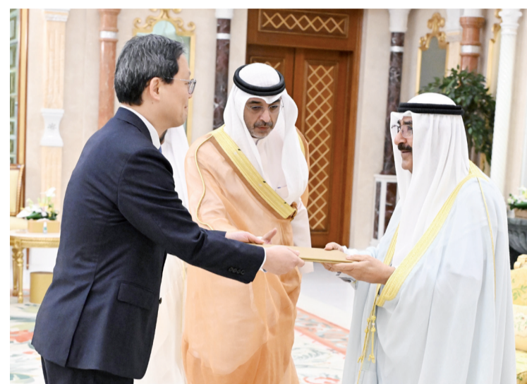
سمو أمير البلاد يتسلم أوراق اعتماد سفير كوريا

كاجوتا موسيفيني رئيس جمهورية أوغندا الصديقة، عبر فيها سموه عن خالص تهنأته بمناسبة العيد الوطني لبلادها. متمنياً سموه لفخامته موفور الصحة والعافية وللجمهورية أوغندا وشعبها الصديق كل التقدم والأزهار.