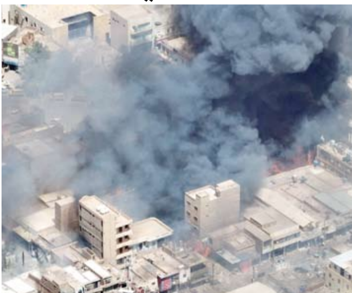
المعارك تجددت قبل أيام

أدانست أحزابٌ وقوى سياسية سودانية، أبرزها «تنسيقية القوى الديمقراطية المدنية» (تقدم)، القصف الجوي والمدفعي الذي سجّل خلال الأيام الأربعة الماضية، وأدى إلى مقتل قرابة 500 شخص، بغارات نفذها طيران الجيش على مدينة الحصاصيما، وسط السودان، ومدن حمرة الشيخ شمال كردفان، وكنم ومليط بشمال دارفور، ويقصف مدفعي نفذته «قوات الدعم السريع» على منطقة الحناتة في شمال أم درمان. ودعت هذه القوى السياسية المجتمع الدولي إلى التدخل العاجل من أجل وقف الانتهاكات».