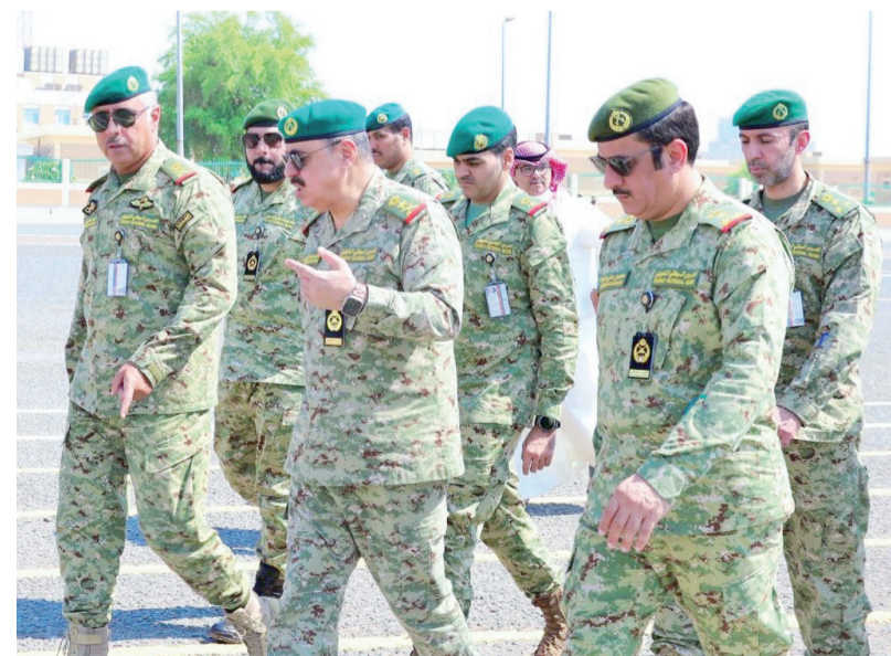
وكيل الحرس الوطني خلال زيارته لمعسكر الصمود

بيان صحفي، أمس: إن الفريق الرفاعي دعا منتسبي الدورة إلى الاستفادة من مناهجها وتدريباتها العملية إضافة إلى الالتزام بالضبط والربط. ونقل المنتسبين تحيات قيادة الحرس الوطني وهنامهم بالانضمام إلى صفوف الحرس.