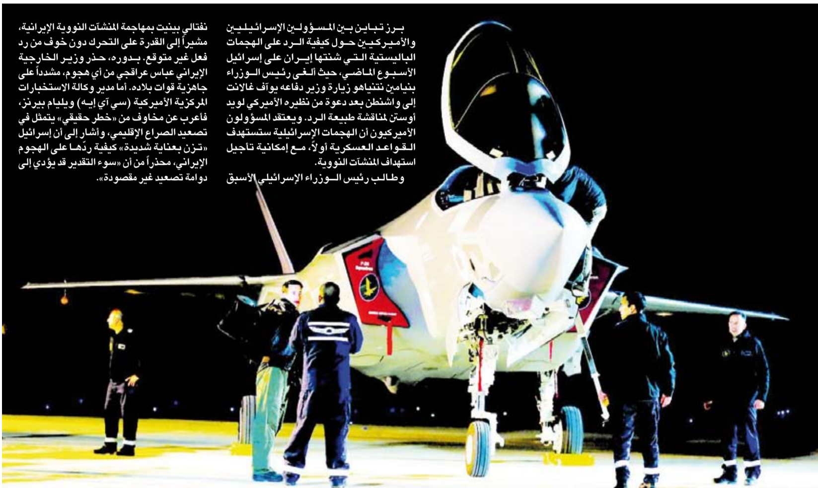
جنود صهاينة قرب طائرة مقاتلة

وأفادت الوكالة في وقت لاحق بعد انهيار أربعة مبان سكنية متلاصقة في منطقة برج البراجنة إثر الغارة الإسرائيلية الأخيرة، دون أن توضح ما إذا سقط ضحايا من جراء الهجوم. في الأسبوع الماضي، اغتالت إسرائيل الأمين العام لحزب الله، حسن نصر الله في قصف على جارة حريك في ضاحية بيروت الجنوبية، وهي منطقة مكتظة فر قسم كبير من سكانها بسبب القصف الإسرائيلي المكثف. ومذاك الحين، تشهد المنطقة غارات إسرائيلية عنيفة تتردد صدها في أرجاء العاصمة اللبنانية.