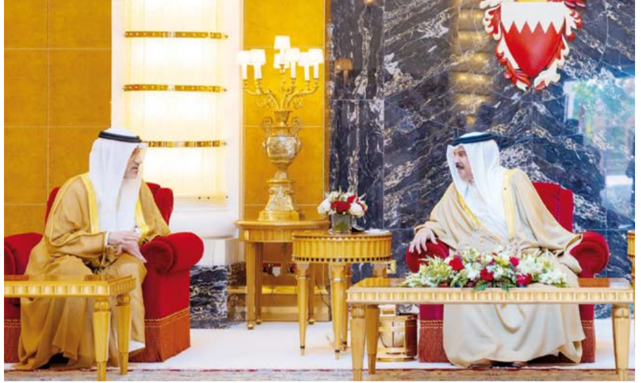
الملك حمد بن عيسى آل خليفة يستقبل الشيخ فهد اليوسف

فيما أجرى النائب الأول لرئيس مجلس الوزراء وزير الدفاع وزير الداخلية الشيخ فهد اليوسف، أمس، مباحثات مع وزير الداخلية البحريني والقائد العام لقوة دفاع البحرين المشير الركن الشيخ خليفة بن أحمد آل خليفة سبل تعزيز التعاون العسكري، التعاون الأمني والعسكري المشترك،