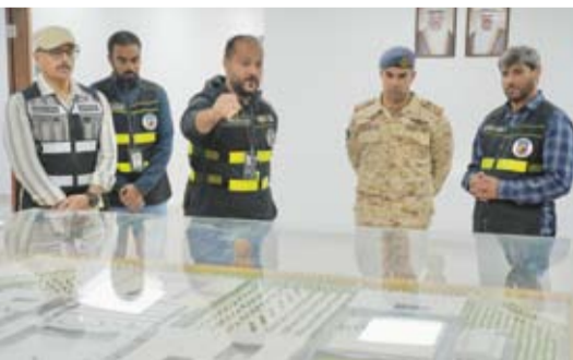
اللواء الركن طيار صباح جابر الأحمد الصباح خلال زيارته التفقدية

قام نائب رئيس الأركان العامة للجيش اللواء الركن طيار صباح جابر الأحمد الصباح، صباح أمس، بزيارة ميدانية تفقدية لمشروع إنشاء أكاديمية علي الصباح العسكرية الجديدة، وكان في استقباله وكيل هندسة المنشآت العسكرية بالتكليف المهندس حسام داود العتيقي.