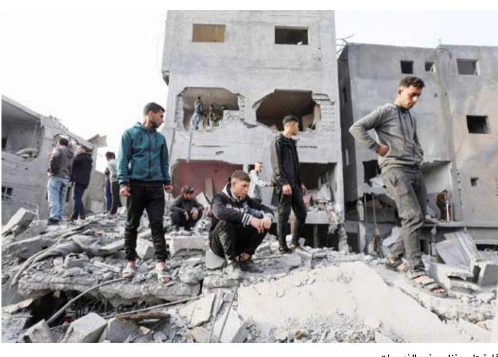
غارة على منزل بمخيم النصيرات

تحركات ويتكوف، تؤكد اهتمام ترمب بالفداء بموعد إنجاز إطلاق سراح الرهائن قبل تنصيبه في 20 يناير 2025، الأمر الذي يعزز جهود مؤقت لإطلاق النار، يتسع بعد ذلك لوقف الحرب المستمرة منذ أكثر من عام.