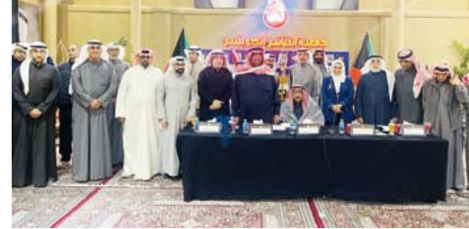
المشاركون في الجمعية العمومية

وجه، انطلاقاً من أن الفن رسالة إنسانية إبداعية ترتقي في الشعوب والمجتمعات الحضارية.