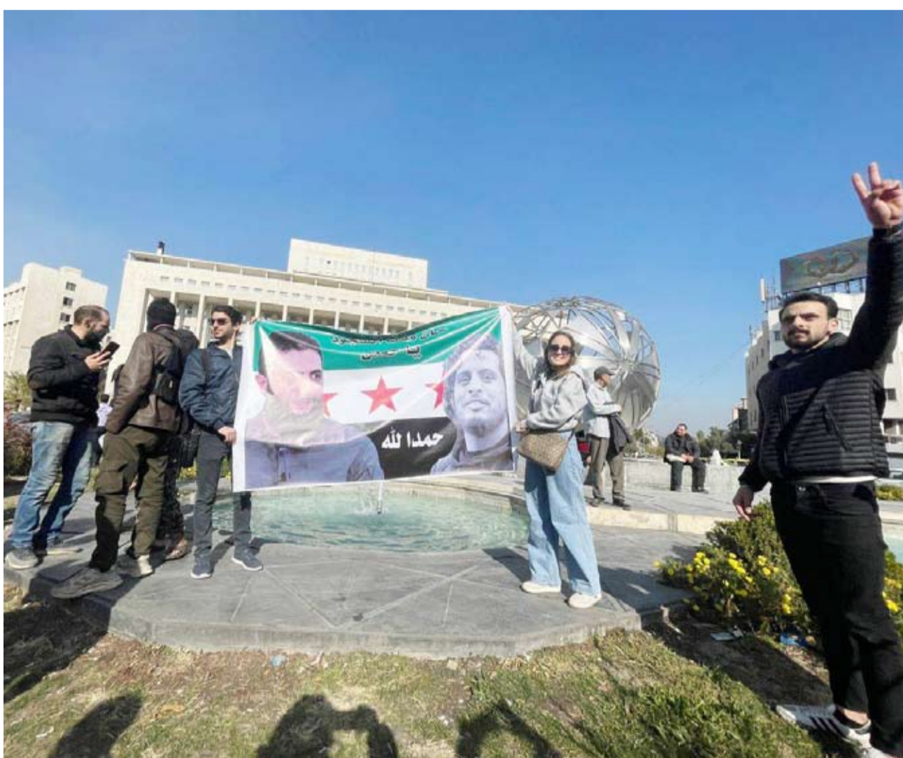
سوريون يحتفلون بسقوط نظام الأسد في دمشق

وأظهرت صور ومقاطع فيديو التقطها الحاج داخل مستشفى حرستا، شمال شرق دمشق، وأطلقت وكالة الصحافة الفرنسية عليها، جثة شخص اقتلعت عيناه، وآخر اقتلعت أسنانه، ودماء تجمدت على وجته ثالث، بينما كانت الكدمات واضحة على أجساد آخرين. وبين الجثث، صرة داخلها غلام وجثة شخص قصفه الصربي ظاهر.