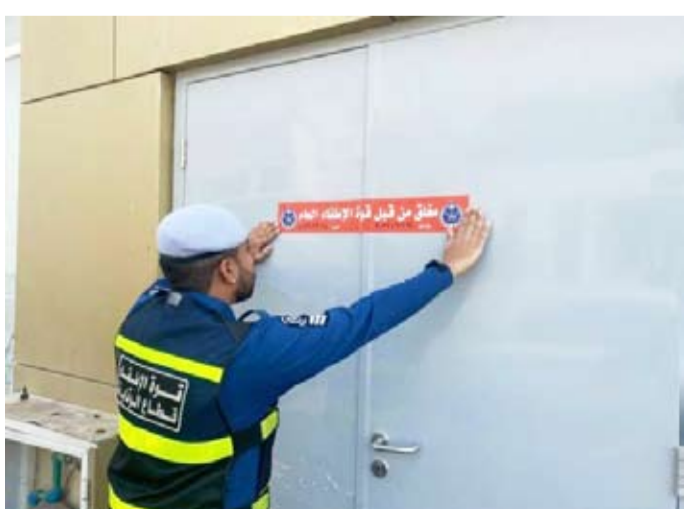
اغلق محل مخالف