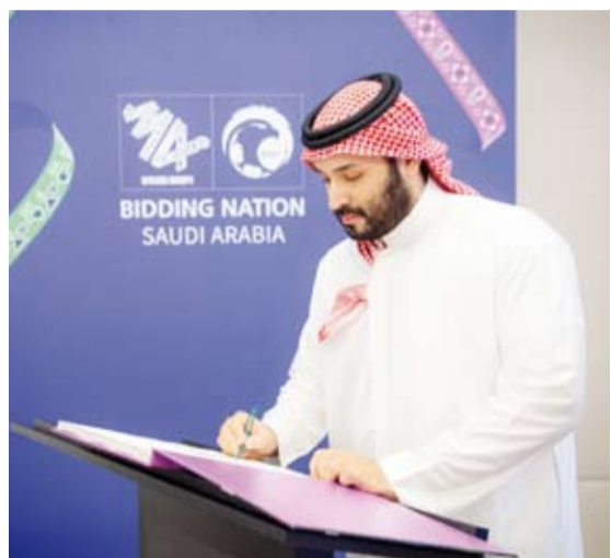
لم يتبق سوى الإعلان الرسمي عن استضافة المملكة لكأس العالم 2034

يعلن الاتحاد الدولي لكرة القدم (فيفا)، الدول المستضيفة لنسخة كأس العالم 2030 و2034 في أجواء محسومة. ويقف ملف المغرب وإسبانيا والبرتغال في مشهد الاستضافة لمونديال 2030، فيما يقف ملف السعودية وحيداً دون منافس لاستضافة كأس العالم 2034. وتستعد العاصمة السعودية الرياض للحدث الأول في تاريخها عبر تقديم أعظم ملف استطاع ويرقم تاريخي أن يحصل على أعلى تقييم بتاريخ تنظيم بطولات كأس العالم بعد أن أعلن «فيفا» أن الملف السعودي حصل على تقييم 419.8 من 500 نقطة في إنجاز غير مسبوق في تاريخ المونديال.