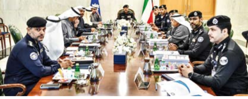
الفريق سالم النواف يترأس الاجتماع

الدراسية لتتواءم مع أحدث الأساليب العلمية العالمية. وأكد الفريق الشيخ سالم النواف على دعم وزارة الداخلية المستمر لأعمال المجلس، مشيداً بالجهود المبذولة لارتقاء برامج التعليم والتدريب، بما يساهم في تعزيز مستوى الكفاءة والتأهيل الأمني.