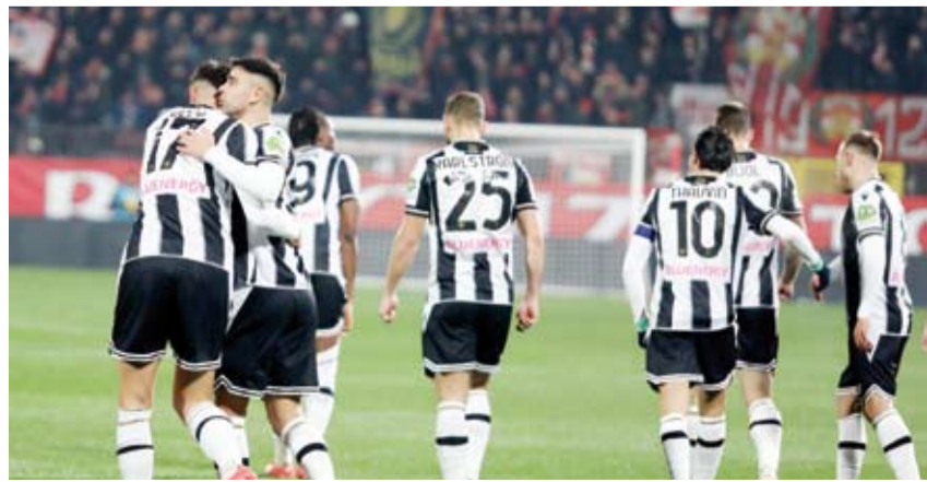
فوز مهم لأودينيزي في الدوري الإيطالي

ويتصدر أتالانتا ترتيب الدوري الإيطالي برصيد 34 نقطة، بفارق نقطتين عن نابولي صاحب المركز الثاني، في حين يحتل إنتر ميلان المركز الثالث برصيد 31 نقطة، بفارق الأهداف عن فيورنتينا صاحب المركز الرابع.