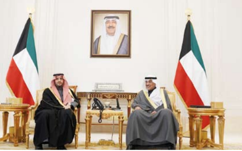
سمو ولي العهد يستقبل الأمير تركي بن محمد