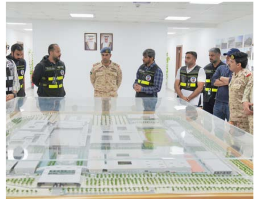
نائب رئيس الأركان يتفقد مشروع إنشاء الأكاديمية

قام نائب رئيس الأركان العامة للجيش اللواء الركن طيار الشيخ صباح جابر الأحمد الصباح امس بزيارة ميدانية تفقدية لمشروع إنشاء أكاديمية علي الصباح العسكرية الجديدة للاطلاع على مختلف المرافق قيد الإنشاء. وقالت وزارة الدفاع في بيان صحفي إن نائب رئيس الأركان استمع إلى كل الجوانب والتحديات المتعلقة بإنشاء الأكاديمية ومرآحها المختلفة مشددا على أهمية الالتزام بأعلى معايير الجودة في تنفيذ المرافق لضمان سير العمل وفقا للجدول الزمني لتوفير بيئة تعليمية متكاملة للطلاب الدارسين فيها.