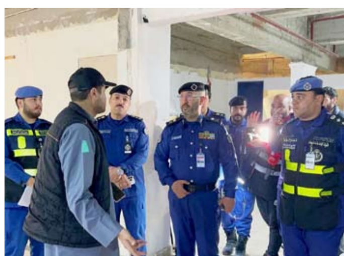
رئيس قوة الإطفاء ومدير العلاقات العامة خلال الحملة

الصناعية يشارك فيها 45 رجل إطفاء يتوزعون على المنطقة بأكملها لرصد المخالفات وغلق الأماكن الخطرة بكامل القسائم والمخازن والمحلات التابعة للمنطقة. وأوضح الرومي أن الحملات مستمرة يوماً على كل مناطق البلاد لرصد المخالفات والتأكد من استيفائها معايير السلامة والحريق ومنها التخزين الخاطي