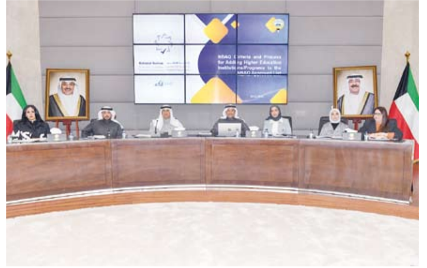
تقديم العرض المرئي برئاسة الجهاز الوطني وحضور وزارة الخارجية

ويأتي هذا العرض المرئي بعد الاجتماع التنسيقية المتعقد بين الجهاز ووزارة الخارجية في نوفمبر الماضي.