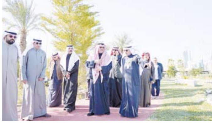
الشيخ عبدالله سالم العلي الصباح خلال الجولة التفقدية

إنجازات المرحلة الثالثة للمشروع، وذكر المحافظ أن حديقة الشهيد تضاهي أحدث المشاريع الترفيهية في الشرق الأوسط، كون الحديقة باتت من معالم الكويت الحضارية، وصرحاً سياحياً وترفيهياً شاملاً، ورمزاً وطنياً يستذكر تخليد الشهداء الأبرار. إضافة إلى كون هذا المشروع التنموي يحمل الكثير من المعالم التاريخية والتراثية، فضلاً عن دوره السياحي والترفيهي.