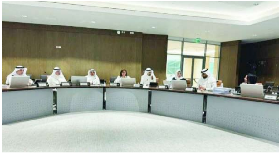
جانب من اجتماع اللجنة الفنية