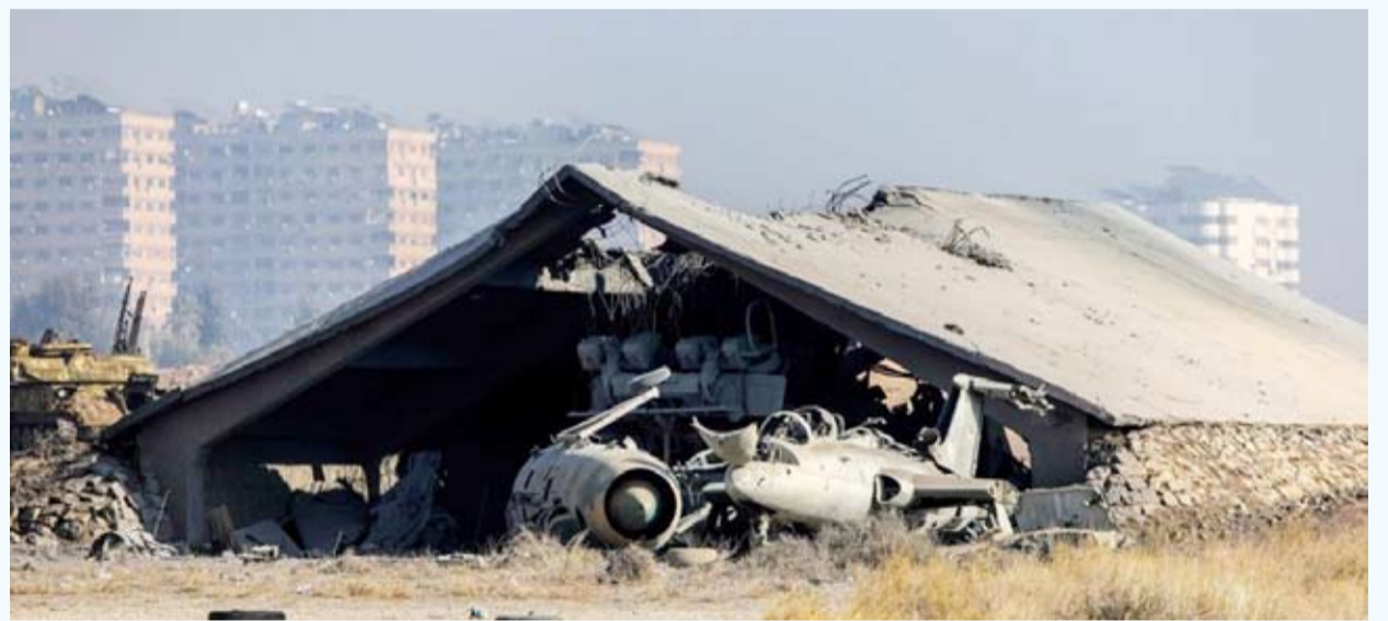
جيش الاحتلال يدمر طائرات وسفنا حربية سورية

سليم قريبا نشر قائمة أولى بأسماء كبار المتورطين في تعذيب الشعب السوري لملاحقتهم ومحاسبتهم، لافتاً إلى تقديم مكافآت لمن يدلي بمعلومات عنهم. بدوره قال الرئيس التركي رجب طيب أردوغان، من الآن فصاعدا لا يمكن أن نسمح بتقسيم سورية مجددا، سنقف في وجه أي اعتداء على حرية الشعب السوري وسلامة