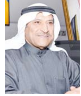
د. جاسم العلي

أكد مدير عام الجهاز الوطني للاعتماد الأكاديمي وضمان جودة التعليم، الدكتور جاسم العلي، أمس، أن رفع مستوى جودة التعليم في مؤسسات التعليم العالي داخل دولة الكويت يعد من الأهداف الرئيسية للجهاز. جاء ذلك في تصريح خاص أدلى به العلي لـ (كويتنا) بعد ترأسه إلى جانب مساعد وزير الخارجية لشؤون أوروبا والسفير صادق معرفي عرساً مرثياً قدمه الجهاز أمام عدد من سفراء الدول الأوروبية لدى دولة الكويت لتعريفهم بعمل الجهاز والمعايير المتبعة لتحديد البرامج العلمية ومؤسسات