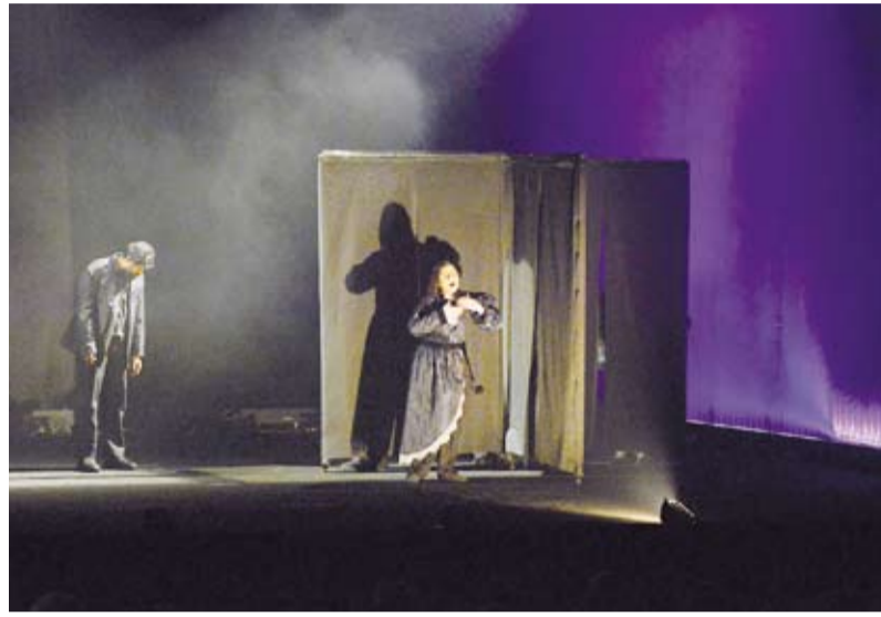
الفناتة سلمى شريف خلال العرض المسرحي