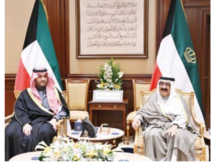
سمو أمير البلاد يستقبل الأمير تركي بن محمد

استقبل صاحب السمو أمير البلاد الشيخ مشعل الأحمد، بقصر بيان، صباح أمس، صاحب السمو الملكي الأمير تركي بن محمد وزير الدولة عضو مجلس الوزراء بالمملكة العربية السعودية الشقيقة وذلك بمناسبة زيارته للبلاد. حيث نقل لسموه تحيات وتقدير أخيه خادم الحرمين الشريفين الملك سلمان بن عبدالعزيز ملك المملكة العربية السعودية الشقيقة وأخيه صاحب السمو الملكي الأمير محمد بن سلمان ولي العهد رئيس مجلس الوزراء وتمنياتها لهما بموفور الصحة ودوام العافية ولشعب دولة الكويت المزيد من الرخاء والثناء. وقد حمله صاحب السمو أمير البلاد تحياته لأخيه خادم الحرمين الشريفين الملك سلمان بن عبدالعزيز ملك المملكة العربية السعودية الشقيقة وأخيه