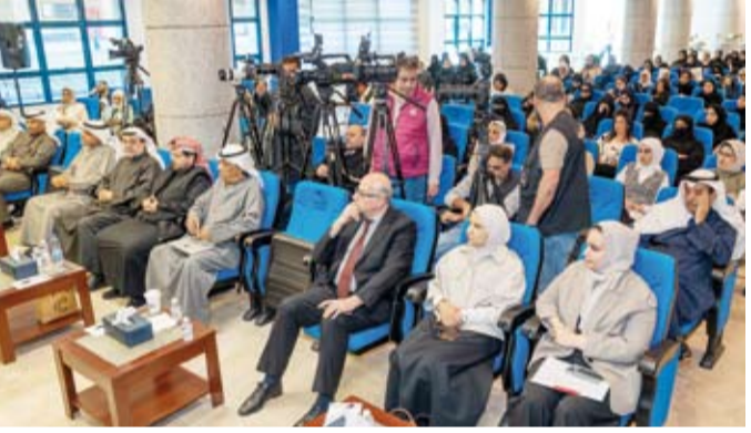
جانب من الحضور في المنتدى