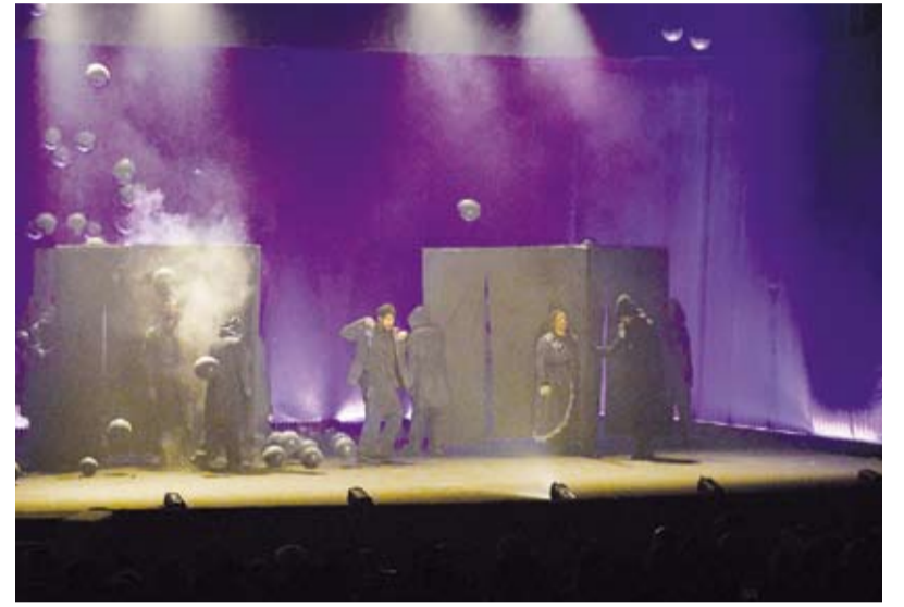
لقطة من ختام المسرحية

ومن كلمات المخرج والمؤلفة تأتي حبكة العرض الذي تدور أحداثه حول طفل يتمنى في كل عيد ميلاد له أن تتحقق أحلامه البسيطة وأن يكون سعيداً بكعكة الزنجبيل والليمون وأن يطفي الشموع مع المدعوين لكن تمر السنوات حتى يكبر دون أي شيء سوى ذكريات الخذلان من قسوة أب حاول أن ينزع الأحلام وذكريات أم حاولت أن تحققها. وتميز العرض بأداء حركي جميل على خشبة