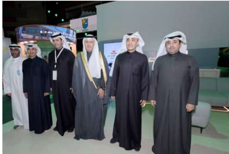
العمر خلال زيارته لجناب بويان

في مجال الذكاء الاصطناعي AI والتحول الرقمي والأمن السيبراني والتكنولوجيا المالية وتكنولوجيا الاتصالات وغيرها من المجالات المساهمة في إعادة تشكيل المستقبل العملي. وقال التوجيهي تعليقا على ذلك "مع الاختتام الناجح لمعرض NEXUS 2024، نفخر أن بويان كان من أوائل المؤسسات الداعمة والمشاركة في هذا الحدث التكنولوجي الأكبر على مستوى الكويت، إيماناً بدور التكنولوجيا وضرورة توظيفها بشكل فعال لتمكين البيئة الرقمية والاستمرار قدماً نحو مسيرة الرقمنة والابتكار. من خلال تقديم حلول تقنية مبتكرة تدعم متطلبات المرحلة المستقبلية وتعزز من مكانة الكويت الريادية بين مصاف الدول الرائدة في مجال التكنولوجيا والابتكار". وأضاف أنه وسط ما أحدثته التكنولوجيا ومستجدات الذكاء الاصطناعي من تغيرات في بيئات ومجالات العمل، استطاع بويان استخدام وسائل التكنولوجيا الحديثة وتقنيات الذكاء الاصطناعي في عالم الصناعة المصرفية، بل وتوجيهها نحو مواجهة التحديات لإعادة تشكيل القدرات الرقمية في العديد من التخصصات مثل معالجة البيانات الضخمة والأمن السيبراني وأمن المعلومات والحوسبة السحابية وغيرها، وهو ما يسهم بصورة واضحة في مستقبل صناعة الخدمات المالية.