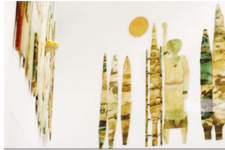
جداريات ضخمة في المتحف

الطبيعة، إذ يتخذ من الأشجار رمزاً يجسد حراك الفلسطينيين الجماعي، وجاء عمل الفنان تيسير بركات (البحث عن الأرواح على شواطئ المتوسط) معتمداً على النار والخشب، بوصفها البدايات الأولى للحياة. أما جدارية (حارسات الأرض) فقد أعادت