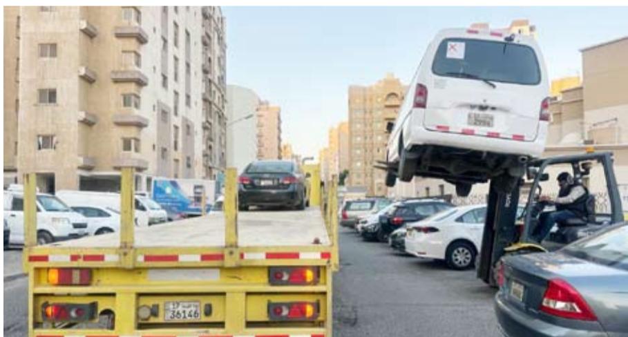
اليات البلدية ترفع سيارات مخالفة

أعلنت إدارة العلاقات العامة في بلدية الكويت موافقة إدارات النظافة العامة واشغالات الطرق لتكثيف جولاتها التففتيشية لرصد وإزالة مخالفات لاحتى النظافة واشغالات الطرق البلدية في كافة المحافظات وتفعيل الدور الرقابي للأجهزة الرقابية لتطبيق قوانين البلدية. وأوضحت أن إدارة النظافة العامة واشغالات الطرق بفرع بلدية محافظة حولي يعمل جولات واسعة على المناطق السكنية وذلك لرفع مستوى النظافة وكل ما يعمل على إعاقة الطريق وينهوه المنظر العام ومنع رمي النفايات خارج الحاويات، وأكدت أن الجولات أسفرت عن رفع 287 سيارة مهملّة وتحرير 243 مخالفة وتوجيه 2255 إنذار وتعهد خلال شهر نوفمبر. وأشارت إلى تواصل الجولات الميدانية من قبل الفريق الرقابي بإدارة النظافة العامة واشغالات الطرق، مبيناً في هذا الخصوص عدم تعاون الفريق الرقابي في اتخاذ كافة الإجراءات القانونية حيال المخالفين للاتحة النظافة العامة واشغالات الطرق.