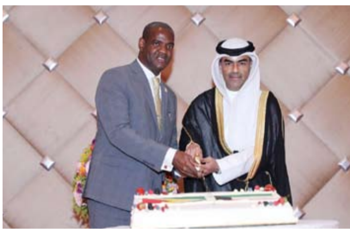
السفير تروي تورينغتون يكرم مساعد وزير الخارجية لشؤون الأمريكتين عبدالعزيز القفطان

وفي ختام كلمته، أشاد بالجهود التي بذلتها الشخصيات والمؤسسات التي ساهمت على مدى العقود الماضية جعلتها تحافظ لعدة سنوات على صفة أسرع اقتصاد نمواً في العالم، مشيراً إلى أن القيادة التي يتولاها الرئيس الدكتور محمد عرفان على أسهمت في