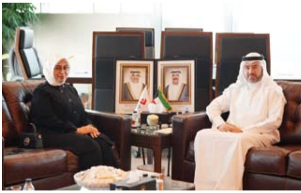
الشيخ المهندس حمود المبارك مع سفيرة تركيا طوبى نور سونمز

وفق أفضل الممارسات والمعايير الدولية. وأفادت بأن الجانبين، أكد أهمية مواصلة التعاون والتنسيق المشترك