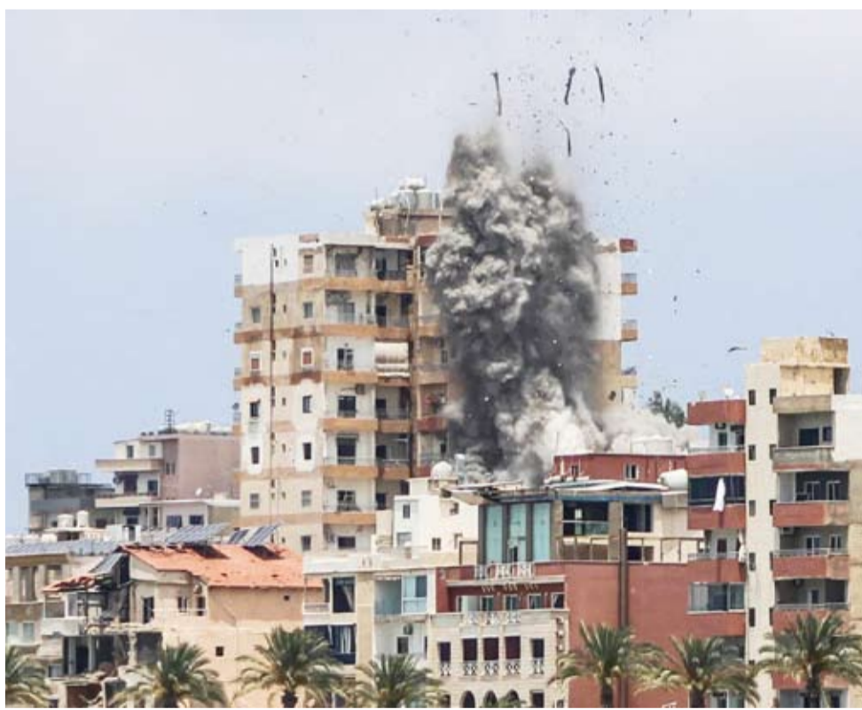
غارة على مدينة صور

وتوسعت رقعة النار الإسرائيلية في جنوب لبنان لطال مدينة صور، بعدما وجه الجيش الإسرائيلي إنذاراً غير مسبوق بالإخلاء شمل المدينة ومحيطها، في خطوة عكست انتقال التصعيد إلى مستوى يهدد بتفريغ المدن الجنوبية من سكانها. وتزامن الإنذار مع غارات مكثفة أوقعت ثمانية قتلى و32 جريحاً.