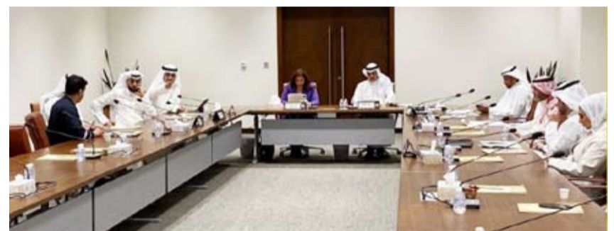
جانب من اجتماع اللجنة