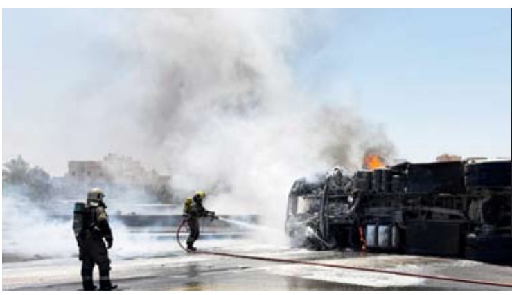
أخمد حريق الصهريج

تعاملت فرقة إطفاء مركز المنقف ظهر امس الأربعاء مع حادث تصادم بين مركبتين وانقلاب وحريق صهريج وقود على طريق الفحيحيل السريع، وقد أسفر الحادث عن حالة وفاة، وتم تسليم الموقع إلى الجهات المختصة.