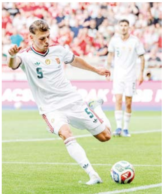
فوز مطمئن للمجر قبل المونديال

مجموعة تضم سلوفاكيا وجزر الشمالية. أما كازاخستان فيلعب في فارو ومولدوفا.