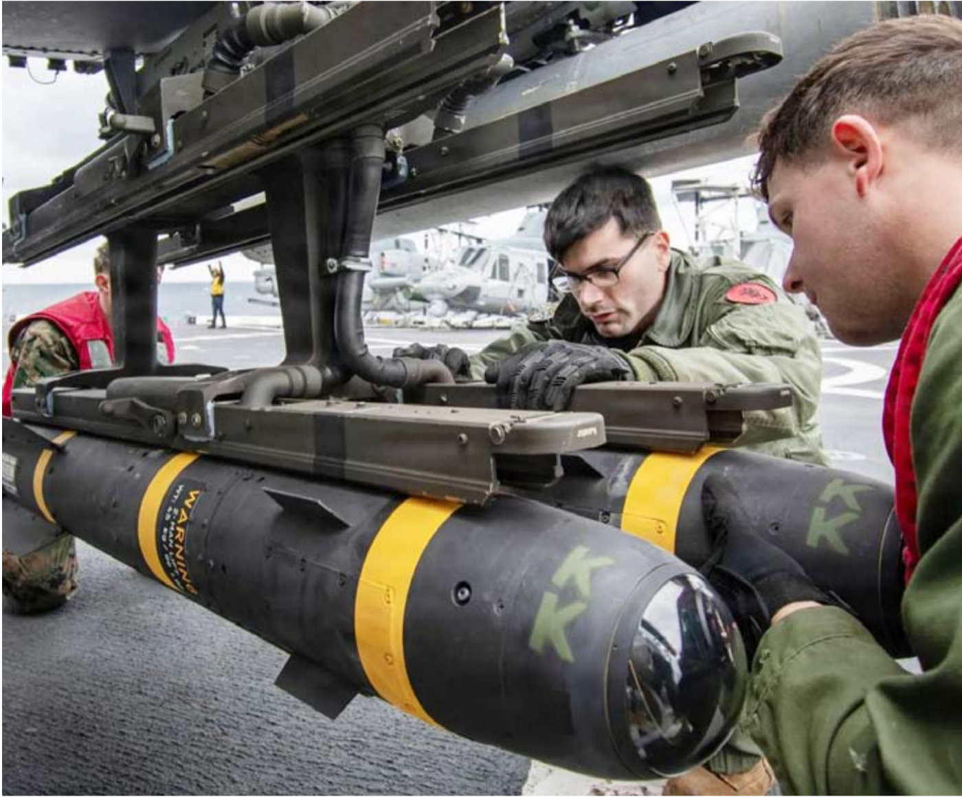
تثبيت صواريخ على مروحية «ايه إتش - 1 زد فايبر»

«لا يمكن أن نتقدم» في ظل الانتهاكات المتكررة لوقف إطلاق النار، مضيفاً: «بعد ما حدث خلال الليل، نحتاج إلى إعادة تقييم المسار الدبلوماسي مع واشنطن... أي عملية دبلوماسية تتطلب حداً أدنى من الاستقرار». واتهم بقائي و«اشطن» بالحاق الضرر بالعملية الدبلوماسية عبر «وسائل متناقضة» وتغييرات متكررة في المواقف والمطالب، فضلاً عن «الانتهاكات المتكررة لوقف إطلاق النار». وقال، في مقطع فيديو نقلته وسائل إعلام إيرانية: «لأسف، تلحق الولايات المتحدة ضرراً بهذه العملية الدبلوماسية من خلال رسائلها المتناقضة وتغييراتها المتكررة في المواقف والمطالب، والأسوأ من ذلك كله، من خلال انتهاكاتها المتكررة لوقف إطلاق النار». وأضاف أن إسرائيل تضرب بالمسار نفسه من خلال «الانتهاكات المتكررة لوقف إطلاق النار في لبنان». وتابع بقائي: «أي عملية دبلوماسية تتضرر باستخدام القوة واللجوء إلى أعمال غير قانونية على الأرض».