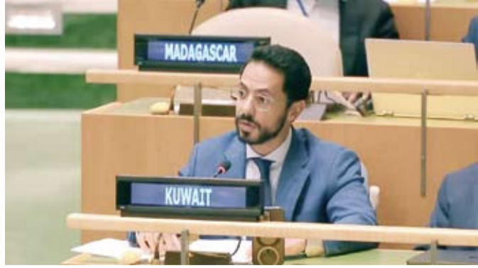
السكرتير الأول بوفد الكويت الدائم لدى الأمم المتحدة فهد العجمي

وجدد التأكيد أيضاً على أن القانون الوطني يكرس حق ذوي الهمم في العمل اللائق وفي الحصول على الترتيبات التيسيرية المعقولة التي تمكنهم من أداء أدوارهم على قدم المساواة مع الآخرين. وأعرب عن إيمان البلاد بأن المشاركة الفاعلة للأشخاص ذوي الإعاقة في صنع القرار تمثل ركناً أساسياً لتحقيق الإدماج والمساواة، مستشهداً بحرص الكويت على إشراك الفئة المعنية