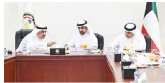
جانب من اجتماع اللجنة بحضور محافظ الجهراء حمد الحبشي.

أرض في مدينة المطلاع السكنية لإنشاء مدرسة لذوي الاحتياجات الخاصة. وأكدت اللجنة استمرار متابعة الموضوعات ذات الصلة بالتنسيق مع الجهات المعنية، وبما يسهم في تحسين مستوى الخدمات المقدمة لأهالي محافظة الجهراء.