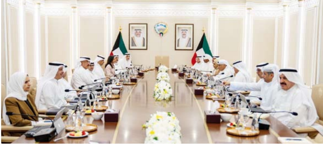
اليوسف يترأس اجتماع مجلس الوزراء

عقد مجلس الوزراء اجتماعاً أمس برئاسة رئيس مجلس الوزراء بالإئابة ووزير الداخلية الشيخ فهد اليوسف وبعد الاجتماع صرح نائب رئيس مجلس الوزراء ووزير الدولة لشؤون مجلس الوزراء شريدة المعشري بما يلي: استهل مجلس الوزراء اجتماعه بتقديم خالص التهاني والتبريكات إلى صاحب السمو أمير البلاد الشيخ مشعل الأحمد وسمو ولي العهد الشيخ صباح الخالد وإلى الشعب الكويتي الكريم والمقيمين الكرام بمناسبة قرب حلول رأس السنة الهجرية الجديدة 1448 هجرية وسائلاً المولى عز وجل أن يعيد هذه المناسبة على دولة الكويت والأمم العربية والإسلامية بالخير واليمن والبركات.