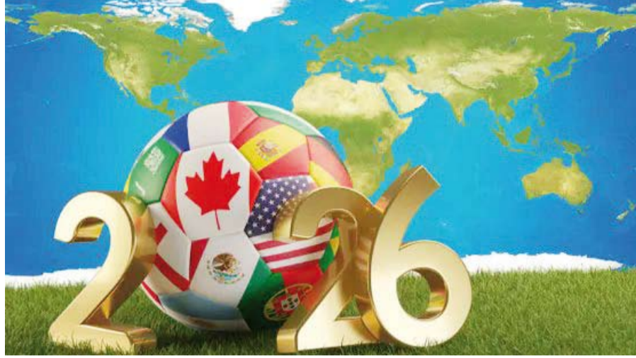
انطلاق النسخة الأكبر في تاريخ كأس العالم

التاريخي للبطولة يتصدر المنتخب البرازيلي قائمة المنتخبات الأكثر تتويجا بكأس العالم برصيد خمسة ألقاب يليه المنتخبان الألماني والإيطالي باربعة ألقاب لكل منهما ثم الأرجنتين بثلاثة ألقاب فيما أحرزت فرنسا والأوروغواي اللقب مرتين لكل منهما. ويحمل المنتخب الأرجنتيني لقب النسخة الأخيرة التي أقيمت في دولة قطر عام 2022 بعد فوزه في المباراة النهائية على المنتخب الفرنسي بركلات الترجيح.