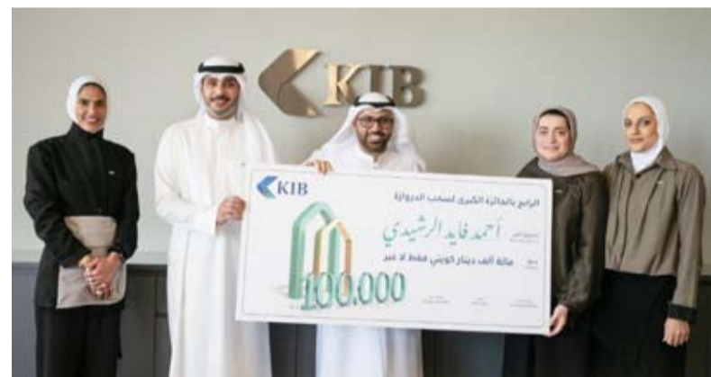
فريق البنك يسلم الفائز شيك الجائزة