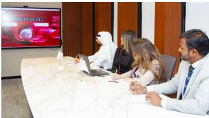
جانب من فعاليات السحب تحت إشراف مكاتب التدقيق

3.3 ملايين دينار كويتي، تضمنت الإعلان عن مليونيرين جديدين لينضموا إلى قائمة المليونيرات التي يواصل البنك صنعها منذ عام 1998. على صعيد متصل، يترقب عملاء حساب «مليونير الدانة» الإعلان عن الفائز في سحب ال 1.000.000 دينار في 8 يوليو المقبل، بالإضافة إلى إعلان 10 فائزين في السحب الشهري عن شهر يونيو بجائزة ألف دينار لكل منهم. علماً أن آخر موعد للإيداع والتأهل للسحب بقيمة 200.000 دينار كويتي هو 30 يونيو 2026. ويطلق بنك الخليج نظاماً جديداً لسحوبات «مليونير الدانة» اعتباراً من سبتمبر المقبل، حيث ارتفعت القيمة الإجمالية للجوائز إلى 3.500.000 دينار، وتشمل الجائزة الكبرى بقيمة 1.500.000 دينار، وجائزة بقيمة 1.000.000 دينار، إضافة إلى خمسة فائزين بجائزة قدرها 200.000 دينار لكل منهم، في خمس سحوبات مختلفة على مدار العام.