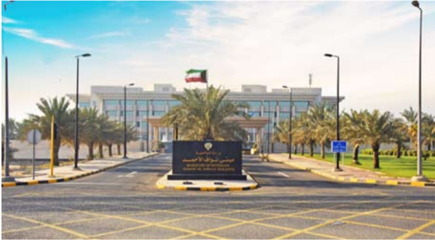
القانون منح مهلة لا تتجاوز ستة أشهر لمالكي المنشآت البحرية والوحدات العائمة

تفاصيل القانون والاشتراطات الفنية الجديدة عبر سلسلة من المنشورات التوعوية في كافة وسائل الإعلام المرئية والمسموعة والمقروءة وحسابات وزارة الداخلية على مواقع التواصل الاجتماعي. وشددت على أنه سيتم تطبيق القانون على المخالفين دون استثناء وفقاً لما نصت عليه التعديلات الجديدة وبما يضمن تحقيق مبدأ العدالة والمساواة القانونية مع التأكيد على احترام حقوق جميع أفراد المجتمع. وناشدت جميع مرتادي البحر من مواطنين ومقيمين بضرورة الالتزام بأحكام القانون البحري الجديد والتقيّد بالتعليمات والإرشادات الصادرة من رجال الأمن حفاظاً على الأرواح والممتلكات وتعزيزاً للأمن البحري.