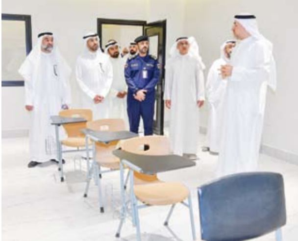
الجولة التقنيّة للصفوف الدراسية للنزلاء