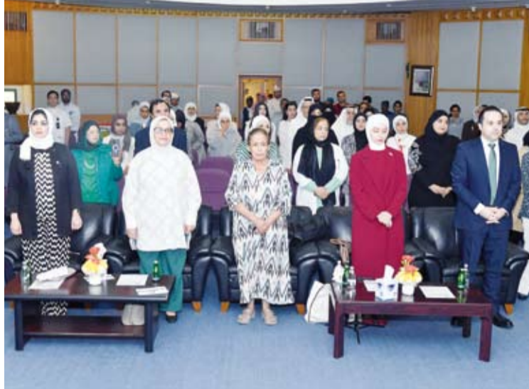
د. عبدالله السند يتقدم الحضور

وذكر السند أن نحو 264 مليون شخص حول العالم يعانون من القلق منوها بالتطور المذهل الذي شهده علاجات تلك الأمراض على مدى السنوات الماضية وسط زيادة مستوى الوعي لدى الأفراد والمجتمعات. وأشار إلى دور مركز الكويت للصحة النفسية ليس على مستوى العلاج فقط بل أيضاً على المستوى الوقائي مستطرداً أن المنظومة الصحية لا تنتظر حدوث المشكلة حتى تعالجها منوها بوجود عيادة للصحة النفسية في كل مستشفى من المستشفيات العامة وعيادة للصحة النفسية الأولية في 70 مركزاً من مراكز الرعاية الصحية الأولية من أصل 120 مركزاً.