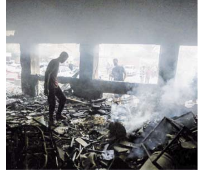
آثار إحدى مجازر الاحتلال في دير البلج

فيما أعلنت سلطات الاحتلال الإسرائيلي، أمس، مصادرة الأرض المقام عليها مقر وكالة الأمم المتحدة لغوث وتشغيل اللاجئين الفلسطينيين «الأونروا» في حي الشيخ جراح بالقدس الشرقية المحتلة، وتحويلها إلى بؤرة استيطانية تضم 1440 وحدة سكنية. فقد أعلنت السلطات الصحية في غزة، أمس، استشهاد 83 فلسطينياً وإصابة 220 آخرين جراء خمس مجازر ارتكبتها قوات الاحتلال الإسرائيلي في قطاع غزة خلال الـ 24 ساعة قبل الماضية. وذكرت السلطات في تقريرها الإحصائي اليومي أن الاحتلال الإسرائيلي ارتكب خمس مجازر ضد العائلات في قطاع غزة وصل منها للمستشفيات 83 شهيداً و220 إصابة لترتفع حصيلة عدوان الاحتلال إلى 42093 شهيداً و97940 إصابة منذ السابع من أكتوبر العام الماضي. وكان من بين أعنف الاستهدافات قيام جيش الاحتلال باستهداف مدرسة تؤولي نازحين في (دير البلج) وسط القطاع أدت إلى استشهاد 28 فلسطينياً من النازحين الأطفال والنساء والشيوخ من بين مجمل أعداد الشهداء.