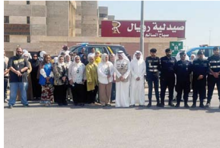
مسؤولي هيئة الغذاء والداخلية أثناء الإخلاء الوهمي

جميع المواد الغذائية والإستهلاكية صالحة ومطابقة للشروط والمواصفات، لافتاً إلى أن العقوبات رادعة لأصحاب المنشآت الغذائية الذين يتداولون مواد غذائية غير صالحة للاستهلاك الآدمي، وهناك غرامات تتراوح بين 50 إلى 100 ألف دينار لتداول المواد غير الصالحة للاستهلاك الآدمي، إضافة إلى محاضر عدم وجود بطاقة بيانات وفتح وإدارة منشأة قبل الحصول على ترخيص صحي، وهي مخالفات غير قابلة للصالح والعملين في الهيئة من مفتشين ومفتشات سنوات، إضافة إلى عدم توافر الاشتراطات الصحية والفنية وكذلك وجود مبيد داخل المنشأة، وتم تحرير محضر حيث أتلقت