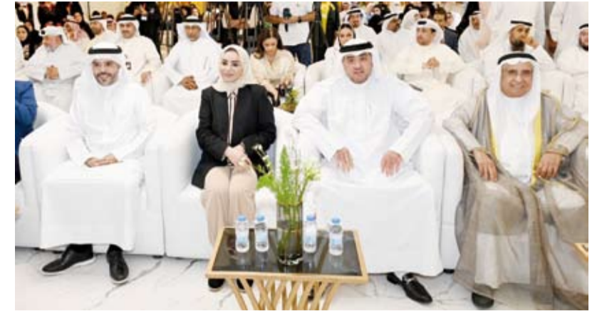
د. أمثال الحويلة خلال افتتاح ديوانية الفردوس للمسنين وإطلاق مبادرة (لمة الأهل)

أطلقت وزيرة الشؤون الاجتماعية وشؤون الأسرة والطفولة، الدكتورة أمثال الحويلة، أمس، مبادرة (لمة الأهل) بهدف تعزيز التواصل والتلاحم بين الأجيال من خلال إقامة روابط إنسانية دائمة بين كبار السن في دور الرعاية والأطفال في دور الأيتام.