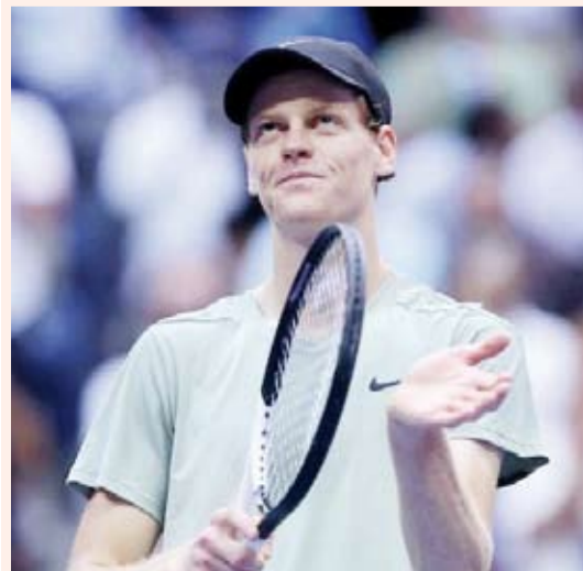
النمساوي دافيد الألبا

تأهل الإيطالي يانك سينر المصنف الأول عالمياً إلى الدور قبل النهائي من بطولة شنغهاي للتنس فئة الألف نقطة، بعد فوزه على الروسي دانييل ميدفيديف المصنف الخامس عالمياً، بمجموعتين دون رد بواقع (6 / 1) و(6 / 4)، في إطار مباريات الدور ربع النهائي. وكان سينر تغلب على الياباني تارو دانييل والأرجنتيني توماس مارتين إتشيفيري والأمريكي بن شيلتون، قبل أن يفوز على ميدفيديف، في طريقه للدور قبل النهائي لبطولة شنغهاي التي يبلغ مجموع جوائزها حوالي تسعة ملايين دولار.