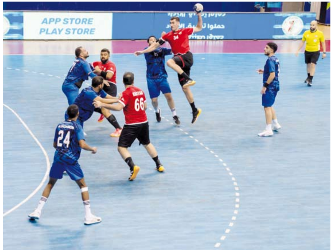
جانب من المنافسات الدوري المحلي لكرة اليد

وواصل (الفحيحيل) أفضليته في الشوط الثاني ليحقق أول فوز له بالبطولة موسم (2024 - 2025). وتمكن فريق نادي خيطان من تحقيق أول فوز له في هذا الموسم بالتغلب على (التضامن) بنتيجة (33 - 22).