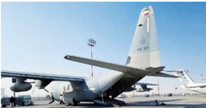
الطائرة الإغاثية الـ 17 من الجسر الجوي الكويتي