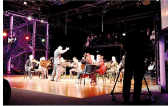
حفل مجموعة الأحمدي الموسيقية

المؤلفين الموسيقيين في العصر الرومانسي ويمزج في أعماله بين الموسيقى الكلاسيكية الأوروبية والعناصر الشعبية التشيكية ومن أشهر أعماله وأكثرها أداء على مستوى العالم السيمفونية التاسعة (من العالم الجديد).