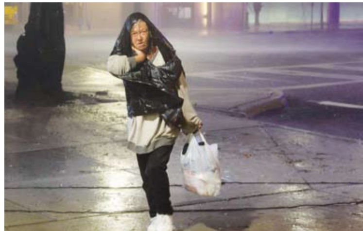
امرأة تسير أثناء وصول «ميلتون»

بدا الإعصار «ميلتون» الذي يُعتبر «خطراً للغاية» باجتياح سواحل ولاية فلوريدا في جنوب الولايات المتحدة، مصحوباً برياح عاتية وأمطار غزيرة وفيضانات فيضائية، لتبدأ بذلك ليلة طويلة وبالغة القسوة على سكان منطقة ضربها قبل أسبوعين فقط إعصار مدمر آخر، وفقاً لوكالة الصحافة الفرنسية.