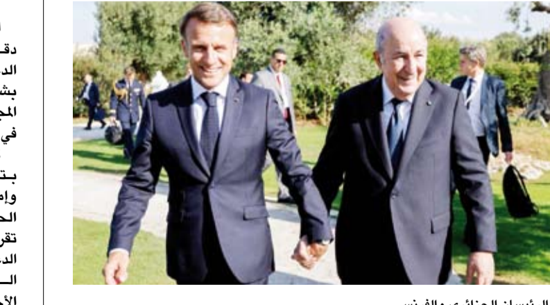
الرئيسان الجزائري والفرنسي

هيمة إمدادات البحر الأسود بقيادة القمح الروسي على سوق الاستيراد الضخمة في البلاد. وتعد الجزائر من أكبر مستوردي القمح في العالم، وكانت فرنسا لسنوات طويلة أكبر مورد لها بفارق كبير. واثار قرار فرنسا في يوليو الماضي، دعم مخطط الحكم الذاتي لمنطقة الصحراء في إطار السيادة المغربية غضب الجزائر، التي تدعم مساعي جبهة «البوليساريو» لإقامة دولة مستقلة هناك.