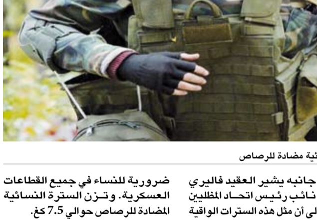
سترة نسائية مضادة للرصاص

ومن جانبه يشير العقيد فاليري يوريف نائب رئيس اتحاد المظللين الروس، إلى أن مثل هذه السترات الواقية