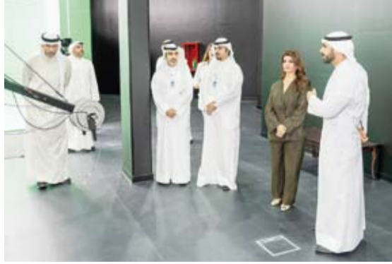
جولة في مؤسسة الإنتاج البرامجي المشترك لمجلس التعاون