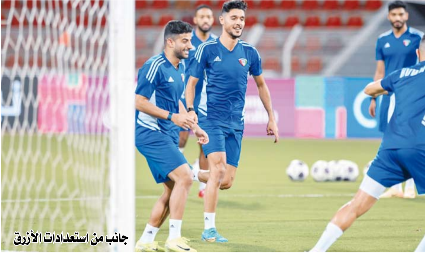
جانب من استعدادات الأزرق