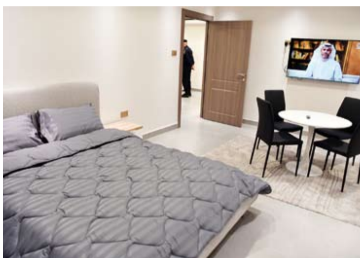
جانب من الغرف المؤنّفة لتمكين الأسر من زيارة النزلاء