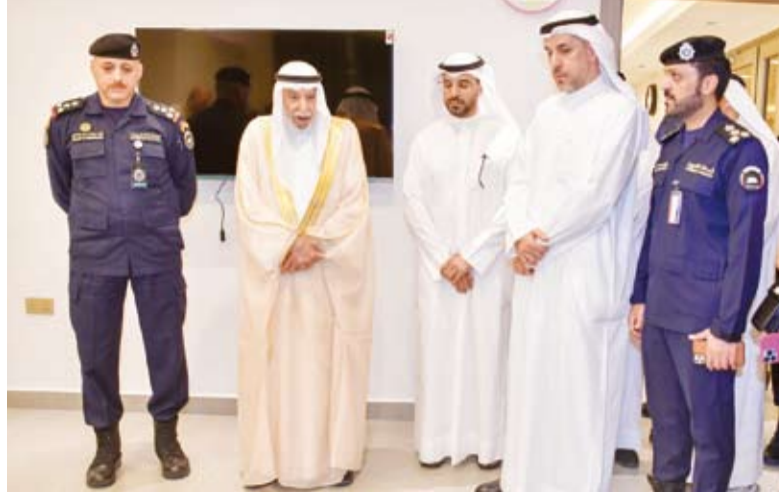
المسؤولون بوزارة الداخلية ورئيس (الإصلاح الاجتماعي) ورئيس (اتحاد الجمعيات والمبرات) خلال الافتتاح