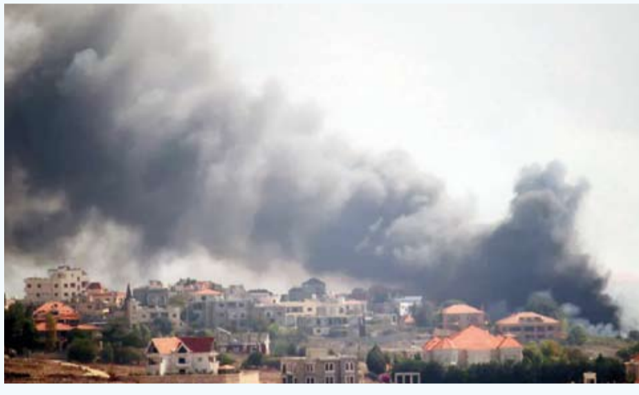
إحدى الغارات على منطقة لبنانية

وقال ميقاتي وفق بيان مكتبته: لقد عبرنا مجدداً خلال الاتصالات الدبلوماسية عن استعدادنا لتطبيق القرار 1701 شرط التزام إسرائيل بكل درجاته. وشدد على أولوية وقف العدوان اتصالات تجري بين الولايات المتحدة وفرنسا التي طلبت انعقاد مجلس الأمن، بهدف إحياء الإعلان الخاص بوقف إطلاق النار لفترة محددة، لكي يصار إلى استئناف البحث في الحلول السياسية. اتصالات تجري بين الولايات المتحدة وفرنسا التي طلبت انعقاد مجلس الأمن، بهدف إحياء الإعلان الخاص بوقف إطلاق النار لفترة محددة، لكي يصار إلى استئناف البحث في الحلول السياسية.