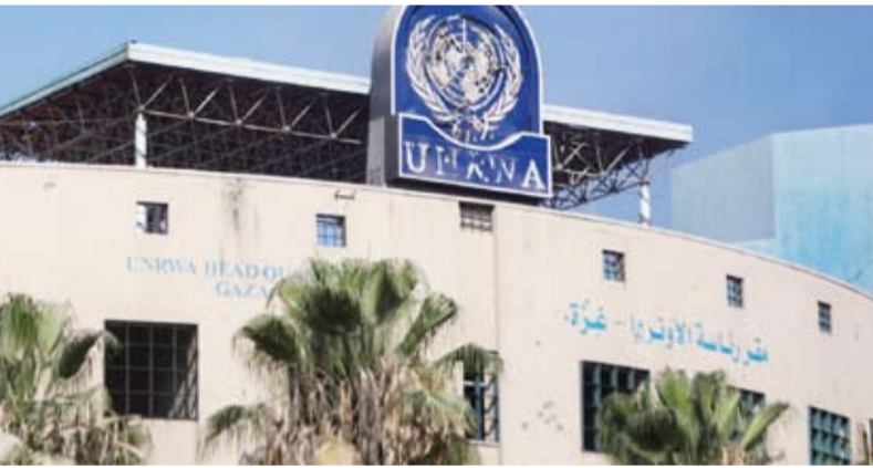
لافتة متضررة جراء قصف مقر «الأونروا»

وأكد أنه «إذا تم إقرار مشروع القانونين، فإن العواقب ستكون وخيمة. من الناحية العملية، قد تتفكك الاستجابة الإنسانية بأكملها (...) التي تعتمد على البنية التحتية للأونروا في غزة». وأشار الأمين العام للأمم المتحدة أنطونيو غوتيريش، إلى أنه يبحث برسالة إلى رئيس الوزراء الإسرائيلي بنيامين نتانياهو يحذر فيها من أن هذا التشريع «قد يمنع (الأونروا) من مواصلة عملها الأساسي في الأراضي الفلسطينية المحتلة».