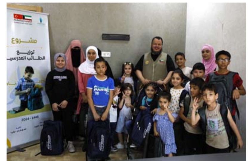
توزيع الحقايب المدرسية للايتام

وبيّن الشقراء أن أولويتنا كفالة الأيتام في غزة وأيتام اللاجئين السوريين والأيتام المتواجدين في اليمن وبنجلاديش والهند وتبلغ قيمة الكفالة الشهرية لليتيم 15 دينار كويتي، ومن خلال هذا المبلغ نوفر لليتيم أبسط مقومات العيش الكريم. مستشهداً بحديث النبي صل الله عليه وسلم "أنا وكافل اليتيم في الجنة كهاتين" وحث الشقراء