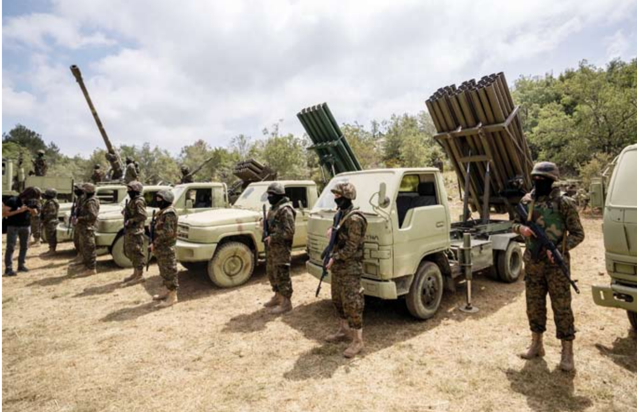
عناصر من حزب الله

ويعد الخبير العسكري والاستراتيجي العميد حسن جوني، أنه «لا يمكن الحديث عن انتهاج الحزب استراتيجية جديدة»، لافتاً إلى أننا «في مرحلة جديدة من استراتيجية الرهانة لا يفترض أن تكون مرحلة إعداد استراتيجيات، وإنما مرحلة تطبيق الخطط وضعت سابقاً تبعاً لمتطلبات الميدان». ويشير جوني، في تصريح ووفقاً لـ«الشرق الأوسط»، إلى «أننا بنتنا في مرحلة التصعيد في استخدام الصواريخ واختيار الأهداف باعتبار