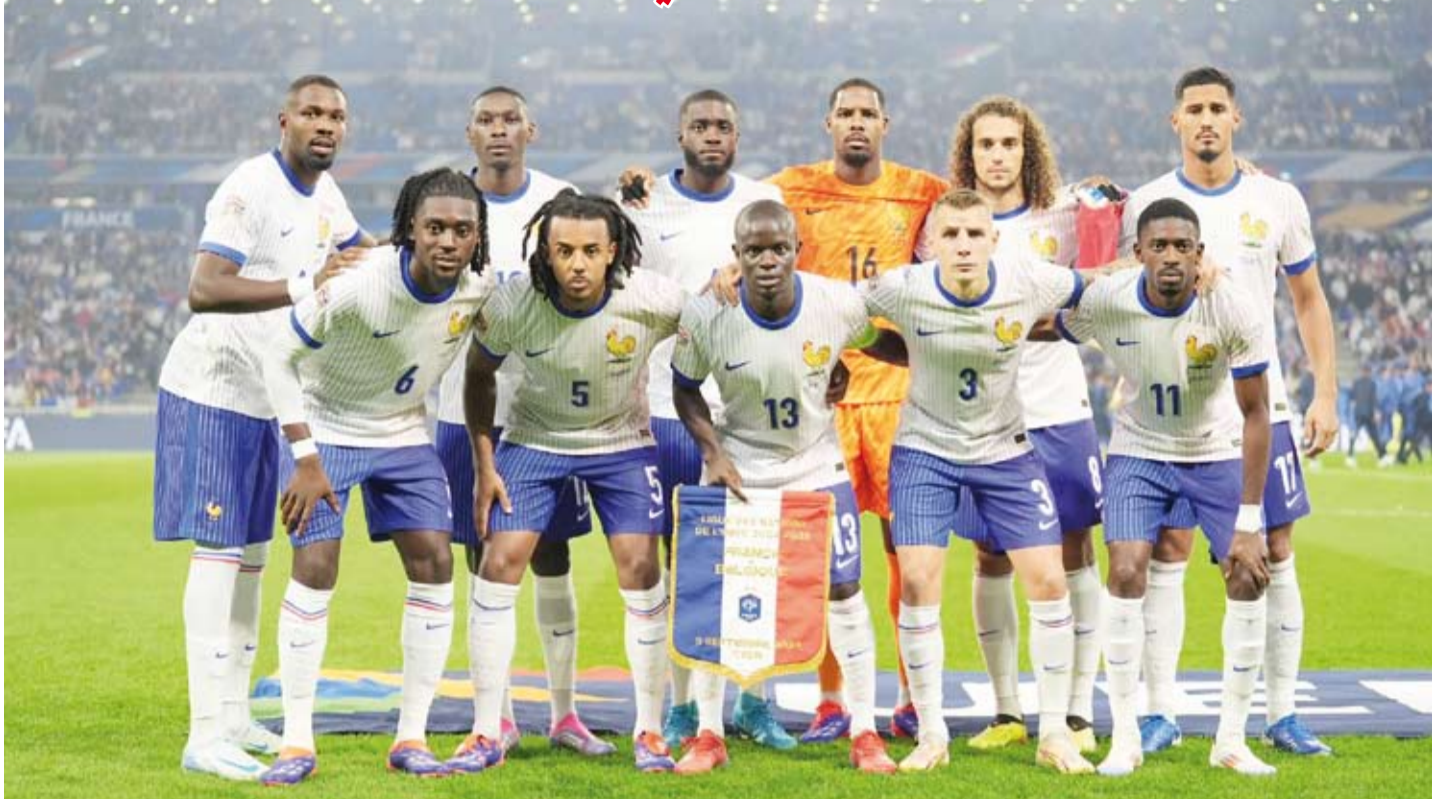
الديوك الفرنسية الأعلى عالمياً

يوروجوبس التقرير الذي نشره موقع "فرانسفير ماركيت" العالمي المتخصص في أسعار والقيمة التسويقية للاعبين. ويتواجد منتخب فرنسا في المركز الثاني بقائمة الأعلى من ناحية القيمة التسويقية التي تصل إلى 1.04 مليار يورو، فيما يحتل المنتخب البرتغالي المركز الثالث بقائمة 992 مليون يورو.