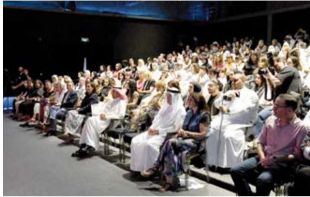
جانب من حضور الحفل