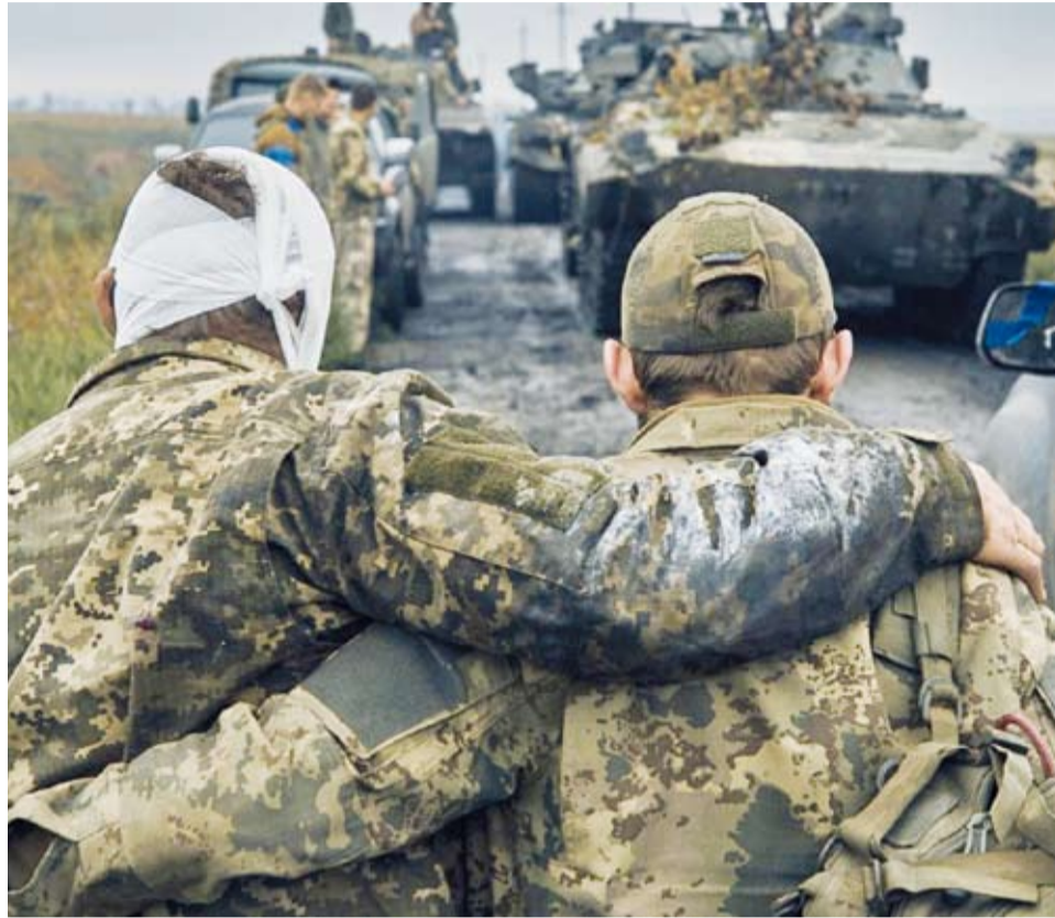
عنصر من الجيش الأوكراني

أعلن الجيش الأوكراني أنه دمر مستودعاً في جنوب روسيا يضم حوالي 400 طائرة مسيرة مفعخة إيرانية الصنع من طراز شاهد. وقال الجيش في منشور على تطبيق تلغرام إن قواته "هاجمت مستودعاً لطائرات مسيرة من طراز شاهد بالقرب من أوكتيابرسكي في منطقة كراسنودار الروسية (...). حوالي 400 طائرة مسيرة هجومية كانت مخزنة هناك". وأظهرت مقاطع فيديو انتشرت على مواقع التواصل الاجتماعي ويعتقد أنها التقطت في المنطقة كرة لهب ضخمة تضيء عممة الليل وتليها سلسلة انفجارات. وأضاف الجيش أن "تدمير القاعدة المخصصة لتخزين مسيرات شاهد سيقلل بشكل كبير قدرة المحتل الروسي على ترويع المدنيين في المدن والقرى الأوكرانية". وتقع منطقة كراسنودار في شرق شبه جزيرة الأوكراينية المطلّة على البحر الأسود والتي ضمتها روسيا إليها في 2014. وتبعد هذه المنطقة حوالي 150 كلم من خطوط الجبهة الامامية الأوكرانية.