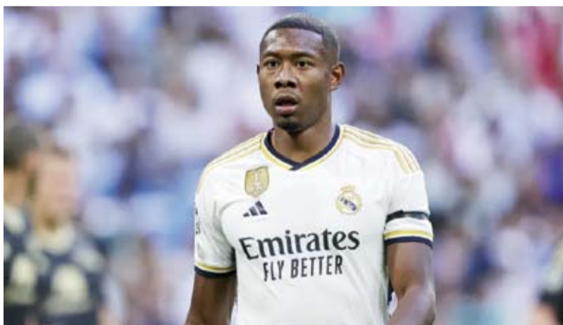
النمساوي دافيد الألبا

ذلك التوقيت، وأضافت الشبكة أن الألبا تغيب عن فريق الريال، نصف الموسم الماضي بالكامل بالإضافة إلى عدم المشاركة في اليورو مع منتخب النمسا، بسبب الإصابة التي تعرض لها أمام فياريال. وأكدت الشبكة أن خطة التأهيل الحالية تضمن للنمساوي دافيد الألبا العودة للمشاركة مع ريال مدريد في شهر يناير العام المقبل، وهو ما يعد صدمة دفاعية جديدة للمدرب الإيطالي كارلو أنشيلوتي. وبهذا، ستصل مدة غياب النمساوي دافيد الألبا عن فريق ريال مدريد بسبب الإصابة، إلى 13 شهراً بما يعادل أكثر من ستة. ووصفت الشبكة أن إصابة المدافع النمساوي دافيد الألبا من الإصابات الأكثر تعقيداً التي يتعرض لها لاعب كرة القدم.