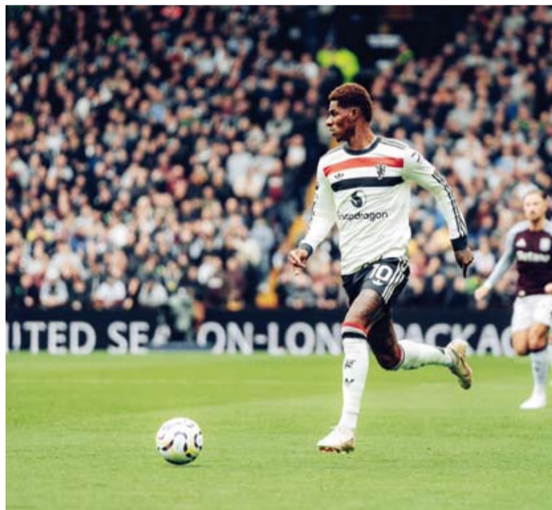
اداء مخيب ليوناييتد مع تين هاج

بشكل خاص أن اجتماع الأسس كان "اجتماعاً روئيتياً ومقرراً منذ فترة طويلة". ويعاني تين هاج، من ضغوط كبيرة بسبب تراجع نتائج الفريق خلال الموسم الحالي، خاصة على مستوى الدوري الإنجليزي الممتاز، حيث يحتل المركز الرابع عشر بالمسابقة برصيد 8 نقاط بعد مرور 7 جولات.