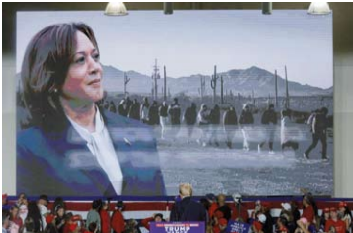
امرأة تسير أثناء وصول «ميلتون»

تتصدر بنسلفانيا قائمة الولايات «المتأرجحة»، التي ستحسم السباق الرئاسي لصالح مرشح الجمهوريين دونالد ترمب، أو الديمقراطي كامالا هاريس، بفضل أصواتها الـ19 في المجمع الانتخابي، وتُعرف بنسلفانيا التي أصبحت ولاية رسمياً في ديسمبر (كانون الأول) 1787، «بـحجر زاوية الاتحاد القيدري»، حيث شهدت كتابة الدستور الأميركي، وأصبحت ثاني ولاية تنضم إلى الاتحاد، ومنذ ذلك الوقت شاركت بنسلفانيا في جميع الانتخابات الرئاسية الـ59 حتى عام 2020.