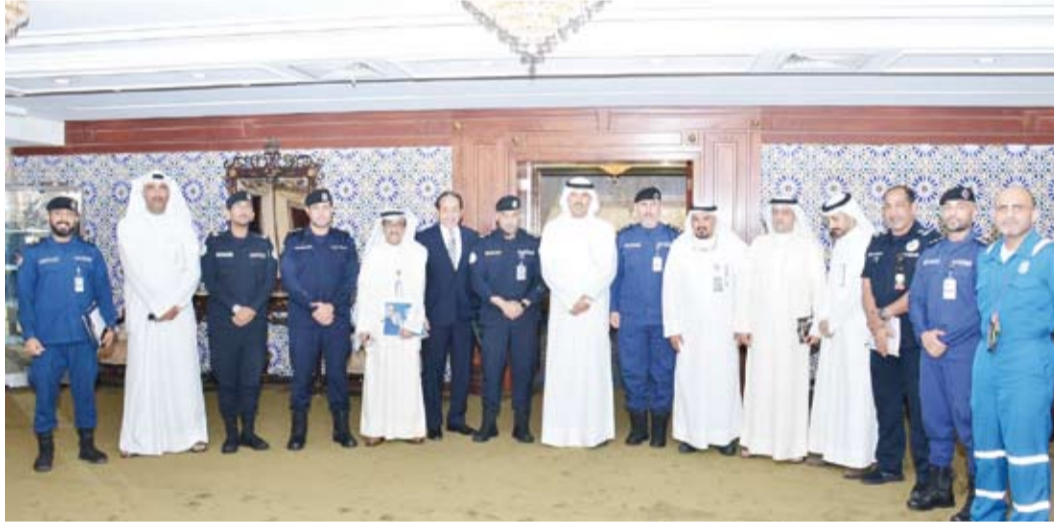
محافظ الأحمدي مجتمعاً مع فريق الطوارئ

أشاد محافظ «الأحمدي» الشيخ حمود جابر الأحمد الصباح، بالمعدين الأصيلين لأهل الكويت الأوفياء وما جلبوا عليه من خصال كريمة وتضامنيهم وترايطهم بدأ واحدة في أوقات الأزمات والظروف الاستثنائية، مؤكداً على ضرورة تضافر الجهود والتعاون والتنسيق المستمر بين مختلف الأجهزة والمؤسسات الرسمية المعنية وتسخير كافة الإمكانيات لخدمة الوطن ووضع الحلول العاجلة لتحقيق الأمن والأمان.