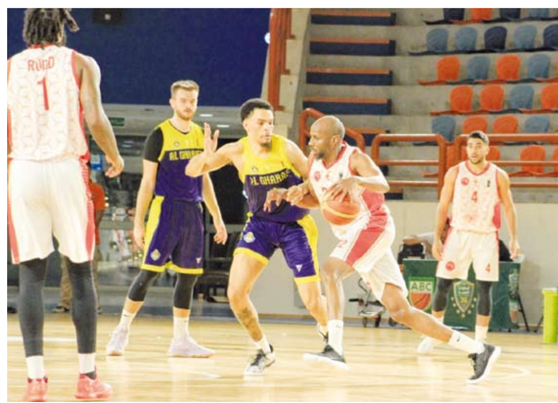
جانب من لقاء العربي القطري مع الغرافة

تاهل فريق العربي إلى نصف نهائي البطولة العربية للأندية لكرة السلة في نسختها السادسة والثلاثين المقامة حالياً بمدينة الإسكندرية المصرية بمشاركة 12 فريقاً.