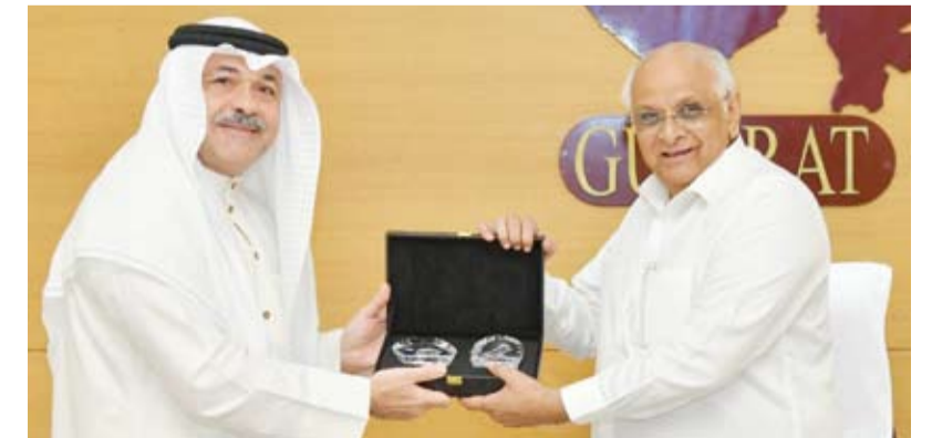
السفير مشعل الشمالي خلال لقائه مع رئيس وزراء ولاية غوجارات

أكد سفير دولة الكويت لدى الهند مشعل الشمالي، أمس، أهمية تنمية العلاقات الثنائية بين الكويت والهند التي أفاق أرحب. جاء ذلك في تصريح أدلى به السفير الشمالي لـ (كونا) عقب لقاء مع رئيس وزراء ولاية (غوجارات) بوبيندر اباي باتيل. وأوضح السفير الشمالي أنه ناقش خلال الاجتماع الذي عقد بمقر إقامة باتيل في (غاندي ناجار) على هامش حضور (مهراجان غوجارات للثقافة والفنون) سبل تعميق العلاقات بين الكويت وولاية (غوجارات) في المجالات ذات الاهتمام المشترك كالامن الغذائي والمائي وقطاع