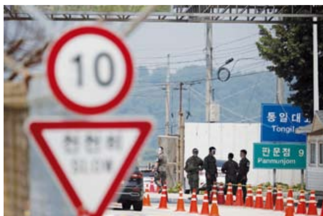
معبّر الحدود بين الجارتين

أدانت وزارة الوحدة الكورية الجنوبية «بشدة» قرار جارتها كوريا الشمالية «إغلاق الحدود مع الجنوب إلى أجل غير مسمى». وأشارت الوزارة في بيان، إلى أن إغلاق الحدود «قرار ضد توحيد» البلدين، وفقاً لوكالة أنباء يونهاب الكورية الجنوبية. ولغقت إلى أن كوريا الشمالية لم تبلغ سيول مسبقاً بقرار إغلاق الحدود. وقالت إن «القرار الذي اتخذته كوريا الشمالية يتعارض مع رغبة شعبنا في الوحدة والأمة الواحدة. ندين هذا القرار بشدة».