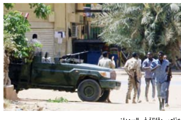
عناصر مقاتلة في السودان

وأضاف البيان: «وإن تنفي جمهورية مصر العربية تلك المزاعم فإنها تدعو المجتمع الدولي للموقف على الأدلة التي تثبت حقيقة ما ذكره قائد ميليشيا الدعم السريع». واختتم البيان بتأكيد حرص مصر الدائم على أمن واستقرار ووحدة السودان، حكومة وشعباً، مشدداً على أن «مصر ستواصل تقديم كل أشكال الدعم الممكنة للأشقاء في السودان