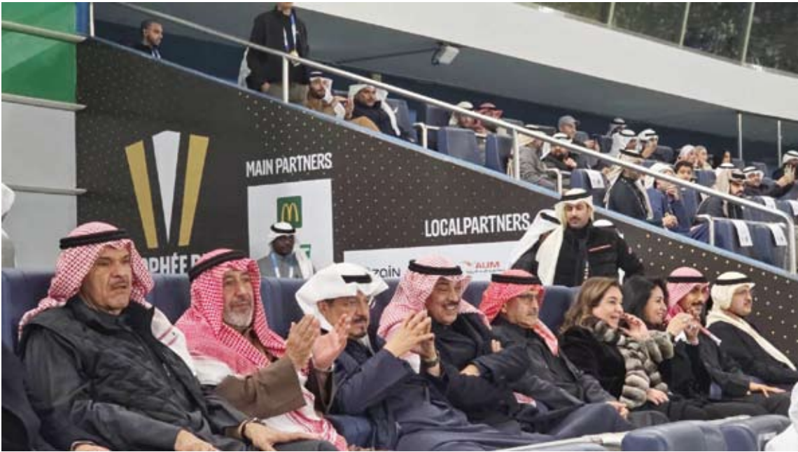
... ويتوسطان كبار الشيوخ والشخصيات