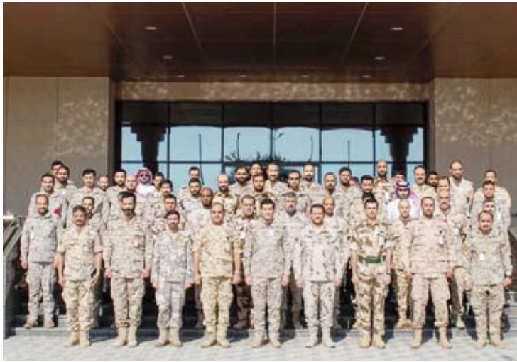
القوات الكويتية المشاركة في التمرين

الدفاعي ورفع القدرة على الاستجابة لمختلف التحديات الإقليمية والدولية. وأضاف أن القوات المشاركة نفذت في ختام التمرين عرضاً جويًا مشتركاً جسد مستوى التناغم والتكامل العملياتي وقدرة القوات على التخطيط والتنفيذ وفق مفاهيم عملياتية موحدة ومعايير مهنية متقدمة