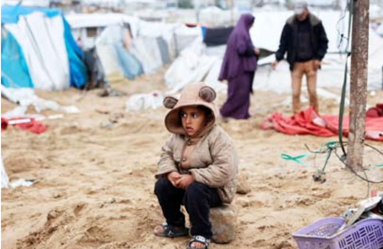
مخيم الشاطئ للاجئين بمدينة غزة

و17104 إصابات، وقتلت القوات الإسرائيلية طفلة بالرصاص في منطقة الفالوجا، غرب مخيم جباليا شمال قطاع غزة، وتبعها قتل شاب بإلقاء قنابل من طائرة مسيرة صغيرة من طراز «كواد كايتر» على مجموعة من الشبان في بلدة بني سهيلا، شرق خان يونس جنوب القطاع، قبل أن يتم إطلاق صاروخ بشكل مفاجئ من مدينة غزة، انفجر على بعد أمتار، ما دفع الجيش الإسرائيلي لشن سلسلة هجمات لاحقا.