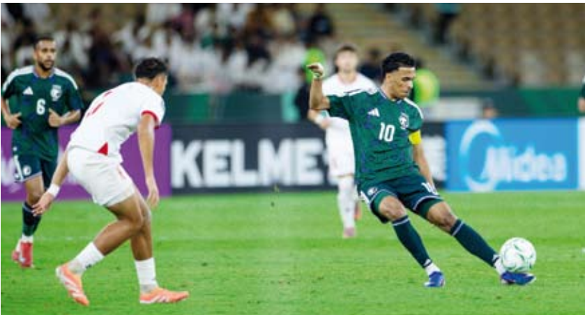
جانب من مباراة الأردن والسعودية