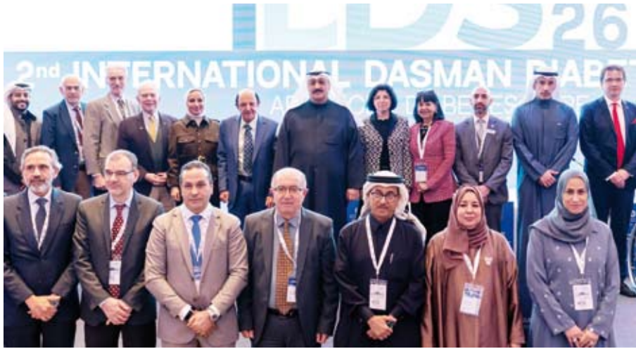
جانب من المشاركين