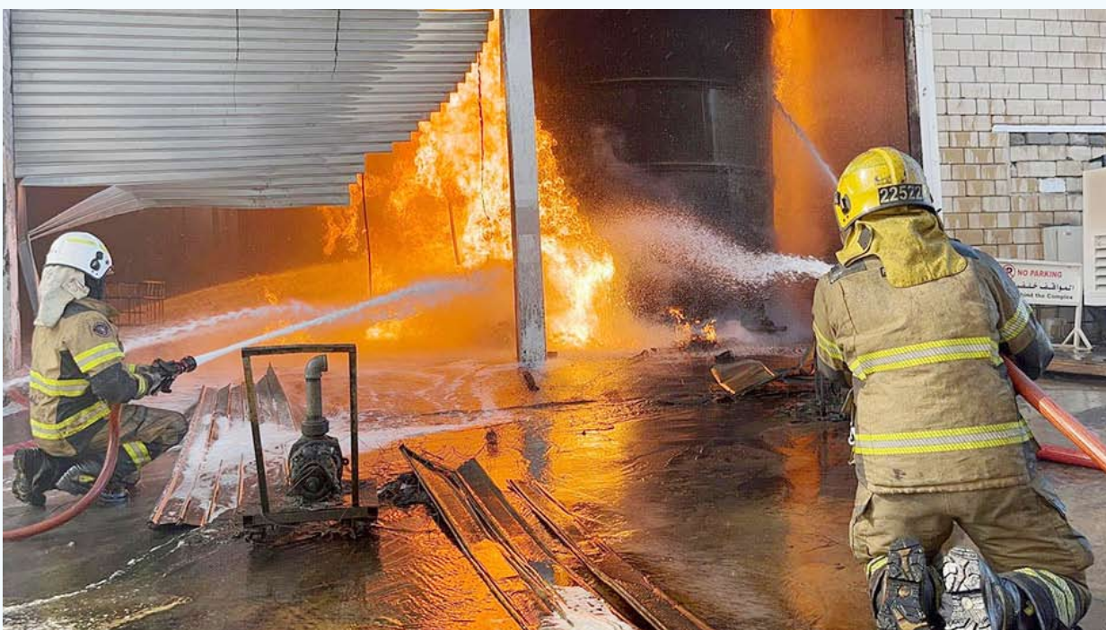
فرق الإطفاء سيطرت على حريق خزانات مواد سريعة الاشتعال

وقد باشرت الفرق مكافحة الحريق والسيطرة عليه دون تسجيل أي إصابات تُذكر.