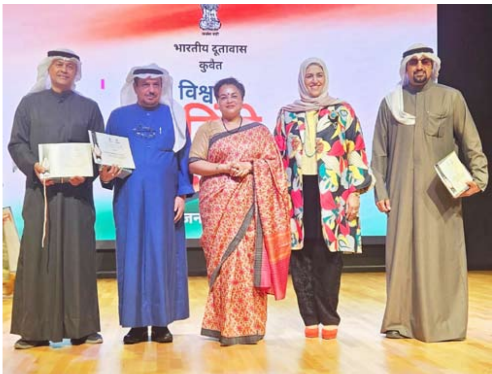
تكريم عدد من المشاركين