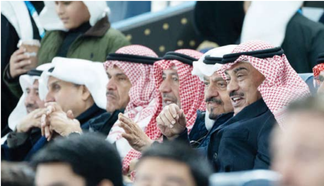
سمو ولي العهد وسمو رئيس الوزراء يتقدمان الحضور

وتقدم الوزير المطيري بجذيل الشكر والامتنان لكل من أسهم بتنظيم هذا الحدث الرياضي من العاملين في الهيئة العامة للرياضة وجهات الدولة والاتحاد الكويتي لكرة القدم والرابطة الفرنسية للعبة والمتطوعين مهنتاً نادي باريس سان جيرمان على تحقيقه اللقب.