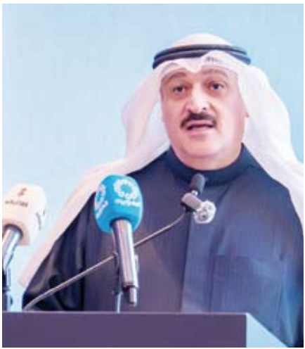
وزير الصحة د.أحمد العوضي يتحدثنا

والتعاون ما كنا نطمح إليه في بداياتنا». وأضاف أن المؤتمر هذا العام يأتي ليبنى على تلك الأسس المتينة من خلال برنامج علمي متكامل يضم عددا من الورش المتخصصة وجلسات علمية معقدة ومشاركة نخبة من المتحدثين والخبراء من مختلف دول العالم. وأكد أن ذلك يعكس المكانة المتنامية للمؤتمر على خريطة المؤتمرات الطبية الدولية مضيفاً أن “تركيزنا بظل ثابتاً على الأبحاث القابلة للتطبيق والممارسات الطبية المتقدمة والأثر العملي المباشر على جودة الرعاية الصحية». وأفاد الدكتور الرفاعي بأن معهد دسمان للسكري يؤكد أهمية الشراكات المحلية بوصفها ركيزة أساسية لتطوير المنظومة الصحية وفي مقدمتها وزارة الصحة باعتبار ذلك نموذجاً فاعلاً للتكامل بين البحث العلمي والتعليم والتطبيق الطبيين بما يسهم في تحسين مخرجات الرعاية الصحية على المستوى الوطني.