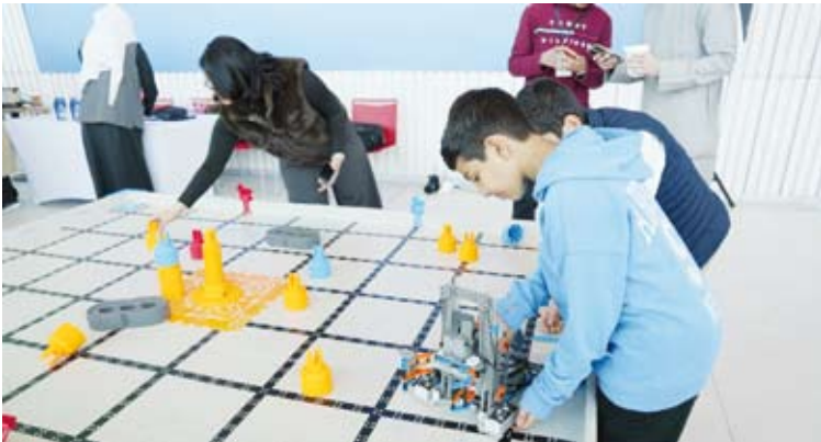
جانب من المسابقات

من جهته، أكد الوكيل المساعد لقطاع الأنشطة