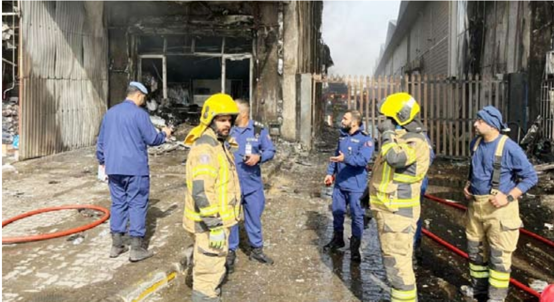
التهام عدد من الكراجات نتيجة الحريق

الموقع إلى الجهات المختصة. كما سيطرت فرق إطفاء مركزي الجهراء والجهراء الحرفي ظهر أمس على حريق منزل بمنطقة النسيم، حيث باشرت الفرق بمكافحة الحريق والسيطرة عليه وقد أسفر الحادث عن إصابة شخص وتم تسليمه إلى الجهات المختصة.