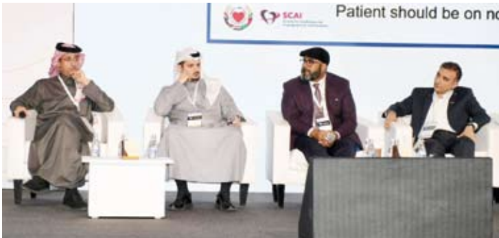
جانب من فعاليات المؤتمر