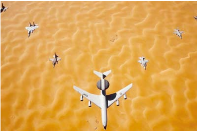
التمرين تضمن محاكاة تهديدات جوية وصاروخية متعددة الأبعاد