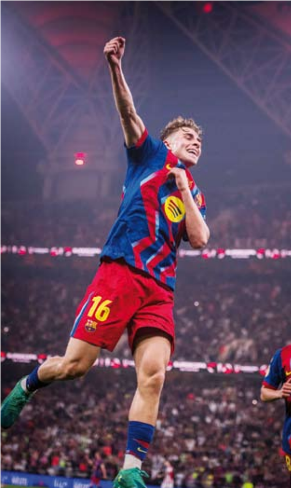
برشلونة استعد لريال مدريد بخماسية في بلباو

يلتقي فريقا برشلونة وريال مدريد، في نهائي كأس السوبر الإسباني لكرة القدم، على ملعب مدينة الملك عبدالله الرياضية بجدة، في رابع مواجهة كلاسيكو تقام بالسعودية منذ 2020. ويأتي النهائي تتويجا لمشوار الفريزين، حيث تاهل برشلونة للمباراة النهائية عقب فوزه على أتلتيك بلباو بخماسية نظيفة، بينما حجز ريال مدريد مقعده في النهائي بتجاوزه عقبة أتلتيكو مدريد بنتيجة 2-1.