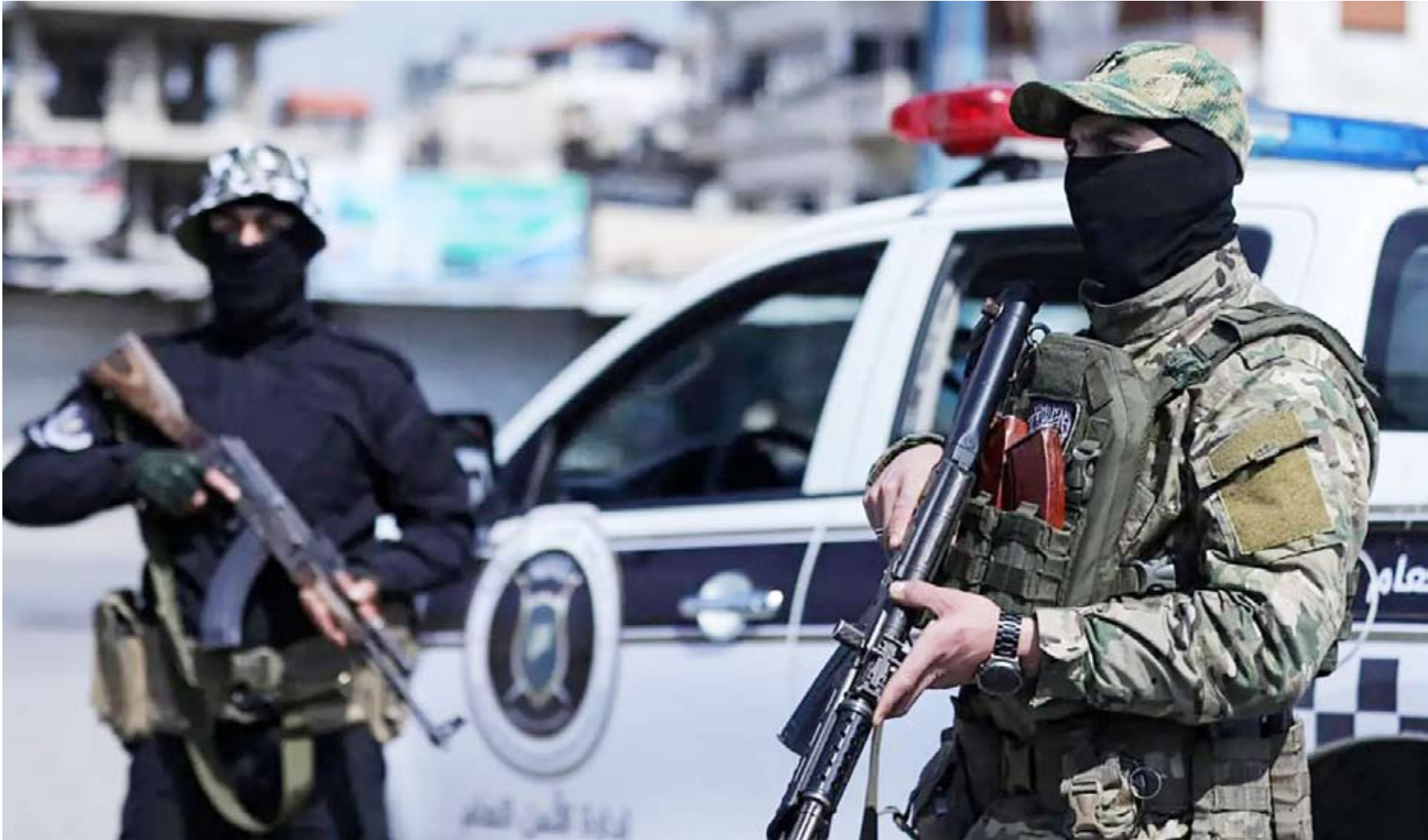
قوات الأمن والجيش السوري في حلب

سيطر الجيش السوري على حي الشيخ مقصود في مدينة حلب، بعد معارك عنيفة مع مقاتلي قوات «قسد»، وبذلك يسيطر الجيش السوري على كامل أحياء مدينة حلب.