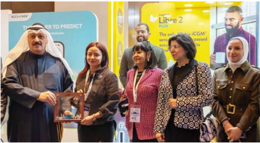
تكريم علي هامش المؤتمر