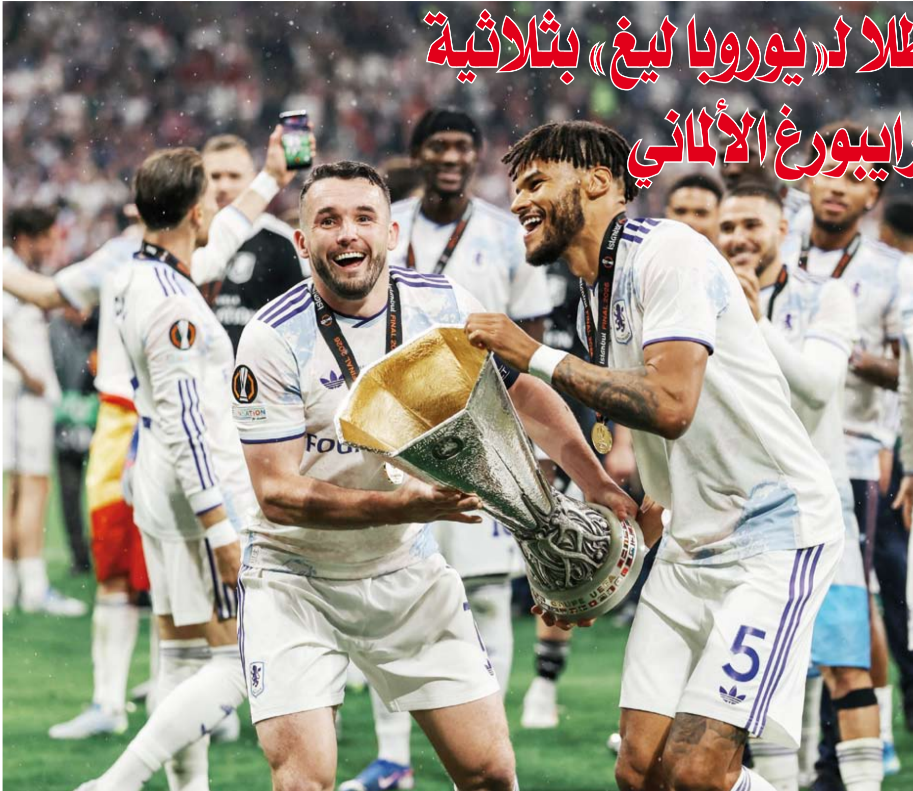
أستون فيلا يحتفل باللقب الأوروبي

تحت أنظار الأمير ويليام، أمير ويلز، ولي العهد البريطاني، والذي يعد أحد مشجعيه الأوفياء، توج أستون فيلا بطلا لـ «يوروبا ليغ» في اسطنبول بالفوز الكبير على فرايبورغ الألماني 3-0 في النهائي.