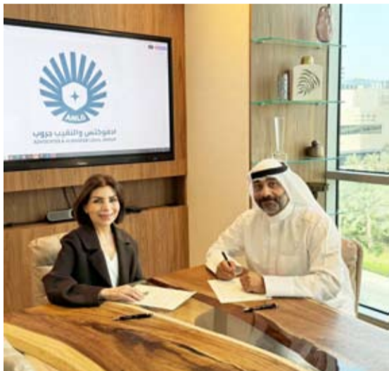
النقيب والفيلكاوي خلال توقيع الاتفاقية

وقعت شركة «أدفوكتس والنقيب جروب لأعمال المحاماة المحلية والدولية» عقد استحواذ كامل على شركة «الحكم» لمكاتب المحاماة والاستشارات القانونية د.م.م، في خطوة تأتي ضمن استراتيجية التوسع والتطوير المهني التي تتبناها الشركة لتعزيز مفهوم التخصص في المجالات القانونية المختلفة، وترسيخ ثقافة الشركات المهنية الناجحة في القطاع القانوني بالكويت والمنطقة.