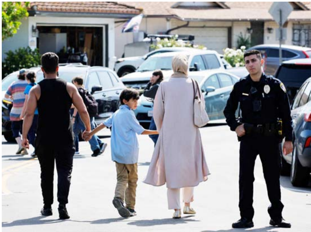
موقع إطلاق النار في المركز الإسلامي بسان دييغو

آخر الخطوات الأوروبية هي الزيارة التي يقوم بها حالياً إلى الجزيرة مفوض الشراكات الدولية جوزف سكيليا للمشاركة في منتدى دولي تنظمه الدنمارك، بالتعاون مع المفوضية الأوروبية حول فرص الاستثمار الكبرى في غرينلاند، والتي تتزامن مع زيارة الموفد الأميركي الخاص لاندري وافتتاح قنصلية أميركية جديدة في الجزيرة. وكان الاتحاد الأوروبي قد قرر مؤخراً مضاعفة مساعدته التمولية إلى الجزيرة حتى أصبحت تناهز نصف المساعدات المخصصة للبلدان الأراضي الواقعة وراء البحار، معرباً عن استعداده لضخ مزيد من الموارد المالية فيها بوصفها رداً سياسياً على تهديدات الإدارة الأميركية بالاستحواذ عليها.