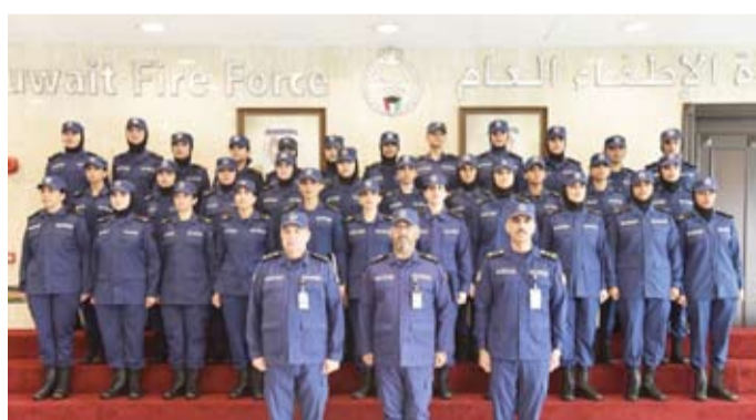
اللواء الرومي متوسط الخريجات

ويأتي تنظيم هذا اللقاء ضمن خطة القوة الرامية إلى تأهيل الدفعة الأولى من ضباط اختصاص العنصر النسائي القدرات على أداء مهامهم بكفاءة واقتدار، بما يعزز منظومة الأمن والسلامة في البلاد.