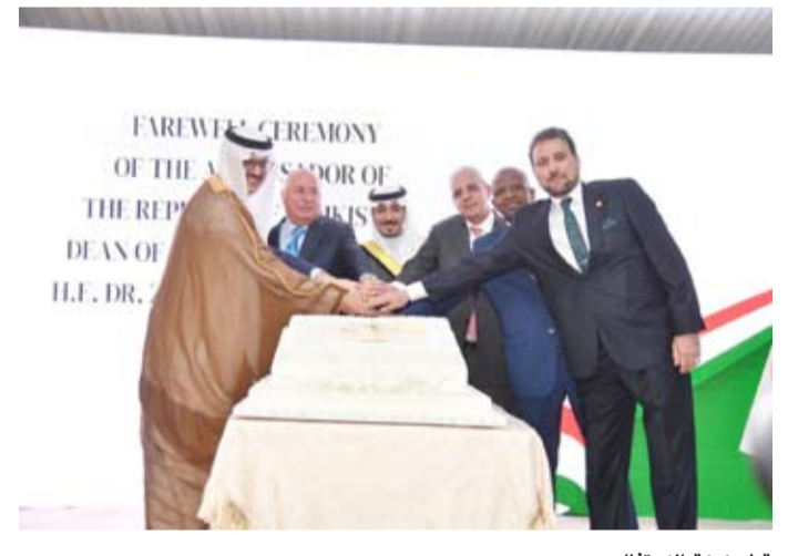
قطع كبة الاحتفال