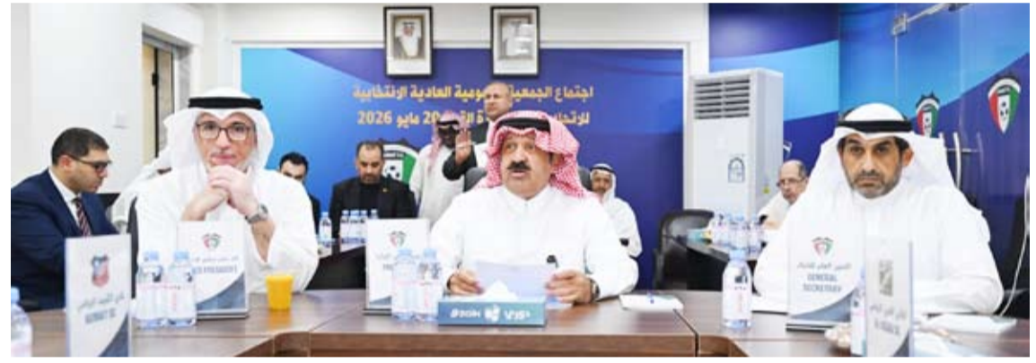
اليوسف خلال الجمعية العمومية العادية لاتحاد القدم

بحث وزير الدولة لشؤون الشباب والرياضة الدكتور طارق الجلاهمة مع مسؤولي نادي ميلتون كينز دونز الإنجليزي تجربة الاستثمار في الدوري الإنجليزي والنجاح الذي تحققت خلال الموسم الماضي بصعود الفريق إلى الدرجة الأعلى. وأكد الوزير الجلاهمة خلال اللقاء أهمية الاستثمار في الطاقات الشبابية وفتح آفاق جديدة أمام القيادات الشبابية للاستفادة من التجارب الدولية الناجحة، بما يساهم في تطوير البرامج والمبادرات الشبابية ويدعم توجهات الدولة نحو إعداد جيل قادر على المشاركة الفاعلة في التنمية وصناعة المستقبل. كما تناول اللقاء بحث فرص التعاون المشترك