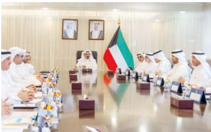
سمو الشيخ أحمد العيدالله يترأس الاجتماع

وزير التجارة والصناعة أسامة بودي، ووزير الخارجية الشيخ جراح الجابر، والمستشار بديوان رئيس مجلس الوزراء الشيخ الدكتور باسل الصباح، ومدير عام هيئة تشجيع الاستثمار المباشر الشيخ الدكتور مشعل جابر الأحمد وعدد من ممثلي الجهات المعنية