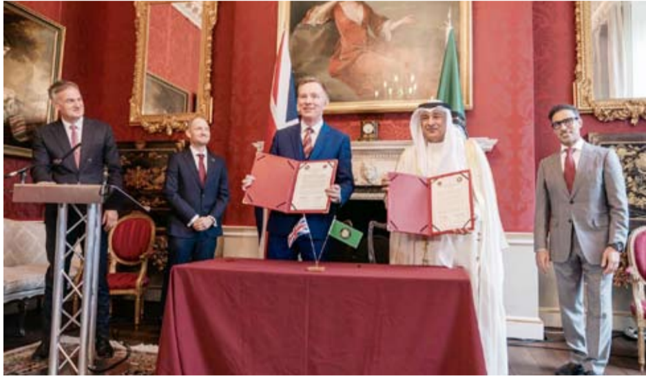
ممثل دول مجلس التعاون والمملكة المتحدة أثناء توقيع الاتفاقية

حيز التنفيذ. ومن شأن تبسيط إجراءات التاشيرة، وموافقة دول مجلس التعاون الخليجي على أطول فترة زيارة عمل على الإطلاق، أن ييسر على المهنيين السفر بين دول المجلس والمملكة المتحدة. وأكد السفير البريطاني لدى دولة الكويت، قدسي رشيد إن اختتام المفاوضات يمثل محطة مهمة في مسيرة العلاقة الراسخة بين المملكة المتحدة والكويت ومنطقة الخليج على نطاق أوسع. وعلى مدى أكثر من 250 عاماً، تمتعت المملكة المتحدة والكويت بشراكة تجارية قوية تواصل نموها. وتعكس هذه الاتفاقية التزام المملكة المتحدة بوصفها شريكاً موثقاً على المدى الطويل للكويت، والعمل معاً على تحقيق الازدهار وخلق الفرص.