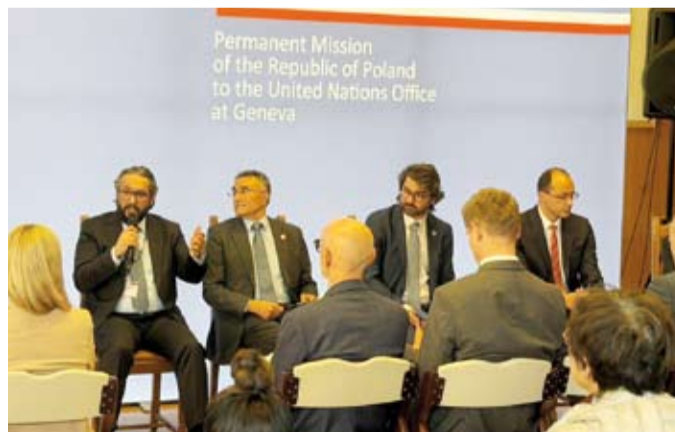
الشيخ الدكتور سلمان الصباح خلال مداخلة

أعمال جمعية الصحة العالمية. وشدد الشيخ الدكتور سلمان الصباح، على أهمية تعزيز جاهزية النظم الصحية الرقمية لمواجهة التهديدات السيبرانية المتزايدة وبناء بنية تحتية صحية رقمية مرنة وأمنة، لافتاً إلى أهمية التعاون الدولي وتبادل الخبرات لدعم استمرارية الخدمات الصحية وحماية أمن البيانات الصحية. وجاءت مشاركة الشيخ الدكتور سلمان الصباح بدعوة شخصية تقديراً لتجربة دولة الكويت الرائدة في مجال المسؤولية الطبية والتنظيم التشريعي والأخلاقي للبيانات الصحية الحديثة بالإضافة إلى كونه الرئيس السابق لجهاز المسؤولة الطبية بدولة الكويت.