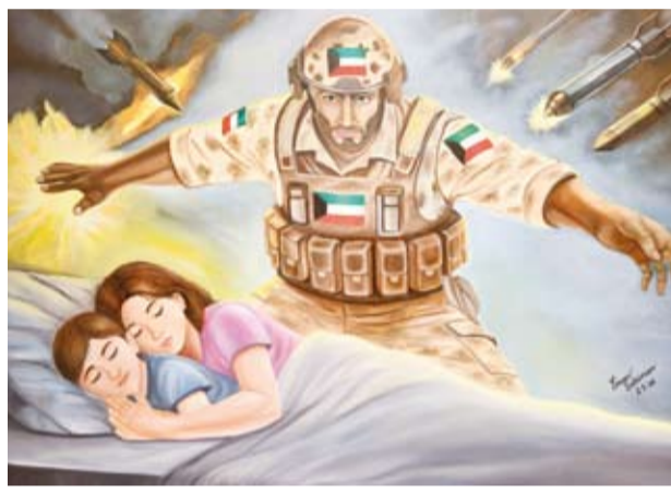
لوحة تبرز دور الصوف الأمامية

بالساليب ابداعية معاصرة، ويأتي تنظيم المعرض استمراراً للانشطة الفنية والثقافية التي تقيمها بين أبناء دول الخليج العربي.