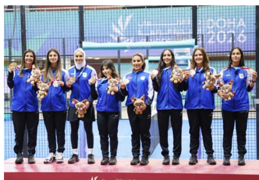
لاعبات البادل يحتفلن بالتتويج

بالمستوى الفني المتميز للاعبين واللاعبات المشاركين في البطولة وما قدموه من أداء يليق بسمعة الرياضة الكويتية معرباً عن تطلعه لتحقيق المزيد