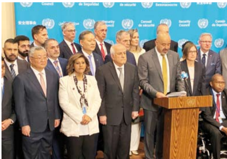
الشيخة جواهر الصباح تشارك في وقفة إعلامية أممية