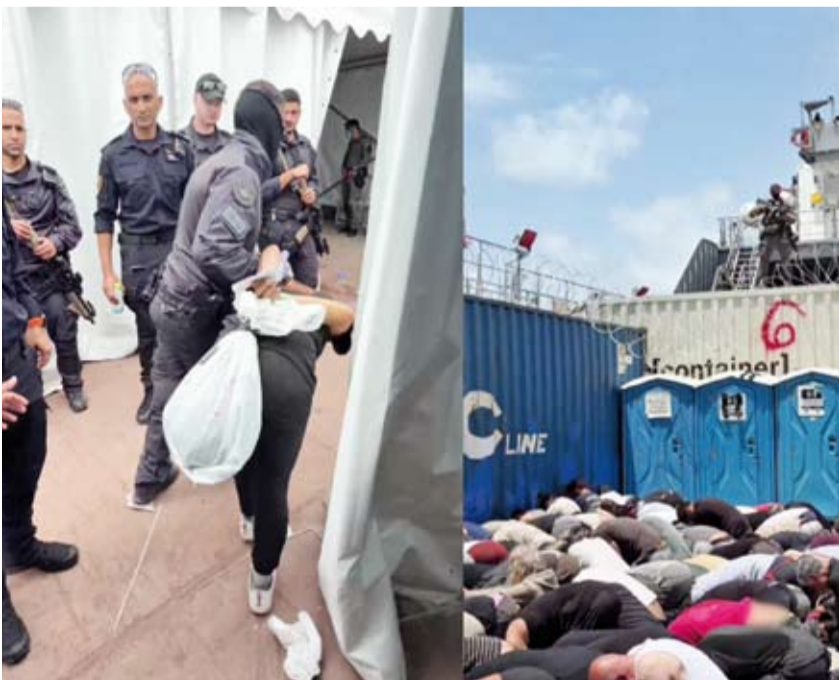
بن غفير نشط يظهر التكتيل بناشطي أسطول الصمود

السلطات الإسرائيلية، وطالبت بمعاملة إنسانية ولائقة للمواطن الأيرلندي المحتجز. واتخذت وزيرة الخارجية الكندية أنيتا أندن نهجاً مماثلاً باستدعاء السفير الإسرائيلي للاحتجاج على المقطع المنشور، وقالت في مؤتمر عبر الهاتف «ما شاهدناه أمر مقلق، وغير مقبول إطلاقاً. نتعامل مع هذه المسألة بجدية بالغة».