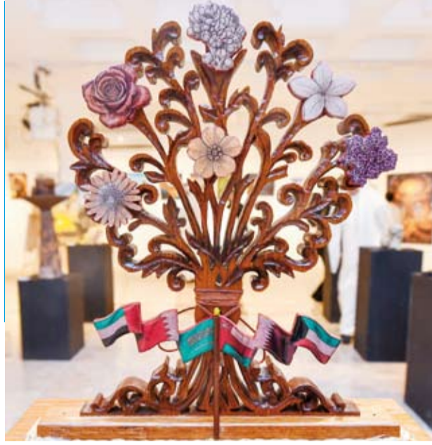
عمل فني بعنوان خليجنا واحد