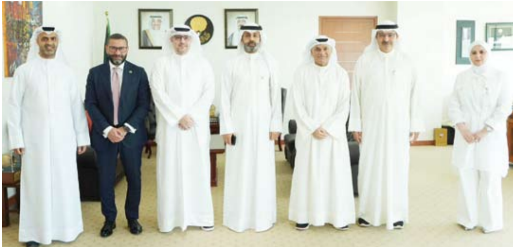
د. نادر الجلال يستقبل رئيس مجموعة بيت التمويل خالد الشعلان

أكد وزير التعليم العالي والبحث العلمي الدكتور نادر الجلال، أمس، أهمية التكامل بين مؤسسات الدولة والقطاع الخاص لخدمة الشباب وتعزيز مسيرتهم التعليمية عبر مبادرات تسهم في رفع مستوى الوعي الأكاديمي.