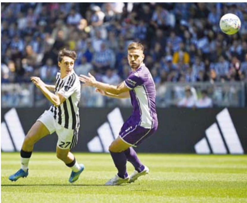
اليوفي في أزمة بعد خسارته على أرضه أمام فيورنتينا

على عائدات النادي ونشاطه في سوق الانتقالات الصيفية.