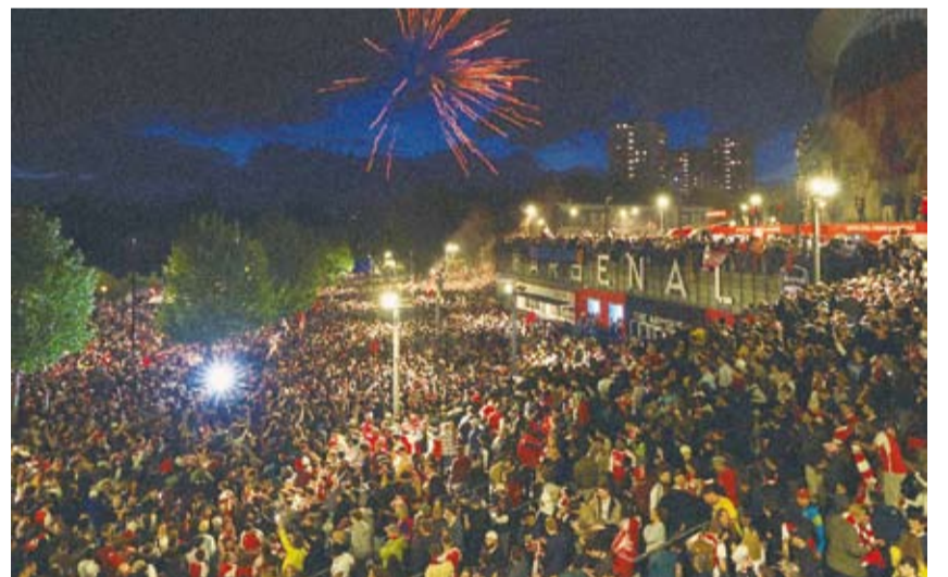
جماهير أرسنال تحتفل بتتويج فريقها باللقب

ووفقاً لشبكة The Athletic، فإن أرقص التذاكر المتاحة حالياً عبر مواقع إعادة البيع تتلخص نحو 3 آلاف جنيه إسترليني (4 آلاف و20 دولاراً)، بينما تراوحت غالبية الأسعار بين 10 آلاف و20 ألف جنيه إسترليني (13 ألفاً و796 دولاراً).