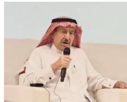
المهنا خلال مشاركته في الندوة

ويؤكد الدكتور إبراهيم المهنا، مستشار وزير الطاقة السعودي، في تصريح، لـ«الشرق الأوسط»، أن دور المملكة «مهم جداً» واتخذ السوق النفطية العالمية من أزمة خطيرة، موضحاً أن «خط شرق - غرب» أسهم في نقل نحو 7 ملايين برميل من النفط إلى البحر الأحمر متجنباً مضيق هرمز، وزود الأسواق الدولية بالنفط الخام والمنتجات،