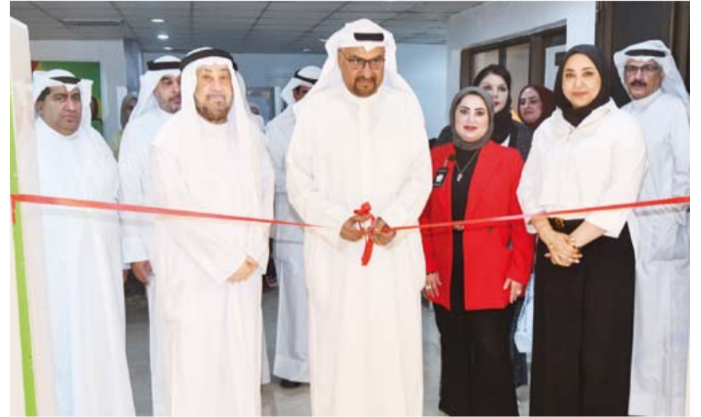
جانب من افتتاح المعرض

وقدم المعرض نحو 90 عملاً فنياً تنوعت بين اللوحات التشكيلية وأعمال الخزف والعدان عكست جميعها رؤى إبداعية استلهمت التراث الخليجي وروابطه الإنسانية والثقافية. وشهد المعرض حضوراً من المهتمين