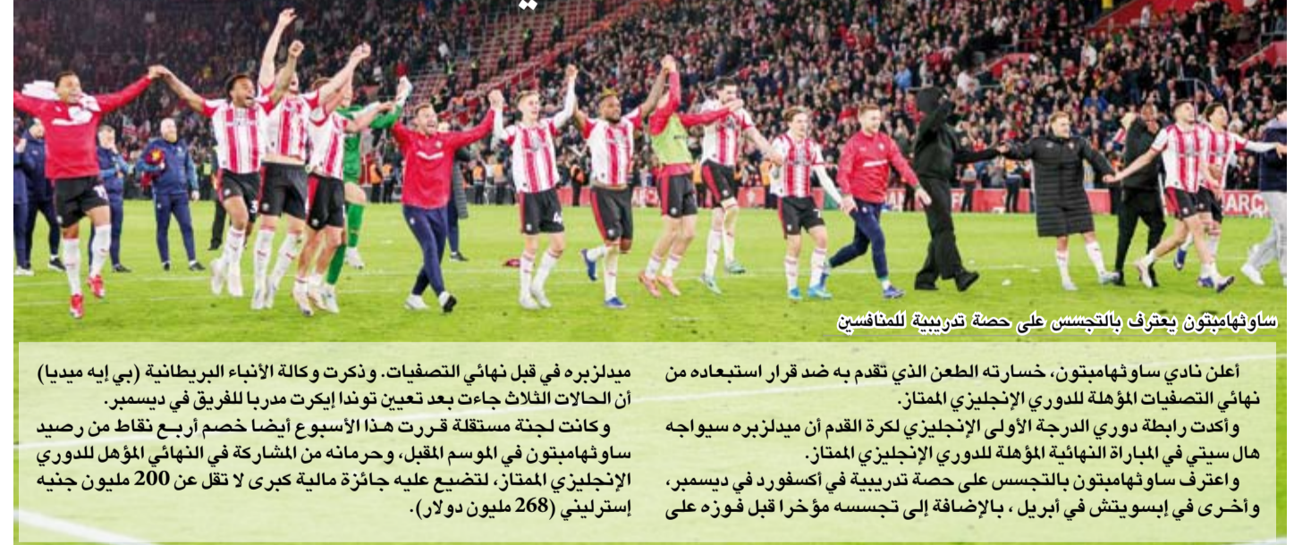
ساوثهامبتون يعترف بالتجسس على حصة تدريبية للمنافسين

ميدلبره في قبل نهائي التصفيات. وذكرت وكالة الأنباء البريطانية (بي إيه ميديا) أن الحالات الثلاث جاءت بعد تعيين توندا إيكرت مدرباً للفريق في ديسمبر.