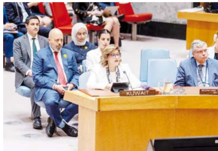
السفيرة الشيخة جواهر الصباح في كلمتها أمام مجلس الأمن

كنصوص فحسب بل تمتد لحماية الإنسان ذاته، الأمر الذي يتطلب الوقوف صفاً واحداً ومجاهمة التآكل الخطير لاحترام القانون الدولي الإنساني والبدء بجدية في تعزيز المساءلة ونيز الإذواجية في تطبيق المعايير. وأكدت على دعم الكويت الكامل لجهود اللجنة الدولية للصليب الأحمر وللمبادرة العالمية لتجديد الالتزام السياسي بالقانون الدولي معربة تطلع الكويت للمشاركة في المؤتمر الدولي الرفيع المستوى الذي سيستضيفه الأردن في نهاية العام لافتة إلى أنه من خلال هذه المبادرات الجماعية "ستستطيع إرسال رسالة جماعية واضحة مفادها أن حماية المدنيين لا زالت وستظل مسؤولية مشتركة لا يجوز التراجع عنها تحت أي ذريعة أو مسوغ".