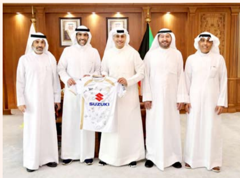
وزير الرياضة مع مسؤولي نادي ميلتون كينز دونز الإنجليزي

وتبادل التجارب في مجالات الشبابي، بما يعزز بناء الإدرات الرياضية والعمل كوادر وطنية مؤهلة وقادرة على قيادة المباريات النووية خلال المرحلة المقبلة