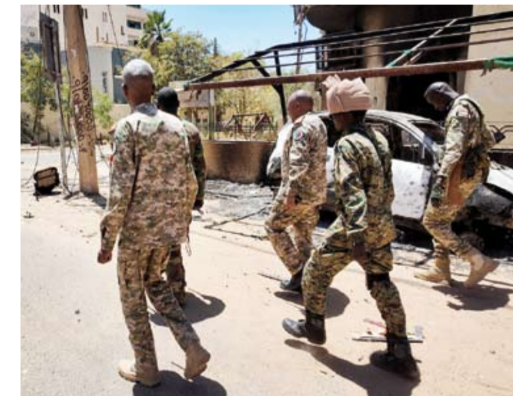
أفراد من الجيش السوداني في الخرطوم

مراكز صنع القرار العسكري والسيادي في السودان، ويضم قيادات تنفيذية وعسكرية وأمنية، من بينها وزراء الدفاع والداخلية والخارجية والمالية، إلى جانب قادة الجيش والأجهزة الأمنية، ويرأسه رئيس «مجلس السيادة» والقائد العام للجيش عبد الفتاح البرهان. وعقد المجلس اجتماع برئاسة البرهان، وبمشاركة كامل الأعضاء، لراجعة الأوضاع الأمنية والعسكرية في البلاد، حسبما نقلت إعلام «مجلس السيادة» الانتقالي. وأزاد حضور المجلس في إدارة الملفين الأمني والعسكري منذ اندلاع الحرب بين الجيش و«قوات الدعم السريع» في 15