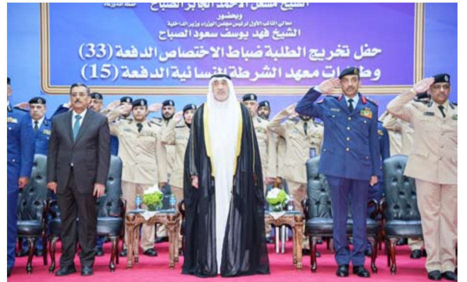
الشيخ فهد اليوسف يتقدم الحضور

وأكد النائب الأول لرئيس مجلس الوزراء ووزير الداخلية الشيخ فهد اليوسف، أن المرحلة الراهنة تتطلب أعلى درجات الجاهزية والانضباط واليقظة،