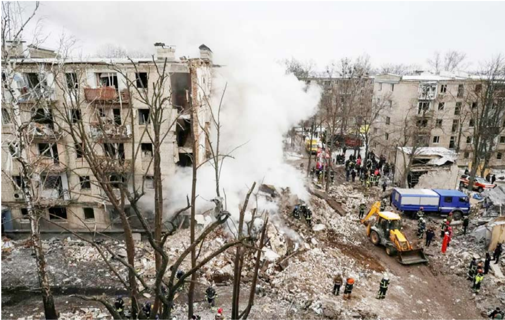
الدمار جراء القصف الروسي على مدينة خاركيف

تُقدر الخسائر البشرية بمئات الآلاف من الجانبين (قتلى وجرحى)، مع تدمير واسع للبنية التحتية في أوكرانيا وتأثيرات اقتصادية عالمية على الطاقة والغذاء. يبدو أن أوكرانيا نجحت في تحويل جزء من الزخم نحو العمق الروسي عبر حرب المسيرات، مما يبطئ التقدم الروسي على الأرض. لكن روسيا تحتفظ بميزة في حجم القوات والضربات الجوية. يبقى مصير الحرب معلقاً بين الاستنزاف طويل الأمد والضغط الدولي للتفاوض.