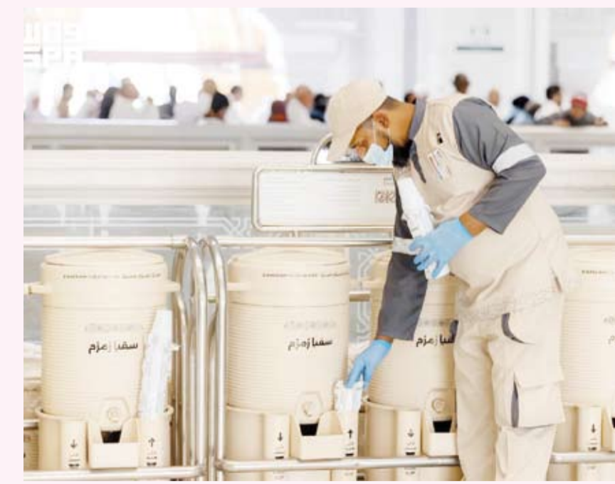
تطوير منظومة سقيا زمزم في المسجد الحرام

تواصل الهيئة العامة للعناية بشؤون المسجد الحرام والمسجد النبوي تطوير منظومة سقيا زمزم في المسجد الحرام، عبر تعزيز كفاءة مشربيات زمزم وتوسيع نقاط الخدمة بما يواكب الكثافة المتزايدة لضيوف الرحمن خلال موسم حج 1447 هـ ويرفع مستوى جاهزية التشغيلية في مواقع الحركة العالية. ويأتي المشروع ضمن توجه تشغيلي يركز على تحسين كفاءة توزيع مياه زمزم، وتقليل الهدر، وتحقيق سرعة الاستجابة خلال أوقات الذروة، مع المحافظة على وفرة الخدمة وجودتها داخل المسجد الحرام وساحاته. وتضم المنظومة الحالية (169) مشربية زمزم، فيما يُستخدم يومياً ما يقارب (14.892) حاوية مياه باردة وحارة، إلى جانب توزيع أكثر من (2.146.000) كاس يومياً لخدمة المصلين والزوار، ويبلغ متوسط استهلاك مياه زمزم نحو (1.622) متراً مكعباً يومياً، في حين تجرى فحوصات يومية على (70) عينة؛ للتأكد من سلامة المياه وجودتها وفق أعلى المعايير المعتمدة. وتعكس مؤشرات التشغيل تطوراً في إدارة منظومة السقيا، من خلال الاعتماد على قياس الطلب وتحليل الاحتياج الفعلي لنقاط الخدمة، بما يسهم في رفع كفاءة التوزيع وتحسين الاستفادة من الموارد، دون التأثير على انسيابية الخدمة أو جاهزية نقاط السقيا. وأكدت الهيئة أن تطوير منظومة سقيا زمزم يُعد جزءاً من حزمة مبادرات تشغيلية متكاملة، تهدف إلى الارتقاء بتجربة ضيوف الرحمن وتعزيز كفاءة الخدمات المقدمة في المسجد الحرام، بما يتسجم مع مستهدفات تحسين جودة الخدمات التشغيلية خلال موسم الحج. وينظر أن تسهم التحسينات الجديدة في تقليل التكدس حول مواقع السقيا، ودعم انسيابية الحركة داخل المسجد الحرام، إلى جانب تعزيز الاستدامة التشغيلية عبر خفض الفاقد وترشيد الاستهلاك، بما يضمن استمرار تقديم الخدمة بكفاءة عالية.