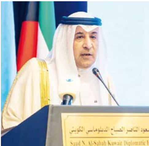
مساعد وزير الخارجية للشؤون القنصلية السفير عزيز الديحاني