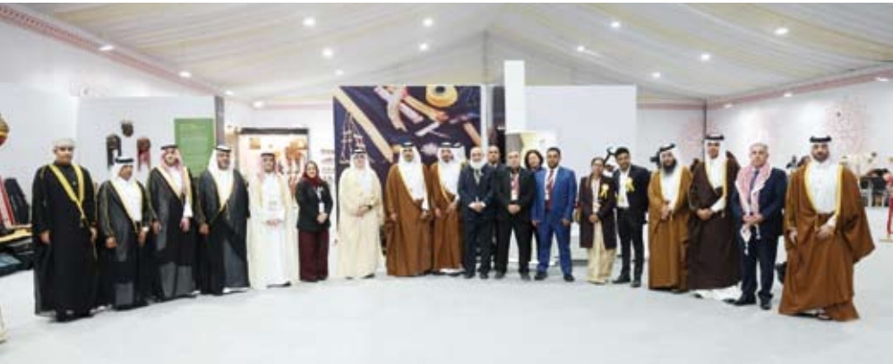
الوفود العربية المشاركة

أدرجت منظمة الأمم المتحدة للترية والعلم والثقافة (يونسكو)، أمس، ملف (البشت: المهارات والممارسات) بوصفه عنصراً عربياً مشتركاً ضمن القائمة التمثيلية للتراث الثقافي غير المادي للإنسانية بجهود جماعية قادتها دولة قطر ومشاركة دولة الكويت ودول مجلس التعاون الخليجي والمملكة الأردنية الهاشمية وجمهورية العراق والجمهورية العربية السورية. وجاء هذا الإعلان خلال اجتماعات الدورة العشرين للجنة الحكومية الدولية لاتفاقية 2003 لصون التراث الثقافي غير المادي المنعقدة في العاصمة الهندية نيودلهي (من 8 إلى 13 ديسمبر