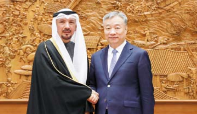
السفير جاسم الناجم مع نائب وزير الخارجية الصيني

أكد سفير دولة الكويت لدى الصين، جاسم الناجم، أمس، الحرص على تعزيز الشراكة الاستراتيجية مع الصين ودعم العلاقات معها وتنميتها في شتى المجالات بما يساهم في تحقيق المنفعة المتبادلة والمصالح المشتركة.