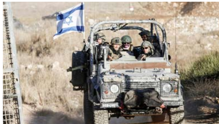
قوات الاحتلال تتوغل في الجولان

وحسب القناة 12 العبرية، فإن التغريدة جاءت تعليقا على مقطع فيديو يظهر جنودا من الجيش السوري خلال احتفالات ذكرى سقوط الأسد وهم يمشون: "غزة، غزة، نداء وحدتنا، نصرنا وقوتنا، ليلا ونهارا". وجاءت أيضا في ظل تصاعد التوتر على الحدود، بعد حادث إطلاق الجيش النار والقنابل الدخانية بشكل مباشر على مدينتي سوريين في القنيطرة.