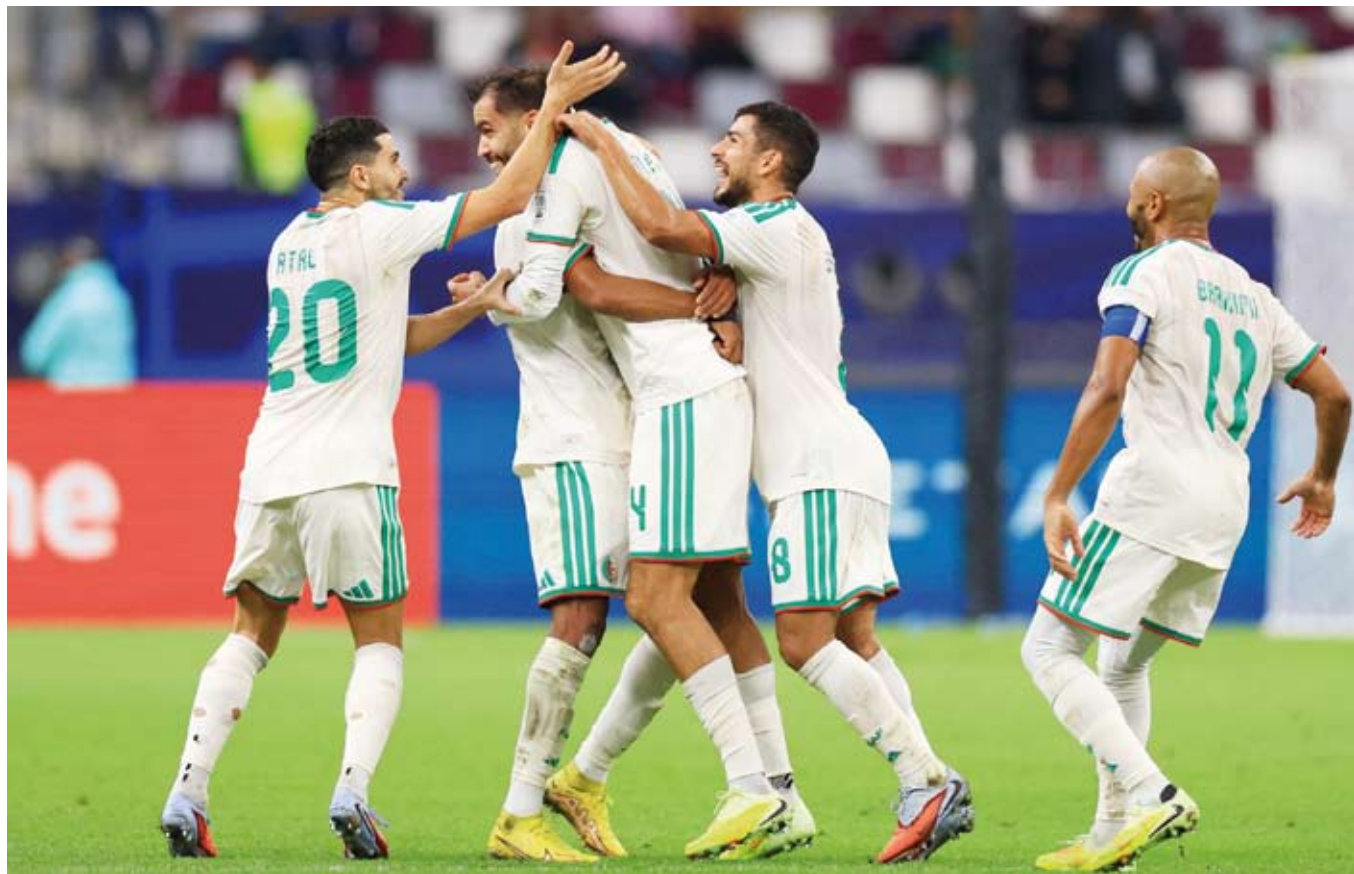
الجزائر يواصل تقديم عروضه القوية في البطولة