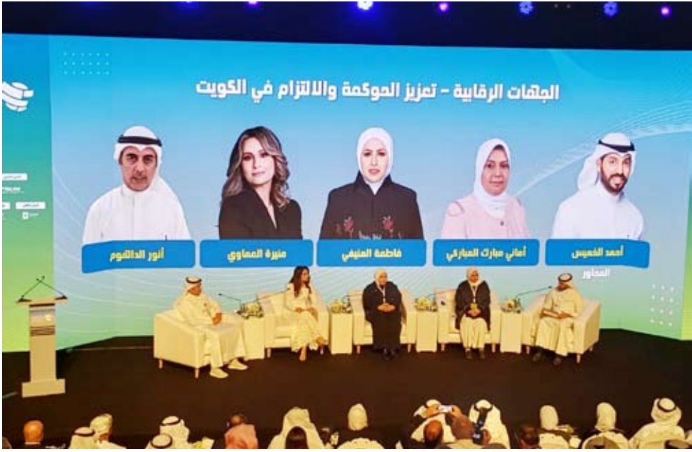
جانب من المؤتمر

حدث المهني الذي يجمع نخبة من الخبراء المحليين والدوليين. وأوضح الرفاعي أن اتحاد المصارف يمنح أهمية كبيرة لمهنة التدقيق الداخلي «بوصفها أحد الأعمدة الأساسية لضمان سلامة واستقرار القطاع المصرفي»، لافتاً إلى أن التدقيق الداخلي لم يعد مجرد وظيفة رقابية، بل «أصبح عنصراً استراتيجياً يساهم في إدارة المخاطر وضمان الالتزام بالمعايير الدولية، وتعزيز الثقة لدى المتعاملين».