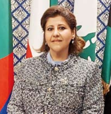
السفيرة الشيخة جواهر الصباح

أكدت مساعدة وزير الخارجية لشؤون حقوق الإنسان، السفيرة الشيخة جواهر الصباح، أمس، أن الاجتماع الـ 13 للجان الوطنية العربية للقانون الدولي الإنساني "محطة بارزة" لدعم الجهود المشتركة وتعزيز حماية المدنيين في النزاعات المسلحة.