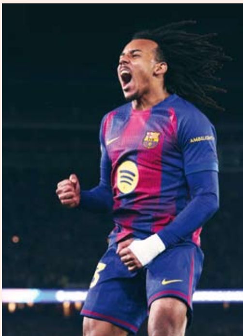
جولز كوندى سجل هدفى برشلونة

انتزع برشلونة ثلاث نقاط ثمينة بفوز صعب على ضيفه آينترأخت فرانكفورت بنتيجة 2 / 1، في إطار منافسات الجولة السادسة من مرحلة الدوري بمسابقة دوري أبطال أوروبا لكرة القدم.