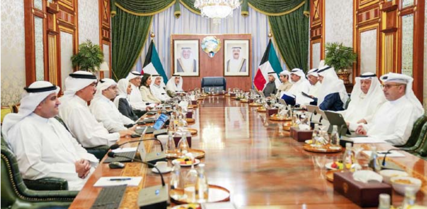
اليوسف يتراس اجتماع مجلس الوزراء

واعتمد مجلس الوزراء محضر اللجنة العليا لتحقيق الجنسية الكويتية والمتضمن حالات فقد وسحب الجنسية الكويتية من بعض الأشخاص وذلك وفقا لأحكام المرسوم بالقانون رقم (15) لسنة 1959 بشأن الجنسية الكويتية وتعديلاته. واستعرض مجلس الوزراء عددا من المواضيع المدرجة على جدول الأعمال وقرر الموافقة عليها كما قرر إحالة عدد منها إلى اللجان الوزارية المختصة لدراستها وإعداد تقارير بشأنها لاستكمال الإجراءات الخاصة لإنجازها.