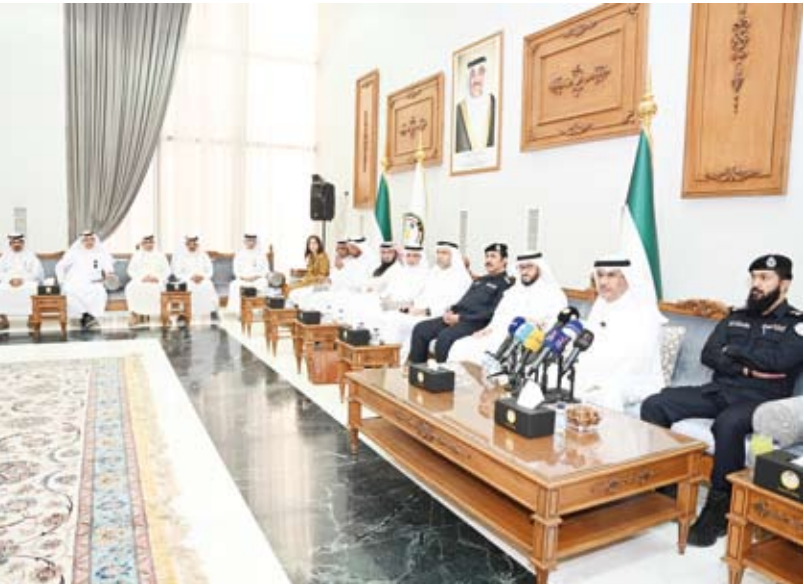
محافظ الجھراء متحدثاً خلال الحوار المفتوح