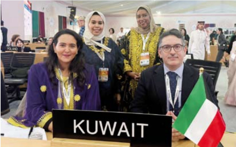
رئيس وفد الكويت محمد بن رضا مع أعضاء الوفد

أدرجت دولة الكويت، ملف «الديوانية» كملف فردي على القائمة التمثيلية لمنظمة الأمم المتحدة للتربية والعلم والثقافة (يونسكو) للتراث الثقافي غير المادي للإنسانية.