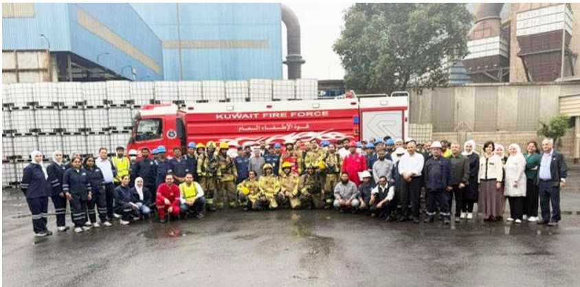
المشاركون في التمرين

الحريق الافتراضي الذي وضع ضمن سيناريو التمرين. وتأتي هذه التدريبات التي تقوم بها قوة الإطفاء العام للتعامل السريع مع مثل هذه الحوادث وذلك لحماية الأرواح والممتلكات وتحقيق الأمن المجتمعي في البلاد. في إطار التعاون بين قوة الإطفاء العام والجهات الحكومية بالدولة نفذت القوة صباح أمس الأربعاء تمريناً عملياً في مستشفى الأميري والشركة الوطنية للصناعات الكيماوية والبترونية والذي تم من خلاله عملية إخلاء وإنقاذ المصابين والسيطرة على