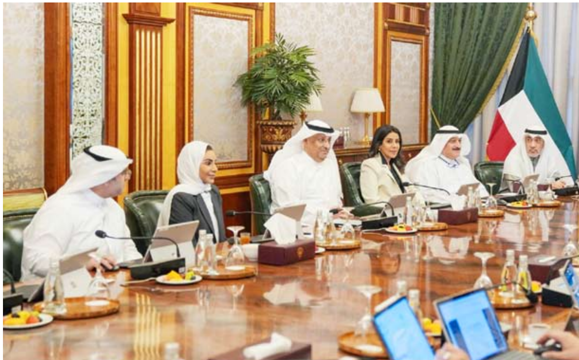
النائب الأول مترشحا لاجتماع المجلس أمس

هذه الجماعات المسلحة التي يدعمها الاحتلال المجرم بهدف الفتنة بين الفلسطينيين، والضغط بصورة أكبر على حركة حماس لكي تخضع لمطالبه وتسلم السلاح وتخرج من المشهد الفلسطيني. وهؤلاء المدعومون من الاحتلال سيأتي الدور عليهم غدا ليتخلص منهم بعد انتهاء مهمتهم!