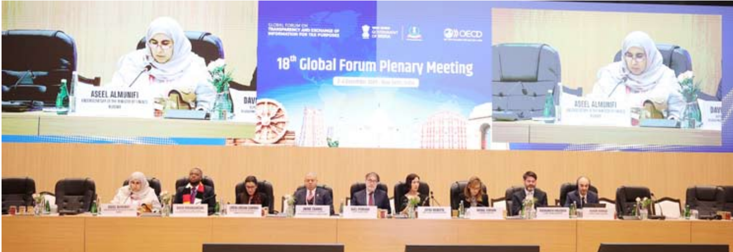
المنيفي تلقي كلمة الكويت

المقيمين الدوليين المكلفين بتقييم الكويت في أبريل 2026، لاستعراض آخر الاستعدادات والمطالبات، كما التقت سعادة سفير دولة الكويت لدى الهند مشعل مصطفى الشمالي وأعضاء البعثة الدبلوماسية، وأطلعتهم على نتائج المشاركة الكويتية وجهود الدولة في تعزيز الشفافية الضريبية ومكافحة التهرب الضريبي. يُذكر أن المنتدى العالمي يعد الإطار الدولي الأبرز لتنسيق التبادل التلقائي للمعلومات المالية والضريبية بين الدول الأعضاء، بهدف الحد من الملاذات الضريبية وتعزيز العدالة الضريبية على مستوى العالم.