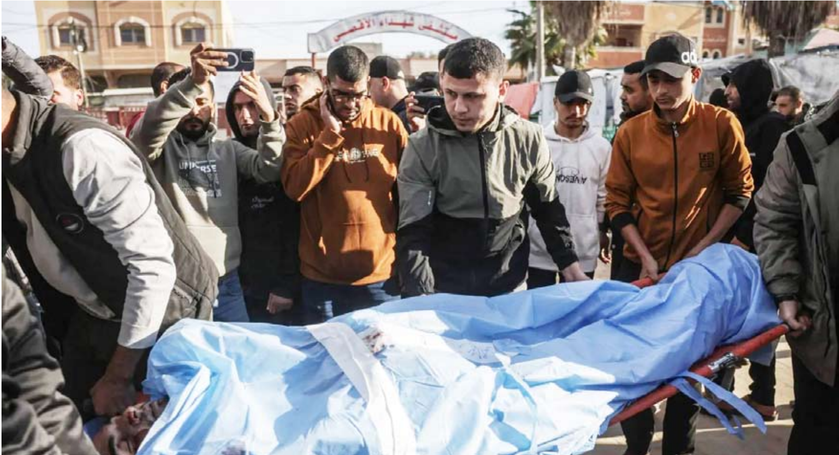
جنازة فلسطيني داخل دير البلح

أظهرت تحركات ميدانية إسرائيلية متواصلة، سعيًا لفرض منطقة عازلة جديدة في قطاع غزة بعمق يقارب 3 كيلومترات غرب الأصفر الذي يفصل بين مناطق سيطرة الاحتلال (شرق الخط الأصفر)، والمواقع التي تعمل فيها حركة «حماس» (غرب الخط). ووفق مصادر ميدانية في الفصائل الفلسطينية في غزة، فإن إسرائيل تسابق الزمن قبل الانتقال للمرحلة الثانية من وقف إطلاق النار، عبر تثبيت حقائق ميدانية جديدة على الأرض عبر نسف المنازل وتسوية الأراضي بما يسمح لها بكشف المنطقة التي تريد أن تصبح منطقة عازلة جديدة في القطاع. وتتوافق تلك التطورات الميدانية، مع تصريحات رئيس أركان الجيش الإسرائيلي إيهال زامير، من داخل قطاع غزة خلال تفقده قواته، إذ قال إن «الخط الأصفر يشكل خط حدود جديدًا، وخط دفاع متقدماً للمستوطنات، وخط هجوم». لكن القيادي في «حماس» حسام بدران، رأى أن تصريحات رئيس الأركان الإسرائيلي «تكشف بوضوح عدم التزام الاحتلال ببنود اتفاق وقف إطلاق النار»، ومشيرًا إلى أن «مواصلة هدم