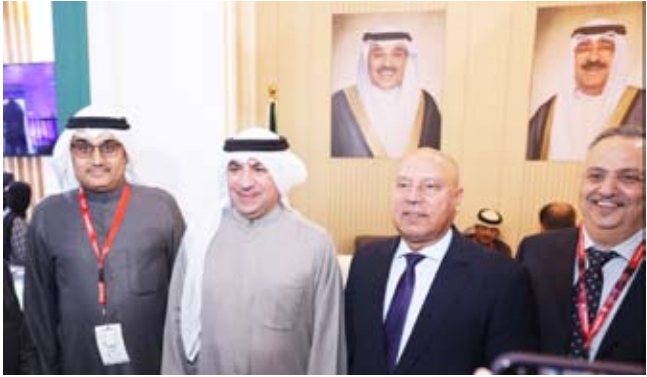
مسؤولو جناح الكويت في المعرض

من خلال مساعيها لإبراز الصناعات الغذائية الكويتية وفتح أسواق جديدة لها شاركت الهيئة العامة للصناعة في المعرض التجاري الدولي للأغذية والمشروبات (فوود أفريكا) في القاهرة بجناح خاص ضم عشر شركات كويتية. وحظي الجناح الكويتي بإقبال لافت من الجمهور والتجار والخبراء والمختصين بما يعكس جودة المنتجات الغذائية الكويتية وتنوعها. ويعتبر معرض (فوود أفريكا) الذي انطلقت فعالياته أول أمس الثلاثاء وتستمر حتى 12 ديسمبر الجاري بمشاركة أكثر من 1200 شركة 45 دولة بينها الكويت المعرض التجاري الأبرز لصناعة الأغذية والمشروبات في إفريقيا والشرق الأوسط.