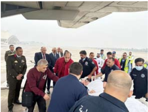
السفير المصري والقنصل العام يتابعان نقل القبط المصري

في لفقة إنسانية وبناء على توجيهات الرئيس المصري عبد الفتاح السيسي وبرعاية أبناء الجاليات المصرية بالخارج، نجحت وزارة الخارجية والهجرة وشؤون المصريين بالخارج، بالتنسيق مع وزارتي الدفاع والصحة والقنصلية المصرية في الكويت، في تسهيل إجراءات نقل مواطن مصري من دولة الكويت لديه ظروف طبية خاصة إلى أرض الوطن، وترتيب رعاية طبية لائقة في أحد مستشفيات وزارة الصحة المصرية.