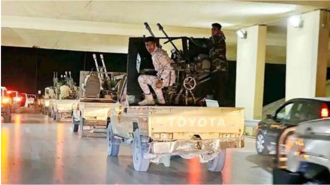
تحركات عسكرية في طرابلس

كانت المؤسسة الوطنية لحقوق الإنسان في ليبيا قد وثّقت وفاة طفل متأثرًا بإصابته جراء أعمال العنف والاشتباكات، التي شهدتها منطقة الحرسه بمدينة الزاوية، على خلفية مقتل أحد عناصر «الكتيبة 103»، المعروفة باسم «السلة»، والخاضعة لإمرة عثمان المهلب، إثر تعرض رتل تابع للكتيبة لإطلاق نار في أثناء مروره بالطريق الساحلي. وتتجدد الاشتباكات في الزاوية بسبب تنافس الميليشيات المحلية على النفوذ، وطرق تهريب الوقود والمهاجرين، إضافة إلى صراعات انتقامية مرتبطة بالاعتقالات، في ظل غياب سلطة أمنية موحدة.