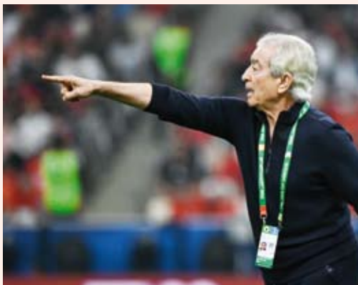
المدرب المصري حلمي طولان

ودّع منتخب مصر الثاني بقيادة المدرب حلمي طولان كأس العرب لكرة القدم المقامة في قطر، بعد هزيمة ثقيلة -3صفر أمام منتخب الأردن الرابع الذي فاز بجميع مبارياته في المجموعة الثالثة.