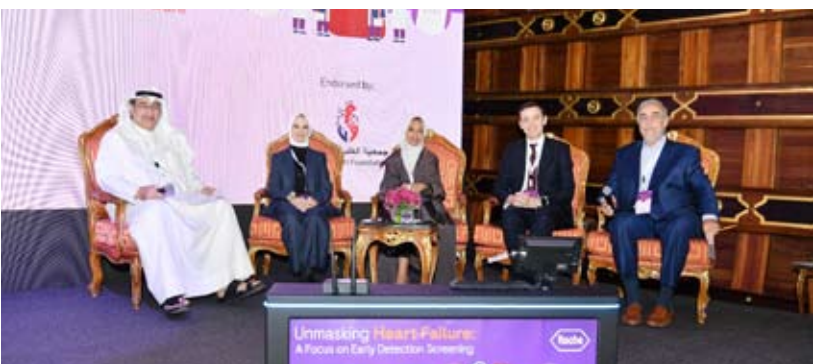
جانب من فعاليات المؤتمر