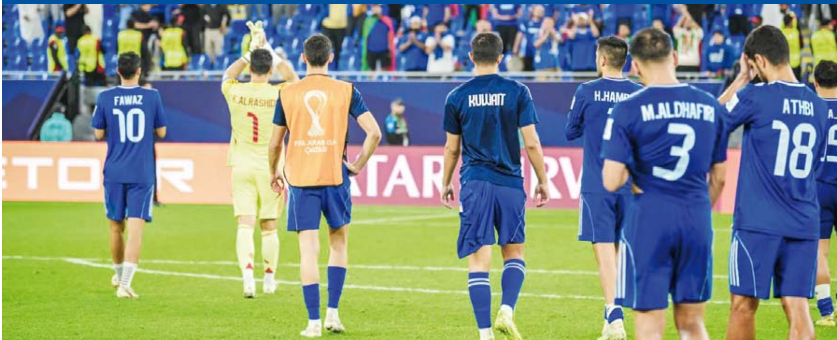
خروج مبكر للأزرق من كأس العرب

أعرب مدرب منتخب الكويت لكرة القدم هيليو سوزا عن فخره بلأعبي المنتخب على ما قدموه في البطولة والفترة الماضية مؤكداً أن المستقبل واعد للمنتخب.