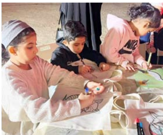
أعمال الأطفال في الاحتفالية

«حماية البيئة» تواصل حملتها الوطنية بالجهداء