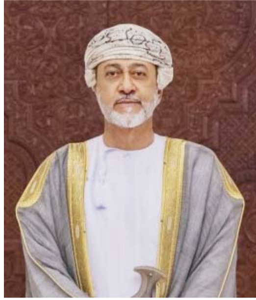
جلالة السلطان هيثم بن طارق