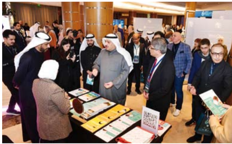
جولة في المعرض