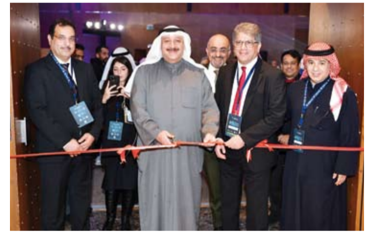
وزير الصحة يفتتح المعرض للمصاحب

بمفهومه الشامل من خلال تكوين فريق التأهيل الطبي المتكامل عليه بين الأوساط المتخصصة المنطقة الذي قدم نموذج التأهيل الطبي العالمي. وذكر أن الكويت كانت رائدة تاريخياً في اعتماد وتكوين هذا التخصص في المنطقة وما زالت تعمل جاهدة على أن تكون رائدة في وقتنا الحاضر من خلال تطور كيمي وكيمي للخدمات المقدمة إذ تقدم أقسام الطب الطبيعي والتمهيد خدماتها من خلال أقسام طبية منتشرة في مختلف مستشفيات الوزارة إضافة إلى القلطات النوعية التي طرأت على الخدمات المقدمة. وبين أن المؤتمر الذي يستمر ثلاثة أيام يمثل أهمية خاصة باتاحة الفرصة لتبادل الخبرات العلمية لتحقيق خدمة طبية متميزة علاوة على أنه إحدى حلقات تطوير واستمرار منظومة التعليم الطبي المستمر ما يتيح تقديم الرعاية المبنيّة على الأدلة والبراهين العلمية لخدمة المرضى.