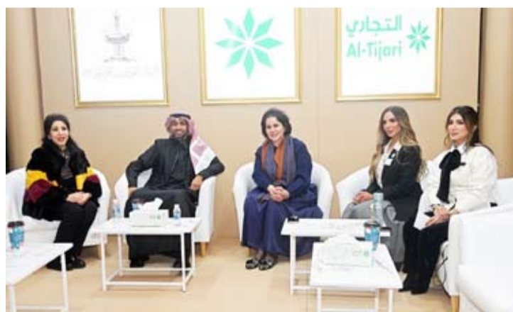
جانب من الفعالية

جوائز للعملاء لتحول فيما بعد لتصبح حساب النجمة.