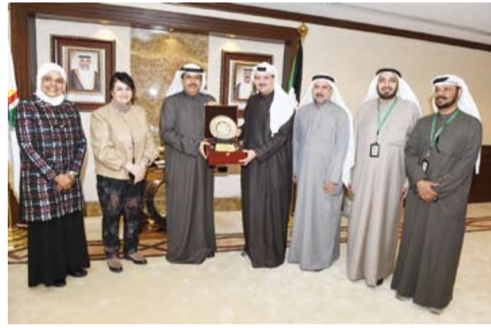
جانب من تبادل الهدايا التذكارية