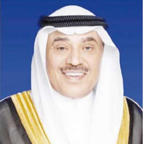
سمو ولي العهد الشيخ صباح الخالد

بعث سمو ولي العهد الشيخ صباح الخالد، ببرقية تهنئة إلى أخيه صاحب الجلالة السلطان هيثم بن طارق المعظم سلطان عمان الشقيقة، ضمنها سموه خالص تهانيه بمناسبة الذكري الخامسة لتولي جلالته مقاليد الحكم. مشيداً سموه بما حققته سلطنة عمان الشقيقة في عهد جلالته الميمون من إنجازات تنموية بارزة على كافة الأصعدة، وتمنياً سموه لجلالته دوام الصحة والعافية ولشعبها الكريم المزيد من التقدم والنماء في ظل قيادة جلالته الحكيمة.