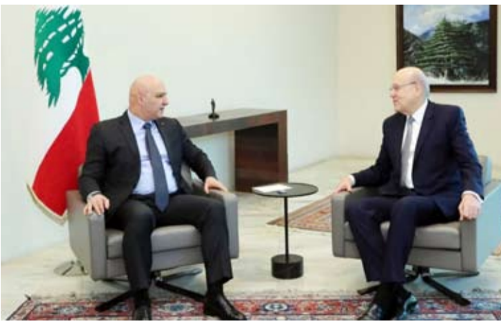
ميفاتي يلتقي عون

للجميع؟ هل ننتظر من حكومة جديدة أن تقول إن السلاح مشروع بيد جميع المواطنين؟ نحن أمام مرحلة جديدة تبدأ من جنوب لبنان وجنوب الليطاني بالذات، من أجل سحب السلاح، وأن تكون الدولة موجودة على كل الأراضي اللبنانية، وأن يكون الاستقرار بدأً من الجنوب». ورداً على سؤال عن الحكومة التي يحتاج إليها لبنان، وهل سيكون رئيس الحكومة المقبل أجاب: «الرئيس الذي سيكلف بتشكيل الحكومة هو الذي سيرد على هذه الأسئلة. ولكن من دون شك، فإن الحكومة يجب أن تكون قادرة على ترجمة التوجه الذي تحدثت عنه فخامة الرئيس. نحن أمام ورشة عمل جديدة تقتضي من الجميع التعاون للقيام بعمل جدي من أجل إنقاذ الوطن».