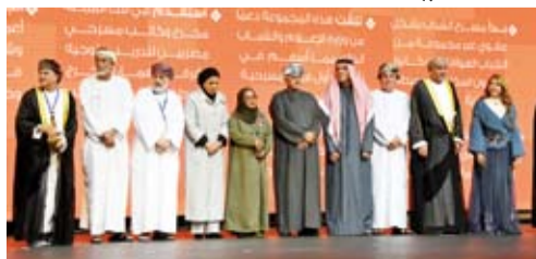
لقطة جماعية للمعربين

أهداف الاستراتيجية الثقافية لوزارة الثقافة والتي تنص رؤيتها على جعل عمان وجهة ثقافية رائدة بهوية راسخة. وأشاد بدور الهيئة العربية للمسرح و جهودها خلال 15 سنة في إقامة هذا