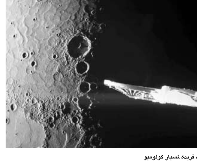
بيانات فريدة لمسبار كولومبو

أعلنت وكالة الفضاء الأوروبية أن المسبار الفضائي الأوروبي-الياباني «بيبي كولومبو»، التابع لها، نجح في جمع صور ومعلومات هامة خلال مروره الأخير بالقرب من كوكب عطارد، الكوكب الأقرب إلى الشمس. وأوضح جي راينت جونز، عالم المشروع في وكالة الفضاء الأوروبية، أن فريق العمل سيبدأ في الأسابيع المقبلة تحليل البيانات التي تم جمعها لفهم المزيد عن كوكب عطارد، مضيفاً أنه بعد تنفيذ عدد من المناورات المعتمدة على الجاذبية، ستدخل المهمة مرحلتها التالية استعداداً لبدء جمع البيانات العلمية في عام 2027. وفقاً للوكالة، أجرى المسبار تحليقه السادس فوق عطارد يوم الأربعاء الماضي، حيث اقترب على مسافة 295 كيلومتراً من سطح الكوكب المظلم والبارد، وبعد سبع دقائق فقط، حلق المسبار فوق القطب الشمالي لعطارد، ملتقظاً صوراً لفوهات بارزة مثل بروكوفيف وكاندينسكي وتولكين وغورديمير، التي تتميز بظلالها الداكنة بسبب عمقها الكبير. كما رصد المسبار سهول «يورياليس بلانيتيا»، وهي