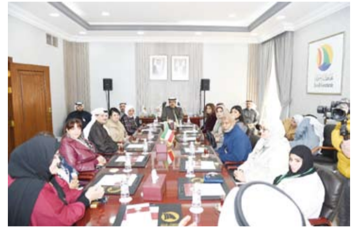
محافظ حولي على الأضواء يلتقي وفد منظمة الصحة العالمية الزائر للبلاد

وتأتي هذه الزيارة لتقييم المدن الصحية في الكويت في إطار أنشطة اللجان التنسيقية في المناطق للتأكد من أن الخطط والأهداف المعروضة قائمة على أرض الواقع. وكانت الدكتورة الفقي قد أكدت في تصريح سابق أن ما توفره دولة الكويت من خدمات في مجالات متعددة ساعدها في استيفاء معايير تقييم المدن الصحية في البلاد منذ بدء مرحلة التقييم وأن هناك مقومات كثيرة ساعدت في تخطي العقبات والمعايير التي تشترطها المنظمة.