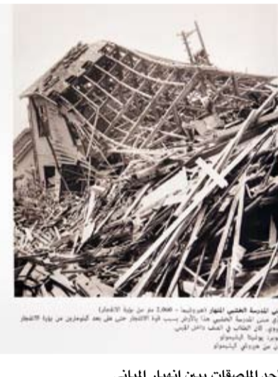
أحد الملصقات بين انهيار المباني