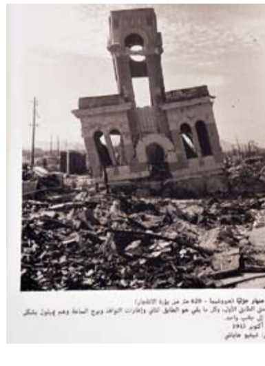
أحد الملصقات بين انهيار المباني