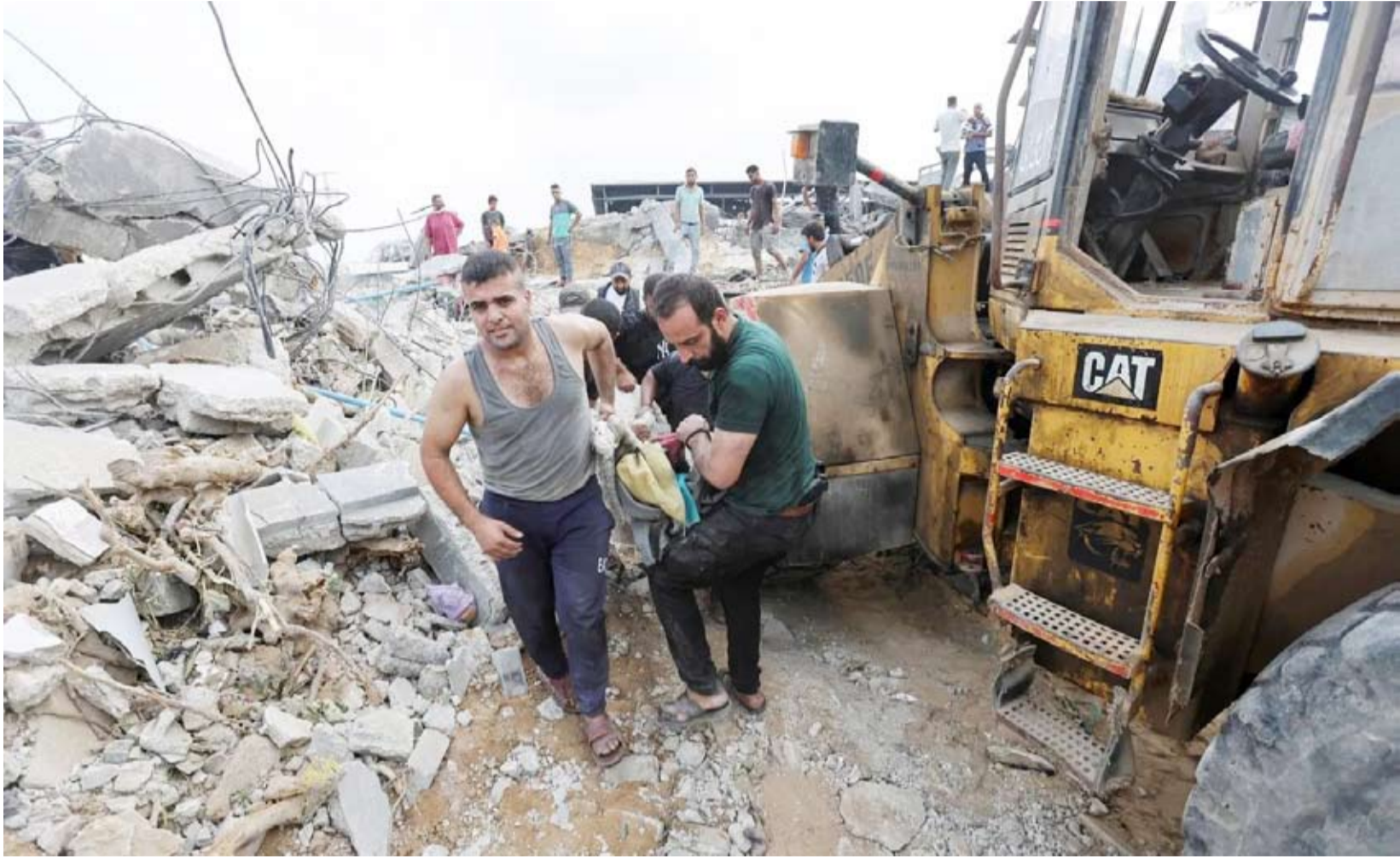
جرحى في موقع غارة جوية صهيونية

على موقف (حماس)». ووسط ذلك التفاؤل الحذر، قال المصدر الفلسطيني المطلع، إن أفكار الاتفاق تتضح، وأي خلافات ستُحل للمرحلة الثانية التي تكون معنية أكثر بالتفاصيل عن نظيرتها الأولى، مرجحاً أن «العودة للحديث عن شروط جديدة بمثابة ضغوط إعلامية قبل الإعلان المرتقب مع وصول ترمب للبيت الأبيض». ورغم تلك الآمال، أوضح مسؤول من «حماس»، لشبكة «سي إن إن»، أن «إسرائيل طالبت بالاحتفاظ بشريط من الأرض بطول كيلومتر واحد على طول الحدود الشرقية والشمالية للقطاع»، في تأكيد منه لتقرير نشرته «رويترز»، نقلاً عن مسؤول فلسطيني، حول الشرط الجديد للحدود، في حين تحدثت «القناة الـ12»، الإسرائيلية، نقلاً عن مسؤول، أن «مفاوضات الرهائن تسير ببطء». وباعتقاد المحلل السياسي الفلسطيني، الدكتور أيمن الرقب، فإن «المرحلة الأولى ستعطي بقاء إسرائيل في مساحات واسعة، كما تشير التقارير إلى أن تنسحب من عمق المدن، وتسمح بحرية حركة الفلسطينيين تحت رقابة»، متوقفاً أن «تواصل الضغوط من جميع الأطراف نحو إبرام هدنة قبل أو مع تصويب ترمب». وأكد، وفقاً للشرق الأوسط، أن «الوقت لا يسمح بشروط جديدة تُستخدم كضغوط على طرفي الحرب»، مرجحاً حدوث تغييرات دراماتيكية تقود الوسطاء لإعلان اتفاق قريب، خاصة مع زيارة مبعوث ترمب إلى الدوحة.