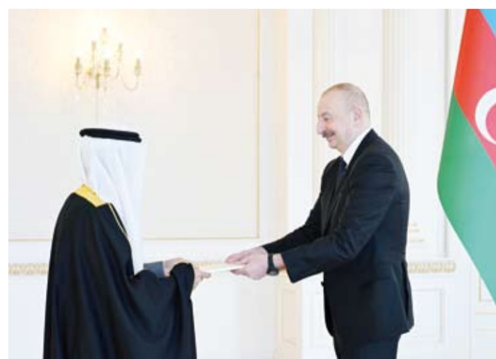
السفير محمد المطيري يقدم أوراق اعتماده إلى رئيس أذربيجان إلهام علفيف

عليه بنجاح أذربيجان في استضافة القمة العالمية لتغير المناخ (كوب 29) وتنظيمها. من جانبه أشاد الرئيس علفيف بحسب البيان بمستوى العلاقات السياسية بين البلدين واصفاً إيها بأنها متميزة. وأعرب عن تطلعه إلى تعزيز التعاون بين البلدين الصديقين في كل المجالات والأصعدة ثنائياً أو من خلال العمل متعدد الأطراف. كما أعرب عن تقدير جمهورية أذربيجان لمشاركة دولة الكويت في مؤتمر الأمم المتحدة لتغير المناخ ومستوى التمثيل العالي، حيث ترأس الوفد الكويتي المشارك ممثل صاحب السمو أمير البلاد الشيخ مشعل الأحمد سمو ولي العهد الشيخ صباح الخالد، ما يعكس حرص دولة الكويت واهتمامها بنجاح أذربيجان في تنظيم هذا المؤتمر المهم.