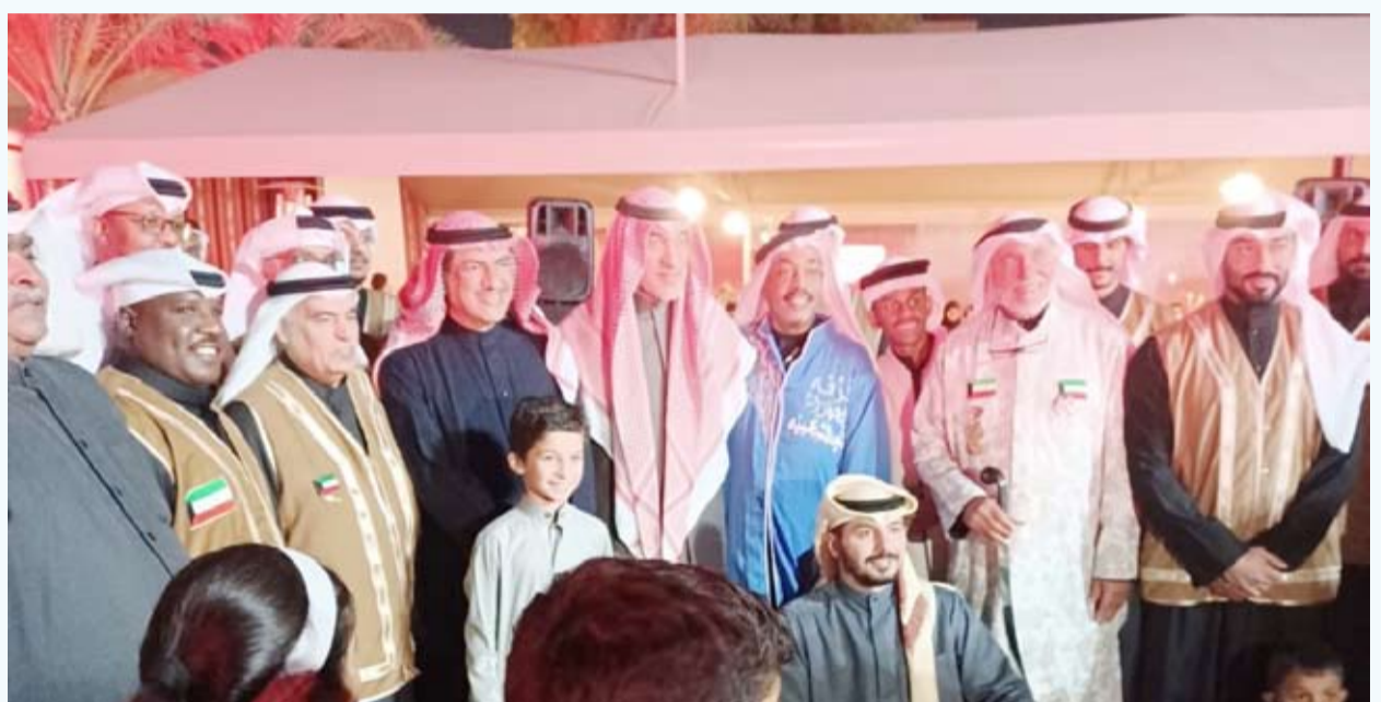
الشيخ فهد اليوسف خلال زيارة تفقدية للقصر الأحمر في الجبراء

قال نائب رئيس مجلس الوزراء وزير الدفاع ووزير الداخلية الشيخ فهد اليوسف أن سمو أمير البلاد حث الحكومة والمحافظين على ضرورة إنشاء مباركية جديدة في الجبراء وأخرى في الأحمدية، وإن شاء الله سنشهد افتتاحها قريباً. وخلال زيارته التفقدية إلى القصر الأحمر في الجبراء، أضاف اليوسف: نحتاج أن نطور هذا الموقع المهم وننظم فعاليات أكثر به، مؤكداً أنه أحد معالم الكويت البارزة، وأن مجلس الوزراء مهتم جداً بالمواقع التراثية بناءً على تعليمات سمو أمير البلاد. وقال اليوسف إن واجهة الجبراء البحرية سيتم تنفيذها قريباً وهذا حلم بالنسبة لأهالي الجبراء، مضيفاً: نتطلع لتشديد أكثر من نادي رياضي في الجبراء بعد توسع المحافظة، خاصة مع وجود المطلاع التي تعتبر مدينة لوحدها وتحتاج إلى نادي رياضي وخدمات خاصة بها، لكن هذا الشيء يحتاج إلى وقت.