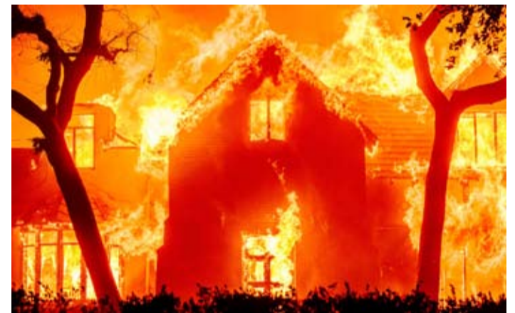
الحرائق خلفت 11 قتيلاً وانهيار عشرة آلاف مبنى

قال مكتب الطب الشرعي في مقاطعة لوس أنجلوس، بولاية كاليفورنيا الأميركية، إن عدد ضحايا حرائق الغابات بالمقاطعة ارتفع إلى 11 قتيلاً. ورغم تراجع قوة الرياح، فإن انتشار النيران مستمر في لوس أنجلوس، حيث لا تزال الحرائق خارج السيطرة في هذه المدينة الكبيرة. كما لحق دمار هائل بأجزاء كاملة من ثاني مدن الولايات المتحدة مع انهيار أكثر من 10 آلاف مبنى. كما اندلع حريق هائل في مبنى سكني بحي برونكس بمدينة نيويورك سرعان ما أتت بقوة الرياح على المباني المجاورة موقعا سبعة جرحى على الأقل. بدوره، قال الرئيس الأميركي جو بايدن خلال اجتماع في البيت الأبيض إن المشهد أشبه بساحة حرب وعمليات قصف.