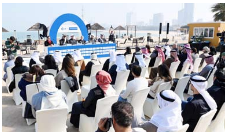
فعاليات بطولة KIB | The Stadium

للبطولة إلى جانب شركة سافكس المنظمة لها، على استكمال التخطيط والتنظيم لهذه البطولة بالتعاون مع أفضل الخبراء والمتخصصين في مجال تنظيم المسابقات الرياضية، حيث قاما بتشييد مضمار فرسية بمعايير عالمية على امتداد شاطئ المارينا، لتقديم تجربة فريدة وجديدة ومختلفة للمجتمع الكويتي، وللفرق المحلية والدولية المشاركة. وتقدم البطولة للفائزين في فعالياتها وتحدياتها جوائز مالية متنوعة من الرجال والسيدات.