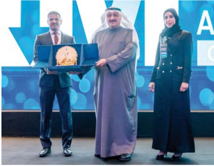
تكريم الوزر العوضي

وأضاف أن المركز يتميز بوجود جميع هذه التخصصات تحت سقف واحد مما يساهم في تحسين رعاية المرضى وتقديم خدمات مبتكرة مثل القسطرة الأولية للجملطات القلبية الصمام الأورطي بالقسطرة لأول مرة في الكويت بالإضافة إلى نجاح زراعة قلابين لأول مرة في البلاد.