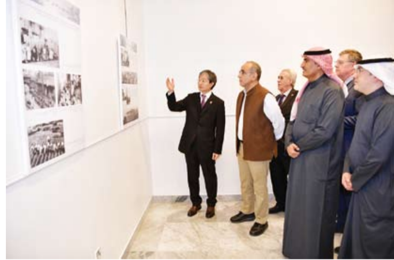
جولة في المعرض