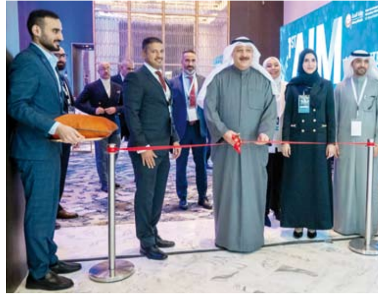
وزير الصحة يفتتح المعرض للمصاحب للمؤتمر

الأبهري عن طريق القسطرة لأول مرة في الكويت وزراعة بطاريات القلب بتقنيات حديثة. من جانبه قال رئيس قسم الباطنية