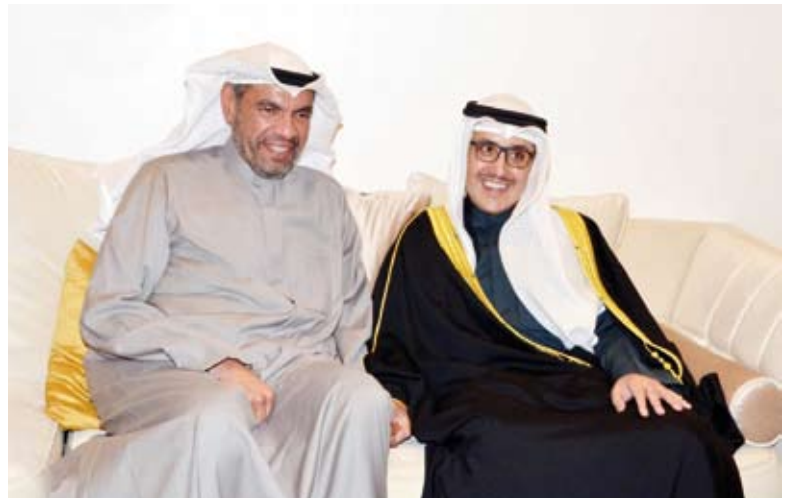
وزير الخارجية علي البحيا ووزير الخارجية السابق الشيخ أحمد ناصر المحمد

رياض عواد استقبل سفير سلطنة عمان لدى دولة الكويت د. صالح الخروصي المهني بالشهر الفضيل، حيث توافد عدد كبير من الشيوخ المعتمدين لدى البلاد وشخصيات عامة إلى ديوانية السفارة. وأوضح في تصريح للصحافيين أن الديوانية أصبحت جزءاً من العرف الدبلوماسي، كما هو الحال في الكويت، حيث تعد الديوانية تقليداً أصيلاً يعكس قيم التأخي والتواصل الاجتماعي بين أفراد المجتمع. وأشار السفير العماني إلى أن هذه الديوانية الرمضانية تأتي في إطار استقبال المهنيين بحلول الشهر الفضيل، سائلاً الله عز وجل أن يعيده على الأمنين العربية والإسلامية بالخير واليمن والبركات. وحول مستجدات العلاقات الثنائية بين سلطنة عمان ودولة الكويت، أكد السفير