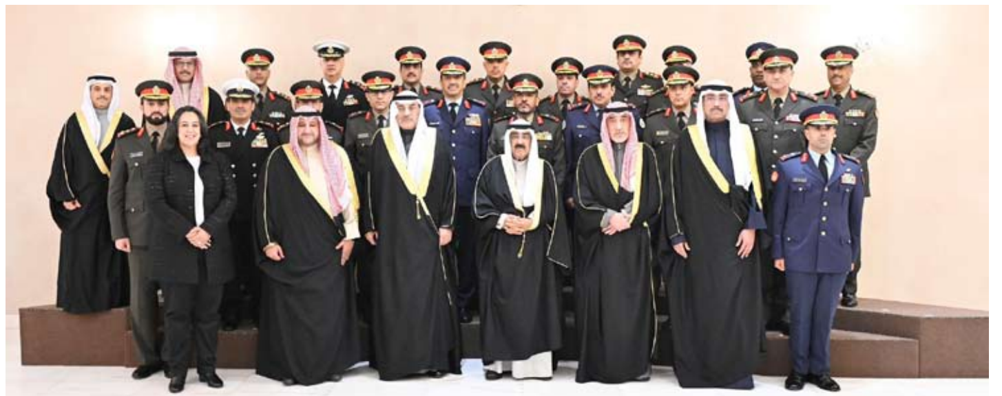
سمو الأمير وسمو ولي العهد يتوسطان قادة وزارة الدفاع