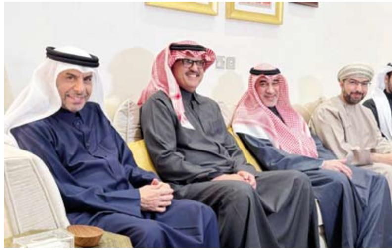
السفير الخروصي ووزير الداخلية والسفير السعودي والسفير القطري