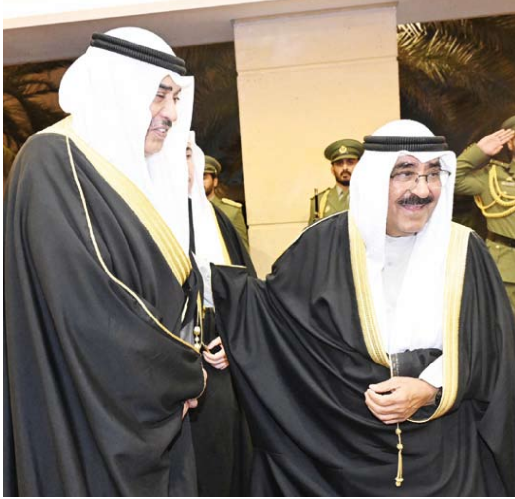
سمو أمير البلاد وسمو ولي العهد خلال زيارة رئاسة الحرس الوطني