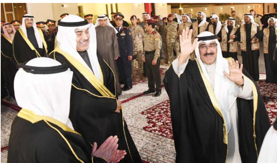
سمو الأمير يحيي الحضور