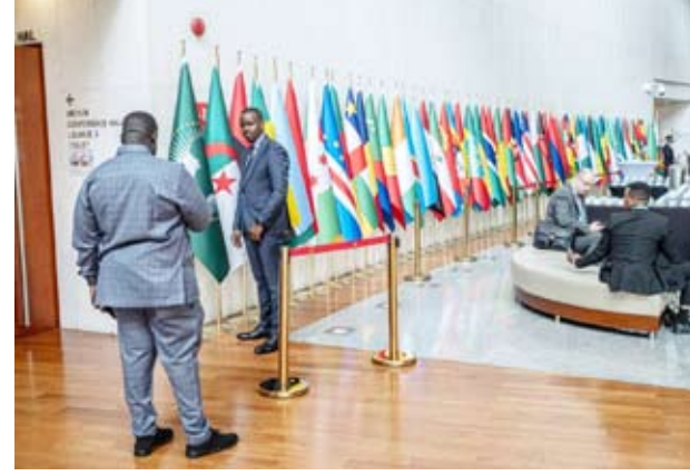
اعلام دول «الاتحاد الأفريقي»

تصحیح مسار المفاوضات نحو القيام بدورها المطلوب في إيجاد الحلول الناجعة للقضايا الأفريقية. وبحث الجانبان تطورات الأوضاع العسكرية والمسار السياسي في السودان، ولف السودان في الاتحاد الأفريقي ومنظمة «إيجاد»، وفق إعلام مجلس السيادة السوداني.