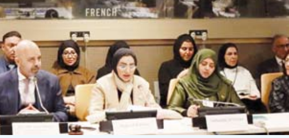
د. أمثال الحويلة خلال إلقاء كلمتها

أكدت وزير الشؤون الاجتماعية وشؤون الأسرة والطفولة، الدكتورة أمثال الحويلة، أن المرأة الخليجية تؤدي دوراً محورياً في مجال التطور التكنولوجي، لافتة إلى تمكن العديد من النساء من تجاوز التحديات التقليدية والمشاركة بفعالية في مجال العلوم والتكنولوجيا والابتكار. جاء ذلك في كلمة ألقاها الحويلة أثناء فعالية جانبية نظمها دولة الكويت بصفتها رئيس الدورة الحالية لمجلس التعاون لدول الخليج العربية على هامش أعمال الدورة الـ 69 للجنة وضع المرأة في الأمم المتحدة بعنوان "المرأة في المجال التكنولوجي" قصص ملهمة.