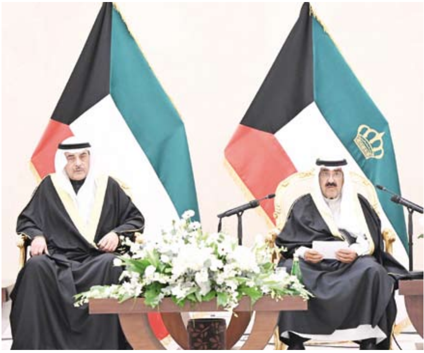
أمير البلاد متحدثاً

◆ سمو الأمير: نخر ونعز بقواتنا المسلحة الدرع الحصين في حفظ استقلال واستقرار وأمن وأمان وطننا العزيز ◆ نحرص على تعزيز كفاءة وقدرات قواتنا المسلحة وتمكينها من القيام بواجبها المقدس في حماية الوطن والدفاع عنه