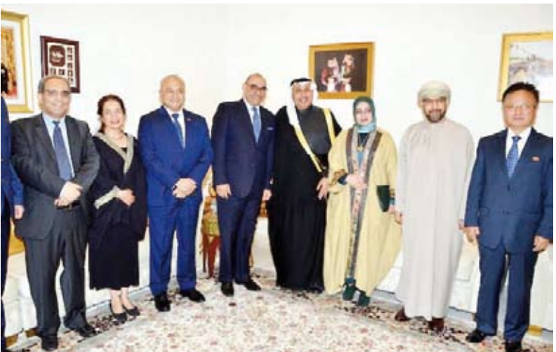
ويتوسط وزير الدفاع السابق وعدد من السفراء

رياض عواد استقبل سفير سلطنة عمان لدى دولة الكويت د. صالح الخروصي المهني بالشهر الفضيل، حيث توافد عدد كبير من الشيوخ المعتمدين لدى البلاد وشخصيات عامة إلى ديوانية السفارة. وأوضح في تصريح للصحافيين أن الديوانية أصبحت جزءاً من العرف الدبلوماسي، كما هو الحال في الكويت، حيث تعد الديوانية تقليداً أصيلاً يعكس قيم التأخي والتواصل الاجتماعي بين أفراد المجتمع. وأشار السفير العماني إلى أن هذه الديوانية الرمضانية تأتي في إطار استقبال المهنيين بحلول الشهر الفضيل، سائلاً الله عز وجل أن يعيده على الأمنين العربية والإسلامية بالخير واليمن والبركات. وحول مستجدات العلاقات الثنائية بين سلطنة عمان ودولة الكويت، أكد السفير