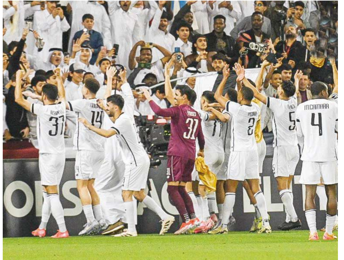
فرحة لاعبي السد بالتاهل

تاهل النصر السعودي إلى الدور ربع النهائي من بطولة دوري أبطال آسيا للنخبة، بعد تغلبه على ضيفه الاستقلال الإيراني بثلاثة أهداف دون رد، في المباراة التي أقيمت بينهما، في إياب الدور ثمن النهائي للبطولة. وكانت مباراة الذهاب في إيران قبل أسبوع، قد انتهت بالتعادل السلبي بين الفريقين. أحرز أهداف النصر كل من الكولومبي جون دوران هدفين، والبرغالي كريستيانو رونالدو من ركلة جزاء في الدقائق (9 و27 و84). جاءت المباراة متوسطة المستوى وسيطر النصر على العديد من فتراتها، ونجح في حسم أموره مبكراً بعدما سجل هدفين قبل مرور نصف ساعة على بداية اللقاء. وحاول الفريق الإيراني العودة للمباراة ونظم العديد من الهجمات لكن كل محاولاته باءت بالفشل، ووضح تأثره بالنقص العددي بعد طرده لاعبهم مهران أحمدفي في نهاية الشوط الأول. في المقابل، حافظ الفريق السعودي على تقدمه خلال الشوط الثاني قبل أن ينجح في إضافة الهدف الثالث قبل دقائق من انتهاء المباراة. يشار إلى أن الأدوار النهائية من دوري أبطال آسيا للنخبة ستقام بنظام التجمع اعتباراً من الدور ربع النهائي، وذلك في مدينة جدة السعودية.