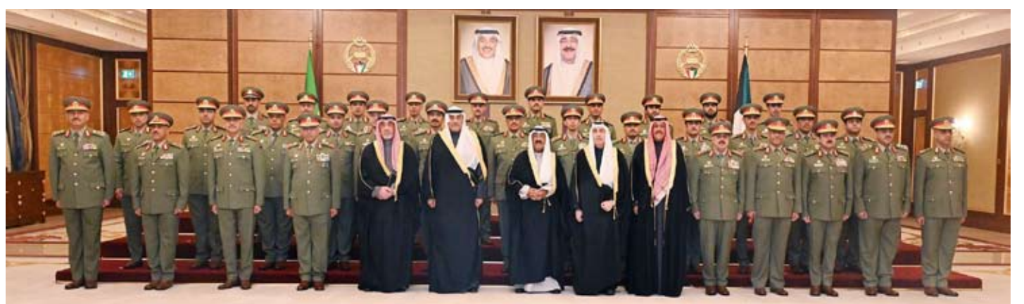
سمو الأمير وسمو ولي العهد خلال زيارة «الحرس الوطني»