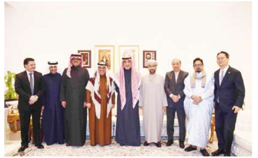
اليوسف والخروصي مع مجموعة من السفراء