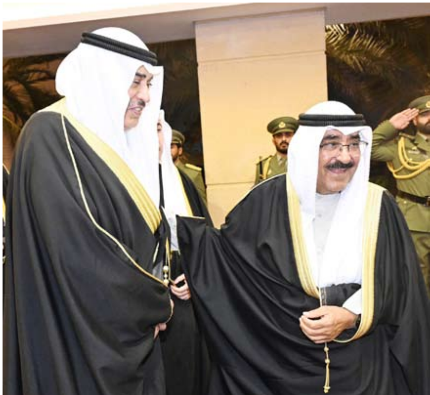
سمو الأمير وسمو ولي العهد