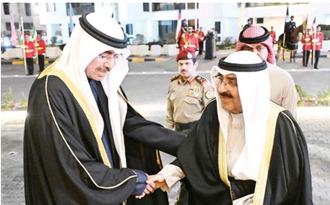
وزير الدفاع مرحباً بسمو أمير البلاد