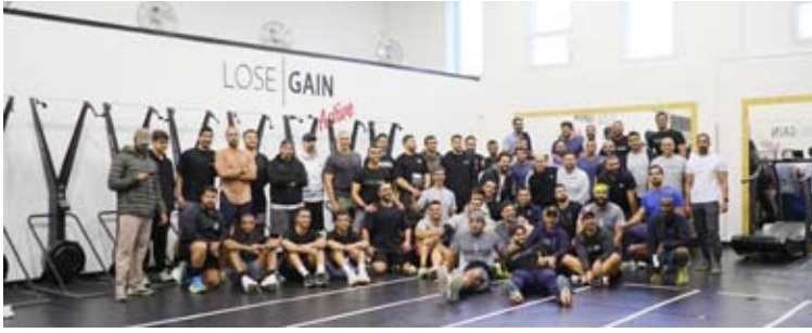
مشاركون في التحدي بنادي Lose Gain

جائزة بقيمة 750 دينار، وفاز الفريق الثالث بجائزة بقيمة 450 ديناراً، إلى جانب جوائز أخرى قيمة.