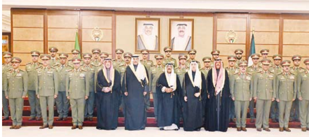
سمو الأمير وسمو ولي العهد خلال زيارة الحرس الوطني