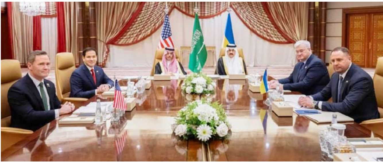
خلال المباحثات في جدة

، والتقى ولي العهد السعودي، استعداداً لمباحثات مع مسؤولين أميركيين حول إنهاء الحرب الروسية - الأوكرانية. وقال زيلينسكي عن لقائه مع الأمير محمد بن سلمان: «ناقشنا جميع المسائل الرئيسية المدرجة على جدول الأعمال، سواء على المستوى الثنائي أو في إطار التعاون مع الشركاء الآخرين. وأشارت إلى الجهود التي يبذلها (ولي العهد) والتي تسهم في تقريب السلام الحقيقي. توفر المملكة العربية السعودية منصة دبلوماسية ذات أهمية كبيرة، ونحن نقدر ذلك».