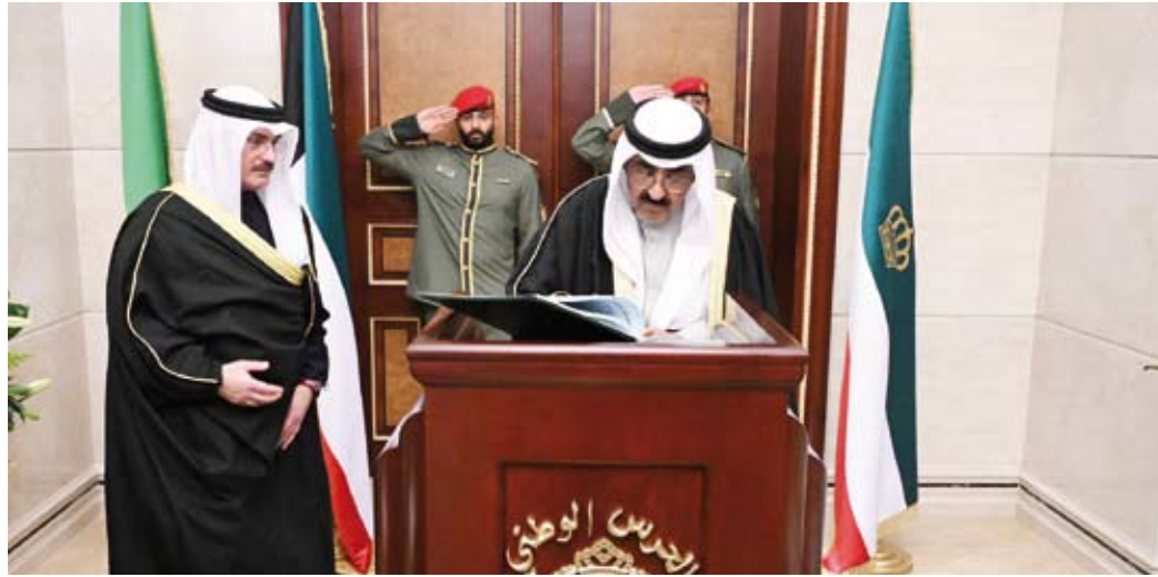
أمير البلاد يوقع على سجل الشرف