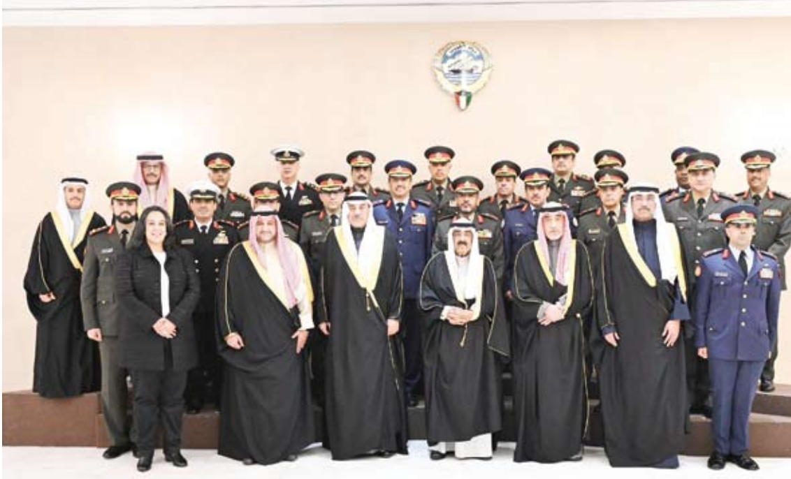
سمو الأمير وسمو ولي العهد خلال زيارة وزارة الدفاع