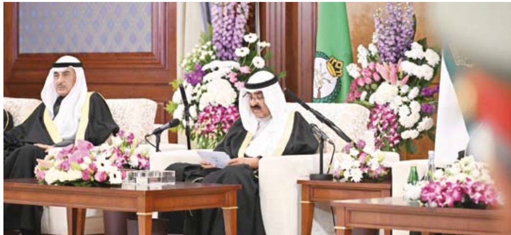
أمير البلاد متحدثاً