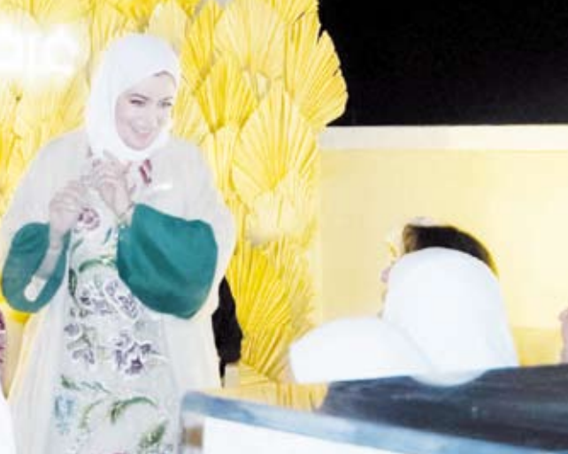
وحوار مع الأمهات المشاركات