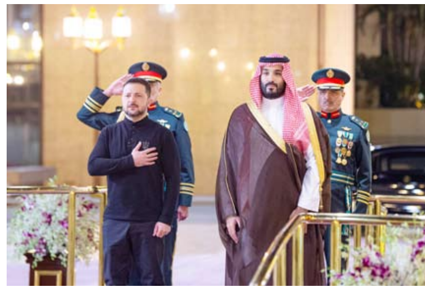
ولي عهد السعودية ورئيس أوكرانيا خلال لقائهما مساء أمس الأول في جدة

بحث ولي العهد السعودي رئيس مجلس الوزراء الأمير محمد بن سلمان أمس الأول مع الرئيس الأوكراني فولوديمير زيلينسكي آخر المستجندات وتطورات الأزمة الأوكرانية، وذلك بقصر السلام في جدة. وقالت وكالة الأنباء السعودية أن ولي العهد أكد حرص المملكة ودعمها لكافة المساعي والجهود الدولية الرامية لحل الأزمة والوصول إلى السلام فيما أعرب الرئيس الأوكراني عن الشكر والتقدير للجهود التي تبذلها المملكة منوهاً بدورها المحوري في منطقة الشرق الأوسط والعالم.