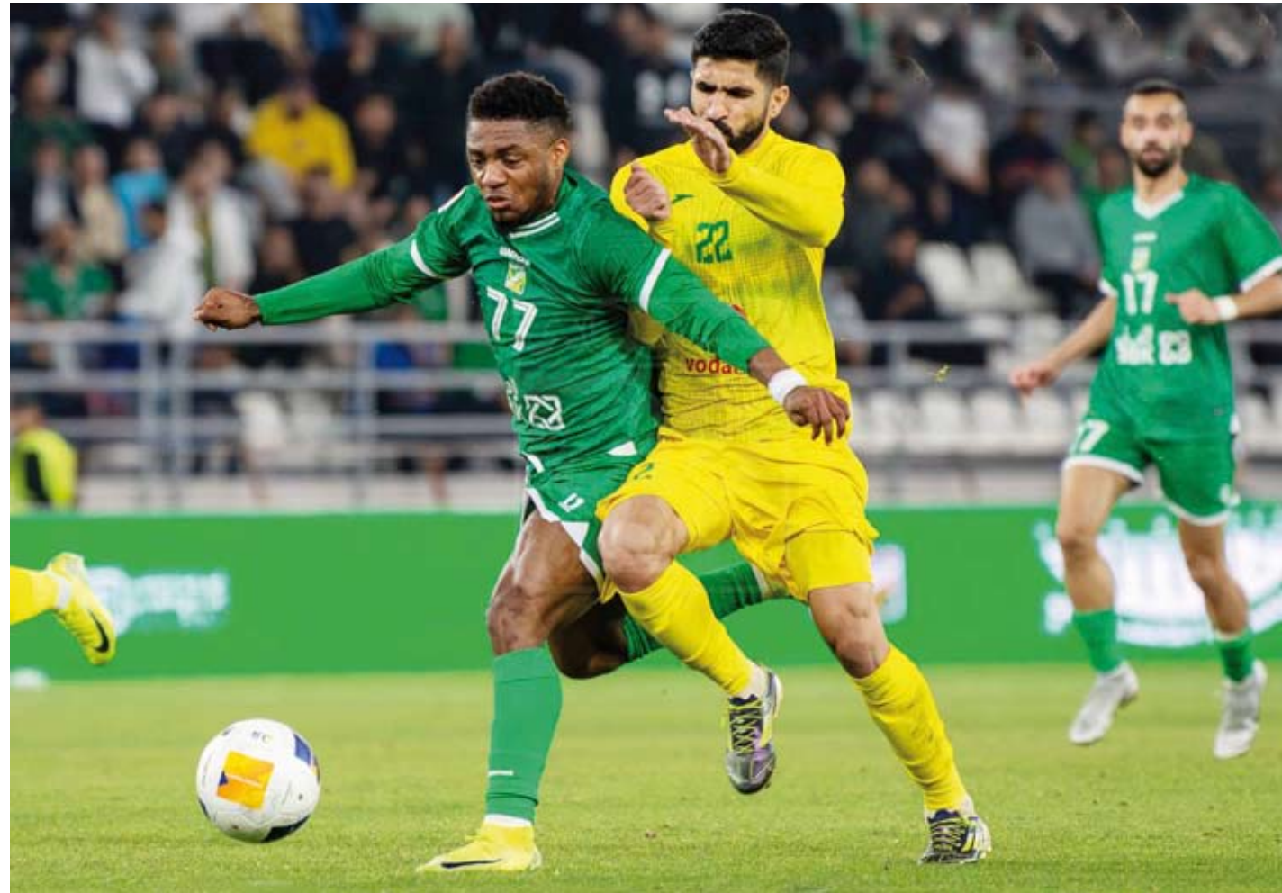
فرحة لاعبي العربي بهدف السلامة في شباك السيب بمباراة الذهاب