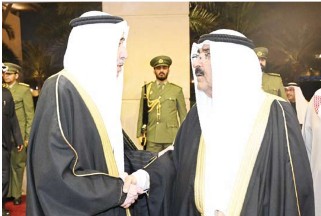
رئيس الحرس الوطني مرحباً بحضور سمو أمير البلاد

يسرنا في هذه الليلة الطيبة من شهر رمضان المبارك، أن نلتقي وأخي سمو ولي العهد الشيخ صباح خالد الحمد الصباح، ورئيس مجلس الوزراء بالإنيابة الشيخ فهد الجبير الصباح، والإخوة المرافقون: لنهني كافة منتسبي الحرس الوطني بشهر الخير والطاعات، الذي تتضاعف فيه الحسنات، وترفع فيه الدرجات... أعاده الله عليكم وعلى وطننا العزيز وأمتنا الإسلامية والعربية بالخير واليمن والبركات.