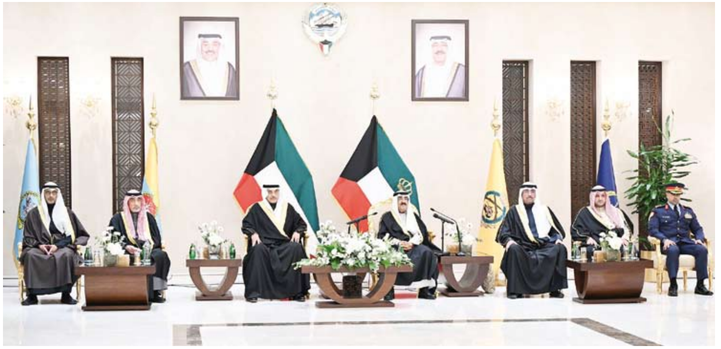
سمو أمير البلاد خلال زيارته وزارة الدفاع