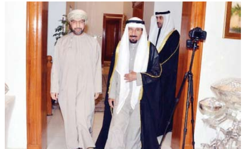
السفير الخروصي مستقبلاً الشيخ علي جابر الأحمد