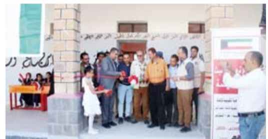
افتتاح ثانوية النهضة

افتتحت الجمعية الكويتية للإغاثة مدرسة الفاروق في مديرية طور الباحة بمحافظة لحج وثانوية النهضة في مديرية الشمايتين بمحافظة تعز، ضمن حملة «الكويت بجانيك»، في خطوة تجسد التزام الكويت بدعم قطاع التعليم في اليمن وتعزيز استدامته.