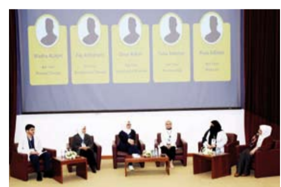
جانب من الملتقى