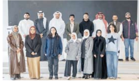
المشاركون في البرنامج التدريبي

المقابلات والمقدمات والإماكن وكيفية التعامل مع الصوت بشكل احترافي. وبين أن الهدف الرئيسي من البرنامج تمثل في رفع كفاءة العاملين بالمجال الإعلامي وتعزيز قدراتهم على تقديم محتوى إعلامي يلبق بالمستوى المطلوب في وقت عكس التفاعل الكبير من المشاركين حرصهم على تطوير مهاراتهم وتوسيع آفاقهم المهنية.