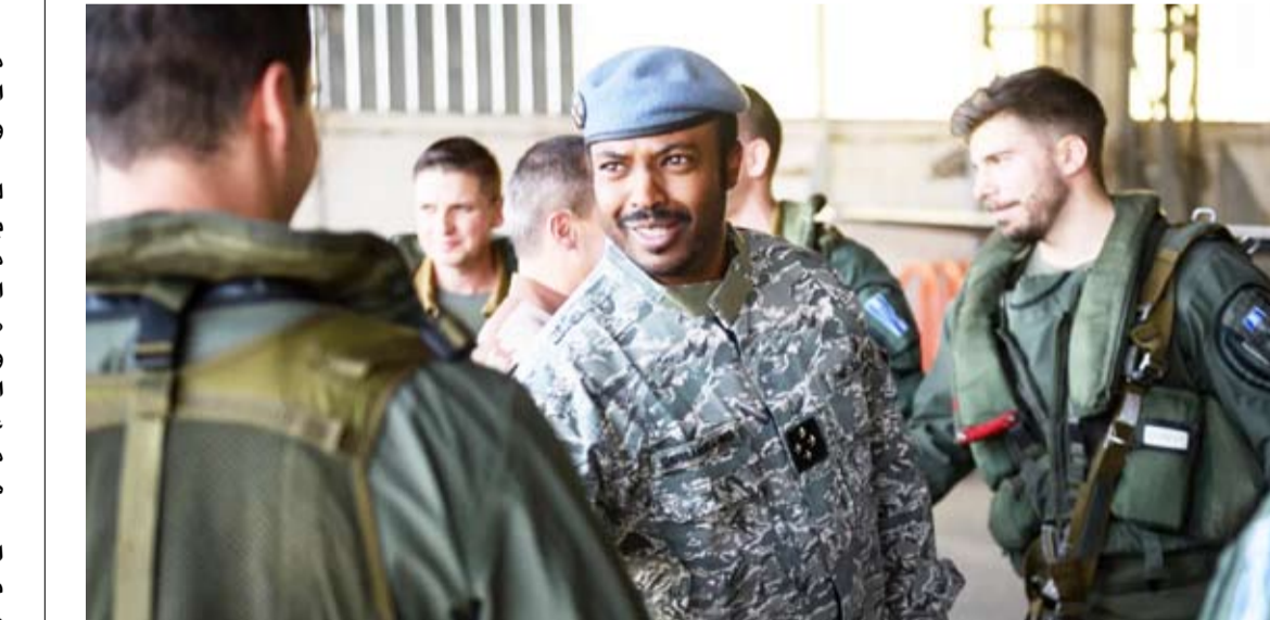
جنود فرنسيون يودعون أقرانهم التشاديين

السياسة أكثر من مرة، خصوصاً حين حاصر المتمردون القادمون من الشمال الرئيس الراحل إيريس ديبي في 2006 و2019. في حدود منتصف نهار، كان الجنود الفرنسيون في قاعدة «غوسي» العسكرية في عاصمة تشاد أنجمينا، يتبادلون الابتسامات الباهتة مع أقرانهم التشاديين، فطغت على أجواء الوداع حميمية مصطنعة، وهم يستعدون لركوب طائرات «الميراج»، في رحلة نهاب دون عودة، نحو فرنسا. رفع الطيار العسكري الفرنسي يده بتحية عسكرية صارمة، من وراء زجاج طائرته النفاثة، وألقى نظرة أخيرة، ثم حلق عالياً لتكون بذلك بداية انسحاب