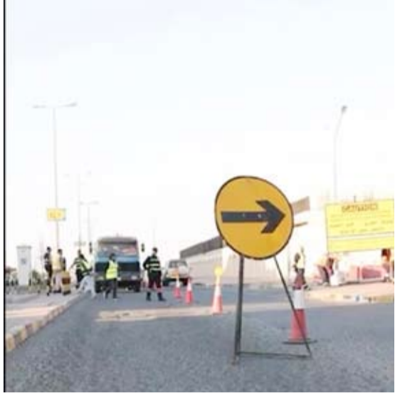
صيانة احد الشوارع

الفرق المعنية بالوزارة تشرف وتتابع وتراقب تنفيذ أعمال الصيانة