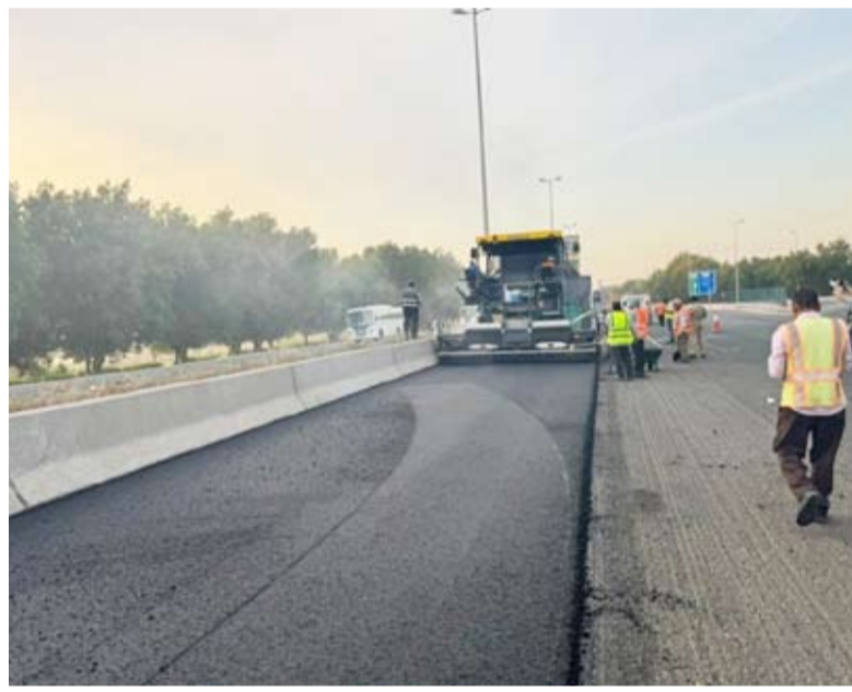
صيانة شوارع الفروانية