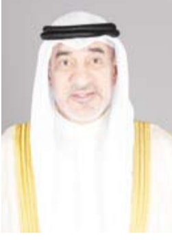
الشيخ فهد اليوسف

وأشار البيان إلى سحب الجنسية الكويتية وفقاً للمادة (13) فقرة (1) من قانون الجنسية الكويتية رقم (15) لسنة 1959م وتعديلاته غش وأقوال كاذبة (تزوير) ومن يكون قد اكتسبها معهم بطريق التبعية وعددهم (16) حالة الحاصلين عليها وفقاً للمادة السابعة. كما قررت اللجنة سحب الجنسية الكويتية وفقاً للمادة (13) فقرة (4) من قانون الجنسية الكويتية رقم (15) لسنة 1959م (مسادة نامتة) وتعديلاته وعددهم (2863) حالة ينتمون إلى 54 دولة مختلفة.