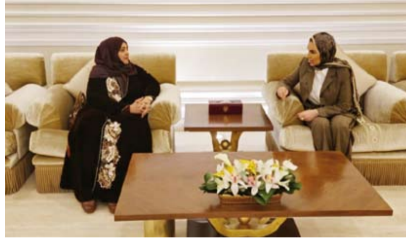
د. أمثال الحويلة تتلقى نظيرتها العمانية

بحثت وزير الشؤون الاجتماعية وشؤون الأسرة والطفولة الدكتورة أمثال الحويلة، أول أمس، مع وزير التنمية الاجتماعية بسلطنة عمان الدكتورة ليلي النجار سبل تعزيز التعاون المشترك. وقالت وزارة الشؤون الاجتماعية في بيان صحفي: إن اللقاء يأتي ضمن الجهود الرامية إلى تبادل الخبرات وتعزيز التنسيق بين الجانبين