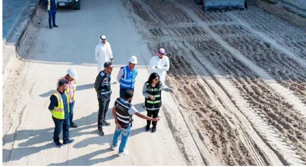
المشعان تتابع أحد المشاريع