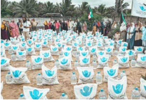
جانب من تجهيز المساعدات لتوزيعها

يذكر أن نماء الخيرية تُنفذ مشاريع إغاثية متنوعة في العديد من الدول التي تشهد كوارث طبيعية أو أزمات، حيث باتت بصمة الكويت واضحة في الساحة الإنسانية الدولية؛ ما يعزز مكانتها كأحد أبرز أقطاب العطاء الإنساني في العالم.