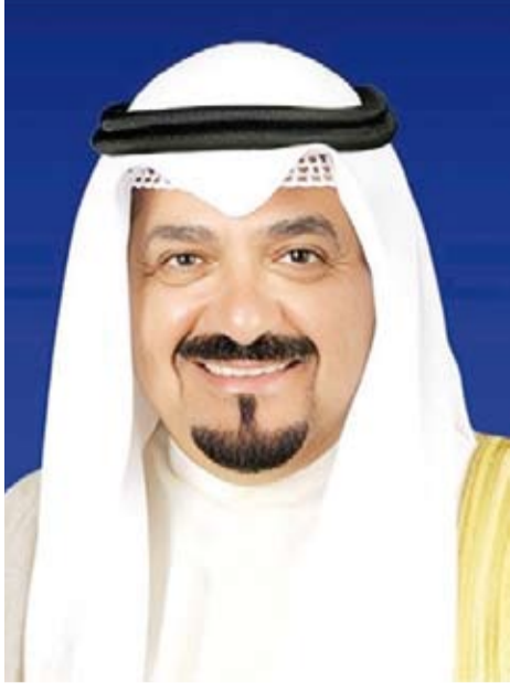
سمو الشيخ أحمد العبد الله