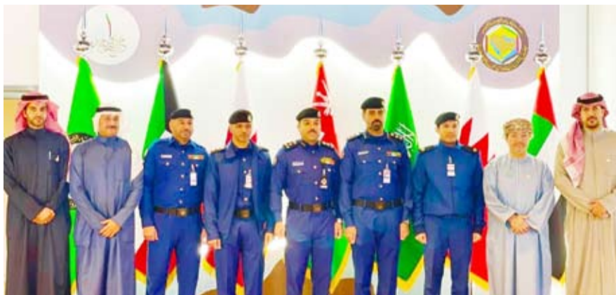
وفد قوة الإطفاء أثناء الزيارة