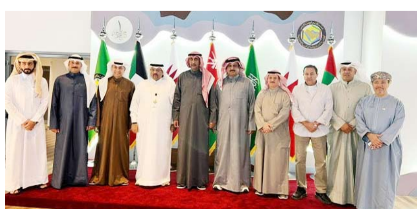
وفد الضباط المتقاعدين

قام رئيس وأعضاء مجلس إدارة جمعية الضباط المتقاعدين بزيارة جناح الأمانة العامة لمجلس التعاون لدول الخليج العربية في مركز الشيخ عبدالله السالم الثقافي بدعوة كريمة من القائمين على الجناح والذي يتميز بتوثيق مسيرة مجلس التعاون، حيث انطلق الجناح بالتزامن مع استضافة دولة الكويت للقمم الخليجية الخامسة والأربعون.