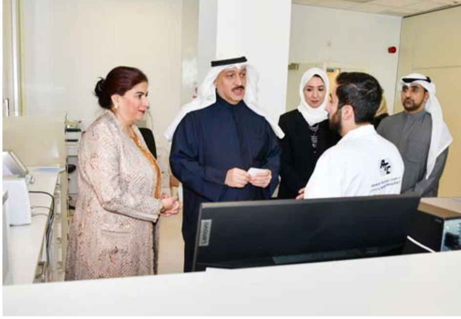
وزير الصحة يستمع إلى شرح لكيفية عمل النظام الجديد