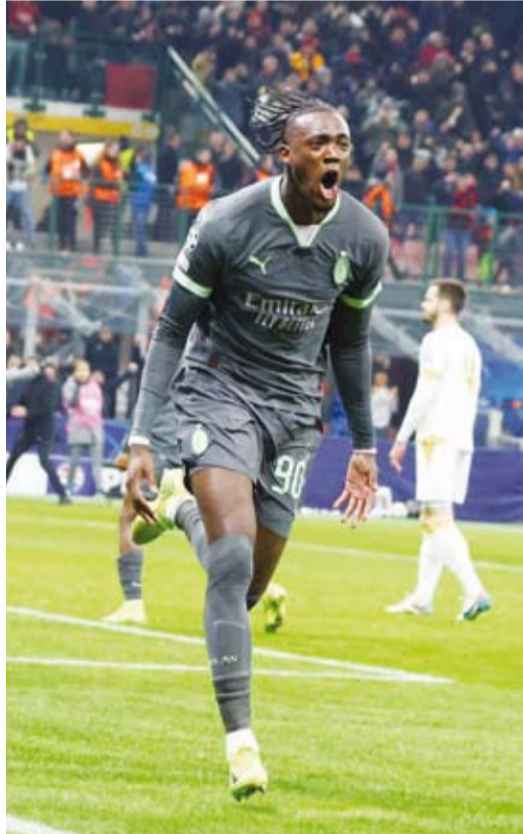
فوز رابع على التوالي لميلان

سجل تامي أبراهام هدفا متاخرا ليمنح ميلان فوزا متخييرا 2-1 على ضيفه رد ستار بلجراد في سان سيرو ليحقق انتصاره الرابع على التوالي معززًا أماله في احتلال أحد المراكز الثمانية الأولى وضمن التأهل مباشرة إلى دور الستة عشر لدوري أبطال أوروبا لكرة القدم. وكان رد ستار قريبا من التقدم عندما سدده أندريا ماكسيموفيتش في العارضة قبل أن يفتتح رافائيل لياو التسجيل لصاحب الأرض في الدقيقة 42 بعدما سيطر بشكل رائع على تمريرة طويلة من يوسف فوفانا بقدمه اليمنى قبل أن يضعها في الشباك بتسديدة رائعة بقدمه اليسرى. وأدرك نيمانيا رادونيتش، الذي سجل هدفين عندما عوض فريقه تأخره بهدف ليفوز 5-1 على شتوتجارت، التعادل في الدقيقة 67 بعدما استلم الكرة خارج منطقة الجزاء وأطلق تسديدة قوية مرت من فوق الحارس مايك ميبينان.