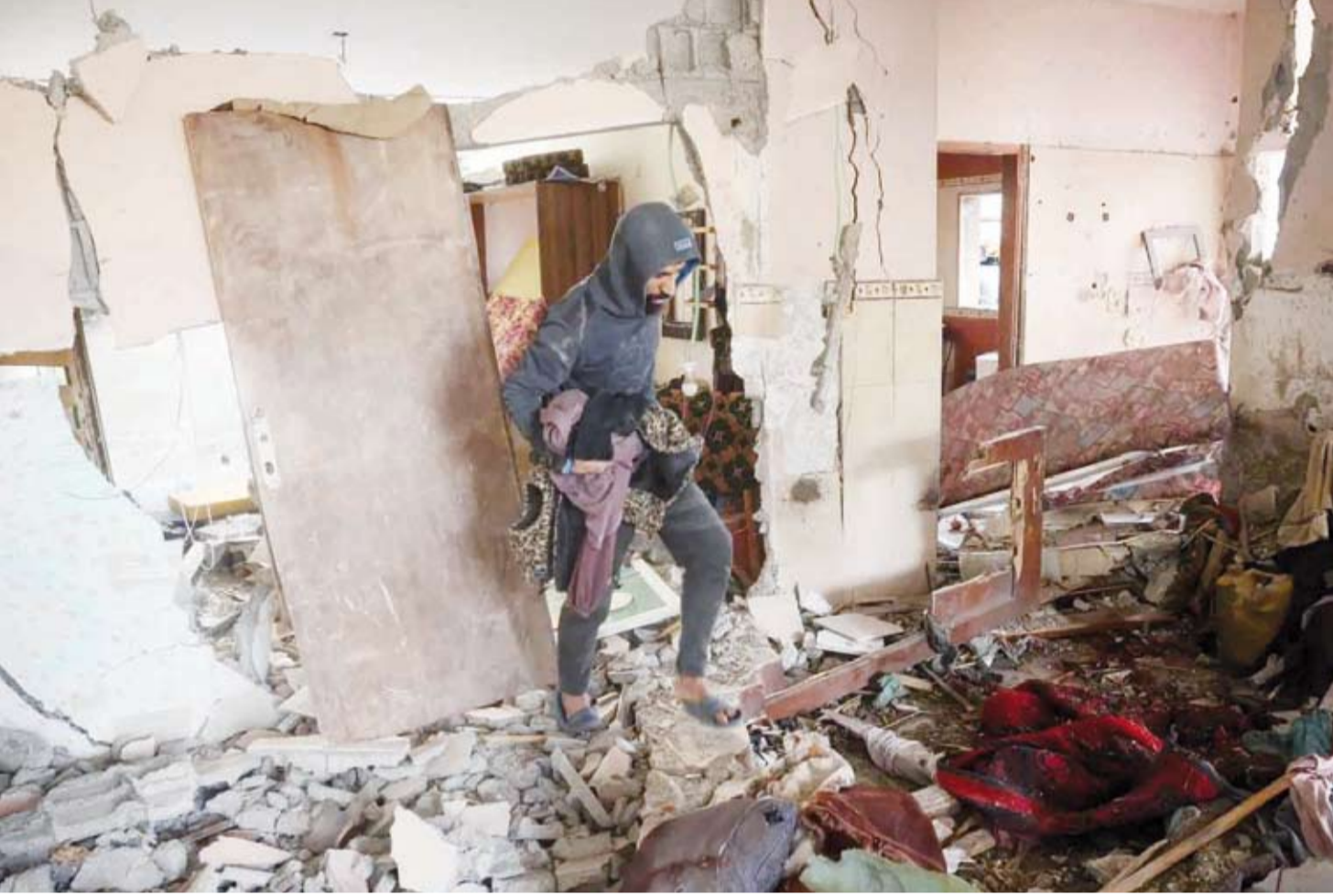
الدمار في منزل بمخيم النصيرات

جولة مرتقبة لمستشار الأمن القومي الأميركي، جاك سوليفان، إلى منطقة الشرق الأوسط، تشمل مصر وإسرائيل وقطر، تستكمل لقاءات ومساعي الوساطة بشأن إبرام هدنة في قطاع غزة وتبادل الرهائن والأسرى. الحديث عن جولة سوليفان يأتي غداة زيارة وفد إسرائيلي رفيع المستوى للقاهرة، ضمن «تحركات مكثفة» للوساطة بعد حالة ركود شهدتها المفاوضات لأسابيع، التي «عاد لها الزخم» مع انتخاب دونالد ترامب، وفق خبراء تحدثوا لـ«الشرق الأوسط»، معتقدين أن فرص إبرام اتفاق هدنة «تضاعفت»، وباتت أقرب من أي وقت مضى، خاصة في ظل مهلة الرئيس الأميركي المنتخب بإتمامها، قبل وصوله للسلطة في 20 يناير المقبل. وأفاد موقع «أكسيوس» الأميركي، بأن سوليفان سيوجه إلى إسرائيل ومصر وقطر، في محاولة للتوصل لاتفاق بشأن الرهائن، ووقف إطلاق النار في غزة، ويلتقي رئيس الوزراء بنيامين نتنياهو. ويخطط سوليفان بعد ذلك للسفر إلى القاهرة والدوحة للقاء الزعماء المصريين والقطريين ومناقشة جهود الوساطة التي يبذلونها، وفق ما ذكر شون سافيت، المتحدث باسم مجلس الأمن القومي بالبيت الأبيض، لوقع «أكسيوس».