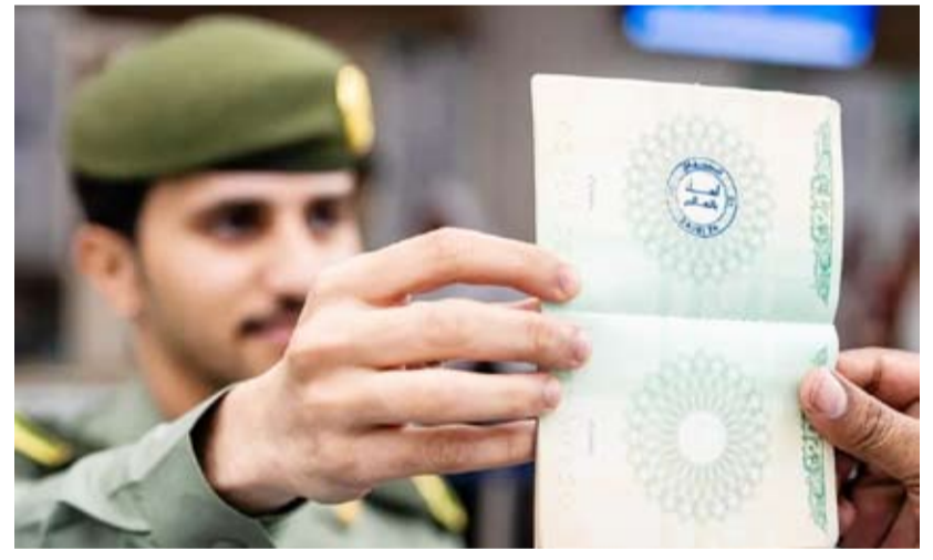
الملكة ترحب بالزائرين بطريقة موندالية

ابتكرت وزارة الداخلية السعودية فكرة مميزة بالتنسيق مع المديرية العامة للجوازات ووزارة الرياضة، بوضع ختم خاص تحت مسمى «أهلاً بالعالم» على جوازات سفر جميع المسافرين الذين سيوزعون المملكة، بمناسبة فوز البلاد بشرط تنظيم بطولة كأس العالم 2034. وأكدت الوزارة أن الختم سيُتاح للمسافرين عبر منافذ المملكة الدولية، حيث تهدف هذه الخطوة إلى الترويج للمونديال، وللإشارة إلى ما تمر به السعودية من تطور على كافة الأصعدة.