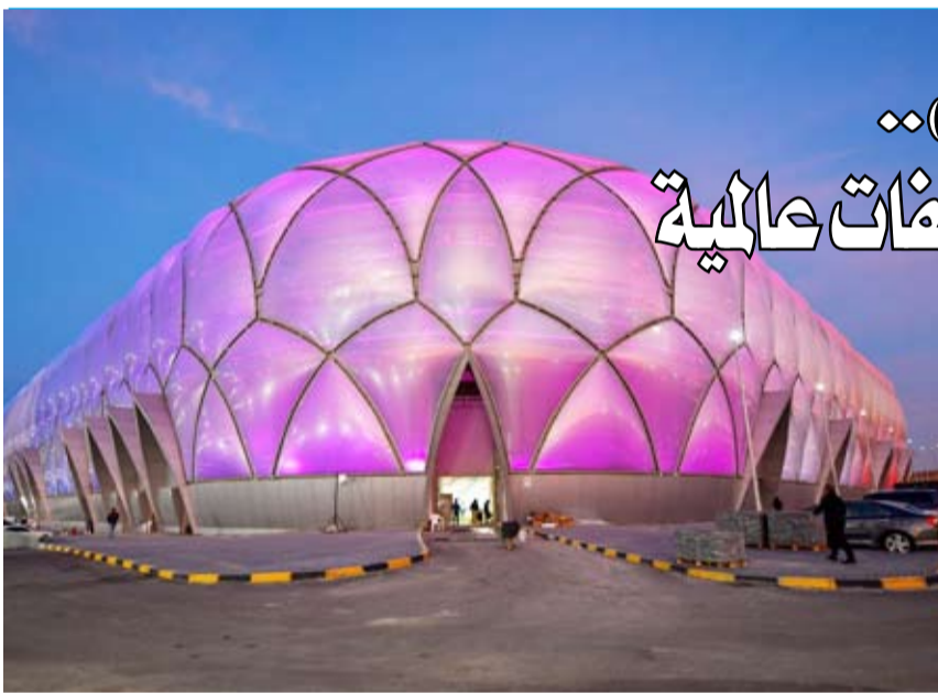
استاد جابر المبارك الصباح بنادي الصليبيخات

يعد استاد جابر المبارك الصباح بنادي الصليبيخات الذي افتتح في وقت سابق صرحاً رياضياً بمواصفات عالمية إذ يتميز بإطلالة بحرية وتصميم فريد من نوعه في دولة الكويت مستوحى من ملاعب كرة القدم العالمية فهو يأتي من دون مضمار.