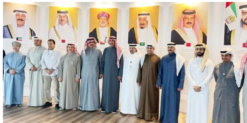
وفد جمعية الضباط المتقاعدين في جناح مجلس التعاون