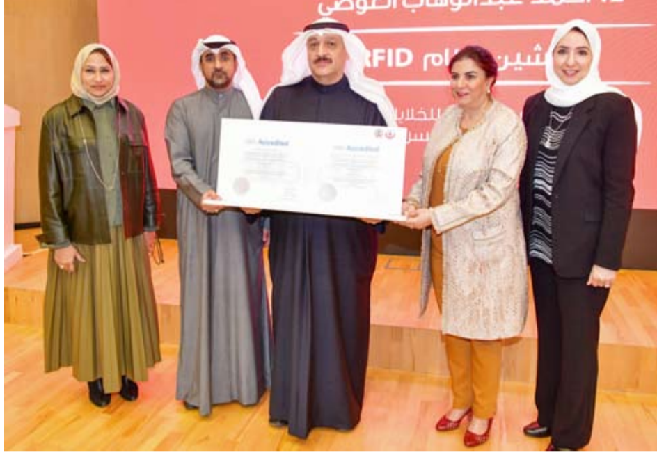
تكريم وزير الصحة د. أحمد العوضي

أكد وزير الصحة، الدكتور أحمد العوضي، أن تدشين نظام تحديد الهوية بموجات الراديو (RFID) يمثل نقلة نوعية في إدارة عمليات نقل الدم ومشتقاته، إذ يتيح تتبعاً دقيقاً لسلسلة الإمداد من المتبرع إلى المستشفى ما يعزز الثقة بسلامة منتجات الدم والمرضى.