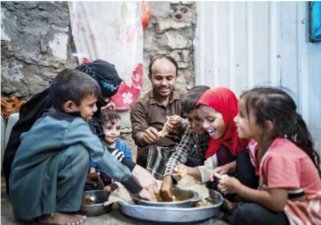
نقص في التمويل من الأمم المتحدة