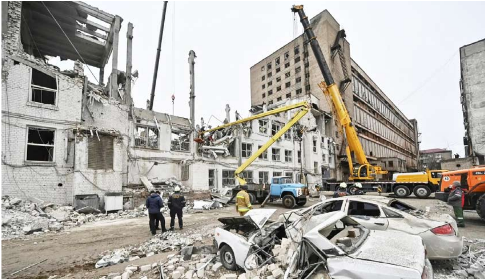
اضرار جسيمة بسبب ضربة صاروخية في زابورجيا