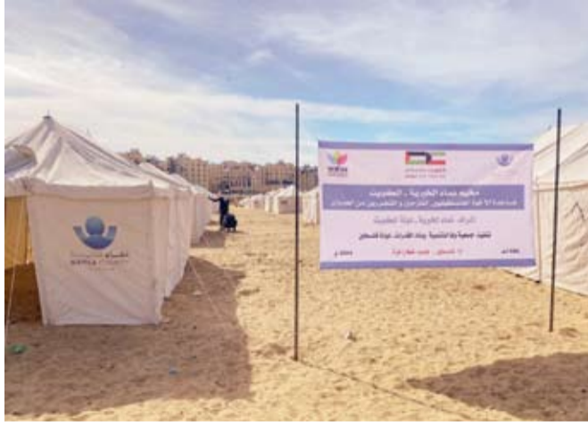
المخيم الذي أقامته نماء الخيرية في قطاع غزة

المخيم المجهزة بالبيانات ومرافق المياه بما يضمن توفير الحد الأدنى من مقومات الحياة الكريمة لتلك العائلات. وأكد عطاونة أن افتتاح المخيم يعكس التزام جمعية (نماء الخيرية) بدعم الشعب الفلسطيني والوقوف إلى جانبه في كل الظروف الصعبة، مشيراً إلى أن المشروع لن يكتمل لولا دعم المتبرعين الكرام في دولة الكويت الذين جسّدوا أسمى معاني الإخاء الإنساني.