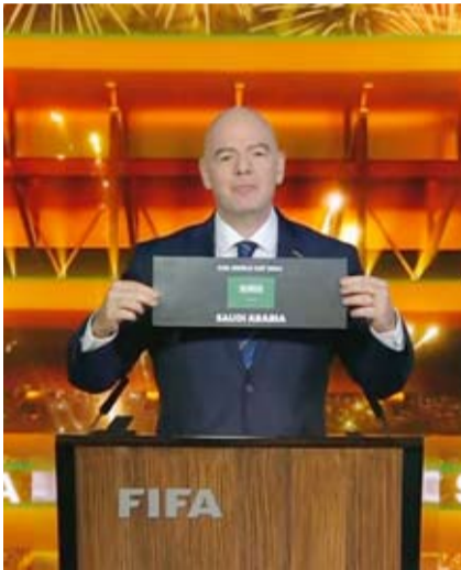
رئيس الفيفا يعلن رسمياً استضافة السعودية لمونديال 2034

أكد وزير الإعلام والثقافة ووزير الدولة لشؤون الشباب عبدالرحمن المطيري أن فوز المملكة العربية السعودية بتنظيم بطولة كأس العالم لكرة القدم (مونديال 2034) بشكل منفرد والمملكة المغربية الشقيقة (مونديال 2030) بالشراكة مع إسبانيا والبرتغال يعد إنجازاً عربياً كبيراً.