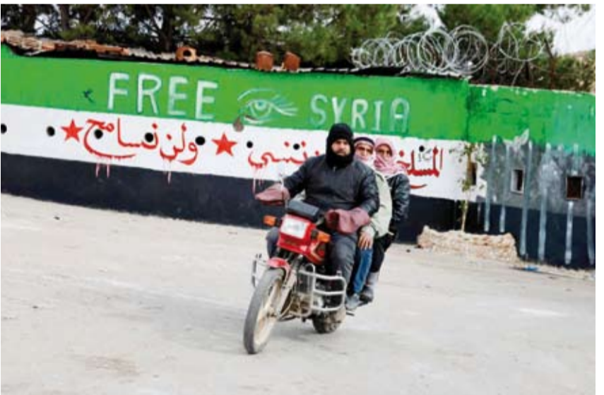
سوريون خارج سجن صيدنايا

تفرض إدارة العمليات العسكرية في سوريا بقيادة أحمد الشرع المكنى «أبو أحمد الجولاني» سلطتها على الدولة السورية بنفس السرعة الخاطفة التي سيطرت بها على البلاد؛ ففي غضون أيام قليلة نشرت شرطة، وسلمت السلطة لحكومة مؤقتة، وعقدت اجتماعات مع مبعوثين أجانب، مما يثير مخاوف بشأن ما إذا حكام دمشق الجدد سيلتزمون بعدم إقصاء أحد.