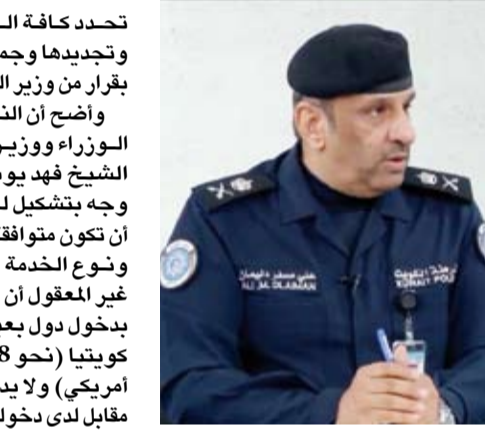
اللواء علي العدواني

تحدد كافة الرسوم المتعلقة بالإقامة وتجديدها وجميع أنواع سمات الدخول بقرار من وزير الداخلية. وأوضح أن النائب الأول لرئيس مجلس الوزراء ووزير الدفاع وزير الداخلية الشيخ فهد يوسف سعود الصباح قد وجه بتشكيل لجنة لبحث الرسوم على أن تكون متوافقة مع دخل الشخص المقيم ونوع الخدمة المقدمة مستدركاً أنه من غير المعقول أن يسمح للمواطن الكويتي بدخول دول بعينها لقاء 70 أو 80 ديناراً كويتياً (نحو 227ر3 و260ر3 دولار أمريكي) ولا يدفع رعايا تلك البلدان أي مقابل لدى دخولهم دولة الكويت. ولفت إلى أن (القانون) تضمن عقوبات مشددة بحق المتجاوزين في تسهيل استخدام الأجنبي إذ حظر الإتجار بالإقامة عن طريق استغلال استخدام أو تسهيل استخدام أجنبي بموجب سمة دخول أو ترخيص إقامة أو تجديدها نظير مبالغ مالية أو منفعة سواء كان هذا الاستخدام أو التجديد لعمل حقيقي أو وهمي أو مزعوم أو لتشغيل الأجنبي لدى المتقدم أو لدى الغير من دون ترخيص أو بالمخالفة لأحكام قانون العمل في القطاع الأهلي أو قانون العمالة المنزلية كما حظر على صاحب العمل أو مستقدم الأجنبي تشغيله في غير غرض استخدام أو تمكينه أو تسهيل عمله لدى الغير من دون ترخيص من وزارة الداخلية أو الامتثال من دون وجه حق عن سداد مستحقته فضلاً عن حظر عمل الأجنبي لدى الغير من دون إذن جهة عمله الحكومية أو من الجهات المختصة وفي جميع الأحوال يحظر على