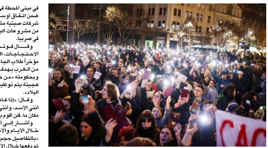
طلاب جامعة بلغراد يحتجون ضد الكسندر فوتشيتش

أخرى الفساد المنتشر في البلاد بأنه السبب في الحادث، حيث أنه كان وراء أعمال التجديد السيئة لشخص آخر والانصاع له».