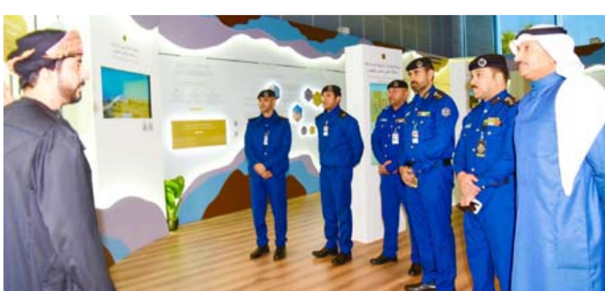
وفد الإطفاء يستمع الى الشرح

زار وفد من قوة الإطفاء العام جناح الأمانة العامة لمجلس التعاون لدول الخليج العربية في مركز الشيخ عبدالله السالم الثقافي بدعوة كريمة من القائمين على الجناح والذي يتميز بتوثيق مسيرة مجلس التعاون، حيث انطلق الجناح بالتزامن مع استضافة دولة الكويت للقمم الخليجية الخامسة والأربعون.