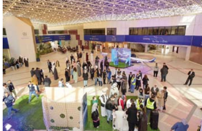
الجمهور يشاهد كأس الخليج

الجوية الكويتية على استعداد تام لتعزيز سبل تطوير وتنمية السياحة في دولة الكويت من خلال استخدام كافة الإمكانيات بما يساهم في الارتقاء بالهوية الكويتية وثقافتها على المستويين المحلي والدولي. وأشار الفعّان إلى أن الخطوط الجوية الكويتية، وفي إطار مساعيها الدؤوبة لتطبيق برامجها للمسؤولية الاجتماعية، وضمن حرص الشركة المتواصل لتمكين الشباب وتقديم كل الدعم اللازم له، فإنها لا تالو جهداً بدعم وتشجيع الفعاليات الهادفة من الجماهير وتولي اهتماماً خاصة بدعم الرياضة والرياضيين. واختتم الفعّان بأن الخطوط الجوية الكويتية تضع نصب أعينها رفع اسم دولة الكويت من خلال تقديم أفضل الخدمات للوفود الرسمية والجماهير والمسافرين وتسخر كافة إمكانيات الشركة لهم من وإلى دول الخليج وكافة أنحاء العالم من خلال مبنى الركاب T4 وعلى متن طائرات الناقل الوطني مما يضمن لهم تجربة سفر متميزة ومرحة وأمنة.