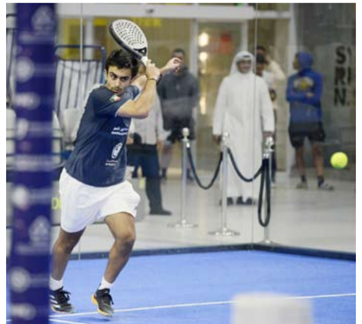
جانب من المباراة

انطلقت منافسات النسخة الثالثة من بطولة كأس الخليج العربي للبادل حتى 15 ديسمبر الجاري. وجمعت المباراة الافتتاحية على «ملاعب البادل ريجنسي» منتخب الكويت للسيدات ونظيره السعودي وانتهت بنتيجة (3-0) في حين تغلب في المباراة الثانية منتخب الإمارات للرجال على نظيره العماني بنتيجة ماثلة. وفي منافسات اليوم الأول تغلب منتخب الكويت للرجال على نظيره السعودي بنتيجة (3-0) أيضاً.