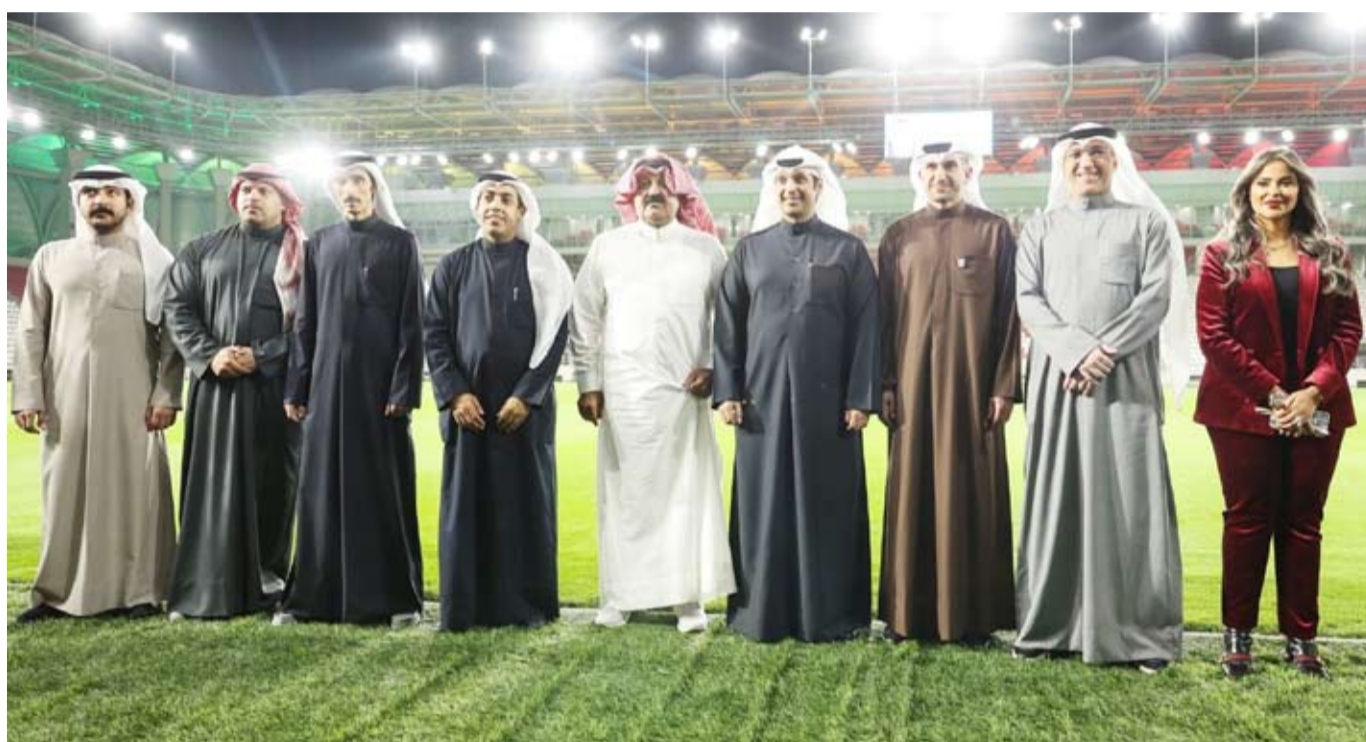
جانب من افتتاح استاد جابر المبارك بالصليبيخات