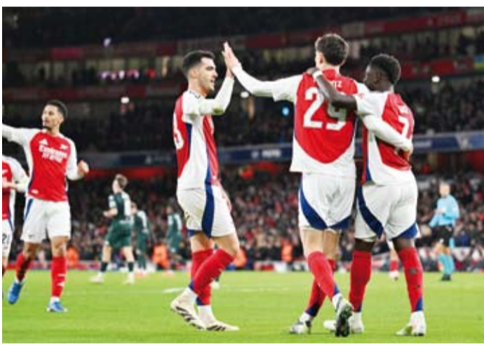
ساكو يواصل التالق مع الجائز

وقال أرتيتا عن لويس-سكلي «هي لحظة فخر حقيقية. إنه أحد أفراد فريقنا ومن دواعي سروري أن أشاهده. من الرائع أن تثق في قدرته على اللعب في هذا المستوى».