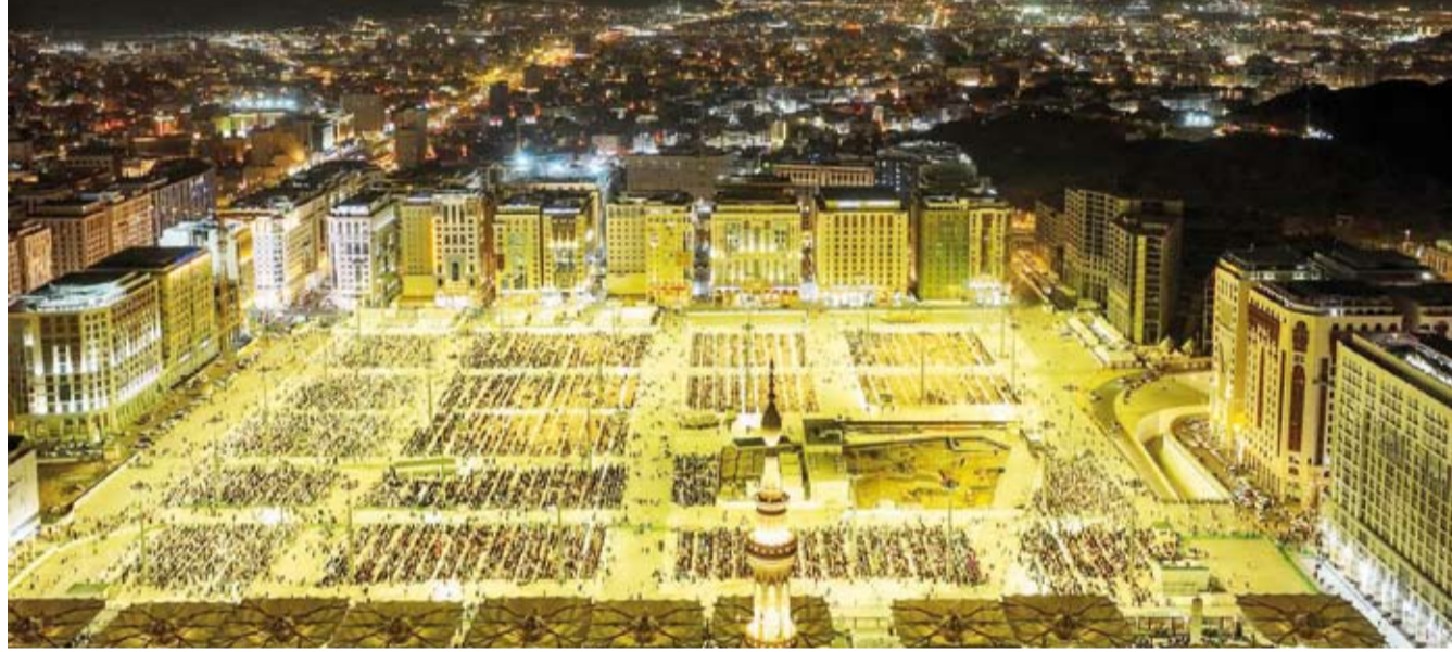
المسجد النبوي من الأعلى

شهد المسجد النبوي خلال العشر الأولى من شهر رمضان لعام 1446هـ، توافد المصلين والزوار، وحرصت الهيئة العامة للعناية بشؤون المسجد الحرام والمسجد النبوي على تقديم أرقى وأجود الخدمات لهم. وبلغ عدد المصلين في المسجد النبوي وسطحه وساحاته إلى 9,705,341 مصلياً خلال العشر الأيام الأولى، وقامت الهيئة بالعمل على تسهيل الوصول لأروقة المسجد النبوي من خلال تنظيم دخول الزائرين والمصلين عبر مراقبين موزعين على الممرات الرئيسية والفرعية لضمان انسيابية الحركة.