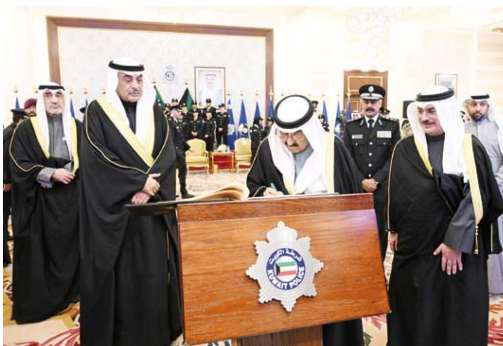
أمير البلاد يوقع على سجل الشرف