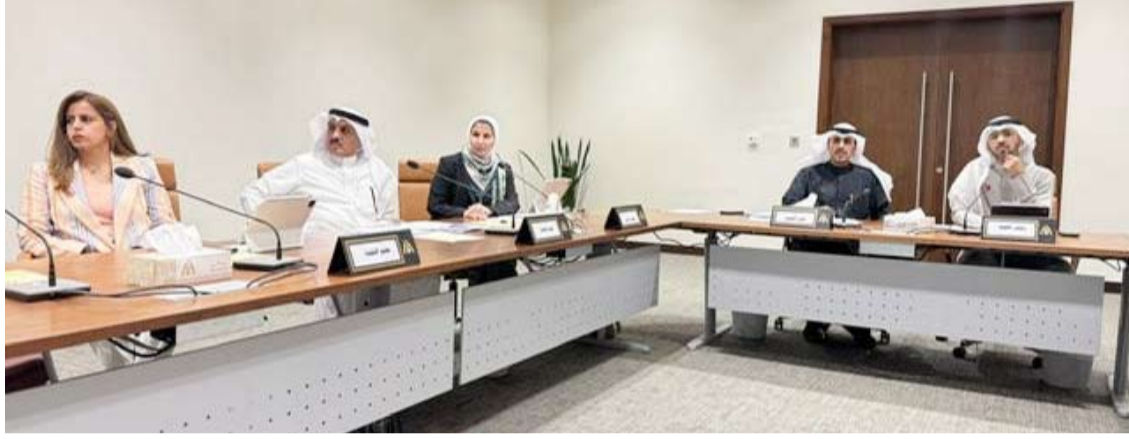
جانب من اجتماع لجنة الفروانية

في الاستفادة من المواقع المخصصة لمشروع «اركن وركب» الذي يعد أحد الحلول لمعالجة الاختناق المروري ويسهم في تطوير منظومة النقل الحضري