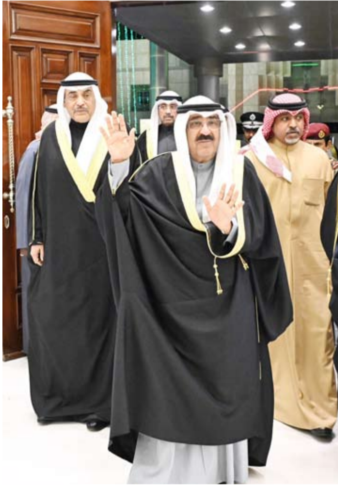
سمو الأمير يحيي الحضور