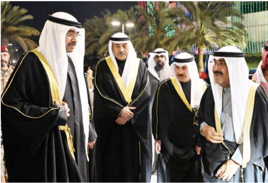
ترحيب بحضور سمو الأمير