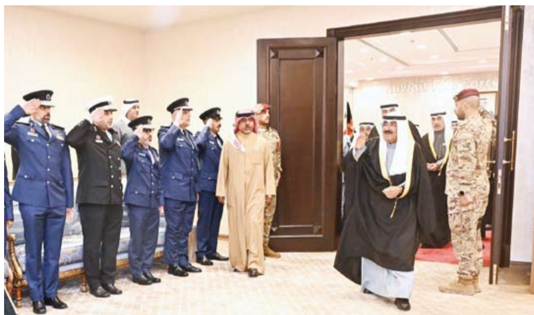
أمير البلاد يحيي الحضور