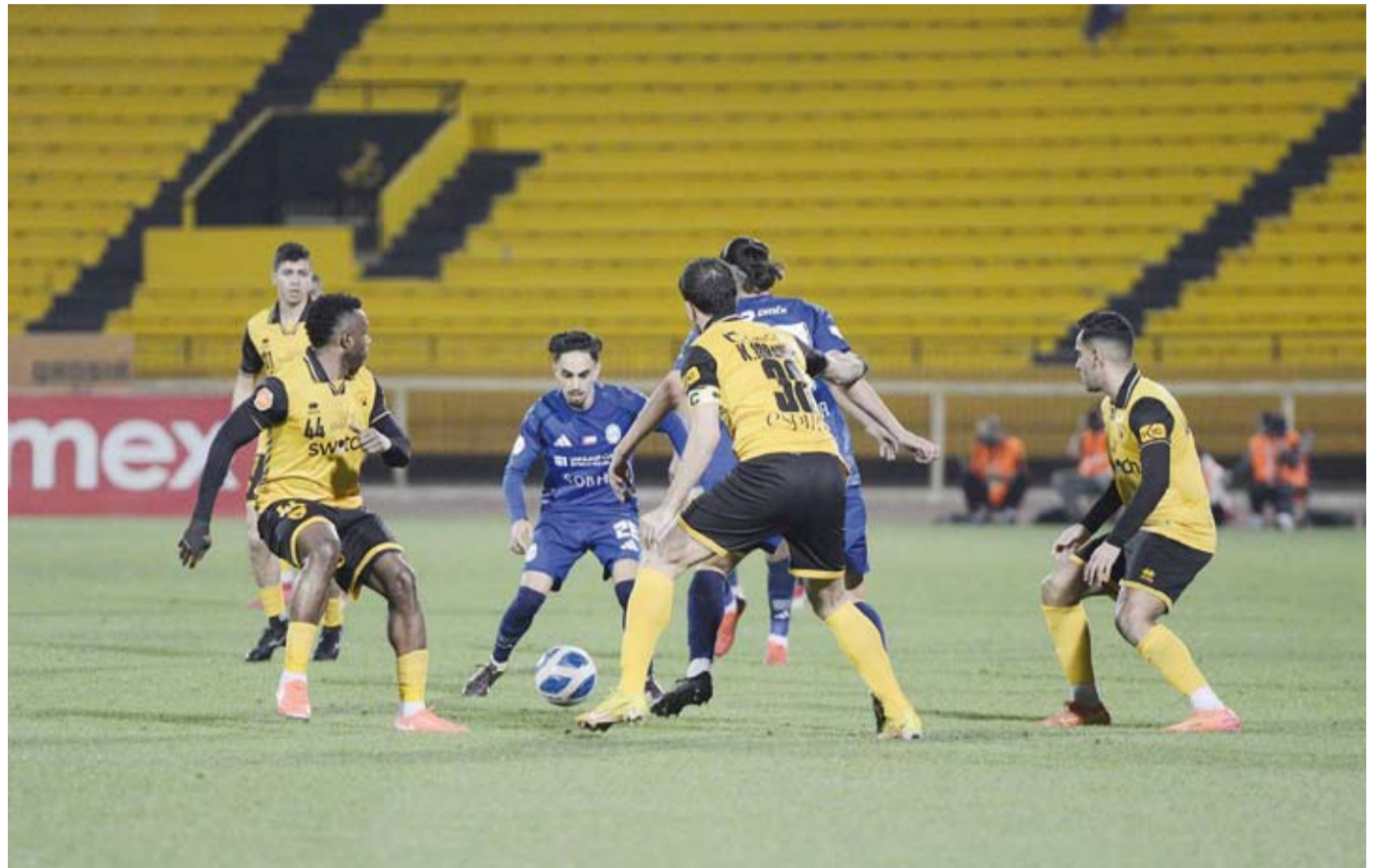
لقاء مثير بين النصر والقادسية والنصر