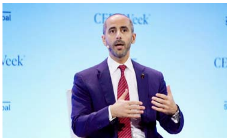
الشيخ نواف سعود الناصر

ترأس نائب رئيس مجلس الإدارة الرئيس التنفيذي لمؤسسة البترول الكويتية الشيخ نواف الناصر الصباح وفد رفيع المستوى من المؤسسة وشركاتها التابعة للمشاركة في مؤتمر (سيراويك) الذي انطلق في مدينة هيوسن بولاية تكساس الأمريكية الإثنين الماضي. وقالت المؤسسة في بيان صحفي إن المؤتمر الذي يختم غدا الجمعة يشهد حضور آلاف من قادة صناعة النفط وصناعة القرار والخبراء من مختلف أنحاء العالم لمناقشة القضايا الحيوية المتعلقة بالطاقة في ظل التحولات الاقتصادية العالمية.