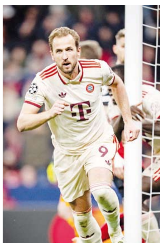
هاري كين يحتفل بالتسجيل

ضرب بايرن ميونخ وانتر ميلان موعداً في ربع نهائي دوري أبطال أوروبا بعد فوزهما على باير ليفركوزن وفينوورد الهولندي في إياب ثمن النهائي. وفي ليفركوزن، سجل بايرن هدفين عن طريق نجميه هاري والفونسو ديفيز ليكرر فوزه على مواطنه باير بعدما كسبه في الذهاب 3-0.