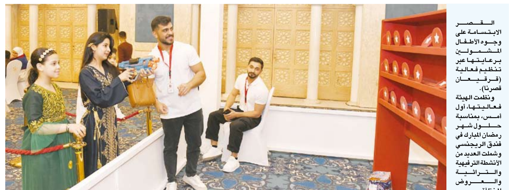
جانب من فعاليات القرقيعان

القصر الإلتزام على وجوه الأطفال المشمولين برعايتها عبر تنظيم فعالية «قرقيعان قصرنا». ونظمت الهيئة فعاليتها، أول أمس، بمناسبة حلول شهر رمضان المبارك في فندق الريجنسي وشملت العديد من الأنشطة الترفيهية والترفيهية والعروض المختلفة.