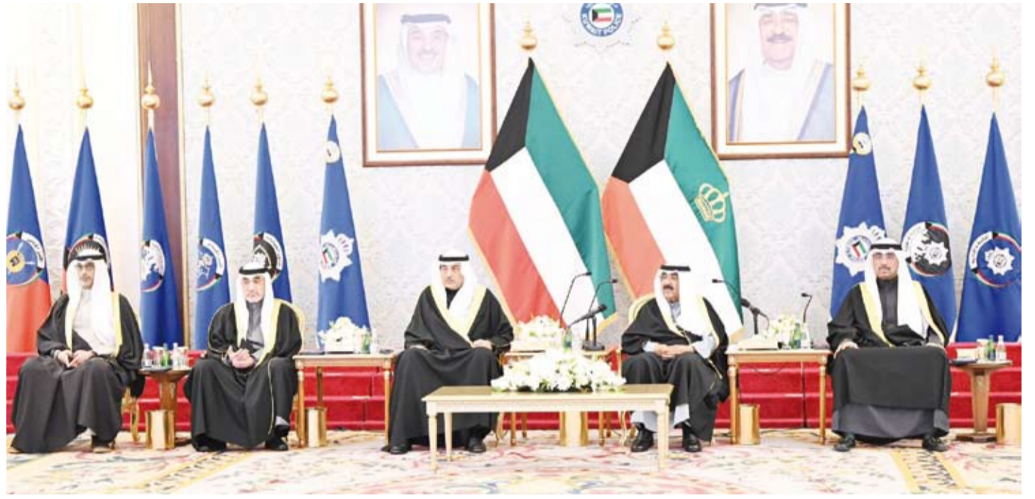
سمو أمير البلاد وسمو ولي العهد خلال زيارة مبنى الشيخ نواف الأحمد بوزارة الداخلية