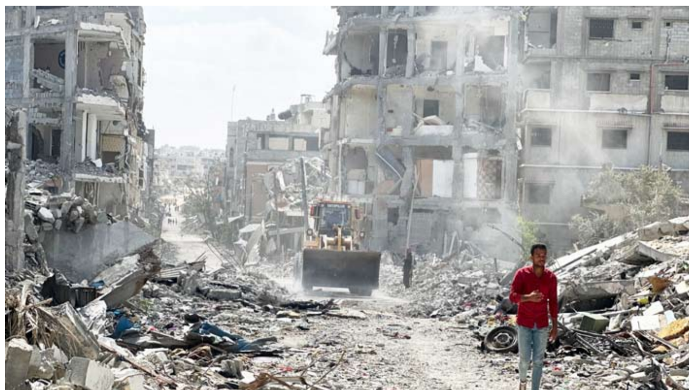
هدنة لمدة شهرين مقابل الإفراج عن نصف الأسرى الأحياء

وصل المبعوث الأميركي إلى الشرق الأوسط ستيف ويتكوف، إلى قطر، للانضمام إلى محادثات تهدف إلى تمديد وقف إطلاق النار في قطاع غزة. ويلتقي ويتكوف ورئيس وزراء قطر محمد بن عبد الرحمن آل ثاني، حيث تأمل إسرائيل أن تقدم الولايات المتحدة اقتراحاً لتمديد وقف إطلاق النار لمدة شهرين تقريباً، تفرج خلالها حماس عن نحو نصف الأسرى الأحياء. وحتى الآن ترفض حماس الاقتراح، مصررة على التزام الجانبين بالإطار الذي تم الاتفاق عليه في يناير. في سياق متصل، جدد ناطق آخر باسم «حماس» اتهام الجانب الإسرائيلي بالتفريط من اتفاق وقف إطلاق النار، معتبراً أن ذلك «يقتاض مع الإرادة الدولية وجهود كل الوساطة لتثبيت الاتفاق وإنهاء الحرب». وأكد الناطق باسم الحركة عبد اللطيف القانون على أن «حماس» قدمت مرونة وتعاملت بإيجابية في مختلف محطات التفاوض، مضيفاً أنها تنتظر خطوات جديدة من مفاوضات الدوحة للمضي نحو تطبيق المرحلة الثانية واستئناف إدخال المساعدات وضمان إنهاء الحرب.