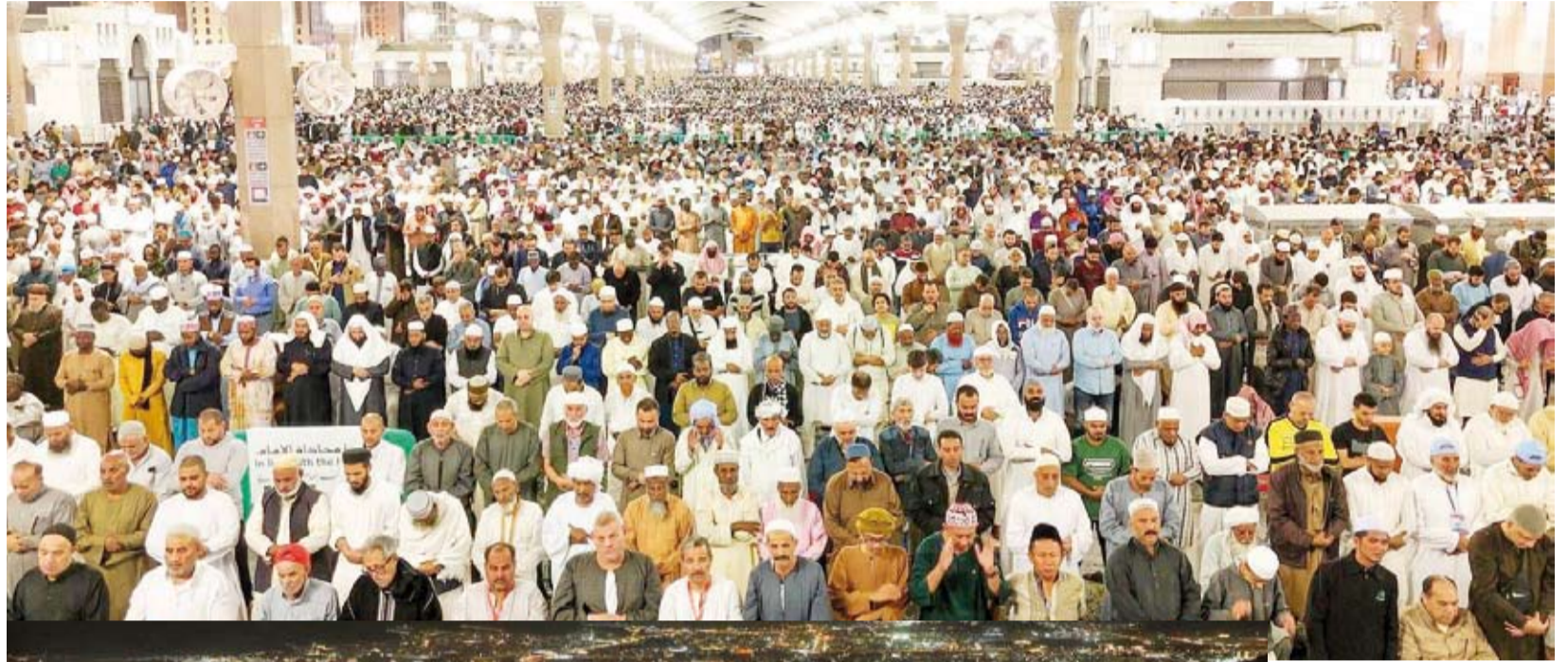
أعداد كبيرة من المصلين

شهد المسجد النبوي خلال العشر الأولى من شهر رمضان لعام 1446هـ، توافد المصلين والزوار، وحرصت الهيئة العامة للعناية بشؤون المسجد الحرام والمسجد النبوي على تقديم أرقى وأجود الخدمات لهم. وبلغ عدد المصلين في المسجد النبوي وسطحه وساحاته إلى 9,705,341 مصلياً خلال العشر الأيام الأولى، وقامت الهيئة بالعمل على تسهيل الوصول لأروقة المسجد النبوي من خلال تنظيم دخول الزائرين والمصلين عبر مراقبين موزعين على الممرات الرئيسية والفرعية لضمان انسيابية الحركة.