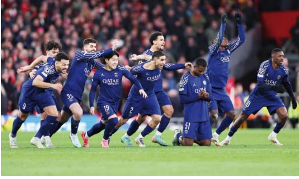
باريس عبر ليفربول بركلات الترجيح

تأهل باريس سان جيرمان الفرنسي للدور ربع النهائي من دوري أبطال أوروبا لكرة القدم، بعد تغلبه على ضيفه ليفربول الإنجليزي بركلات الترجيح بأربع كرات مقابل ركلة واحدة بعد انتهاء الوقتين الرسمي والإضافي بنتيجة هدف دون مقابل لصالح النادي الفرنسي الذي خسّر لقاء الذهاب على أرضه بالنتيجة 1-0.