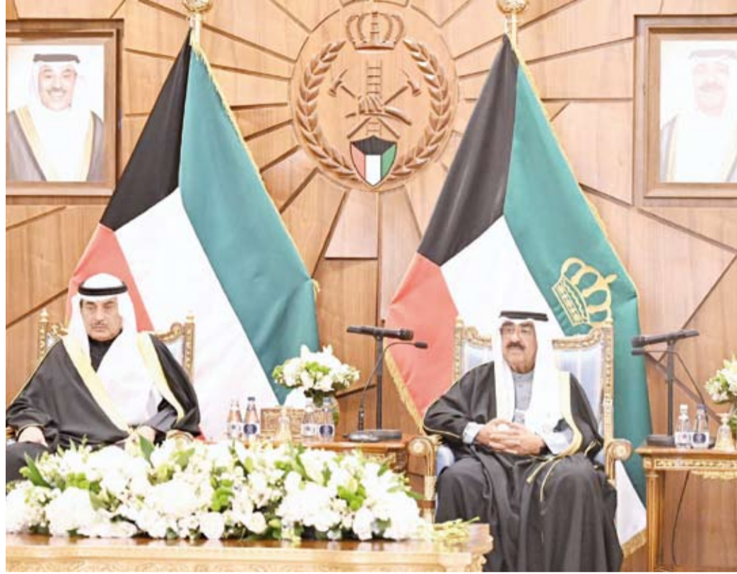
سمو الأمير وسمو ولي العهد خلال زيارة قوة الإطفاء العام

نحن أبناءك نغف اليوم مجددين العهد والولاء لسموكم مستميرين في تادية رسالتنا الإنسانية بروح الفريق الواحد ملتزمين بتوجهاتكم الحكيمة... لتحقيق أعلى معايير السلامة والاستجابة