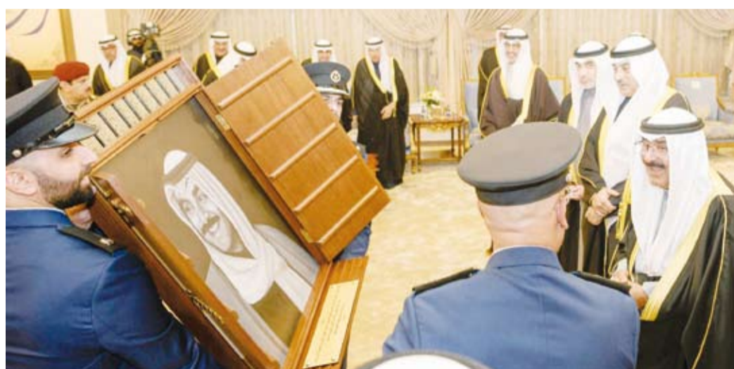
تقديم هدية تذكارية إلى سمو أمير البلاد