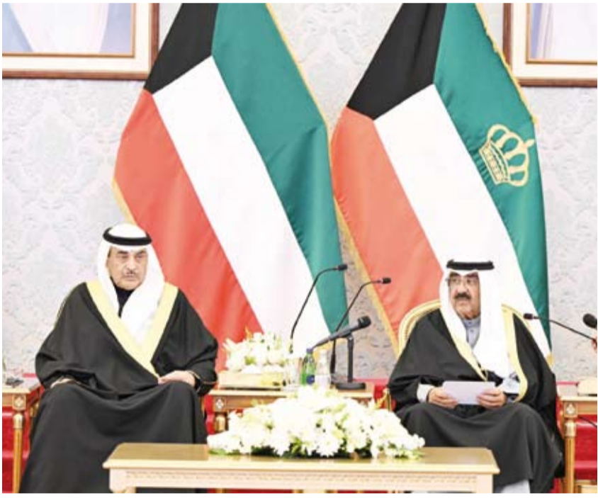
سمو الأمير متحدثاً

◆ نسجل إشاراتنا بالجهود المبذولة التي تتوج بتطوير «الداخلية» وعناصرها البشرية ◆ سنستمر بدعم الكوادر الأمنية لتعزيز القدرات والإمكانات في كافة القطاعات ولتستمر بكل كفاءة في أداء المهام والتواجبات