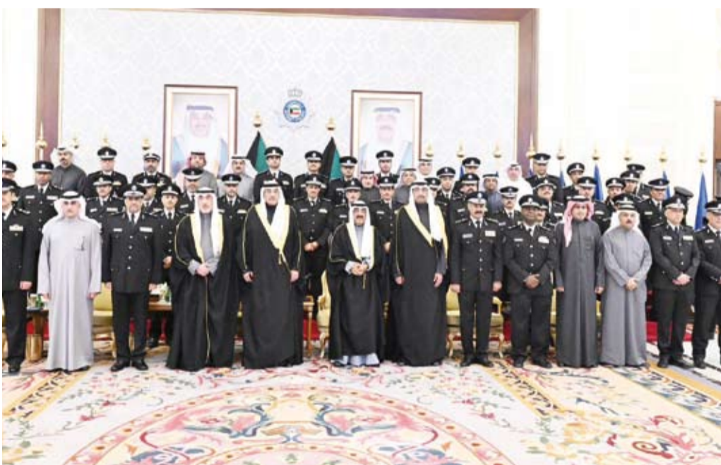
سمو الأمير وسمو ولي العهد يتوسطان قادة وزارة الداخلية