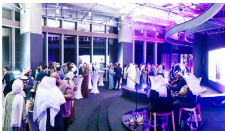
حضور كثيف من رواد الاعمال خلال غبقة وياك

الإرشاد وفعاليات التواصل، مشيرة إلى أنها لن تدخر جهداً في سبيل مواصلة جهودها للمساعدة في نمو الشركات الناشئة وتعزيز النظام البيئي بما يمكن الشركات الصغيرة والمتوسطة الحجم من تحقيق الازدهار الذي تصبوا له. ومن خلال مبادرات مثل غبقة «وياك»، تعزز الشركة علاقاتها مع اللاعبين الرئيسيين في قطاع زيادة الأعمال، وتعزز دورها كممكن رئيسي للتحول الرقمي والابتكار.