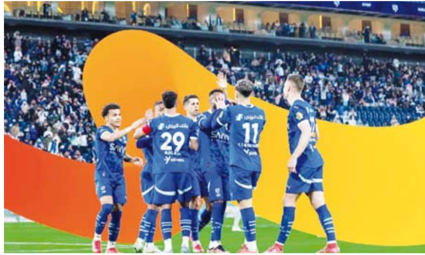
الهلال يضرب باختاكور برعاية نظيفة