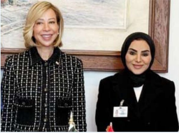
د.أمال الحويلة تلتقي مع السيدة الأولى للجمهورية اللبنانية نعتت عون

أكدت وزير الشؤون الاجتماعية وشؤون الأسرة والطفولة، الدكتورة أمال الحويلة، الثلاثاء، التزام دولة الكويت بتعزيز دور المرأة وتمكينها في مختلف المجالات من خلال تطوير سياسات الحماية الاجتماعية التي تضمن تحقيق العدالة وتعزيز الفرص الاقتصادية.