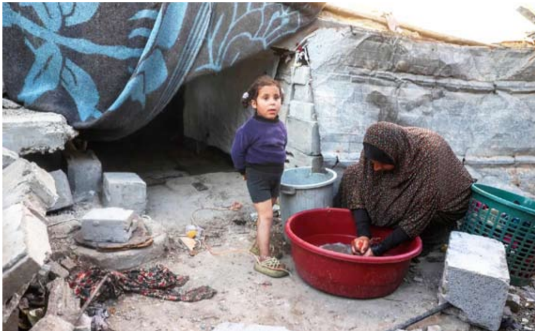
سيدة فلسطينية تغسل أطباقاً وبقائها طفلة في مخيم البريج

ويحول قسم من سكان غزة على الألواح الشمسية والمولدات للحصول على الكهرباء، خصوصاً أن الوقود يدخل القطاع بكميات ضئيلة. وتذكر هذه الخطوة بإعلان إسرائيل مطلع الحرب، تشديد الحصار الذي كانت تفرضه على القطاع منذ سيطرة «حماس» عليه عام 2007، وقامت حينها بقطع الكهرباء عن القطاع، ولم تعاود إمداده بها سوى في منتصف مارس 2024.