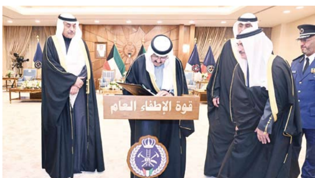
سمو الأمير يوقع على سجل الشرف في قوة الإطفاء