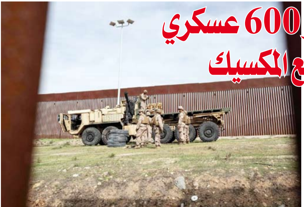
جنود أميركيون من سلاح الهندسة

أعلنت الولايات المتحدة أنها ستنتشر أكثر من 600 عسكري إضافي على حدودها مع المكسيك، في خطوة تتزامن مع تعزيز إدارة الرئيس دونالد ترمب إجراءات مكافحة الهجرة غير النظامية. وقالت القيادة الأميركية الشمالية في الجيش الأميركي إن نحو 40 من هؤلاء العسكريين الإضافيين هم محللون استخباراتيون في القوات الجوية، في حين أن الباقيين وعددهم 590 عسكرياً هم من سلاح الهندسة. وأضافت أن هذه الزيادة ستترافق مع العدد الإجمالي للعسكريين المنتشرين أو المتوقع نشرهم على الحدود مع المكسيك