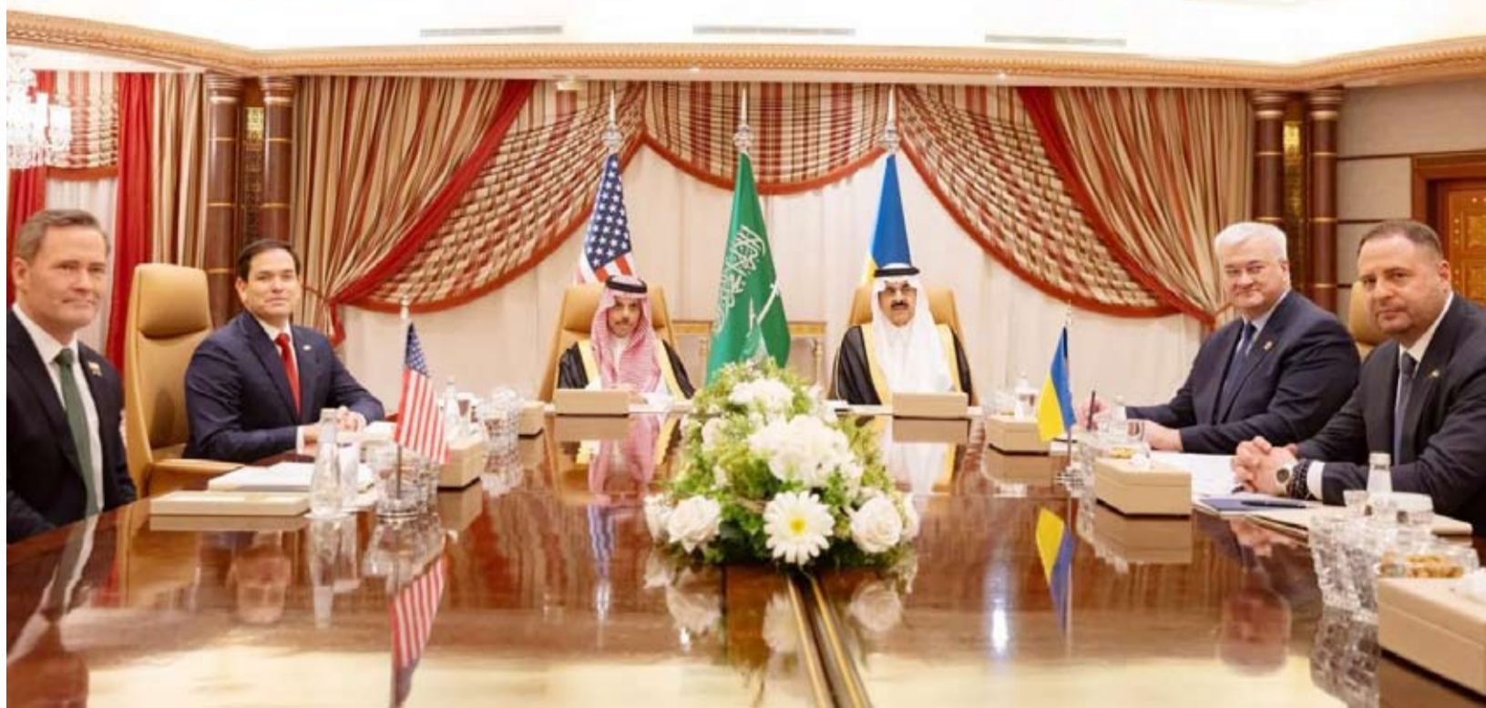
جانب من المحادثات الأميركية - الأوكرانية

وفيما أكدت الرئاسة الأوكرانية أن وقف النار المقترح «يمكن تعديده بموافقة متبادلة من الطرفين»، قال الرئيس الأوكراني فولوديمير زيلينسكي: «إذا وافقت روسيا، فإن وقف النار سيدخل حين التنفيذ فوراً، بدوره، قال روبيو إن على روسيا أن تقرر ما إذا كانت ستقبل وقف النار مع أوكرانيا. أما والتز فعبّر عن أمله في إنهاء حرب أوكرانيا بعدما قبلت كيف اقتراح الهدنة وخوض مفاوضات فورية. كما قال الرئيس الأميركي دونالد ترمب إنه يأمل أن توافق روسيا على وقف النار، مشيراً إلى أن اجتماعاً أميركياً سيعقد مع روسيا خلال ساعات.