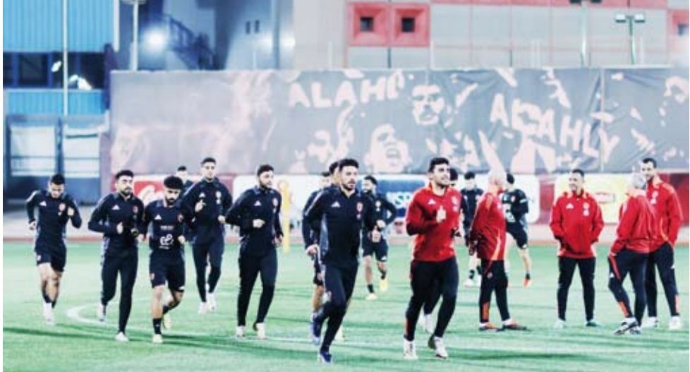
جانب من تدريبات النادي الأهلي

بقي لاعبو الزمالك 20 دقيقة بعد بداية موعد مباراة فريقهم أمام الغريم التقليدي الأهلي وهدم في الملعب قبل أن يطلق الحكم محمود بسويوني صافرة انتهاء المباراة نظير عدم حضور لاعبي الأهلي إلى الملعب لخوض مواجهة ضمن مسابقة الدوري المصري.