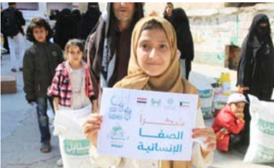
شكر للجمعية على مساعيها

نفذت جمعية الصفا الخيرية الإنسانية مشروع السلال الرمضانية ووجبات تظهير الصائمين بدعم من أهل الخير لصالح الأسر المتعففة في الكويت وقبر غيزيا والهند وفلسطين وتركيا وسورية واليمن ولبنان وبنغلاديش وسريلانكا وتشاد والصومال وبروكينا فاسو ومالي والنيجر، شجارتهم فرحة فطرم، وإعانتهم على أداء عبادتهم؛ وقد استفاد من هذا المشروع أكثر من 85.000 صائم في هذا الشهر.