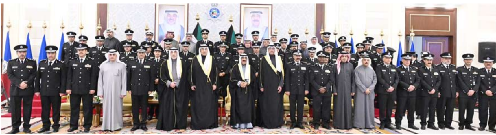
سمو الأمير وسمو ولي العهد يتوسلطان قادة «الداخلية»