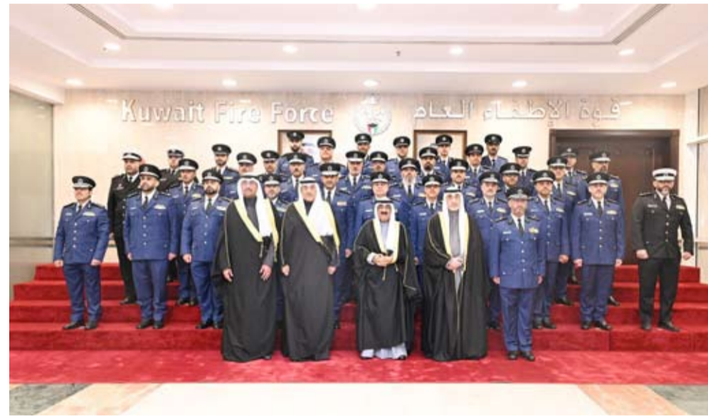
سمو الأمير وسمو ولي العهد يتوسلطان قادة الإطفاء