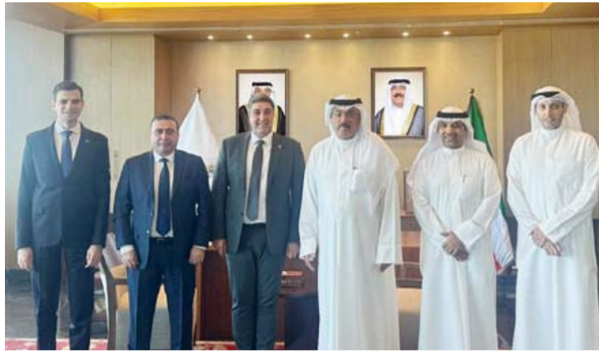
وزير التربية يستقبل سفير أرمينيا لدى البلاد

بحث وزير التربية سيد جلال الطبطبائي، أمس، مع سفير جمهورية أرمينيا الصديقة لدى دولة الكويت الدكتور أرسين أراكليان تعزيز سبل التعاون التربوي بين البلدين. وقالت الوزارة في بيان: إن الجانبين بحثا عدداً من الموضوعات ذات الاهتمام المشترك في المجالات التربوية والتعليمية بما يخدم العملية التعليمية إلى جانب التأكيد على أهمية الدور التربوي والثقافي للمؤسسات التعليمية في تعزيز التواصل الحضاري والثقافي. كما أكد الجانبان على أهمية تعزيز أواصر التعاون وتبادل الخبرات بما يسهم في دعم العلاقات الثنائية وتطوير مجالات العمل التربوي والتعليمي بين البلدين