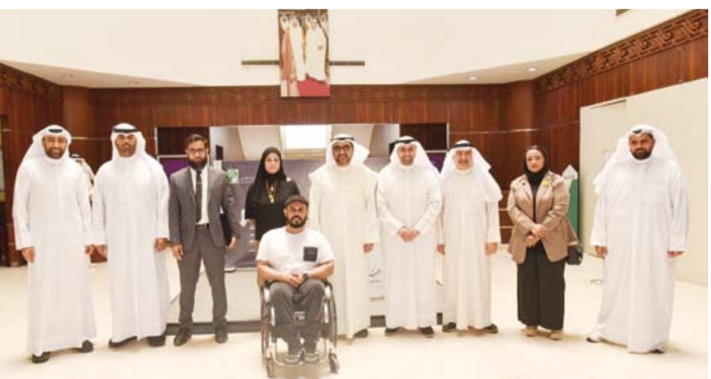
تكريم فريق (نبض الطبي) و«الإرادة لذوي الإعاقة»

السماعات الطبية استهدف فئة من المحتاجين داخل الكويت ممن لا يستطيع تحمل تكاليف العلاج أو الحصول على سماعات بصورة مجانية. وأشار الدكتور العلي إلى أن المشروع أحدث أثراً كبيراً في حياة المستفيدين وساعدهم على التواصل والتعلم والاندماج في المجتمع. وقال: إن فكرة المشروع انطلقت بمبادرة من فريق (الإرادة لذوي الإعاقة) قبل أن يتبناها فريق (نبض الطبي) بالتعاون مع الهيئة التي تكفلت بترتيبات المشروع وتوفير السماعات وفق أعلى المعايير. وأضاف أن الفريق استعان بمراكز متخصصة لاختيار الحالات المستحقة وتحديد السماعات المناسبة لكل حالة إلى جانب وجود خطط مستقبلية لتكرار المشروع ودراسة تنفيذ مشروع لزراعة