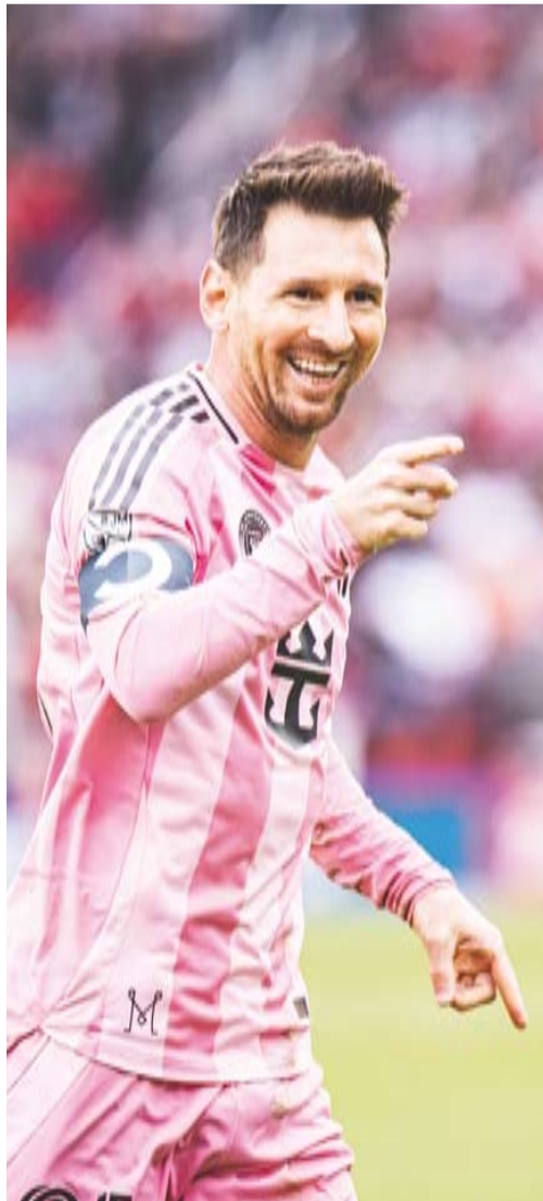
الأرجنتيني ليونيل ميسي

سيحصل الأرجنتيني ليونيل ميسي على أكثر من ضعف راتبه المقدر بـ 25 مليون دولار، في عقده الجديد مع نادي إنتر ميامي، وسيربح أكثر مرتين، مقارنة بما حققه ثاني أعلى اللاعبين أجراً في الدوري الأميركي لكرة القدم، الكوري الجنوبي سون هيونغ مين لاعب لوس أنجلوس إف سي. ويشمل عقد ميسي الجديد 25 مليون دولار يحصل عليها راتباً أساسياً، بالإضافة إلى تعويض مضمون بقيمة تزيد على 28 مليون دولار، حسبما أعلنت رابطة لاعبي الدوري الأميركي في أول إصدار لرواتب عام 2026. ويسدد إنتر ميامي رواتب بقيمة 54.6 مليون دولار، متفوقاً بأكثر من 20 مليون يورو عن لوس أنجلوس إف سي، الذي يتحمل رواتب بقيمة 32.7 مليون يورو، ونحو خمسة أضعاف رواتب فيلادلفيا صاحب أدنى إجمالي رواتب في الدوري بـ 11.7 مليون دولار، وقد ارتفعت رواتب ميامي من 46.8 مليون دولار في بداية الموسم الماضي. في المقابل، فقد خفض تورونتو رواتب لاعبيه إلى 21.4 مليون دولار من 34.1 مليون دولار في بداية عام 2025، بينما زاد لوس أنجلوس إف سي إنفاقه إلى 32.7 مليون دولار من 22.4 مليون دولار. وبلغ إجمالي تعويضات الدوري 631 مليون دولار، وارتفع متوسط التعويض المضمون إلى 688 مليون دولار في 16 أبريل، بزيادة قدرها 8.9 في المائة عن 632 مليون دولار في 1 أكتوبر الماضي.