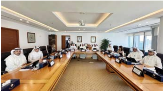
جانب من اجتماع مجلس الجامعات الحكومية برئاسة وزير التعليم العالي

ناقش مجلس الجامعات الحكومية، أمس، المرحلة الأولى من إنشاء وتشغيل كلية الطب والعلوم الصحية للجامعات الحكومية. وقال الأمين العام للمجلس بالتكليف الدكتور جاسم العلي في تصريح صحفي: إن ذلك جاء خلال اجتماع المجلس برئاسة وزير التعليم العالي والبحث العلمي الدكتور نادر العلي، وتحت إشراف وزير التعليم العالي بما يواكب احتياجات الدولة.