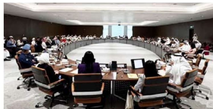
جانب من الورشة

الإخلاء للأشخاص ذوي الإعاقة في جميع المباني والمنشآت لضمان سلامتهم في حالات الطوارئ. 4. التأكيد على الجهات ذات العلاقة على أن تشمل إجراءات الإخلاء الوهمي الروتينية الأشخاص ذوي الإعاقة للتأكد من سلامة الإخلاء في حال الحوادث الفعلية. 5. تدقيق بند التأهب لحالات الطوارئ في كود الكويت لإمكانية الوصول وفق التصميم العام للتأكد من توافق المصطلحات المستخدمة مع كود الإطفاء لتحقيق سلامة تطبيق وتحديث الكود.