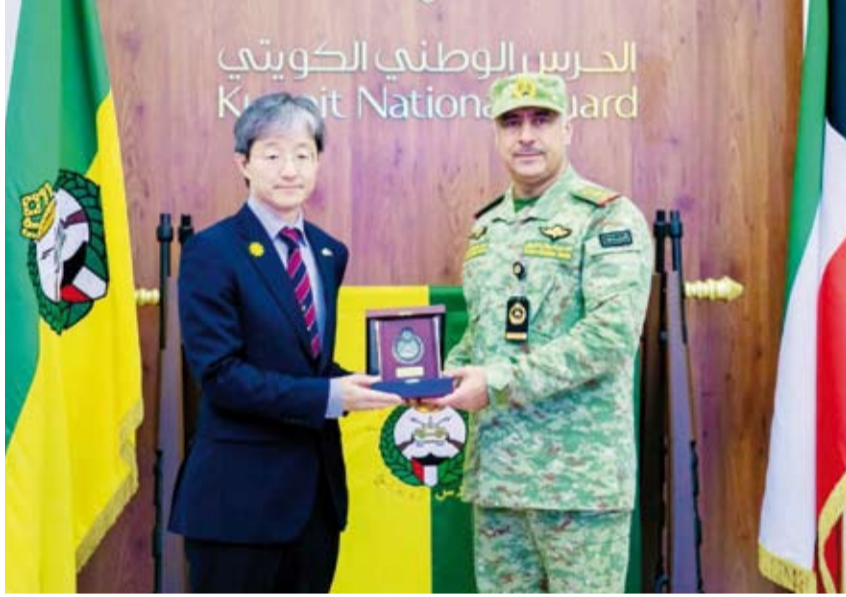
الفريق الركن حمد البرجس يقدم درعاً لسفير اليابان موكاي كينيتشيرو

له تحيات قيادة الحرس الوطني. وأضاف أنه تم خلال اللقاء بحث الموضوعات ذات الاهتمام المشترك وتعزيز سبل التعاون في المجالات العسكرية والأمنية. ومشارك. وقال الحرس الوطني في بيان: إن الفريق البرجس استقبل في مكتبه بالرئاسة العامة للحرس السفير كينيتشيرو ونقل