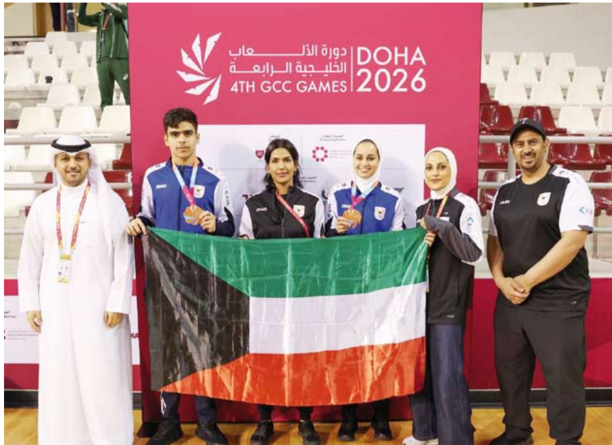
أبطال الكويت يحتفلون بالبرونزيات

أنهى وادي دجلة آمال ضيفه الإسماعيلي في البقاء بالدوري المصري الممتاز لكرة القدم بعد أن فاز عليه 2 - 1 في إطار مباريات الجولة العاشرة لمجموعة تفادي الهبوط للدرجة الثانية. وتجمد رصيد الإسماعيلي عند 19 نقطة في المركز 14 والأخير لتنتهي آماله بقائه بالدوري الممتاز رسمياً ولن يفقده الفوز في المباريات الثلاث المتبقية.