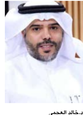
د. خالد الجمعي

أعلن وكيل وزارة الشؤون الاجتماعية الدكتور خالد الجمعي، أمس، انطلاق المرحلة الثالثة من مشروع تكويّن الوظائف الإشرافية في الجمعيات التعاونية بطرح 70 وظيفة إشرافية شاغرة بمختلف التخصصات والمسميات.