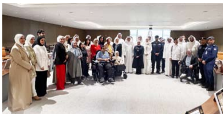
أعضاء البلدي والجهات المشاركة

تشجيع تبني متطلبات الإخلاء في جميع المباني والمنشآت لضمان سلامتهم