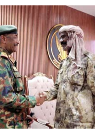
البرهان مستقبلاً اللواء النور القبة

وتشير تقارير متداولة إلى أن الهوية انضم إلى الجيش السوداني برقعة قوة ميدانية تضم ما بين 11 إلى 15 عربية قتالية بكامل عتادها، في خطوة اعتبرت ضربة جديدة لـ«قوات الدعم السريع»، حتى وإن حاولت قياداتها التقليل من أثرها العسكري.