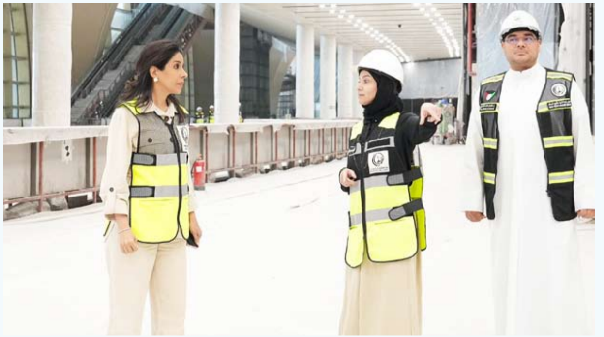
وزيرة الأشغال خلال تفقدها الأعمال التنفيذية أمس

لدمع قطاع الطيران المدني وتعزيز قدرة الكويت على استيعاب النمو المتزايد في حركة السفر والنقل الجوي.