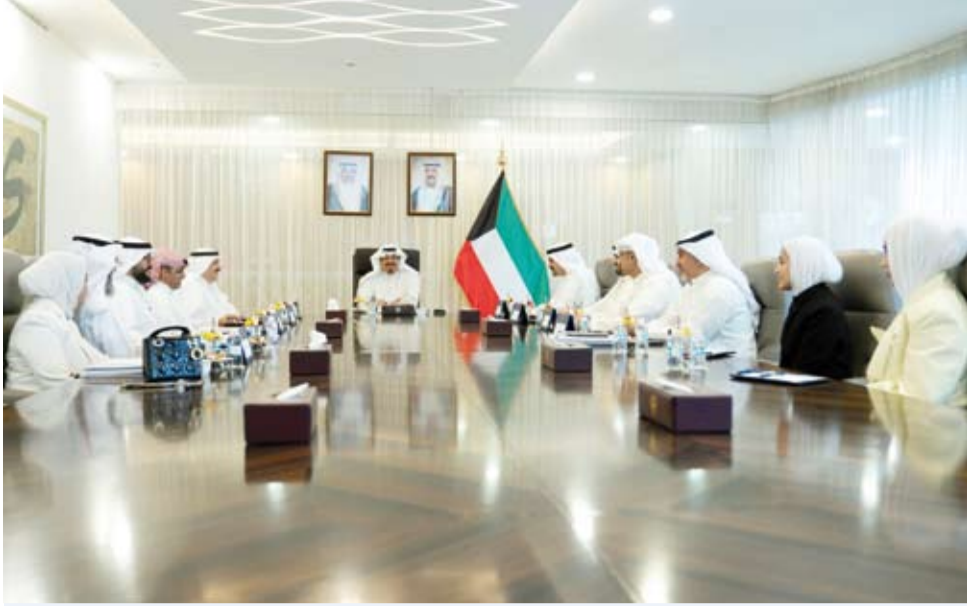
سمو الشيخ أحمد عبدالله يترأس الاجتماع

الدبيلة. وحضر الاجتماع وزير الصحة الدكتور أحمد العوضي، والمستشار ديوان رئيس مجلس الوزراء الدكتور خالد الفاضل، ومدير عام هيئة تشجيع الاستثمار المباشر الشيخ الدكتور مشعل جابر الأحمد، ورئيس ديوان رئيس مجلس الوزراء بالإنابة الشيخ خالد محمد الخالد، ووكيل وزارة الصحة الشيخ