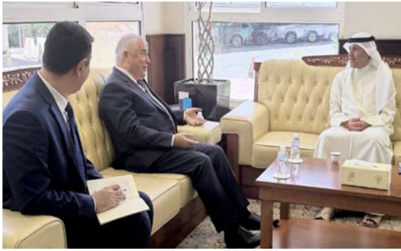
د. محمد الوسمي مستقبلاً مع سفير طاجيكستان د. زيد الله زبيدوف

بحث وزير الأوقاف والشؤون الإسلامية الدكتور محمد الوسمي مع سفير جمهورية طاجيكستان الصديقة عميد السلك الدبلوماسي لدى دولة الكويت الدكتور زيد الله زبيدوف، أمس، سبل تعزيز التعاون وتبادل الخبرات بما يخدم المصالح المشتركة. وذكرت الوزارة في بيان (كونا)، أن اللقاء الذي عقد بمناسبة انتهاء فترة عمل السفير زبيدوف سفيراً لبلادته لدى البلاد، تم خلاله استعراض أوجه التعاون بين البلدين الصديقين وما يشهده من تطور وتعاون في الشؤون الإسلامية والعمل الديني. وثنى الوزير الوسمي - وفق البيان - الدور الذي قام به السفير زبيدوف خلال فترة