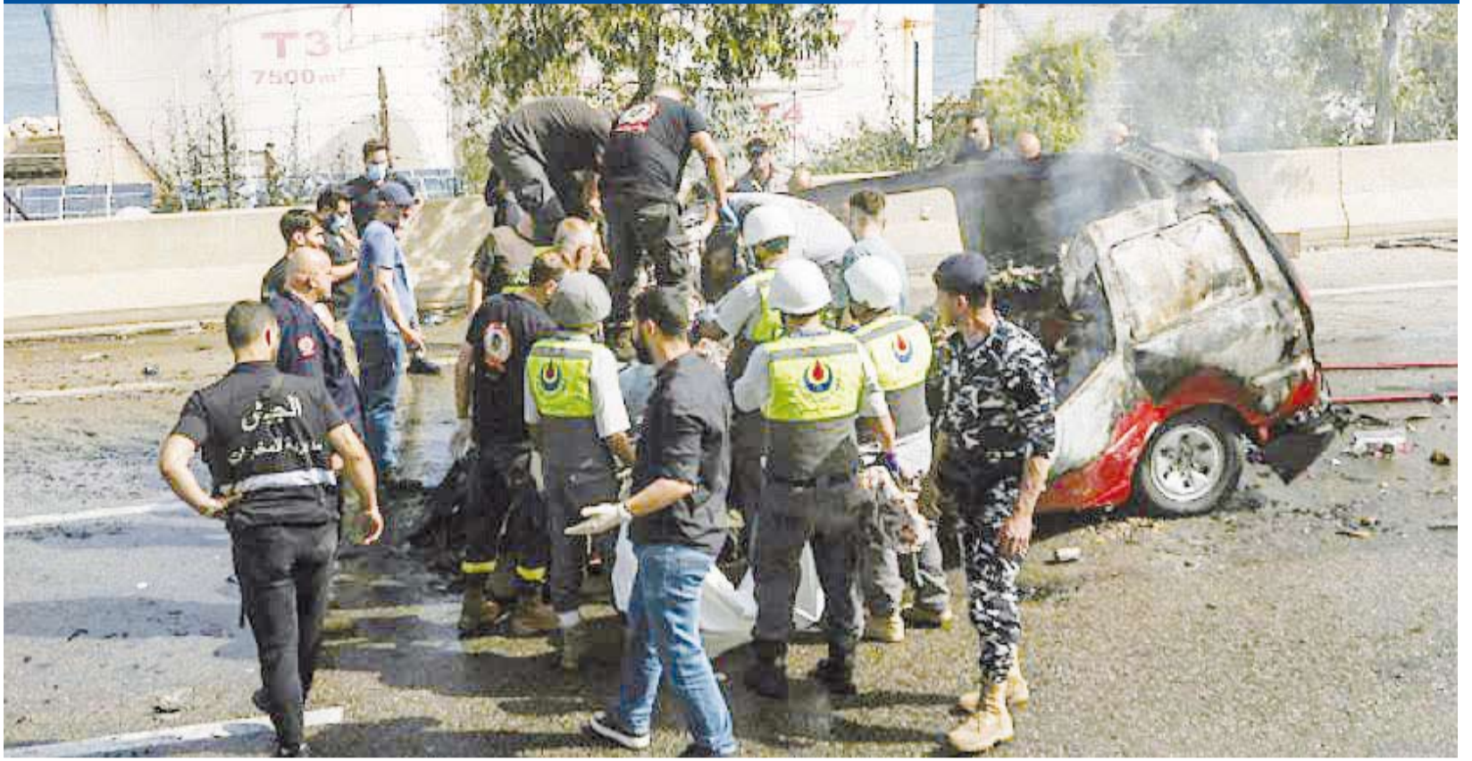
جيش الاحتلال يستهدف المدنيين يومياً رغم الهدنة

أعلنت وزارة الصحة العامة اللبنانية أمس عن ارتفاع عدد ضحايا عدوان الاحتلال الصهيوني على لبنان إلى 2896 قتيلاً و8824 مصاباً. جاء ذلك في التقرير اليومي الصادر عن مركز عمليات طوارئ الصحة التابع للوزارة بشأن إجمالي عدد ضحايا عدوان الاحتلال الإسرائيلي المستمر منذ الثاني من مارس الماضي. وأشار التقرير إلى أن عدد ضحايا العدوان على لبنان من منتسبي القطاع الصحي خلال هذه الفترة بلغ 110 قتلى و252 جريحاً. وكان جيش الاحتلال قد استهدف أمس بغارات جوية متفرقة عدداً من السيارات أثناء تنقلها على الطرق في عدد من المناطق بلغ مجموع ضحاياها بحسب مركز عمليات