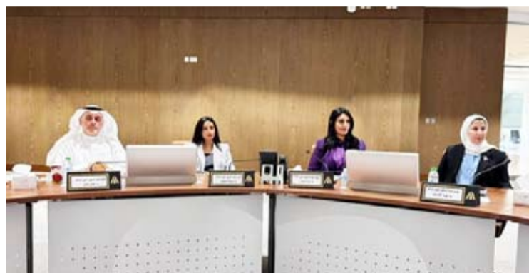
أعضاء البلدي اثناء الورشة