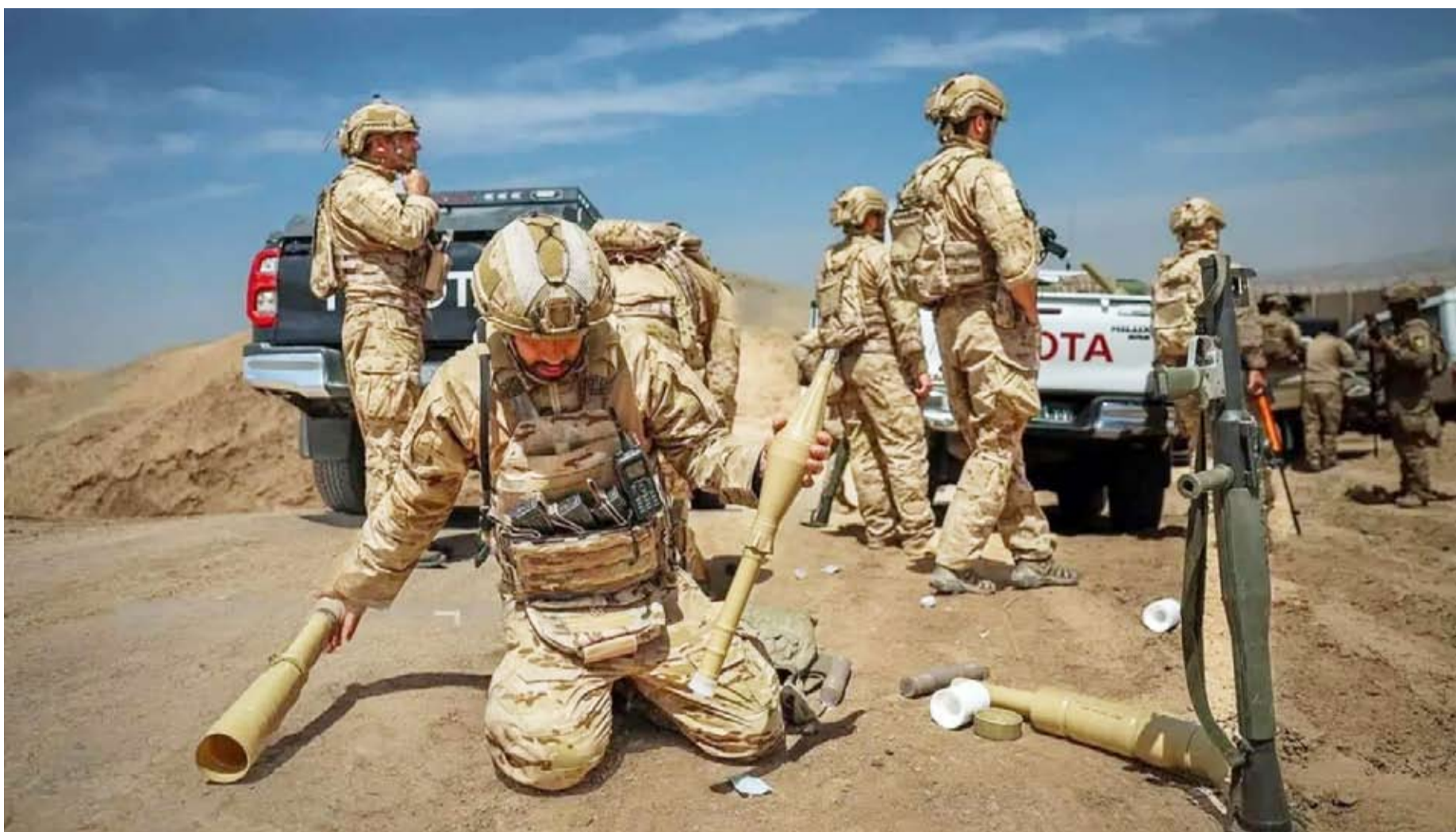
تدريبات «الحرس الثوري» في محيط العاصمة طهران

أجرى «الحرس الثوري» الإيراني مناورات عسكرية في محيط العاصمة طهران، استعداداً لأي مواجهة محتملة، وذلك غداة تحذير الرئيس الأمريكي دونالد ترامب من أن وقف إطلاق النار بات على شفا الانهيار، فيما لُوِّح نائب إيراني بارز بإمكان رفع تخصيب اليورانيوم إلى مستوى صنع السلاح إذا استؤنف النزاع.