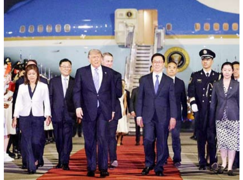
رؤساء كبرى الشركات الأمريكية يرافقون ترامب في زيارته إلى بكين

ويرافق ترامب في الزيارة كل من وزير الخارجية ماركو روبيو، ووزير الدفاع بيت هينغست، وممثلين عن 17 شركة أمريكية، بينهم مالك شركة «تسلا» إيلون ماسك، والرئيس التنفيذي لشركة «أبل» تيم كوك، ومؤسس شركة «إنفديا» ينسن هوانغ.