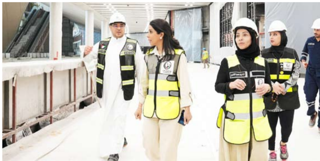
الوزيرة المشعان اثناء الجولة

قامت وزيرة الأشغال العامة الدكتورة نورة المشعان بزيارة ميدانية إلى مشروع مبنى الركاب الجديد (T2) في مطار الكويت الدولي، وذلك لمتابعة تقدم الأعمال والاطلاع على سير تنفيذ المشروع في مختلف مراحله الإنشائية والفنية. وتفقدت الوزيرة خلال الجولة عدداً من مرافق المشروع، حيث استمعت إلى شرح من المسؤولين والمهندسين القائمين على التنفيذ حول نسب الإنجاز الحالية وخطط العمل المقبلة، إضافة إلى أبرز التحديات المتعلقة بالمراحل المتبقية وآليات التعامل معها لضمان سير العمل وفق الخطة الموضوعية. وأكدت المشعان أهمية مواصلة الجهود وتسريع الإنجاز مع الالتزام الكامل بمعايير الجودة والسلامة، مشيرة إلى أن مشروع مبنى الركاب الجديد يمثل خطوة استراتيجيّة لدعم قطاع الطيران المدني وتعزيز قدرة الكويت على استيعاب النمو المتزايد في حركة السفر والنقل الجوي.