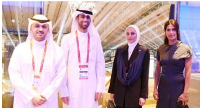
مشاركة البنك في حفل افتتاح دورة ألعاب الخليج

الكويتي إلى الدوحة ضمن ترتيبات رسمية، وفرت بموجبه طائرة خاصة مخصصة لوفد اللجنة الأولمبية الكويتية، وكان KIB قد رافق الوفد الرياضي