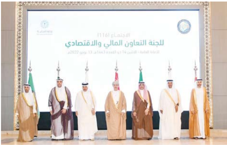
وزراء المالية بدول مجلس التعاون

شاركت الكويت في الاجتماع (116) للجنة التعاون المالي والاقتصادي بمجلس التعاون لدول الخليج العربية، حيث ترأس معالي وزير المالية وزير دولة للشؤون الاقتصادية والاستثمار عبدالوهاب محمد الرشيد وفد دولة الكويت المشارك، وذلك لزيادة التنسيق والتعاون وتوثيق الروابط بين دول الأعضاء في كافة الميادين ولا سيما في الجوانب الاقتصادية. وتم خلال الاجتماع مناقشة عدد من الموضوعات بشأن العمل الاقتصادي الخليجي، يأتي في مقدمتها آلية متابعة برنامج تحقيق الوحدة الاقتصادية بين دول مجلس التعاون لدول الخليج العربية بحلول عام 2025، والإطلاع على تقرير الأمانة العامة بشأن الخطوات المتبقية لقيام الاقتصاد الجمركي ونتائج اجتماعات لجنة السوق الخليجية المشتركة. كما قام معالي وزراء المالية بمناقشة مذكرة الأمانة العامة بشأن المواضيع المقترحة أن يقدم صندوق النقد الدولي دراسات بشأنها في الاجتماع المشترك للجنة التعاون المالي والاقتصادي ولجنة المحافظين بين دول مجلس التعاون لدول الخليج العربية ومدير عام صندوق النقد الدولي.