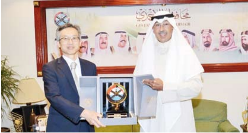
درع تذكارية من الشيخ فوزان الخالد لسفير اليابان

الخصوص، وذلك بحضور السكرتير الأول بالسفارة أوتا تاكيشي، حيث أهدى المحافظ الخالد للسفير ياسوناري في ختام اللقاء درعاً تذكارية، معرباً عن تمنياته له التوفيق والنجاح في الدفع بعلاقات الصداقة بين البلدين إلى آفاق أرحب.