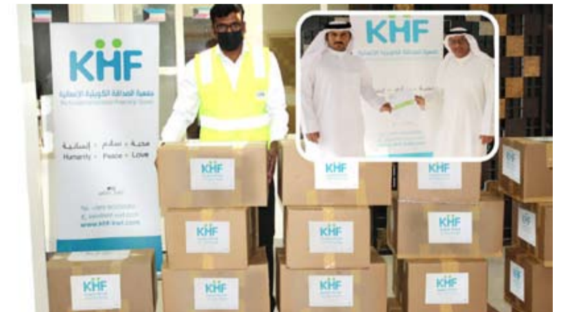
جانب من تقديم المساعدات