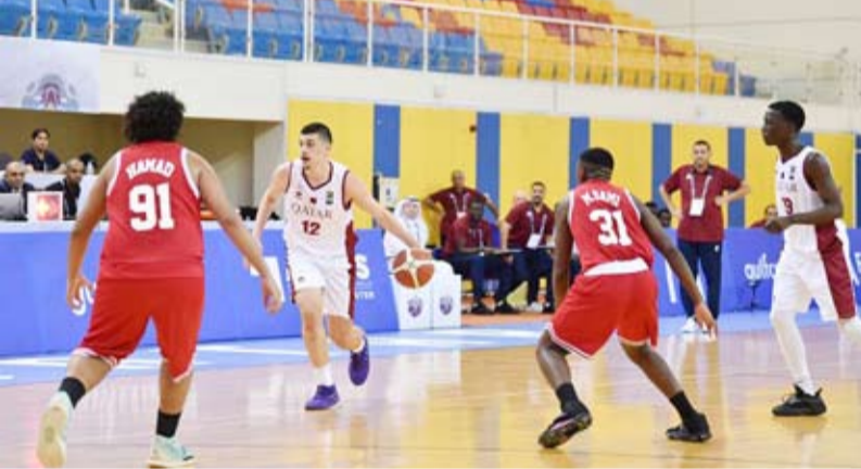
جانب من فعاليات البطولة التي انطلقت أمس في الدوحة

حيث كانت المدة قصيرة نتيجة مشاركتهم في الامتحانات الدراسية التي جرت خلال الأسبوعين الماضيين. وأفسد بان لاعبي المنتخب الكويتي كانت تتقهم اللياقة المناسبة لاسيما أنهم لم يتمكنوا من خوض أي مباراة محلية قبل البطولة معربا عن امله في أن يتمكن المنتخب من تحسين أدائه في المباريات المقبلة. وتم توزيع الفرق الـ 13 المشاركة بالبطولة على 4 مجموعات حيث تضم المجموعة الأولى منتخبيا قطر والبحرين والهند وأستراليا وتضم المجموعة الثانية ايران ولبنان واندونيسيا والمجموعة الثالثة الفلبين واليابان والكويت فيما تضم المجموعة الرابعة والاشيرة منتخبان كوريا ونيوزيلاندا وكازاخستان. وستاهل من هذه البطولة 4 منتخبات الى كأس العالم للعبة التي ستقام الشهر المقبل في مدينة ملقا الإسبانية.