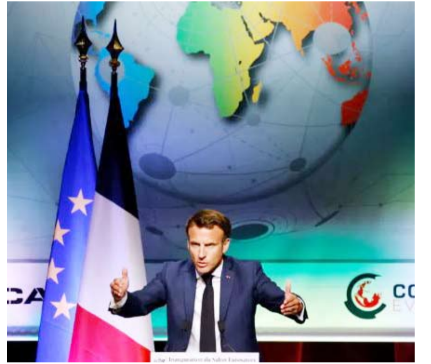
الرئيس الفرنسي: نحتاج إلى أوروبا قوية للحفاظ على السلام

ودعا الرئيس الفرنسي إلى زيادة الاستثمار في الصناعات الدفاعية، معتبراً أن «مشروع البوصلة الاستراتيجية للدفاع الأوروبي، هو ركيزة أساسية لسياستنا».