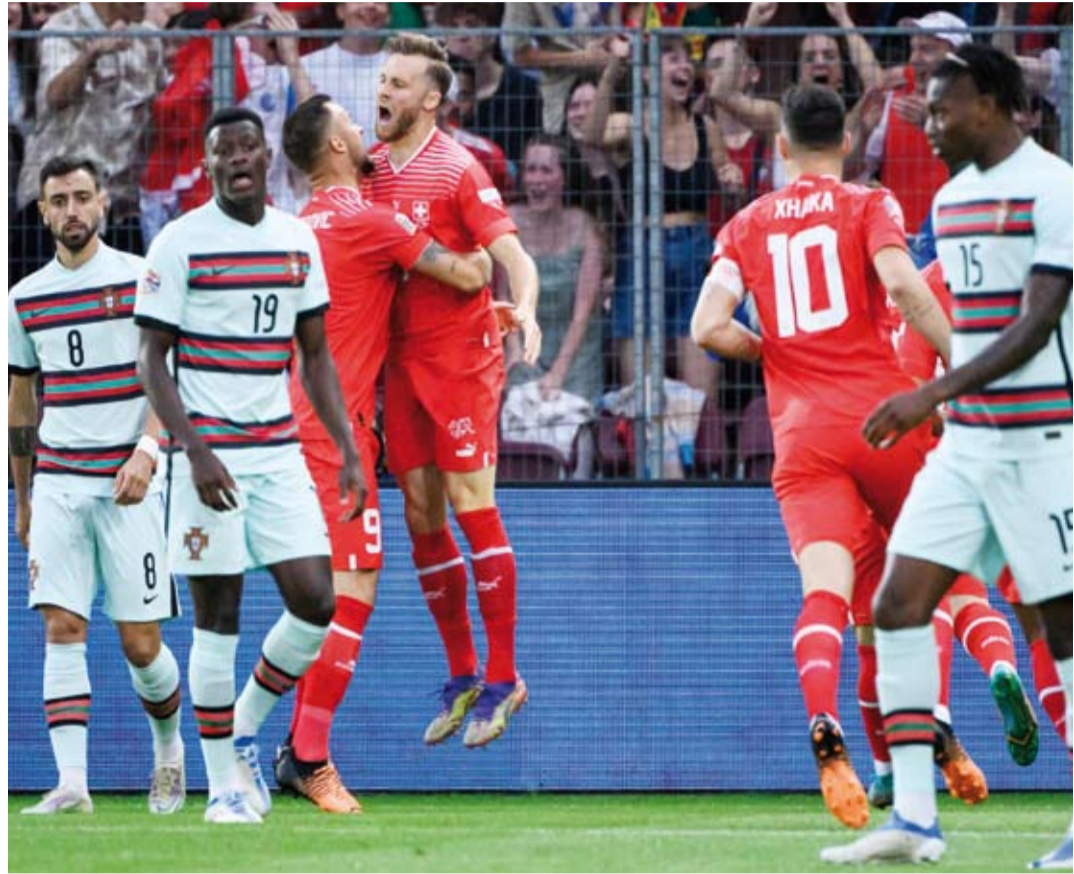
الصدارة إسبانية في دوري الأمم الأوروبية