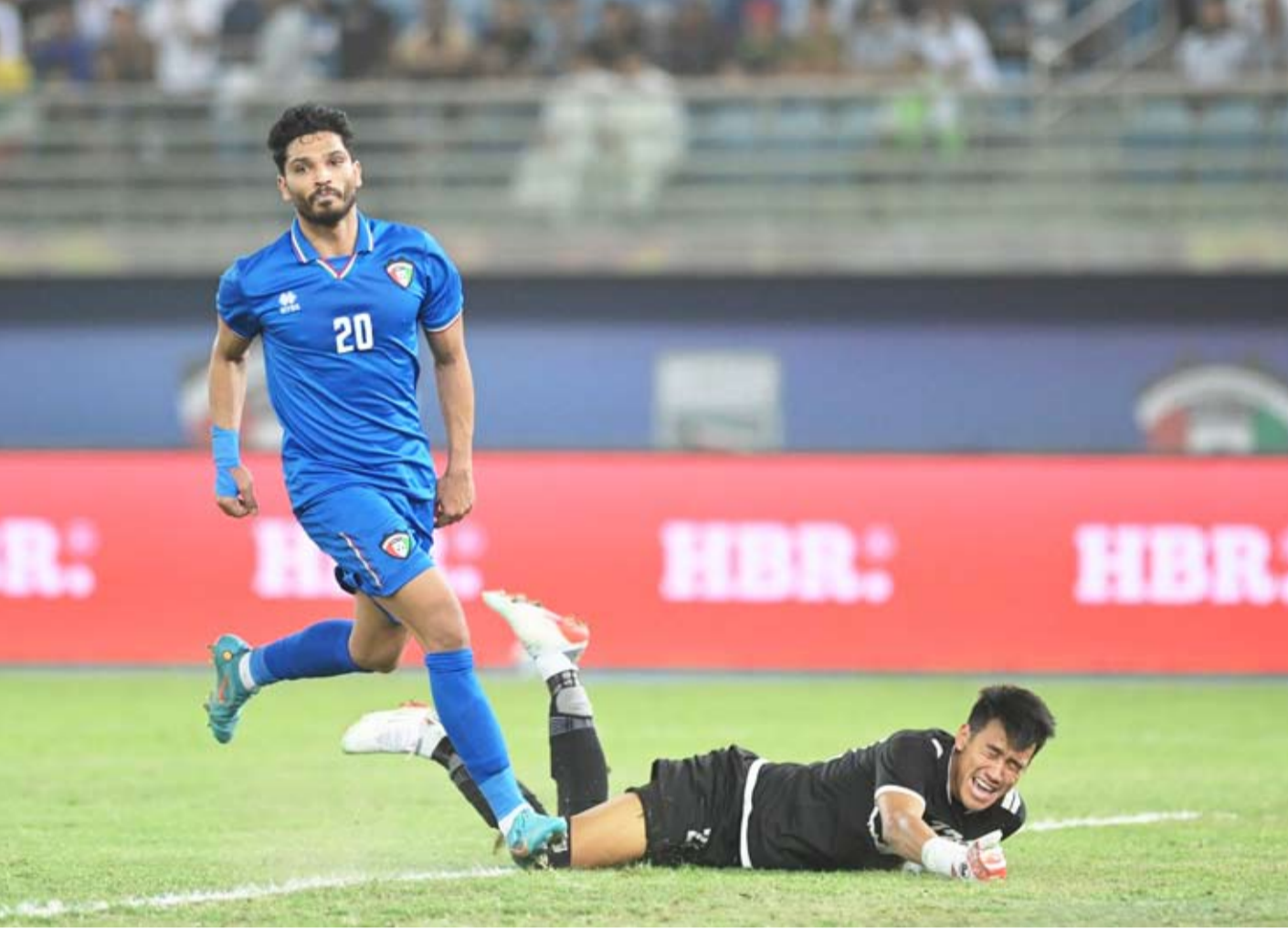
اداء مميز للكويت في مباراته أمام نيبال

خيار وحيد هو الفوز يدخل منتخبنا الوطني لكرة القدم مواجهة الأردن المقرر أن تجمع بينهما مساء اليوم عند الساعة والرابع على استاد جابر، ضمن منافسات الجولة الأخيرة بالمجموعة الأولى والمؤهلة لكأس آسيا 2023. كما يلتقي في المجموعة ذاتها المنتخبين الأندونيسي والنيبالي عند العاشرة والرابع. يرفع منتخبنا الوطني لكرة القدم شعار الفوز ولا غيره في مواجهة المرتبة أمام الأردن مساء اليوم عند الساعة والرابع، ضمن منافسات الجولة الأخيرة بالمجموعة الأولى والمؤهلة لكأس آسيا 2023. كما يلتقي في المجموعة ذاتها المنتخبين الأندونيسي والنيبالي. ويحتل المنتخب الأردني صدارة المجموعة برصيد 6 نقاط، ومن ثم المنتخب الأندونيسي برصيد 3 نقاط، وبأفضلية المواجهات المباشرة مع الأزرق، صاحب الرصيد