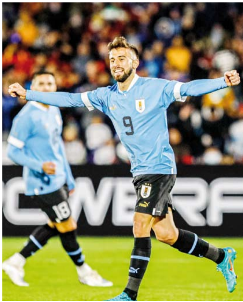
الأسطورة الإيطالية بيرو

أعلن نادي فاتح كاراغومروك التركي عن تعاقدته مع المدرب الإيطالي أندريا بيرلو لموسم واحد. ودرّب بيرلو (43 عاماً) فريق يوفنتوس بحت 23 عاماً ثم كلف بتدريب الفريق الأول خلفاً لماوريسيو ساري. وقال نادي مدينة إسطنبول على حسابه على تويتر «وَقَّعَ بيرو عقداً للتدريب كاراغومروك لمدة عام اعتباراً من الأول من يوليو». وانتهى كاراغومروك الموسم الفائت في المركز الثامن في الدوري التركي.