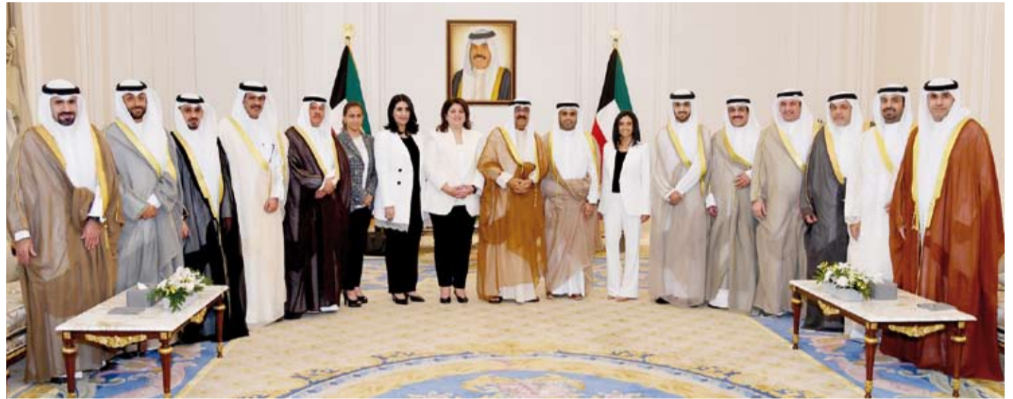
سمو ولي العهد يستقبل الوزيرة رنا الفارس وأعضاء المجلس البلدي