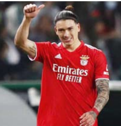
المهاجم الأوروغواياني داروين نونييس

توصل نادي ليفربول الانجليزي إلى اتفاق مع نادي بنفيكا البرتغالي لنضم المهاجم الأوروغواياني داروين نونييس مقابل 75 مليون يورو. ووفقا لنادي بنفيكا فإن قيمة الصفقة قد ترتفع في نهاية المطاف إلى 100 مليون يورو، متجاوزة الرقم القياسي الذي دفعه ليفربول لساو نيمبوتون وهو نحو 90 مليون دولار لضم قلب الدفاع الهولندي فيرجيل فان ديك في العام 2018. وانضم نونييس إلى صفوف بنفيكا في صيف عام 2020 قادماً من المرييا الإسباني، الذي كان وقتها يلعب في الدرجة الثانية، مقابل 24 مليون يورو في أعلى صفقة في تاريخ قلب مدينة لشبونة.