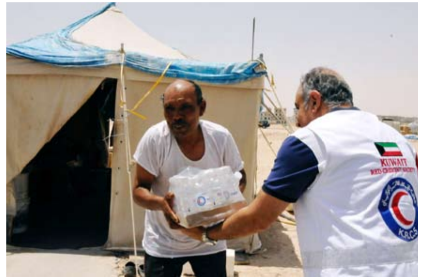
جمعية الهلال الأحمر الكويتي توزع 2400 عبوة مياه على العمال

المجتمع لهم ولما يقدمونه من إسهامات لخدمة الوطن، مبيّناً أن الجمعية وفرت شاحنات مبردة ومجهزة لتوزيع المياه الباردة في الكثير من المواقع الإنشائية.