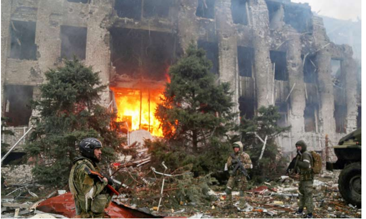
جنود روس قرب مصنع ازوف للصلب

يتوقع السفير الأوكراني أندريه ميلينيك أن يتعهد المستشار الألماني أولاف شولتس بزيارة دبابات ألمانية إلى أوكرانيا خلال زيارته لكييف. وقال ميلينيك في تصريحات لوكالة الأنباء الألمانية: «من دون أسلحة ألمانية ثقيلة، لن نتمكن لألصف من كسر التفوق العسكري الروسي الهائل وإنقاذ أرواح الجنود والمدنيين... يتوقع الأوكرانيون أن يعلن المستشار أولاف شولتس عن حزمة مساعدات جديدة من الأسلحة الألمانية خلال زيارته إلى كييف، والتي يجب أن تشمل بالتأكيد دبابات قتالية رئيسية من طراز (ليوبارد 1) ومركبات مشاة قتالية من طراز (مارادر)، والتي يمكن تسليمها على الفور». وبحسب تقارير إعلامية، يعتزم شولتس السفر إلى كييف هذا الشهر