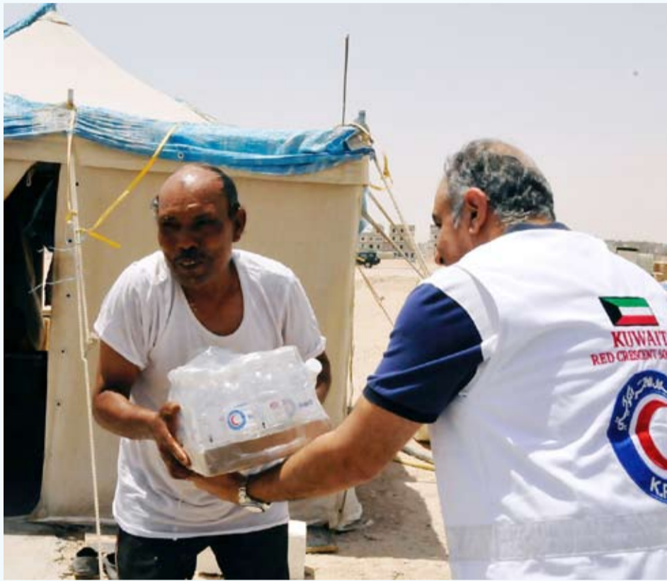
جانب من توزيع 2400 عبوة مياه باردة على العمال في منطقة المطلاع