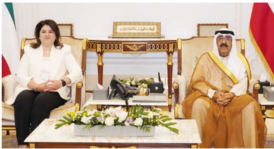
سمو ولي العهد يستقبل وزيرة البلدية

استقبل سمو ولي العهد الشيخ مشعل الأحمد، بقصر بيان العامر، صباح أمس، وزير الدولة لشؤون البلدية ووزير الدولة لشؤون الاتصالات وتكنولوجيا المعلومات، الدكتورة رنا الفارس، حيث قدمت لسموه، رئيس المجلس البلدي عبدالله عبدالعزيز المحري وأعضاء المجلس المنتخبين والمعينين.