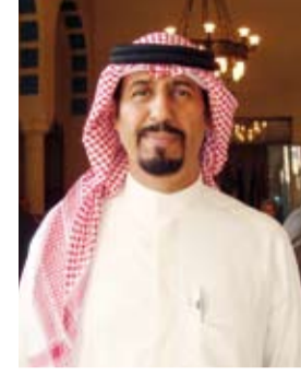
الشيخ علي الخالد

وتمنّى الخطط الطموحة والرائدة لزيادة سبل الراحة لخدمة قاصدي المدينة المنورة من قبل الأمير فيصل بن سلمان،