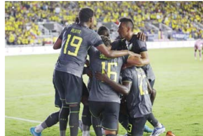
لاعب الأوروغواي يحتفلون بالفوز

في المقابل يستعد منتخب كاب فيردي لمواصلة خوضه منافسات التصفيات المؤهلة لكأس أمم أفريقيا التي تقام في كوت ديفوار العام المقبل.