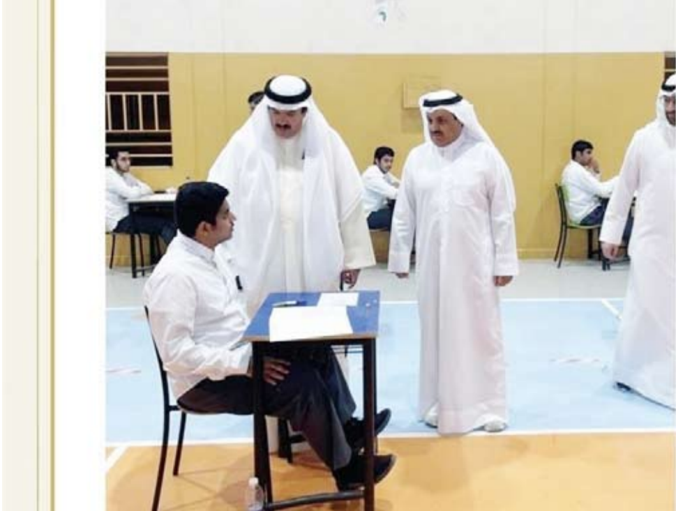
المضف يتحدث مع أحد الطلبة