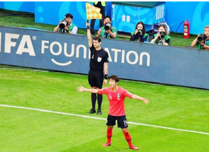
الاتحاد الدولي لكرة القدم قطع شوطا لإقرار تقنية نصف آلية

«نصف آلية» لأن القرار النهائي في احتساب التسلسل من عدمه يبقى في نهاية المطاف من صلاحية حكم الفيديو المساعد «في أي آر»، خلافا لتكنولوجيا خط المرمى التي تحدد بشكل جازم تجاوز الكرة للخط. وتعتمد التقنية الجديدة على كاميرات في سقف الملعب المتابعة اللاعبيين ومساعدة الحكام على تقدير نقطتين حاسمتين: اللحظة التي يتم فيها تمرير الكرة أو لمسها، وموقع كل جزء من أجزاء أجسام اللاعبيين المعنيين استنادا إلى خط التسلسل الوهمي. وستنقل البيانات التي تم جمعها، في الوقت الفعلي تقريبا إلى خلية حكم الفيديو المساعد، والقرار النهائي يكون دائما على عاتق الحكم نفسه حسب ما شدد الاتحاد الدولي للعبة... وتم اختيار نظام التتبع البصري لأول مرة في كأس العرب العام الماضي في قطر، ثم في كأس العالم للأندية في أبوظبي.