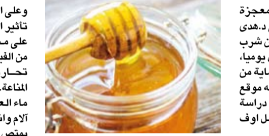
ماء العسل يساعد على التخلص من الآم وانتفاخ البطن

وعلى الرقيق، مشيرة إلى أن ماء العسل لديه تأثير المضادات الحيوية ويحتوي أيضاً على مضادات الأكسدة، فضلاً عن العديد من الفيتامينات والمعادن والإنزيمات، التي تحارب البكتيريا وبالتالي تقوية جهاز المناعة. وأز دفت: أفادت الدراسة أن استعمال ماء العسل يومياً يساعد على التغلب على آلام وانتفاخ البطن، لأن هذا السائل الصحي يمتص الغازات المتواجدة في الأمعاء ويخفف من الأوجاع. واختتمت: ماء العسل هو عبارة وصفة بسيطة للغاية، تتمثل فقط في مزج ملعقة من العسل الصافي مع ماء دافئ ينصح بشربه في الصباح الباكر على معدة فارغة.