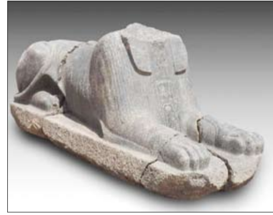
الكشف عن قاعدة تمثال الملك أحمدس الثاني

رئيس قطاع الآثار المصرية بالمجلس الأعلى للآثار ورئيس البعثة من الجانب المصري، إن البعثة نجحت كذلك في الكشف عن بعض الدلائل على الوجود المبكر لهذه المنطقة، حيث تم الكشف عن العديد من الطبقات الأثرية يرجع تاريخها إلى عصر الأسرة صفر (فترة نقادة الثالثة) بالإضافة إلى طبقات من رديم الفخار، والذي يشير إلى نشاط ديني وطقسي في الألف الثالث قبل الميلاد بالموقع، فضلا عن وجود أدلة تشير إلى التواجد الكبير خلال عصر الأسرة الثالثة والرابعة حيث عثر البعثة على قطعة من الجرانيت للملك بيبي الأول (2280 ق م) عليها نقش بالبارز للصقر حورس، لافتا إلى أن البعثة ستستمر في أعمال حفائرها للكشف عن المزيد.