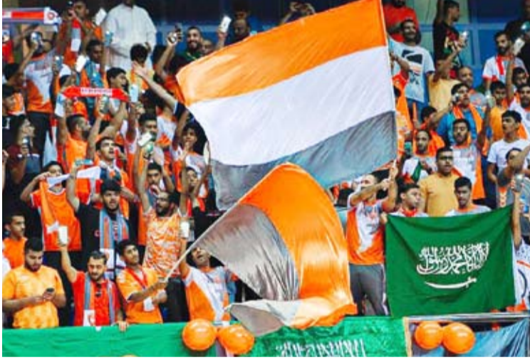
حضور جماهير مميز في مجمع سعد العبد الله للصالات