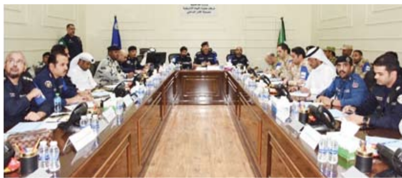
جانب من المشاركين في التطبيق المكثبي

إدارة العمليات الطارئة من خلال مجموعة من السيارات يوهات لإعمال تخریبية، ويهدف تمرين «تعاون 3» إلى رفع مستوى الجاهزية الأمنية بين الجهات العسكرية والمدنية المشاركة، كما يساهم في تبادل الخبرات والمعلومات واتخاذ القرارات المناسبة خصوصاً في الحالات الطارئة.