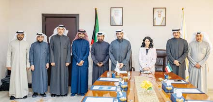
جانب من المشاركين في توقيع الاتفاقية