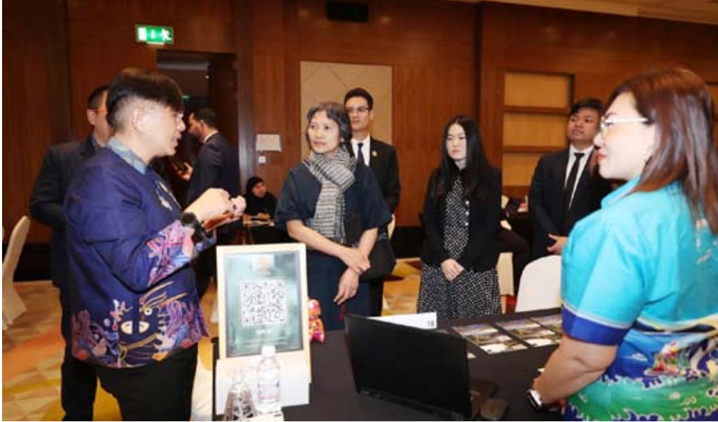
القائم بالأعمال بالإنابة بسفارة تايلاند خلال الفعالية

الماضي، وأقل من 10 آلاف قبل جائحة كوفيد19—، ما يعكس تزايد الاهتمام الكويتي بالوجهة.