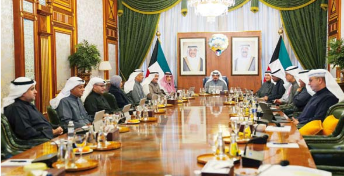
العبدالله يترأس اجتماع مجلس الوزراء أمس

في بداية يناير 2027 مشيراً إلى أنه باعتماد معيار (XBRL) في منظومة وزارة التجارة والصناعة في عام 2026 من شأنه أن يجعل دولة الكويت ومنظومتها التجارية في مصاف الدول المتقدمة على مستوى دقة البيانات المالية التجارية في المنطقة.