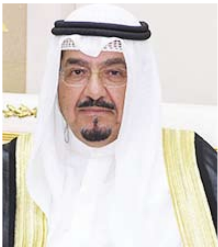
سمو الشيخ أحمد العبد الله

بعث سمو الشيخ أحمد العبدالله رئيس مجلس الوزراء ببرقية تعزية إلى خادم الحرمين الشريفين الملك سلمان بن عبدالعزيز آل سعود ملك المملكة العربية السعودية الشقيقة ضمنها سموه خالص تعازيه وصادق مواساته بوفاة المغفور لها بإذن الله تعالى والده صاحب السمو الملكي الأمير شقران بن سعود بن عبدالعزيز آل سعود.