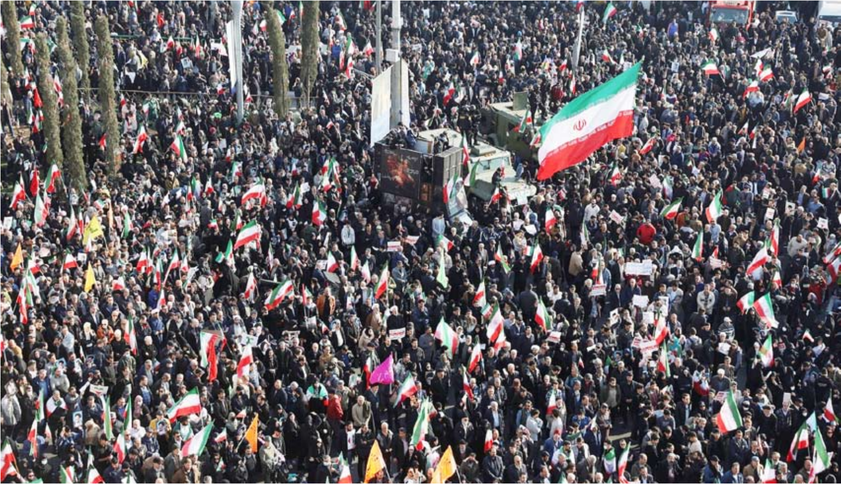
مسيرة احتجاجية في طهران

تجد الجمهورية الإسلامية الإيرانية نفسها أمام واحدة من أكثر اللحظات التاريخية حرجاً منذ عقود؛ حيث تتقاطع الأزمات الداخلية المتفجرة مع ضغوط خارجية غير مسبوقة، لترسم مشهداً ضبابياً يضع النظام والشعب على حد سواء أمام خيارات مصيرية. ومع مطلع عام 2026، لم يعد الحديث في الصالونات السياسية في طهران يقتصر على الملف النووي فحسب، بل بات يتمحور حول «البقاء الاقتصادي» و«الاستقرار المجتمعي». ودخل الاقتصاد الإيراني مرحلة «السقوط الحر» خلال الساعات الـ48 الماضية، بعد أن سجل الريال تراجعاً تاريخياً أمام الدولار الأمريكي، متجاوزاً حاجز المليون وأربعمئة ألف ريال للدولار الواحد في السوق الموازي. هذا التدهور لم يمر بسلام على قطاع التجارة؛ حيث شهد «البازار الكبير» في طهران ومدن أصفهان وشيراز إغلاقات جزئية واضرابات صامتة، بعد أن عجز التجار عن تسعير بضائعهم في ظل تقلبات الساعة الواحدة.