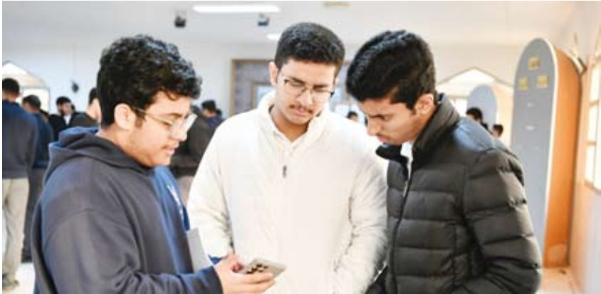
ختام اختبارات نهاية الفصل الدراسي الأول

اختتمت وزارة التربية أمس اختبارات نهاية الفصل الدراسي الأول للفصل الثاني عشر في القسم العلمي وسط أجواء اتسمت بالانضباط والتنظيم داخل لجان الامتحانات ومتابعة تربوية وإدارية حثيئة. وتقدم طلبة القسم العلمي لاختبار مادة الكيمياء فيما تقدم طلبة القسم الأدبي لاختبار مادة تاريخ