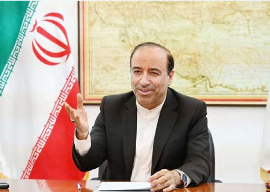
السفير محمد توتونجي

وإلى أن نتائج التحقيقات ستُعلن وعرض توتونجي فيلما وثائقيا خلال المؤتمر قال إنه يوثق أنشطة جماعات ومؤسسات إرهابية خلال المظاهرات في بلاده.