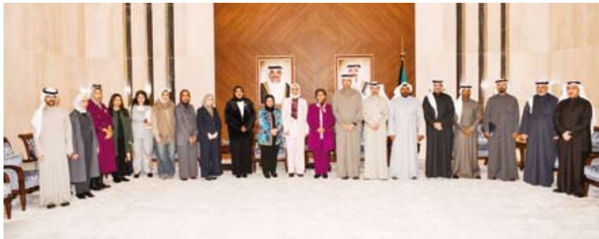
الشيخة جواهر الصباح تتوسط المشاركين

المعنية استعرض خطة إعداد التقرير والرد على التوصيات الدولية بهذا الخصوص. وأفادت أن (الخارجية) وبالتعاون مع المفوضية السامية لحقوق الإنسان التابعة للأمم المتحدة ستستلزمان دورة تدريبية في فبراير المقبل بمشاركة الجهات المعنية للعمل على مواءمة التطور مع تلك التوصيات. ومن المزمع أن تقدم دولة الكويت تقريرها الرابع في جنيف في أكتوبر القادم تأكيداً منها للعمل المستمر من أجل الارتقاء بحالة حقوق الإنسان.