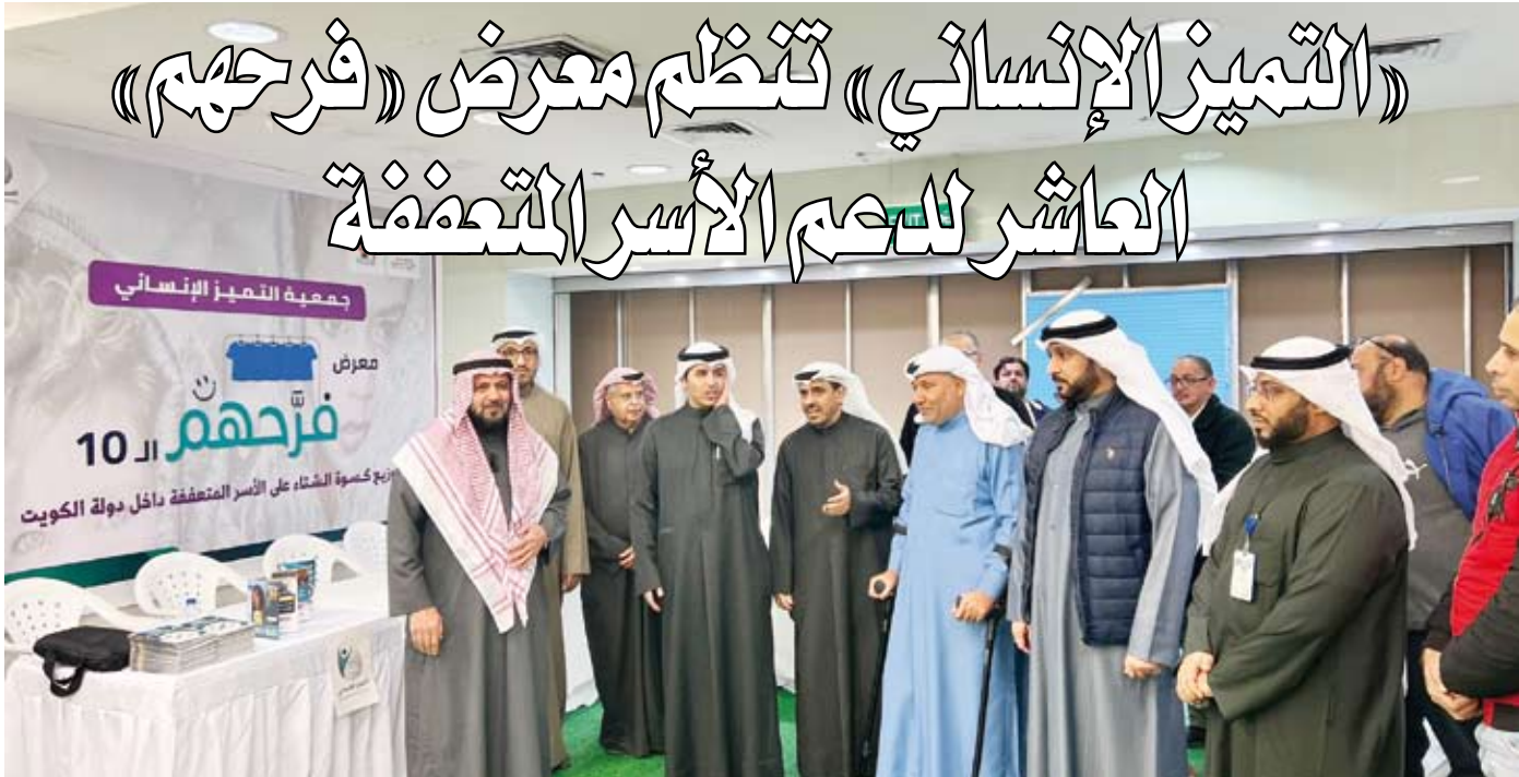
جانب من افتتاح المعرض

من جانب آخر أحاط النائب الأول لرئيس مجلس الوزراء ووزير الداخلية الشيخ فهد اليوسف نتائج الزيارة الرسمية لوزير الداخلية بمملكة البحرين الشقيقة الفريق أول ركن الشيخ راشد بن عبدالله بن أحمد