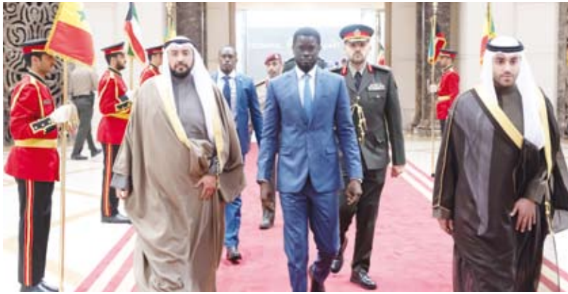
الرئيس السنغالي مغادراً وفي وداعه الشيخ الدكتور باسل الحمود

غادر البلاد صباح أمس الرئيس بشيرو جوماي فاي رئيس جمهورية السنغال الصديقة والوفد الرسمي المرافق، وذلك بعد زيارة رسمية أجرى فخامته خلالها مباحثات رسمية مع حضرة صاحب السمو أمير البلاد الشيخ مشعل