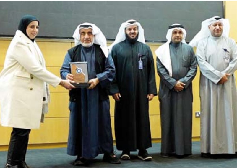
النجاح الخيرية تسعى لاستقطاب العمالة الوطنية المميزة

اختتمت وزارة التربية أمس اختبارات نهاية الفصل الدراسي الأول للفصل الثاني عشر في القسم العلمي وسط أجواء اتسمت بالانضباط والتنظيم داخل لجان الامتحانات ومتابعة تربوية وإدارية حثيئة. وتقدم طلبة القسم العلمي لاختبار مادة الكيمياء فيما تقدم طلبة القسم الأدبي لاختبار مادة تاريخ