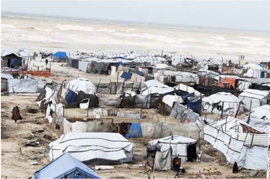
غالبية سكان قطاع غزة يعيشون في مخيم

قالت صحيفة نيويورك تايمز إنها علمت من عدة مسؤولين أن الولايات المتحدة تقترب من تشكيل لجنة من الكنتوقراط الفلسطينيين للإشراف على إدارة قطاع غزة ورجحت أن يتم الإعلان عن تشكيلة هذه اللجنة.