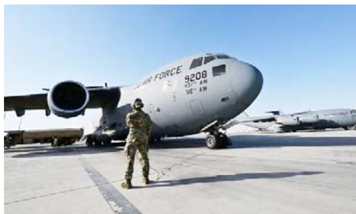
استعدادات لمغادرة عدد من القوات الأميركية بالمنطقة