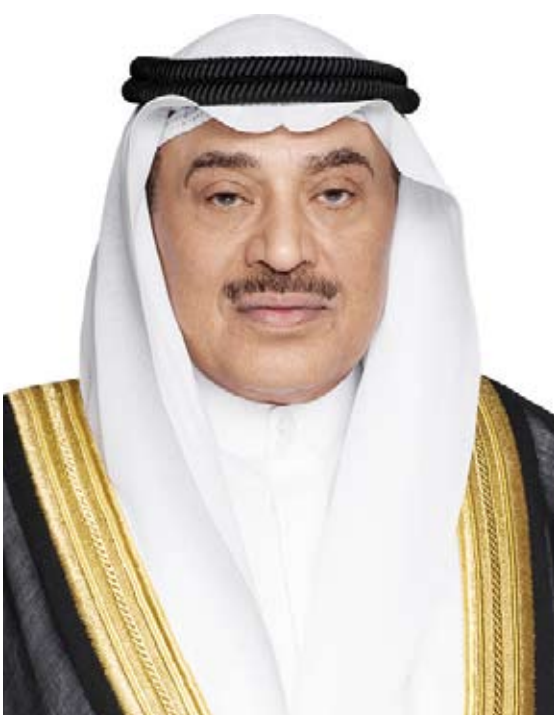
سمو ولي العهد الشيخ صباح الخالد

بعث سمو ولي العهد الشيخ صباح الخالد ببرقية تعزية إلى خادم الحرمين الشريفين الملك سلمان بن عبدالعزيز آل سعود ملك المملكة العربية السعودية الشقيقة ضمنها سموه خالص تعازيه وصادق مواساته بوفاة المغفور لها بإذن الله تعالى والده صاحب السمو الملكي الأمير شقران بن سعود بن عبدالعزيز آل سعود، سائلاً المولى تعالى أن يتغمد الفقيدة بواسع رحمته ويسكنها فسيح جناته وأن يلهم الأسرة المألقة الكريمة وذوي الفقيدة جميل الصبر والسلوان.