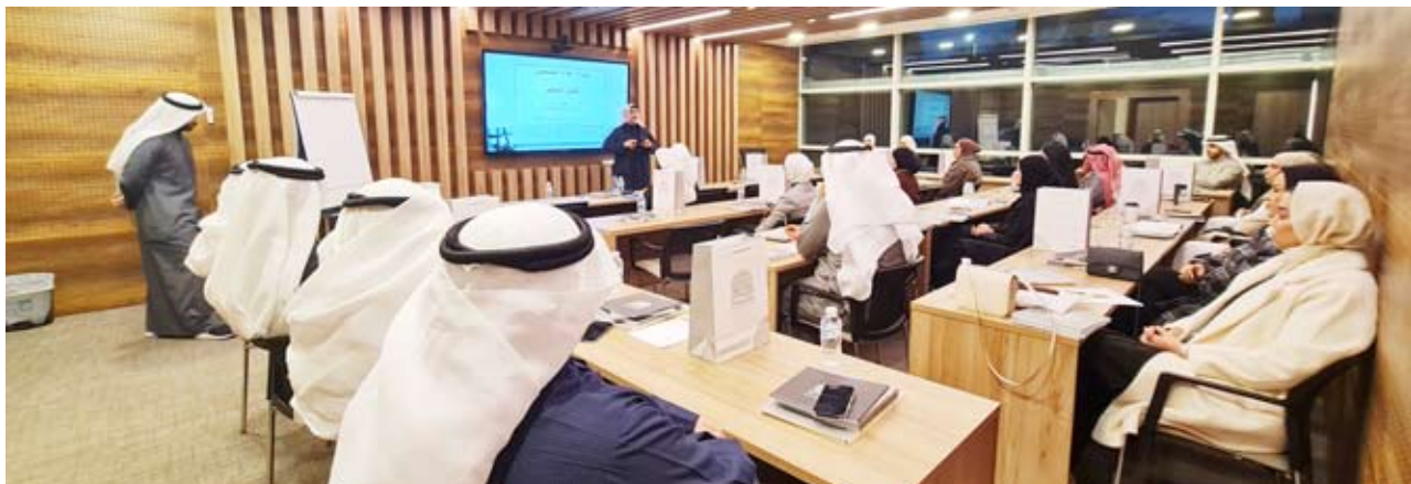
مشاركون في برنامج إعداد المحكمين

التحكيم وإجراءات دعوى التحكيم، بما في ذلك المركز القانوني للمحكم وإدارة جلسات التحكيم. المرحلة الثالثة: مخصصة لـ "حكم التحكيم وصياغته"، وتتضمن التدريب على بيانات الحكم والمداولة وإصدار الأحكام. صرح المركز بأن هذا البرنامج يعد امتداداً لرسالته في تقديم طرق بديلة وسريعة لحل المنازعات التجارية، مما يعزز من ثقة المستثمرين في النظام القانوني الكويتي، وتختتم الدورة بتنفيذ ورش عمل وقضايا تحكيمية صورية لضمان اكتساب المشاركين للمهارات العملية اللازمة لإدارة العملية التحكيمية بكفاءة.