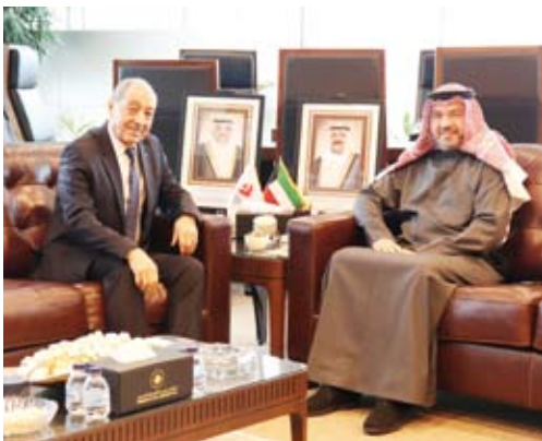
الحمود و بلحاج خلال اللقاء

بحث رئيس الهيئة العامة للطيران المدني الشيخ حمود مبارك الحمود مع سفير الجمهورية الجزائرية الديمقراطية الشعبية لدى دولة الكويت عمر بلحاج سبل تعزيز التعاون المشترك في مجالات الطيران المدني.