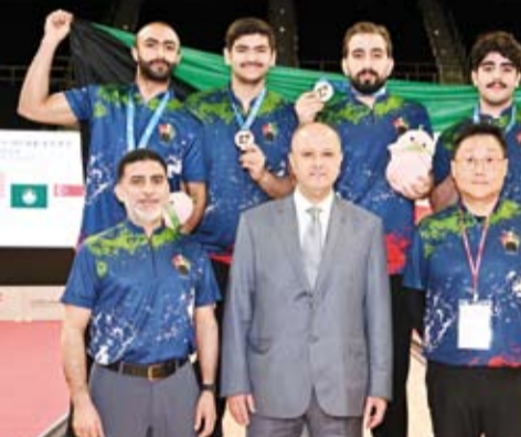
فريق الكويت لرياضة البولنيغ على منصة التتويج

الشيخ أحمد عبدالله الأحمد الصباح مؤكداً أن توجهاتهم السديدة ودعمهم المتواصل للرياضة والرياضيين لها بالغ الأثر في نفوس الجميع كما توجه بالشكر إلى الهيئة العامة للرياضة على دعمها وتذليل كافة العقبات التي تواجه الرياضيين في الكويت وأشاد بالمجهود الجيد للاعبين خلال البطولة وإصرارهم على وضع الكويت على خارطة العالم الرياضية في رياضة البولنيغ