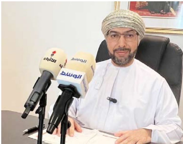
السفير العماني متحدثاً لوسائل الاعلام المحلية

كان لزيارات جلالة السلطان إلى كثير من دول العالم خلال السنوات الخمس الماضية دوراً مهماً في تعزيز العلاقات الثنائية والتأكيد على الثوابت المستقرة في سياستها الخارجية