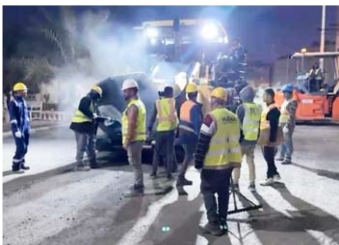
جانب من أعمال الصيانة