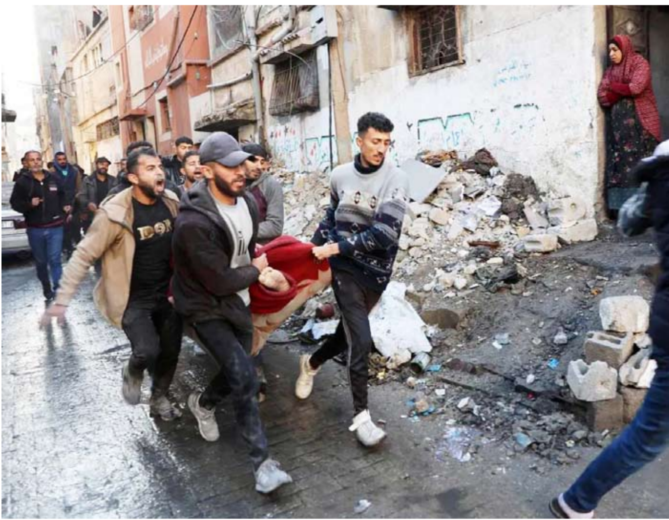
جثة شهيد في غارات جوية

وأكدت اللجنة التنفيذية المركزية للحزب، في بيان، أن «الإصرار على فرض الأوصياء على البلديات التي جاء رؤساؤها من خلال صناديق الاقتراع، هو خطوة تهدف إلى تخريب إمكانية الحل والسلام».