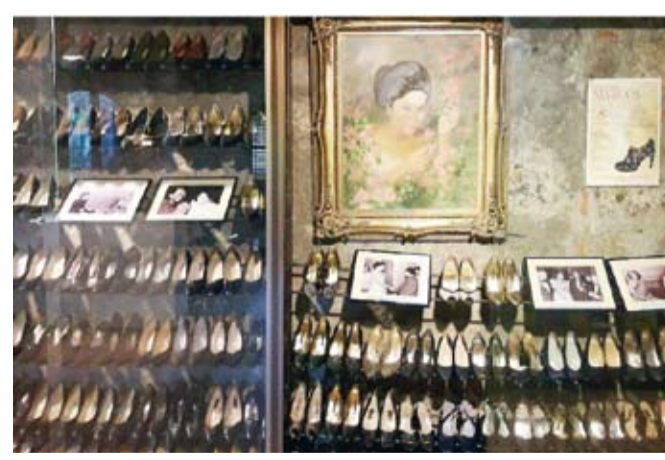
جانب من متحف الأحذية

كان هناك نحو 800 زوج من الأحذية العالمية مثل غوتشي وديور وفيراغامو وبرادا. وعندما افتتح المتحف قبل نحو ربع قرن بحضور إيميلدا ماركوس،