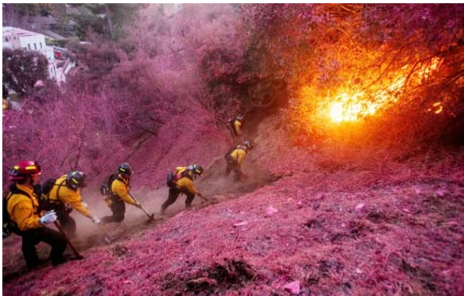
رجال الإطفاء يسعون لإخماد الحرائق

ونوهت القرارات بأن معظم فصائل السويدياء أبدت استعدادها للانضمام إلى جيش قائم على أسس وطنية لا محاصصة فيه. كما أشارت إلى أن بعض الفصائل المسلحة في درعا طرحت فكرة وضع خصوصية مناطقيه خاصة بها.