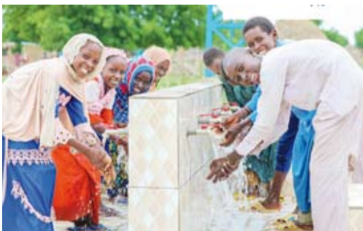
أحد الأبار نفذته جمعية النجاة في النيجر