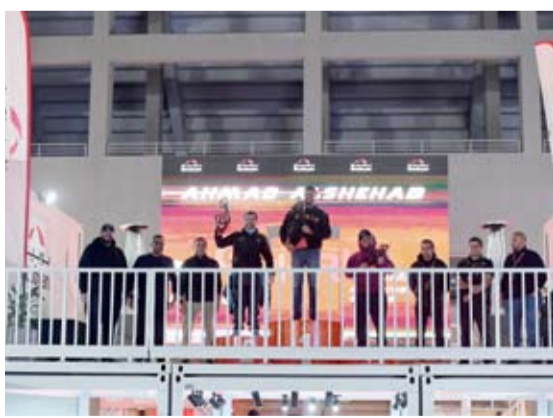
البسام وفريق بويان أثناء تكريم أحد الفرق الفائزة

اختتم بنك بويان مشاركته ورعايته الرئيسية لسباق Gulf Run، إحدى أضخم الفعاليات الرياضية في رياضة المحركات على مستوى منطقة دول الخليج، وذلك بعد اختتام فعاليات السباق النهائية الذي أقيم مؤخراً في مدينة الكويت لرياضة المحركات. وقد شهد هذا الحدث الرياضي المميز مشاركة أهم اللاعبين والمحترفين من عشاق رياضة سباق السيارات والدرجات النارية وسط أجواء تحدي رياضية حماسية وحضور جماهيري كبيراً حيث ضم العديد من المطاعم والكافيات، المناطق المخصصة للأطفال، عمالو على مجموعة من الفعاليات والأنشطة الرياضية والفقرات الترفيهية المماشبية مع الأجواء العائلية والشبابية ومختلف الأعمار.