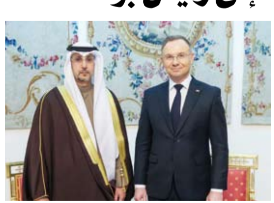
سعد المهيني ورئيس الجمهورية أندجيه دودا خلال مراسم الاعتماد

وقال السفير المهيني: إن دولة الكويت مهتمة بتنمية العلاقات بما يخدم شعبي البلدين الصديقين من خلال رفع مستوى التبادل التجاري والاستثماري والسياحي وتعزيز التعاون في المجالين الغذائي والتكنولوجي. وأشار إلى أهمية استثمار فترة رئاسته دولة الكويت الحالية لمجلس التعاون الخليجي ورئاسة بولندا والنماء للبلدين الصديقين.