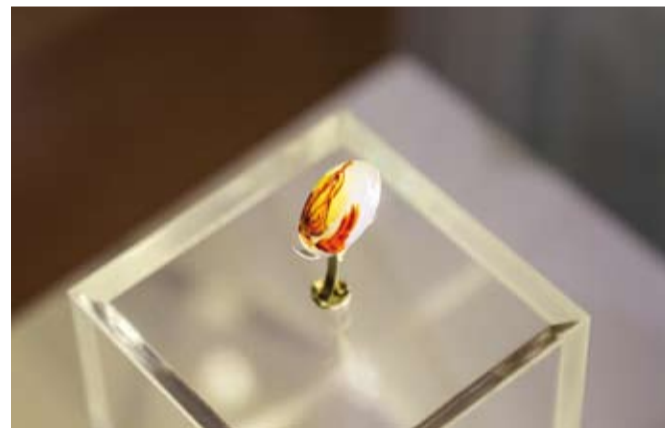
إحدى الأحجار النادرة

افتتحت المؤسسة العامة للحي الثقافي «كتارا»، النسخة الأولى لمعرض «الإبداع الإلهي»، وذلك بحضور عدد من السفراء وممثلي البعثات الدبلوماسية المعتمدين لدى الدولة، بالإضافة إلى جمهور الثقافة والفنون. ويسلط المعرض الذي يتواصل حتى 27 يناير الجاري، الضوء على التكوينات والرسومات الطبيعية النادرة للأحجار، التي تبدو وكأنها لوحات فنية تعكس قصصاً ومشاهد واقعية، مما يبرز الإبداع الإلهي في تشكيل الطبيعة عبر ملايين السنين.