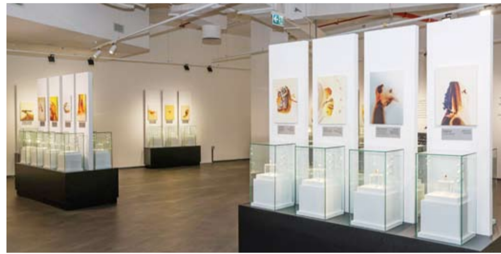
جانب من المعرض