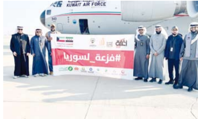
الجهات الرسمية المشاركة ضمن الجسر الجوي الكويتي إلى سورية

الرسمية الكويتية المشرفة على العمل الإنساني الكويتي والمنظمة له وعلى رأسها وزارات الدفاع والخارجية والشؤون الاجتماعية والعمل والإعلام، ممثلة دور الجمعيات والهيئات الخيرية الكويتية الشريكة في العمل الإنساني الكويتي المشترك والجهود الشعبية الكويتية في دعم ومساعدة المحتاجين في الدول الشقيقة والصديقة.