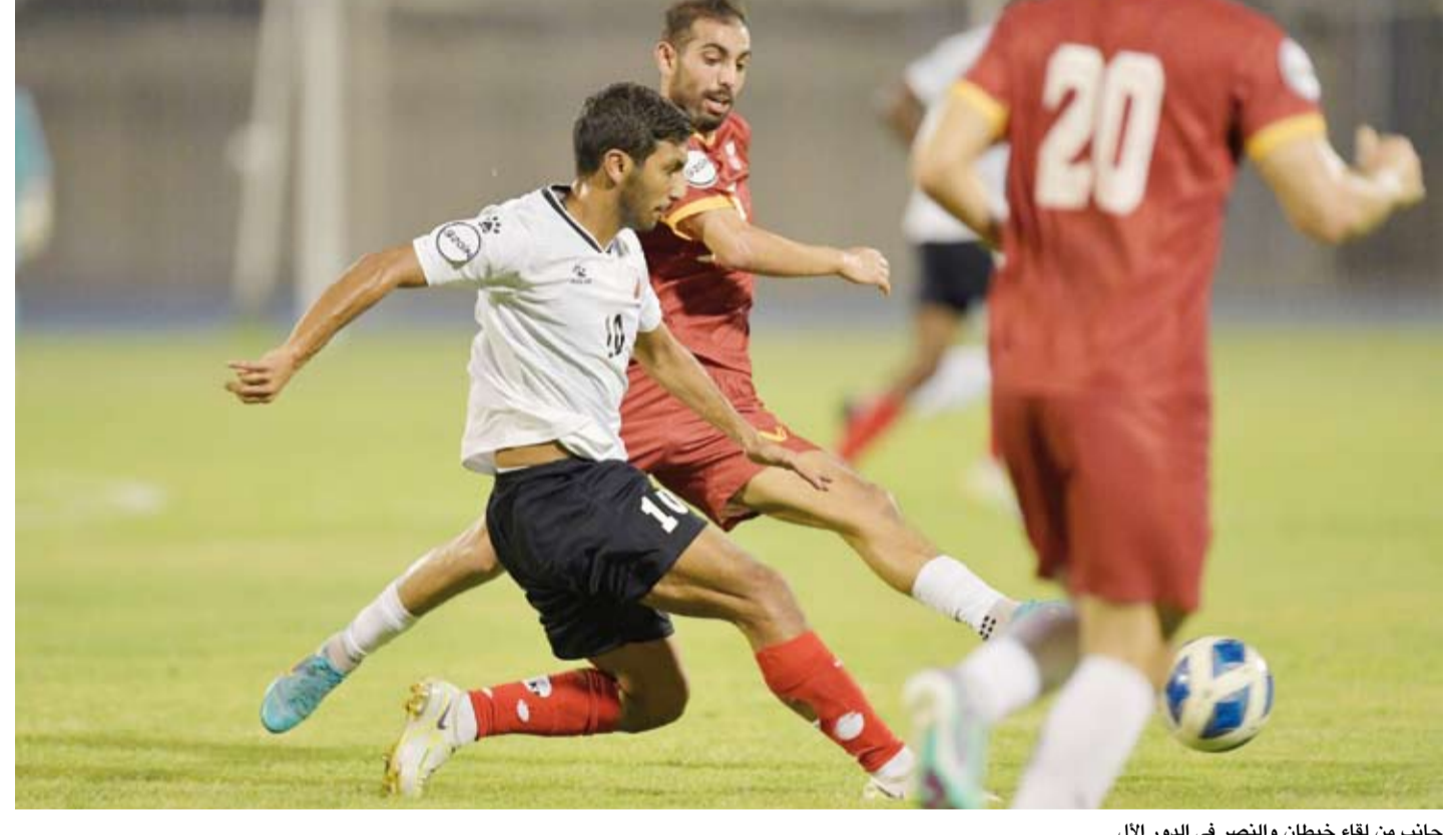
جانب من لقاء خيطان والنصر في الدور الال

في الدقيقة 77. وبهذه النتيجة عزز الكويت صدارته لترتيب البطولة بوصوله إلى النقطة 30 في حين أبقى الفحيحيل على نقاطه الـ17 بالمركز الرابع. وتستكمل الجولة يوم غد الثلاثاء بمواجهتي العربي مع التضامن والبرموك مع القادسية فيما تختتم بعد غد بقاء خيطان مع نظيره النصر ومواجهة السالمية مع كاظمة.