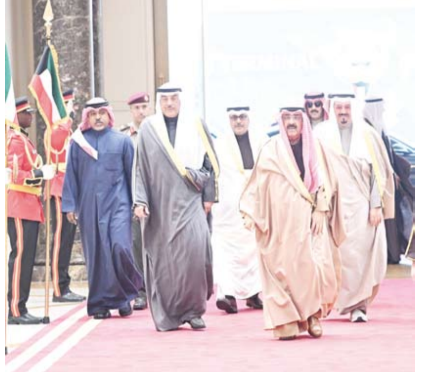
سمو أمير البلاد يتوجه إلى المملكة المتحدة

غادر صاحب السمو أمير البلاد الشيخ مشعل الأحمد، والوفد الرسمي المرافق لسموه أرض الوطن، صباح أمس، متوجهاً إلى اسكتلندا - المملكة المتحدة الصديقة وذلك تلبية لدعوة شخصية من صاحب الجلالة الملك تشارلز الثالث ملك المملكة المتحدة لبريطانيا العظمى وإيرلندا الشمالية الصديقة.