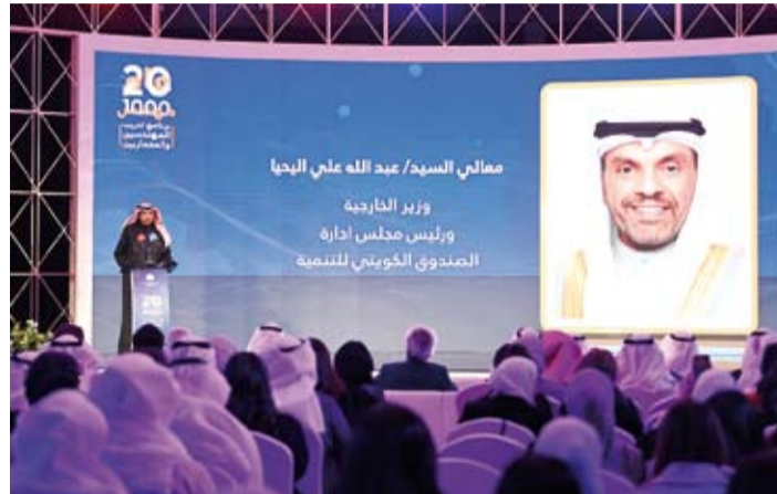
وزير الخارجية عبدالله الحيحا متحدثاً خلال الاحتفالية

المدرين والمختصين في المجالات العلمية والعملية داخل دولة الكويت وخارجها. وذكر أن البرنامج يشمل ثلاث مراحل تتضمن (الأولى) منها ومدتها ثلاثة أشهر تدريب المهندسين داخل الصندوق الكويتي للتنمية من خلال تقديم دورات من قبل متخصصين وعمل تطبيقات عملية فيما تشمل المرحلة الثانية ومدتها ستة أشهر التدريب في شركات دولية ذات خبرة لاكتساب المهندسين والمعماريين.