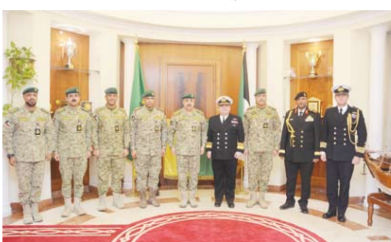
الفريق هاشم الرفاعي يستقبل مستشار الدفاع الأول البريطاني والوفد المرافق بحضور كبار القادة

له تحيات قيادة الحرس الوطني ممثلة برئيس الحرس الوطني الشيخ مبارك حمود الجابر الصباح ونائبه الشيخ فيصل نواف الأحمد الصباح. وذكر أنه تم خلال اللقاء بحث سبل تعزيز التعاون التدريبي العسكري في ظل اهتمام قيادة الحرس الوطني بتحقيق أهداف الوثيقة التوجيهية للحرس الوطني 2025 (حماية وسند) عبر التعاون والشراكة مع المؤسسات العسكرية في الدول الشقيقة والصديقة.