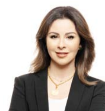
السفيرة الشخبة الزين الصباح

ودعت المواطنين الكويتيين إلى التواصل مع القنصلية العامة والمكتب الثقافي في (لوس أنجلوس) في حالات الطوارئ عبر الرقمين التاليين: القنصلية العامة في لوس أنجلوس 3102793644 المكتب الثقافي في لوس أنجلوس 3107464789.