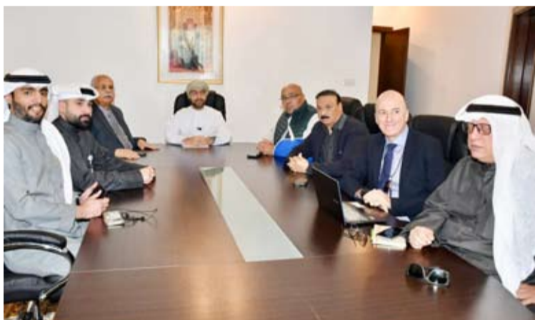
السفير العماني والزملاء الصحفيين

الاعمال مقدمة 27 مركزاً عن العام 2023. وأضاف السلطنة أقرت الحكومة بتوجيه سام من جلالاته منظومة الحماية الاجتماعية التي تراعي الظروف الاقتصادية لجميع المواطنين لاسيما الفئات الاقل دخلاً.