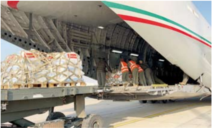
نقل المساعدات الإغاثية المتنوعة إلى داخل الطائرة