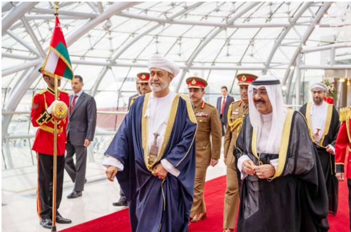
صاحب السمو أمير البلاد والسلطان هيثم بن سعيد في زيارة سابقة

وتمثل نقله في مسار التعاون الاقتصادي والاستثماري بين سلطنة عمان ودولة الكويت، ونموذجاً مالياً للتعاون بين دول مجلس التعاون الخليجي، وأضاف الى هذا المشروع العلاقات مشروع الصناعات البتر وكيمياوية الذي ينتظر ان يبدأ قريباً باستثمار مشترك يبلغ نحو 7 مليار دولار بالإضافة إلى خزانات النفط في رأس مركز