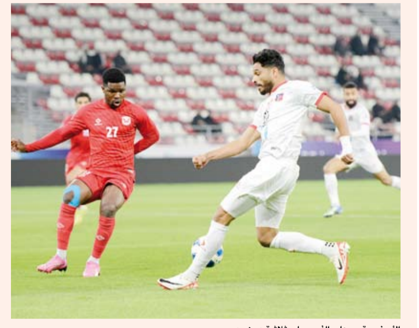
الأبيض يقسو على الفحيحيل بثلاثة دون رد

في الدقيقة 77. وبهذه النتيجة عزز الكويت صدارته لترتيب البطولة بوصوله إلى النقطة 30 في حين أبقى الفحيحيل على نقاطه الـ17 بالمركز الرابع. وتستكمل الجولة يوم غد الثلاثاء بمواجهتي العربي مع التضامن والبرموك مع القادسية فيما تختتم بعد غد بقاء خيطان مع نظيره النصر ومواجهة السالمية مع كاظمة.