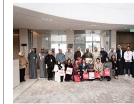
الوفد الزائر مع مسؤولي البنك

كما يتم استخدام أجهزة استشعار لتقليل استهلاك الكهرباء. كذلك، تم تخصيص مساحات خضراء داخل الفروع، فضلاً عن توفير وحدات لشحن السيارات الكهربائية في أفرع مختارة. وأشاروا إلى أن البنك يطبق العديد من المبادرات داخل البنك وخارجه، لخفض انبعاثات الكربون، وتحسين الفروع المجددة بتصميم يركز على الاستدامة، حيث يتم تقليل استهلاك الكهرباء بفضل استخدام الألواح الشمسية والإضاءة الطبيعية.