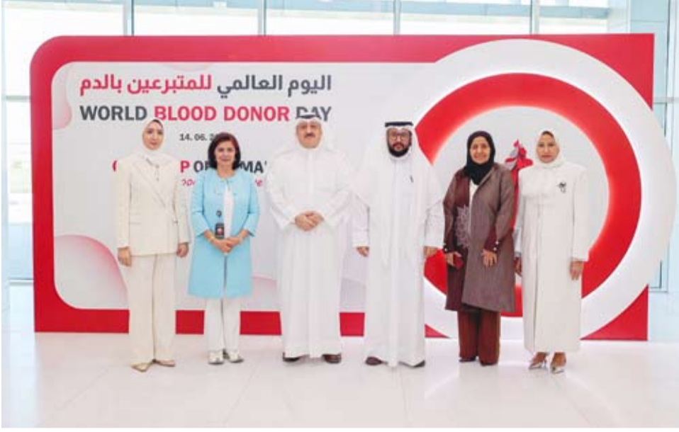
مراكز وينوك شهدت الدم إقبالا واسعا من المواطنين والمقيمين