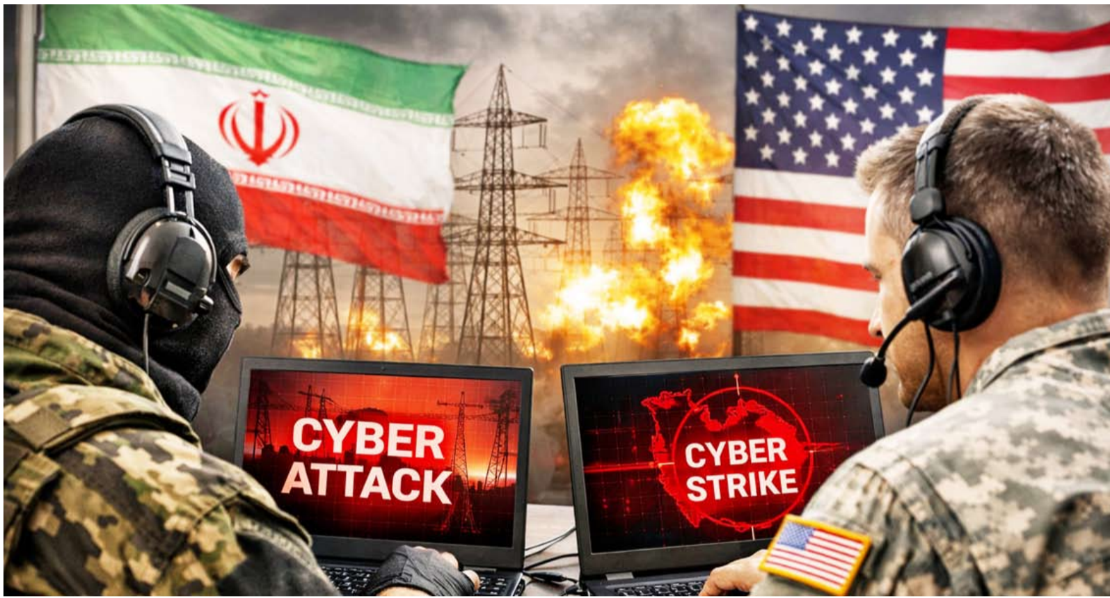
تم الإعلان عن تفاهم مبدئي فقط

خصوصاً في ظل تباين مواقف الطرفين بشأن الضمانات المطلوبة وآليات تنفيذ أي التزامات مستقبلية، الأمر الذي قد يؤجل الإعلان عن اتفاق نهائي أو يدفع نحو تمديد المشاورات لفترة إضافية. وتراقب الأسواق العالمية ودوائر الطاقة هذه التطورات عن كثب، نظراً لما قد يترتب على أي انفراجة في العلاقات بين واشنطن وطهران من تأثيرات محتملة على أسواق النفط والتجارة الدولية وحركة الاستثمارات، فضلاً عن انعكاساتها على ملفات الأمن والاستقرار في منطقة الشرق الأوسط.