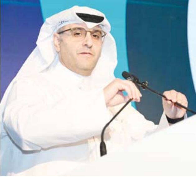
المشاري متحدداً خلال افتتاح الملتقى

وحضر الملتقى عدد من ممثلي الجهات الحكومية والمؤسسات المالية والاستثمارية والبنوك الكويتية والجهات المعنية بالقطاع الإسكاني إلى جانب المطورين العقاريين والمكاتب الهندسية والبنوك الاستثمارية وشركات المقاولات والتعمير. وتضمن الملتقى -في يومه الأول- عدداً من الجلسات النقاشية المتخصصة تناولت الفرص الاستثمارية للمطورين العقاريين في الكويت بمشاركة ممثلين عن المؤسسة العامة للرعاية السكنية والقطاع العقاري والإنشائي، حيث ناقش المشاركون سبل تعزيز دور المطور العقاري في معالجة الملف الإسكاني وتوسيع نطاق الشراكة بين القطاعين العام والخاص وتسريع تنفيذ المشروعات السكنية والتنموية.