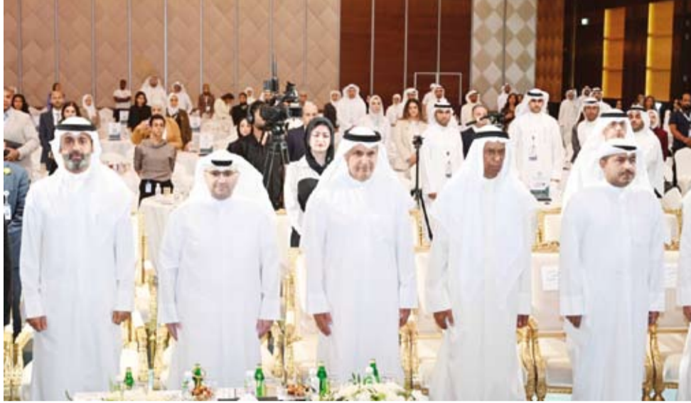
وزير الإسكان يتقدم الحضور