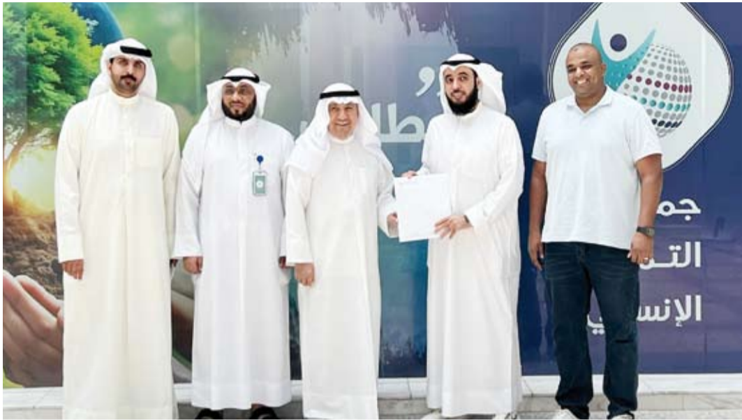
جانب من تسلم التقرير الخاص بالمشروع

في خطوة تعكس أهمية التكامل بين مؤسسات العمل الخيري والإنساني في دولة الكويت، وقعت جمعية التميز الإنساني اتفاقية تعاون مع جمعية التكافل لرعاية السجناء لتنفيذ مشروع الإفراج عن الغارمين، وذلك في إطار الجهود المشتركة الرامية إلى دعم الفئات المتعززة مالياً وتعزيز الاستقرار الاجتماعي والأسري. وجسدت هذه الشراكة نموذجاً متميزاً للتعاون المؤسسي، حيث ساهمت جمعية التميز الإنساني في دعم وتمويل المشروع، فيما تولت جمعية التكافل لرعاية السجناء متابعة الحالات المستحقة واستكمال الإجراءات القانونية والإدارية اللازمة، بما أسفر عن الإفراج عن عدد كبير من الغارمين وإعادة الأمل لهم ولأسرهم، وتمكينهم من بدء صفحة جديدة في حياتهم بعيداً عن الإغواء والالتزامات التي أثقلت كاهلهم.