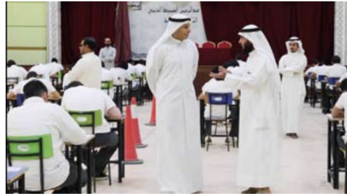
جانب من امتحانات الصف الثاني عشر لطلبة التعليم الديني

وأكد المطيري تطبيق إجراءات تنظيمية دقيقة داخل اللجان، من بينها ترك مسافة لا تقل عن متر بين كل طالب وآخر، ومنع أي شكل من أشكال التواصل أو الحديث داخل قاعات الامتحان، إضافة إلى حظر قيام الملاحظين أو رؤساء اللجان بقراءة أو تفسير أسئلة الامتحان للطلبة. وبين أن أي تصحيح أو تعديل في ورقة الأسئلة يتم فقط بناء على تعليمات رسمية تصدر من الجهات المختصة في وزارة التربية ويتم إبلاغها للجان وفق الإجراءات المعتمدة. وأشار إلى أن الامتحانات سارت بصورة منتظمة، وأكد المطيري أن اللجان وفرت جميع الترتيبات اللازمة لضمان راحة الطلبة، بما في ذلك تنظيم آلية خروج الطلبة بعد انقضاء نصف زمن الامتحان، متمنياً للجميع دوام التوفيق والنجاح.