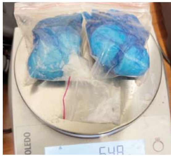
إحباط محاولة لتهرب مواد مخدرة

وتهدف الإدارة العامة للجمارك من إقامة مثل هذه المزادات تعظيم الإيرادات المحصلة للدولة وتعتبر من ضمن استراتيجيات الإدارة العامة للجمارك لتعزيز موارد الدخل.