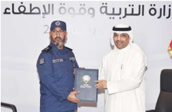
اللواء طلال الرومي والوكيل المساعد للتربية محمد الخالدي

التعاون يمثل خطوة مهمة نحو تعزيز التكامل المؤسسي بين الجانبين بما يتيح الاستفادة من عدد من مرافق الوزارة لدعم الاحتياجات التشغيلية والتدريبية والتوعوية لقوة الإطفاء العام بما يسهم في تطوير كفاءة العمل والارتقاء بجاهزية منتسبيها.