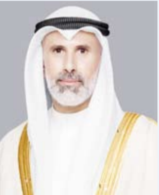
الشيخ جراح الجابر

أجرى وزير الخارجية الشيخ جراح الجابر، أول أمس، اتصالاً هاتفياً مع رئيس مجلس الوزراء وزير خارجية دولة قطر الشقيقة الشيخ محمد بن عبدالرحمن بن جاسم آل ثاني، وذكرت وزارة الخارجية - في بيان - أنه جرى خلال الاتصال استعراض آخر التطورات التي تشهدها المنطقة والجهود المبذولة حيالها ولا سيما التقدم المحرز في المفاوضات القائمة للتوصل إلى النص النهائي لاتفاق السلام المزمع إبرامه ما بين الجانبين الأمريكي والإيراني.