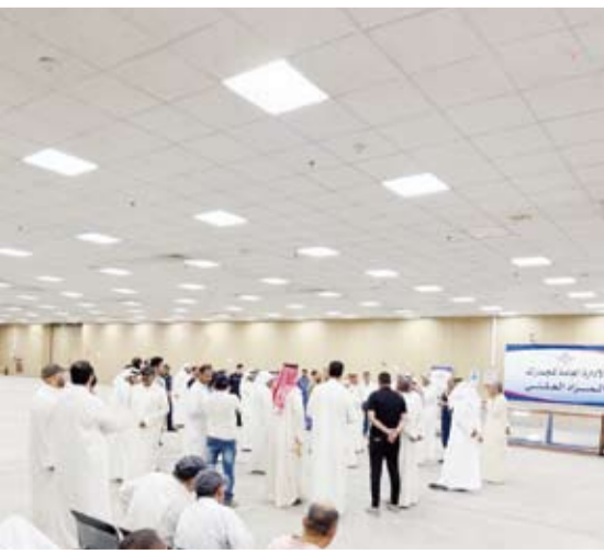
جانب من المزاد العلني