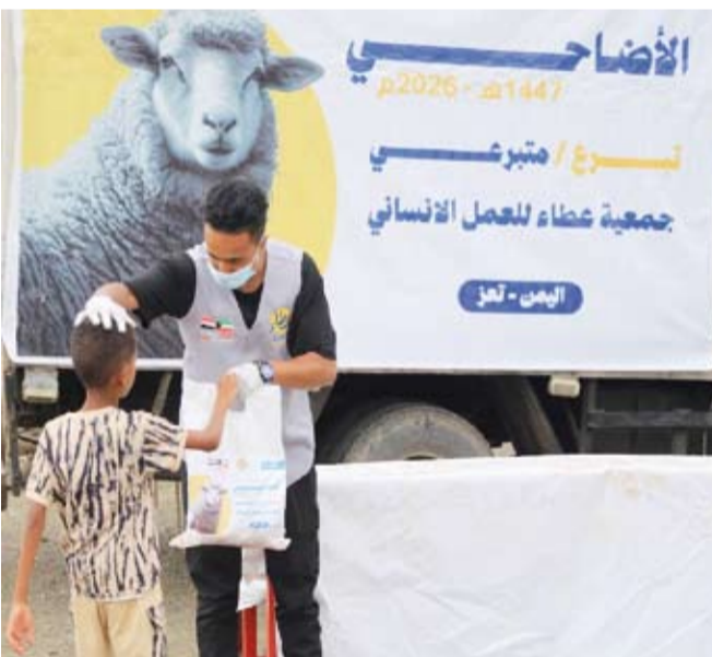
توزيع الأضاحي في اليمن