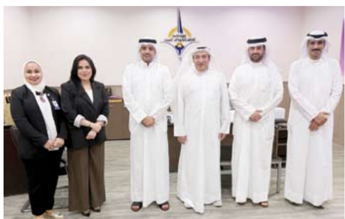
مدير إدارة الاعتماد الأكاديمي في «التطبيقي» مستقبلاً وفد أكاديمية سعد العبدالله

حيث أكد أهمية الاستفادة من تجربة الهيئة الرائدة في هذا المجال.