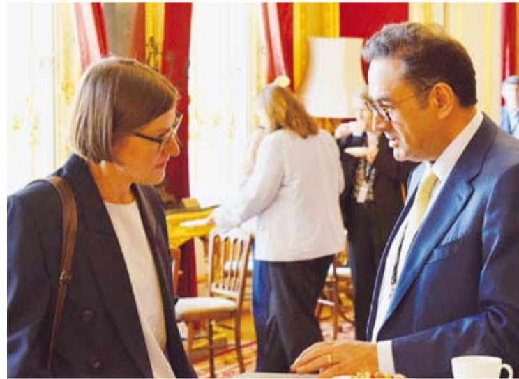
مساعد وزير الخارجية السفير صادق معرفي خلال لقائه رئيسة اللجنة الدولية للصليب الأحمر ميريانا سيولاريش

شارك مساعد وزير الخارجية الكويتي لشؤون المنظمات الدولية السفير صادق معرفي في الاجتماع السنوي في لندن لمجموعة المانحين الداعمين التابعة للجنة الدولية للصليب الأحمر. وذكرت سفارة دولة الكويت في لندن في بيان، أول أمس، أن الاجتماع الذي عقد يومي أمس الأول والخميس وأسس الجمعة ناقش سبل تعزيز كفاءة المنظومة الإنسانية الدولية وتطوير آليات الاستجابة للآزمات في ظل التحديات المتزايدة التي يشهدها العمل الإنساني مع التأكيد على أهمية بناء شراكات أكثر فاعلية واستدامة بين اللجنة الدولية والدول المانحة. وأشار البيان إلى أن السفير معرفي التقى خلال المناسبة رئيسة اللجنة الدولية للصليب الأحمر ميريانا سيولاريش، حيث جرى بحث سبل توطيد التعاون القائم بين دولة الكويت واللجنة الدولية لا سيما في ملف المفقودين