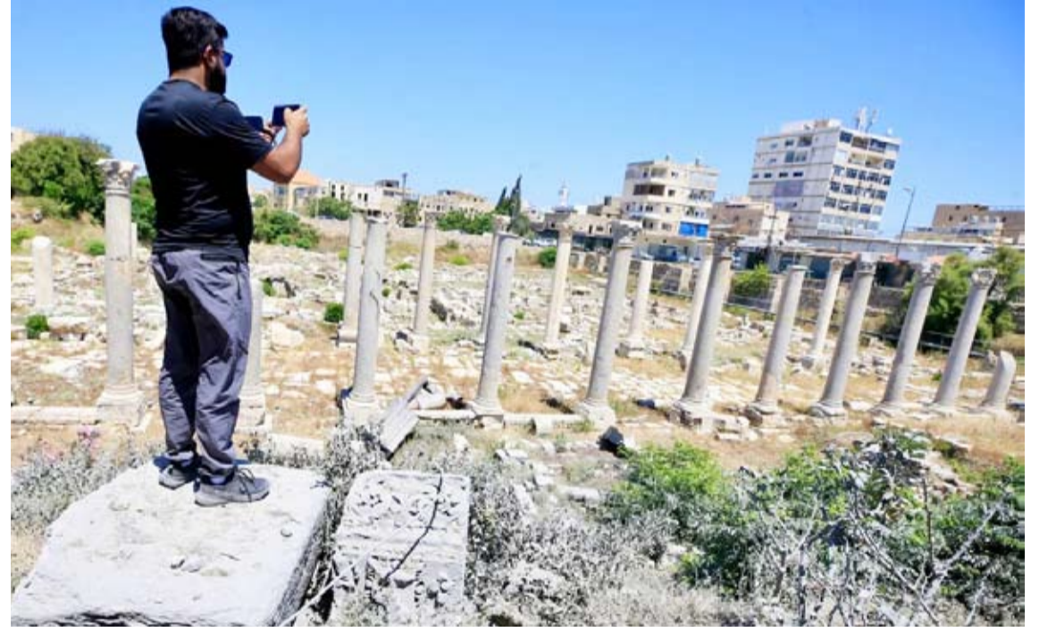
مواقع أثرية في مدينة صور بعد الغارات

تواصل قوات الاحتلال الإسرائيلي عملياتها العسكرية المكثفة في مخيمات شمالي الضفة الغربية، مخلقة وراءها دماراً واسعاً وموجات نزوح جماعي طالت عشرات الآلاف من المواطنين. وبحسب الإحصاءات، أسفرت هذه العمليات عن تدمير ما يزيد على 3 آلاف وحدة سكنية بشكل كامل، فضلاً عن إلحاق أضرار متفاوتة بالآلاف المنازل الأخرى. وتحذر أوساط محلية وحقوقية من أن استمرار هذا الاستهداف المنهوج يحمل في طياته مساعي لفرص واقع ديمغرافي وجغرافي جديد داخل المخيمات، يهدف إلى تصفية قضية اللاجئين وتغيير معالم المنطقة كلياً. صعد المستوطنون الإسرائيليون، هجماتهم ضد أهالي القرى الفلسطينية وأضرمو النار في أراض زراعية ومركبات في مناطق متفرقة من الضفة الغربية، بالتزامن مع اقتحام الجيش الإسرائيلي عدة بلدات هناك. وأحرق مستوطنون إسرائيليون، أراضي زراعية و4 مركبات فلسطينية في بلدة جيت بمحافظة قلقيلية، شمالي الضفة الغربية المحتلة، قبل أن تتمكن طواقم الدفاع المدني الفلسطيني وأهالي القرية من إخماد النيران. وخلال الاعتداء على بلدة جيت، ألقي المستوطنون زجاجات حارقة باتجاه 3 منازل مما تسبب في أضرار مادية طفيفة دون وقوع إصابات بشرية. كما هاجم مستوطنون قرية عين عريك، غرب رام الله، وسط الضفة، حيث ألقوا زجاجات حارقة باتجاه 3 منازل. وقالت مصادر للأناضول إن مستوطنين أطلقوا الرصاص نحو أهالي القرية الذين حاولوا التصدي للهجوم، دون وقوع إصابات.