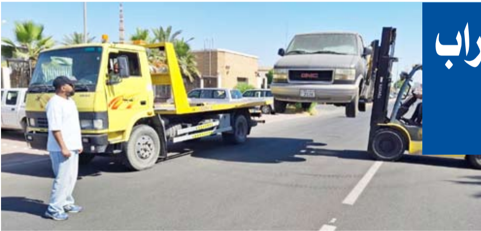
رفع سيارة مخالفة

عن رفع 384 سيارة مهملة وسكراب والإفراج عن 190 سيارة ووضع 5059 ملصقا لسيارة وقارب مهيئين تمهيدا لانتهاء المدة المحددة بالإضافة إلى تحرير 427 مخالفة نظافة عامة وإستغلال مساحة.