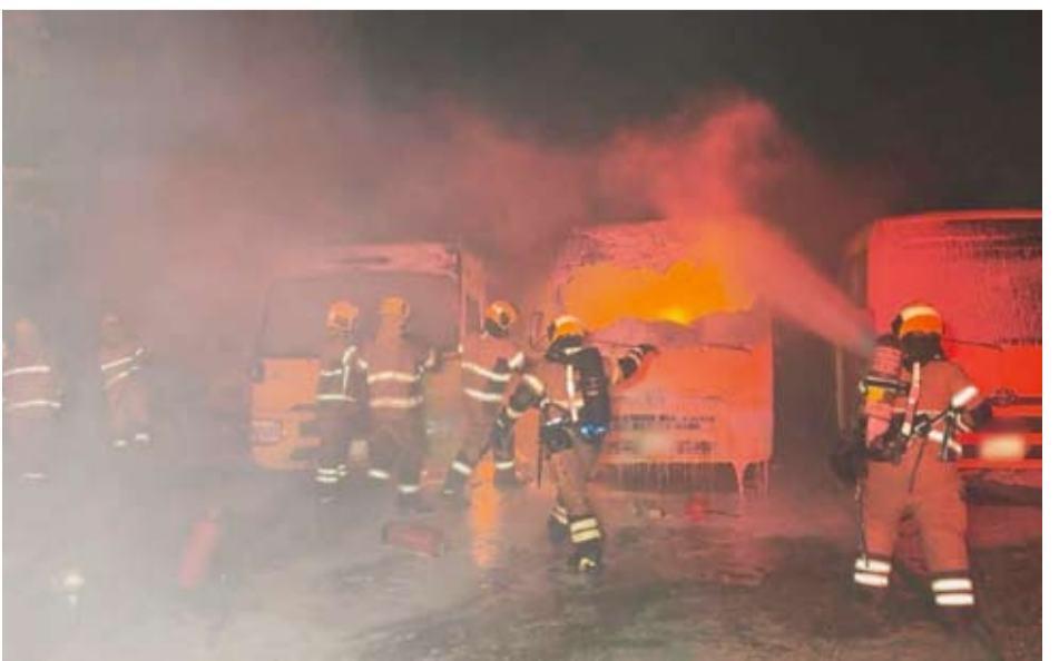
جانب من احماد الحريق

أدى حادث انقلاب وحريق مركبة فجر امس إلى وفاة شخصين، فيما أصيب شخص إثر تصادم في بحر الزور وسجلت إصاباتان إثر حريق منزل في القروان.