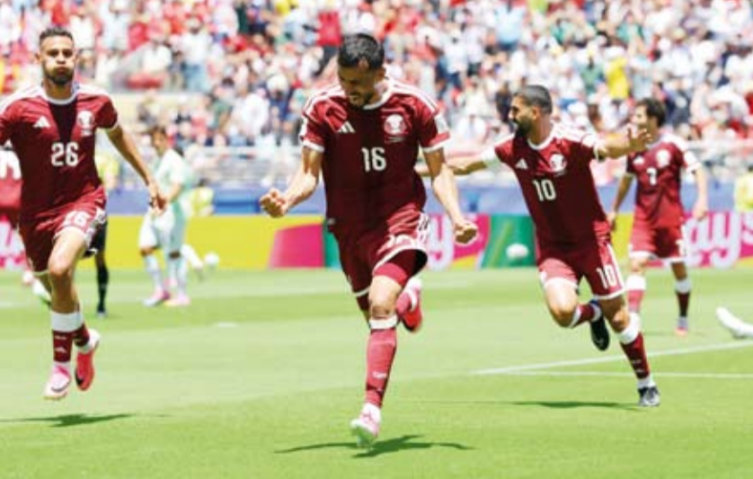
فرحة لاعبي قطر بالتعادل في الوقت الضائع

بدل الضائع للشوط الثاني عن طريق بوعلام خوخ. وسيلعب المنتخب القطري في المباراة المقبلة مع نظيره الكندي، الجمعة المقبل، بينما سيلعب المنتخب السويسري مع نظيره البوسني، الخميس، ضمن منافسات الجولة الثانية.