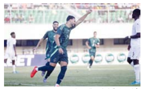
تاهل مستحق لحاربي الصحراء

بلغ المنتخب الجزائري نهائيات بطولة كأس أمم إفريقيا لكرة القدم 2025 المقرر إقامتها في المغرب، وذلك بعد فوزه على مضيفه منتخب توغو بهدف دون مقابل، ضمن منافسات الجولة الرابعة بالمجموعة الخامسة من التصفيات. ورفع منتخب الجزائر، الذي تاهل للنهائيات للمرة