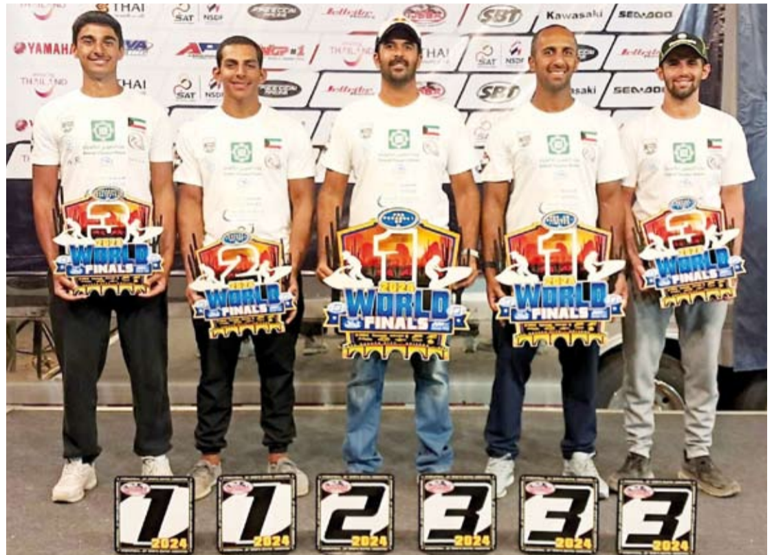
أبطال الكويت في الدراجات المائية حصدوا ذهبيتين وفضية و3 برونزيات

من إنجاز ما ترك بصمة مشرفة باسم الكويت في هذا الحدث العالمي وبالجهد المبذول من الطاقم الإداري والفني. وتقدم بالشكر إلى كل من الهيئة العامة للرياضة لما حظي به المنتخب من دعم كبير من قبلها وإلى عدد من الداعمين من القطاع الخاص.