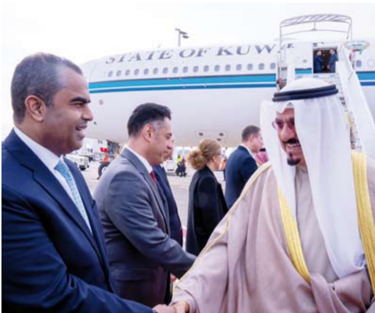
سمو الشيخ أحمد عبدالله لدى وصوله إلى بروكسل

والعربية والاتحاد الأوروبي في بناء شراكة استراتيجية قائمة على رؤى وأهداف مستقبلية مشتركة في مختلف المجالات لتحقيق تنمية وإزدهار دول الخليج العربية والاتحاد الأوروبي. وقال سموه: إن هذه القمة تصيف أبعداً جديدة للعلاقات المتميزة التي تربط مجلس التعاون لدول الخليج العربية بالاتحاد الأوروبي عبر الإرتقاء بها إلى آفاق أرحب وتوسيع أطر التعاون بينهما بما يخدم المصالح والتطلعات المشتركة لبلداننا وشعوبنا. وأعرب سمو رئيس مجلس الوزراء عن اعتزازه بالعلاقات التاريخية والوطيدة التي تجمع دولة الكويت والاتحاد الأوروبي، مؤكداً حرصه على تعزيز التعاون الثنائي وتطويره في كافة المستويات تنفيذاً للتوجيهات الحكيمة لصاحب السمو أمير البلاد الشيخ مشعل الأحمد وسمو ولي العهد الشيخ صباح الخالد.