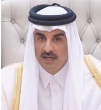
الشيخ تميم بن حمد

أكد أمير قطر الشيخ تميم بن حمد أنه وجه بإحالة مشروع التعديلات الدستورية في بلاده، بما فيها العودة إلى نظام تعيين أعضاء مجلس الشورى إلى المجلس لاتخاذ اللازم بشأنها. وخلال افتتاحه دور الانعقاد العادي الرابع من الفصل التشريعي الأول الموافق لدور الانعقاد السنوي 53 لمجلس الشورى القطري، قال الشيخ تميم بن حمد: «انطلاقاً من مسؤوليتي وواجبي تجاه وطني وشعبي، ووجهت بإحالة مشروع التعديلات الدستورية للمساواة بين المواطنين في الحقوق والواجبات، وبما فيها العودة إلى نظام تعيين أعضاء مجلس الشورى إلى