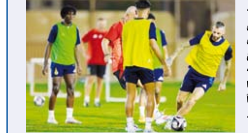
جانب من تدريبات النصر السعودي

قرر الاتحاد الآسيوي لكرة القدم، يوم الثلاثاء، نقل مباراة استقلال طهران الإيراني والنصر السعودي ضمن منافسات منطقة الغرب ببطولة دوري أبطال آسيا للدرجة 2024-2025. وذكر الاتحاد الآسيوي أن لقاء الاستقلال والنصر، الذي كان مقرراً إقامته على ستاد (شهري