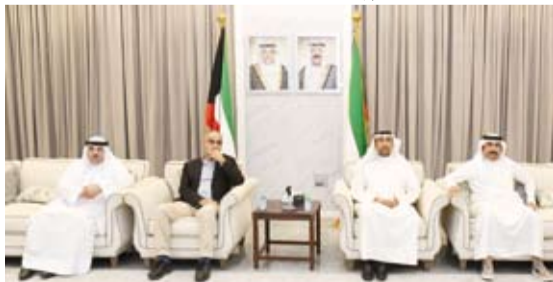
جانب من الحلقة النقاشية