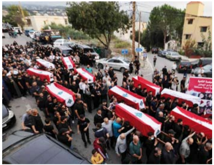
تشجيع بعض القتلى في لبنان

استهدفت لأول مرة، بلدة أيطو ذات الغالبية المسيحية في قضاء زغرتا. وتوسعت رقعة القصف في الجنوب أيضاً، مع إنذارات بإخلاء مزيد من القرى والبلدات منها الزهراني التي لا يزال يسكنها الآلاف وتبعد عن الحدود نحو 40 كيلومتراً. وأعلن الجيش الإسرائيلي أن قواته داهمت نقفاً طوله 800 متر، مشيراً إلى أنه كان مقرراً لقيادة «قوة الرضوان»، وأضاف: «عثرنا في النقف على صواريخ لطائرات عمودية وقذائف ودراجات نارية». وإن كرر نتياهو مطالبته قوات «يونيفيل» بالانسحاب إلى ما بعد الخط الأزرق، رفض أعضاء مجلس الأمن، في جلستين منفصلتين، عقداً هذه الدعوات، مذكرين بأن قوات حفظ السلام منتشرة في جنوب لبنان بموجب القرار 1701.