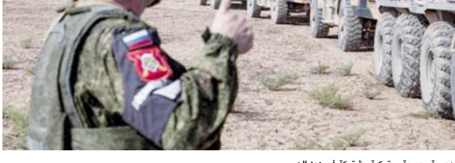
دورية روسية - تركية مشتركة في عين العرب

تشهد مناطق خفض التصعيد في شمال غربي سوريا، المعروفة باسم منطقة «بوتين - أردوغان»، تصعيداً غير مسبوق، إذ شهدت هجمات وتعزيرات عسكرية من مختلف الأطراف. وتعرّضت قاعدتان تركيتان، قرب أعزاز، وفي قرية مرج دابق شمال حلب، للقصف مصدره مواقع «قسد»، والجيش السوري. تزامناً ذلك مع غارات روسية عنيفة في إدلب وريف اللاذقية الشمالي، وقصف متبادل بين القوات السورية و«هيئة تحرير