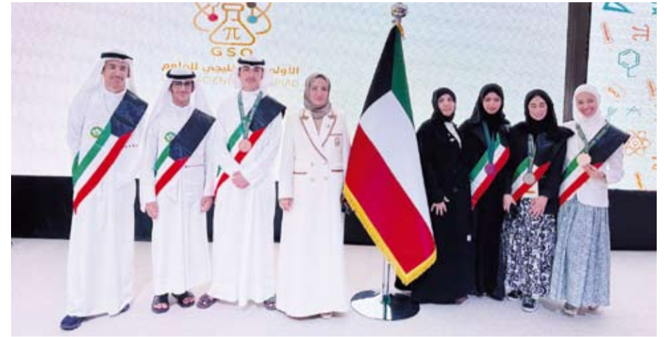
فريق الرياضيات الفائز