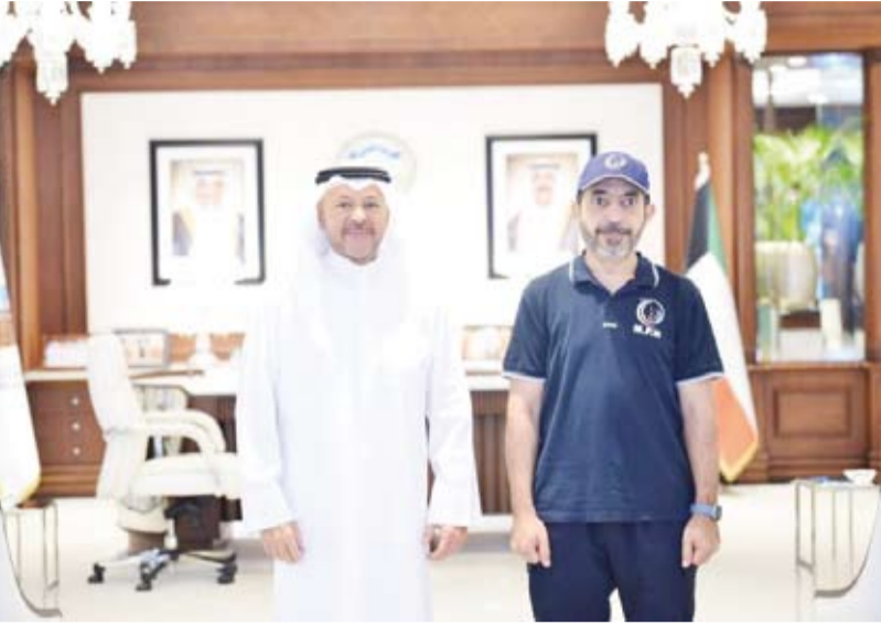
محافظ الفروانية ومدير إدارة صيانة الطرق بالأشغال

إضافة إلى التركيز على الصيانة بوصفها عنصراً أساسياً في الارتقاء الدائم بجودة الخدمات المقدمة. وأشار إلى أنه حرص كل الحرص على تعزيز التواصل والتعاون مع جميع الجهات الخدمية التي تليي مطالب واحتياجات أهالي (الفروانية).