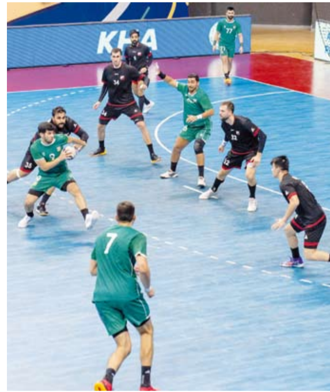
جانب من مباراة العربي وخطان

انطلقت منافسات الأسبوع الثاني من الدور التمهيدي لبطولة الدوري الكويتي العام لكرة اليد موسم (2024 - 2025) بثلاث مواجهات استضافها مجمع الشيخ سعد العبدالله الرياضي للصالات المغطاة وانتهت بفوز فرق (برقان) و (العربي) و (النصر). في المواجهة الأولى تغلب فريق (برقان) على نظيره الفحيحيل بنتيجة (28 - 25) بعدما أنهى الشوط الأول متقدماً بفارق هدف واحد فقط (14 - 13). في المباراة الثانية حقق (العربي) انتصاره الثاني على التوالي هذا الموسم بتغلبه على (خطان) بنتيجة (30 - 26) بعد انتهاء الشوط الأول بفارق ثلاثة أهداف (16 - 13). وفي المواجهة الثالثة واصل فريق (النصر) انطلاقته "القوية" هذا الموسم بفوزه بنتيجة (31 - 25) على نظيره (اليرموك) بعدما أنهى شوط المباراة الأول بنتيجة (13 - 9) لمصلحته. ويلتقي اليوم الأربعاء (التضامن) مع (كاظمة) و (القادسية) مع (الكويت). يذكر أن مواجهات الأسبوع الأول شهدت فوز (الفحيحيل) على (الساحل) بنتيجة (30 - 21) و (خطان) على (التضامن) بنتيجة (33 - 22) وتغلب (كاظمة) على (اليرموك) بنتيجة (31 - 25) و (العربي) على (برقان) بنتيجة (24 - 23).