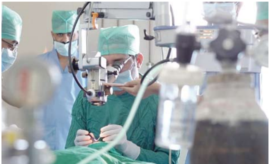
جانب من إجراء العمليات الجراحية