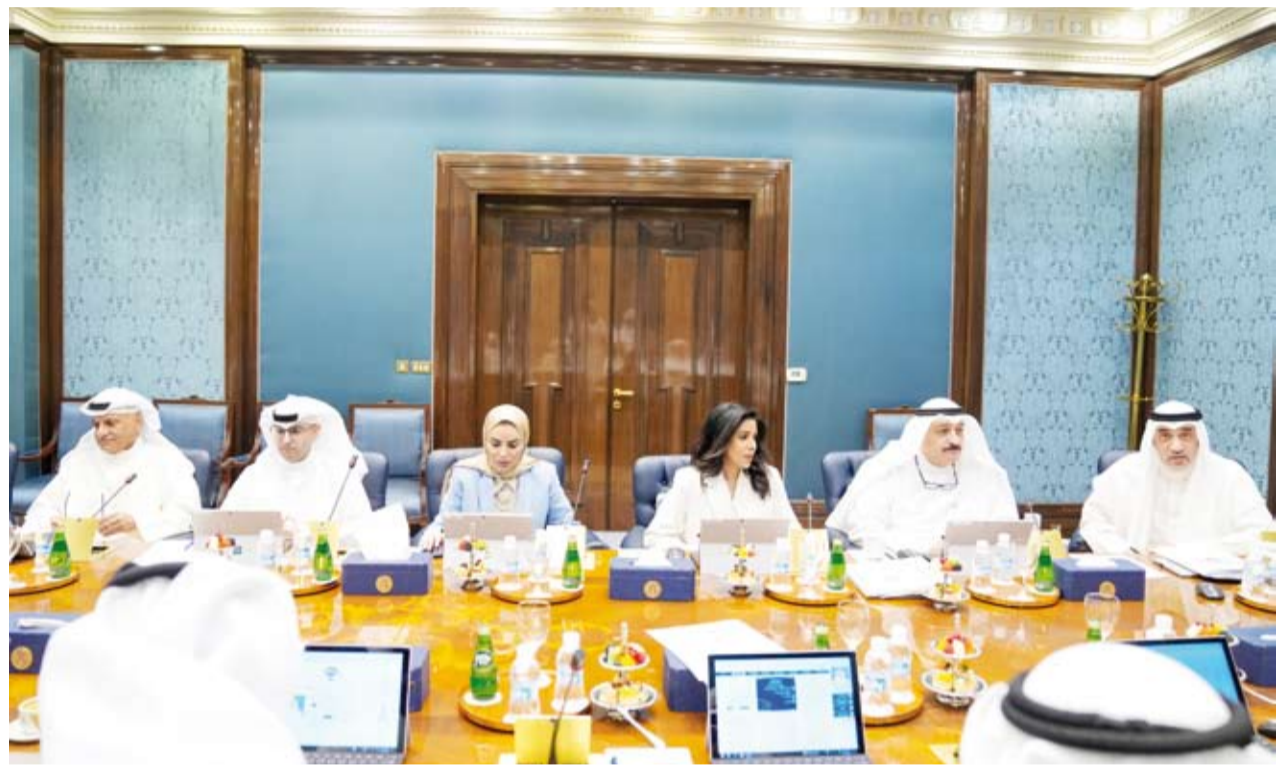
جانب من اجتماع مجلس الوزراء أمس

أعلنت وزيرة الأشغال العامة الدكتورة نورة المشعان، أن الوزارة والهيئة العامة للطرق والنقل البري بصدد توقيع عقود 18 ممارسة خلال الأيام القليلة المقبلة لصيانة جذرية لجميع الطرق الرئيسية السريعة والشوارع الداخلية في محافظات الكويت الست مع شركات علمية وخليجية ومحلية.