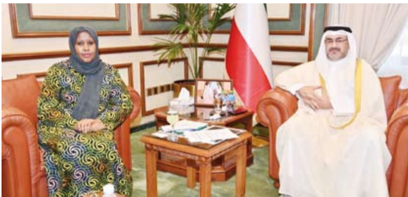
الشيخ عبدالله سالم العلي الصباح مستقبلاً السفيرة حلينة محمود

استقبل محافظ العاصمة الشيخ عبدالله سالم العلي الصباح، في مكتبه بديوان عام المحافظة، صباح أمس، سفير جمهورية كينيا لدى دولة الكويت حلينة محمود. وتطرق اللقاء حول تعزيز العلاقات الثنائية بين دولة الكويت وجمهورية كينيا وخلق فرص جديدة للعمل المشترك في كافة المجالات بما يخدم