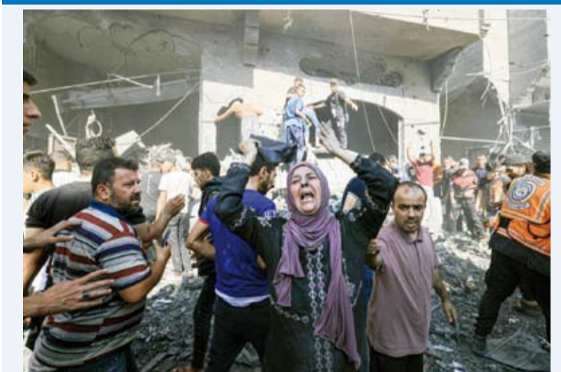
فلسطينيون يبحثون عن ضحايا بين الأنقاض

استشهد مواطن آخران وأصيب عدد آخر بجروح إثر قصف منزل شمال غربي مخيم النصيرات. وقتل مواطنان وفقد أكثر من 10 مواطنين تحت الأنقاض في غارات نفذها الطيران الإسرائيلي استهدفت مربعة سكنياً في شارع الصناعة جنوب غربي مدينة غزة. كما قتل ثلاثة مواطنين وأصيب آخرون في قصف إسرائيلي استهدف محيط مسجد صلاح الدين بحي الزيتون جنوب شرقي مدينة غزة. وقتل أربعة مواطنين وأصيب آخرون بجروح، جراء قصف إسرائيلي لمنزل بمنطقة الفالوجا في مخيم جباليا شمال قطاع غزة، كما قتل مواطن في قصف محيط مسجد النعمان وسط حي النزالة.