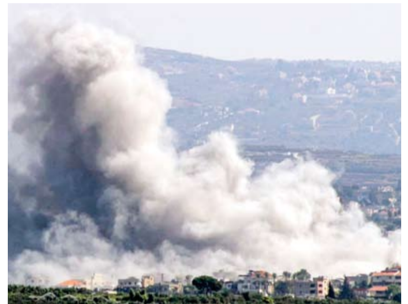
قصف عنيف على جنوب لبنان

فيما يتعرض لبنان منذ 23 سبتمبر الماضي لغارات جوية عنيفة يشنها طيران الاحتلال الإسرائيلي على مختلف المناطق، فقد حذر نائب أمين عام «حزب الله» نعيم قاسم، من أن المنطقة أمام خطر «شرق أوسط جديد»