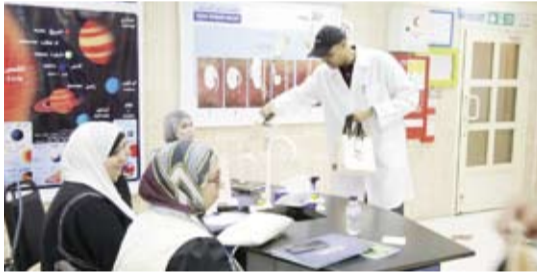
جانب من ورشة «تصوير الحشرات وحفظها»

ومن جانبه، أكد د. قيس مجيد، رئيس قسم العلوم في كلية التربية الأساسية في الهيئة العامة للتعليم التطبيقي والتدريب، على أهمية التعاون المشترك بين المؤسسات الأكاديمية والنشطاء في مجال البيئة لنشر الوعي البيئية ونقل العلوم بشكل فعال، وأوضح أن مثل هذه الورش العلمية المتخصصة تلعب دوراً مهماً في دعم برامج التعليم، من خلال تمكين المعلمين من اكتساب مهارات جديدة واستخدام الأدوات العلمية والتدريبية في المختبرات بكفاءة.