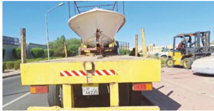
رفع طراد مهمل

من قبل الفريق الرقابي بإدارة النظافة العامة وأشغالات الطرق، مبيّناً في هذا الخصوص عدم تهاون الفريق الرقابي