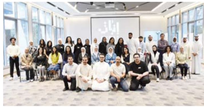
مشاركون في برنامج إنبات

ونجاح البرنامج وأثره الإيجابي على المشاركين، حيث يمثل البرنامج فرصة لتزويد الشباب بالمهارات اللازمة لتحقيق النجاح في أي مسار مهني يختارونه.