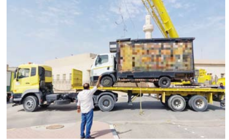
آليات البلدية ترفع سيارات مخالفة