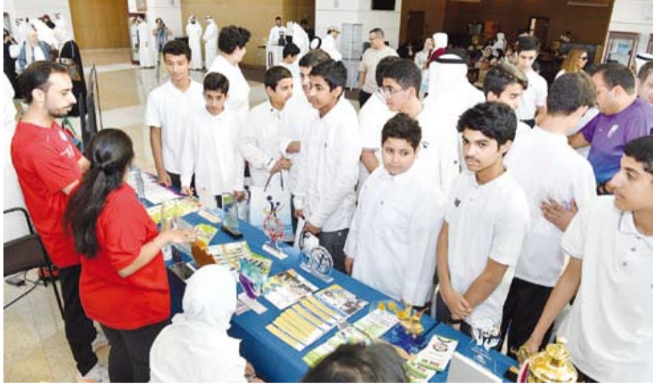
جانب من الفعالية