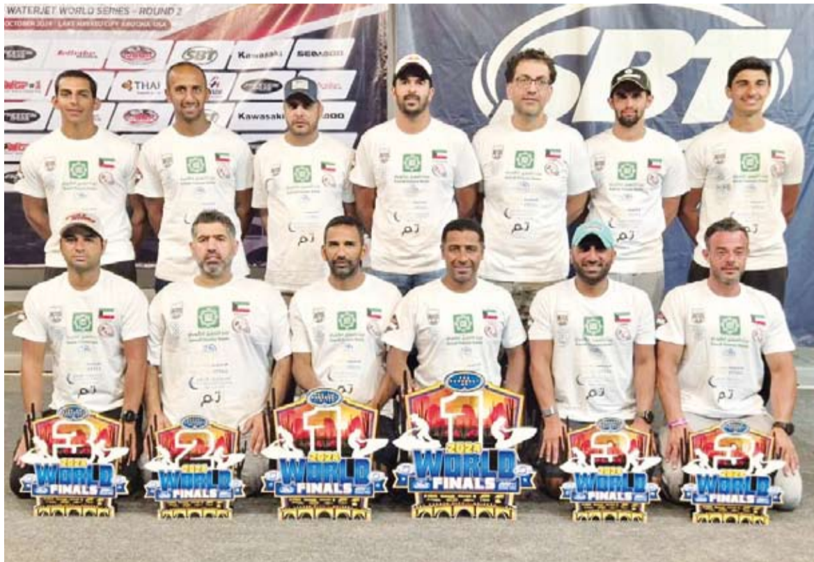
صورة جماعية لمنتخب الكويت للالعاب المائية