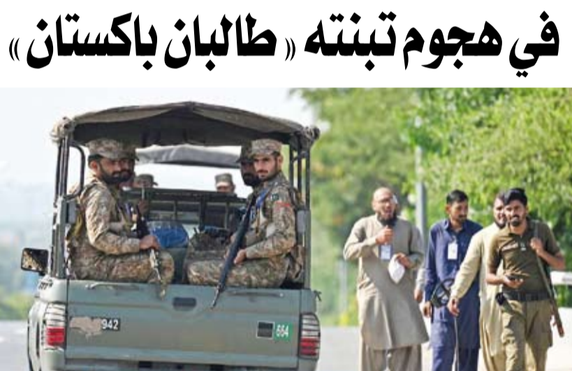
أفراد من الجيش يقومون بدورية

الأسابيع الأخيرة هجمات، فقد قتل مهندسان صينيان في هجوم بقليلة في جنوب مدينة كراتشي نهاية الأسبوع الماضي كما قتل 20 مسلحاً بالمدافع المضادة للصواريخ في موقع منجم الفحم جنوب غربي بلوشستان الجمعة. وفي مواجهة هذا التهديد، فرض إغلاق على إسلام آباد ونشرت الحكومة دوريات عسكرية في الشوارع طوال فترة القمة. وشددت باكستان الإجراءات الأمنية في العاصمة إسلام آباد، فيما توافد رؤساء الحكومات لحضور قمة منظمة شنغهاي بالتعاون. وجرى نشر أكثر من عشرة آلاف فرد من الشرطة والقوات شبه العسكرية وسنطال الأسواق والمدارس مغلقة لثلاثة أيام. وشهدت محافظات في