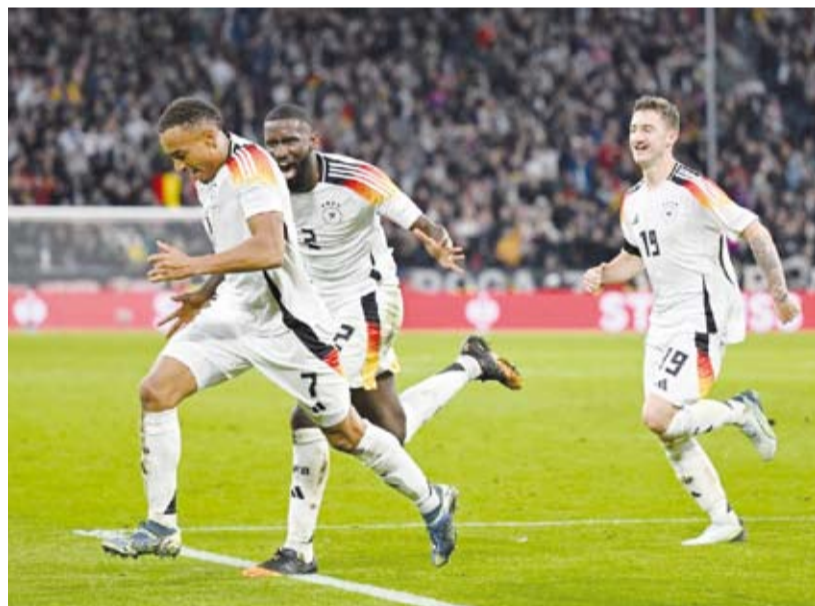
هدف وحيد ضمن الصدارة للمكينات الألمانية

فاز المنتخب الألماني على ضيفه الهولندي بهدف دون مقابل، ضمن منافسات الجولة الرابعة من المجموعة الثالثة بالمستوى الأول في دوري الأمم الأوروبية لكرة القدم. ورفع المنتخب الألماني رصيده إلى عشر نقاط ليتصدر المجموعة، بفارق خمس نقاط عن المنتخب الهولندي صاحب المركز الثاني. وسجل جيمي ليلفيلنج هدف المباراة الوحيد للمنتخب الألماني في الدقيقة 64. وفي مباراة أخرى بنفس المجموعة، فاز منتخب المجر على مضيفه البوسنة والهرسك 2-0. ورفع المنتخب المجرى رصيده إلى خمس نقاط في المركز الثالث، بفارق الأهداف خلف هولندا، فيما تجدد رصيد البوسنة عند نقطة واحدة في المركز الرابع والأخير. وسجل دومينيك سوبوسلاي هدفا المجر في الدقيقتين 38 و50 من ضربة جزاء.