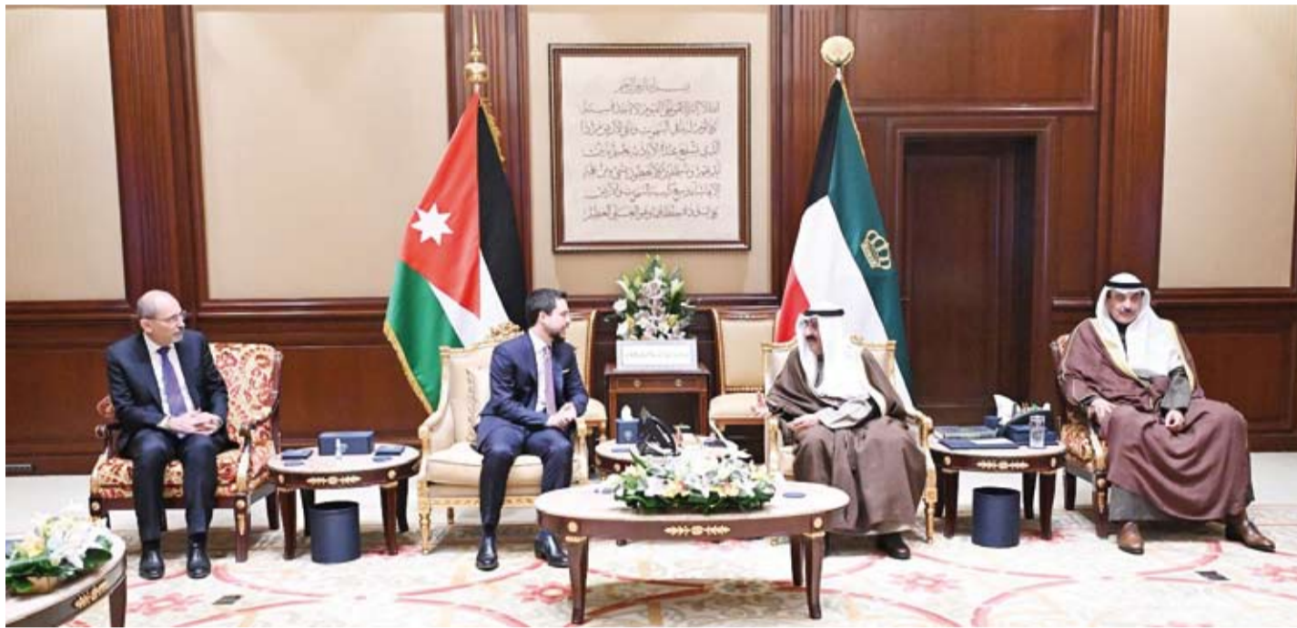
سمو أمير البلاد خلال لقائه ولي العهد الأردني