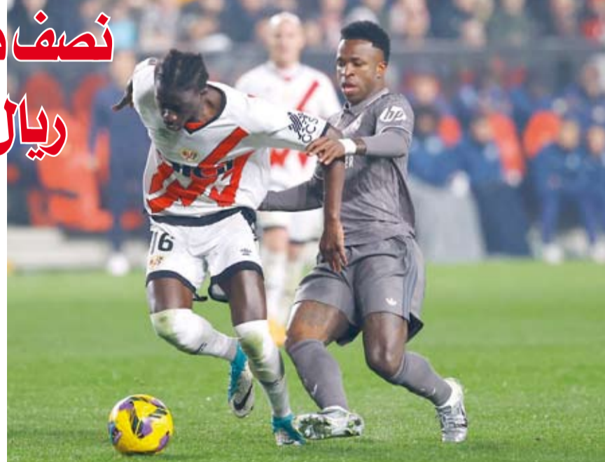
مباراة حافلة بالندية

تعادل فريق ريال مدريد مع ضيفه رايو فايكانو بنتيجة 3-3. خلال المباراة التي جمعتهم ضمن منافسات الجولة السابعة عشرة للمسابقة، والتي شهدت فوز ريال مايوركا على جيرونا بنتيجة هدفين مقابل هدف. ففي المباراة الأولى، تعادل ريال مدريد مع رايو فايكانو بثلاثة أهداف لكل منهما على ملعب «تيريزا ريفير».