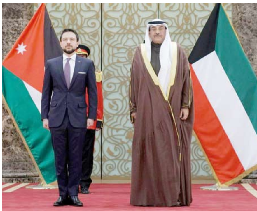
سمو ولي العهد مستقبلاً ولي العهد الأردني لدى وصوله إلى البلاد

استقبل صاحب السمو أمير البلاد الشيخ مشعل الأحمد، بقصر بيان صباح أمس، وزير المالية ووزير الدولة للشؤون الاقتصادية والاستثمار نورة الفصام، حيث قدمت لسموه الشيخ سعود سالم عبدالعزيز الصباح العضو المنتدب للهيئة العامة للاستثمار وذلك بمناسبة تعيينه بمنصبه الجديد.