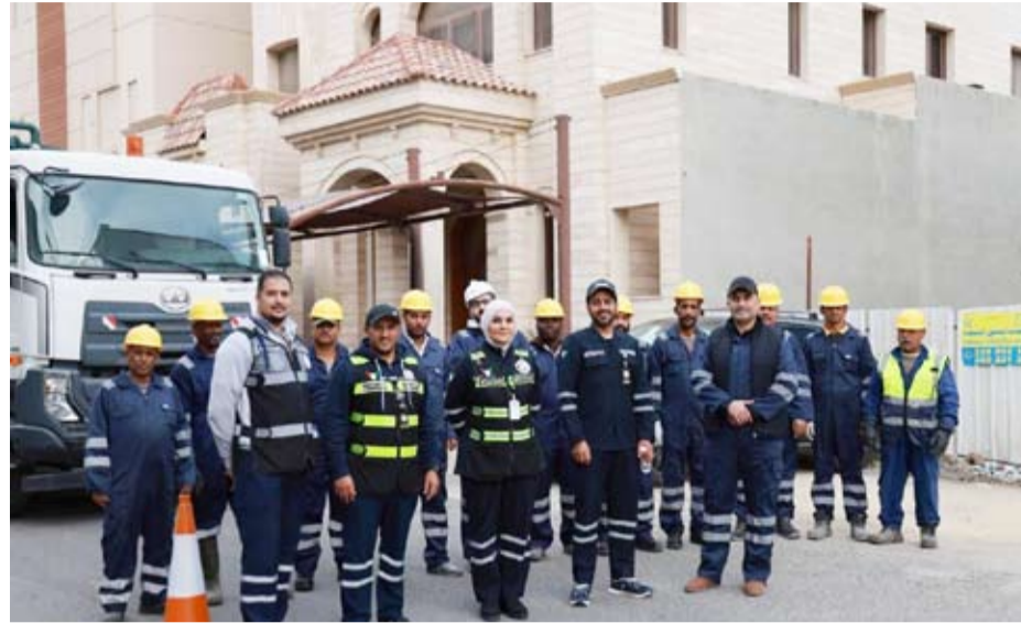
مهندسو وزارة الأشغال

التعاون مع الجهات المعنية لإنجاز الأعمال في الوقت المحدد، خصوصاً مع وجود بعض الطرق التي سيتم إغلاقها خلال أعمال الصيانة.