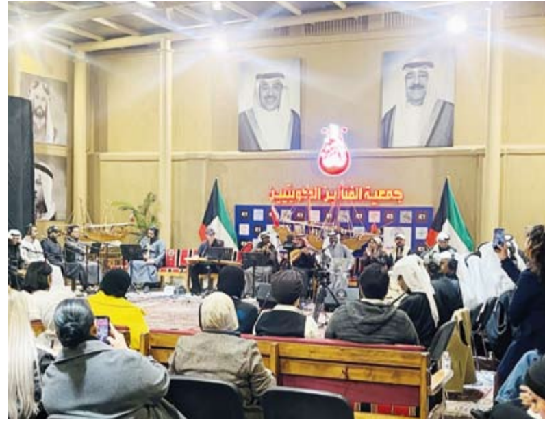
جلسة طاب السمر