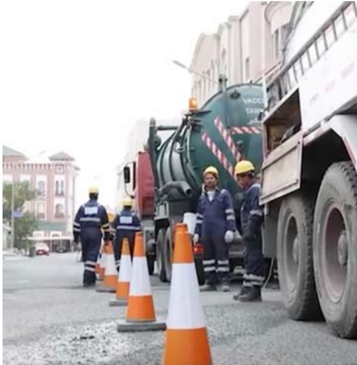
جانب من أعمال الصيانة