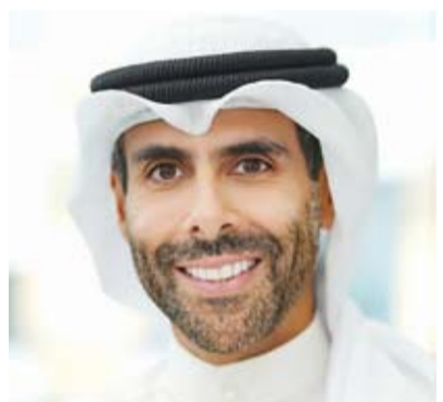
الشيخ جابر بندر الصباح

أعلن نادي الألعاب الشتوية الكويتي أن الاتحاد الدولي لهوكي الجليد منح الشارة الدولية لأربعة حكام كويتيين منهم سيدة واحدة بعد اجتيازهم الاختبارات المطلوبة من قبل لجنة الحكام الدولية التابعة له لينضموا للحملة شوق الهندان التي تم التجديد لها من قبل الاتحاد.