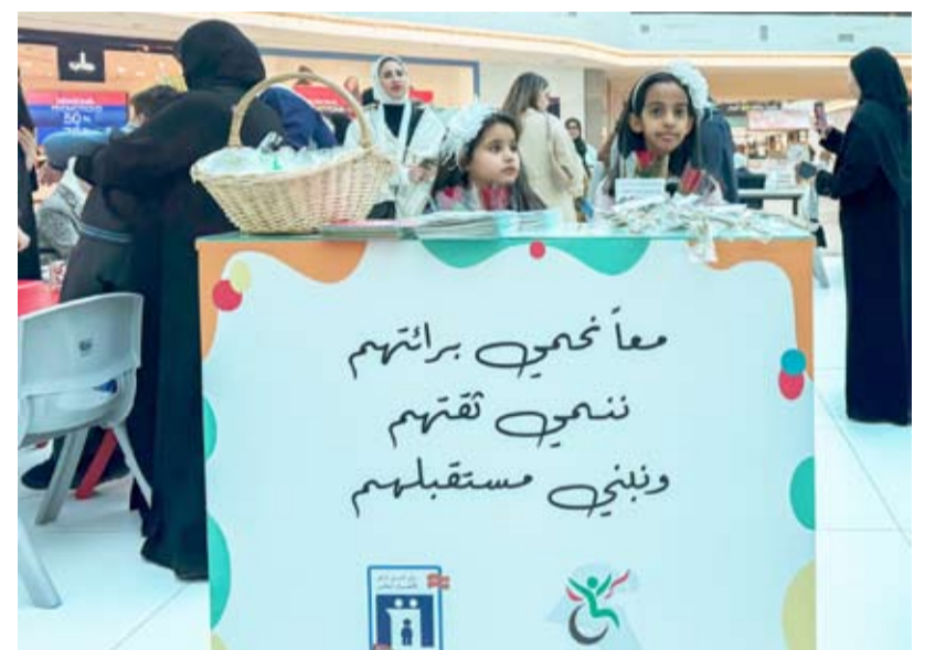
الحملة تهدف إلى تحسين جودة الحياة للأطفال ذوي الإعاقة

مع إطلاق الحملة التوعوية للعناية بالطفل، أمس، تحت شعار «نرعاهم ليزهروا» تواصل الهيئة العامة لشؤون ذوي الإعاقة جهودها الهادفة إلى تحسين جودة الحياة للأطفال ذوي الإعاقة ودعمهم ليصبحوا عناصر فاعلة في المجتمع. وتركز الحملة على أهمية الرعاية المبكرة للأطفال ذوي الإعاقة ودورها في تعزيز قدراتهم بما يساهم في تحقيق أهداف التنمية المستدامة إذ تأتي هذه المبادرة ضمن سلسلة من الجهود الوطنية الرامية إلى تعزيز الوعي المجتمعي بقضايا الأطفال ذوي الإعاقة وتطوير البرامج والخدمات الموجهة لهم بما يلبي احتياجاتهم ومتطلبات أسرهم.