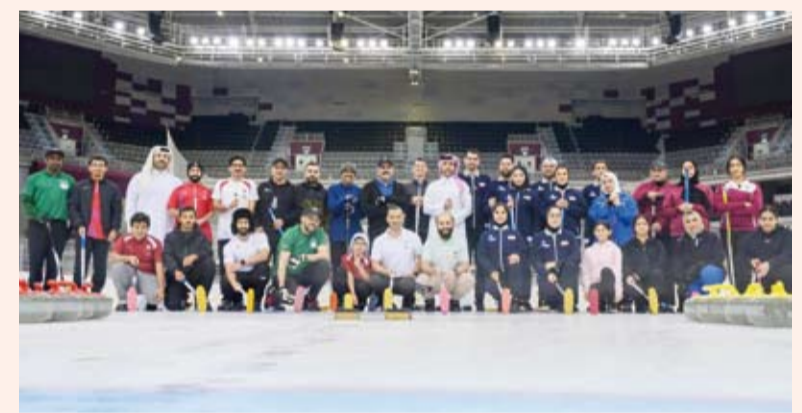
صورة جماعية للمشاركين

الذي ضم 4 منتخبات هي السعودية وايران وقطر المستضيفة اضافة الى الكويت تأتي في إطار استعدادهم للمشاركة في دورة الألعاب الآسيوية الشتوية المقرر اقامتها في مدينة (هاربين) بالصين في شهر فبراير المقبل.