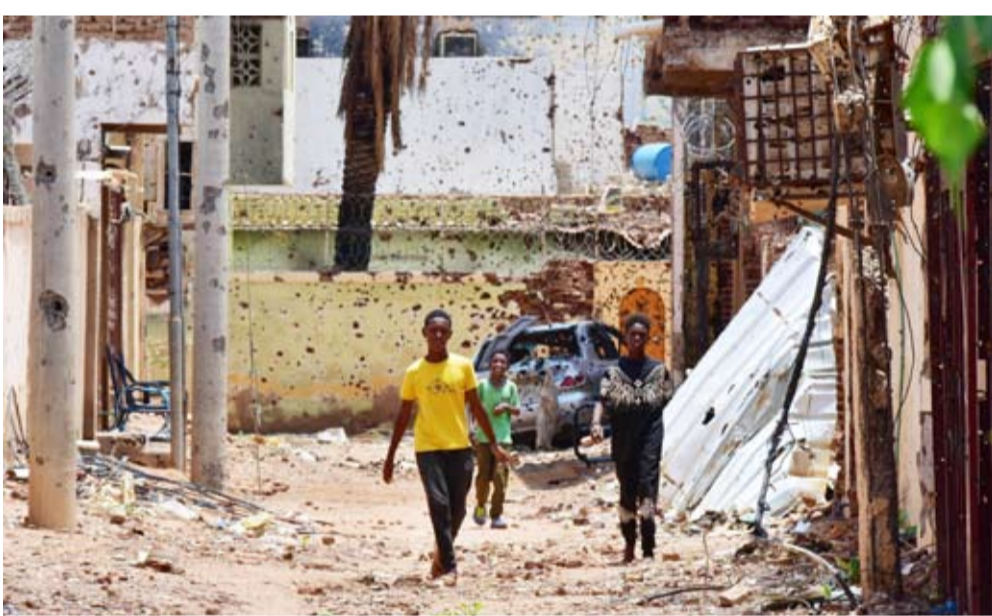
شبانًا يسرون في شارع لحق به الدمار

المزيد من الضغوط على الأطراف المتصارعة للالتزام بالقوانين الدولية، لوضع حد للكصف العشوائي بالمدافع الثقيلة والبراميل المتفجرة في الأماكن المأهولة بالسكان. وقال: «لا يوجد ما يبرر هذه الأعمال الإجرامية، لقد حان الوقت لإنقاذ ما تبقى من أرواح بريئة، فالكارثة لم تعد تحتل المزيد من التأجيل».