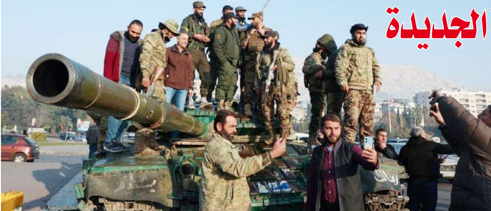
مقاتلون من المعارضة السورية

أعلن وزير الدفاع التركي غولر، أن أنقرة مستعدة لتقديم دعم عسكري للحكومة السورية الجديدة إذا طلبت ذلك. وفي تصريحات نقلتها وسائل إعلام تركية، قال أنه يجب منح الفرصة للحكومة الجديدة برئاسة محمد البشير من «هيئة تحرير الشام»، التي أطاحت مع فصائل معارضة أخرى بحكم بشار الأسد قبل أسبوع، وأضاف أن تركيا «مستعدة لتقديم الدعم اللازم إذا طلبت الإدارة الجديدة ذلك»، بحسب وكالة الصحافة الفرنسية. وقال غولر للصحافيين في أنقرة «في بيانها الأول أعلنت الإدارة الجديدة التي أطاحت بـ(بشار) الأسد أنها ستحترم كل المؤسسات الحكومية والأمم المتحدة والمنظمات الدولية الأخرى». وأضاف «نعتقد أننا بحاجة إلى رؤية ما ستفعله