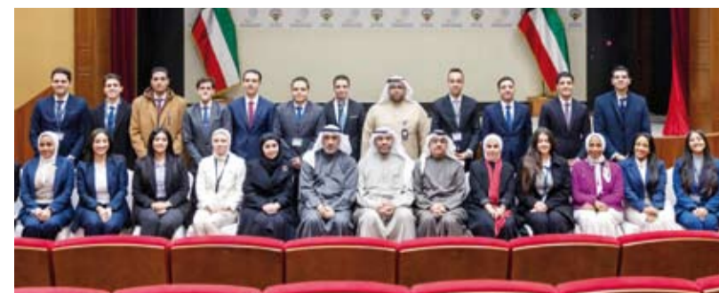
وزير الخارجية في لقطة جماعية مع الوفد المصري

التقى وزير الخارجية عبدالله الجبير، أمس، بوفد من وزارة الخارجية بجمهورية مصر العربية الشقيقة الذي يزور البلاد حالياً بدعوة من معهد سعود الناصر الصباح الدبلوماسي الكويتي في إطار برنامج الضيافة الدبلوماسية الذي ينظمه المعهد سنوياً من شهر أكتوبر ولغاية شهر فبراير من كل عام. وأعرب وزير الخارجية عن ترحيبه بالوفد، متمنياً لهم طيب الإقامة في دولة الكويت ومشيداً بالعلاقات المتميزة والراسخة بين دولة الكويت وجمهورية مصر العربية الشقيقة والتي تعد مثلاً ناجحاً للعلاقات بين الدول العربية.