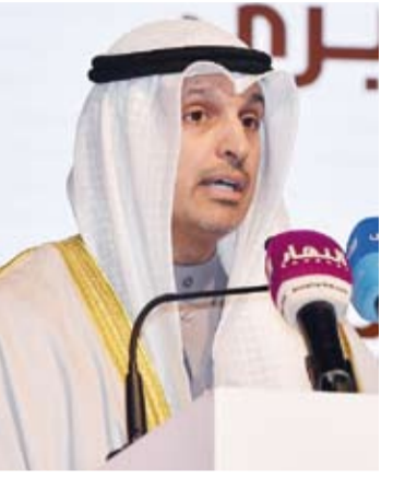
عبد الرحمن المطيري

أكد وزير الإعلام والثقافة ووزير الدولة لشؤون الشباب عبدالعزيز سعود المطيري، أن جائزة مؤسسة عبدالعزيز سعود البابطين الثقافية تحمل في طياتها عبق الشعر وأريج الكلمة وتعتبر تأكيداً على أن الثقافة هي الروح التي تحيي الأمم والجسر الذي يعبر بنا نحو مستقبل زاهر بالتسامح والتعايش والمحبة.