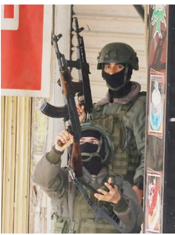
عناصر من الأمن الفلسطيني

«الجهاد» يزيد جعابصة «الذي ارتقى برصاص أجهزة السلطة في جنين»، متهمه السلطة بـ«ملاحقة المقاومين والمطوبين للاحتلال»، في استهداف متصاعد ومتعمد «يتماهى بشكل تام مع عدوان الاحتلال وإجرامه». ودعت «الجهاد»، الفصائل لاتخاذ موقف حاسم ضد السلطة، فالاحتلال حركة «حماس» التي رأت «ما تنفذه أجهزة السلطة بالضفة الغربية استهدافاً واضحاً للمقاومة المتصاعدة». وطالبت «حماس» قيادة السلطة بـ«لجم سلوك أجهزتها وتصبح بوصلتها الأخلاقية والوطنية نحو خيار الوحدة والمقاومة لرد الاحتلال وصد عوانته».