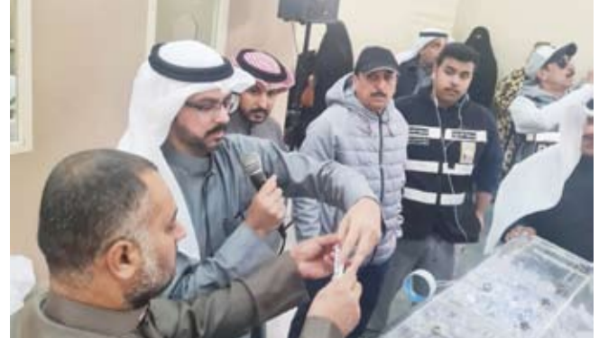
سحب رقم من الصندوق

وفي هذا السياق أوضح مراقب الأغذية والأسواق في إدارة التدقيق ومتابعة الخدمات