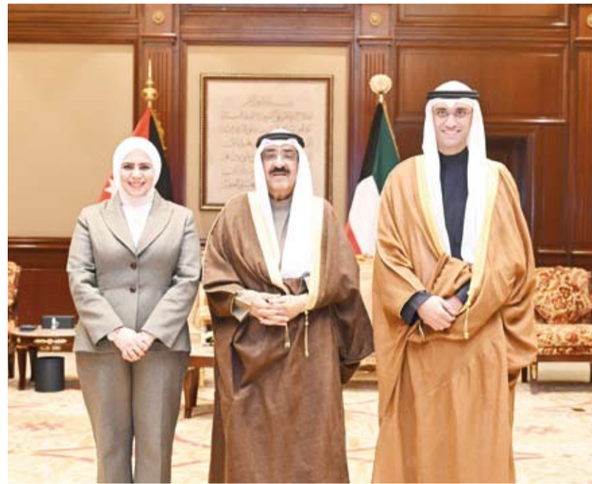
.. وسموه يستقبل الوزيرة نورة الفصام والشيخ سعود سالم عبدالعزيز الصباح