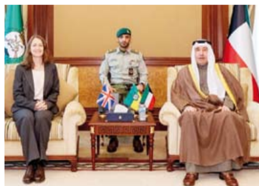
الشيخ مبارك الحمود مستقبلاً السفارة بليندا لويس

ويذكر أن ولي العهد الأردني سيلتقي خلال الزيارة التي تستمر يومين بصاحب السمو أمير البلاد الشيخ مشعل الأحمد، كما يجري سموه مباحثات رسمية مع سمو ولي العهد الشيخ صباح الخالد ويعقد أيضاً لقاءات على هامش الزيارة مع مسؤولين واقتصاديين كويتيين.