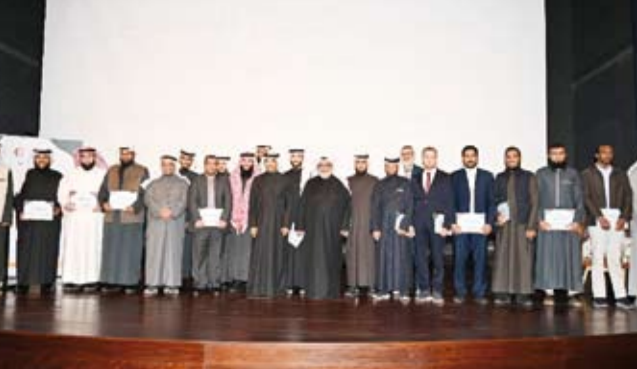
صورة جماعية للمكرمين

وأعرب شرف عن سعادته بتفاعل الطلبة وأعضاء هيئة التدريس في هذه المحاضرة، متمنياً استمرار مشروع توحيد الهوية البصرية، بدلاً من الاجتهادات الشخصية التي قد تصيب أو تخيب.