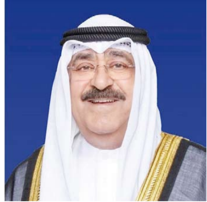
سمو أمير البلاد الشيخ مشعل الأحمد

استقبل صاحب السمو أمير البلاد الشيخ مشعل الأحمد، بقصر بيان، صباح الأحد، سمو ولي العهد الشيخ صباح الخالد، كما استقبل سموه رئيس مجلس الوزراء بالإنيابة الشيخ فهد اليوسف.