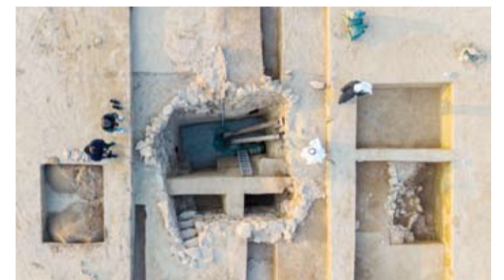
صورة جوية لبئر الماء المكتشفة والدرج المؤدي إلى القاع

اكتشاف الذي يعود إلى الفترة المسيحية وبداية الإسلام يؤكد النشاط الحضاري في الجزيرة آنذاك كما كشف عن العثور على أكثر من 5 كيلوجرامات من الأحجار الكريمة مثل الياقوت والجمشت الأرجواني ما يعكس طبيعة النشاط الاقتصادي في الجزيرة قبل 1400 سنة. من ناحيته قال رئيس البعثة السلوفاكية الدكتور ماتي روتكاي إن التركيز في موسم 2025 سيكون على شمال مستوطنة القصور حيث تم العثور سابقاً على بقايا فناء ومنزل يعتقد أنه كان لأحد الأثرياء في تلك الحقبة.