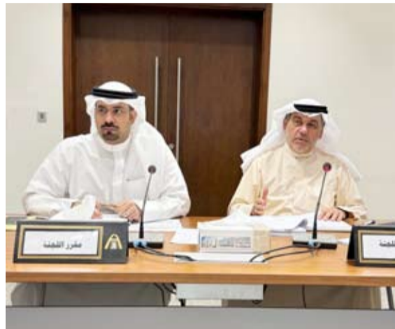
رئيس اللجنة ومقرها