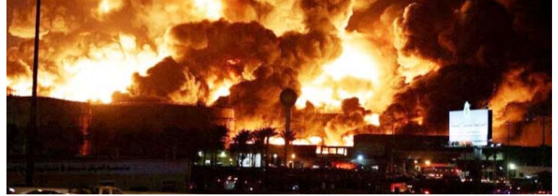
10 ساعات من القصف المتواصل على مواقع عسكرية تابعة لجماعة الحوثي

وكان الرئيس الأمريكي دونالد ترامب قال إنه أمر بشن سلسلة من الضربات الجوية على صنعاء، مساء السبت، متعهدا باستخدام "قوة مميّنة ساحقة" حتى توقف جماعة الحوثي المدعومة من إيران هجماتها على السفن.