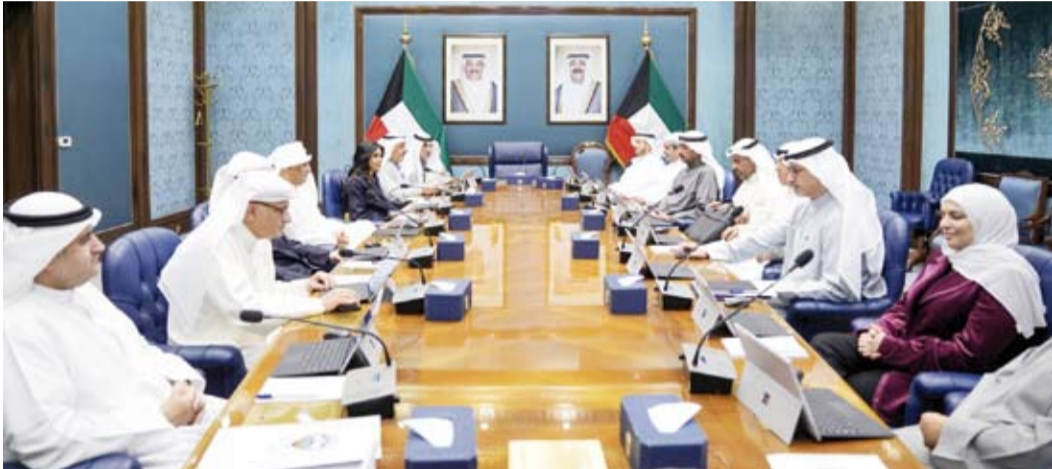
جانب من اجتماع مجلس الوزراء الأخير