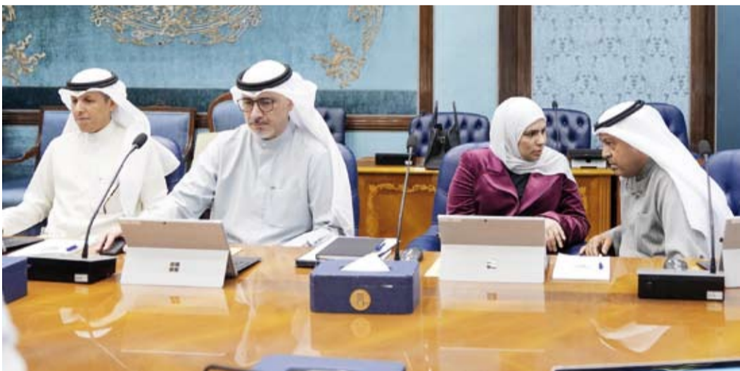
الوزيرة نورة الفصام اجتماع مجلس الوزراء

بناء على أحكام المادة ثمانين من قانون التأمينات الاجتماعية، وكلفها بالتنسيق مع ديوان الخدمة المدنية والمؤسسة العامة للتأمينات الاجتماعية للمضي قدماً في اتخاذ الإجراءات الواجب اتباعها لتنفيذ هذا المقترح.