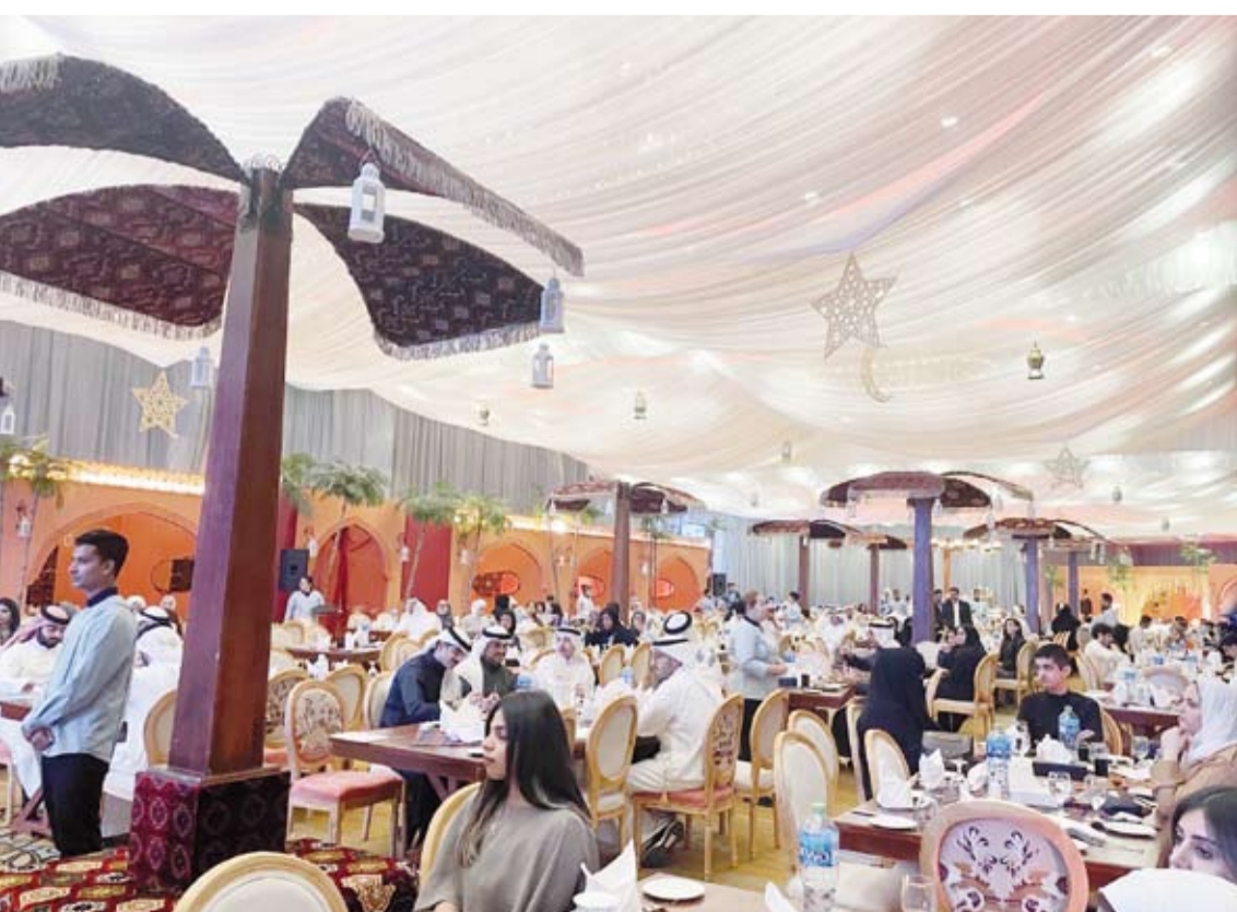
المشاركون في مأدبة الإفطار بحضور الشيخ ثامر الجابر

على جميع أشكال التمييز ضد المرأة التي تضمن الموافقة الحرة والكاملة للزوجين وتشجع على تحديد سن أدنى للزواج لذا رُوي استبدال المادة (26) من القانون رقم (51) لسنة 1984 في شأن الأحوال الشخصية على نحو يمنع توثيق الزواج ما لم يبلغ الزوجين ثمانية عشر عاماً». وأضافت، لقد أعد مشروع المرسوم بقانون المائل، ونصت المادة الأولى منه على استبدال المادة (26) من القانون رقم (51) لسنة 1984 المشار إليه ومنعت توثيق عقد الزواج أو المصادقة عليه لمن لم يبلغ من العمر 18 عاماً وقت التوثيق ونصت المادة الثانية منه على إلزام كل من رئيس مجلس الوزراء والوزراء بتنفيذ هذا المرسوم بقانون على أن يعمل به من تاريخ نشره في الجريدة الرسمية.