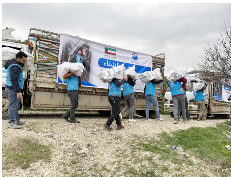
تنفيذ مشروع دفع الشتاء في الشمال السوري

والجمعية مستمرة في جهودها للمساهمة في تخفيف معاناة أهل غزة، وجميع تقارير الجهود الإنسانية لدعم أهل غزة متاحة للمشاهدة من خلال قناة جمعية الحياة الخيرية على اليوتيوب ومن خلال حساباتها على وسائل التواصل الاجتماعي، وتشاهدون فيها دعوات أهلنا في غزة لإخوانهم في الكويت وشكرهم على الوقوف بجانبهم في هذه المحنة الشديدة، كتب الله لنا وللحسين الكرام أجر إغاثة الملهورف وتفريج كربة المكروبين