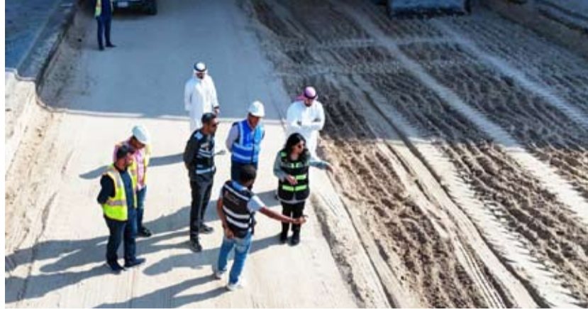
وزيرة الأشغال في أحد المشاريع