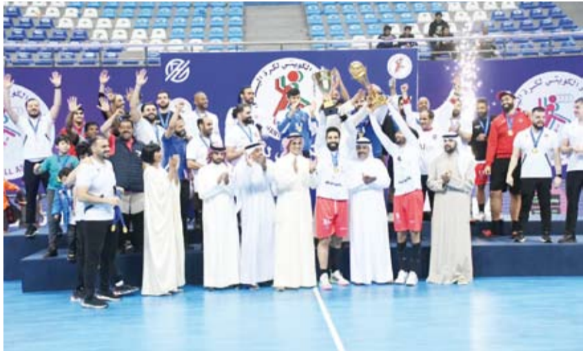
من تويج الكويت بالسوبر العام الماضي

نادي الكويت هو الأقرب للظفر باللقب لما يملكه من لاعبين على مستوى عالٍ ودولي بجانب جاهزية الفريق للمنافسة بقوة من الناحية الذهنية والفسية لكنه لم يستبعد حدوث مفاجآت لوجود فرق لديها العزيمة والإصرار مثل كاظمة والسالمية إضافة إلى العربي.