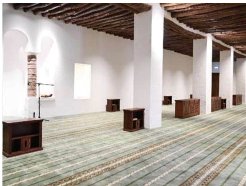
المسجد من الداخل