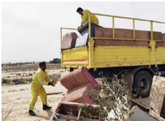
رفع اثاث من البر

الخرينج : مشاركة 50 عامل نظافة و 88 الية