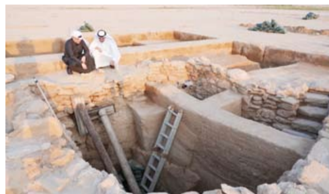
نقاش حول احتمالية العثور على أساسات برج بجانب البئر المكتشفة