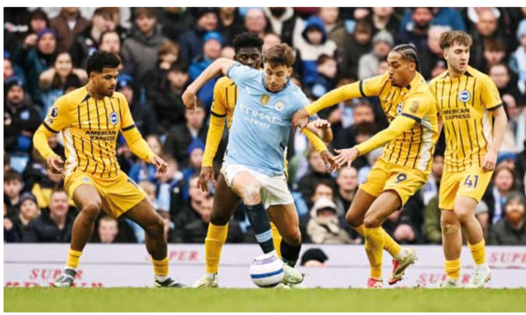
سيتي مهدد بالغياب عن أبطال أوروبا

في المقابل، تجمد رصيده إيسويتش تاون عند 17 نقطة في المركز الثامن عشر. وفي باقي مواجهات الجولة، فاز