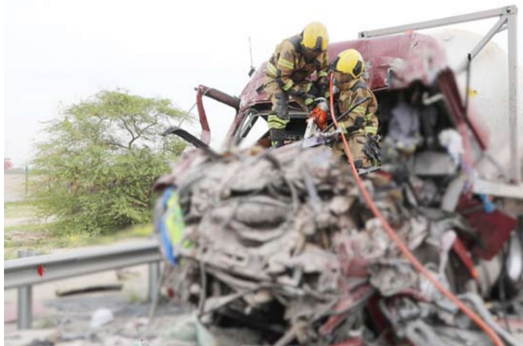
قوة الإطفاء تبحث عن ناجين في حادث تصادم بين صهريج غاز ونساف رمل