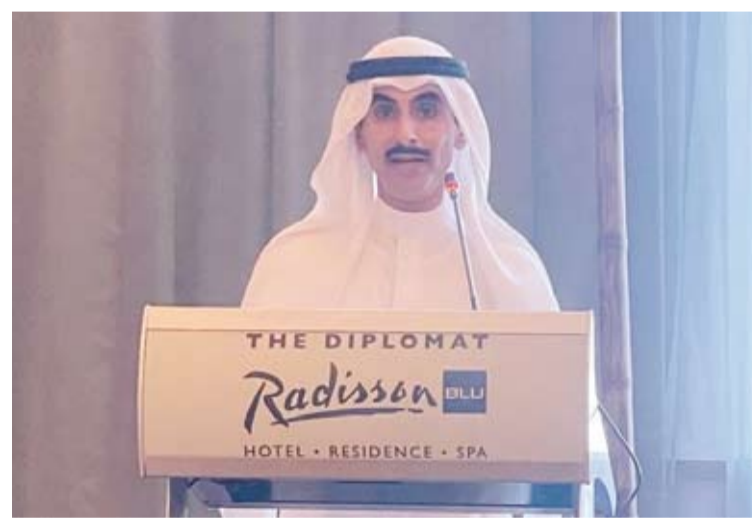
الشيخ ثامر الجابر يلقي كلمته خلال مأدبة الإفطار