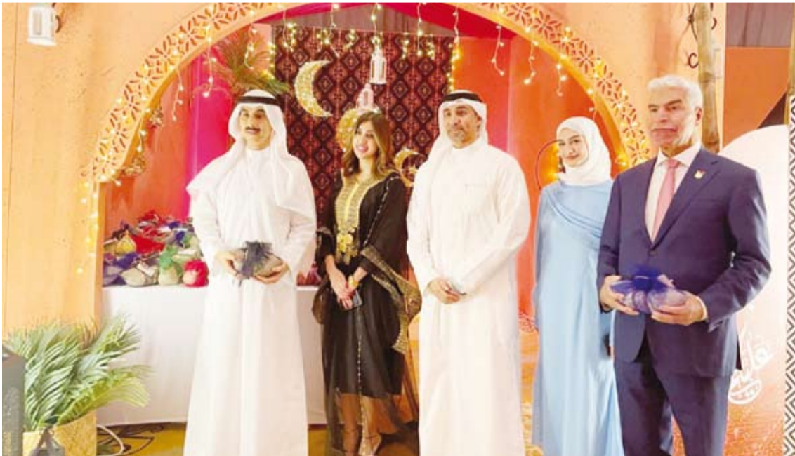
جانب من مأدبة الإفطار السنوية الثانية لطلبة الكويت الدارسين بالبحرين