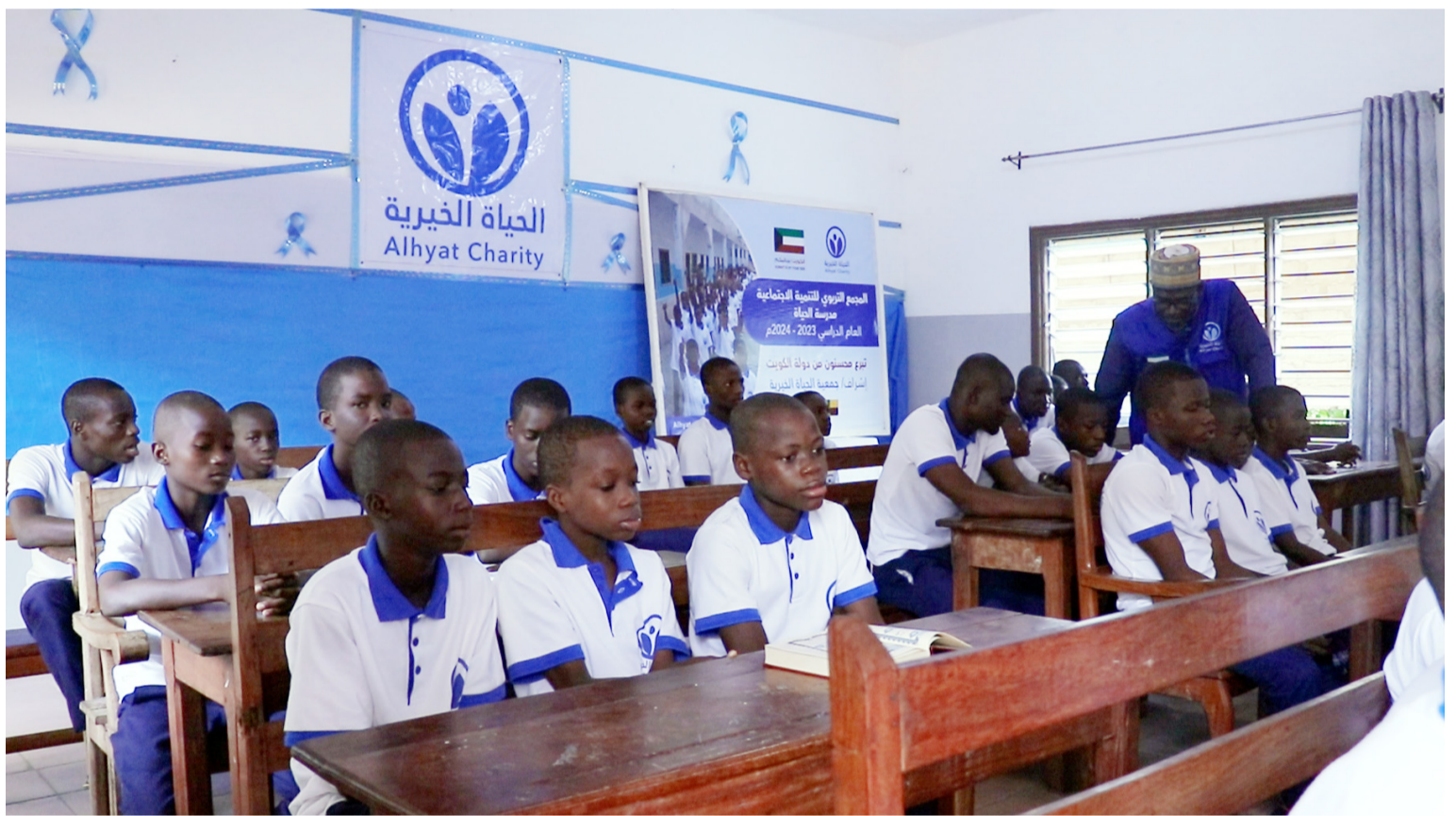
فصول تعليمية في بنين

خلال رمضان من العام الماضي والتي تمثلت في تقديم وجبات الإفطار والسلال الغذائية وكسوة العيد و زكاة الفطر جميع المشروعات في موسم رمضان العام الماضي بلغ عددها 13 مشروعات أسعدت أكثر من 230 ألف مستفيد في 17 دولة.