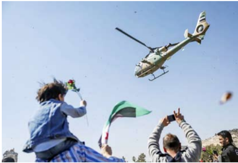
مروحية ترمي وروداً فوق المتجمعين

ودمشق، لتعكس تحول تلك الساحات إلى منصة للاحتفاء بالمرحلة الجديدة. وهناك من رأى في الزخم الاحتفالي بالساحات تعبيراً عن «الاتفاف الشعبي حول السلطة الجديدة للعبور بالبلاد من نفق التحديات الصعبة التي تواجهها».