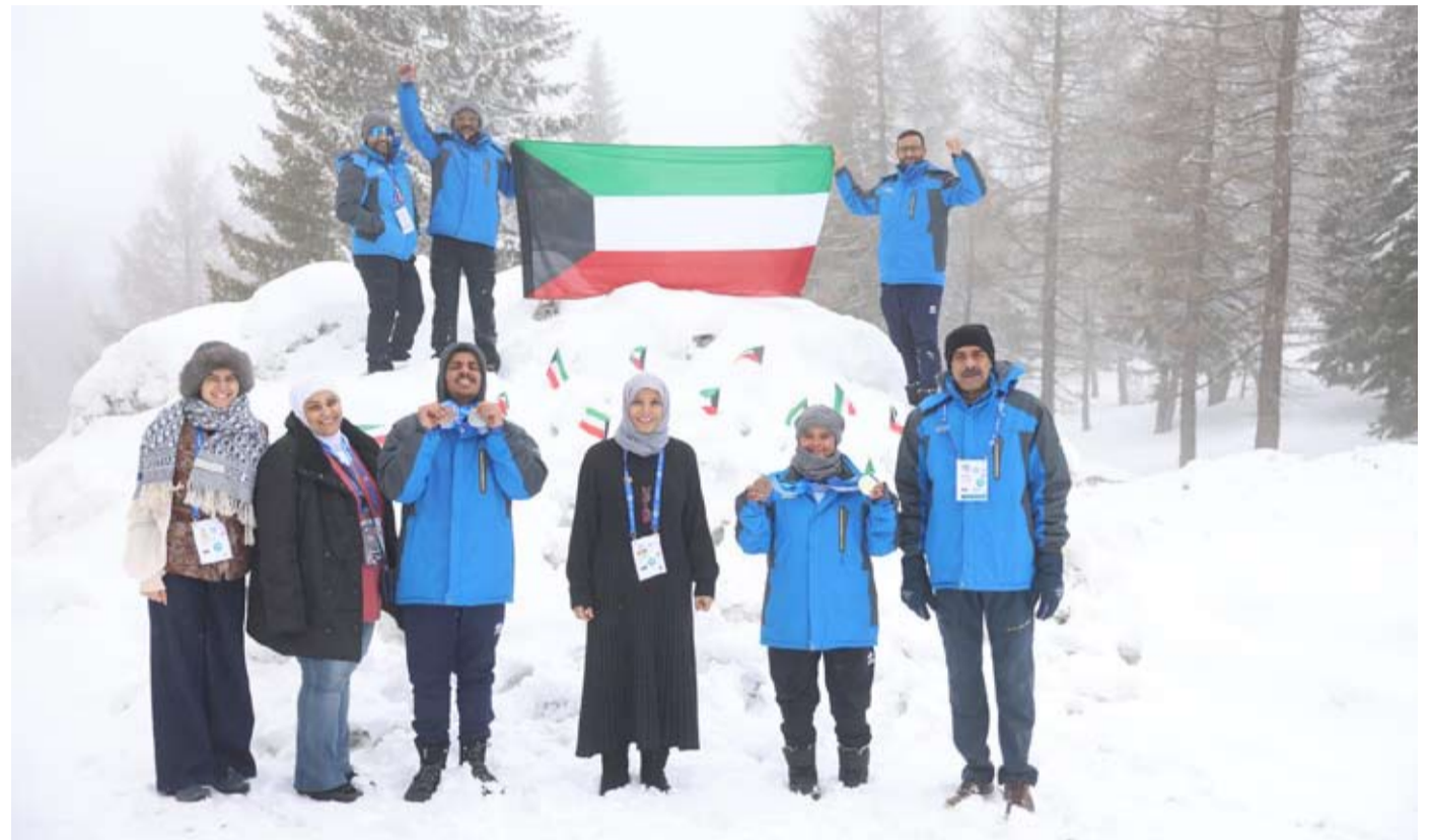
وفد الكويت المشارك في دورة الألعاب الشتوية تورينو 2025

أولياء الأمور في الوصول إلى هذه التناح المشرقة كما قدمت الشكر إلى البعثة الدبلوماسية الكويتية ودورها في تذليل جميع الصعاب مؤكدة حرص الأولمبياد الخاص الكويتي على المضي قدماً في تمكين أبنائنا من الأشخاص ذوي الإعاقة الذهنية والارتقاء بقدراتهم وإبراز مواهبهم ودمجهم في المجتمع وتأهيلهم بما يحقق أهداف التنمية المستدامة ورؤية «كويت جديدة 2035».