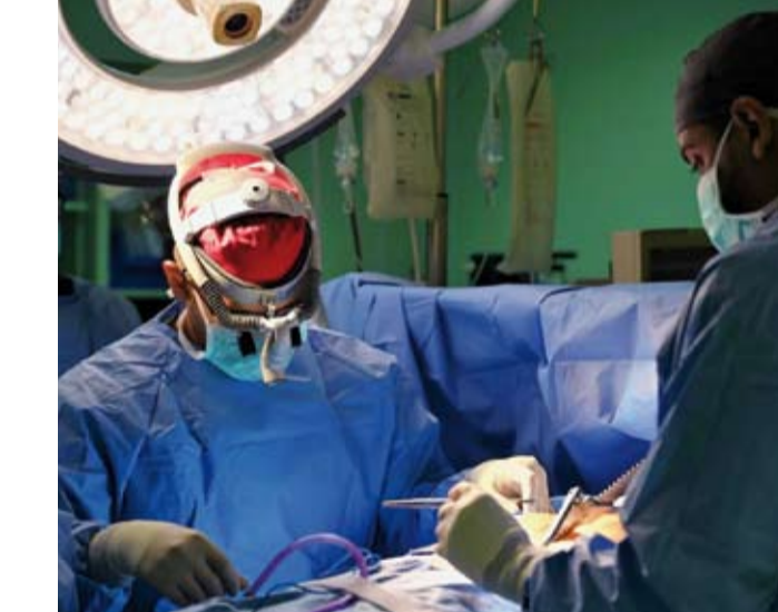
جانب من إحدى العمليات

نجح مركز أمراض وجراحة القلب بالمدينة المنورة في إجراء عملية قلب مفتوح و7 عمليات قسطرة قلبية للمعتمرين من 5 جنسيات مختلفة خلال النصف الأول من شهر رمضان الجاري، وذلك ضمن الجهود الصحية المقدمة لضيوف الرحمن خلال الشهر الكريم. وأكد تجمع المدينة المنورة الصحي حرصه على تعزيز الخدمات الطبية التخصصية لضيوف الرحمن، عبر توفير الكوادر الطبية المؤهلة والتقنيات الحديثة لضمان تقديم الرعاية القلبية اللازمة للحالات الطارئة، مما يساهم في حماية صحة وسلامة المعتمرين وتمكينهم من أداء مناسكهم بكل يسر وطمانينة. ويواصل مركز القلب بالمدينة المنورة تقديم خدماته العلاجية لمرضى القلب من زوار المسجد النبوي، ضمن منظومة متكاملة من الخدمات الصحية المتخصصة خلال الشهر الفضيل.