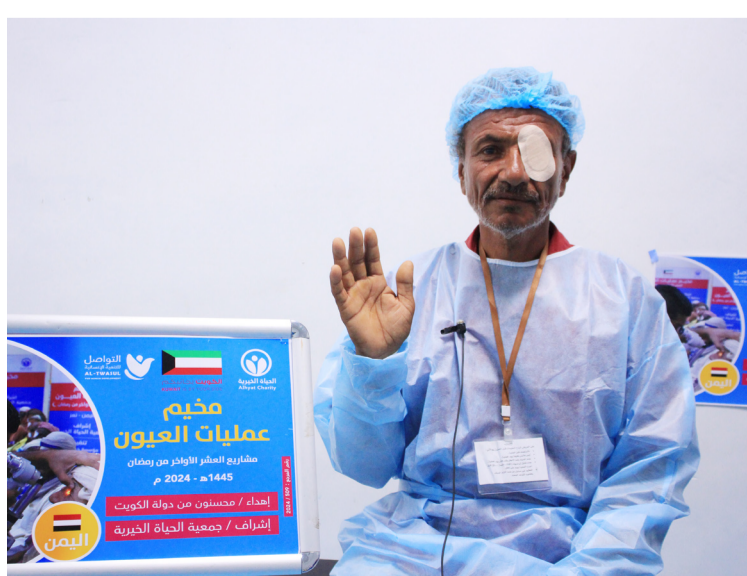
مخيم عمليات العيون في اليمن