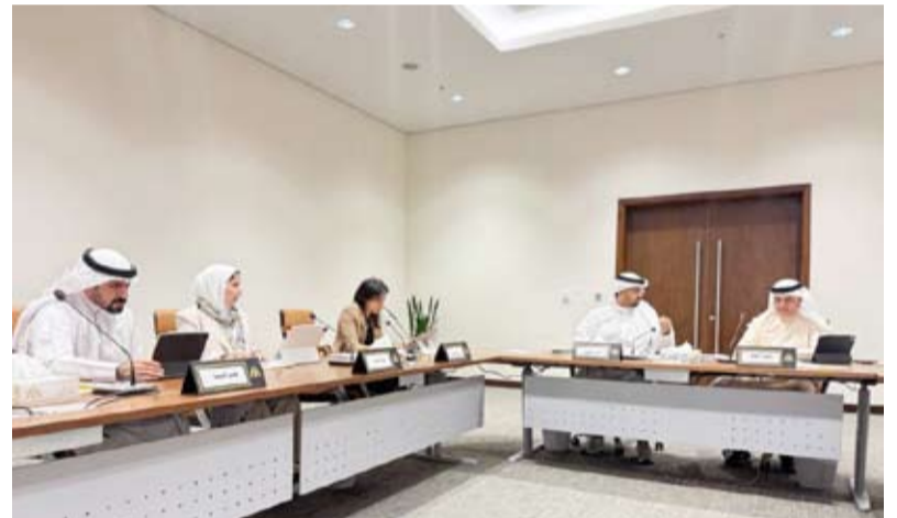
جانب من اجتماع لجنة العاصمة

المجاورة العائدة للدولة الواقعة بمنطقة الشرق قطعة (7). على جدول اعمالها مع دعوة كل من قطاع المشاريع وشركة الشعب الوطنية العقارية كما أعادت اللجنة للجهاز الطلب المقدم من أحد المواطنين بخصوص معاملة كامل العقار الاستثماري للقسيمة رقم 64 بمنطقة شرق لاستعمال مكاتب تجارية لتحديث الرد حسب اللوائح كما حفظت اللجنة طلب وزارة الداخلية بشأن دعوة الاجتماع الخامس للجنة محافظة العاصمة من دور الانعقاد الثالث للفصل التشريعي الثالث عشر للمجلس البلدي