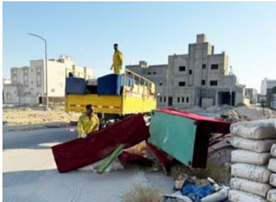
رفع مخلفات تشوين

وواصلت فرق النظافة الميدانية تنفيذ أعمال التنظيف واسعة النطاق في المحافظات لتشمل المناطق التجارية والأسواق العامة والحيوانات الزراعية والصناعية . وقد نفذ فريق ادارة النظافة واشغالات الطرق بمحافظة الأحمدى حملة تنظيف استهدفت منطقة الوفرة الزراعية وأسفرت عن رفع 325 طن من المخلفات الزراعية بالاستعانة بـ 88 الية المعدات والآليات ومشاركة 50 عامل نظافة .