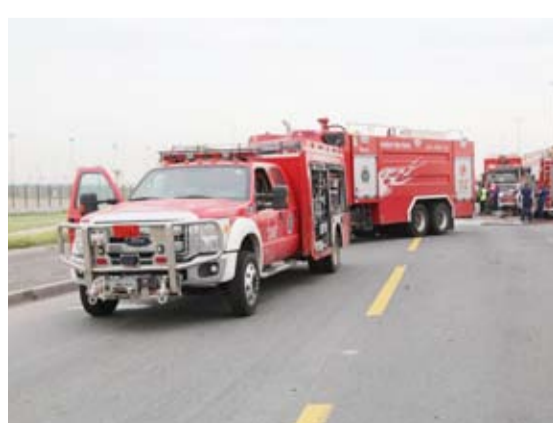
البيات الإطفاء في موقع الحريق

أعلنت قوة الإطفاء العام أن فرق إطفاء من مركز البيروق والمواد الخطرة تعاملت، صباح امس الأحد، مع حادث تصادم بين صهريج غاز ونساف رمل على طريق الدائري السابع. وقالت قوة الإطفاء في تدويته نشرتها على حساب التواصل الاجتماعي «إكس» أن الحادث أسفر عن حالة وفاة وتم تسليم الجثة إلى الجهات المختصة. من جهة أخرى سيطرت فرق إطفاء مركزي الشويخ الصناعية والشهيد مؤخراً على حريق محل بمنطقة الشويخ الصناعية، حيث باشرت الفرق بمكافحة الحريق والسيطرة عليه، ولم يسفر الحادث عن أي إصابات تذكر. كما سيطرت فرق الإطفاء مؤخراً على حريق حافلة نقل ركاب صغيرة في منطقة الفروانية حيث باشرت الفرق بمكافحة الحريق والسيطرة عليه دون وقوع أي إصابات تذكر.