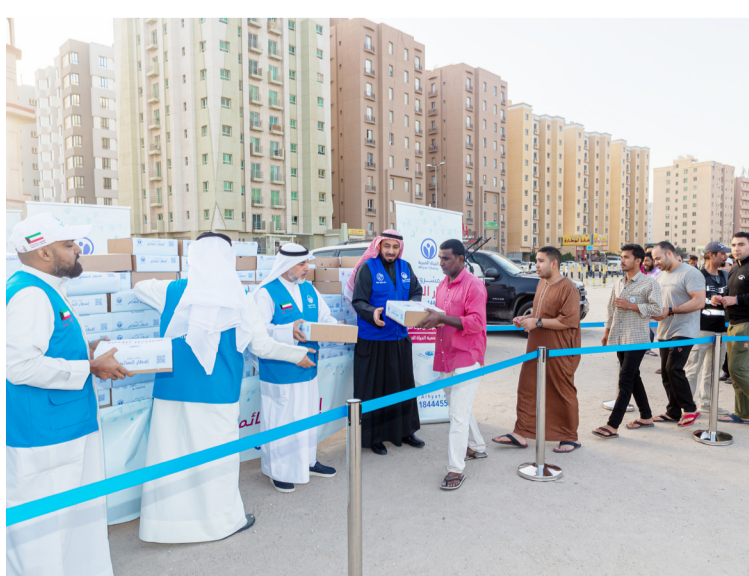
من تنفيذ مشروع إفطار الصائم داخل الكويت