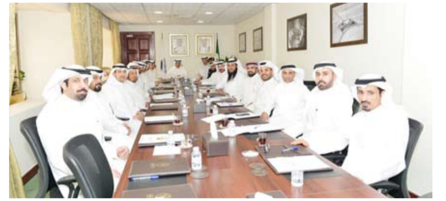
جانب من اجتماع المحافظ ومسؤولي الجمعيات

استقرار الأسواق وضمان استدامة توافر السلع للمواطنين والمقيمين. كما حث محافظ الأحمد مسؤولي الجمعيات التعاونية على تقديم الأفكار والمقترحات والمبادرات المجتمعية التي تسهم في تنمية المناطق المختلفة بالمحافظة بما يتناسب مع خطط التنمية المستدامة. حضر اللقاء رؤساء مجالس إدارات ومسؤولو الجمعيات التعاونية «الأحمدي، الفحجيل، الظهر، علي صباح السالم، الفطاس، جابر العلي، فهد الأحمد، صباح الأحمد السكنية، الوفرة السكنية، الرقة، المنقف، العقيلة، وهدية».