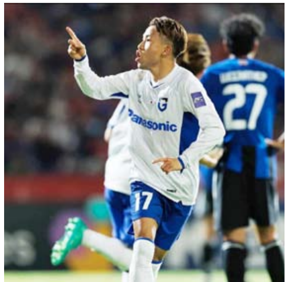
الإثارة حاضرة في أبطال آسيا

تأهل فريق جامبا أوساكا الياباني إلى المباراة النهائية لبطولة دوري أبطال آسيا /2/ لكرة القدم، بعد فوزه على مضيفه بانكوك يونائيد التايلاندي (3 - صفر) في إياب الدور نصف النهائي من المسابقة.