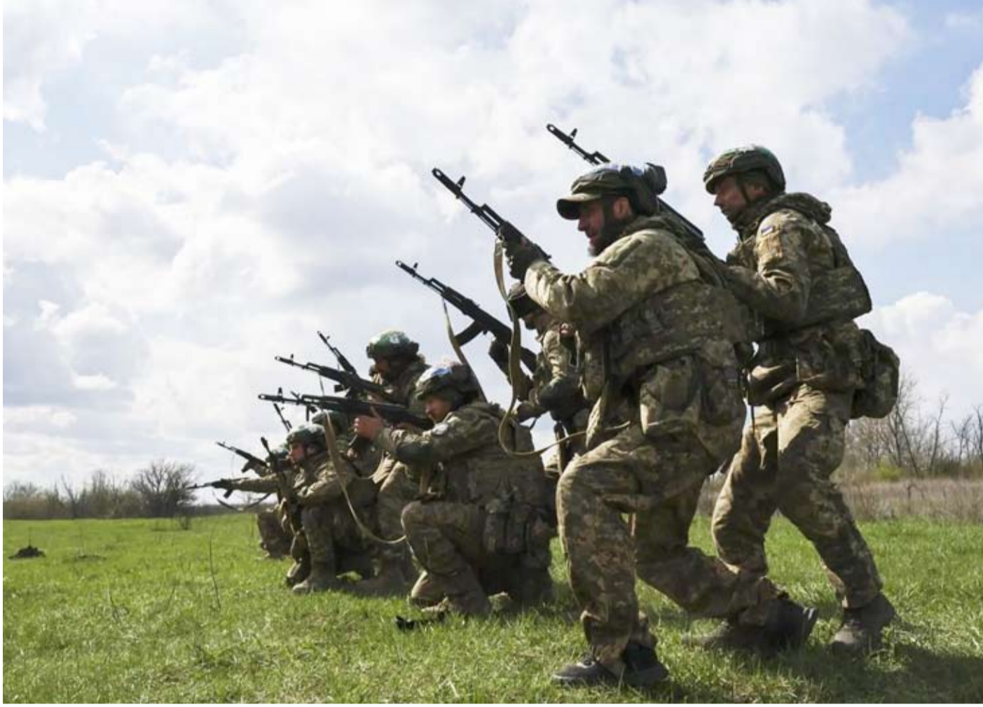
مجنونين أوكرانيون من «اللواء الألي المنفصل 65»

وكشفت أوكرانيا هجمات على موانئ ومصانع وأسدة روسية؛ في مسعى للحد من عائدات موسكو من صادرات السلع الأساسية، في وقت أدت فيه حرب إيران إلى ارتفاع الأسعار العالمية.