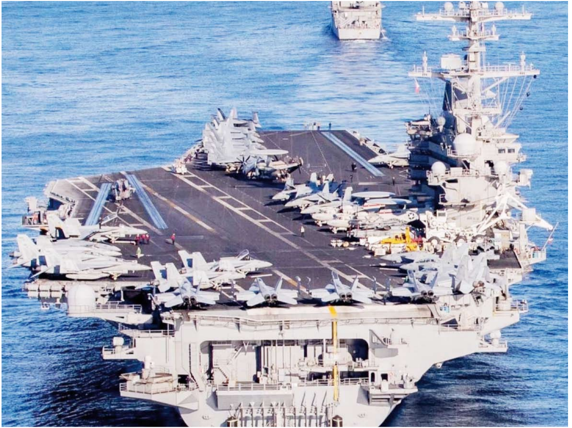
حاملة الطائرات «يو إس إس جورج إتش ديليو بوش»

في ظل هدنة مؤقتة بين إيران من جهة، والولايات المتحدة وإسرائيل من جهة أخرى، تكشف المعطيات الميدانية عن سباق خفي لإعادة ترتيب القدرات العسكرية. فبينما تعلن الأطراف المختلفة عن نجاحات ميدانية وضربات نوعية، تشير الأدلة الخفية والتحليلات الاستخباراتية إلى أن طهران تسعى، بهدوء ولكن بثبات، إلى استعادة جزء من بنيتها الصاروخية التي تضررت خلال المواجهات الأخيرة. وفي هذا السياق، أفادت صحيفة «التلغراف» بأن صور الأقمار الاصطناعية تظهر شروع إيران في إزالة آثار الدمار من قواعد الصاروخية تحت الأرض، مستفيدة من فترة وقف إطلاق النار. وقد رصدت أليات فضائية تعمل على رفع الأنقاض من مداخل أنفاق كانت قد أغلقت، حيث جرى تجميع الركام ونقله عبر شاحنات إلى مواقع قريبة. وتجدر الإشارة إلى أن هذه المداخل كانت قد استهدفت بشكل متعمد خلال غارات سابقة نفذتها الولايات المتحدة وإسرائيل، في إطار استراتيجية عسكرية هدفت إلى شل قدرة منصات إطلاق الصواريخ عبر حصرها داخل منشآت تحت الأرض ومنعها من الحركة أو الاستخدام. وتُظهر إحدى صور الأقمار الاصطناعية، الملتقطة في 10 أبريل، جرافة أمامية تقف فوق كومة من الأنقاض التي كانت تسد مدخل أحد الأنفاق، إلى جانب عدد من الشاحنات التي تنتظر في محيط الموقع داخل قاعدة صاروخية قرب مدينة الخمين الإيرانية. كما أظهرت صورة أخرى التقطت نشاطاً لمعدات بناء في موقع منفصل بمدينة تبريز. وقد هدفت الضربات الجوية، من خلال إغلاق منافذ الخروج، إلى منع منصات الإطلاق من الانتشار أو تنفيذ عمليات إطلاق، أو حتى العودة إلى مواقعها لإعادة التزود. ومع ذلك، تشير تقييمات الاستخبارات الأميركية إلى أن نحو نصف منصات إطلاق الصواريخ الإيرانية لا تزال سليمة.