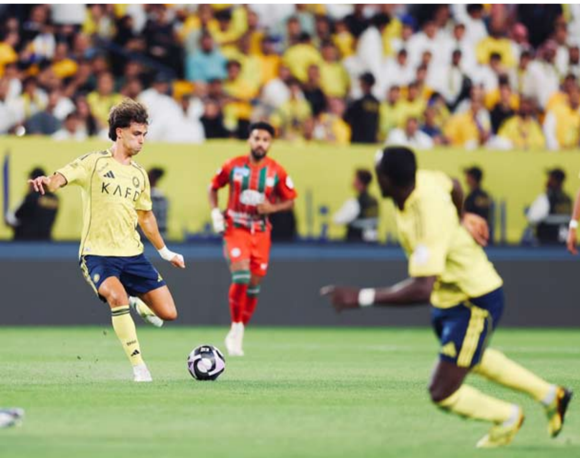
النصر يتعد في صدارة الدوري السعودي

وسّع النصر فارق الصدارة مع منافسيه في الدوري السعودي للمحترفين، بفوز جديد على حساب الاتفاق بنتيجة 1 / صفر، ضمن منافسات الجولة الـ29 من البطولة.