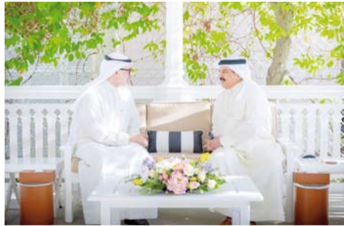
العاقل البحريني الملك حمد بن عيسى يستقبل وزير الخارجية الشيخ جراح الجابر

العدوان الإيراني الأثم وتطورات الأحداث في المنطقة والجهود الدبلوماسية المبذولة بشأنها، حيث شدد الجانبان على أهمية أن تفضي تلك الجهود إلى التوصل لتسوية شاملة ومستدامة تعزز الأمن والاستقرار في المنطقة. وأكد الجانبان مواصلة التنسيق الكويتي - البحريني على مختلف الصعد في ظل هذه الظروف الدقيقة التي تمر بها المنطقة انطلاقاً من وحدة المصير والتاريخ المشترك وتعزيزاً للجهود لمواجهة التحديات الراهنة.