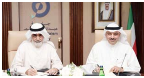
د. بدر البصيري و د. عادل الحسينان يوقعان العقد

ووقعت وزارة التعليم العالي، أمس، عقد استئجار مع جامعة (عبدالله السالم) لاستخدام عدد من مبانيها في موقع كيهان مقراً للوزارة والجهات التابعة لها وذلك ضمن توجه الوزارة نحو تعزيز كفاءة الإنفاق الحكومي وترشيد التكاليف التشغيلية. وقال وكيل الوزارة الدكتور بدر البصيري في تصريح صحفي: إن هذه الخطوة تأتي ضمن خطة تنظيمية متكاملة تهدف إلى الاستفادة المثلى من الأصول والمرافق الحكومية وتوظيف المساحات المتاحة بما يحقق قيمة مضافة على مستوى الأداء المؤسسي. وأضاف الدكتور البصيري، أن هذه الخطوة ستسهم في توفير بيئة عمل حديثة ومتكاملة تدعم تطوير آليات العمل وتعزز جودة الخدمات المقدمة بما يواكب متطلبات المرحلة الحالية ويرفع من كفاءة الأداء الحكومي فضلاً عن تحقيق وفر مالي عبر خفض المصروفات التشغيلية وتحسين الاستفادة من الإمكانيات المتاحة. وأوضح أن الانتقال إلى مباني جامعة عبدالله السالم في موقع كيهان، سيتم بعد استكمال أعمال