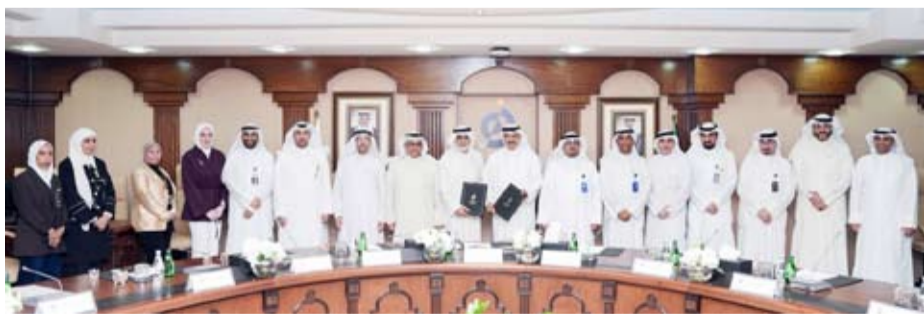
لقطة جماعية للمشاركين في الاجتماع

ووقعت وزارة التعليم العالي، أمس، عقد استئجار مع جامعة (عبدالله السالم) لاستخدام عدد من مبانيها في موقع كيهان مقراً للوزارة والجهات التابعة لها وذلك ضمن توجه الوزارة نحو تعزيز كفاءة الإنفاق الحكومي وترشيد التكاليف التشغيلية. وقال وكيل الوزارة الدكتور بدر البصيري في تصريح صحفي: إن هذه الخطوة تأتي ضمن خطة تنظيمية متكاملة تهدف إلى الاستفادة المثلى من الأصول والمرافق الحكومية وتوظيف المساحات المتاحة بما يحقق قيمة مضافة على مستوى الأداء المؤسسي. وأضاف الدكتور البصيري، أن هذه الخطوة ستسهم في توفير بيئة عمل حديثة ومتكاملة تدعم تطوير آليات العمل وتعزز جودة الخدمات المقدمة بما يواكب متطلبات المرحلة الحالية ويرفع من كفاءة الأداء الحكومي فضلاً عن تحقيق وفر مالي عبر خفض المصروفات التشغيلية وتحسين الاستفادة من الإمكانيات المتاحة. وأوضح أن الانتقال إلى مباني جامعة عبدالله السالم في موقع كيهان، سيتم بعد استكمال أعمال