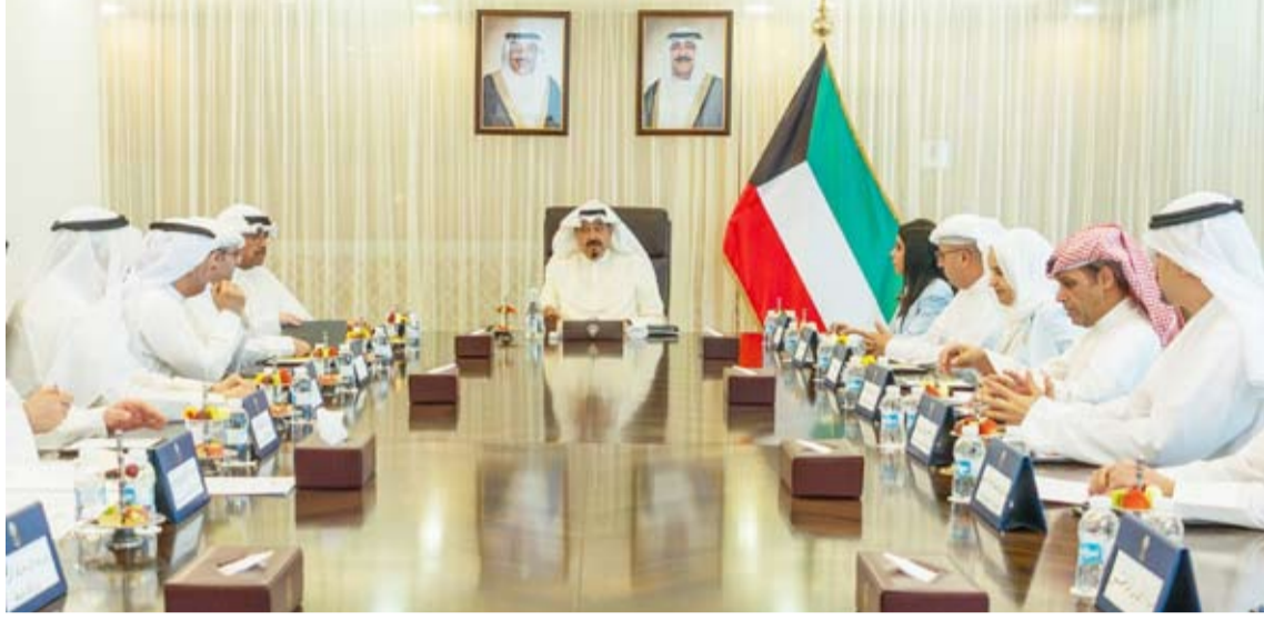
سمو الشيخ أحمد العبدالله يترأس الاجتماع

رئيس مجلس الوزراء بالإنابة الشيخ خالد محمد الخالد، ورئيس إدارة الفتوى والتشريع المستشار صلاح الماجد، ومساعده وزير الخارجية لشؤون آسيا وعضو ومقرر اللجنة الوزارية للشفافية سميح جوهر حيات.