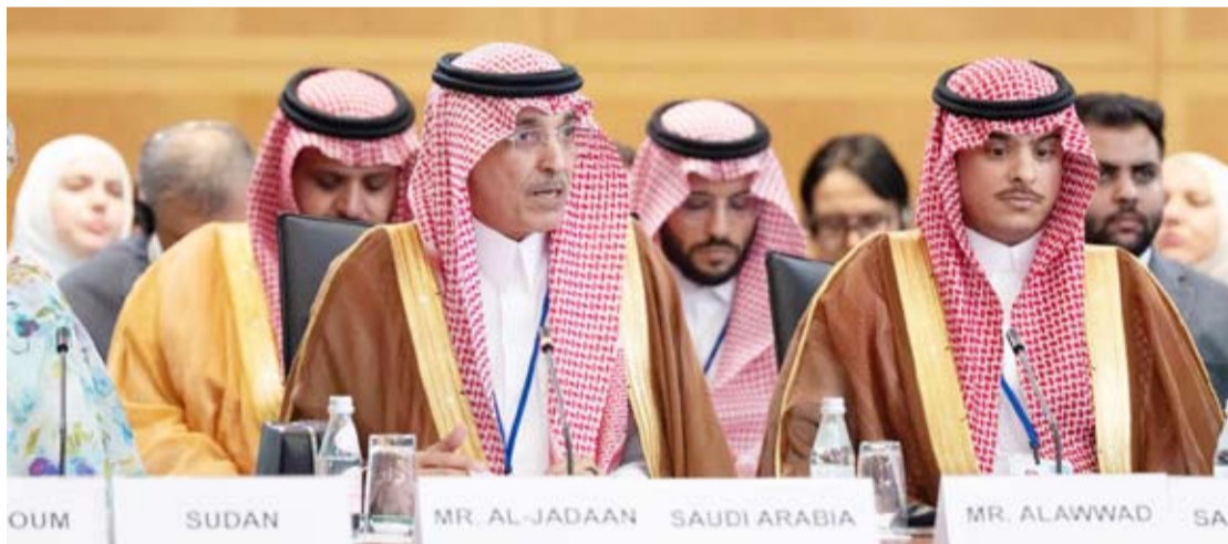
الجدعان متحدثاً في الاجتماع

أكد وزير المالية السعودي، محمد الجدعان، أن المملكة نجحت في الحفاظ على استقرارها الاقتصادي واستمرارية أنشطتها خلال الأزمات الراهنة.