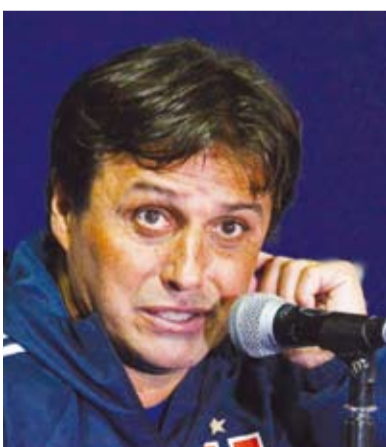
الأرجنتيني غيرمو هويوس

قال الأرجنتيني غيرمو هويوس إن صداقته الطويلة مع النجم ليونيل ميسي لن تمنعه من العمل بجد مع مواطنه في الترتيبات، وذلك خلال تقديمه مدرباً جديداً لفريق إنتر ميامي المنافس في الدوري الأميركي لكرة القدم «إم إل إس»، الأربعاء.