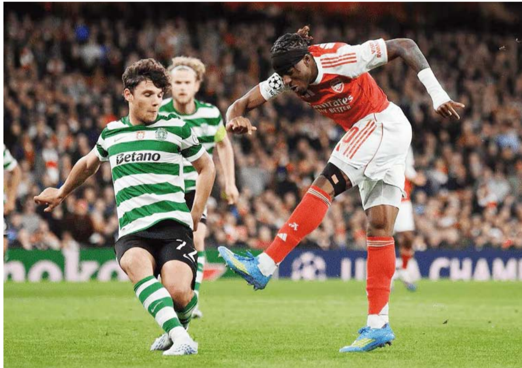
أداء غير مقنع لآرسنال في دوري الأبطال

واصل آرسنال حلمه بالتتويج بلقب دوري أبطال أوروبا للمرة الأولى في تاريخه، بعدما تأهل للدور قبل النهائي في المباراة القارية، للنسخة الثانية على التوالي.