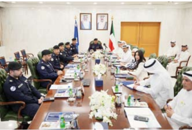
اللواء عبدالوهاب الوهيب خلال اجتماعه مع مجلس إدارة اتحاد وكلاء السيارات

والعمل على تذليلها، حيث جرى الاتفاق على جملة من الإجراءات التنظيمية التي تعود بالنفع والإيجاب على وكالات السيارات مع مراعاة الجوانب الأمنية المعتمدة وبما يحقق المصلحة العامة للبلاد. وأكد اللواء الوهيب حرص النائب الأول لرئيس مجلس الوزراء ووزير الداخلية الشيخ فهد اليوسف على دعم أوجه التعاون البناء مع القطاع الخاص بما يسهم في تطوير الخدمات المقدمة وتحقيق التكامل المؤسسي. ولفت إلى حرص القيادة العليا بالوزارة على تذليل العقبات وتقديم التسهيلات اللازمة للارتقاء بمستوى الخدمات، فيما أشاد وفد الاتحاد بالتعاون القائم مع الوزارة ونهجها في التواصل الفعال بما يسهم في تطوير بيئة العمل وتحقيق الأهداف المشتركة.