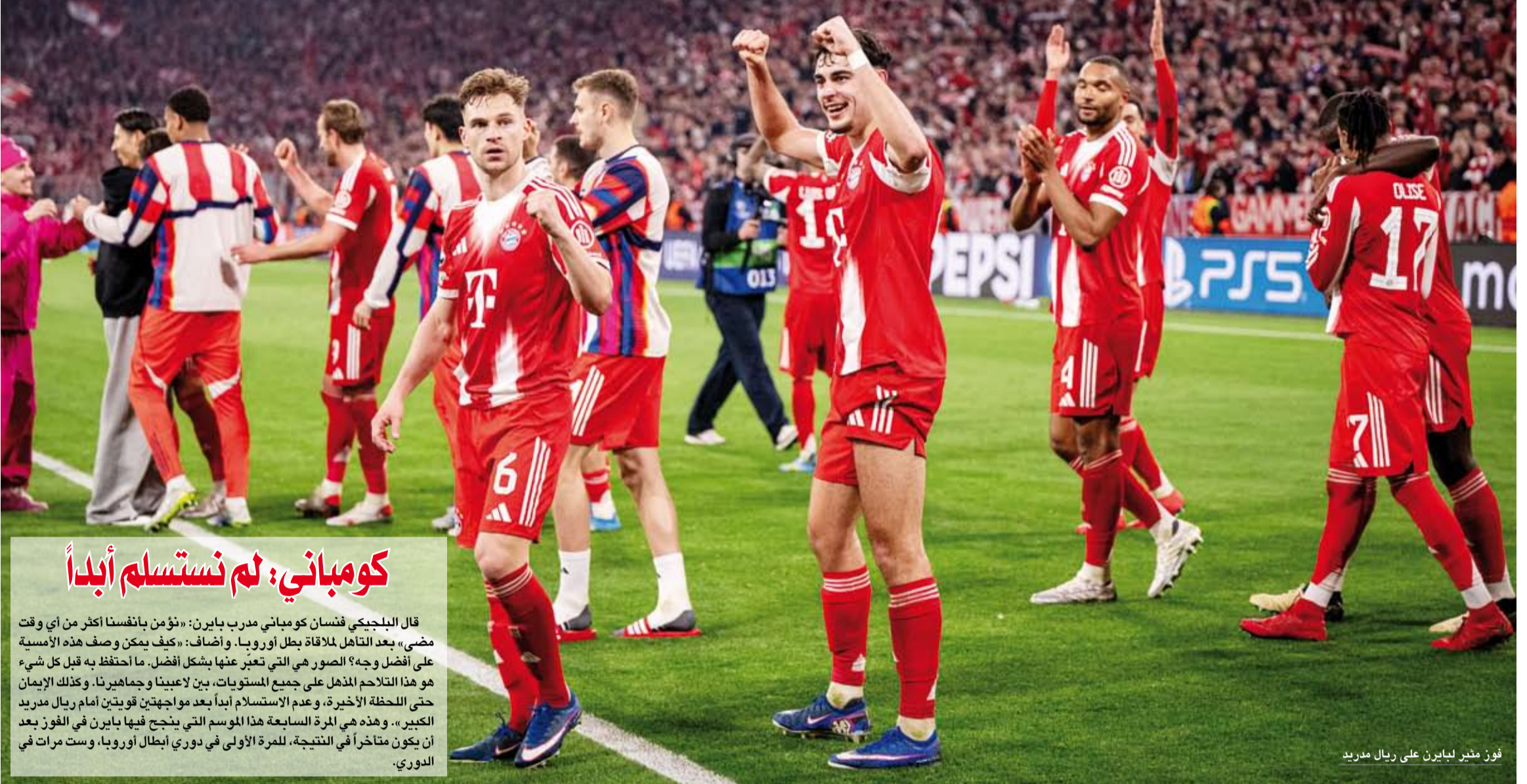
فوز منير لبايرن على ريال مدريد

وسجل الكولومبي لويس دياز هدف التعادل (3-3) في الدقيقة 89، الكافي للتأهل بعد الفوز 2-1 ذهابًا في مدريد، قبل أن يحسم الفرنسي ميكايل أوليسيه الأمور (4+90)، بعدما سبقهما الإنجليزي هاري كاين (38) والكنسندر بافلوفيتش (6)، مقابل ثلاثة أهداف من