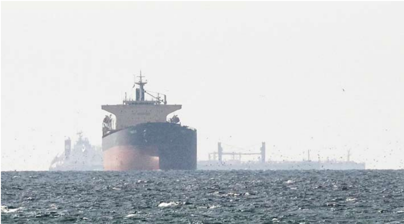
سفينة شحن في الخليج العربي

تستمر أسعار خام غرب تكساس الوسيط في التذبذب بين 80 و100 دولار.