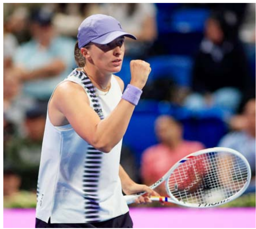
البولندية إيغا شفيونتيك

وانتهى مشوار الإيطالية جازمين باوليني المصنفة الخامسة عند الدور الأول بخسارتها أمام التركية زينب سونميز المصنفة 79 عالمياً بواقع 2 - 6 و2 - 6.