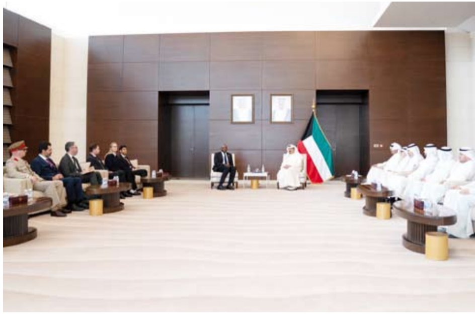
سمو الشيخ أحمد العبدالله مستقبلاً ديفيد لامي والوفد المرافق

استقبل سمو الشيخ أحمد العبدالله رئيس مجلس الوزراء، أمس، ديفيد لامي اللورد المستشار ووزير العدل ونائب رئيس الوزراء في المملكة المتحدة لبريطانيا العظمى وأيرلندا الشمالية والوفد المرافق له وذلك بمناسبة زيارته للبلاد. وتسلم سمو رئيس مجلس الوزراء - خلال اللقاء - رسالة خطية موجهة إلى صاحب السمو أمير البلاد الشيخ مشعل الأحمد من رئيس وزراء المملكة المتحدة لبريطانيا العظمى وأيرلندا الشمالية كير ستارمر تتعلق بالعلاقات الثنائية بين البلدين الصديقين. كما جرى استعراض العلاقات الثنائية الوثيقة وسبل تعزيزها بما يحقق المصالح المشتركة إضافة إلى تبادل وجهات النظر حول آخر مستجدات القضايا على الساحتين الإقليمية والدولية. وحضر المقابلة وزير الدفاع الشيخ عبدالله العلي، ووزير الخارجية الشيخ جراح الجابر، ومدير عام هيئة تشجيع الاستثمار المباشر الشيخ الدكتور مشعل جابر الأحمد، ورئيس ديوان رئيس مجلس الوزراء بالإنابة الشيخ خالد محمد الخالد، ومساعد وزير الخارجية لشؤون أوروبا السفير صادق معرفي، وسفير المملكة المتحدة لبريطانيا العظمى وأيرلندا الشمالية لدى دولة الكويت قدسي رشيد.