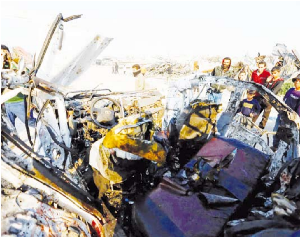
غارات مكثفة تستهدف عناصر «القسام» في المنطقة

في الوقت الذي تهدد فيه إسرائيل بالعودة إلى الحرب على قطاع غزة، حال رفضت حركة «حماس» والفصائل الأخرى بشكل نهائي نزع سلاحها، كنف الجيش الإسرائيلي عملياته في مناطق وسط القطاع. وعبرت مصادر ميدانية من الفصائل الفلسطينية في القطاع عن مخاوف من خطة لتكثيف الهجمات في المنطقة التي كانت وفق تقييمهم «الأقل ضرراً»، خلال الحرب التي امتدت منذ أكتوبر 2023، حتى إعلان اتفاق وقف إطلاق النار في أكتوبر 2025. ورغم الإعلان عن اتفاق وقف إطلاق النار، ارتكبت إسرائيل خروقات يومية في مناطق واسعة من القطاع مع تركيز خاص على المنطقة الوسطى. وفي ظل التلويح الإسرائيلي بإمكانية استئناف الحرب بغزة تسود مخاوف بين الفصائل الفلسطينية من أن تستهدف إسرائيل بشكل أكبر المناطق التي لم تعمل بها سابقاً وبشكل أساسي المنطقة الوسطى، وأوضح مصدر ميداني من فصائل في غزة أن «المنطقة الوسطى خلال عامي الحرب كانت عادةً تتعرض لهجمات جوية، وبشكل محدود جداً شهدت عمليات برية؛ الأمر الذي أبقى منطقتها على قيد الحياة وبنيتها التحتية جيدة مقارنة بحالة التدمير التي لحقت بمناطق أخرى من القطاع». وتحدث مصدر ميداني آخر من حركة «حماس» لـ«الشرق الأوسط» عن أن الهجمات الإسرائيلية المتصاعدة في وسط غزة تُركّز على استهداف منشآت الفصائل والمركبات التابعة للشرطة والحواجز الأمنية التابعة لـ«كتائب