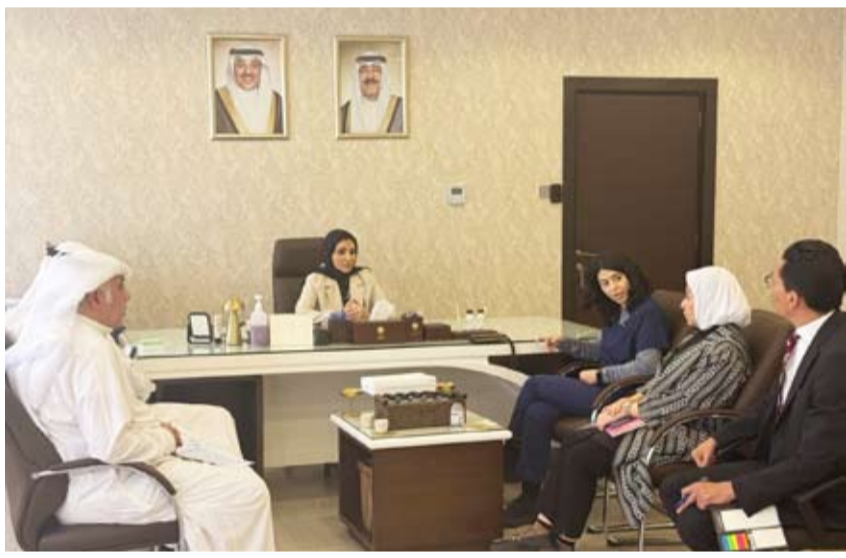
د. أمثال الحويلة خلال اجتماع مع قيادات الهيئة العامة لشؤون ذوي الإعاقة