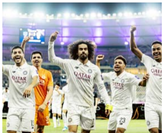
لاعبو السد القطري يحتفلون بلقب الدوري

أعلن الاتحاد القطري لكرة القدم إقامة نهائي كأس الأمير لعام 2026 يوم 9 مايو المقبل على استاد خليفة الدولي، في ختام النسخة الرابعة والخمسين من البطولة، التي تُعد الأهم على مستوى بطولات الكأس في قطر.