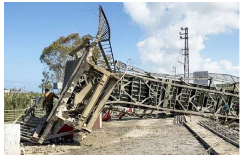
الاحتلال يقصف آخر الجسور الواصلة بين الجنوب ولبنان

أعلن الرئيس الأميركي دونالد ترامب التوصل إلى اتفاق لبدء هدنة مؤقتة بين لبنان وإسرائيل تبدأ منتصف ليل يوم أمس ولمدة عشرة أيام، عقب اتصالات أجراها مع كل من الرئيس اللبناني جوزاف عون ورئيس وزراء الاحتلال الإسرائيلي بنيامين نتنياهو. وقال ترامب: "لقد أجريت محادثات ممتازة مع الرئيس اللبناني المحترم جوزاف عون، ورئيس الوزراء الإسرائيلي بنيامين نتنياهو"، مضيفاً أن "هذين القادتين اتفقا على أنه من أجل تحقيق السلام بين بلديهما، سيبدأن رسمياً هدنة لمدة 10 أيام تبدأ عند الساعة الخامسة مساءً بتوقيت شرق الولايات المتحدة".