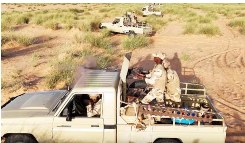
تعزيزات عسكرية إلى مناطق توتر مع مالي