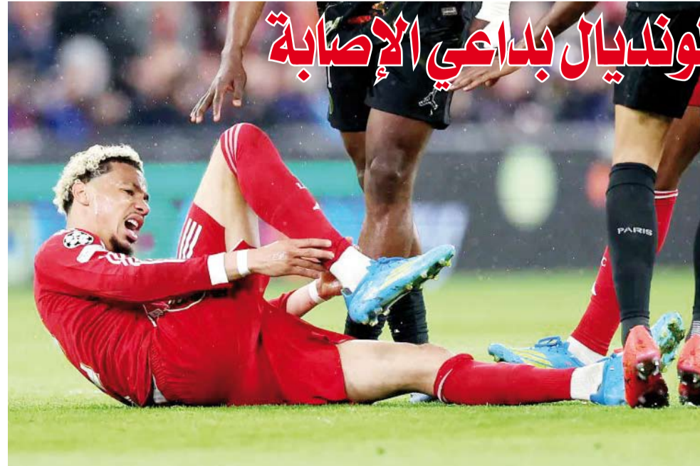
المهاجم أوغو إيكيتيكيه

أعلن ديبدييه ديشان مدرب المنتخب الفرنسي لكرة القدم غياب المهاجم أوغو إيكيتيكيه عن المشاركة في كأس العالم المقبلة، بسبب الإصابة الخطيرة التي تعرض لها مع فريقه ليفربول الإنجليزي في ربع نهائي دوري أبطال أوروبا.