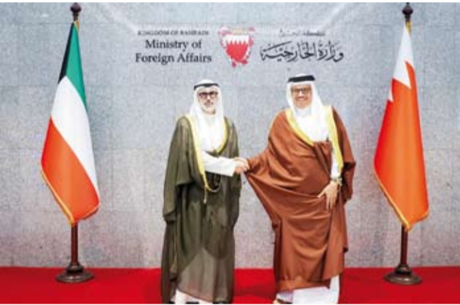
الشيخ جراح الجابر ووزير خارجية البحرين د.عبد اللطيف الزياتي