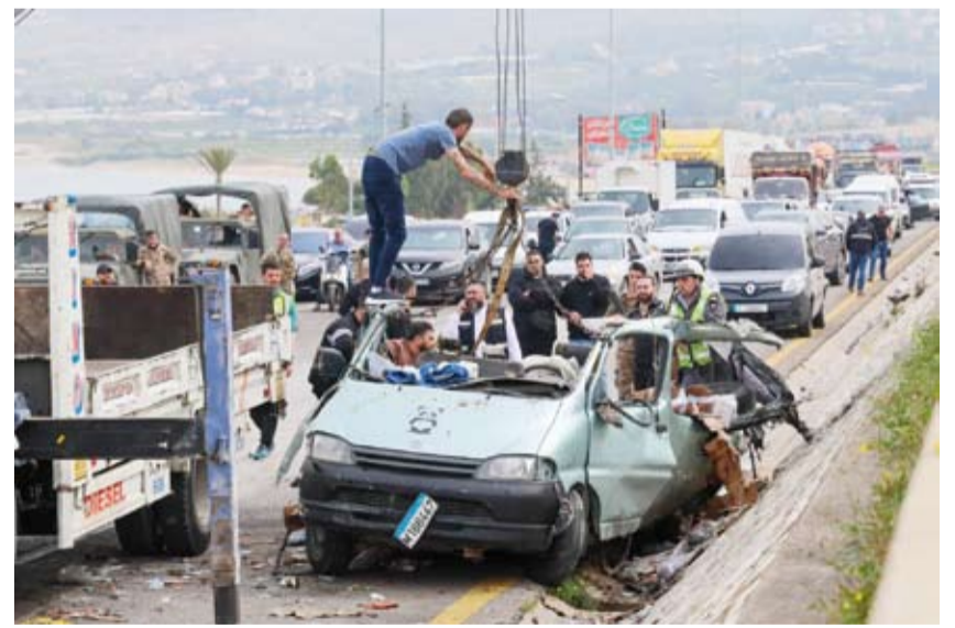
أشخاص يزيلون حطام سيارة جنوب بيروت

على صعيد الخسائر، انتشرت فرق الدفاع المدني 4 قتلى و3 جرحى من مجمع «الخضر» في منطقة قدوس بدمية صور، فيما قتلت عائلة كاملة من 4 أفراد في غارة على بلدة جياح بإقليم النجاف. كما سجلت إصابات في برعشيت والصوالة، في حين ارتفعت حصيلة غارة أنصارية إلى 5 قتلى و4 جرحى، وسط تحليق مكثف من الميسرات في أجواء النبطية، وغارات متقطعة ترافقت مع اشتباكات وتمشيط بالأسلحة المتوسطة من جهة الخيام. وفي الجنوب أيضاً شنّ الطيران الحربي الإسرائيلي غارة على بلدة ميغدون بقضاء النبطية، قبل أن تستهدف مسيرة فريق إسعاف خلال توجهه إلى المكان؛ ما أدى إلى سقوط 4 عناصر من «الهيئة الصحية الإسلامية» و«كشافة الرسالة الإسلامية». في موازاة ذلك، فجرّت القوات الإسرائيلية منازل في الناقورة بقضاء صور، واستهدفت مسيرة سيارة عند مثلث إبل السقي - بلاط - برغز قرب مركز «البيونفيل» في القطاع الشرقي.