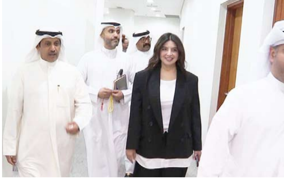
العصفور أثناء جولتها

ألا تقل مساحة المعرض وملحقاته عن 1000م 2 ، في القطاع 13 القسائم المطلة على طريق الغزالي والقطاع 10 القسائم المطلة على الدائري الرابع والقسائم المطلة على شارع محمد بن القاسم و قطاع 6 القسائم المطلة على شارع كندا دراي، والقطاع 8 بالكامل. 5 - إضافة نشاط تأجير السيارات ككاتب للتاجر بالقطاع 10 القسائم المطلة على الدائري الرابع شرط ألا تقل مساحة مكتب التاجر عن 2500م 2 مع عمل دراسة مرورية تبين أماكن الانتظار والداخل والمخرج. 6 - إضافة نشاط ناد صحي الشويخ الصناعية الثانية قطاع 7. 7 - إضافة نشاط بيع التجزئة ضمن القطاع 10 القسائم المطلة على الدائري الرابع والغزالي ومحمد بن القاسم. 8 - إضافة نشاط خدمات البيطرة بجميع أنواعها مثل (بيع أدوية بيطرية، خدمات بيطرية، صيدلية بيطرية، عيادة بيطرية، العناية بالحيوانات صالون حلاقة حيوانات، بيع سمك الزينة والطيور، مركز ترفيحي للحيوانات الأليفة) في قطاع 13 الري، شرق طريق الغزالي، وإيقاف التراخيص الجديدة لخدمات