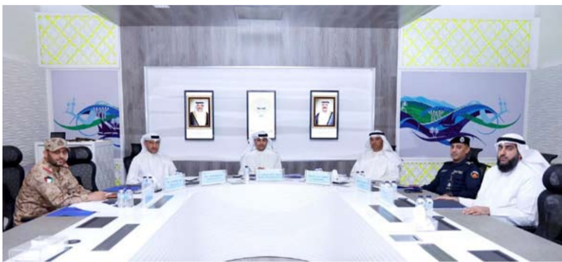
جانب من الاجتماع مع الجهات المعنية