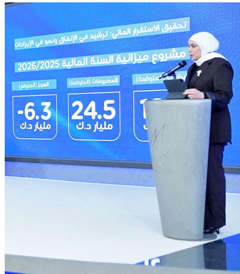
وزير المالية نورة الفصام خلال مؤتمر صحفي أمس للحديث عن ميزانية 2025-2026

النجاح الباهر الذي حققته دولة قطر في استضافة بطولة كأس العالم 2022 ، ونجاح الكويت بامتياز في تنظيم كأس الخليج ، وفوز المملكة العربية السعودية باستضافة كأس العالم 2034 ، خير دليل على إمكانيات دول المجلس وقدراتها العالية في استضافة الفعاليات الكبرى وجذب السياح من مختلف أنحاء العالم.