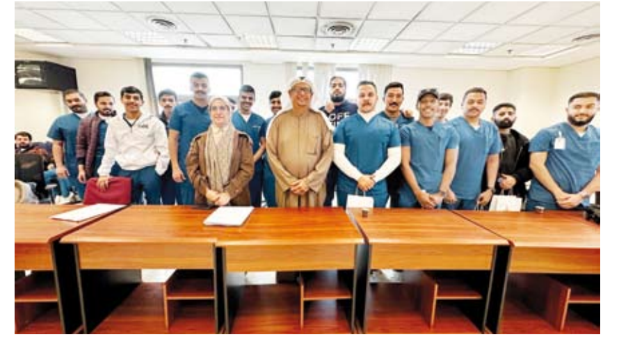
جانب من المشاركين في الأسبوع الثقافي

الموهوبين باستعراض قدراتهم وإمكانياتهم المميزة والفريدة. وشهدت فعاليات الأسبوع الثقافي إقبالاً كبيراً من الطلبة والطالبات وأعضاء هيئة التدريس الذين أبدوا سعادتهم وإعجابهم بما تم تقديمه خلال الأسبوع، وفي الختام تم منح شهادات للمشاركين.