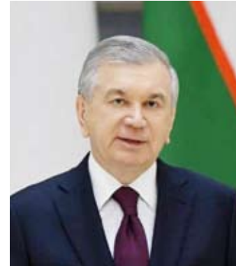
رئيس أوزبكستان ميرزيايف

من جانبه قال رئيس اللجنة المنظمة أحمد إسماعيل بهيجاني: تجسد العلاقات الكويتية البريطانية والتي تمتد لـ 250 عاماً نموذجاً مميزاً للعلاقات المبنية على أسس صلبة تركز على الصداقة التاريخية، والتي توجت بتوقيع المغفور له بإذن الله تعالى الشيخ مبارك الصباح على المعاهدة الكويتية البريطانية 1899 والتي أكدت على استقلالية القرار الكويتي وأبعدت الكويت عن الصراعات الدولية الكبرى وأضاف: لا شك أن رعاية سمو الشيخ ناصر المحمد للحدث تؤكد عمق وتاريخ