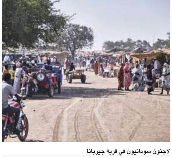
لاجئون سوريون في قرية جبربانا

قال الأمين العام للأمم المتحدة أنطونيو غوتيريش إنه يجب على المجتمع الدولي أن يتحد لوقف تدفق الأسلحة وتمويل إراقة الدماء في السودان. واقتربت الحرب في السودان بين الجيش و«قوات الدعم السريع» من دخول عامها الثالث، ولا يبدو في الأفق نهاية للصراع الذي أسقط آلاف القتلى وشرّد أكثر من 12 مليون سoudاني، متسبباً في واحدة من كبرى أزمات النزوح في العالم. وقال غوتيريش في حسابه على «إكس»: «السودان يتمزق أمام أعيننا، وهو الآن موطن لأكثر أزمة نزوح ومجاعة في العالم». وأضاف الأمين العام للأمم المتحدة: «حان الوقت لوقف الأعمال العدائية في السودان على الفور». وكان غوتيريش قد قال أمام «المؤتمر الإنساني رفيع المستوى لدعم شعب السودان»، الذي أقيم على هامش قمة الاتحاد الأفريقي في أديس أبابا: «لا بد من وقف الدعم الخارجي وتدفق الأسلحة، اللذين من شأنهما أن يساعدا في استمرار الحرب والدمار الكبير الذي يلحق بالملايين وسفك الدماء في السودان».