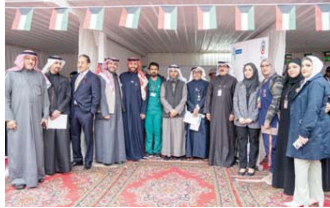
وكيل وزارة الصحة د. عبد الرحمن المطيري وعدد من الحضور

من جانبه قال مدير المستشفى الدكتور حسين الشمري لـ (كوونا): إن المستشفى حرص على المشاركة في مثل هذه المناسبات العزيمية، إذ تم التجهيز للفعالية من مختلف أقسامها الطبية، داعياً أن يدوم على الكويت نعمة الأمن والأمان.