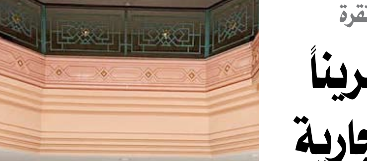
جانب من التمرين

شدد محافظ الفروانية الشيخ عذبي الناصر على ضرورة الالتزام بالجدول الزمني المحدد لصيانة الطرق في المحافظة، مؤكداً أهمية المتابعة المستمرة لآخر الأعمال للاستكمال في إنجاز الخطة الموسوعة وذلك عبر الاجتماعات المستمرة مع وزارة الأشغال والشركات المنفذة والقيام بجولات تفقدية.