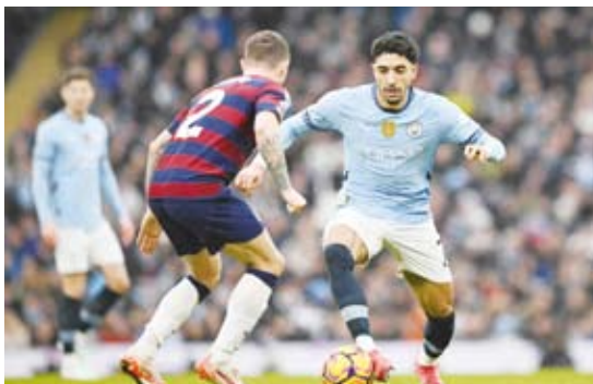
مرموش رجل مباراة سيتي ونيوكاسل

بينما سجل الإنجليزي جيمس ميكاتي الهدف الرابع في الدقيقة (84). وتجاوز حامل اللقب خسارته الثقيلة (5-1) في الجولة الماضية أمام أرسنال، ليرتقي للمركز الرابع بعدما رفع رصيده إلى 44 نقطة، بينما تراجع نيوكاسل للمركز السابع برصيد 41 نقطة.