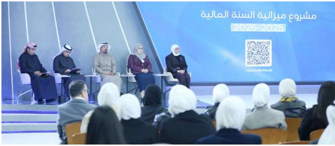
جانب من مؤتمر الميزانية