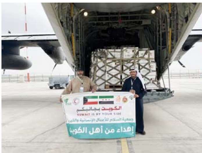
الطائرة الـ 28 من الجسر الجوي الكويتي