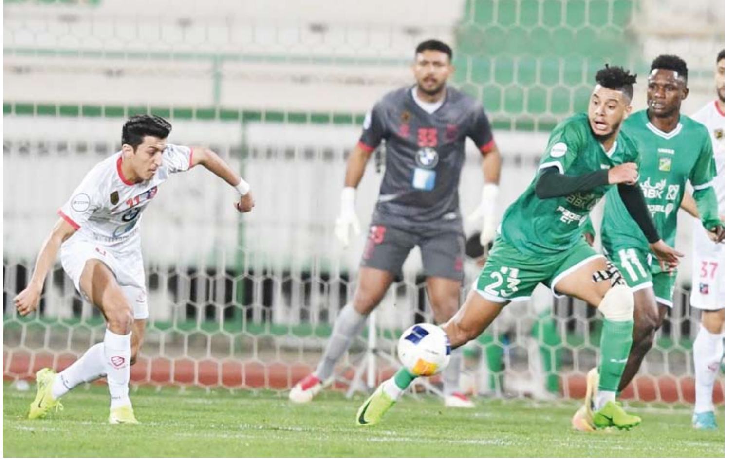
الإثارة حاضرة في اللقاء رغم نظافة الشباك

40 نقطة في صدارة الترتيب في حين وصل العربي إلى النقطة 38 بالمركز الثاني. وأسفرت نتائج المباريات الأخرى التي أقيمت في نفس الجولة عن فوز كل من النصر والقادسية والسالمية على البرموك