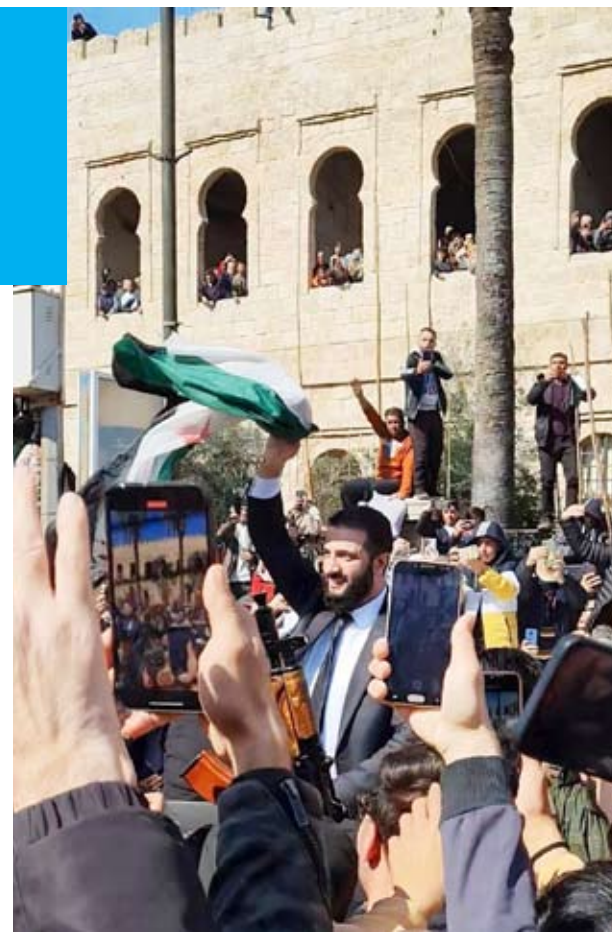
استقبال حاشد للشرع في اللاذقية

أشاد رئيس وزراء الاحتلال الإسرائيلي بنيامين نتنياهو أمس بالدعم الأمريكي الثابت والمستمر لقتل أبيب، قائلاً إن الرئيس دونالد ترامب "هو الصديق الأعظم لإسرائيل بتاريخ البيت الأبيض"، وذلك خلال مؤتمر صحفي مع وزير الخارجية الأميركي ماركو روبيو الذي يزور إسرائيل بأول زيارة له للمنطقة. وخلال المؤتمر الصحفي، قال نتنياهو إن إسرائيل والولايات المتحدة لديهما استراتيجيتان تتفقان في المبدأ الذي سيفتح فيها "أبواب الجحيم" إذا لم تطلق حركة المقاومة الإسلامية "حماس" سراح جميع المحتجزين.