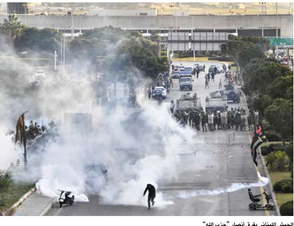
الجيش اللبناني يفرق انصار «حزب الله»

اختبر «حزب الله»، عهد الرئيس جوزيف عون، وحكومة الرئيس نواف سلام في مظاهرات بالشارع على خلفية منع طائرة إيرانية من الهبوط في مطار رفيق الحريري ببيروت، وانتهت بمواجهة مع الجيش أدت إلى وقوع إصابات. وتوافد متظاهرون إلى جسر الكوكودي عند طريق المطار القديمة، لتلبية دعوة «حزب الله» للاعتصام، وقال عضو المجلس السياسي في «حزب الله»، محمود قماطي، إن «منع الدولة هبوط الطائرة الإيرانية إهانة للبنان ويشكل خضوعاً للإملاء والتهديدات الأميركية». وحاول عدد من المتظاهرين الاقترب من مدخل حرم المطار. الأمر الذي أشعل المواجهات مع عناصر الجيش اللبناني الذين أطلقوا عدداً من القنابل المسيلة للدموغ على المتظاهرين بهدف تفريقهم. وأعاد الجيش فتح طريق المطار بالاتجاهين، بينما أعلنت اللجنة المنظمة للاعتصام أنتهاؤه بعد أن أوصل رسالته». وجاء الاعتصام الذي وصفه «حزب الله»، بعد ساعات على أزمة تمثلت في الاعتداء على قافلة لـ«اليونيفيل»، وسارعت السلطات اللبنانية إلى معالجتها عبر توقيف أكثر من 25 مشتبهاً بهم في الاعتداء وتأكيد الرئيس عون أن قوات الأمن «لن تتهاون مع أي جهة تحاول زعزعة الاستقرار والسلام الأهلي في البلاد».