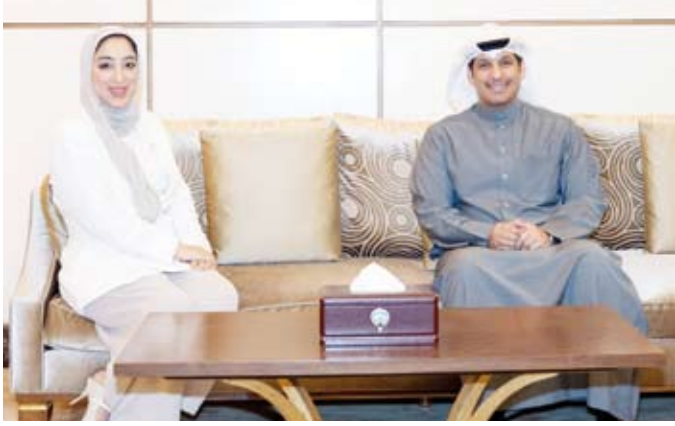
وزير الإعلام يستقبل وزير السياحة البحرينية

فبراير الجاري اجتماعاً (عن بعد) للجنة السياحة العامة ولجنة الاستراتيجية الخليجية للسياحة تحضيراً للاجتماع الوزاري التاسع للوزراء المسؤولين عن السياحة بدول التعاون. وتم خلال الاجتماع مناقشة المبادرات الخليجية الموحدة وعلى رأسها مبادرة الترويج السياحي المشترك بالإضافة إلى مبادرة التبادل الإحصائي والمعرفي ومشروع الإرشاد السياحي الموحد الذي يهدف إلى تعزيز التكامل السياحي بين دول المجلس وتفعيل التعاون الدولي مع الدول الشقيقة والصديقة واحتتم الاجتماع بعدد من التوصيات سيتم عرضها على الاجتماع الوزاري في الكويت اليوم.