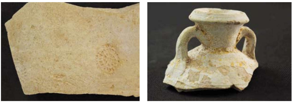
قطعة من 2000 سنة عليها دمغة لصانها