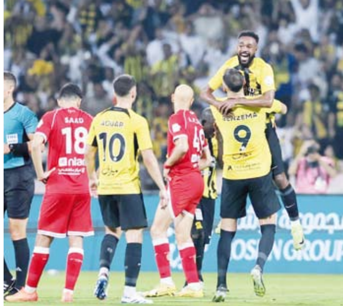
فوز كبير للاتحاد على الوحدة

عزز الاتحاد صدارته للدوري السعودي لكرة القدم بفوزه على الوحدة بأربعة أهداف لواحد، في المباراة التي جرت بينهما على استاد مدينة الملك عبد العزيز الرياضية، ضمن الجولة العشرين من المسابقة. وسجل أهداف الاتحاد مهند الشفيطي، والفردوسي كريم بنزيما، والهولندي ستيفن بيرجوين، والجزائري حسام عوار في الدقائق (35) و(45) و(60) و(90+5) على التوالي، فيما أحرز