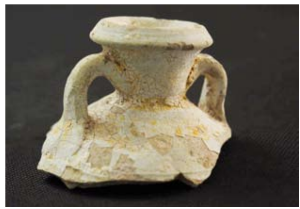
بقايا من جرار فخارية مكتشفة من موقع الفناء الهلنستي

أعلن المجلس الوطني للثقافة والفنون والآداب، أمس، عن اكتشاف فناء ومبنى غرب موقع القرينية في جزيرة فيلكا يعود إلى الفترة الهلنستية من 2300 سنة.