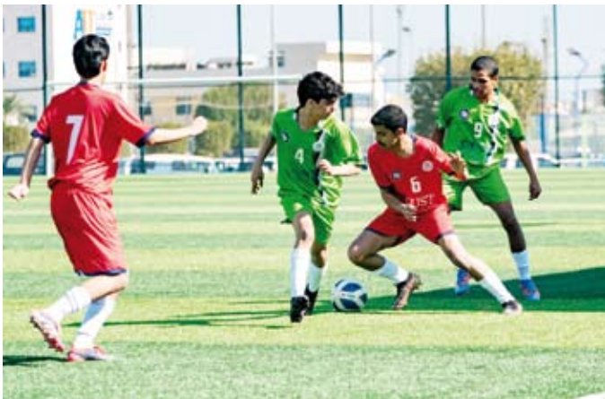
جانب من البطولة

المنظمة طبقت اللائحة على كافة المنتخبات المشاركة خاصة بند الالتزام بمشاركة اللاعبين المسجلين في كشوف الأندية الرياضية عدد 1+6 من ضمنهم حارس مرمي ويتواجد داخل الملعب 5 لاعبين فقط من ضمنهم حارس المرمي من أجل تحقيق الهدف من إقامة المباراة، وقال: نجاح البطولة يأتي من خلال التعاون المثمر بين الاتحاد المدرسي ووزارة التربية وتوجيه التربية البدنية بنين والدعم الكبير الذي يقدمه المهندس سيد جلال الطبطبائي وزير التربية والتعليم الذي سخر كافة إمكانيات الوزارة من أجل إنجاح البطولة والتي تأتي من ضمن برنامج التعاون المشترك بين الوزارة والاتحاد المدرسي في إقامة الفعاليات والبطولات الرياضية ومن ضمنها كأس التفوق العام لكرة القدم.