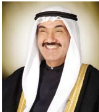
سمو الشيخ ناصر المحمد

والرعاية الصحية، والطيران، والمدارس والخدمات المصرفية، ويتضمن علامات تجارية عالية ومشهورة. واختتم بهيجاني بأنه لا يمكن أن ننسى الموقف التاريخي للمملكة المتحدة خلال الغزو العراقي الغاشم 1990 وموقف رئيسة الوزراء البريطانية الراحلة السيدة مارغريت تاتشر للكويت وامتزاج الدماء البريطانية بالدماء الكويتية على تراب الكويت 1991، لتبقى شاهدة على أن العلاقة بين البلدين الصديقين كانت وستبقى نموذجاً جيداً بين الدول.