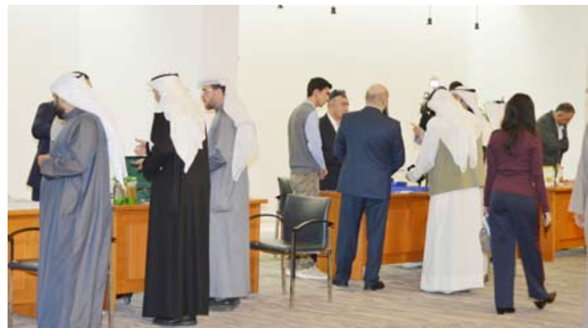
مشاركون في منتدى الأعمال الكويتي - الأوزبكي

أقامت غرفة تجارة وصناعة الكويت منتدى الأعمال الكويتي - الأوزبكي، حيث ترأس الوفد الأوزبكي وزير الاستثمار والصناعة والتجارة ليزين كودراتوف، وذلك بحضور رجال أعمال ومهتمين كويتيين. في بداية اللقاء، رحبت الغرفة بالضيوف الكرام، وأشارت إلى أن الكويت وأوزبكستان تتمتعان بشراكة قوية مبنية على الاحترام المتبادل والتجارة والاستثمار. وأوضحت أن الإصلاحات في أوزبكستان فتحت فرصاً مثيرة للمستثمرين الكويتيين في مختلف القطاعات، لقطاع الطاقة والموارد المتجددة يمثلان إمكانات كبيرة، كما أن الزراعة والأمن الغذائي توفران مجالات وأبعاداً أخرى. من جانبه، قال وزير الاستثمار والصناعة والتجارة الأوزبكي ليزين كودراتوف إن أوزبكستان حققت نمواً في الصادرات بنحو 20% خلال العام 2024، مشيراً إلى أن حجم الاستثمارات الأجنبية في أوزبكستان بلغ نحو 34.9 مليار دولار حتى عام 2024، لافتاً إلى أن من أهم الصناعات هي الأقمشة والصناعات الكيماوية والمواد الغذائية والزراعية.