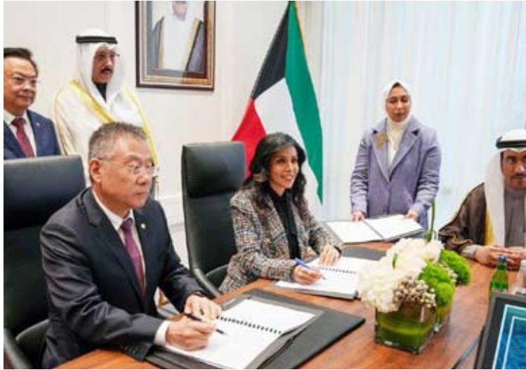
وزيرة الأشغال نوره المشعان ورئيس الوفد الصيني