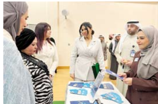
جانب من المعرض للمصاحب