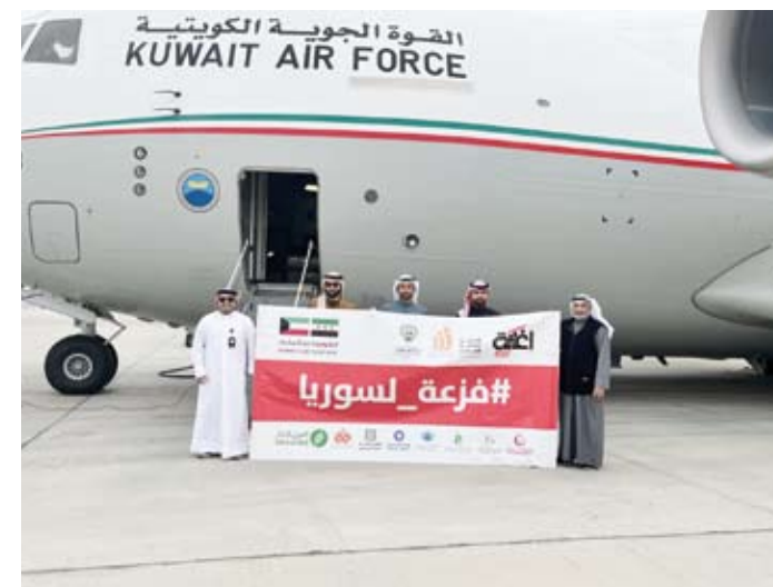
الجهات الرسمية المشاركة بالرحلة الـ 27 لإغاثة سورية

وأكد العون أن مساعي البلاد الخيرة تمكنت من إيصال 28 طائرة إغاثية محملة باطنان من مختلف المواد التي تم اختيارها من قبل منظمة الهلال الأحمر العربي السوري لتلبية للاهالي في المناطق بطانيات وقفازات وملابس الثقيلة ضمن حملة الجمعية تحت شعار (10 آلاف طن) لمجابهة فصل الشتاء. وأعرب عن شكره للجهات الداعمة للعمل الخيري الكويتي من بينها وزارات (الشؤون) والخارجية والدفاع ممثلة بالقوة الجوية ولإصحاب الأيادي الخيرة من المختبرين مؤكداً أنها تأتي ترجمة للتوجهات السامية الهادفة لمساعدة الدول الشقيقة والصديقة في احث الظروف.