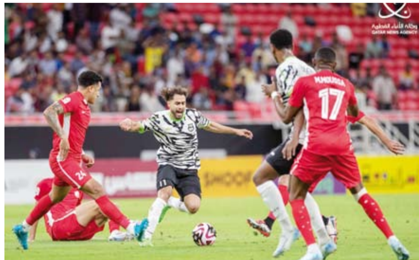
منافسات قوية يشهدها الدوري القطري

در اكسلر أفضل لاعب في شهر سبتمبر الماضي. وضمن ذات الجولة يلتقي السد الذي حقق الانتصارين على الصعيدين المحلي والقاري مع الشحانية، الذي يملك دوافع متشعبة كبيرة بعد الفوز على المنصهر. وفي مباراة أخرى يبحث الخور والريان عن تجاوز التعثرات وتصحيح المسار.