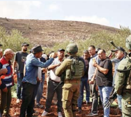
قوات صهيونية تمار الفلسطينيين بمغادرة الحقول

استشهدت فلسطينية برصاص القوات الإسرائيلية شمال شرقي جنين بالضفة الغربية. وأعلن «مستشفى ابن سينا»، عن «استشهاد» المواطنة الفلسطينية (60 عاماً)، متأثرة بإصابتها برصاص القوات الإسرائيلية في قرية فقوة، شمال شرقي جنين. وذكرت «وكالة الأنباء والمعلومات الفلسطينية (وفا)» أن المواطنة أصيبت برصاص الاحتلال في الصدر بينما كانت تقطف ثمار الزيتون مع عائلتها، في المنطقة القريبة من جدار الفصل والتوسع العنصري المقام على أراضي فقوة». ووفق «الوكالة»، يشهد موسم قطف ثمار الزيتون في الضفة الغربية هذا العام اعتداءات متكررة من قبل المستعمرين وقوات الاحتلال، كحرق أشجار الزيتون، وتقطيعها، وسرقة المحصول، ومنع المزارعين من الوصول إلى أراضيهم». وأشارت إلى أن «مستعمرين أطلقوا النار على مشاركين في فعالية نظمها (مينة مقاومة الجدار والاستيطان) بساعدة مزارعي قرية كفر اللبد شرق طولكرم، في قطف ثمار الزيتون باراضيهم».