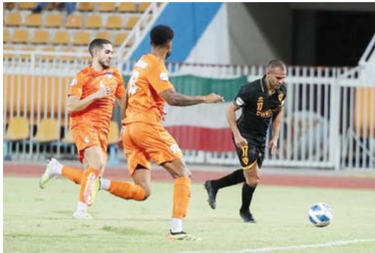
القادسية لمواصلة حصد النقاط أمام النصر