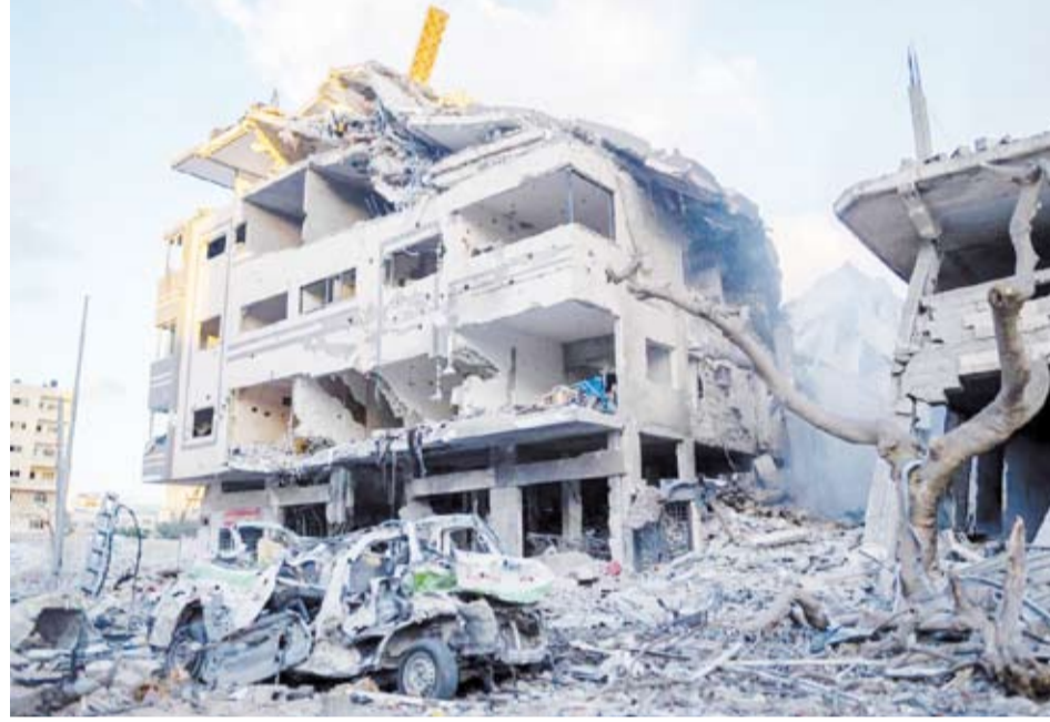
جيش الاحتلال يدمر المنازل في مخيم المغازي

أعلنت هيئة البث الإسرائيلية، أمس، اغتيال زعيم حركة حماس، يحيى السنوار، في غزة. ونشر الجيش الإسرائيلي صوراً للعملية التي استهدفت السنوار في منطقة تل السلطان في رفح. وقالت إذاعة الجيش الإسرائيلي: إن وحدة المظليين وكتيبة 450 ووحدة كفير الخاصة شاركت بقتل السنوار. وأشارت صحيفة «يديعوت أحر ونوت» إلى مقتل القياديين في حماس محمود حمدان وهاني حميدان مع السنوار. وقالت القناة 12 الإسرائيلية إن عملية قتل السنوار لم تكن مخططة لها مسبقاً. وقال جيش الاحتلال الإسرائيلي: إن رئيس الأركان هرتسي هاليفي والفريق الأمني يقيمون الموقف الحالي، فيما قالت القناة 12 الإسرائيلية إن السنوار كان يرتدي سترة عليها قنابل يدوية، وقالت هيئة البث الإسرائيلية إن الوزراء تلقوا تحديداً تفصيلياً عن مقتل السنوار.