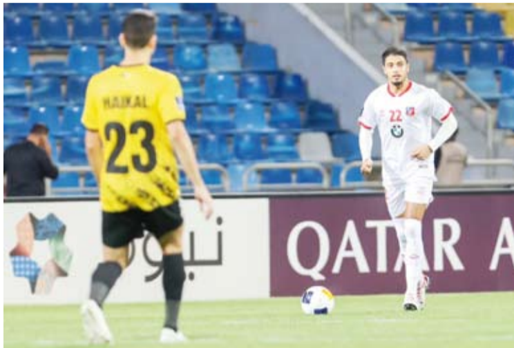
الكويت متحفز للحفاظ على مشواره خالياً من الهزائم