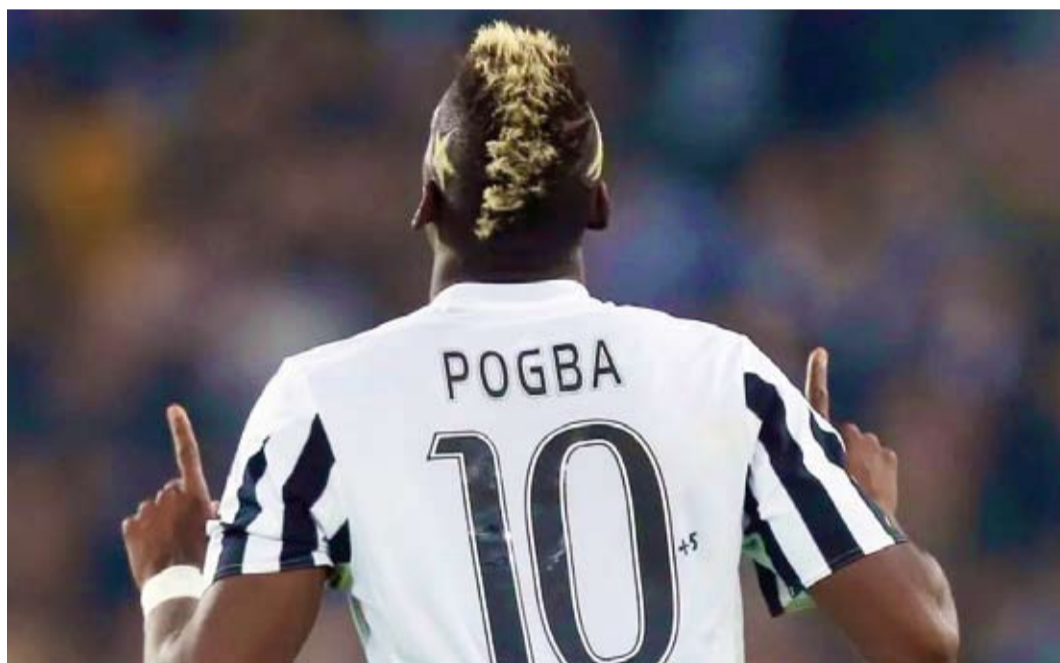
الفرنسي بول بوغبا

أعرب لاعب الوسط الفرنسي بول بوغبا، الذي تم تخفيض إيقافه بسبب المنشطات من أربع سنوات إلى 18 شهراً ويستطيع العودة لممارسة كرة القدم في مارس 2025، عن رغبته في استئناف مسيرته في صفوف يوفنتوس الإيطالي حتى لو كان ذلك يعني التخلي عن المال وذلك خلال مقابلة مع صحيفة "غازيتا ديلو سبورت" الإيطالية.