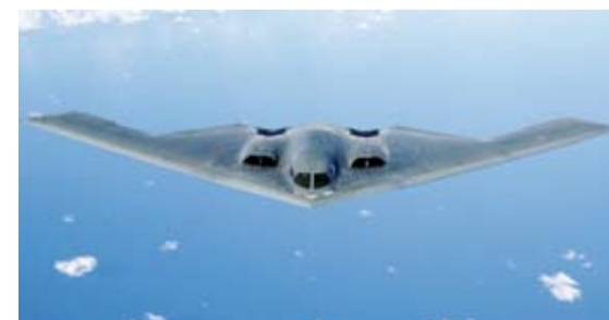
القاذفة الاستراتيجية الخفية «بي-2»

أعلنت وزارة الدفاع الأميركية (البنتاغون) أن الولايات المتحدة شنت غارات جوية بواسطة قاذفات استراتيجيّة خفية من طراز «بي-2» على منشآت لتخزين السلاح في مناطق يمنية تسيطر عليها جماعة الحوثي المدعومة من إيران. وقال وزير الدفاع الأميركي لويد أوستن في بيان إن «القوات الأميركية استهدفت عدداً من المنشآت تحت أرضية التابعة للحوثيين والتي تضمّ مكونات أسلحة مختلفة من نفس الأنواع التي استخدمها الحوثيون لاستهداف سفن مدنية وعسكرية في سائر المنطقة»، وأوضح البنتاغون «مقدّنا ضربات ضد 5 مواقع تخزين أسلحة بمناطق خاضعة لسيطرة الحوثيين باليمن»، وأن «التقييمات جارية ولا تشير لسقوط خسائر بين المدنيين»، وكانت قناة «إيه.بي.سي. نيوز» نقلت عن مسؤولين أميركيين القول إن الجيش الأميركي قصف منشآت تخزين أسلحة تابعة للحوثيين في اليمن. ونقلت عن مسؤول دفاعي أميركي أن «قوات القيادة المركزية الأميركية نفذت عدة ضربات جوية على العديد من منشآت تخزين الأسلحة التابعة للحوثيين المدعومين من إيران داخل المناطق التي يسيطر عليها الحوثيون في اليمن». وكانت وسائل إعلام تابعة للحوثيين باليمن قالت، إن ضربات جوية أميركية بريطانية استهدفت مدينتي صنعاء وصعدة.