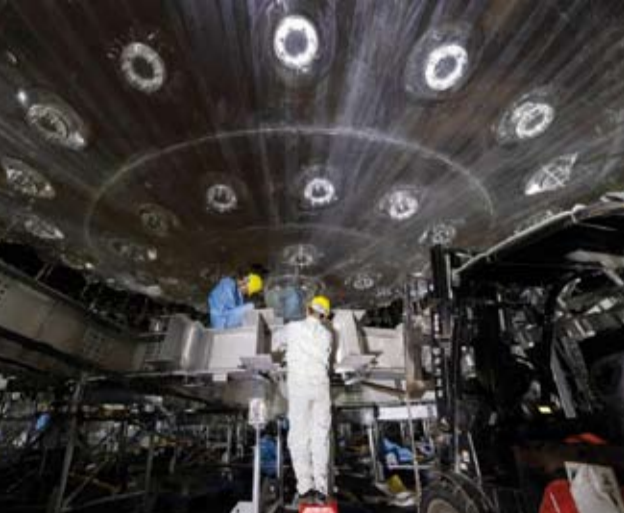
أعضاء فريق في مرصد جيانغمن للنيوتريونات

الأخرى المتنوعة. علاوة على ذلك فهي أضعف من أن تهدد وجود الدولة والحكومة الروسيين. وقوات موسكو تعلم أنها في النهاية ستستعيد الأرض التي تم غزوها، وأوكرانيا لا تمتلك القوة الكافية لصد الهجمات المضادة الروسية للأبد، وستضطر في النهاية للانسحاب أو البحث عن تسوية سياسية. ولأن الروس قادرين على استرداد أراضيهم بالوسائل التقليدية، فلا حاجة لاستخدام الوسائل النووية.