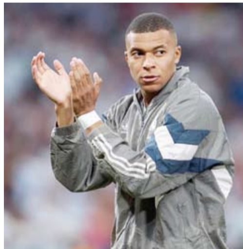
الفرنسي كيليان مبابي

أعلن نادي ريال مدريد الإسباني تتويج الفرنسي كيليان مبابي مهاجم الملكة بجائزة أفضل لاعب في شهر سبتمبر داخل صفوف الملكة في ظل تألقه خلال المباريات الأخيرة بكل المسابقات. ونشرت الصفحة الرسمية لنادي ريال مدريد صورة مبابي على موقع التواصل الاجتماعي "إكس"، معلنة تتويجه بجائزة أفضل لاعب بالفريق عن شهر سبتمبر.