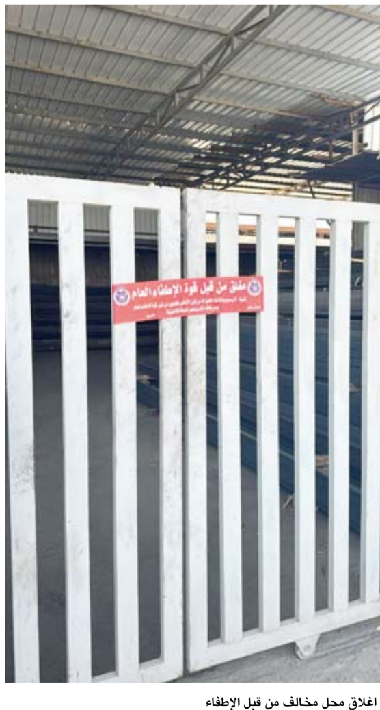
إغلاق محل مخالف من قبل الإطفاء