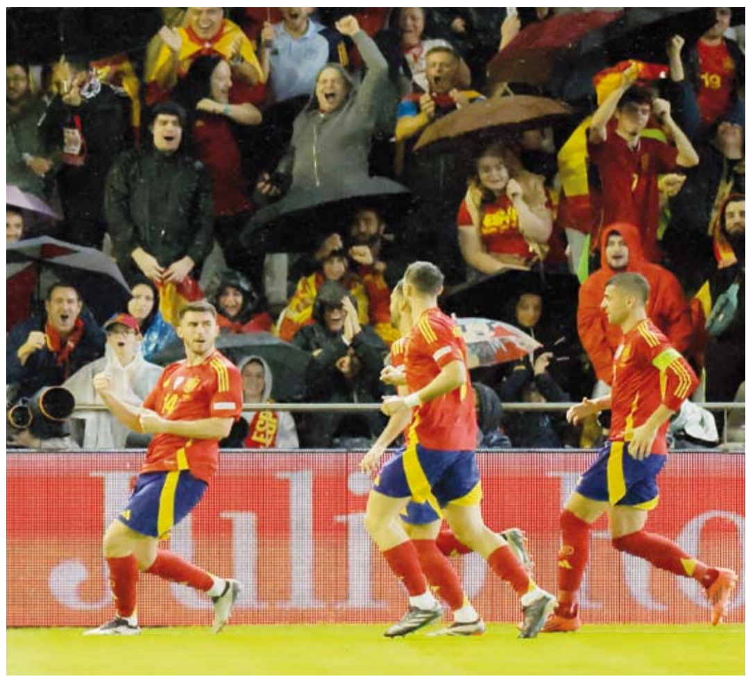
الإسباني إيميريك لابورت يقدم مستويات قوية مع الماتادور

نادي مانشستر سيتي الإنجليزي في صيف 2023، مقابل نحو 23.5 مليون جنيه إسترليني، وفق تقارير إعلامية، بعدما قضى 5 مواسم ونصف في النادي الإنجليزي حقق خلالها الدوري الإنجليزي الممتاز خمس مرات ودوري أبطال أوروبا 2023 وبطولات أخرى.