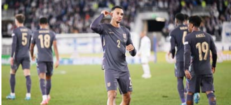
الإنجليزي ألكسندر أرنولد

كشفت تقارير صحفية أن الإنجليزي ألكسندر أرنولد ظهر ليفربول الإنجليزي أبلغ إدارة نادي ريال مدريد الإسباني بالموافقة على الانتقال لصفوف الملكة خلال فترة الانتقالات الصيفية 2025.