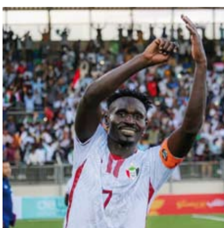
لاعبو السودان تحدوا الظروف وقدموا مستويات مميزة

عندما اندلعت شرارة الاقتتال الأول بين الجيش السوداني وقوات الدعم السريع في محيط المدينة الرياضية بالعاصمة الخرطوم منتصف أبريل 2023، اكتنف الغموض مصير كرة القدم في البلاد، بعدما أدت الحرب إلى إيقاف النشاط الرياضي، ما زاد المخاوف بشأن مستقبل "صفوف الجديان" الذي كان مقبلا على المشاركة في تصفيات كأس العالم 2026 وكأس إفريقيا 2025. وأعلن بعدها الاتحاد السوداني لكرة القدم تكفل السعودية باستضافة كافة المنتخبات السودانية في معسكرات مفتوحة مع البرامج الإعدادية والمباريات. وقهر منتخب السودان معاناة الحرب وانقلاب نتائجها وأسا على عقب، بعدما كان يعيش في