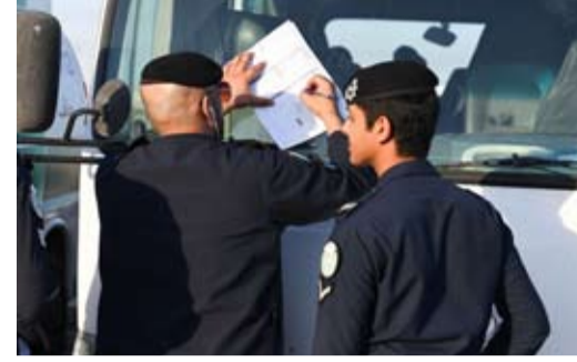
تسجيل مخالفة مرورية