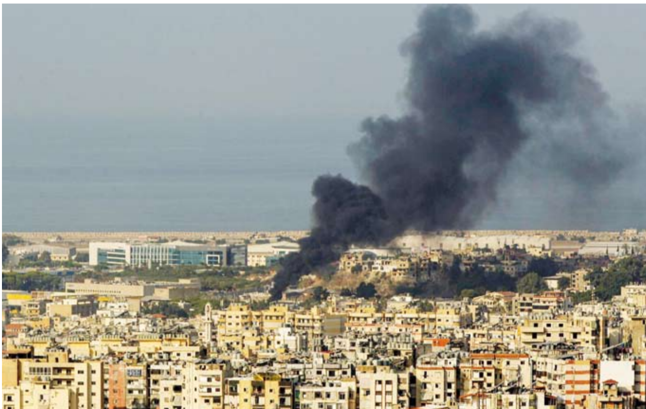
تصاعد دخان أسود فوق الضاحية الجنوبية لبيروت

أعلن «حزب الله»، في سلسلة بيانات، أنه استهدف تجمعا لجنود الجيش الإسرائيلي بمنطقة السدانة في مزارع شبعا اللبنانية. كما استهدف بعيد منتصف دبابية ميركافا في مرتفع اللبونة، ما أدى إلى احتراقها ووقوع طاقمها بين قتل وجريح، كما استهدفوا دبابية ميركافا ثانية فجراً في مرتفع اللبونة، ما أدى إلى احتراقها ووقوع طاقمها بين قتل وجريح.