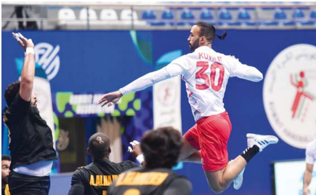
لاعب الكويت في طريقة لإحراز هدف في شبك القادسية

اختتمت منافسات الأسبوع الثاني من الدور التمهيدي لجولة الدوري الكويتي العام لكرة اليد موسم (2024 - 2025) بإقامة مواجهتين شهدتا فوز (كاظمة) و (الكويت). في المواجهة الأولى حقق (كاظمة) انتصارا كبيرا على نظيره (التضامن) بنتيجة (37 - 14) في مباراة شهدت سيطرته على مجرياتها منذ انطلاقتها إذ حسم شوطها الأول بفارق كبير (16 - 8) ليحقق بذلك فوزه الثاني على التوالي هذا الموسم. وفي المباراة الثانية حسم (الكويت) قمة مواجهات الأسبوع