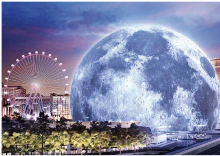
مجسم الكرة الأرضية في لاس فيغاس

من المقرر بناء ثاني مجسم ضخم للكرة الأرضية في العاصمة الإماراتية أبو ظبي، بعد افتتاح الأول في مدينة لاس فيغاس الأمريكية. وأعلنت دائرة الثقافة والسياحة في أبوظبي وشركة "سفير إنترتينمنت"، أمس