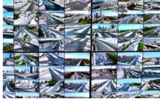
متابعة حركة السير بالطرق الرئيسية في البلاد

بتهمة مخدرات و21 انتهاء إقامة و32 بدون إثبات و16 بتهمة التغييب و39 مطلوباً بأوامر إنفاذ قبض و5 بحالة غير طبيعية و1 تنفيذ جنائي و7 أحداث و1 مواد مسكرة كما تم حجز 5 مركبات ودراجات وضبط 12 مركبة مطلوبة وتمت إحالتهم إلى جهة الاختصاص لاتخاذ الإجراءات القانونية اللازمة. وأكدت الوزارة أن هذه الحملات تأتي في إطار استمرار القطاعات الميدانية في ضبط المخالفين والخارجين على القانون ومخالفي قانون الإقامة لتحقيق الانضباط العام وحفظ الأمن والنظام والتصدي للجريمة والوقاية منها ومكافحة الظواهر السلبية.