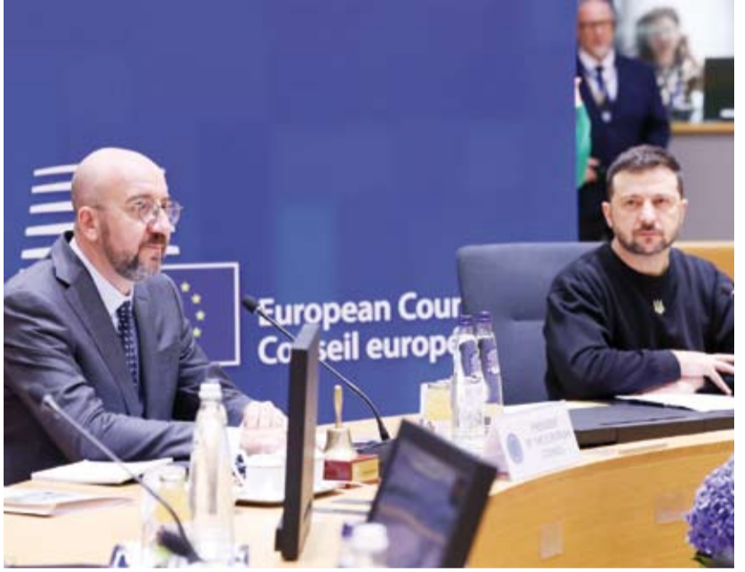
زيلينسكي في قمة المجلس الأوروبي ببروكسل

كشف الرئيس الأوكراني فلاديمير زيلينسكي، أمس، عن «خطة النصر» في قمة المجلس الأوروبي ببروكسل أمام القادة الأوروبيين وتتضمن الحل عبر الطرق الدبلوماسية. وتتضمن الخطة خمسة محاور تشمل تلقي أوكرانيا دعوة للانضمام إلى حلف شمال الأطلسي (ناتو) كطرف دفاعي بالإضافة إلى ما أسماه زيلينسكي «بالردع غير