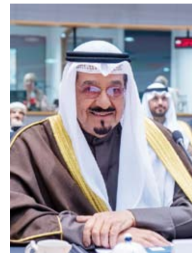
سمو الشيخ أحمد عبدالله الفلي كلمة الكويت في القمة

الخليجي - الأوروبي، مضيفاً أنه يتطلع إلى القمة المقبلة التي ستستضيفها المملكة العربية السعودية الشقيقة في عام 2026 والتي من المنتظر أن تكون بمثابة تنويع لجهود مستمرة لتعزيز الشراكة بين الطرفين، وأكد الجانبان أن دول مجلس التعاون والاتحاد الأوروبي سيواصلان سعيهما الحثيث للتوصل إلى اتفاقية تجارة حرة إقليمية شاملة تشمل تعزيز الاستثمارات بين الجانبين مضيفاً أن هذه الاتفاقية تمثل فرصة قيمة لتعزيز مصالح الجانبين وتسهم بلا شك في دفع عجلة النمو الاقتصادي.