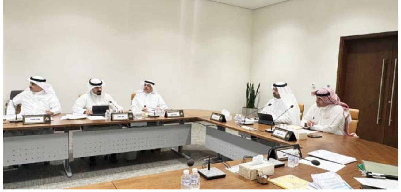
جانب من اجتماع لجنة الاعتراضات والشكاوى

بخصوص عدم إزالة العوائق بموقع قطعة I المخصص لحطة التحويل الثانوية بمنطقة العديلية وفقاً لطلب وزارة الكهرباء والماء والطاقة المتجددة بالإضافة إلى حفظ الشكاوى المقدمة من قبل أحد المواطنين ضد بلدية الكويت.