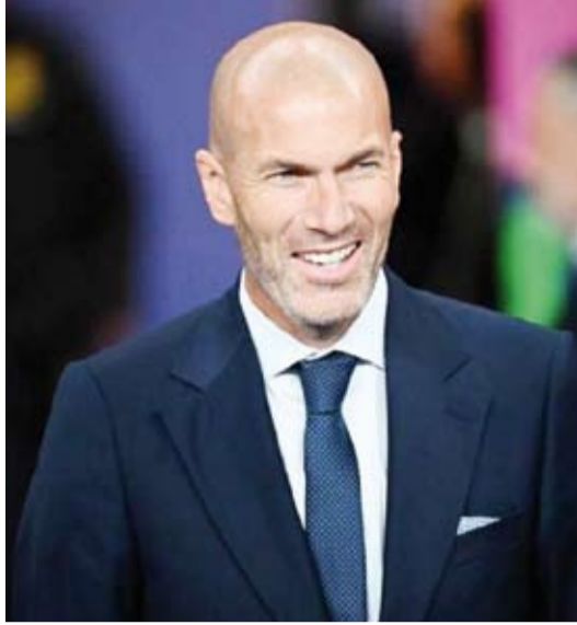
الفرنسي زين الدين زيدان

كشفت تقارير صحفية أن إدارة نادي مانشستر يونايتد الإنجليزي توصلت لاتفاق مع الفرنسي زين الدين زيدان المدير الفني لريال مدريد السابق لتولي قيادة الفريق خلفاً للهولندي إريك تين هاج، المدير الفني لفريق مانشستر يونايتد الإنجليزي بسبب تراجع نتائج الفريق. ويقدم مانشستر يونايتد خلال الموسم الحالي أسوأ بداية في الدوري الإنجليزي منذ موسم 1989 - 1990، بعد جمعه 8 نقاط فقط بعد 7 جولات، ليحتل المركز الرابع عشر.