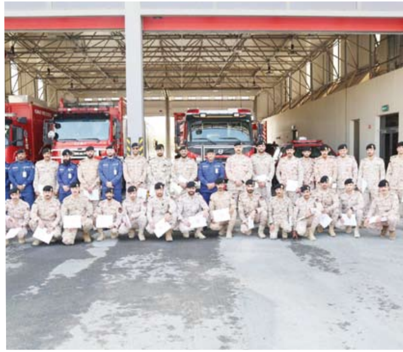
قوة الإطفاء العام بعد انتهاء الدورة

بأفضل الطرق الاحترافية للتعامل الأولي مع هذه المواد وأخطارها من جهة أخرى نفذت قوة الإطفاء العام صباح أمس الخميس غلق إداري لعدد (44) محل و مناشأة في عدد من المحافظات وذلك لعدم حصولهم على تراخيص إطفاء ولم يلتزموا باستيفاء اشتراطات السلامة والوقاية من الحريق بعد أن تم إنذارهم لتلافي المخالفات في وقت سابق