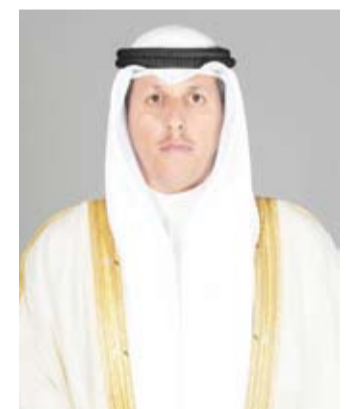
د. محمد الوسمي

أشاد وزير العدل ووزير الأوقاف والشؤون الإسلامية رئيس اللجنة الوطنية الدائمة لمكافحة الاتجار بالأشخاص وتهريب المهاجرين الدكتور محمد الوسمي بالإجراءات التي اتخذها بنك الكويت المركزي بالتعاون مع وزارة العدل في توفير خدمات لتسهيل فتح حسابات لذوي الدخل المحدود والضعيف، وأشار الوزير في بيان صحفي صادر عن ديوان الخدمة المدنية، أن هذه الخطوة تأتي في إطار استراتيجيتها لمكافحة الاتجار بالأشخاص، وأضاف أن هذا الإجراء يساهم على ضمان حقوق تلك الفئات وحماية أرباب العمل وفقاً للقوانين السارية المتعلقة بالعمل في القطاع الأهلي والعمالة المنزلية.