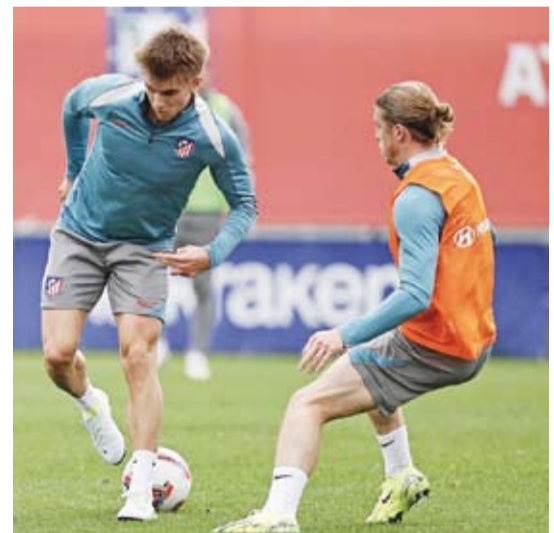
جانب من تدريبات أتلتيكو مدريد

قال نادي أتلتيكو مدريد المنافس في دوري الدرجة الأولى الإسباني لكرة القدم إنه لن يبيع تذاكر مبارياته الخمس المقبلة خارج ملعبه لحاملي التذاكر الموسمية بعدما فرض عليه الاتحاد الأوروبي (يويفا) والاتحاد الإسباني للعبة عقوبات. وفي الأسبوع الماضي، تم تغريم أتلتيكو 30 ألف يورو مع إيقاف تنفيذ بيع تذاكر لجماعته خارج ملعبه لمباراة واحدة في البطولات الأوروبية بعدما أظهر مشجعوه تصرفات "عنصرية أو تمييزية" خلال خسارة الفريق 4-صفر أمام بنفيكا البرتغالي في دوري أبطال أوروبا.