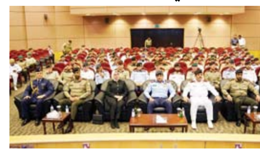
سفيرة تركيا طوبى نور سونمز خلال مشاركتها في لإلقاء محاضرة

أشادت سفيرة تركيا طوبى نور سونمز، أمس، بالعلاقة المتميزة التي تربط بين بلادها والكويت، جاء ذلك وفق بيان صحفي لوزارة الدفاع أثناء محاضرة ألقاها السفيرة سونمز للدارسين في دورة القيادة والأركان المشتركة رقم (29) بعنوان (الدراسات الإقليمية... تركيا في الشرق الأوسط). وذكرت الوزارة أن هذه المحاضرة تأتي ضمن منهج المحاضرات التي تقيمها كلية مبارك العبدالله للقيادة والأركان المشتركة للدورات المنعقدة لديها من خلال استضافة محاضرين من مختلف التخصصات الأكاديمية المدنية والعسكرية من داخل الكويت وخارجها لتطوير القدرات ومهارات التحليل والتخطيط وفهم البيئة الاستراتيجية للدارسين فيها، ولغقت إلى أن مثل هذه المحاضرات والزيارات تهدف إلى إثراء المحتوى الأكاديمي وزيادة المحصلة العلمية، وأشارت إلى أنه كان في استقبال السفيرة سونمز أمر كلية مبارك العبدالله للقيادة والأركان اللواء الركن طيار فهد الخريج.