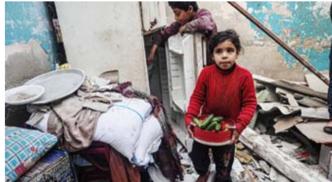
حصار شديد على غزة

وأرشد مبينا 12 شاحنة دقيق لا تغير شيئاً في الواقع الصعب، حيث يتقادم الحصار وحالة المجاعة، فالفلسطينيون هناك بحاجة ماسة إلى مواد غذائية متنوعة ووقود وغاز الطهي. وأضاف أن الدقيق يتلف في بيوت الفلسطينيين، بسبب نقص وسائل إعداده، من ماء صالح وغياب الوقود اللازم لإيقاد النار. وتتكون محافظة شمال غزة من 3 بلدات رئيسية هي بيت لاهيا وبيت حانون وجباليا، ويعمل الجيش الإسرائيلي على تهجير الفلسطينيين منها إلى محافظة غزة ومنها إلى منطقة «الموصي» الممتدة غرب محافظات الوسطى وخبان يونس ورفح. وفي حال تمكن أي من الفلسطينيين