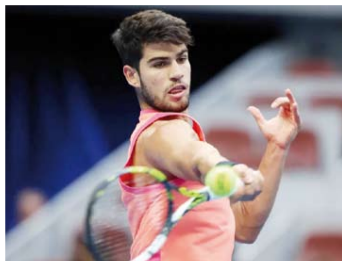
الإسباني كارلوس ألكاراز

العمر 28 عاماً في ربع نهائي بطولة ويمبلدون.