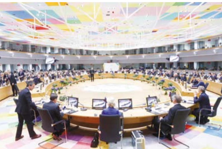
جانب من أعمال القمة الخليجية- الأوروبية