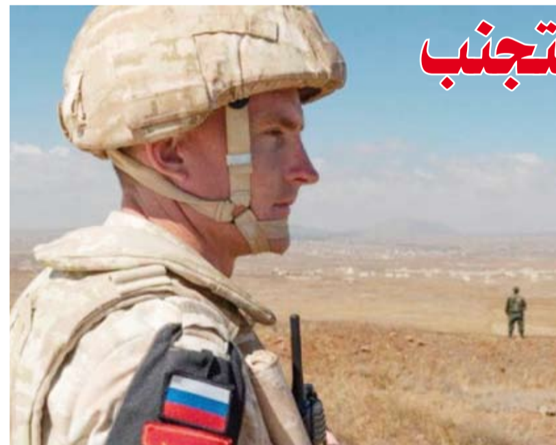
أحد أفراد الشرطة العسكرية الروسية

ومع تزايد احتمالات توسع الحرب التي تشنها إسرائيل ضد «حزب الله» في لبنان