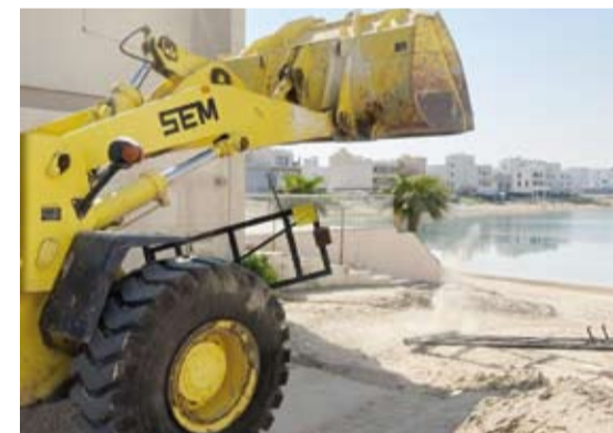
اليات البلدية تزيل مخالفات