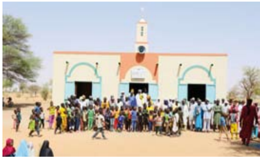
افتتاح أحد المساجد في إفريقيا