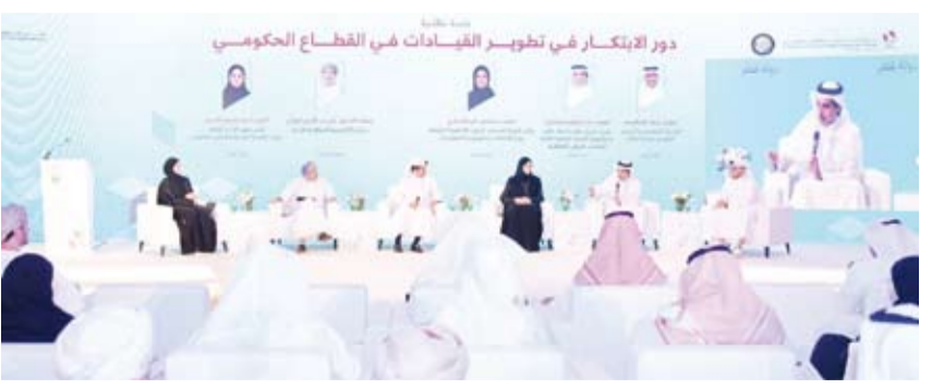
جانب من الملتقى