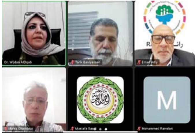
جانب من المشاركين في احتفالية جمعية البيئة باليوم الدولي للحد من مخاطر الكوارث

إلى أهمية وضع الأولويات وتحسين المفاهيم في المنصات تجاه الدمار البيئي الشامل بفلسطين المحتلة الذي أسمته بالإبادة البيئية، فيما تناول الدكتور ببالعلاجي رئيس الجمعية الأردنية للإسعاف أثار الحرب الصهيونية تجاه فلسطين على نزوح مئات الآلاف تجاه الأردن وما يمثله ذلك من ضغط على البنى التحتية والصحة العامة ومتطلباتهم علاوة على الصعوبات التي يواجهونها خلال تنقلاتهم الإغاثية. وأوضحت العقاب أن الدكتور فوزي الخواري رئيس الجمعية الكويتية للأزمات والطوارئ تناول الأدوار الميدانية والتوعوية للجمعية فضلاً عن استعراض مبادراتها الوطنية لبناء القدرة على الحد من مخاطر الكوارث والطوارئ «زاهب» وأهميتها وبنائها والأهداف المنشودة لها.