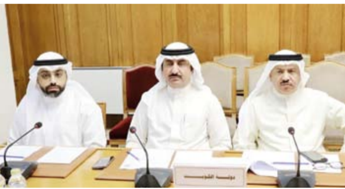
سعد العازمي خلال ترؤسه وفد الكويت

وضم الوفد الكويتي المشارك في الاجتماع إلى جانب العازمي والسريع مراقب مكتب وكيل وزارة الإعلام سعد العدواني بالإضافة إلى الأمين العام للملتقى الإعلام العربي ماضي الخميس.