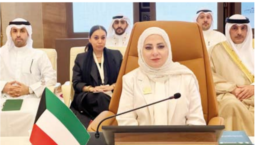
م. سميرة الكندري

أكدت مدير عام الهيئة العامة للبيئة بالوكالة المهندسة سميرة الكندري، أمس، أهمية التعاون المشترك بين الدول العربية وتوحيد الجهود خاصة فيما يتعلق بالاتفاقيات الدولية التي تعنى بالبيئة.