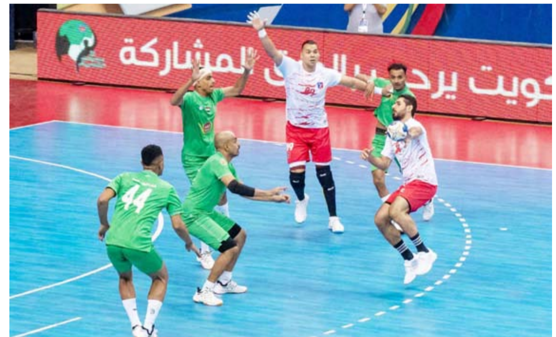
جانبا من اللقاء

افتتح نادي السالمية الكويتي مشواره اليوم الاثنين بفوز صعب ومثير على نظيره الأهلي القطري بنتيجة 28/29 في ثاني مواجهات اليوم الأول من منافسات البطولة العربية لكرة اليد للأندية أبطال الدوري والكأس الـ39 التي انطلقت في وقت سابق اليوم بالكويت وتستمر حتى 26 سبتمبر الجاري. وأنهى (السالمية) الشوط الأول متفوقا على (الأهلي) بنتيجة 11 / 15 وواصل تفوقه بالشوط الثاني بصعوبة بالغة لتنتهي المباراة لصالح بنتيجة 28/29 بفارق هدف واحد فقط.