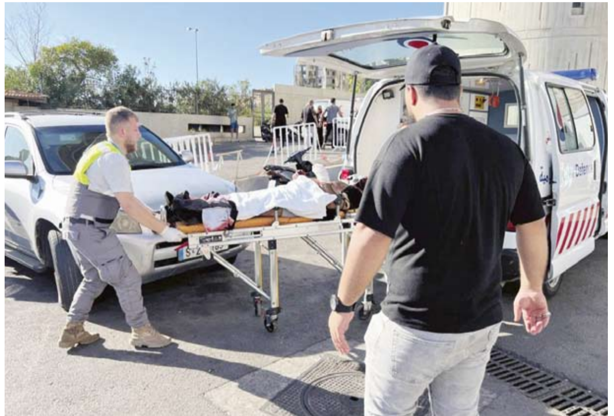
اعداد كبيرة من المصابين توافدت إلى المستشفيات اللبنانية

خبر العثور على آثار قديمة تحت سوق المباركية، آثار العديد من علامات الاستفهام، خاصة بعد حالة التخبط التي أصابت الأجهزة الحكومية بين النفي والتأكيد، ورغم أن هذا الخبر قد يات بقراءة أركيولوجية جديدة لتاريخ الكويت، إلا أنه لم يحظ باهتمام إعلامي لأسباب غير معروفة. ذلك التخبط في التصريحات يشير إلى أزمة قد تذهب ضحيتها تلك الآثار ما لم يكن هناك موقف رسمي مسؤول، وفي هذا الصدد يتناول الدكتور اسماعيل الشطي