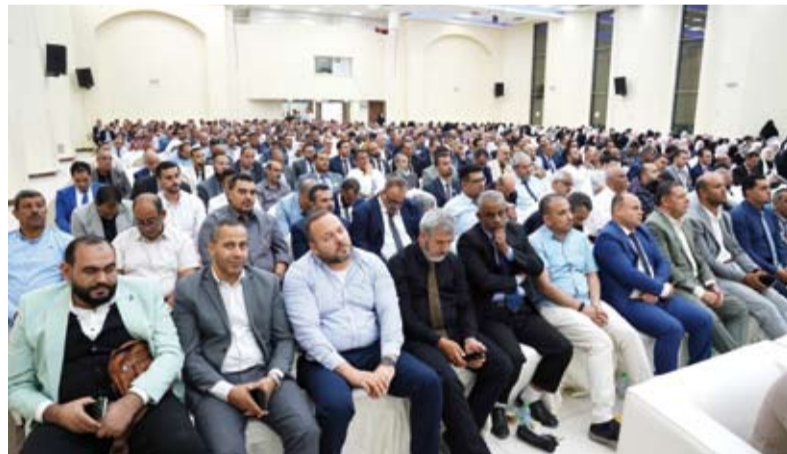
جانب من حضور المعلمين