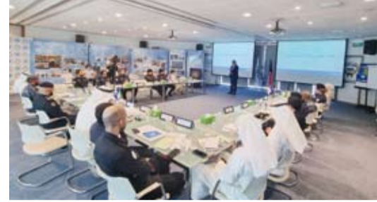
جانب من الحلقة النقاشية

اختتمت أمس، الحلقة النقاشية التي نظمتها المفوضية السامية للأمم المتحدة لشؤون اللاجئين والمنظمة الدولية للهجرة وامتدت لثلاثة أيام في بيت الأمم المتحدة في الكويت والتي ركزت على آليات حماية المهاجرين والأشخاص المشمولين بالحماية الدولية.