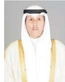
د. محمد الموسمي

وأكد وزير العدل ووزير الأوقاف والشؤون الإسلامية، الدكتور محمد الموسمي، أن صدور الرسوم بقانون رقم 2024/93 يؤكد حرص البلاد على موازنة التشريعات الوطنية مع الالتزامات الدولية الناشئة بموجب الاتفاقيات التي انضمت إليها بمجال حقوق الإنسان ولا سيما اتفاقية مناهضة التعذيب وغيره من ضروب المعاملة أو العقوبة القاسية أو اللاإنسانية أو المهينة. ويهدف إلى تعزيز حقوق الإنسان وحرياته الأساسية وكرامته والتي كفلها دستور دولة الكويت، مبيّناً أن هذا التعديل التشريعي ينتج بالتعاون المتكرر بين وزارتي العدل والخارجية.