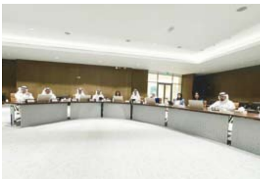
جانب من اجتماع قنية البلدي

اجتماع الخامس للجنة الفنية من دور الانعقاد الثالث للفصل التشريعي الثالث عشر للمجلس البلدي كما إعادة اللجنة الكتاب المقدم من اتحاد المكاتب الهندسية والدور الاستشارية الهندسية والدور الاستشارية الكويتية على التعديل المقترح على لائحة تنظيم أعمال البناء وعلى الجداول الملحقة به والصادر بشأنها القرار الوزاري رقم 2009/206 وتعديلاته للجهاز التنفيذي للتنسيق مع اتحاد المكاتب الهندسية والدور الاستشارية الكويتية وتحديد الرد