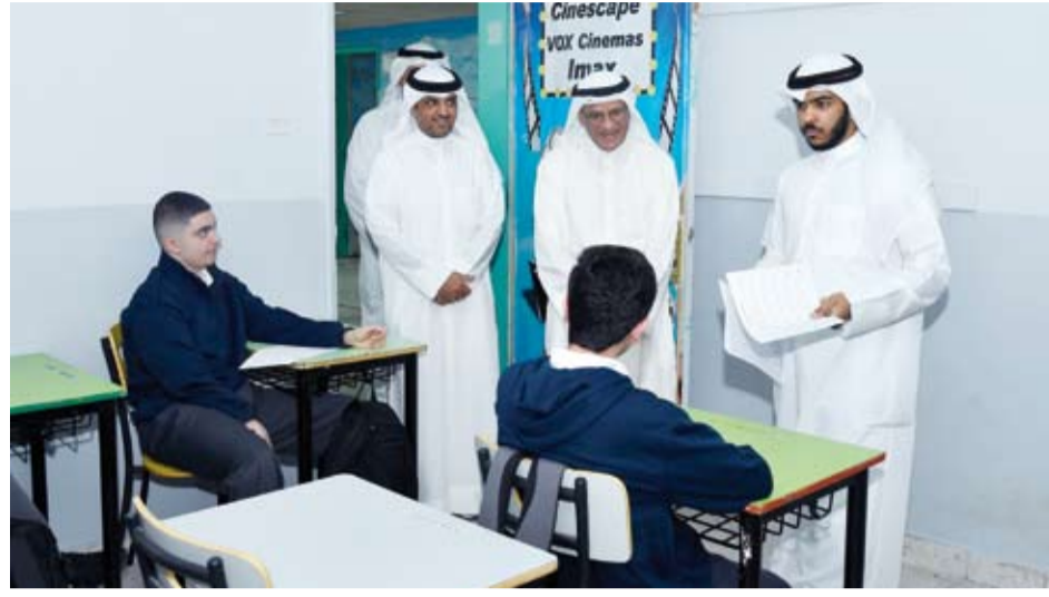
د. نادر الجلال أثناء تفقده سير العملية التعليمية

قام وزير التعليم العالي والبحث العلمي ووزير التربية بالوكالة، الدكتور نادر الجلال، بجولة تفقدية شملت عدداً من مدارس التعليم العام لمتابعة انطلاق العام الدراسي الجديد والوقوف على سير العملية التعليمية حرصاً على متابعة تنفيذ السياسات التعليمية على أرض الواقع والتأكد من جاهزية المرافق التعليمية والوصول الدراسية. وهذا الوزير الجلال بحسب بيان صادر عن وزارة التربية، أمس، أثناء الطلاب والطالبات بمناسبة العودة إلى مقاعد الدراسة قائلاً: إن بداية العام الدراسي فرصة جديدة للإنجاز والتفوق تتجدد فيها الأمال والطموحات وتزرع فيها بذور العلم والمعرفة التي ستثمر مستقبلاً واعداً لأبنائنا المتعلمين في جميع المراحل الدراسية.