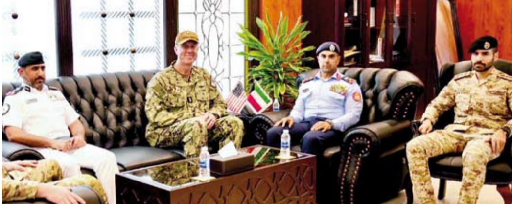
اللواء الركن طيار صباح جابر الأحمد الصباح مستقبلاً الفريق بحري جورج وايفوف والوفد المرافق

استقبل نائب رئيس الأركان العامة للجيش اللواء الركن طيار صباح جابر الأحمد الصباح، بمكتبه، مساء أمس، قائد القوات البحرية في القيادة المركزية الأمريكية قائد الأسطول الخامس الفريق بحري جورج وايفوف والوفد المرافق له، وذلك بمناسبة زيارته للبلاد. كما استقبل في وقت لاحق رئيس البعثة العسكرية البريطانية العميد الركن جافين تومسون، حيث تم خلال اللقاء تبادل الأحاديث الودية ومناقشة أهم المواضيع ذات الاهتمام المشترك، لا سيما المتعلقة بالجوانب العسكرية. وحضر اللقاء مدير عام الإدارة العامة لخفر السواحل العميد الركن بحري مبارك علي الصباح.