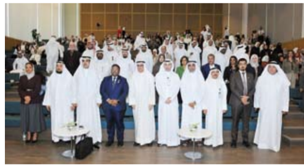
جانب من حفل الاستقبال السنوي للعام الجامعي الجديد