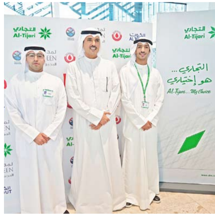
مشاركة البنك في حملة التبرع بالدم

يحرص البنك التجاري دوماً على رعاية الفعاليات المجتمعية والإنسانية التي تخدم أفراد المجتمع الكويتي، ومن هذا المنطلق، قام البنك برعاية حملة التبرع بالدم التي نظمتها محافظة الأحمدية في مجمع الكوت مول، تحت شعار «قطرة من دمك... حياة لغيرك» بالتعاون مع بنك الدم المركزي، برعاية وحضور محافظ الأحمدية معالي الشيخ حمود جابر الأحمد الصباح. وقد جاءت رعاية البنك لهذه الحملة في إطار تعاونه ورعايته للعديد من الأنشطة والفعاليات المجتمعية، التي تنظمها محافظات الكويت، ومنها محافظة الأحمدية، وانطلاقاً من إيمانه بأهمية دعم ورعاية الفعاليات الصحية والتوعوية التي تنظمها مؤسسات المجتمع المدني، وتجسيدها للمسؤولية المجتمعية في دعم الأنشطة الصحية والتوعوية وغيرها من الفعاليات المجتمعية. وبهذه المناسبة، أشاد محافظ الأحمدية معالي الشيخ حمود جابر