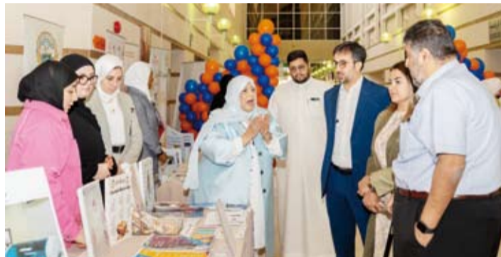
جولة في أروقة المعرض