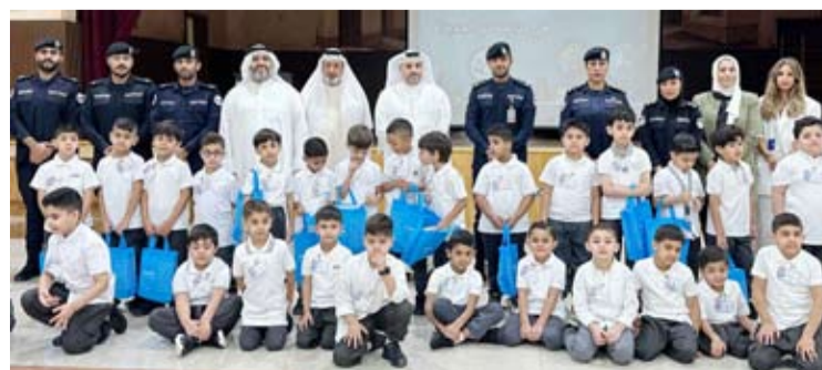
فريق زين يتوسط مسؤولي الداخلية

للقطاع الخاص بدعم مؤسسات الدولة في كل ما يحقق النمو الاجتماعي المستدام في مختلف القطاعات الحيوية، ويعكس ذلك في الشراكات العديدة التي أقامتها الشركة مع مؤسسات القطاع العام على مر السنوات السابقة، والتي أثمرت بالعديد من الجهود