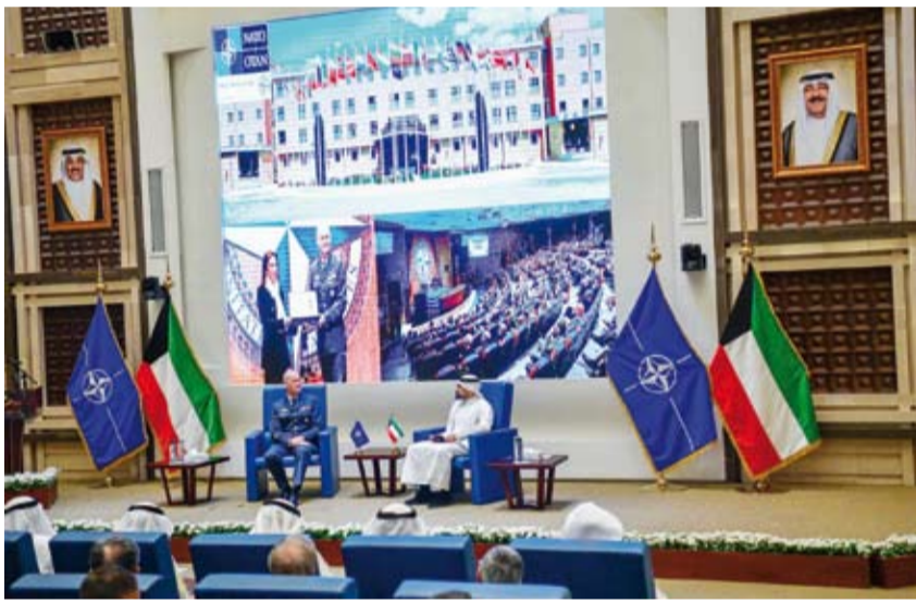
جانب من كلمة الفريق الركن ماكس نيلسن أثناء الحلقة النقاشية

أشاد قائد كلية الدفاع التابعة لحلف شمال الأطلسي (الناو) في روما الفريق الركن ماكس نيلسن، أمس، بقوة العلاقة والشراكة المحورية الناجحة بين الحلف ودولة الكويت الممتدة منذ 20 عاماً. جاء ذلك بتصريح صحفي أدلى به الفريق نيلسن لـ (كونا) على هامش حلقة نقاشية نظّمها المركز الإقليمي للناو ومبادرة إسطنبول للتعاون بعنوان (تكيف التعليم الدفاعي مع البيئات الأمنية الصعبة) بمناسبة زيارته إلى البلاد. وأعرب الفريق نيلسن عن تطلع الحلف إلى مواصلة الارتقاء بتلك الشراكة المحورية التي تعزز الأمن والاستقرار الإقليمي في منطقة الخليج العربي وسبل تطويرها في مختلف مجالات التعاون الثنائي في إطار الاحترام المتبادل والثقة المكتسبة بين الطرفين. وأضاف أن دولة الكويت