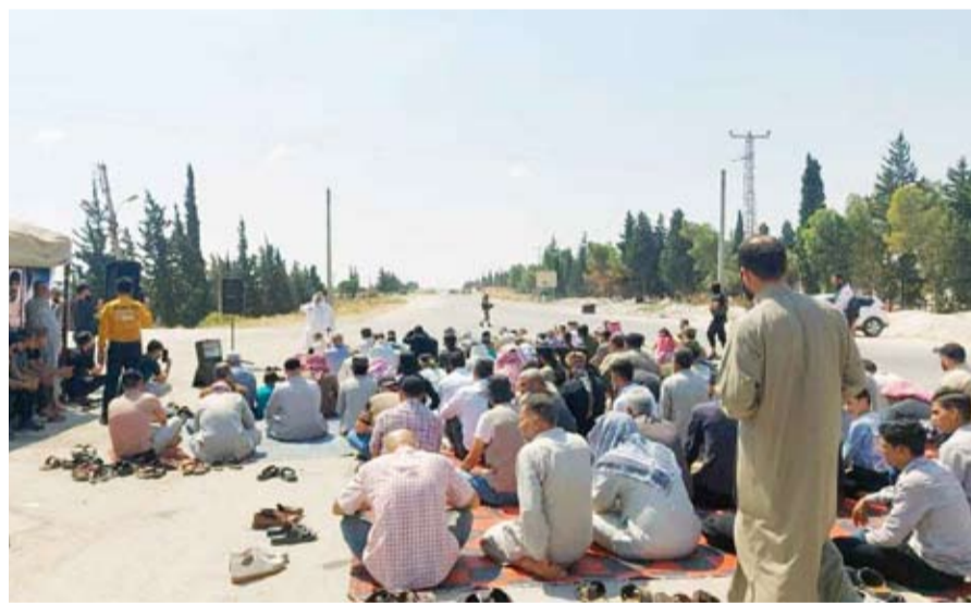
سوريون قرب معبر أبو الزنادين

وحسب المصادر، دفع فصيل «لواء صفور الشمال» بتعزيزاته من عشرين بریف حلب الشمالي، حيث يتمركز، باتجاه قطاعاته المحاذية لقطاع القوة المشتركة و فرقة السلطان مراد المدعومة من تركيا، وسط مخاوف من اتجاه الأمور في الشمال نحو مزيد من التعقيد، مع احتمال انضمام اللواء إلى «الجبهة الشامية»، وفق المصادر. كانت صحيفة «الوطن» المحلية في دمشق، قد أفادت في وقت سابق، بحسم أنقرة موقفها بوضع معبر أبو الزنادين في الخدمة، ولو