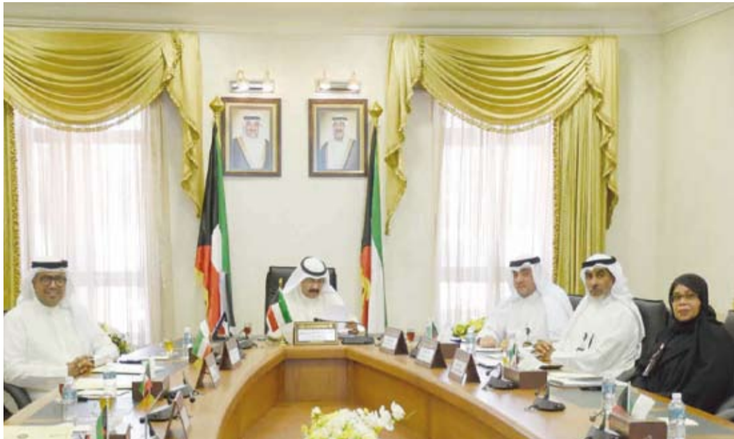
جانب من اجتماع مسؤولي وزارة الشؤون الاجتماعية والجهاز المركزي

بحث الوكيل المساعد للرعاية الاجتماعية بوزارة الشؤون بالتكليف، الدكتور جاسم الكندري مع مسؤولين في الجهاز المركزي لمعالجة أو وضع المقيمين بصورة غير قانونية بالتعاون المباشر فيما يتعلق بتقديم الخدمات الإنسانية والاجتماعية للأطفال مجهولي الوالدين.