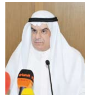
د. أسامة السعيد

أكد مدير جامعة الكويت بالإنابة، الدكتور أسامة السعيد، أن الرسالة السامية التي تحملها الجامعة وجهت العملية التعليمية نحو تحقيق أهداف الخطة الاستراتيجية العامة لدولة الكويت والتي أضفت أهمية على الدور الذي تؤديه مؤسسات التعليم العالي وأبرزها جامعة الكويت.