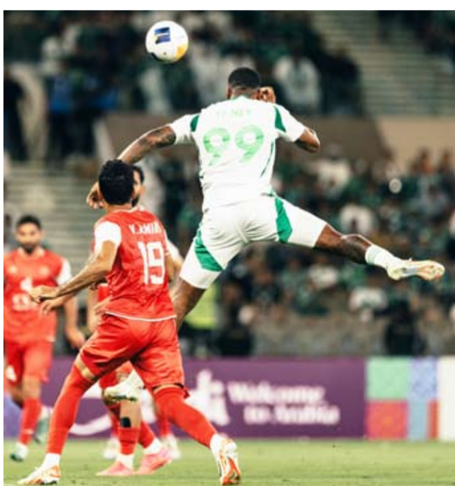
فوز مهم للاهلي السعودي