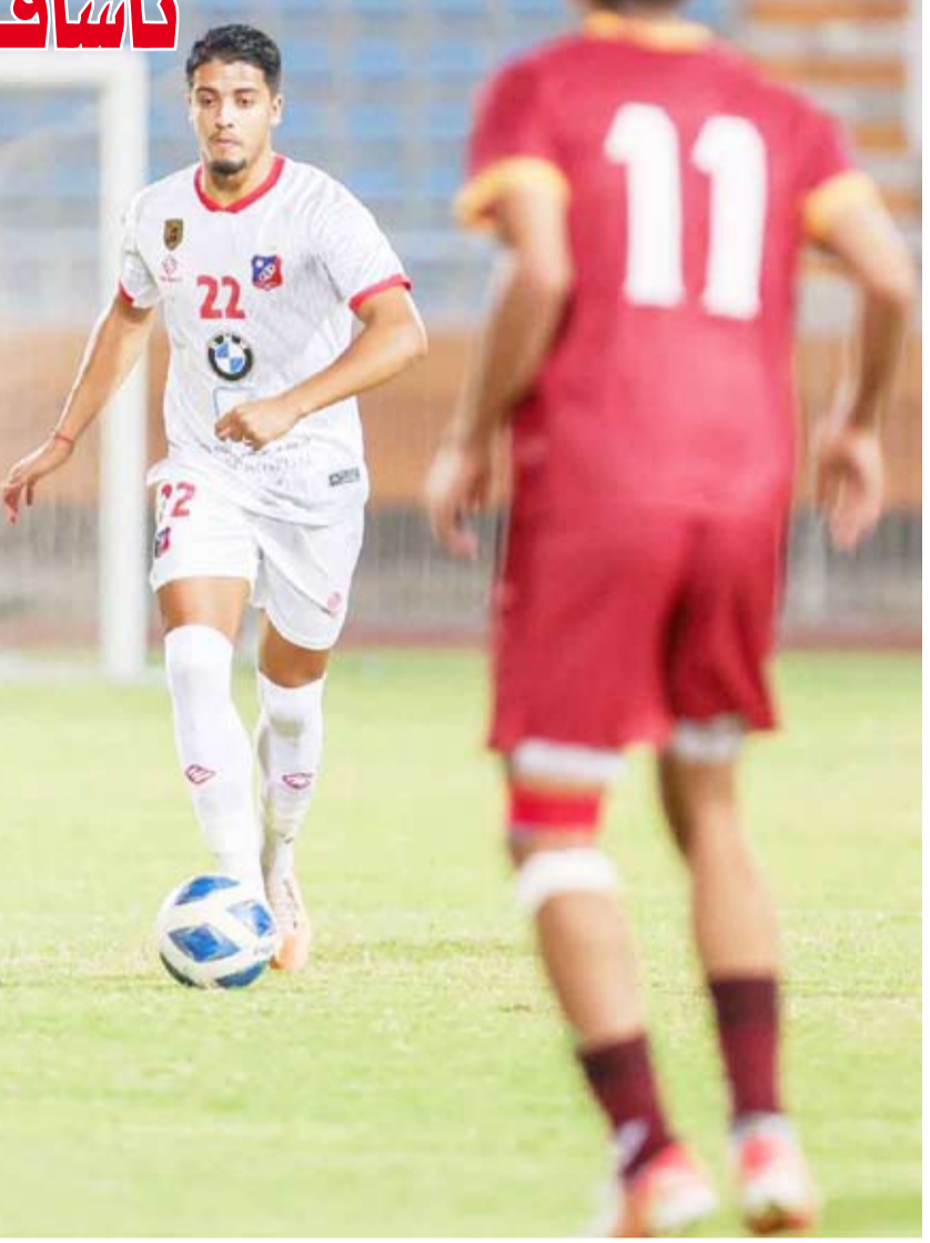
الكويت متصدر الدوري المحلي في مهمة آسيوية