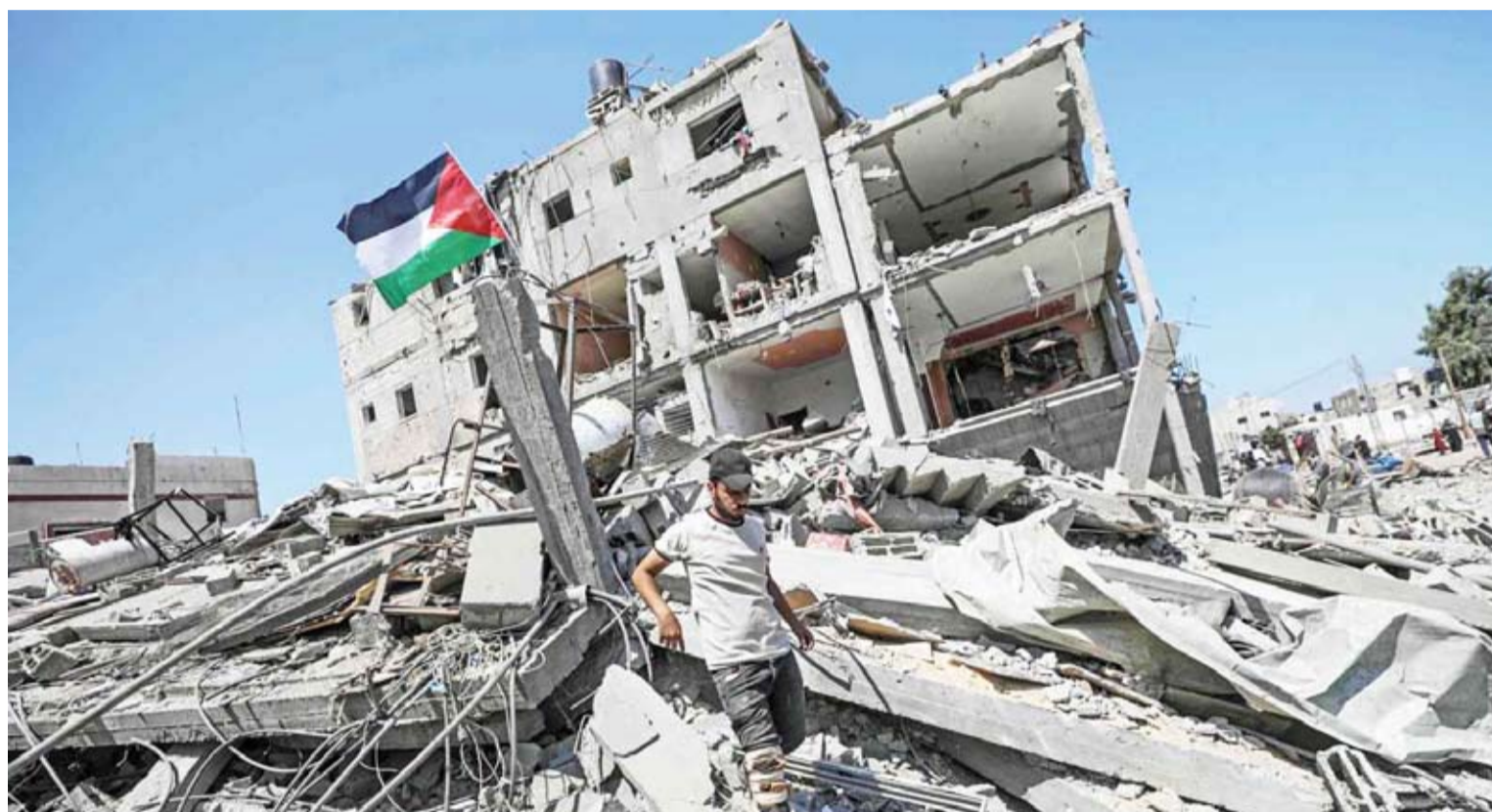
فلسطيني نازح يتفقد منزله في دير البلح

أعلنت وزارة الصحة بغزة، ارتفاع حصيلة ضحايا العدوان الإسرائيلي على القطاع والمستمر منذ 11 شهراً، إلى 41252 شهيداً على الأقل وإصابة 95497 آخرين. وأوضحت الوزارة، في بيان، أنها أحصت خلال الساعات الـ 24 الماضية ارتقاء 26 شهيداً و84 مصاباً جراء 3 مجازر ارتكبتها الاحتلال الإسرائيلي، وتم نقلهم إلى المستشفيات.