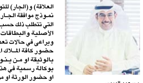
م. سعود الدبوس

أصدر مدير عام البلدية م. سعود الدبوس تعميماً بشأن المعاملات التي يشترط فيها إحضار موافقة الجار. وقال م. الدبوس في التعميم: أنه وتسهيلاً على المراجعين وسرعة إنجاز المعاملات واتخاذ الإجراءات اللازمة والحلول المناسبة لها في إطار الحرص على تطبيق سياسة الباب المفتوح. وبناء على إلغاء القانون رقم 40 لسنة 1966 بشأن المختارين، قرر: نوجه كافة رؤساء قطاعات البلدية وأقرها بالمحافظات وإداراتها المختلفة بشأن