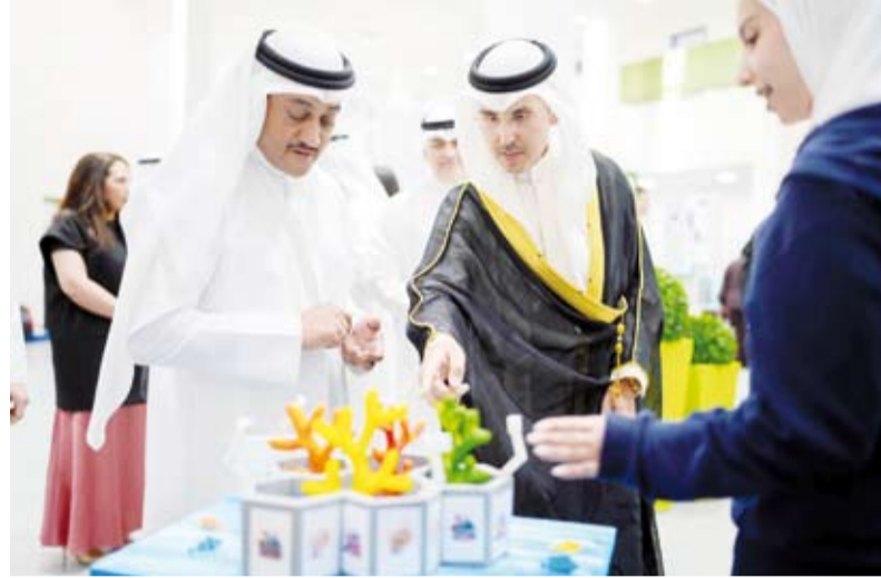
الشيخ صباح ناصر المحمد ورئيس مجلس إدارة النادي العلمي طلال الخرافي

أكد ممثل سمو الشيخ ناصر المحمد، راعي مسابقة الكويت للعلوم والهندسة الـ12، الشيخ صباح ناصر المحمد، أن المسابقة تمثل منذ انطلاقها منصة رحيبة للشباب المبدعين تمكنهم من عرض مشاريعهم العلمية وإبداعاتهم المتميزة وتنمية روح البحث العلمي لديهم. وقال الشيخ صباح ناصر المحمد في كلمته خلال تدشين المعرض الختامي للمسابقة مساء أمس الأول والتي ينظمها النادي العلمي الكويتي بدعم من مؤسسة الكويت للتقدم العلمي: إن المسابقة تنسجم مع التوجهات السامية لصاحب السمو أمير البلاد الشيخ مشعل الأحمد الداعية إلى دعم الأنشطة العلمية والثقافية وتشجيع الشباب على الابتكار والتطوير. وأعرب عن تقديره للقائمين على المسابقة والأساتذة المشرفين لإصرارهم على إقامة الفعاليات رغم الظروف الاستثنائية وتطويع وسائل الاتصال الحديثة لتابعة أعمال المتسابقين متفنيا على دور النادي العلمي ومؤسسة الكويت للتقدم العلمي في جعل المسابقة إحدى الفعاليات المؤثرة والمهمة محليا. من جانبه قال رئيس مجلس إدارة النادي العلمي طلال الخرافي في كلمته: إن المسابقة تعد محطة وطنية بارزة في مسيرة دعم العقول الشابة وتجسيدها لتوجه الدولة نحو ترسيخ ثقافة الابتكار وبناء اقتصاد معرفي، مشيراً إلى أنها الأكبر محلياً وتندرج ضمن البرنامج الوطني لرعاية الباحثين والمبتكرين الشباب. وأوضح الخرافي أن المسابقة تهدف إلى اكتشاف الطاقات المبركة وصلقلها وفق منهجيات حديثة لتهيئة جيل قادر على المنافسة إقليمياً ودولياً، لافتاً إلى حرص النادي على توفير