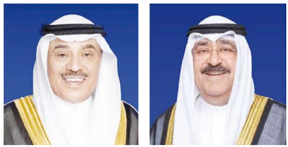
سمو ولي العهد الشيخ صباح الخالد