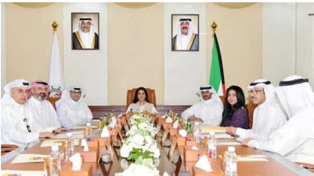
جانب من اجتماع المشعان ومحافظ مبارك الكبير

أكدت وزير الأشغال العامة الدكتورة نورة المشعان أهمية الاجتماع التنسيقي لمناقشة الأعمال والخدمات للجهات الحكومية الذي عقد أمس الاثنين وما يحتويه من موضوعات ذات طابع حيوي تشكل أولوية قصوى.