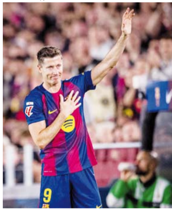
ليفاندوفسكي يودع جماهير برشلونة

استعداد برشلونة للانتصارات، التي غابت عنه في المرحلة الماضية ببطولة الدوري الإسباني لكرة القدم، عقب فوزه الكبير 3 / 1 على ضيفه ريال بيتيس، في المرحلة الـ37 للمنافسة. وافتتح البرازيلي رافينيا التسجيل لبرشلونة في الدقيقة 28، ثم عاد اللاعب ذاته ليضيف الهدف الثاني لأصحاب الأرض في الدقيقة 62.