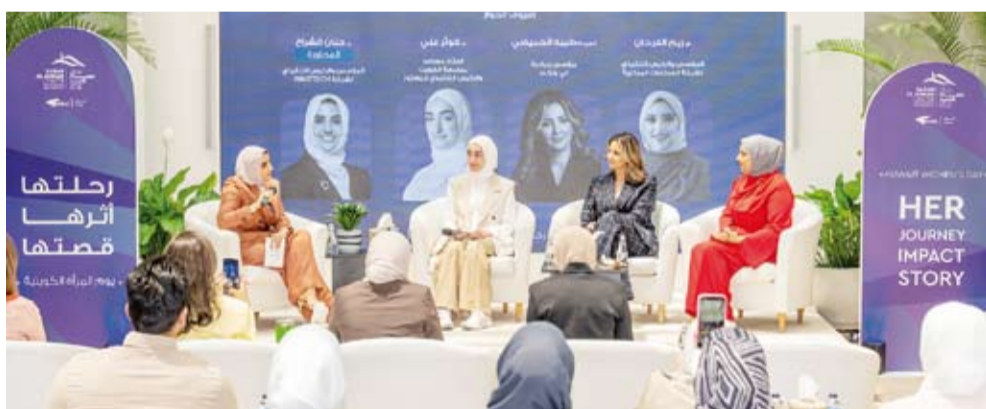
جانب من الجلسة الحوارية