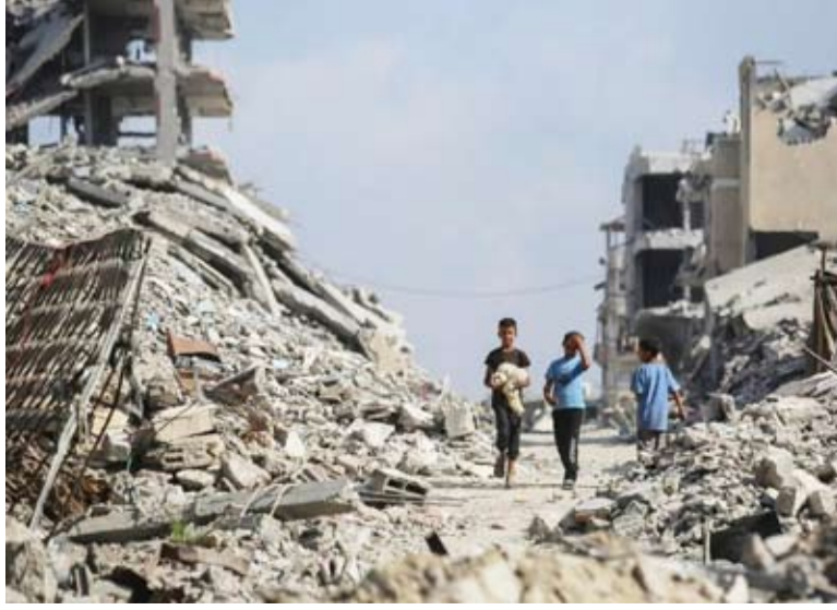
انقاض المباني في مخيم الشاطئ للاجئين شرق غزة

مستمرة، سواء طوعاً أو عبر استمرار الضغط العسكري». حديث المسؤول يأتي بعد أيام من حديث صحيفة «يسرائيل هيوم»، بأنه «جرى توسيع المناطق الأمنية داخل قطاع غزة بمساحة إضافية تبلغ 34 كيلومتراً مربعاً، بموافقة «مجلس السلام»، بعد عدم تنفيذ (حماس) الالتزامات المرتبطة بنزع السلاح». الخبير في الشؤون الإسرائيلية «مركز الأهرام للدراسات السياسية والاستراتيجية»، سعيد عكاشة، يرى أنه ليس من الصعب أن تقبل إسرائيل طرحاً من الممثل الأعلى لمجلس السلام بغزة نيكولا ملادينوف، بإدخال عناصر من اللجنة ضمن زيادة الضغوط للتضييق على الحركة، خصوصاً بعد اغتيال الحداد، مضيفاً: «لكن إسرائيل لا تلتزم بشيء»، وقد تستمر في إسقاطها رئيس الجناح العسكري لحركة الخروقات، ما يهدد مسار دخول اللجنة مجدداً».