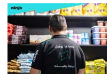
أسرع توصيل خلال 30 دقيقة

حملته للعروض الأسبوعية المستمرة، والتي تشمل ما يصل إلى 1.200 منتج أسبوعياً عبر فئات متعددة، مع خصومات تصل إلى 50%، بما يعزز من تجربة التسوق اليومية ويمنح المستهلك فرصة الاستفادة من أسعار تنافسية على المنتجات الموسمية والاحتياجات الأساسية. ومع تغير سلوك المستهلك خلال الموسم، باتت الراحة وسرعة الحصول على الاحتياجات المتنوعة من أهم الأولويات، وهو ما يستجيب له «نينجا» من خلال منصة توفر كل ما يحتاجه العميل في مكان واحد: من منتجات العناية الشخصية، إلى المرطبات، والمنظفات.