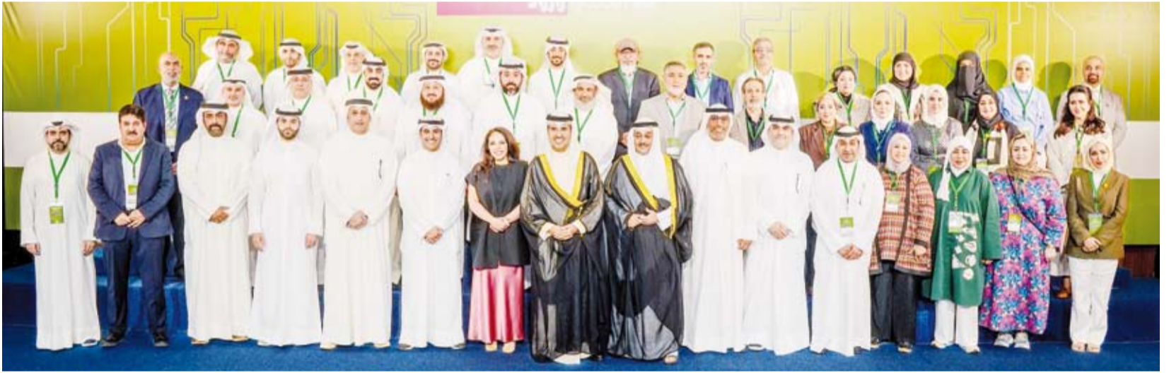
أعضاء هيئة محكمي مسابقة الكويت للعلوم والهندسة الـ12

وأشار الجمعة إلى حرص النادي على توفير بيئة علمية متقدمة عبر ورش العمل والدورات المكثفة، مشيداً بالشراكات الاستراتيجية مع الجهات الأكاديمية والبحثة التي تفتح مختبراتها للطلبة المشاركين لرفع جودة مخرجاتهم البحثية والعلمية.