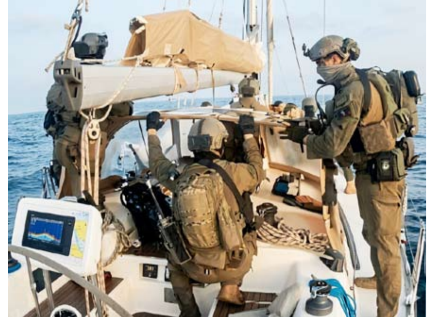
قوات الاحتلال خلال توقيف إحدى سفن الأسطول البحري

دانت وزارة الخارجية التركية أمس بشدة هجوم قوات الاحتلال على مبادرة أسطول الصمود العالمي الثالثة في المياه الدولية واصفة الهجوم بـ"القرصنة الجديدة". وشددت على ضرورة إيقاف الاحتلال لهجماته بشكل فوري والإفراج عن جميع النشطاء المعتقلين دون شروط مشيرة إلى اتخاذ السلطات التركية الخطوات اللازمة لضمان عودة مواطنيها المشاركين في الأسطول إلى جانب التنسيق مع الدول المعنية.