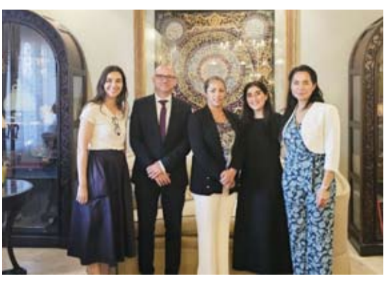
السفير الفرنسي وزوجته في إحدى الزيارات

قام السفير الفرنسي، أوليفييه غوفان، وزوجته، سايه غوفان، بزيارة عدد من السيدات الكويتيات اللاتي يتمتعن بمسيرة مهنية رائعة. وذلك بمناسبة يوم المرأة الكويتية، الذي يحتفي به في 16 مايو من كل عام واشتملت جولة السفير الفرنسي وزوجته، لقاءات مع نساء كويتيات ذات مسارات استثنائية، ناشطات في مجالات الطاقة، والدفاع عن حقوق المرأة، وعلوم الفضاء، والتمويل.