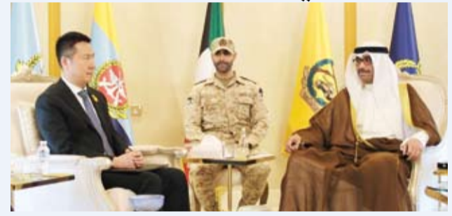
الشيخ عبدالله العلي خلال لقائه سفير الصين يانغ شين

بحث وزير الدفاع الشيخ عبدالله العلي مع سفير جمهورية الصين الشعبية المشترك لدى دولة الكويت يانغ شين، عدداً من الموضوعات ذات الاهتمام المشترك.