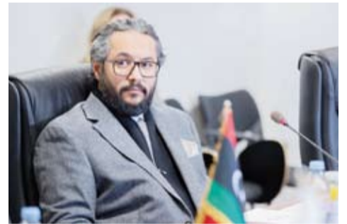
د. سلمان الصباح خلال الاجتماع