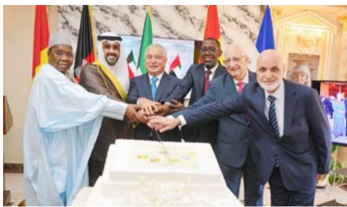
السفراء المحتفي بهم

إلى مساهمته في إعداد عدد من مشاريع الاتفاقيات ومذكرات التفاهم بين المؤسسات المعنية في كلا البلدين. وتوه بالدور الذي اضطلع به السفير الأفغاني في الحفاظ على علاقات إيجابية وبناءة مع السلطات الكويتية وأعضاء السلك الدبلوماسي، رغم التحديات السياسية التي شهدتها أفغانستان منذ عام 2021، حيث واصل أداء مهامه بروح من الالتزام والتعاون.