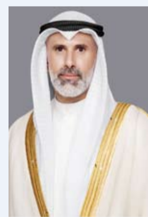
الشيخ جراح الجابر

تلقي وزير الخارجية الكويتي الشيخ جراح الجابر، أول أمس، اتصالاً هاتفياً من نائب رئيس الوزراء وزير خارجية دولة الإمارات العربية المتحدة الشقيقة الشيخ عبدالله بن زايد آل نهيان. وبحسب بيان صادر عن وزارة الخارجية الكويتية، جرى خلال الاتصال الاثنان على إجراءات السلامة في منطقة بركة الطاقة النووية في منطقة الظفرة بإمارة أبو ظبي بعد الاعتداء المدان الذي تعرضت له المحطة. ووفق البيان، جدد وزير الخارجية خلال الاتصال تضامناً دولة الكويت الكامل مع دولة الإمارات العربية المتحدة ودعمها في كل ما تتخذ من إجراءات للحفاظ على سيادتها وأمنها وسلامة منشآتها.