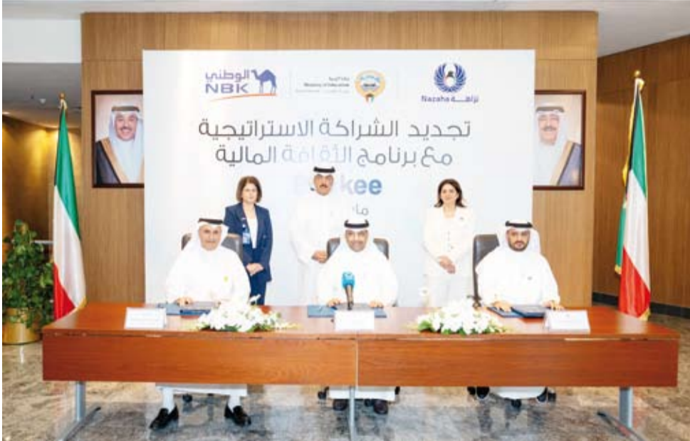
جانب من توقيع تجديد الشراكة الاستراتيجية لبرنامج «بنكي»