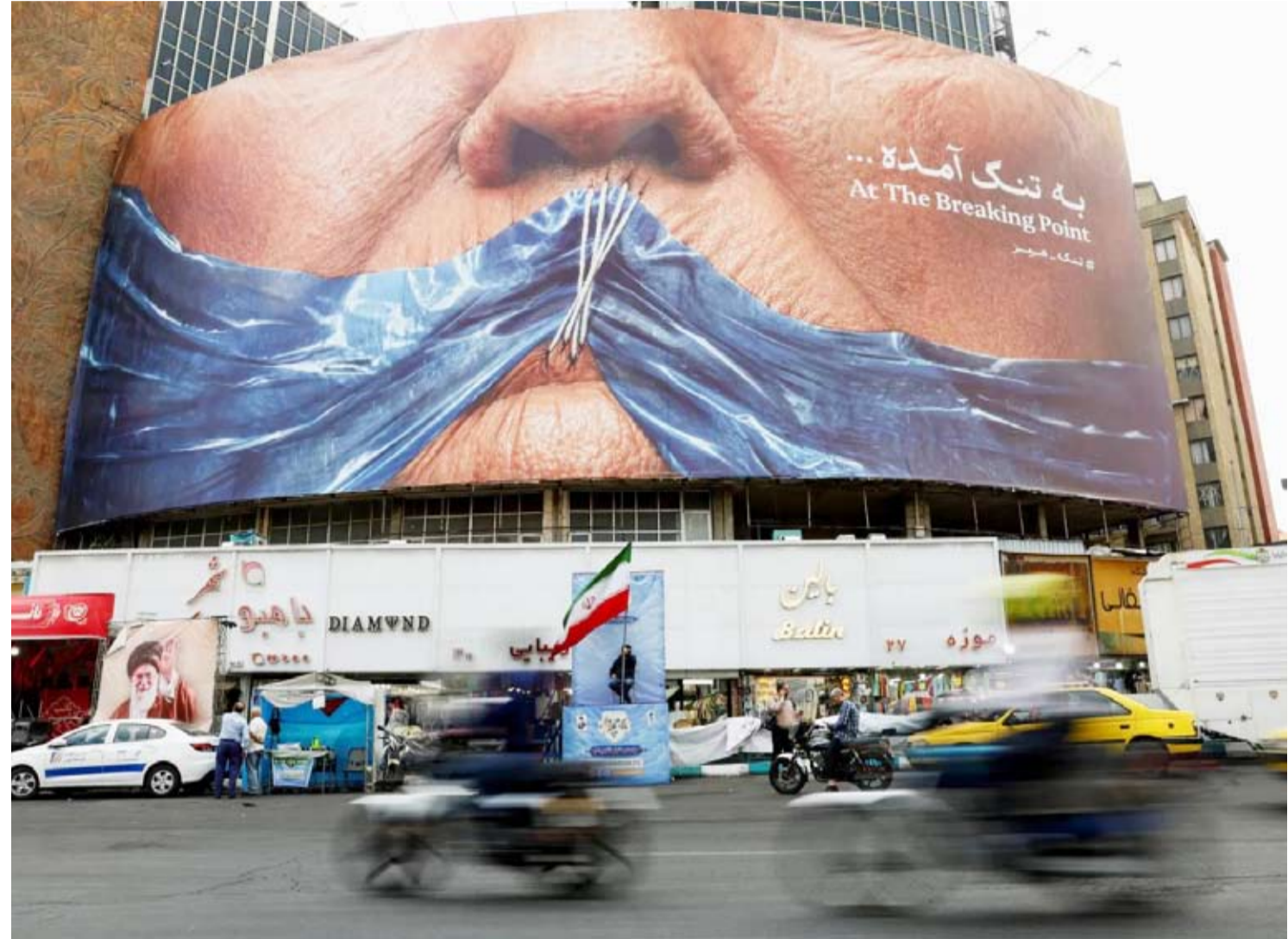
لوجة دعائية مناهضة للولايات المتحدة

من جانبها، أدانت قطر بشدة محاولة استهداف السعودية بطائرات مسيرة، وعدتها «اعتداءً مرفوضاً وانتهاكاً لسيادة المملكة وتهديداً لأمنها وأمن المنطقة». وأكدت وزارة الخارجية القطرية، في بيان، تضامن الدوحة الكامل مع السعودية، ودعمها كل ما تتخذه من إجراءات للحفاظ على أمنها وسيادتها وسلامة مواطنيها والمقيمين على أراضيها. من جانبها، أعربت وزارة الخارجية البحرينية عن إدانة مملكة البحرين واستنكارها الشديدين للهجوم الإرهابي الأثم الذي استهدف أمن واستقرار السعودية باستخدام ثلاث طائرات مسيرة قادمة من الأجواء العراقية، وعدت ذلك تصعيداً خطيراً يهدد الأمن والاستقرار الإقليمي، وانتهاكاً صارخاً لمبادئ حسن الجوار وقواعد القانون الدولي، وخرقاً لقرار مجلس الأمن الدولي رقم 2817.