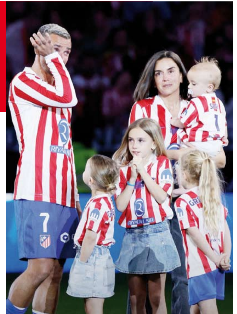
انتوان غريزمان وعائلته في وداع الليغا

خاض المهاجم الفرنسي لفريق أتلتيكو مدريد الإسباني أنطوان غريزمان وداعه الأخيرة أمام جماهيره في الفوز على ضيفه جيرونا 0-1، ضمن الجولة قبل الأخيرة لليغا الإسبانية، وتلقى تحية مؤثرة في ملعب ميتروبوليتانو تليق بمكانته. وودّع غريزمان البالغ 35 عاماً، جماهيره بعد خوضه مباراته الـ500 في الدوري الإسباني بقميص «الروخيبيلانكوس»، وربما مباراته قبل الأخيرة في أوروبا، قبل أن يشد الرحال هذا الصيف إلى أورلاندو في الولايات المتحدة. واحتفي بطل العالم الفرنسي، الهدف التاريخي لأتلتيكو مدريد برصيد 212 هدفاً، كبطل حقيقي أمام أنظار زوجته وأطفاله الأربعة الذين نزل معهم إلى أرضية ملعب ميتروبوليتانو للمرة الأخيرة في مسيرته، وهو