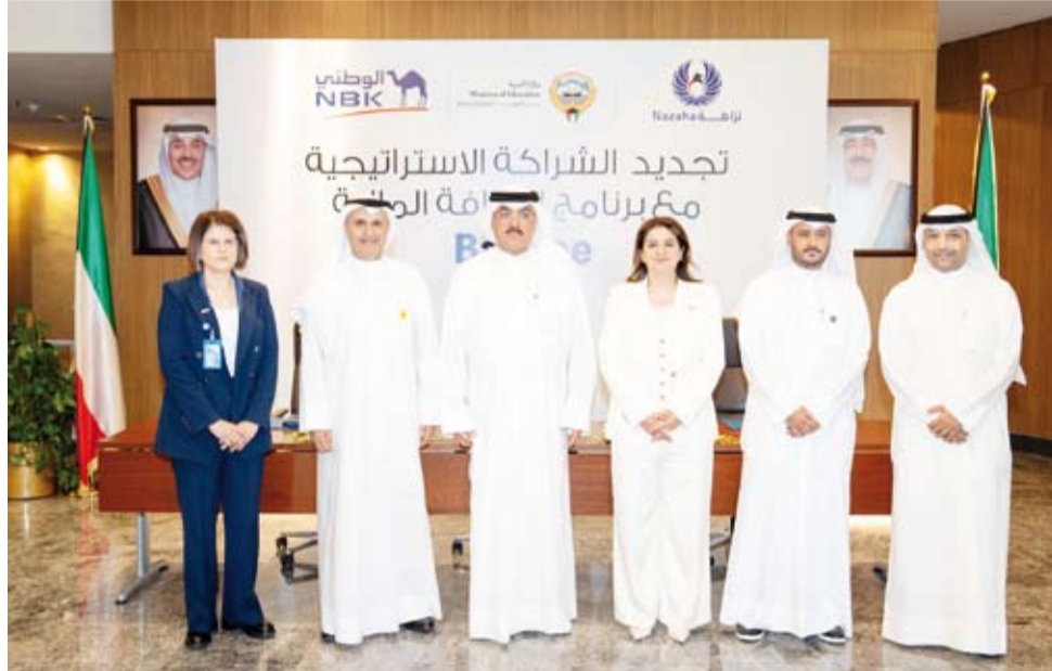
الطبيباني والصقر والفارس خلال توقيع تجديد الشراكة

أكد وزير التربية سيد جلال الطبيباني، أهمية ترسيخ مفاهيم الثقافة المالية والنزاهة لدى الطلبة باعتبارها ركيزة أساسية في بناء شخصية الطالب وتعزيز وعيه بالمسؤولية المالية والسلوكيات الاقتصادية السليمة بما يواكب متطلبات الحياة المعاصرة ويسهم في إعداد جيل قادر على اتخاذ قرارات مالية واعية ومسؤولة.