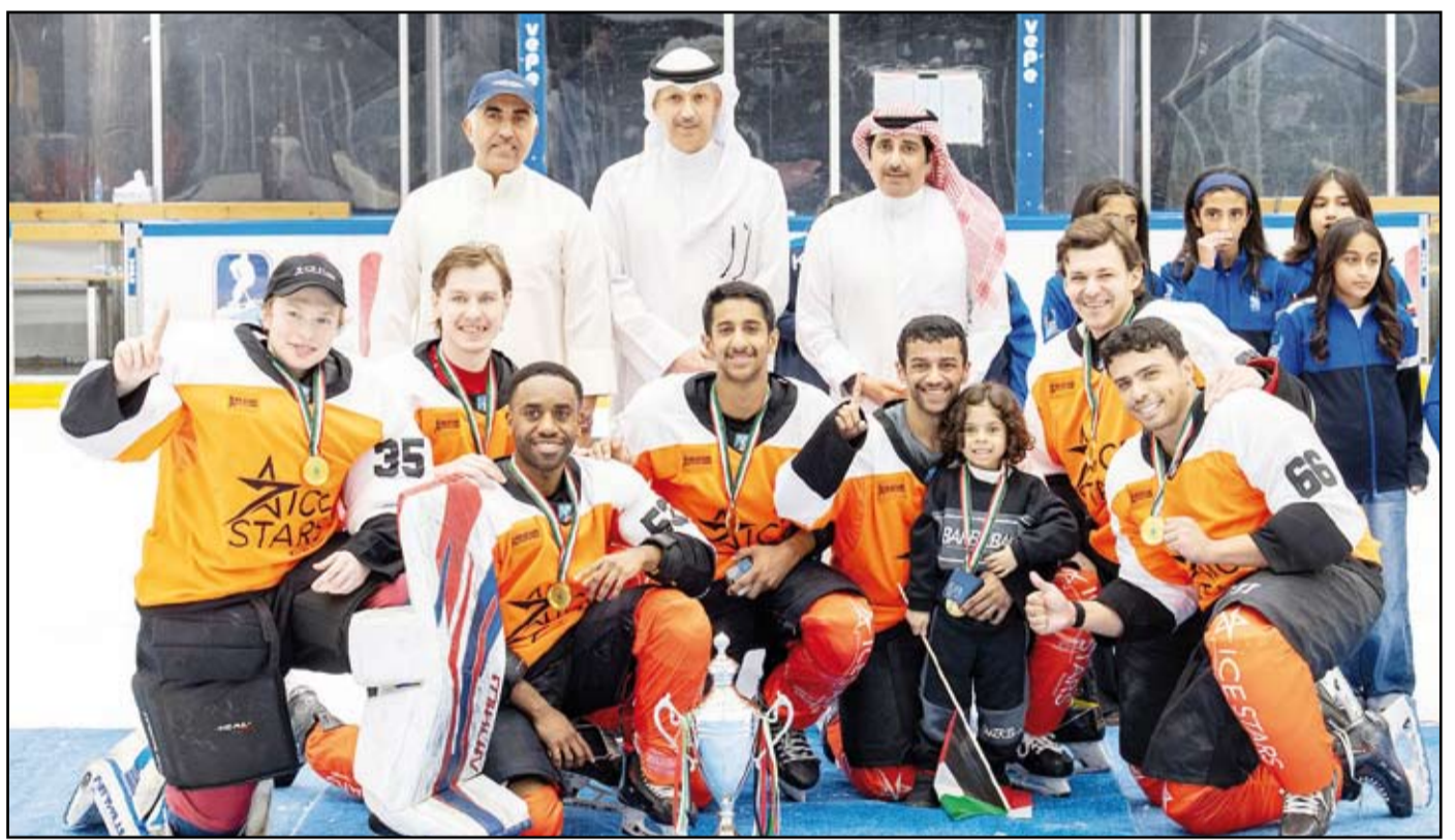
جانب من التتويج

في بطولات خارجية شملت أيضاً لعبتي الكيرلنج والتزلج على الجليد. وذكر أن النادي حرص على استكمال مباريات الدوري الكويتي بعد فترة التوقف الأخيرة بهدف استعادة اللاعبين لأجواء المباريات التنافسية في ظل استعدادات منتخب الكويت الأول لخوض منافسات البطولة الدولية الرابعة لمتدري الدول الإسلامية لهوكي الجليد والمزمع إقامتها في مدينة (كازان) في روسيا يونيو المقبل.