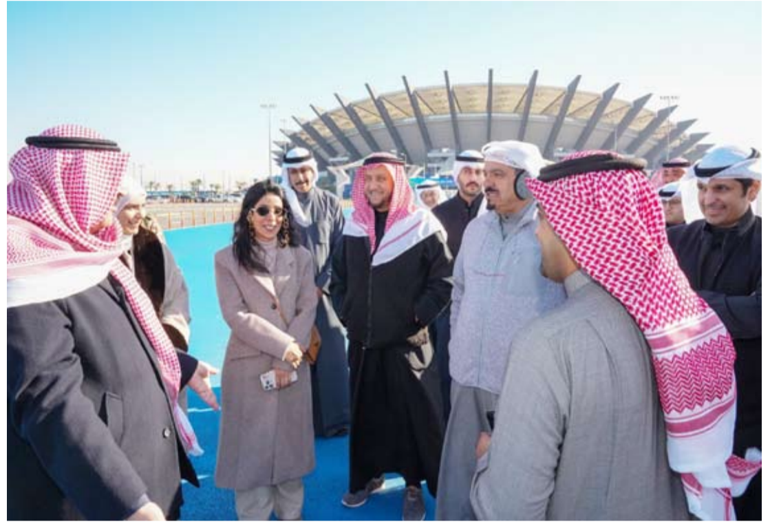
سمو رئيس مجلس الوزراء الشيخ أحمد عبدالله خلال تفقده ستاد جابر الدولي بصحبة الوزراء أمس

عقد مجلس الوزراء اجتماعه الأسبوعي برئاسة سمو رئيس مجلس الوزراء الشيخ أحمد عبدالله، أمس، في قاعة الاجتماعات باستاد جابر الدولي. وخلال الاجتماع اطلع العبدالله والوزراء على آخر الاستعدادات لاستضافة بطولة كأس الخليج لكرة القدم خليجي 26. وقدم وزير الإعلام والثقافة وزير الشباب رئيس اللجنة المنظمة للبطولة عبدالرحمن الطيرى ومسؤولي هيئة الرياضة شرحاً عن جاهزية المنشآت الرياضية. في ذات السياق يستعد مطار الكويت الدولي لاستقبال نحو 30 ألف مشجع للبطولة، في خطوة تعكس الاستعدادات الكبيرة لهذا الحدث الرياضي المهم والذي يعزز الروابط الثقافية والرياضية بين الدول المشاركة. وتبدأ بطولة خليجي زين 26 في الفترة ما بين 21 ديسمبر الجاري و3 يناير المقبل وتشارك فيها منتخبات السعودية والإمارات وقطر والبحرين وعمان والعراق واليمن بجانب منتخب دولة الكويت.