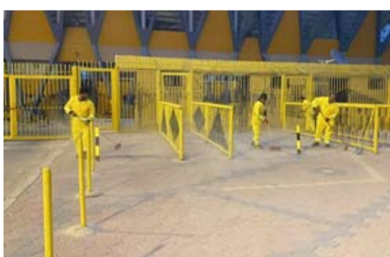
عمال نظافة البلدية أثناء تنظيف الشوارع