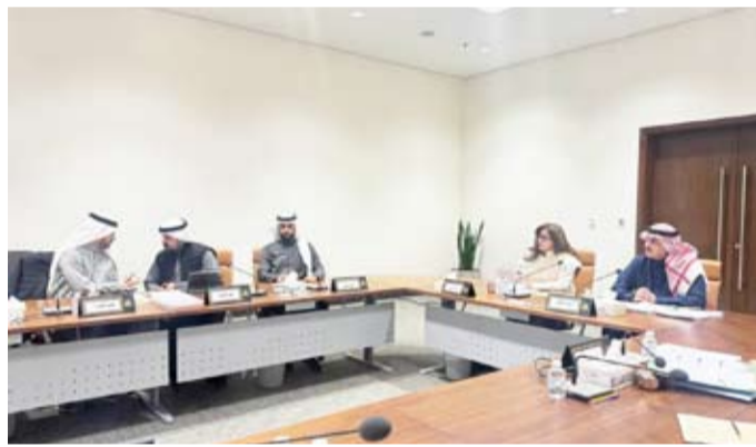
جانب من اجتماع لجنة الجبراء