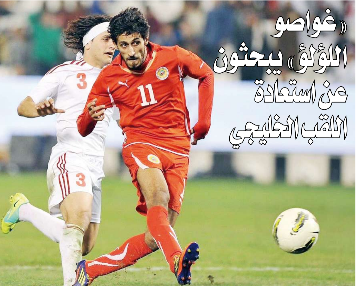
طموحات البحرين في اللقب الثاني.. مشروعة

المنظمة العليا لبطولة "خليجي زين 26" اختارت بعناية ودقة مجموعة من اللجان العاملة لتتولى مسؤولية التخطيط والتنظيم والتنفيذ قبل وأثناء البطولة، وأرادت تشكيل لجنة ضبط الجودة للمتابعة والإشراف على عمل جميع اللجان، ومتابعة سير عملها، كما