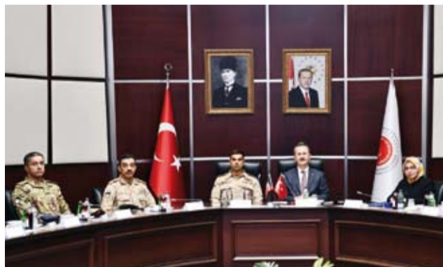
جانب من المباحثات

وذكرت وزارة الدفاع الكويتية في بيان أن ذلك جاء على هامش زيارة نائب رئيس الأركان لفرق هيئة الصناعات الدفاعية التركية (اس اس بي) في العاصمة التركية أنقرة. وأضاف أن الجانبين بحثا أيضاً سبل تعزيز التعاون والشراكة بين الجانبين لتطوير القدرات الدفاعية.