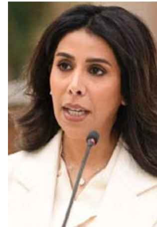
وزيرة الأشغال نوره المشعان

الأعمال في الوقت المحدد، خصوصاً مع وجود بعض الطرق التي سيتم إغلاقها خلال أعمال الصيانة.