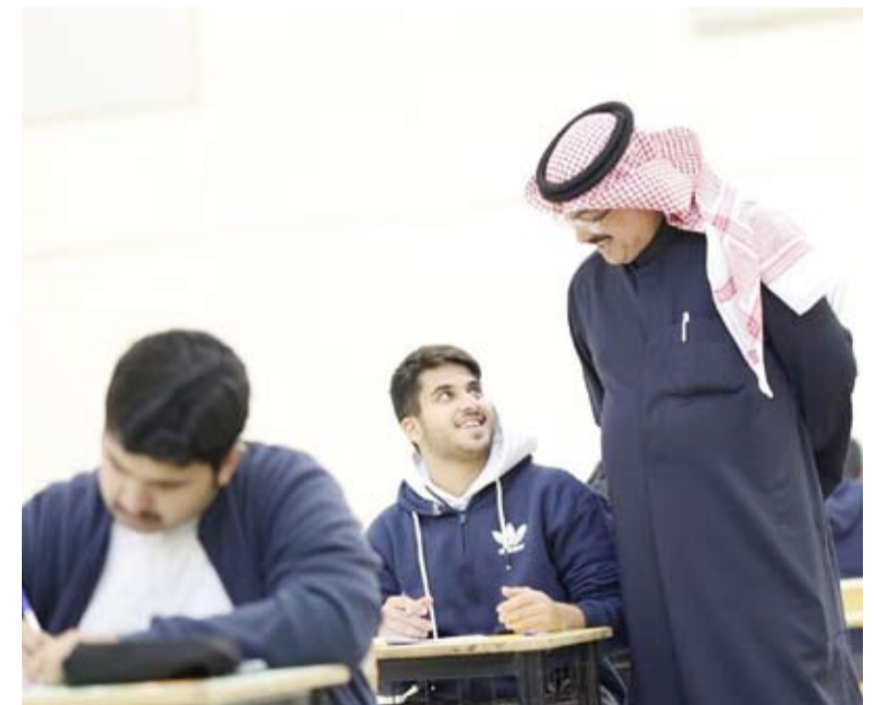
وزير التربية تفقد انطلاق الاختبارات واطمن على سير العمل

أكد وزير التربية جلال الطبطبائي أن النجاح لا يقاس فقط بالدرجات بل بالإصرار والعزيمة على تحقيق الأهداف الكبرى، مشيراً إلى أن العلم هو الطريق الأمثل لخدمة الكويت والنهوض بها. جاء ذلك في تصريح للوزير الطبطبائي نقله بيان صحفي صادر عن وزارة التربية أمس عقب جولة تفقدية قام بها في ثانوية (عبدالمطيف ثنيان الغانم بنين) التابعة لمنطقة الفروانية التعليمية للاطمئنان على سير العمل في انطلاق امتحانات الفصل الدراسي الأول 2024 - 2025. وكان نحو 104 آلاف طالب وطالبة في المرحلة المتوسطة والصفيين العاشر والحادي عشر قد بدأوا صباح أمس اختبارات نهاية الفصل الدراسي الأول من العام الدراسي 2024 - 2025.