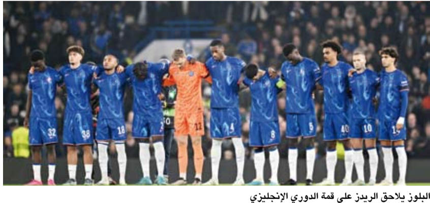
البلوز بلاح الريز على قمة الدوري الإنجليزي

يستضيف تشيلسي الإنجليزي، اليوم الخميس، شامروك روفرز الإيرلندي في الجولة الأخيرة لمرحلة الدوري الأوروبي في الجولتين الأولى والثانية. ويسعى تشيلسي لإنهاء هذه المرحلة بالعلامة الكاملة، بعد أن كان أول فريق يضمن التأهل لدور الـ16 بشكل مباشر بعدما حقق الفوز في المباريات الخمس التي خاضها حتى الآن، حيث يتصدر جدول الترتيب برصيد 15 نقطة بفارق نقطتين أمام ملاحقه المباشر فيتوريا جيماريز البرتغالي. وتصدر أول 8 فرق مباشرة إلى دور الـ16، فيما ستخوض الفرق التي أنهت مرحلة الدوري في المراكز التاسع إلى الـ24 ملحق التأهل لدور الـ16، حيث تصعد الفرق الثمانية الفائزة من الملحق إلى دور الـ16، ومن دور الـ16 يتم لعب الأدوار الإقصائية بحيث يتأهل الفائز للدور التالي. ويدخل تشيلسي مواجهة شامروك روفرز