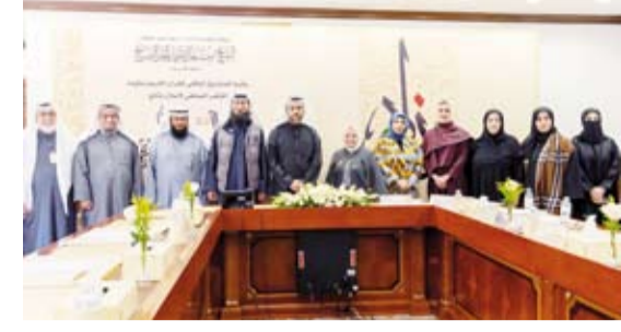
جانب من المؤتمر الصحفي

أعلنت الأمانة العامة للأوقاف أمس أسماء الفائزين في مسابقة الكويت الكبرى لحفظ القرآن الكريم وتجويد بنسختها الـ 27 تحت شعار (خير زاد) برعاية حضرة صاحب السمو أمير البلاد الشيخ مشعل الأحمد الجابر الصباح حفظه الله ورعاه.