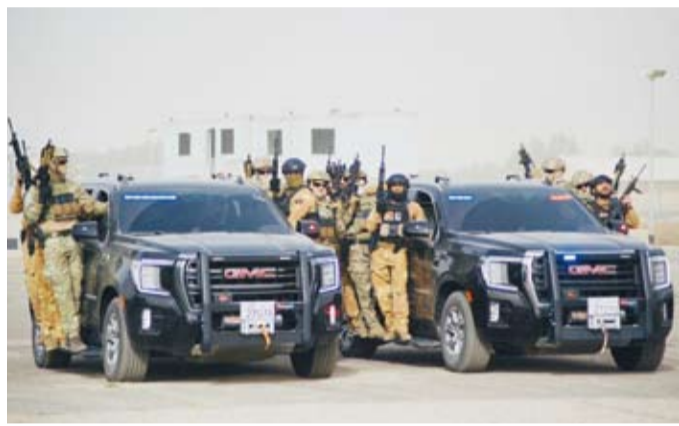
جانب من التمرين