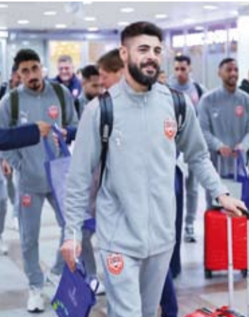
وصول الوفود المشاركة