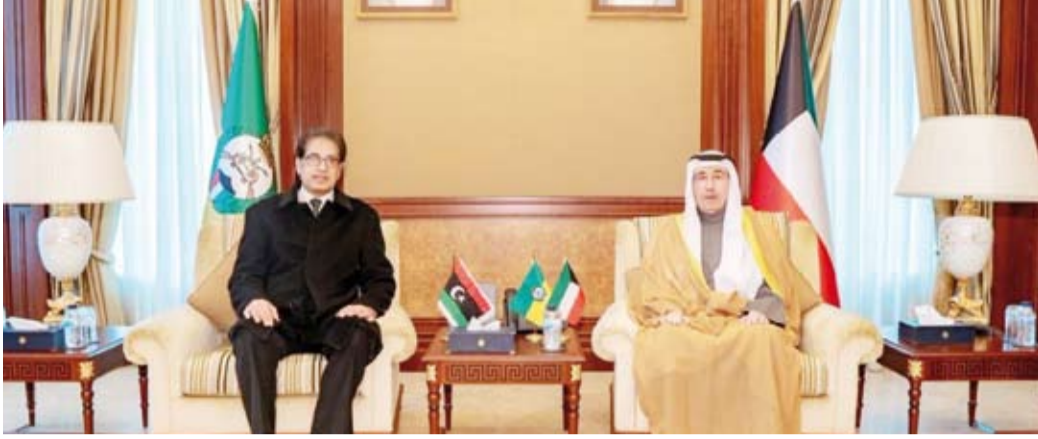
الشيخ مبارك حمود الجابر الصباح مستقبلاً السفير الليبي

أشاد رئيس الحرس الوطني الشيخ مبارك حمود الجابر الصباح، أمس، بالعلاقات المتميزة التي تربط بين دولة الكويت وليبيا الشقيقة. وقال الحرس الوطني في بيان صحفي: إن الشيخ مبارك حمود استقبل في ديوانه برئاسة الحرس، أمس، السفير الليبي لدى البلاد سليمان الساحلي الذي قدم له التهنئة بحصوله على ثقة القيادة السياسية وتعيينه رئيساً للحرس الوطني.