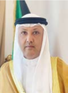
الوزير خالد المطيري

بين البلدين جعلتهما يسيران على الطريق ذاته في كل المحافل الدولية وعلى جميع الأصعدة الهادفة إلى دعم السلم والاستقرار في المنطقة والعالم وتطلقان من رؤية مشتركة لتحقيق الازدهار لشعبهما. وأعرب عن تقديره لحرص دولة قطر على تعزيز وتوثيق العلاقات الخليجية-الخليجية. وهذا المطيري قيادة وحكومة وشعب دولة قطر بهذه المناسبة الحجدية، سائلاً الله العلي العظيم، أن يديم على السدحة الأمن والأمان والاستقرار وأن تواصل مسيرتها في النمو والازدهار في ظل قيادتها الحكيمة.