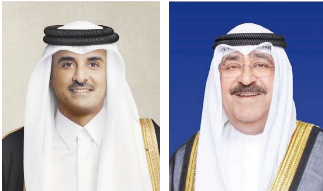
سمو الشيخ تميم بن حمد آل ثاني أمير دولة قطر