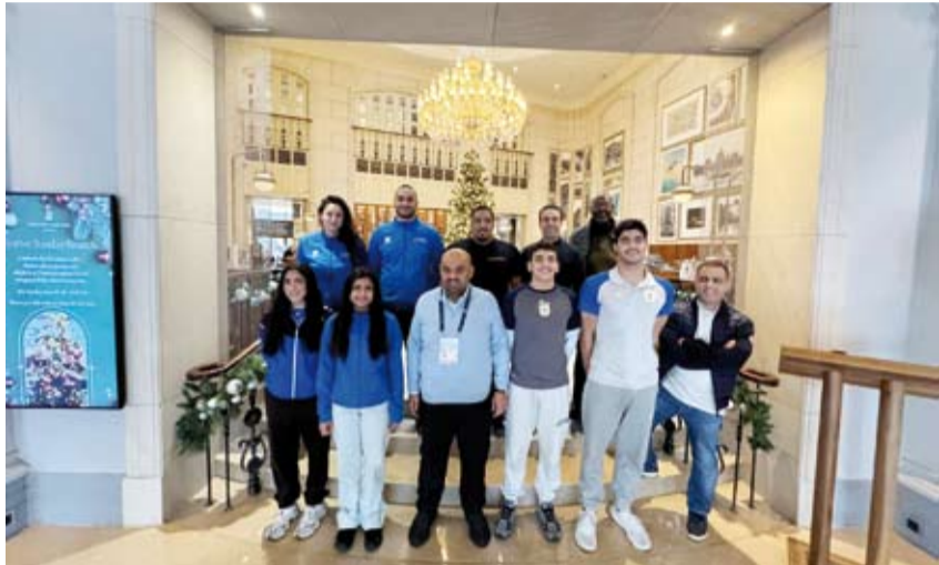
منتخب الكويت المشارك ببطولة العالم للسباحة في ضيافة الشيخ خالد البدر