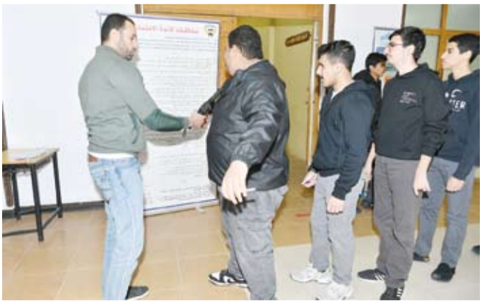
تفتيش الطلبة قبيل الدخول