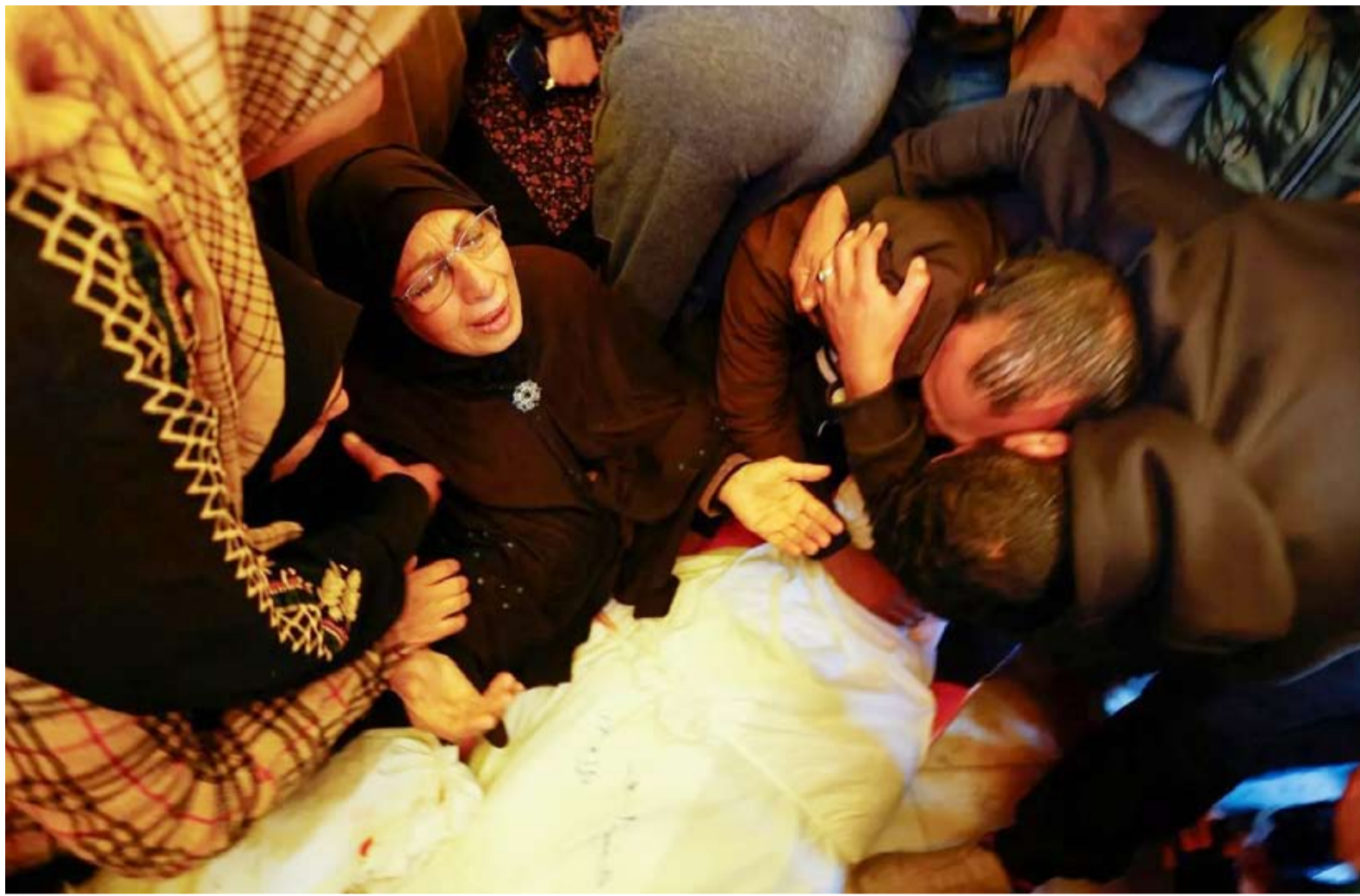
جنازة فلسطينيين قُتلوا في غارات صهيونية

وسلط محادثات واتصالات وجولات للوسطاء، دخلت مفاوضات الهدنة في قطاع غزة مرحلة «حاسمة» عبر اجتماعات فنية، وسط حديث مصري عن «جهود مكثفة» من القاهرة والدوحة مع الأطراف كافة للتوصل إلى اتفاق تهدئة بالطعام. تلك الاجتماعات التي تشهدها الدوحة بحضور إسرائيل، تأتي مع ترجيح مصادر لـ«الشرق الأوسط» باقتراب عقد الاتفاق بعد استكمال تفاصيله الأخيرة، خصوصاً المرتبطة بإسماء الرهائن الأحياء والأسرى الفلسطينيين، لافتين إلى معلومات أولية تشير إلى احتمال أن تتم الصفقة الأسبوع المقبل على أن يعلن عنها قبل أحد الأعياد اليهودية، الذي يحل في 25 ديسمبر الحالي، حال استمر التقدم الحالي بالمفاوضات. ويرجع خبراء تحدثوا لـ«الشرق الأوسط» حدوث مرونة من جانب «حماس» وعدم ممانعة من رئيس الوزراء الإسرائيلي، بنيامين نتانياهو؛ لتفادي التصعيد الداخلي ضده في ملف الرهائن، متوقعين حال نجاح المحادثات الفنية أن تكون الصفقة وشبكة في توقيت لا يتجاوز أسبوعاً من الانتهاء منها.