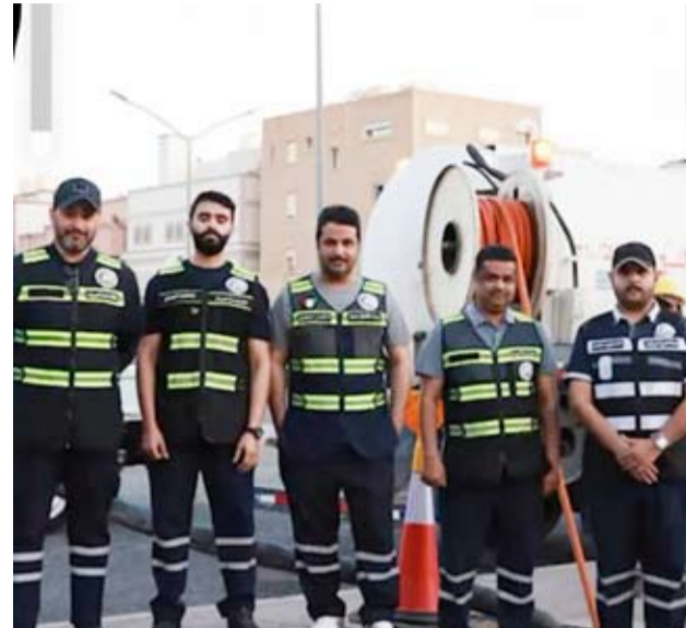
مهندسو مشروع حولي