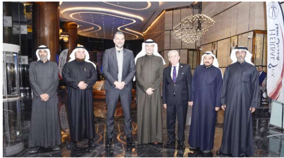
وزير خارجية البوسنة والهرسك يتوسط أعضاء مجلس رجال الأعمال الكويتي

◆ تشانانتشار: استثمارات القطاع الخاص الكويتي فاقت نظيرتها الحكومية