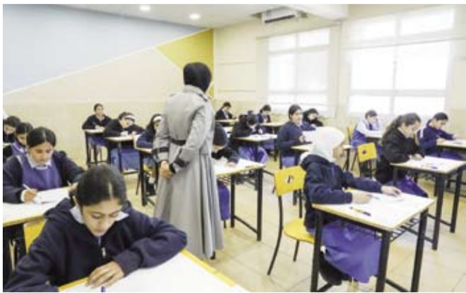
جانب من اختبارات الطالبات

اختبارات المرحلة المتوسطة في 26 ديسمبر الجاري فيما تمتد اختبارات الصفين العاشر والحادي عشر حتى 30 الجاري.