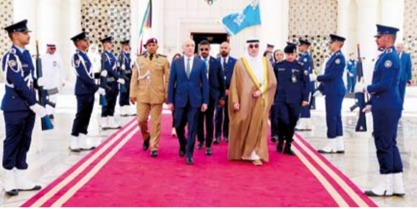
الشيخ فهد اليوسف خلال وداع وزير الداخلية والبلديات اللبناني أحمد الحجار

عن خالص شكره وتقديره لصاحب السمو أمير البلاد الشيخ مشعل الأحمد وسمو ولي العهد الشيخ صباح الخالد وسمو الشيخ أحمد عبدالله رئيس مجلس الوزراء، والنائب الأول لرئيس مجلس الوزراء ووزير الداخلية الشيخ فهد اليوسف على ما حظي به والوفد المرافق من حفاوة الاستقبال وكرم الضيافة. وفمن ما يجمع دولة الكويت والجمهورية اللبنانية الشقيقة من علاقات أخوية وثيقة مشيدا بما أسفرت عنه الزيارة من نتائج إيجابية تعزز التعاون والتنسيق المشترك في المجالات المشتركة بما يخدم المصالح المشتركة بين البلدين الشقيقين.