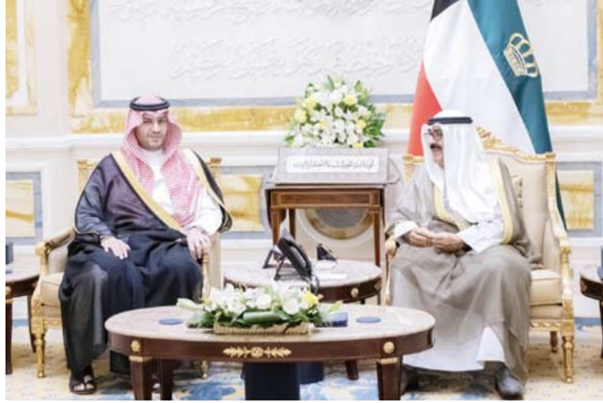
سمو أمير البلاد مستقبلاً الأمير تركي بن محمد

استقبل صاحب السمو أمير البلاد الشيخ مشعل الأحمد، أمس، صاحب السمو الملكي الأمير تركي بن محمد وزير الدولة عضو مجلس الوزراء بالملكة العربية السعودية الشقيقة والوفد المرافق وذلك بمناسبة زيارته الرسمية لبلاد. حيث نقل لسموه تحيات وتقدير أخيه خادم الحرمين الشريفين الملك سلمان بن عبدالعزيز ملك المملكة العربية السعودية الشقيقة وأخيه صاحب السمو الملكي الأمير محمد بن سلمان ولي العهد رئيس مجلس الوزراء وتمنياتها لسموه بوفور الصحة وتام العافية ولشعب دولة الكويت المزيد من التقدم والثناء.