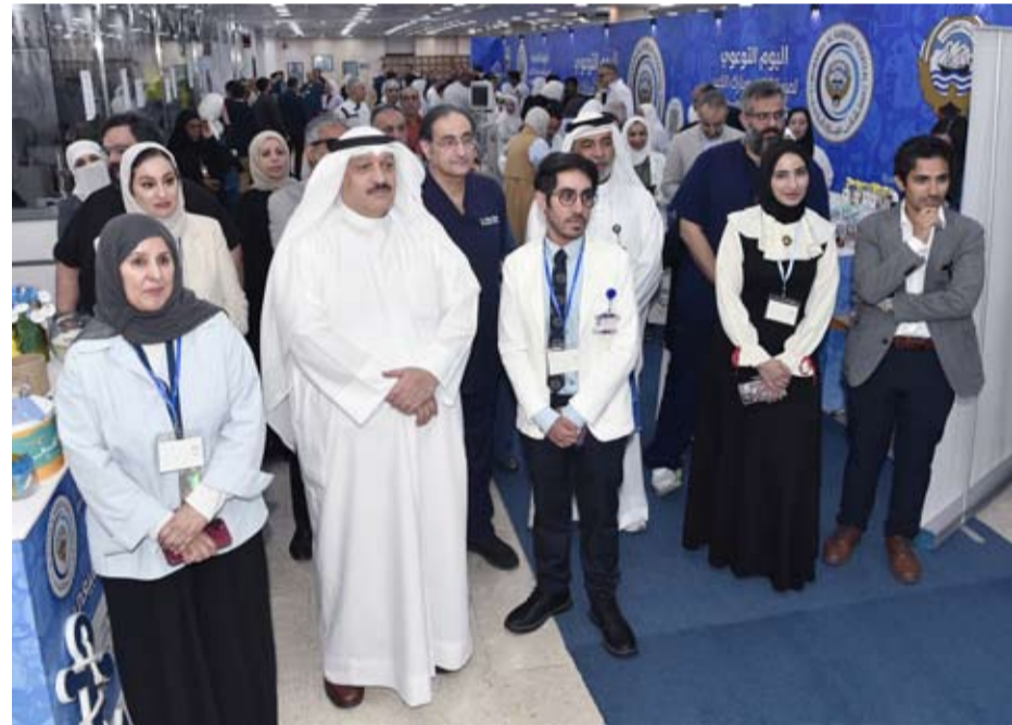
د. أحمد العوضي أثناء افتتاحه لليوم التوعوي

افتتح وزير الصحة الدكتور أحمد العوضي، أمس، اليوم التوعوي في مستشفى مبارك الكبير بمحافظة حوالى، الذي يهدف إلى نشر الوعي حول أمراض عدة لدى المرضى والمراجعين.