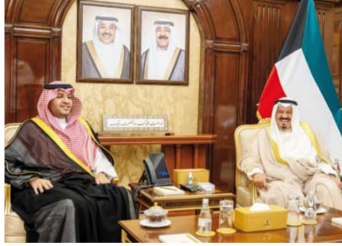
سمو الشيخ أحمد عبدالله يستقبل الأمير تركي بن محمد

خادم الحرمين الشريفين الملك سلمان بن عبدالعزيز ملك المملكة العربية السعودية الشقيقة وأخيه صاحب السمو الملكي الأمير محمد بن سلمان