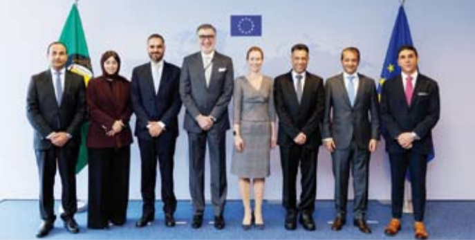
كايا كالاس مع سفراء دول مجلس التعاون الخليجي

التعاون لدول الخليج العربية بوصفها شركاء مؤثرين في المنطقة مؤكدا حرص الاتحاد على تعزيز التعاون في المجالات ذات الأولوية ولا سيما الأمن البحري وحماية حرية الملاحة في الممرات البحرية الدولية بما في ذلك مضيق (هرمز). كما أكدت كالاس تمسك الاتحاد الأوروبي بموقفه الراض لفرص أي رسوم أو إجراءات مستحدثة على حركة الملاحة مضيق (هرمز) مشددة على أهمية الحفاظ على استباكية التجارة العالمية وأمن الممرات البحرية.