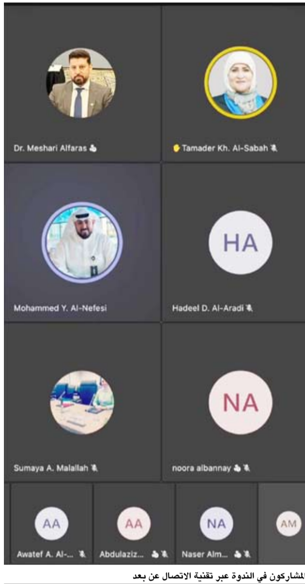
المشاركون في الندوة عبر تقنية الاتصال عن بعد

تعد أداة استراتيجية لتقييم المخاطر، وقياس حجم الخسائر، وتحديد الأولويات، وتوجيه الاستثمارات نحو الحد من مخاطر الكوارث وتعزيز الجاهزية المؤسسية. وأشار إلى نظام بيانات الخسائر الوطنية (DesInventar) باعتباره أحد أهم الأنظمة العالمية المستخدمة في توثيق خسائر الكوارث، مؤكداً أنه مطبق حالياً في أكثر من 112 دولة، ويتيح إنشاء قاعدة بيانات وطنية موحدة تسهم في توثيق الأحداث وتحليل آثارها الاقتصادية والاجتماعية والبيئية.