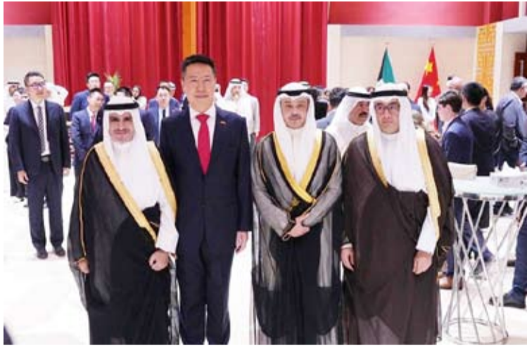
السفير الصيني متوسلاً ساعدي وزير الخارجية لشؤون آسيا وشؤون المنظمات الدولية ورئيس مجلس إدارة بنك بركان