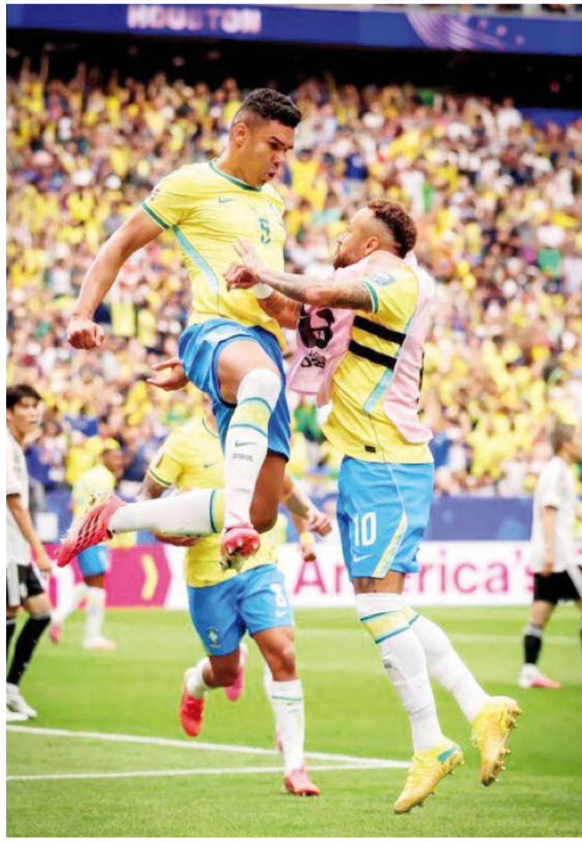
كاسيميرو يحتفل بالتسجيل مع نيمار

حصل كاسيميرو، لاعب وسط منتخب البرازيل، على جائزة رجل مباراة فريقه أمام اليابان، التي انتهت بفوز البرازيل 2-1 في دور الـ32 من كأس العالم لكرة القدم في أميركا والمكسيك وكندا. وسجل كاسيميرو هدف