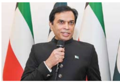
السفير الباكستاني متحدثاً

◆ 100 ألف باكستاني يسهمون في دعم الاقتصاد والمجتمع الكويتي.