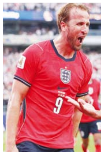
منتخب إنجلترا يبحث عن طريقة لاستعادة توهجه

فازت في المواجهتين السابقتين. وسمع فوز عريض في الجولة الثالثة لبلجيكا بحجز صدارة المجموعة الخامنة، وبالتالي الحصول على مواجهة بساتال أمام السنغال التي تاهلت بوصفها أحد أفضل المنتخبات صاحبة المركز الثالث. ونجت بلجيكا من الإقصاء في مباراتها الأخيرة بدور المجموعات بعدما استهلّت النهائيات بتعادلين مخيبين، لكنها أصبحت في نهاية المطاف أول منتخب أوروبي منذ إنجلترا عام 1990، يتصدر مجموعته رغم إيقافه في تحقيق الفوز في أول مبارائين، كما حققت أكبر انتصار لها في تاريخ النهائيات عندما تغلّت على نيوزيلندا 5-1. وتمثل هذه الأهداف الخمسة أكثر مما سجله «الشياطين الحمر» في مبارياتهم السبع السابقة في المونديال مجتمعاً، ما يؤكد أنهم بلغوا ذروة مستواهم في الوقت المناسب.