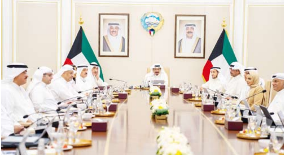
العدالله يترأس اجتماع مجلس الوزراء أمس

بمستجدات الأوضاع في منطقة الشرق الأوسط واستعراض كافة المساعي والجهود التي تسهم في تعزيز أمنها واستقرارها. بفحوى لقاء سمو ولي العهد الشيخ صباح خالد الحمد الصباح مع وزير خارجية الولايات المتحدة الأمريكية الصديقة ماركو روبيو بمناسبة زيارته الرسمية إلى البلاد حيث تم خلال اللقاء استعراض العلاقات التاريخية الراضية التي تجمع البلدين والشعبين الصديقين بالإضافة إلى بحث آخر المستجدات في منطقة الشرق الأوسط والتأكيد على دعم كافة الجهود للحفاظ على أمن واستقرار المنطقة.