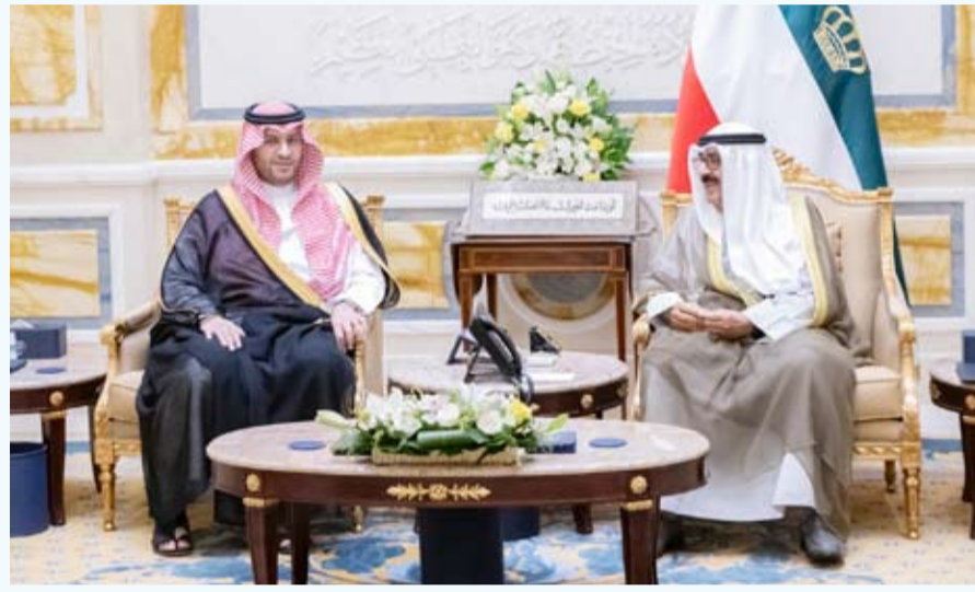
صاحب السمو الأمير مستقبلاً سمو الأمير تركي بن محمد

استقبل صاحب السمو أمير البلاد الشيخ مشعل أحمد أمس صاحب السمو الملكي الأمير تركي بن محمد بن فهد بن عبدالعزيز آل سعود وزير الدولة عضو مجلس الوزراء بالملكة العربية السعودية الشقيقة والوفد المرافق.