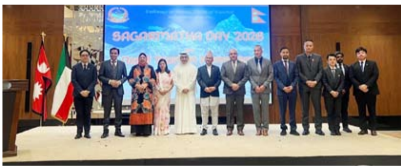
السفير ظفر إقبال متوسلاً عدد من الدبلوماسيين