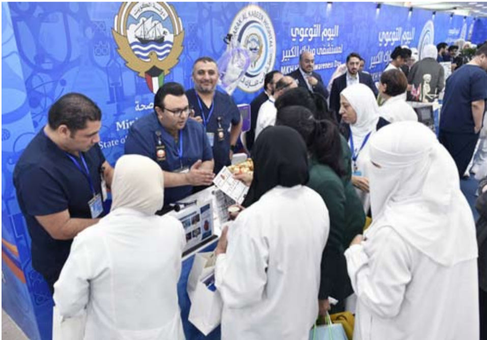
جانب من اليوم التوعوي في مستشفى مبارك الكبير