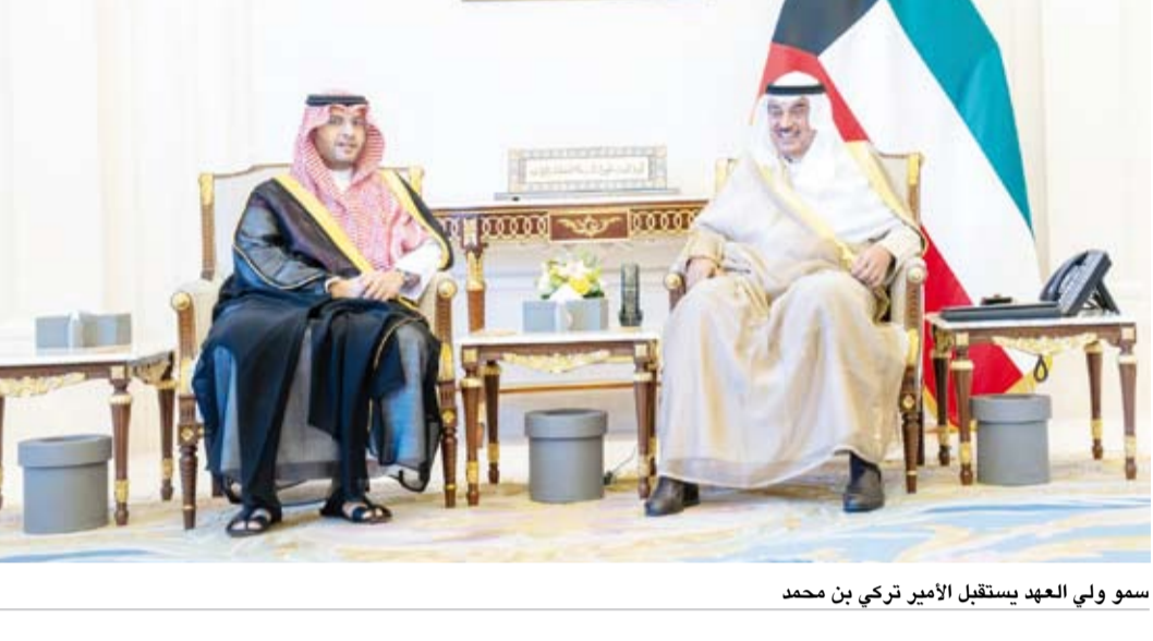
سمو ولي العهد يستقبل الأمير تركي بن محمد

ناصر الجابر رئيس ديوان سمو ولي العهد، وصاحب السمو الأمير سلطان بن سعد عميد السلك الدبلوماسي سفير خادم الحرمين الشريفين لدى دولة الكويت وكبار المسؤولين في الديوان. من جهة أخرى، بعث سمو ولي العهد الشيخ صباح الخالد، ببرقية تهنئة إلى الرئيس فيليكس تشيسيكدي رئيس جمهورية الكونغو الديمقراطية الصديقة ضمنها سموه خالص تهانيه بمناسبة ذكرى الاستقلال لبلادها وراجياً لفخامته دوام الصحة والعافية.