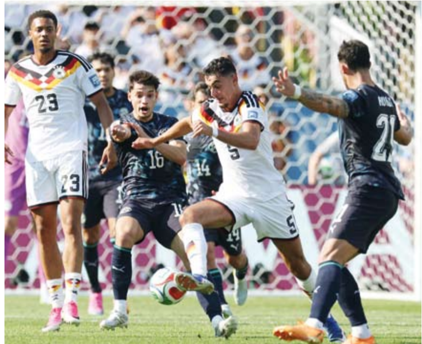
أداء مخيب لمنتخب ألمانيا في المونديال

تاه، في ظلّ تألق الحارس أورلاندو خيل، بينما أضع من الجانب الآخر البديلان أنتونيو سانابريا وفابيان بالويونا. وسجلّ خوسيه كانالي ركلة الترجيح الحاسمة في أول جولة من الركلات المفاجئة، بينما لعب الحارس أورلاندو خيل دور البطولة بتصديه لركلتين حاسمتين، ليقود منتخب بلاده إلى إنجاز تاريخي. وتقدّمت باراغواي في أواخر الشوط الأول عبر رأسية خوليو إنسيسيو، قبل أن يعادل كاي هافيرتز النتيجة لألمانيا في الدقيقة 54، لتستمر المباراة إلى وقت إضافي، ثم إلى ركلات الترجيح.