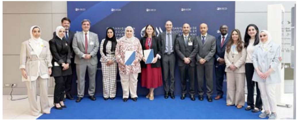
جانب من مشاركة هيئة أسواق المال

والصناعة ووحدة التحريات المالية، حيث عُقد الاجتماع في العاصمة الفرنسية باريس خلال الفترة من 22 إلى 26 يونيو 2026، في إطار تنفيذ بروتوكول التعاون بين وزارة المالية والجهات الرقابية وتطبيق توصيات المنتدى العالمي للشفافية.