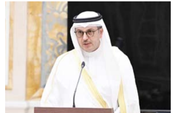
وزير الكهرباء الدكتور صبيح المخيزيم

شارك وزير الكهرباء والماء والطاقة المتجددة الدكتور صبيح عبدالعزيز المخيزيم، أمس، في الاجتماع الاستثنائي للجنة التعاون الكهربائي والمائي بدول مجلس التعاون لدول الخليج العربية، والذي عُقد عبر تقنية الاتصال المرئي، للاطلاع على قرار المجلس الأعلى في اللقاء التشاوري التاسع عشر لأصحاب الجلالة والسمو قادة دول مجلس التعاون، المنعقد في مدينة جدة بالملكة العربية السعودية بتاريخ 28 أبريل 2026، حول "إمكانية بناء مشاريع الربط المائي بين دول المجلس".