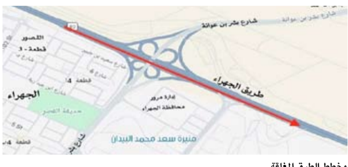
مخطط الطرق المغلقة

وأضافت أن أعمال الصيانة ستشمل كذلك إغلاق الحارة اليمنى والحارة الوسطى على طريق الدائري السادس باتجاه المسيلة، إلى جانب إغلاق مخرج طريق العبدلي المؤدي إلى الدائري السادس، وكذلك مخرج طريق الجهراء المؤدي إلى الدائري السادس باتجاه المسيلة، وذلك اعتباراً من يوم أمس الثلاثاء وحتى الانتهاء من أعمال الصيانة. ودعت الإدارة مرئادي الطرق إلى الالتزام بالإرشادات المرورية والانتباه إلى التحذيرات المؤقتة، حفاظاً على انسيابية الحركة وسلامة مستخدمي الطريق.