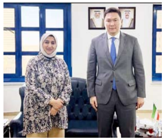
مدير عام الجهاز المركزي لتكنولوجيا المعلومات بالتلف مع سفير كازاخستان

بحثت مدير عام الجهاز المركزي لتكنولوجيا المعلومات بالتلف مع سفير جمهورية كازاخستان لدى دولة الكويت بيجان إيليكيف، سبل تعزيز التعاون وتبادل الخبرات في مجالات التحول الرقمي والحكومة الرقمية والذكاء الاصطناعي، كما استعرض الجانبان تجارب ومبادرات البلدين بما يدعم تبادل المعرفة ومواءمة التطورات الرقمية العالمية.