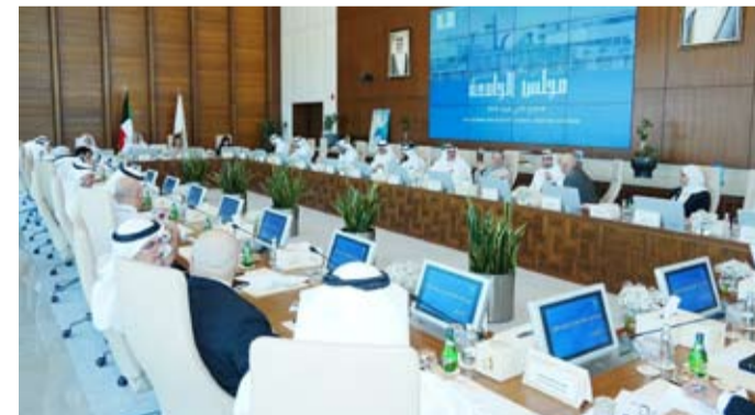
جانب من اجتماع مجلس جامعة الكويت

وأضاف أن المجلس اعتمد كذلك ترقية 23 عضواً من أعضاء الهيئة الأكاديمية في عدد من الكليات العملية والإنسانية والاجتماعية إلى درجتي أستاذ وأستاذ مشارك.