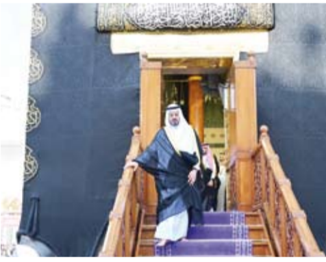
نائب أمير منطقة مكة المكرمة خلال غسل الكعبة المشرفة

لخادم الحرمين الشريفين الملك سلمان بن عبدالعزيز، وولي عهده الأمين، مؤكدة أنها سخرت إمكانياتها التقنية والخدمية والبشرية لمناسبة غسل الكعبة المشرفة مدعومة بالكوادر الفنية والهندسية لد سلم العرين.