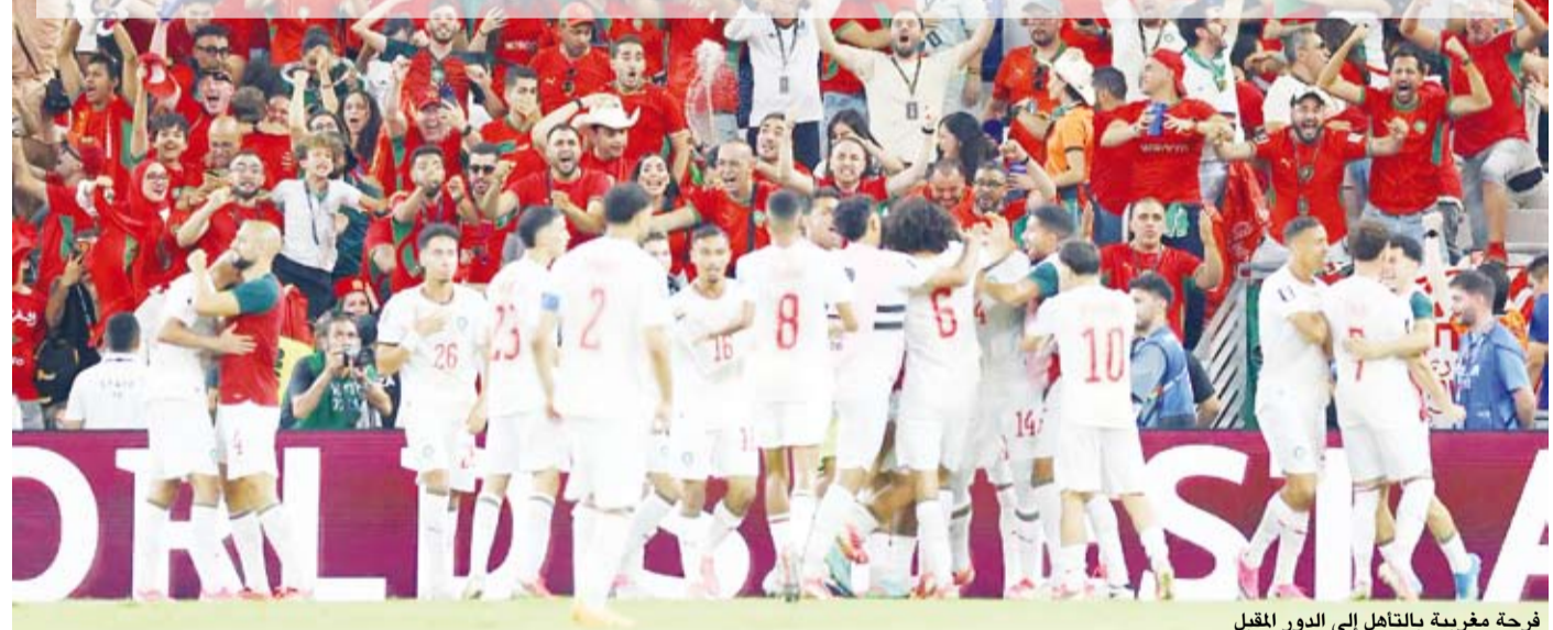
فرحة مغربية بالتأهل إلى الدور المقبل

أطاح المنتخب المغربي، رابع النسخة الأخيرة، بنظيره الهولندي وبلغ ثمن النهائي عندما تغلب عليه 3-2 بركلات الترجيح بعد تعادلهما 1-1 في الوقتين الأصلي والإضافي، في مدينة مونتيري المكسيكية في دور الـ32 لوندبال أميركا الشمالية في كرة القدم. وتصدى الحارس ياسين بونو للركلة الترجيحية الخامسة لكريستيانو سافريل، قبل أن يسدّد إسماعيل صيباري، هدف الفريق في النسخة الحالية.