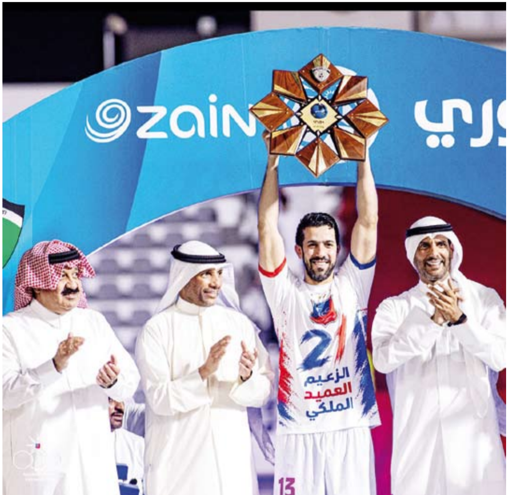
الكويت يتوج بدوري زين للمرة الخامسة على التوالي

ومع ختام بطولة الدوري حسمت المقاعد المؤهلة إلى البطولات الخارجية الموسم المقبل بعدما تصدر الكويت الترتيب بـ53 نقطة تلاه العربي ثانياً بـ39 نقطة بفارق الأهداف عن القادسية الثالث ثم كاظمة رابعاً بـ38 نقطة والسالمية خامساً بـ37 نقطة وأخيراً الفحيحيل سادساً بـ22 نقطة.