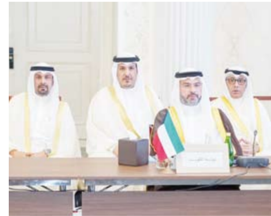
رئيس الهيئة العامة للطيران المدني يترأس وفد الكويت

عن خالص التهاني والتمنيات له بالتوفيق في تحقيق الأهداف الاستراتيجية للمنظمة.