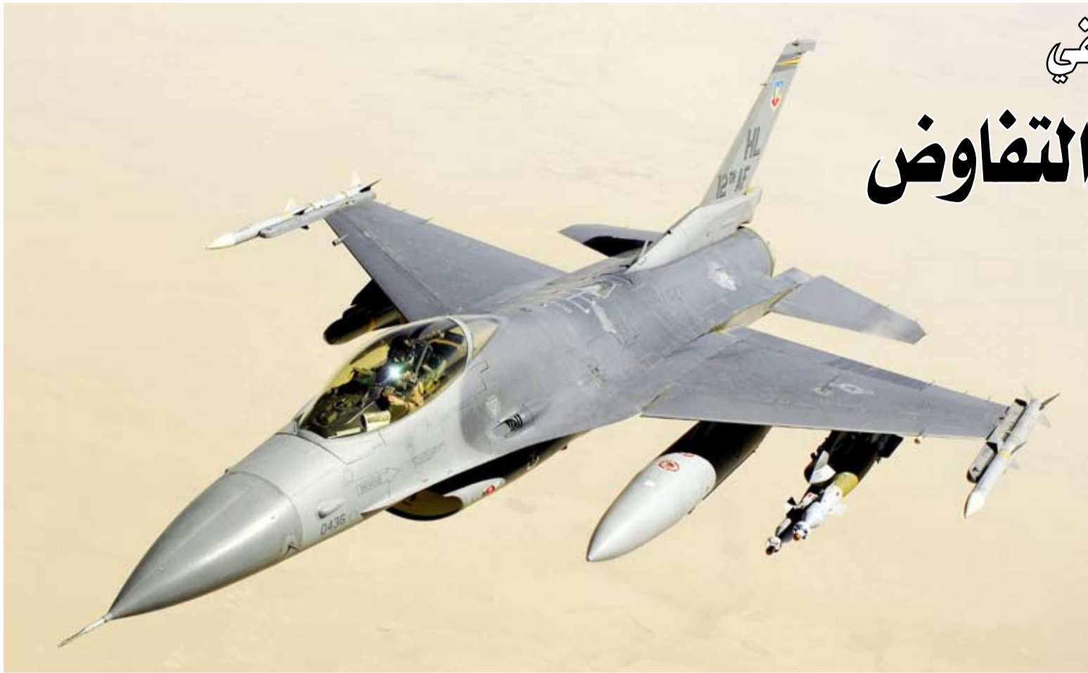
مقاتلة أميركية من طراز «إف - 16»

أكد الرئيس التركي، رجب طيب أردوغان، أن الحفاظ على قدرة «حلف شمال الأطلسي (ناتو)» على الردع، وتعزيز تضامن الدول الحليفة، باتا أهم من أي وقت مضى في ظل الأزمات الإقليمية والدولية الراهنة. ودعا أردوغان «الحلف» إلى إنشاء شبكة للأمن والدفاع تمتد من مدينة تكساس الأميركية إلى العاصمة التركية أنقرة، «دون أي شروط أو تحفظات».