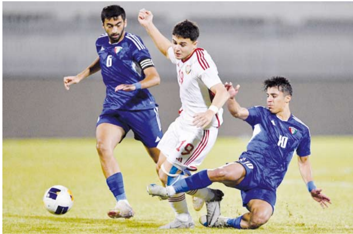
التعادل مع الإمارات غير كاف للتأهل

وتأهل منتخب كوريا الجنوبية إلى النهائيات كمصنوع للمجموعة بعد فوزه على لبنان اليوم ووصوله إلى النقطة الـ 12 فيما بقي لبنان على نقاطه الثلاث وجزر مريانا الشمالية دون رصيد من النقاط. وتأهلت منتخبات سوريا واندونيسيا وكوريا الجنوبية والسعودية وكوريا الشمالية وقطر والعراق واليابان وأوزبكستان وإيران واليمن وقيرغيزستان