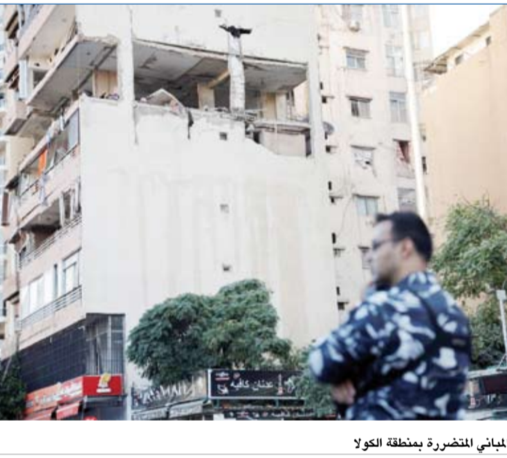
المباني المتضررة بمنطقة الكولا