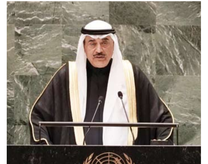
ممثل سمو الأمير سمو ولي العهد يلقي كلمة أمام الجمعية العامة للأمم المتحدة

ذات الصلة بالجانب الأمني والفني للممر الملاحي في خور عبدالله، وحضر ملف الانفتاح التنموي والاستثماري بقوة على جدول لقاءات الكويت، إذ أكد ممثل سمو أمير البلاد سمو ولي العهد صاحب السمو في تعزيز وجود الشركات العالمية بدولة الكويت ونقل خبراتها.