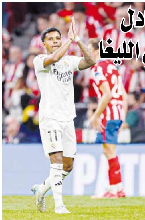
تعادل مخيب للملكي

فرض أتلتيكو مدريد التعادل على ضيفه ريال مدريد بنتيجة 1-1 ضمن منافسات الجولة الثامنة بالدوري الإسباني لكرة القدم. تقدم ريال مدريد بهدف سجله المدافع البرازيلي إيدير ميليتاو في الدقيقة 64. وأدرك أتلتيكو مدريد التعادل في الوقت بدل ضلعه أنخيل كوريا في الدقيقة الخامسة من الوقت بدل الضائع في الشوط الثاني، ليحصل كل فريق على نقطة. وفشل ريال مدريد في رد اعتباره بالخسارة بلعبه أندا مترو وبوليتانو معقل أتلتيكو مدريد مرتين في الموسم الماضي خلال مباراتين ببطلوتي الدوري وكأس ملك إسبانيا. بهذا التعادل فرط الريال في نقطتين ثمينتين ورفع رصيده إلى 18 نقطة في المركز الثاني، ولم يستغل سقوط المتصدر برشلونة 21 نقطة بالخسارة أمام أوساسونا في نفس الجولة، مساء السبت. وتفادى أتلتيكو مدريد خسارته الأولى هذا الموسم ليرفع رصيده إلى 16 نقطة في المركز الثالث.