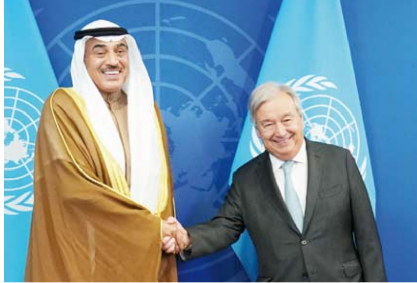
سمو ولي العهد يلتقي الأمين العام للأمم المتحدة