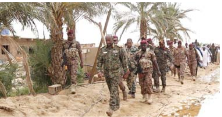
عبد الفتاح البرهان

نفي الجيش السوداني، أمس الاثنين، استهداف مقر السفير الإماراتي في الخرطوم. وأضاف الجيش السوداني، في بيان، أن قواته «لا تستهدف مقر البعثات الدبلوماسية أو مقار ومنشآت المنظمات الأممية أو الطوعية، ولا تتخذها قواعد عسكرية، ولا تنهب محتوياتها». وتابع: «إنما تقوم بتلك الأفعال الشائنة والجيابة ميليشيا متمردي آل دقلو الإرهابية، التي تدعمها لارتكاب تلك الأفعال دول معلومة للعالم، وتستمر في ارتكابها على مرأى