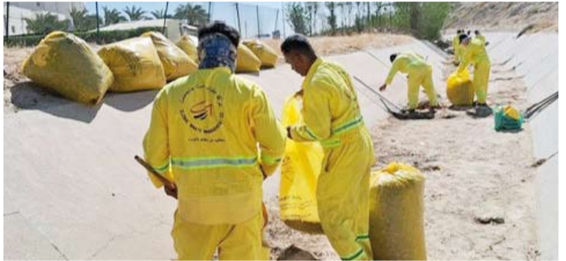
عمال البلدية ينظفون مجرى الأمطار