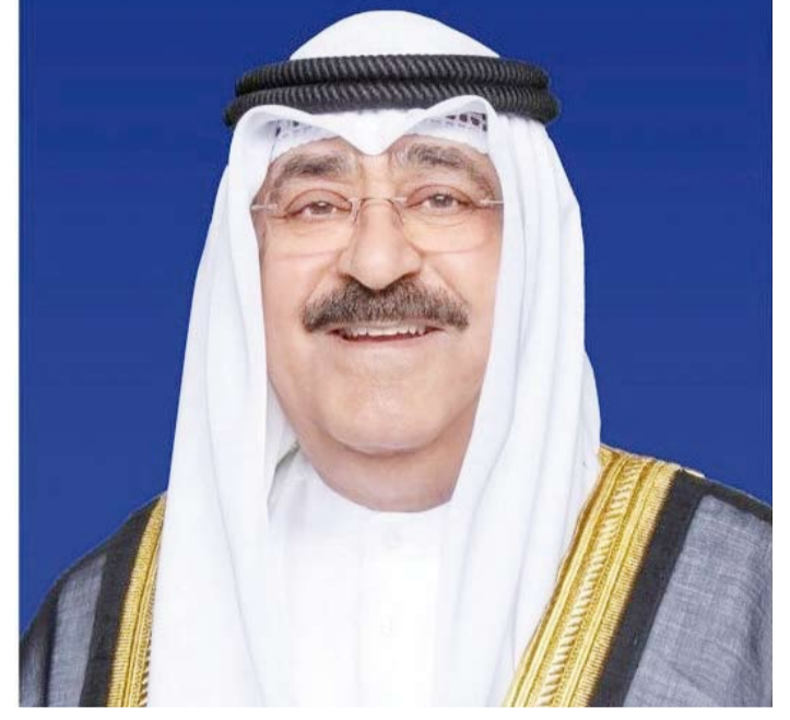
سمو أمير البلاد الشيخ مشعل الأحمد

بعث صاحب السمو أمير البلاد الشيخ مشعل الأحمد، ببرقية تهنئة إلى الرئيس الدكتور مكغوتيسي إريك ماسيسي رئيس جمهورية بوتسوانا الصديقة، عبر فيها سموه عن خالص تهانته بمناسبة العيد الوطني لبلادها. متمنياً سموه لرخايتها موفور الصحة والعافية ولجمهورية بوتسوانا وشعبها الصديق كل التقدم والازدهار.