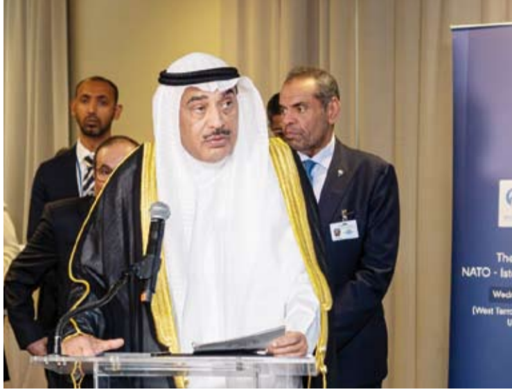
سمو ولي العهد الشيخ صباح الخالد أثناء إلقاء كلمته في ذكرى إطلاق مبادرة إسطنبول للتعاون