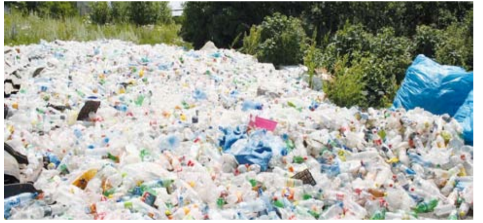
إعادة تدوير النفايات البلاستيكية

كبرى من الطين في منطقة تيومين يساعدنا على استخراج المواد المحفزة لعملية تحليل النفايات البلاستيكية، ما سيقلل من تكلفة إعادة تدوير هذه النفايات، مشيراً إلى إمكانية استخدام أنواع مختلفة من الطين مع تركيبات معدنية أخرى لاستخلاص المحفزات. يذكر أن علماء من جامعة "فيكتوريا" الروسية قد ابتكروا في يوليو الماضي، طريقة لإعادة تدوير النفايات الطبية البلاستيكية دون تكوين مواد سامة. ويمكن للتكنولوجيا المقترحة أن تصبح الأساس لمحطات حرق النفايات الجديدة الموفرة للطاقة.