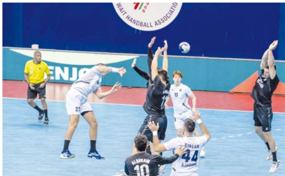
انطلاقة قوية لمنافسات كأس الاتحاد لكرة اليد

انطلقت منافسات النسخة المؤجلة من بطولة كأس الاتحاد الكويتي لكرة اليد موسم (2023 - 2024) بإقامة ثلاث مواجهات أقيمت جميعها على مجمع الشيخ سعد العبدالله للصالات المغطاة.