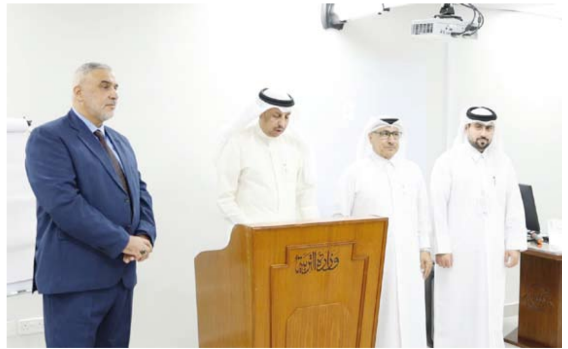
مدير إدارة التطوير والتنمية بوزارة التربية خلال البرنامج التدريبي

نظمت وزارة التربية، أمس، البرنامج التدريبي (استخدام المعايير المهنية لتحسين أداء المعلم في ضوء كفايات المستقبل) وذلك بالتعاون مع المركز العربي للتدريب التربوي لدول الخليج التابع لدولة قطر. وأشاد مدير إدارة التطوير