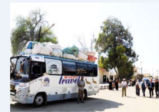
نازحون لبنانيون عن المعبر الحدودي

قال «المرصد السوري لحقوق الإنسان» إن الطيران الإسرائيلي قصف مبنى في محيط معبر بابوس بريف دمشق، عند الحدود السورية اللبنانية.