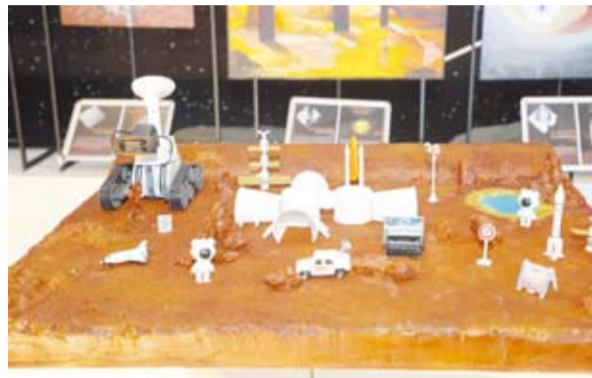
قطع فنية بصرية