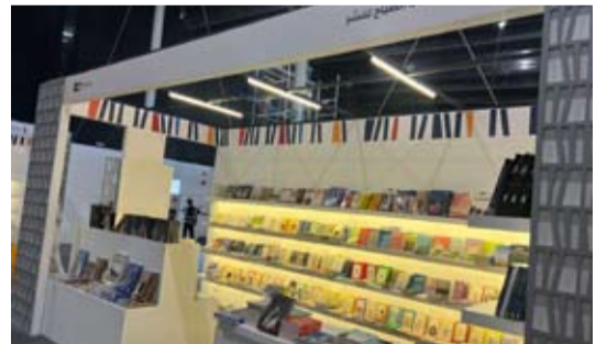
دار سعاد الصباح للنشر في معرض الرياض

ونُدوة «وصف الناقة في معلقة طرفة بن العبد»، فضلاً عن جلسات حول «الإبل ودورها في التاريخ والثقافة العربية»، و«حديث الإبل» بمشاركة نخبة من المهتمين بتربيتها، ولم ينس القائمون على المعرض القادمة الشعرية الأمير الراحل بدر بن عبدالمحسن، حيث تم تنظيم ممر تكريمي للفقيه تكريماً لمنجزه الأدبي والثقافي، وإسهامه