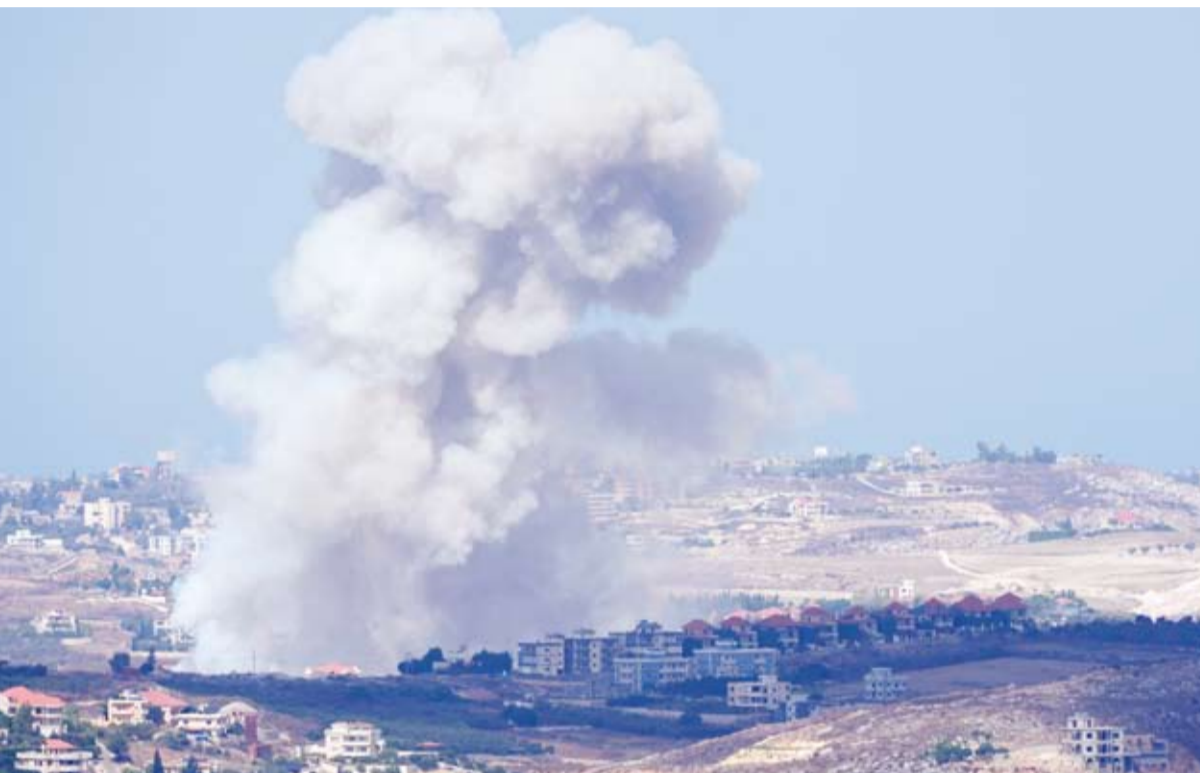
غارات متجددة على لبنان

قال شاهد لوكالة «رويترز»، أمس الاثنين، إن أعمدة الدخان تتصاعد في الضاحية الجنوبية لبيروت بعد ما يشتبه في أنها غارة إسرائيلية جديدة.