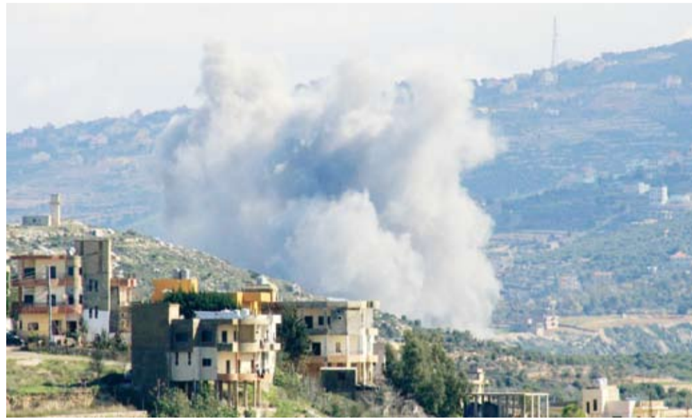
غزة إسرائيلية على بلدة بدياس جنوبي لبنان

الحركة الدبلوماسية التي يشهدها «لبنان» في محاولة لوقف عدوان الاحتلال الإسرائيلي تتواصل بوتيرة عالية. تجنّب لبنان مزيداً من الخسائر البشرية والمادية لا بد أن يكون أولوية الأولويات. الحكومة اللبنانية مطالبة بفرض قراراتها على جميع المناطق والمكونات اللبنانية، والجيش اللبناني يجب أن يبسط نفوذه على جميع الأراضي داخل البلاد، وجمع السلاح ليبقى في يده فقط، طالما أن الحكومة مستعدة لإرساله إلى جنوب نهر الليطاني، والقيام بمهامه كاملة بالتنسيق مع قوات حفظ السلام الدولية في الجنوب. حتى الله لبنان والمنطقة العربية وجنبتها الحروب والمتآسي والفتن.