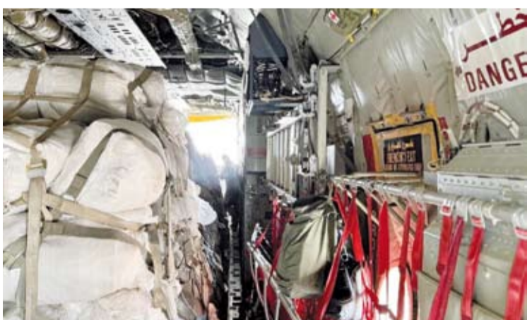
جانبا من الخيام الإيوائية داخل الطائرة