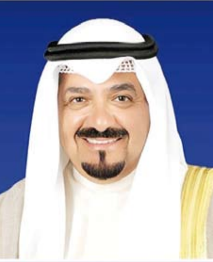
سمو الشيخ أحمد عبد الله

بعث سمو الشيخ أحمد عبدالله رئيس مجلس الوزراء، ببرقية تهنئة إلى الرئيس الدكتور مكغوتيسي إريك ماسيسي رئيس جمهورية بوتسوانا الصديقة بمناسبة العيد الوطني لبلادها.