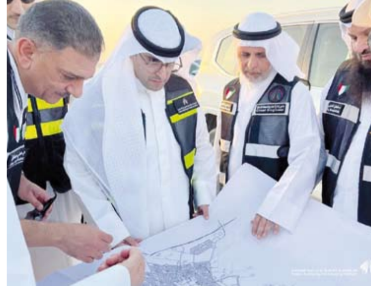
الوزير عبداللطيف المشاري خلال جولته التفتيشية

أكد وزير الدولة لشؤون الإسكان عبداللطيف المشاري العمل على تذليل العقبات وتجاوز أي معوقات تواجه مشروع جنوب مدينة سعد العبدالله الإسكاني بالتنسيق مع الجهات المعنية ذات الصلة لتسليم الأعمال وفق الجدول الزمني المحدد. جاء ذلك في بيان صحفي للمؤسسة العامة للرعاية السكنية نقلاً عن الوزير المشاري عقب تفقده، أمس، مشروع جنوب مدينة سعد العبدالله الإسكاني بحضور قياديي (السكنية).