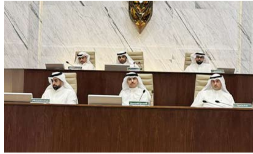
رئيس المجلس البلدي والجهاز التنفيذي

مراعاة تزيده بمرافق ترفيهية للعائلات والزوار، مما يجعله وجهة مفضلة للتنزه والاستجمام والتسوق. وذكرت أن المشروع يعكس رؤية الكويت نحو تطوير المناطق التاريخية والمحافظ على الإرث الثقافي وتعزيز السياحة الداخلية وجذب الزوار من داخل البلاد وخارجها.