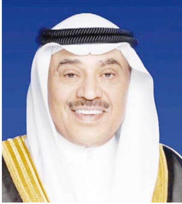
سمو ولي العهد الشيخ صباح الخالد

بعث سمو ولي العهد الشيخ صباح الخالد، ببرقية تهنئة إلى الرئيس الدكتور مكغوتيسي إريك ماسيسي رئيس جمهورية بوتسوانا الصديقة، ضمنها سموه خالص تهانته بمناسبة العيد الوطني لبلادها وراجياً لرخايتها دوام الصحة والعافية.