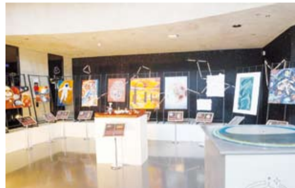
أعمال فنية مطبوعة امن وكالة "ناسا"