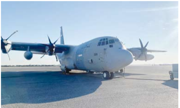
الطائرة الإغاثية الـ 14 من الجسر الجوي الكويتي

أقلعت يوم أمس، الطائرة الإغاثية الـ 14 ضمن الجسر الجوي الكويتي متجهة إلى مطار (بوروتسودان) وعلى متنها 10 أطنان من الخيام بتنظيم الجمعية الكويتية للإغاثة لإيواء النازحين إثر الأمطار والفيضانات والزاعات المستمرة في السودان.