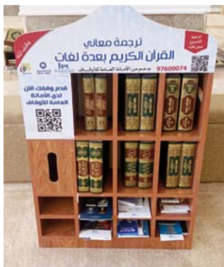
إحدى مكتبات المصاحف المترجمة التي تم توزيعها على المساجد

مصحفاً بـ6 لغات في (الإنجليزية والأوردو والنيبالية والتاميلية والهندية والبنغالية)، لتكون بذلك من أعظم الوسائل لإفهامهم القرآن الكريم بترجمة معانيه. وأضاف أن المكتبة ستضم إلى جانب ترجمة معاني القرآن، مجموعة كتبيات تتعلق بآداب المسجد والطهارة والأذكار، لتكون زائداً للمصلين الذين يكون في أمس الحاجة لمثل هذه الكتبيات بلغاتهم. واختتم الكندي، بتجديد الشكر للأمانة العامة للأوقاف، على دعمها المتواصل لمشاريع اللجنة، لتعريف ضيوف الكويت بالإسلام، ورعاية الجاليات المسلمة والمهتدين الجدد.