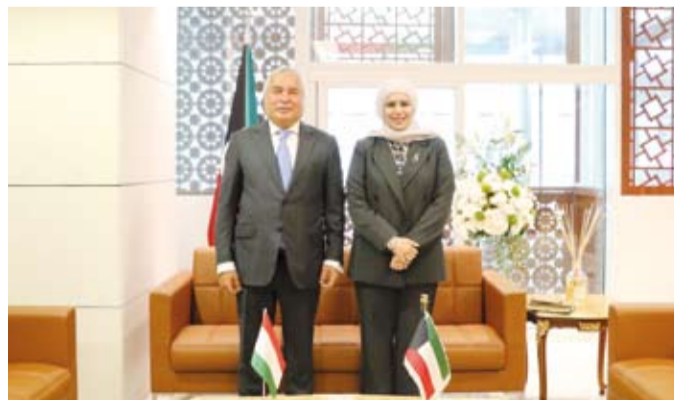
لقاء الفصام مع سفير طاجيكستان

في دولة الكويت، ودعوة الشركات الاستثمارية والبنوك لتبادل الخبرات وتطوير العلاقات الثنائية بين البلدين الصديقين. كما تم التأكيد على أهمية دور القطاع الخاص وتهيئة المناخ الاستثماري لمجتمع الأعمال في استكشاف الفرص التجارية والاستثمارية المحتملة.