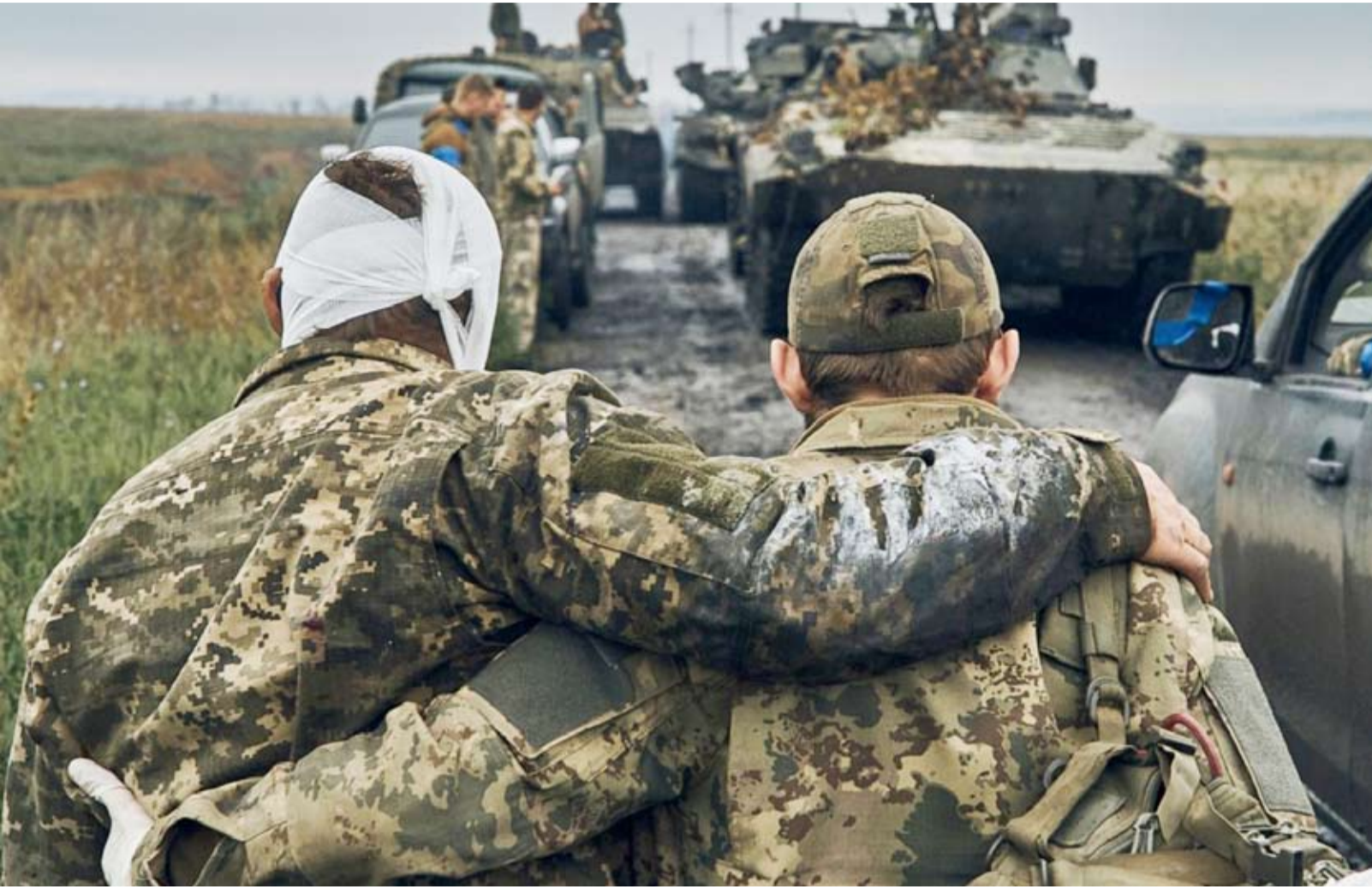
مصابون في حرب روسيا وأوكرانيا

من إعادة توجيه صاراتها من الطاقة نحو الأسواق الآسيوية الضخمة (كالصين والهند)، وتكييف قاعدتها الصناعية لتلبية احتياجات الجهد الحربي، مما وفر للكرملين شريان حياة مالياً وعسكرياً يضمن استدامة العمليات.