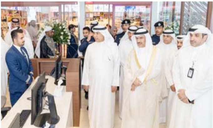
جولة في أرجاء المكتب الجديد في «الجهراء مول»