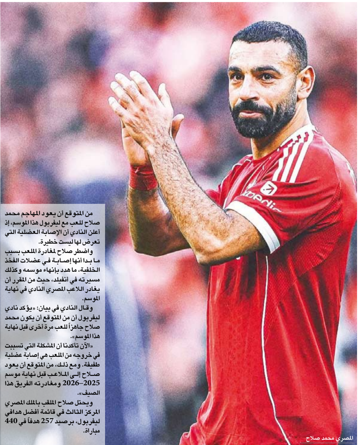
المصري محمد صلاح

من المتوقع أن يعود المهاجم محمد صلاح للعب مع ليفربول هذا الموسم، إذ أعلن النادي أن الإصابة العضلية التي تعرض لها ليست خطيرة. واضطر صلاح لمغادرة الملعب بسبب ما بدا أنها إصابة في عضلات الفخذ الخلفية، ما مهد بإنهاء موسمه وكذلك مسيرته في أتقيلد، حيث من المقرر أن يغادر اللاعب المصري النادي في نهاية الموسم.