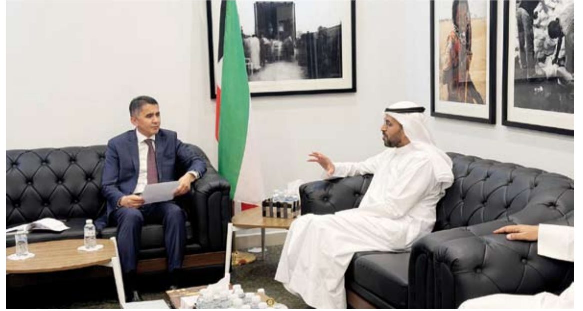
سعد العتيبي مستقبلاً سفير أوزبكستان أيوب خان يونسوف