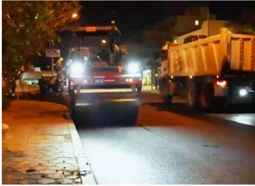
جانب من فرش الإسفلت

في جولة ميدانية تؤكد نهج المتابعة المباشرة وتعزيز كفاءة الأداء، قامت وزيرة الأشغال العامة الدكتورة نورة محمد المشعان بجولة تفقدية في محافظة العاصمة، للاطلاع على سير أعمال المشاريع الحيوية التي تنفذها الوزارة. وشملت الجولة عدداً من مواقع العمل، حيث تابعت الوزيرة ميدانياً نسب الإنجاز، ووقفت على أبرز التحديات التي تواجه فرق التنفيذ، مشددة على ضرورة تسريع وتيرة العمل والالتزام بالجدول الزمني المحددة، مع تطبيق أعلى معايير الجودة والسلامة. وأكدت المشعان خلال الجولة أن الوزارة مستمرة في تنفيذ خططها التنموية وفق رؤية واضحة تستهدف تطوير البنية التحتية ورفع كفاءتها، بما يلبي احتياجات المواطنين والمقيمين، مشيرة إلى أن الجولات الميدانية تأتي ضمن سياسة المتابعة المستمرة لضمان جودة التنفيذ ومعالجة أي معوقات بشكل فوري. وأضافت أن المرحلة الحالية تتطلب تكثيف الجهود والتنسيق بين مختلف الجهات المعنية، لضمان إنجاز المشاريع وفق أعلى المواصفات الفنية، وبما يعكس التزام الوزارة بتقديم خدمات مستدامة تعزز جودة الحياة. واختتمت الوزيرة جولتها بالتأكيد على أهمية العمل بروح الفريق الواحد، ومواصلة الجهود لتحقيق الأهداف التنموية المنشودة، بما يواكب تطلعات الدولة في تطوير البنية التحتية.