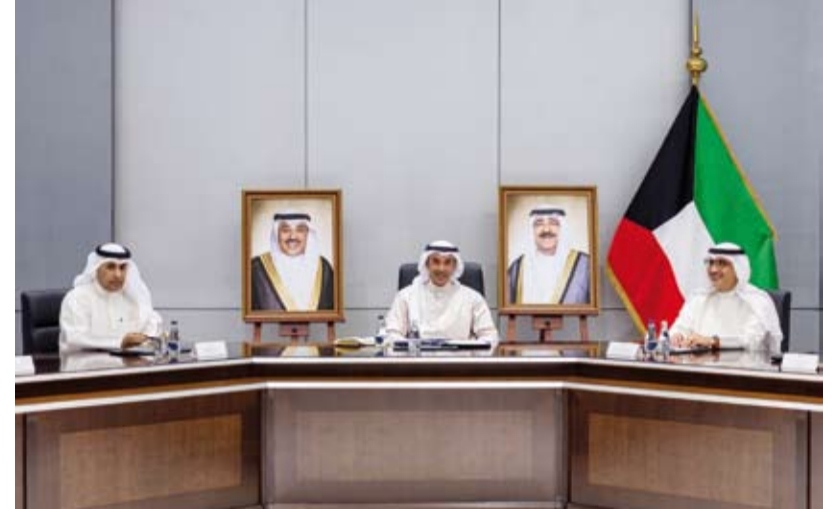
حمد المشعان مترأساً الاجتماع

ترأس نائب وزير الخارجية السفير حمد المشعان، أمس، اجتماعاً لمجلس السلكين الدبلوماسي والقنصلي في ديوان عام الوزارة بمشاركة مساعي وزير الخارجية أعضاء المجلس. وتحدث (الخارجية) في بيان لها، أنه تم خلال الاجتماع بحث عدد من الموضوعات على جدول الأعمال.