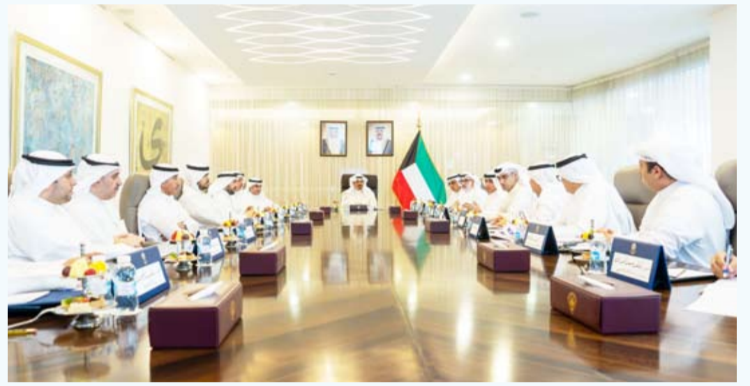
رئيس الوزراء تراس اجتماعاً بشأن ملاحظات ومتطلبات مجموعة العمل المالي «فاتف»

والتابعة بين الجهات الحكومية المختصة بما يكفل الالتزام بمنظومة مكافحة غسل الأموال وتمويل الإرهاب ويعكس نهج العمل المؤسسي المشترك في التعامل مع هذا الملف الحيوي، كما يجسد في