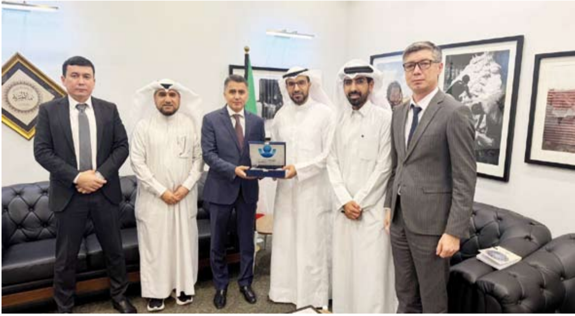
تقديم درع تذكارية لسفير أوزبكستان