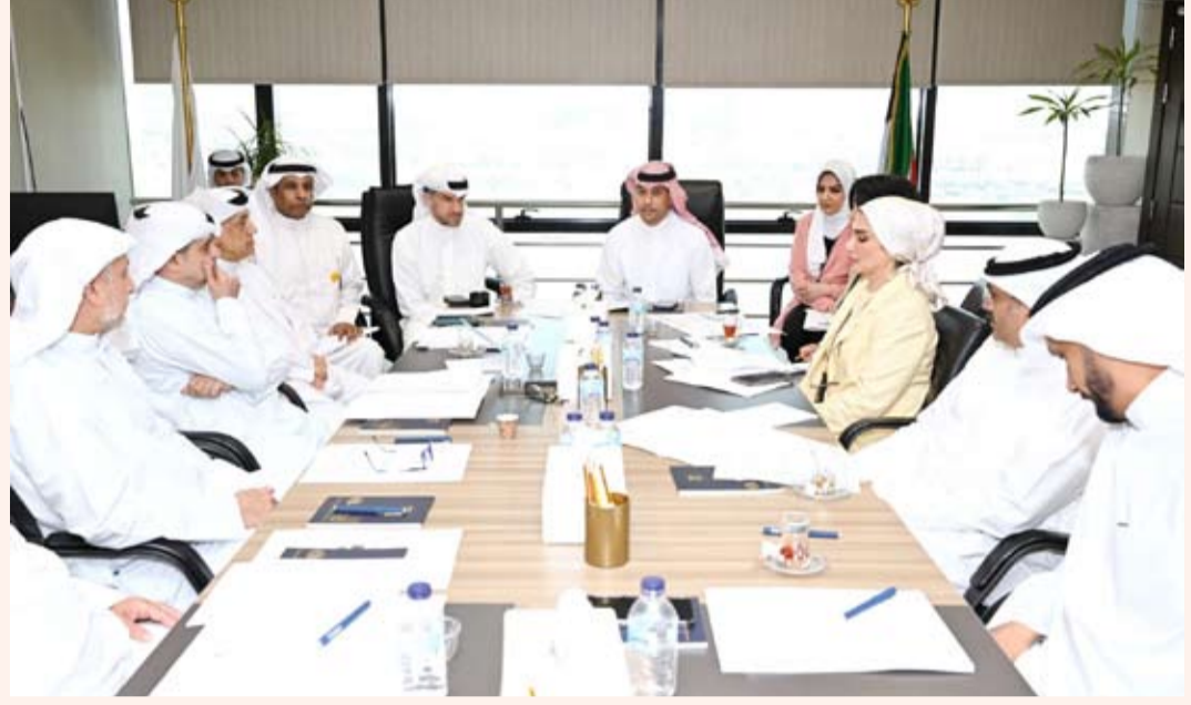
د. طارق الجلامه يترأس اجتماع مسؤولي (هيئة الرياضة) و(التطبيقي)

ترأسه وزير الدولة لشؤون الشباب والرياضة الدكتور طارق الجلامه أليات تصميم برامج دراسية متطورة تلبي احتياجات سوق العمل مع التركيز على الجوانب التطبيقية والتدريب الميداني. وأكدت على أهمية مواءمة مخرجات التعليم مع متطلبات التنمية من خلال تأهيل كفاءات ماهرة تدعم تطوير المنظومة