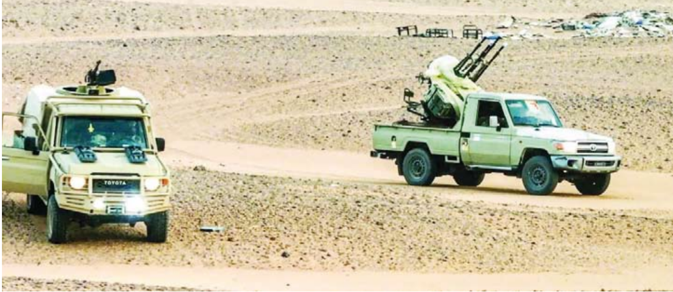
دورية على الحدود الليبية

من دون إبطاء. وتراقب فرنسا عن بعد ما يجري في مستعمرتها السابقة، ومع ذلك فالحكومة الفرنسية ليست مستعدة لاتخاذ النظام الذي أخرجها من مالي رغم الخوف من تمدد التمرد إلى دول في غرب أفريقيا قريبة جداً من فرنسا، مثل السنغال وساحل العاج.