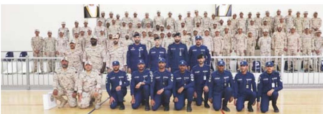
جانب من قوة الإطفاء المشاركة

العام ووزارة الدفاع لتطوير القدرات الميدانية وتعزيز التنسيق بين جهات الدولة بما يحقق أعلى مستويات الكفاءة. من جهة أخرى سيطرت فرقة إطفاء مركزي المنقف و الفحيحيل عصر امس على حريق شقة في عمارة بمنطقة المهجولة حيث تم مكافحة الحريق والسيطرة عليه، ولم يسفر الحادث عن أي إصابات تذكر، وتم تسليم الموقع إلى الجهات المختصة.