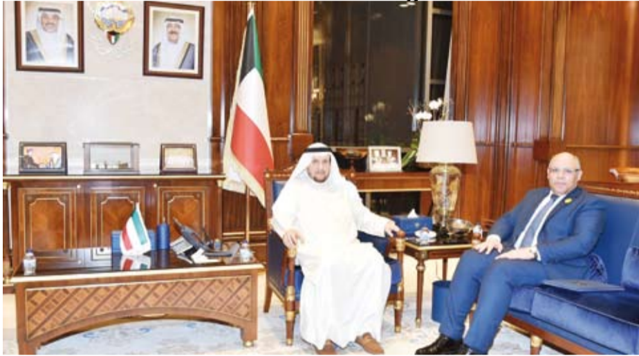
نائب رئيس مجلس الوزراء وزير الدولة لشؤون مجلس الوزراء شريده المعوشي يستقبل سفير مصر محمد أبو الوفا

بحث نائب رئيس مجلس الوزراء وزير الدولة لشؤون مجلس الوزراء المعوشي مع سفير جمهورية مصر العربية لدى دولة الكويت محمد أبو الوفا، سبل تعزيز العلاقات الثنائية الكويتية - المصرية في مختلف المجالات إضافة إلى عدد من الموضوعات ذات الاهتمام المشترك. وذكر مكتب وزير الدولة لشؤون مجلس الوزراء في بيان، أمس، أن ذلك جاء خلال استقبال الوزير المعوشي للسفير أبو الوفا في قصر السيف بحضور نائبة السفير المصري نورا عبد الهادي. ولقت البيان إلى أن عمق العلاقات التي تربط دولة الكويت بجمهورية مصر العربية وحرص دولة الكويت على استمرار التنسيق المشترك بين البلدين بما يساهم في تعزيز التعاون الثنائي الاستراتيجي. من جهة أعرب السفير أبو الوفا عن اعترازه بمناخ العلاقات الاخوية بين دولة الكويت وجمهورية مصر العربية، مؤكداً أهمية التنسيق الوثيق بين البلدين في مواجهة التحديات الراهنة.