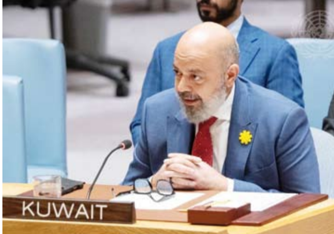
المنوب الدائم لدولة الكويت لدى الأمم المتحدة السفير طارق البنائي

التصعيد على أمنها وسيادتها ومنشأتها الحيوية. وأشار إلى أن الاعتداءات الإيرانية السافرة جزء من نهج خطر يقوم على توسيع نطاق التهديد من البر إلى البحر ومن المنشآت المدنية إلى الممرات الدولية ومن أمن الدول إلى أمن الاقتصاد العالمي. وشدد على أن أمن دول مجلس التعاون الخليجي "كل لا يتجزأ"، وأن أي اعتداء على سيادة أي دولة من هذا الكيان أو على منشآته الحيوية أو على ممراته البحرية هو مساس بأمن المنطقة بأكملها. وجدد البنائي التأكيد على موقف الكويت المنسجم مع الموقف الخليجي الموحد المستند إلى التمسك بالقانون الدولي واحترام سيادة الدول وحسن الجوار ورفض التدخل في الشؤون الداخلية والاحتكام إلى الحوار والدبلوماسية.