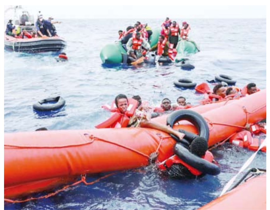
مهاجرون تم إنقاذهم من الموت

أفادت جمعية الهلال الأحمر الليبي ومصادر أمنية، بانتشال ما لا يقل عن 17 جثة لمهاجرين وفقدان تسعة آخرين فيما تم إنقاذ سبعة بعد تعطل قاربهم وتقطع السبل بهم وسط البحر لمدة ثمانية أيام.