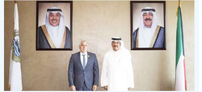
وزير التربية يستقبل السفير اللبناني

خلال اللقاء عدداً من الموضوعات ذات الاهتمام المشترك لاسيما التعليمي، وذلك في إطار حرص الجانبين على توطيد الشراكة الثنائية وتعزيز مجالات التعاون بما يخدم الأهداف التعليمية والثقافية بين البلدين الشقيقين.