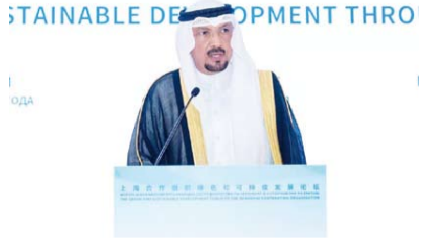
السفير جاسم الناجم متحدثاً في المنتدى