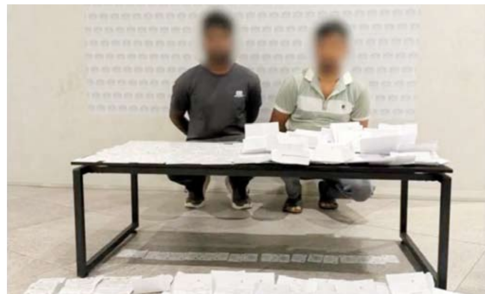
المتهمان مع كروت تعبئة المياه المدعومة

تمكنت الإدارة العامة للمباحث الجنائية ممثلة بإدارة مكافحة جرائم التزوير ومن ضبط 3 أشخاص من جنسية آسيوية، أحدهم صادر بحقه أمر الإلقاء القبض بتهمة التزوير. وكانت قد وردت معلومات تفيد بقيام المذكورين بالاتجار غير المشروع بكروت تعبئة المياه الصادرة من وزارة الكهرباء والماء حيث تم التأكد من صحة المعلومات وبعد اتخاذ الإجراءات القانونية اللازمة، تم ضبطهم وبحوزتهم عدد 250 كرت تعبئة مياه، وعدد كبير من قوالب التحصيل، بالإضافة إلى قوالب بنكية. وتبين أن المتهمين يقومون ببيع كروت تعبئة المياه المدي التي يتم صرفها للأفراد والشركات المألحة لصهاريج المياه "التناكر" لاستخدامها في احتياجاتهم الخاصة، حيث إن هذه المياه مدعومة من الدولة وغير مخصصة للبيع. وقد تم اتخاذ الإجراءات القانونية اللازمة بحق المتهمين، وإحالتهم إلى جهة الاختصاص، لاستكمال التحقيقات واتخاذ ما يلزم بحقهم.