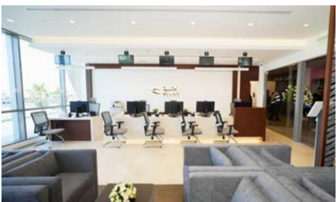
مكتب شركة الخطوط الجوية الكويتية

ويومي الجمعة والسبت من الساعة 3 عصراً وحتى 10 مساءً. ويأتي تدشين المكتب الجديد لمبيعات التذاكر لشركة الخطوط الجوية الكويتية بمجمع (الجهراء مول) جودة الخدمات وتلبية احتياجات المسافرين من مختلف المناطق في دولة الكويت. وتمتلك (الكويتية) عدة مكاتب مبيعات ضمن مناطق مختلفة في البلاد وذلك بكل من ضاحية صباح السالم ومنطقة الفروانية ومجمع الأفنيوز التجاري ومجمع العاصمة مول التجاري ومبنى (الركاب T4) ومبنى مجمع الوزارات.