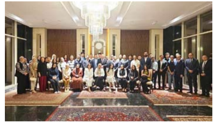
السفير المصري متوسطا الحضور

أطلقتها الدولة لشباب المصريين بالخارج ومنها مسابقة "من مصر للعالم"، ومسابقة "مصر بعيون شبابها"، ومؤتمر "مصر تستطيع" ومبادرة "تكلم عربي" وغيرها. وأكد السفير أبو الوفا أن الدولة المصرية، بمختلف مؤسساتها، تضع طرحة كبيرة في شبابها داخل الوطن وخارجه، وتعمل عليهم في تحقيق التنمية المستدامة وصياغة مستقبل أكثر إشراقاً. كما شدد على التزام