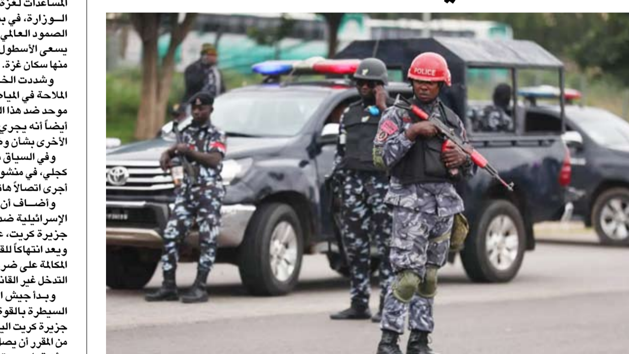
رجال الشرطة النيجيرية في ابوجا

وتحدثت تقارير عديدة عن «حالة من الارتباك والذعر تنتشر بين سكان البلدة»، وقال أحد السكان لصحيفة محلية: «إنه أمر مرعب ومفاجئ، اقتحموا البلدة بأعداد كبيرة، وأطلقوا النار على الناس بشكل عشوائي، قتلوا القس، واقتادوا الآخرين نحو الغابة، كان من بينهم كبار سن، وأطفال». وفي تعليق على التطورات، أكد مسؤول حكومي رفيع وعضو في اللجنة الأمنية بالولاية وقوع الهجوم، متحدثاً شريحة عدم كشف اسمه لكونه غير مخول بالتصريح الرسمي، وقال إن الأجهزة الأمنية قد انتشرت بالفعل في المنطقة، وهي تتفقد آثار المهاجمين، معرباً عن ثقته في إنقاذ الضحايا دون أذى.