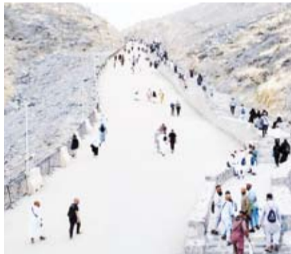
تجربة الصعود إلى غار حراء