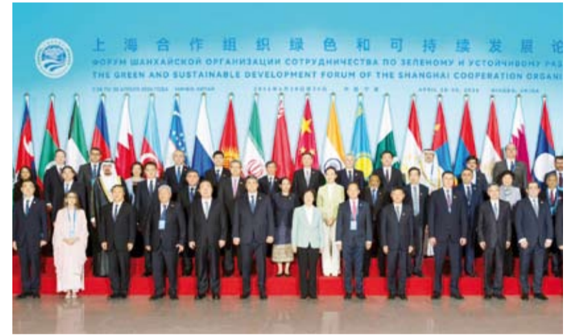
لقطة جماعية للمشاركة

أكدت دولة الكويت، أمس، الالتزام بدعم التعاون الدولي لمواجهة تحديات تغير المناخ وتعزيز التحول نحو الطاقة النظيفة. جاء ذلك خلال كلمة القاهما سفير دولة الكويت لدى الصين جاسم الناجم أمام منتدى التنمية الخضراء والمستدامة لمنظمة شنغهاي للتعاون في مدينة (نينغبو) بمقاطعة (تشجيانغ) شرقي الصين. وشدد السفير الناجم على حرص دولة الكويت على تسريع التحول نحو الطاقة النظيفة وتعميق التعاون الدولي في مجال الطاقة المستدامة. وأشار إلى أن رؤية الكويت 2035 تشكل الإطار الوطني للتحول الاقتصادي والطاقة من خلال تنوع مصادر الدخل وتوسيع الاستثمار في مجالات الطاقة المتجددة. وأكد سعي دولة الكويت نحو تعميم شراكاتها مع الصين والدول الصديقة كافة بهدف بناء مستقبل أكثر استدامة وأمناً وازدهاراً. ويعقد المنتدى تحت شعار (تطبيق مبادرة الحوكمة العالمية وتعزيز التنمية الخضراء والاستدامة) على مدى يومين بمشاركة أكثر من 300 مسؤول من مختلف دول العالم.