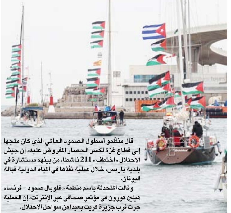
قوات الاحتلال هاجمت الأسطول قبالة جزيرة كريت اليونانية