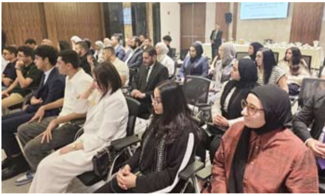
متابعة من الحضور