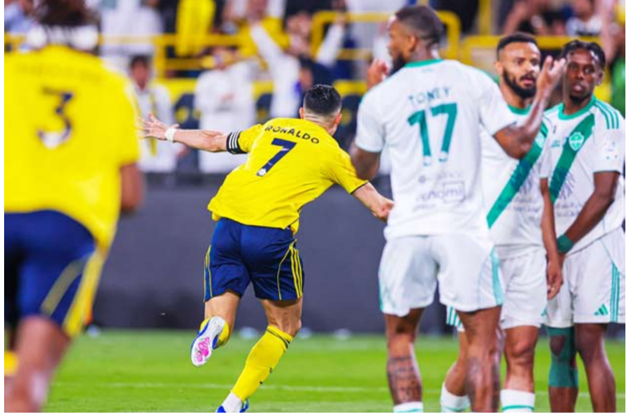
روندو يحتفل بالتسجيل

ورفع الاتحاد رصيده إلى 48 نقطة في المركز السادس بفارق نقطة عن التعاون الخامس، ليعزز الفريق الذي توج بطلاً للدوري والكأس، الموسم الماضي، من المنافسة في الجولات المتبقية على مركز مؤهل للمشاركة الآسيوية.