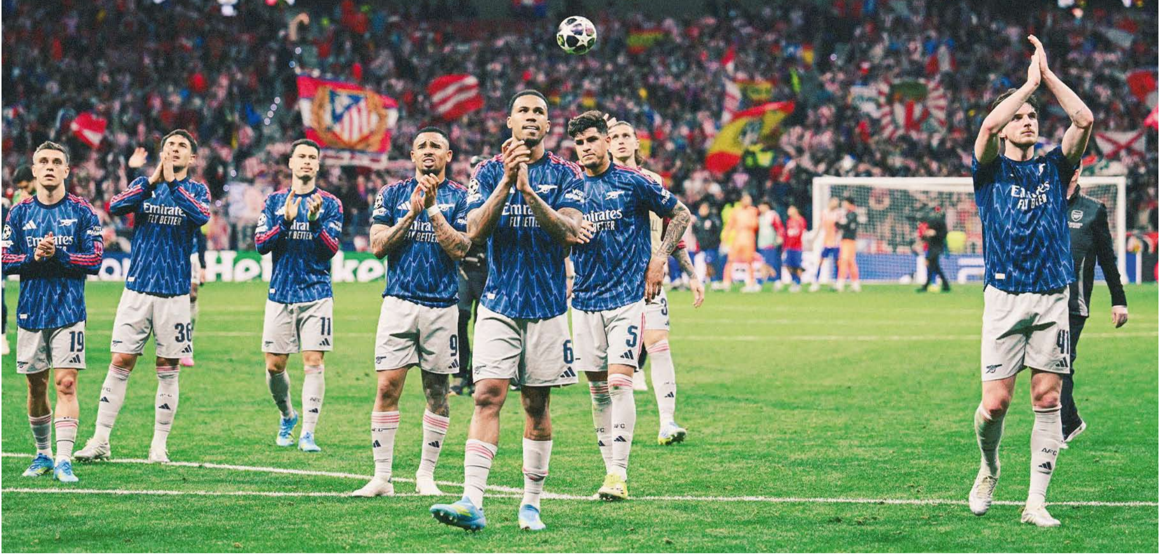
الرسنال ينتظر الحسم في لقاء العودة