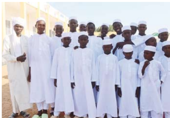
مجموعة من الأيتام في المجمع