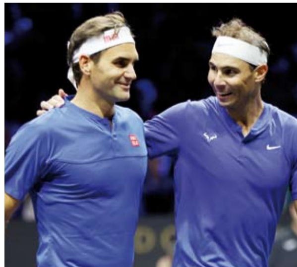
رسالة مؤثرة من فيدور لنادال بمناسبة اعتزاله

ملعبك المفضل، وقد جعلتني أعمل بجهد أكبر مما نادال قائلا إن اللاعب الإسباني تحدها أكثر من أي لاعب آخر وأنه جعل عالم التنس يشعر بالفخر خلال مسيرة مظلورة استمرت لأكثر من عقدين من الزمن. ويشارك نادال ضمن فريق إسبانيا الذي يبدأ مشواره في كأس فيديف ضد هولندا في وقت لاحق يوم الثلاثاء، إذ من المقرر أن يعلن اللاعب الحائز على 22 لقباً للفرد في البطولات الأربع الكبرى والمبتلي بالإصابات اعتزاله بعد بطولة الفرق في ملقا. ونشر فيدور، الذي كان ضمن "الثلاثة الكبار" في عالم تنس الرجال إلى جانب نادال ونوفاك ديوكوفيتش، رسالة على موقع إكس يتذكر فيها تنافسه مع اللاعب الإسباني (38 عاما) قال فيها عن المنافس الذي خسر أمامه 24 مرة مقابل 16 انتصارا: دعونا نبدأ بالأمر الواضح: لقد تغلبت على كثير. أكثر مما تمكنت من الفوز عليك. لقد تحديتني بطرق لم يستطع لاعب آخر أن يفعلها. واصل: على الملاعب الرملية، شعرت وكأنني أدخل إلى