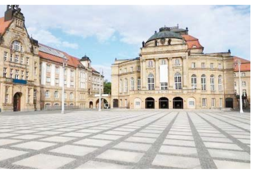
مدينة كيمنتس الألمانية

تستعد مدينة كيمنتس الألمانية لاستضافة 150 مشروعاً و 1000 فعالية ثقافية العام المقبل، باعتبارها عاصمة للثقافة الأوروبية 2025. ومن بين أهم الفعاليات المقررة معرض للرسم الترويجي إدفارد مونك، وجولة عن الفن المحلي والعالمي، فضلاً عن افتتاح عرض أوبرالي معاصر مأخوذ عن رواية الكاتب الألماني فيرنر براونيج «روميل بلاتس»، بالإضافة إلى تنظيم برامج احتفاء بالثقافة الرياضية. وإلى جانب كيمنتس، سوف تكون مدينة نونابورغا في سلوفينيا أيضاً عاصمة للثقافة الأوروبية العام المقبل. ويختار الاتحاد الأوروبي كل عام مدينة أو أكثر من دوله للاحتفال بالفنون والثقافة طوال عام، بغرض تعزيز المشهد الثقافي المحلي وترسيخ الشعور بالانتماء لمنطقة ثقافية مشتركة بين المواطنين الأوروبيين، كما تهدف المبادرة إلى تعزيز السياحة