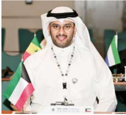
رئيس الاتحاد الكويتي للخماسي الحديث ناصر الوليد

الكويتي للخماسي الحديث في اجتماعات الجمعية العمومية للاتحاد الدولي التي شهدت حضور أكثر من 100 دولة في الرياض حيث جرى انتخاب رئيس وأعضاء مجلس إدارة الاتحاد الدولي ولجانته للدورة الجديدة.