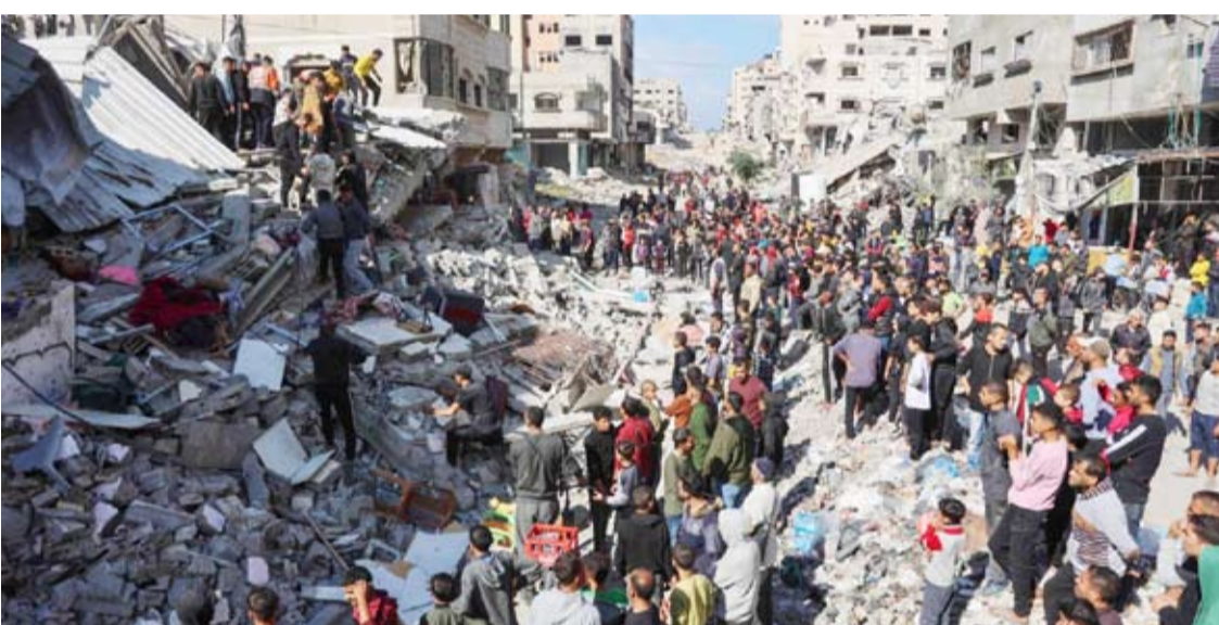
قصف منزل في شارع الجلاء وسط قطاع غزة

في الوقت الذي واصل فيه الجيش الإسرائيلي عملياته العسكرية الواسعة في شمال غزة، ظهرت مؤشرات جديدة داخل حكومة بنيامين نتنياهو على وجود خطط لإقامة حكم عسكري طويل في القطاع. وهاجم وزير المالية الإسرائيلي، يتسليخيل سموتريتش، في تصريحات، جيش بلاده لرفضه خطط حكم غزة عسكرياً، وقال إن «المستوى السياسي يوجب وأصر، لكن الجيش رفض بشدة أن يأخذ على عاتقه أي شيء يفوح منه رائحة إدارة عسكرية». وأردف: «إذا كان هذا هو الأمر المطلوب من أجل ضمان الأمن، فإنني لست قلقاً من أن تكون بديلاً سلطوياً في القطاع لفترة معينة من أجل القضاء على (حماس)». وتعرّض تصريحات سمو تريتش لانتقادات من الوزراء بأنه ينوي احتلال القطاع، وإقامة حكم عسكري هناك.