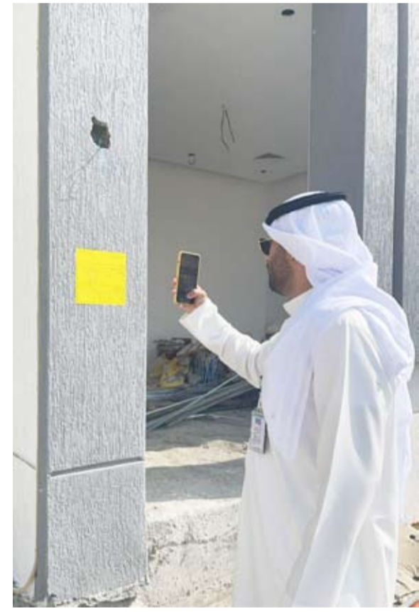
موظفي البلدية يتابعون الابنية المخالفة

كشفت إدارة العلاقات العامة ببلدية الكويت عن قيام الفريق الرقابي بإدارة السلامة بفرع بلدية محافظة الأحمدية بجولة ميدانية مكثفة بهدف التأكد من اتخاذ كافة إجراءات السلامة للعقارات الاستثمارية والتجارية. وفي هذا السياق أوضحت بأن الجولات التي تم تنفيذها من قبل الفريق الرقابي بإدارة السلامة قد أسفرت عن توجيه 14 إنذاراً لافتقارها لأنظمة واشتراطات السلامة وتعرض المارة للخطر. ودعت أصحاب العقارات اتخاذ كافة إجراءات السلامة والالتزام بلوائح ونظم البلدية بإزالة الأبناس الإنشائية من قبل المقاول وصاحب العقار أو لا يوافق تجنبا لأي مخالفات مفرقة قانوناً. لافتة إلى إن الفريق الرقابي بإدارة السلامة لن يتهاون في اتخاذ كافة الإجراءات القانونية حيال أي مخالفة.