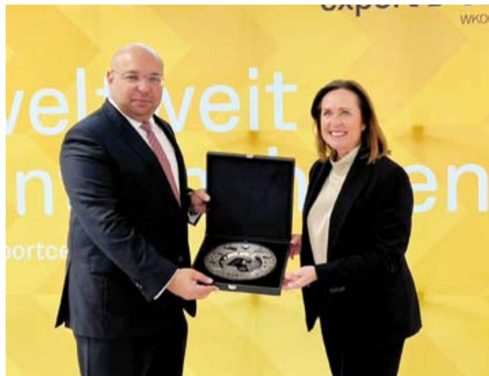
السفير طلال الفصام يقدم درعاً لحاكم ولاية النمسا العليا توماس شتيلزير

فرص تعزيز التعاون الاقتصادي وتشجيع الاستثمارات المتبادلة بين الكويت وولاية النمسا العليا وتوسيع قاعدة الشراكة بين رجال الأعمال والمؤسسات الاقتصادية في كلا البلدين. وفيما يتعلق باجتماعه مع غرفة التجارة في (لينز) أشار السفير الفصام إلى أن اللقاء كان مثمراً حيث استعرض الجانبان فرص التعاون في المجالات التجارية والصناعية كما تم بحث إمكانية تنظيم فعاليات مشتركة تساهم في تطوير العلاقات الاقتصادية بين الكويت والنمسا. وشدد على أن الزيارات التي يقوم بها إلى مختلف الولايات النمساوية تأتي في إطار تعزيز أواصر الصداقة والشراكة بين الكويت والنمسا عربياً عن تفاعلها بمستقبل العلاقات الثنائية واتفق التعاون المشترك التي تساهم في تحقيق المنفعة المتبادلة بين البلدين الصديقين.