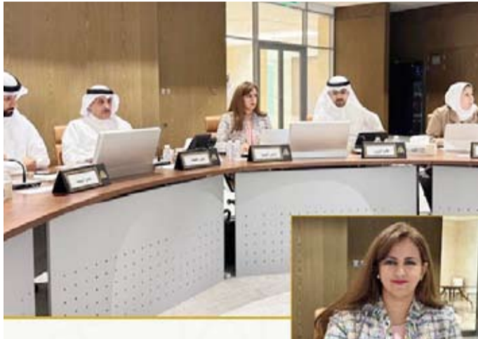
جانب من اجتماع قنية البلدي