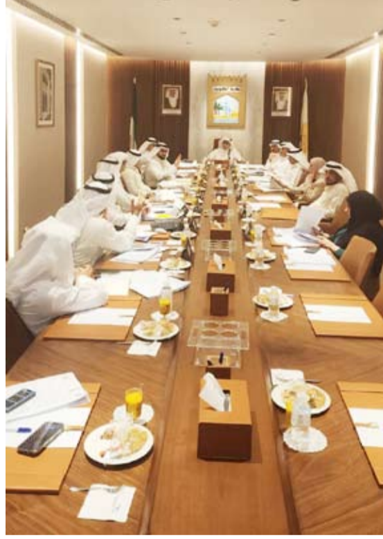
الوزير المشاري مترسا اجتماع قيادي البلدية