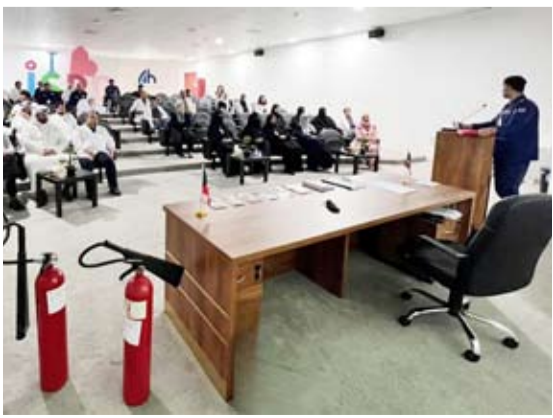
جانب من محاضرة الإطفاء

في إطار التعاون بين قوة الإطفاء العام ووزارة الصحة نظمت إدارة العلاقات العامة والإعلام بقوة الإطفاء العام صباح اليوم الإثنين محاضرة توعوية في مركز أسعد الحمد للأمراض الجلدية. وتهدف هذه المحاضرة إلى تثقيف وتوعية الكوادر الطبية والطواقم التمريضية بالمركز عن مخاطر الحرائق والحوادث وسبل الوقاية منها، وشملت المحاضرة على شرح نظري لكيفية الإخلاء في حالات الطوارئ وطريقة استخدام مطفاة.