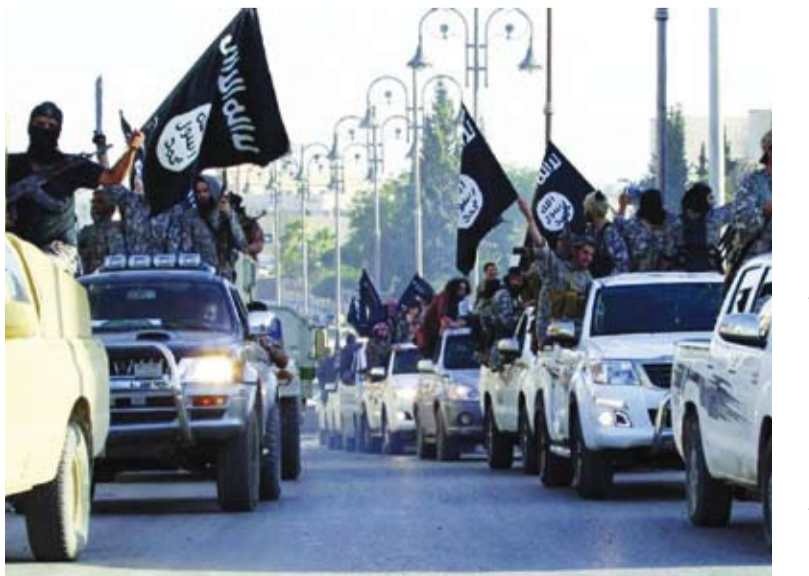
مقاتلون من تنظيم «داعش» الإرهابي

ضمن المناطق الخاضعة لسيطرة القوات الحكومية والمليشيات الريدفة. وأكد المرصد فشل القوات الحكومية وسلاح الجو الروسي في القضاء على «التنظيم»، محذراً من ازدياد مخاطر عملياته العسكرية. وتركزت هجمات «داعش» في سورية تصعيداً كبيراً في عمليات وسجل المرصد السوري لحقوق الإنسان نحو 211 عملية قام بها التنظيم منذ بداية العام الجاري قتل فيها نحو 592 شخصاً، منهم 56 من عناصر «داعش»، و478 من القوات الحكومية والمليشيات الريدفة، و58 مدنياً. وقال المرصد في تقرير له، إن تنظيم «داعش» انتعش بشكل كبير داخل الأراضي السورية، منذ بداية العام الجاري، خصوصاً