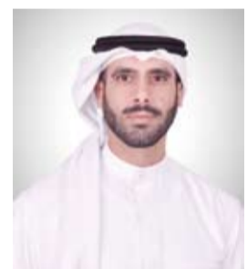
الشيخ مبارك فهد جابر الأحمد الصباح

يذكر أن (منتدى مسك العالمي 2024) يشارك فيه أكثر من 150 متحدثاً ويحتضن أكثر من 100 جلسة حوارية و30 ورشة ضمن نقاشات تغطي مجموعة واسعة من الموضوعات ومنها الاستدامة والتعليم والابتكار والتكنولوجيا والصحة والثقافة وتغير المناخ وذلك بهدف استكشاف آفاق التنمية المستقبلية للشباب.