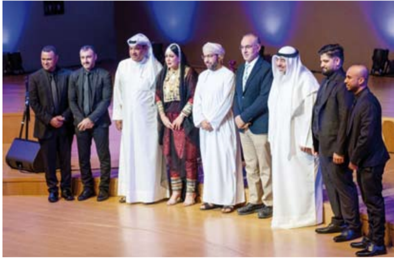
لقطة جماعية مع كبار الحضور