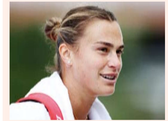
البياروسية أرينا سابالينكا

احتفظت البياروسية أرينا سابالينكا بموقعها في صدارة التصنيف العالمي للاعبات التنس المحترفات الصادر اليوم. وجاءت سابالينكا في المركز الأول عالميا، برصيد 9416 نقطة، في حين حافظت البولندية إيجا شفيو نيتيك على الوصافة برصيد 8370 نقطة. وحلت الأمريكية كوكو جوف في المركز الثالث برصيد 6530 نقطة، والإيطالية جاسمين باوليني رابعا برصيد 5344 نقطة، والصينية كينون شينج خامسا برصيد 5340 نقطة، والكانز أختسانية إيلنا ريباكيينا سادسا برصيد 5171 نقطة، والأمريكية جيسكا بيجولا سابعا برصيد 4705 نقاط، والأمريكية إيما نافارو ثامنا برصيد 3589 نقطة، فيما جاءت الروسية داريا كاستاكينا في المركز التاسع برصيد 3368 نقطة، والتشيكية باربورا كرتشيوكوفا عاشرا برصيد 3214 نقطة.