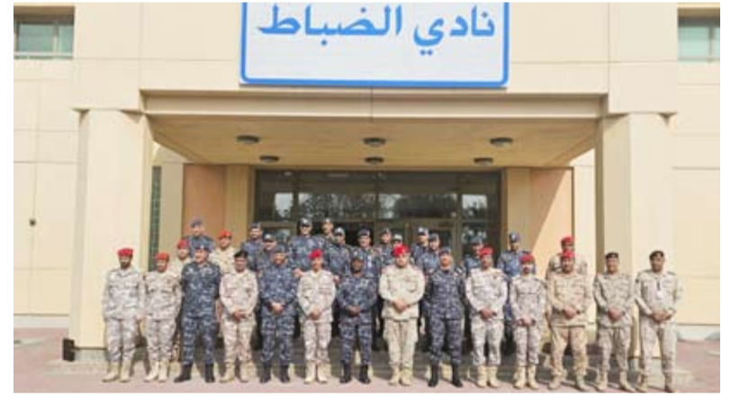
الوفد القطري خلال زيارته معسكر قوات الأمن الخاص أمس

قالت وزارة الداخلية أمس إن وفداً أمنياً قطرياً زار معسكر قوات الأمن الخاص في الكويت في إطار تعزيز التعاون الأمني وتبادل الخبرات بين الجانبين وتأكيد العلاقات الوثيقة بين البلدين الشقيقين. وأضافت الإدارة العامة للعلاقات والإعلام الأمني بالوزارة في بيان صحفي أن الوفد اطلع خلال الزيارة على اختصاصات الإدارة العامة لقوات الأمن الخاص وتعرف على مختلف مرافق المعسكر إلى جانب استعراض شامل للأسلحة والمعدات والمدركات التابعة للمعسكر.