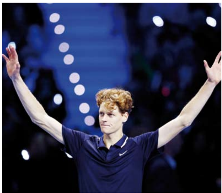
الإيطالي يانيك سينر

احتفظت البياروسية أرينا سابالينكا بموقعها في صدارة التصنيف العالمي للاعبات التنس المحترفات الصادر اليوم. وجاءت سابالينكا في المركز الأول عالميا، برصيد 9416 نقطة، في حين حافظت البولندية إيجا شفيو نيتيك على الوصافة برصيد 8370 نقطة. وحلت الأمريكية كوكو جوف في المركز الثالث برصيد 6530 نقطة، والإيطالية جاسمين باوليني رابعا برصيد 5344 نقطة، والصينية كينون شينج خامسا برصيد 5340 نقطة، والكانز أختسانية إيلنا ريباكيينا سادسا برصيد 5171 نقطة، والأمريكية جيسكا بيجولا سابعا برصيد 4705 نقاط، والأمريكية إيما نافارو ثامنا برصيد 3589 نقطة، فيما جاءت الروسية داريا كاستاكينا في المركز التاسع برصيد 3368 نقطة، والتشيكية باربورا كرتشيوكوفا عاشرا برصيد 3214 نقطة.