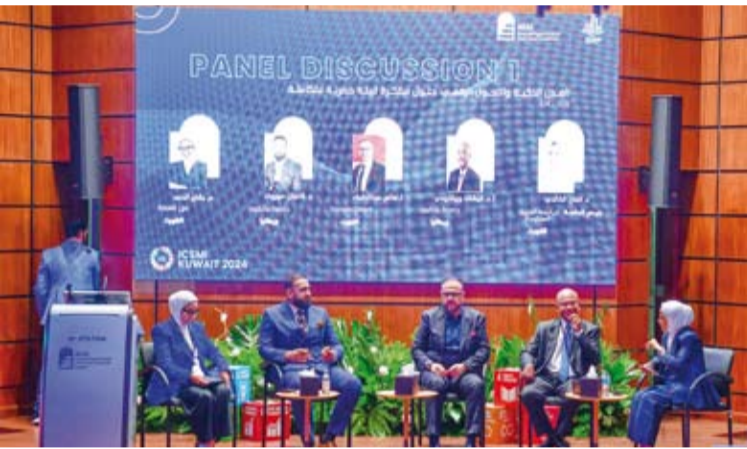
جانب من حلقة نقاشية

أكد وزير التعليم العالي والبحث العلمي، الدكتور نادر الجلال، أمس، أن التقدم نحو إنشاء مدن ذكية ومستدامة أصبح ضرورة ملحة تفرضها التحديات التنموية العالمية لما يعيشه هذا العصر من تطورات متسارعة وتحولات رقمية. جاء ذلك في كلمة القاهها الوزير الجلال ممثلًا عن سمو الشيخ أحمد العبدالله رئيس مجلس الوزراء خلال افتتاح المؤتمر الدولي للإدارة الذكية والابتكار من أجل مدن مستدامة تحت عنوان (تصور مستقبل المدن الذكية) الذي تنظمه الجامعة العربية المفتوحة في الكويت ويستمر ثلاثة أيام. وقال الوزير الجلال: إن الإدارة الذكية تعتبر عموداً أساسياً لدفع عجلة التحول نحو مدن ذكية تتسم بالكفاءة والتكيف مع المتغيرات البيئية وإن استخدام التكنولوجيا لرفع جودة الخدمات وتحقيق استدامة الموارد والابتكار في هذا السياق يمثل الأساس الذي نطمح أن نبني عليه مجتمعاتنا.