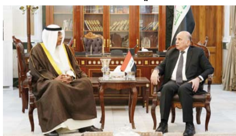
وزير الخارجية العراقي مستقبلاً سفير الكويت طارق الفرج

حسين السفير الكويتي لدى العراق طارق الفرج بمناسبة انتهاء مهام عمله في العراق. ومن جانبه أبدى السفير الكويتي شكره وامتنانه لحكومة وشعب العراق لما قدموه من دعم وتعاون أثناء مدة عمله عربياً عن امهله بمواصلة العمل لتعزيز العلاقات الثنائية وتوسيع افق التعاون بما يخدم المصالح المشتركة بين البلدين الشقيقين.