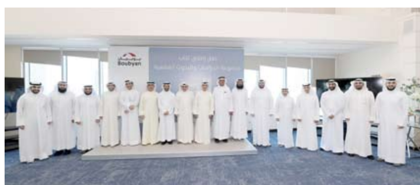
لقطة جماعية للحضور من حفل الإطلاق

للشيخ الاستاذ الدكتور عبدالعزیز القصار رئيس هيئة الرقابة الشرعية لمجموعة بنك بويان نموذجاً ومرجعاً متميزاً لمواكبة أدوات التطور والنمو الاقتصادي