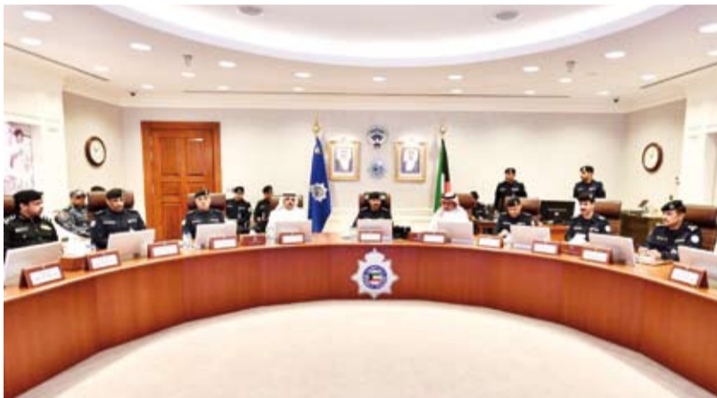
الفريق سالم النواف يترأس الاجتماع

ملوك ورؤساء دول الخليج العربية، كما تمت مناقشة المهام والواجبات المنوطة بكل وحدة من الوحدات العاملة ودور كل منها في الحماية والتأمين والسيطرة. ووجه الشيخ سالم النواف بضرورة الاستعداد واليقظة التامة لكل الأجهزة المشاركة في عمليات التأمين والتواصل بين جميع القطاعات المعنية لإظهار مؤتمراً قمة مجلس التعاون الخليجي بالشكل الحضاري الذي يعبر عن مكانة الكويت وقدرتها على تنظيم مثل هذه المؤتمرات. وأعطى بعض التعليمات والتوجيهات استكمالاً لما استمع إليه من شرح وعرض لتقارير وخطط تفصيلية، مؤكداً ثقته بقدرة الجهات المشاركة في التأمين على أداء المهام المكلفين بها على أكمل وجه.