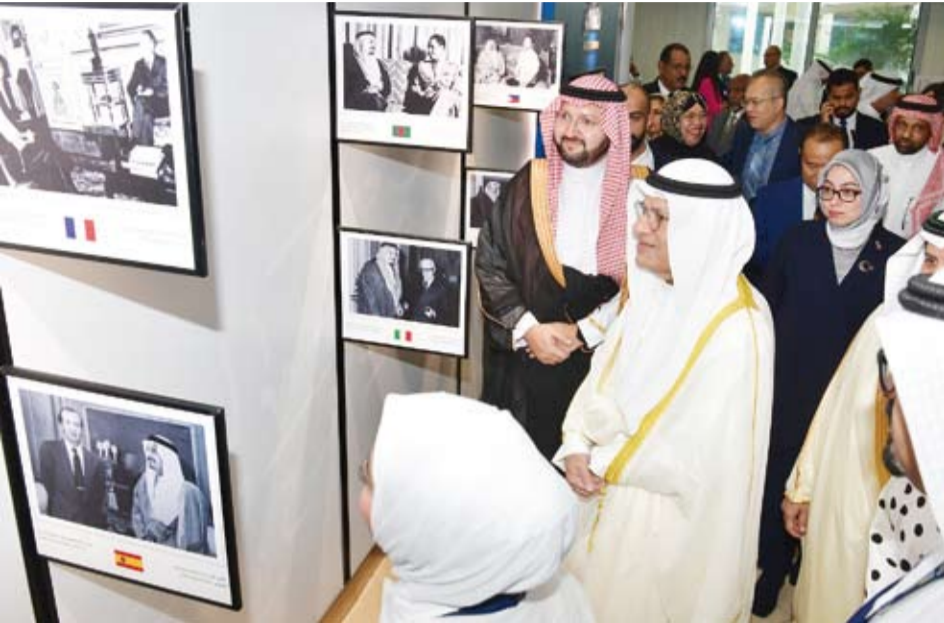
جانب من المعرض المرافق