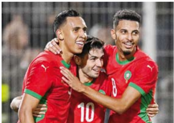
أسود الأطلس حقق العلامة الكاملة

المجموعة بطاقة واحدة حسمت قبل الجولة الختامية لصالح الغابون الفائزة على مضيفتها إفريقيا الوسطى (-1 صفر)، لتحل في المركز الثاني برصيد 10 نقاط، وليسو تو ثالثة بـ4 نقاط، وإفريقيا الوسطى الأخيرة بـ3 نقاط. وارتقى منتخب جزر القمر إلى صدارة المجموعة الأولى بفوزه على مدغشقر (-1 صفر)، ليتصدر المجموعة بـ12 نقطة، فيما أنهى المنتخب التونسي التصفيات على أسوأ نحو بالرغم من تأهله، وذلك بخسارته أمام ضيفه منتخب غامبيا بهدف نظيف في رادس، ليحل منتخب تونس ثانيا برصيد 10 نقاط.