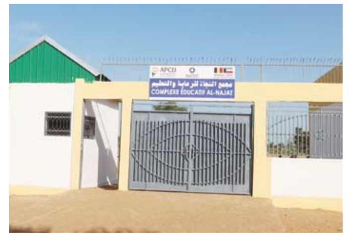
مجمع النجاة لايتام في تشاد

الصلوة وحفظ القرآن الكريم ويثر ماء لخدمة المجمع والمنطقة المحيطة به إضافة إلى ومستوصف لعلاج الأيتام وأهالي المنطقة. وأضاف أن المجمع يضم كذلك دكاكين وبقية ومركزاً لتدريب الأيتام وأمهاتهم وثلاثة فصول دراسية تتسع