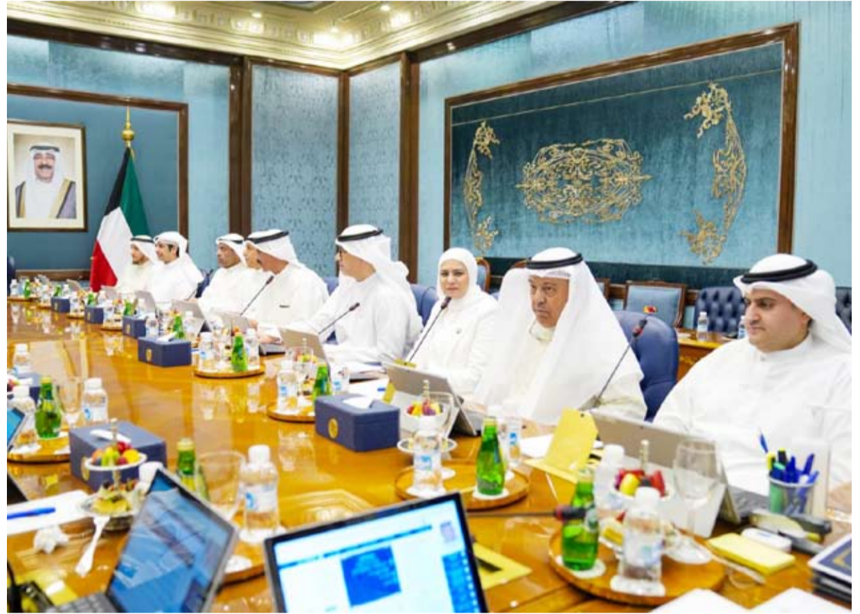
جانب من اجتماع المجلس أمس

بين السطور مراسيم تعيين القيادات التي أقرها أمس مجلس الوزراء خطوة مهمة جداً نحو تحقيق الاستقرار في الهيئات الحكومية، وإنهاء حالة التلكيف التي استمرت لمدة طويلة. ولاشك أن الاستقرار الوظيفي في المؤسسات والجهات الحكومية مثل الهيئة العامة للطرق وغيرها من الجهات الأخرى سيكون له أثر كبير على تحقيق الإنجازات التي ينتظرها المواطن، خاصة إذا كانت تلك الجهات تتعلق بالخدمات العامة. نأمل من رؤساء الهيئات الذين تم أو سيتم تعيينهم خلال هذه الفترة الاهتمام فقط بخدمة الوطن والمواطن، والبعد عن المهاترات والصراعات الجانبية.. الله يوفقكم لما فيه خير الكويت.