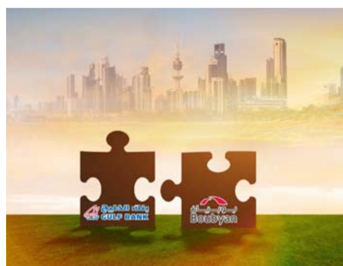
عدم التوصل إلى هيكل عملية الاندماج إلى معدل التبادل العادل للأسهل. وشددا على عدم الاعتماد على أي أو الانتهاء من تقييم كلا البنكين للوصل

وكانت «هيرميس» قد كشفت أن السيناريو الأكثر ترجيحاً يتمثل في استحواذ «بويان» على «الخليج» ليكون سهم الأول مقابل 1.55 سهم في الثاني، وأن يتم تقييم الخليج بمضاعف 1.7 مرة للقيمة الدفترية؛ ما يعني زيادة محتملة بنسبة 15% في سعر الثاني. وتوقعت حدوث الاندماج القانوني في النصف الثاني من عام 2025، على أن تنخفض حصة بنك الكويت الوطني في «بويان» إلى 38% من 60% مع زيادة ربحية سهم «بويان» 14-20% بحلول 2026-2027، وتوفير تكاليف بنسبة 18% نتيجة اندماج.