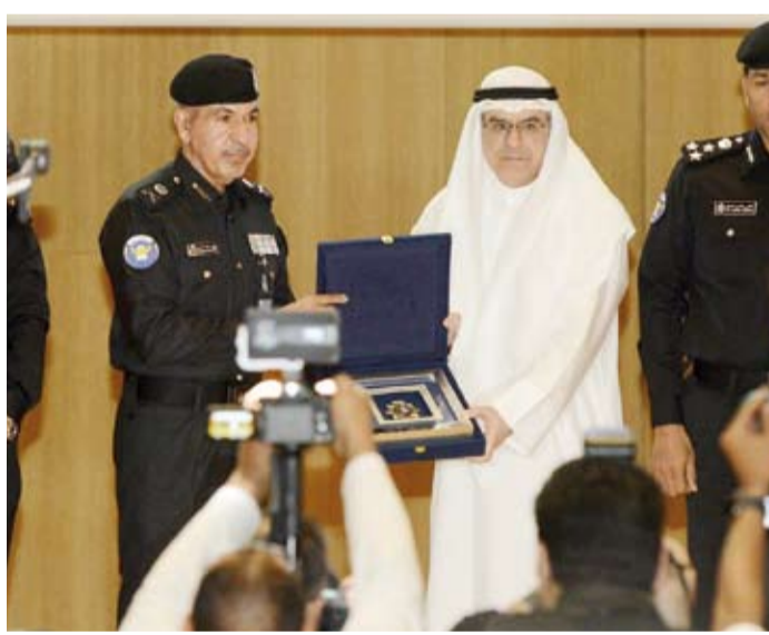
تكريم خلال الندوة