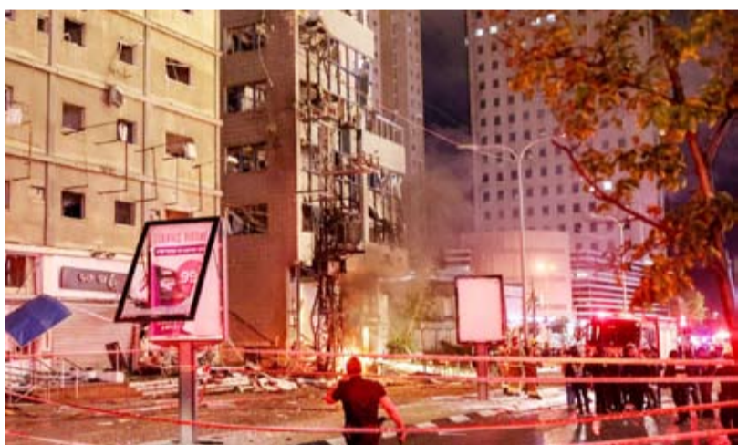
حزب الله قصف شمال تل أبيب

5 أشخاص في وسط إسرائيل بعد إطلاق 5 صواريخ من لبنان. كان المتحدث باسم الجيش الإسرائيلي أفخاي اندري، قال إنه عقب تشغيل صفارات الإنذار في منطقة الجليل الأعلى، تم رصد نحو 10 قذائف صاروخية أطلقت من لبنان.