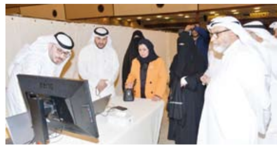
جانب من انطلاق التصفيات النهائية

تحت رعاية كريمة من وزير التربية المهندس سيد جلال الطبطبائي، انطلقت صباح أمس، فعاليات التصفيات النهائية لجائزة عبدالله العلي المطوع السابعة لحفظ القرآن الكريم وتلاوته، المخصصة لمعلمي مسجد الدولة الكبير. الجائزة تنظمها مرة بالمتميزين لخدمة القرآن الكريم والعلوم الشرعية بالتعاون مع وزارة التربية ممثلة بإدارة التوجيه الفني العام للتربية الإسلامية، وبدعم كريم من أسرة الكويت، وفي كلمته خلال الحفل، أكد رئيس مجلس إدارة مرة بالمتميزين الشيخ يوسف سالم الصبيعي أن هذه المسابقة تعد من أهم المشاريع التي حرصت المبرة على تنظيمها والإهتمام بها، مشيراً إلى أنها تأتي في إطار رسالة المبرة لخدمة كتاب الله الكريم وتعزيز دوره في بناء المجتمع.