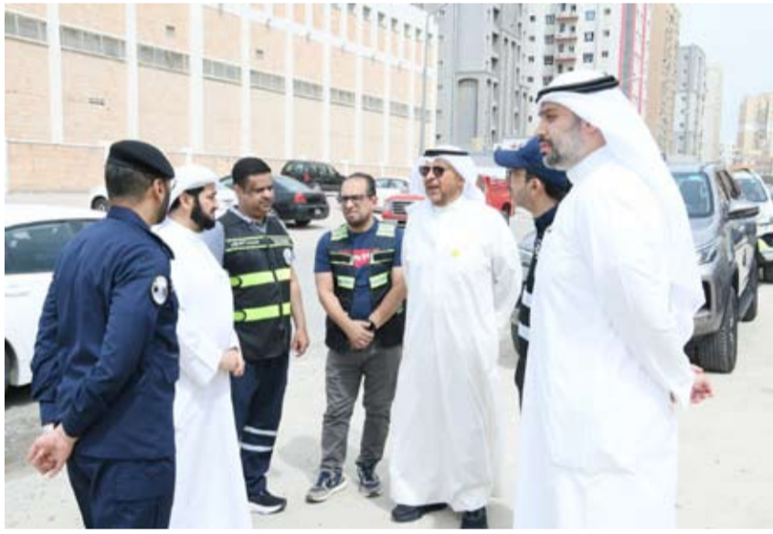
محافظ الفروانية خلال الجولة

قام محافظ الفروانية الشيخ عذبي ناصر العذبي الصباح، صباح أمس بجولة ميدانية على بعض المواقع ضمن نطاق منطقة الفروانية، وذلك بحضور المهندس فواز الشمري الوكيل المساعد لقطاع شؤون هندسة الصيانة بالتكليف في وزارة الأشغال العامة. وأطلع خلال الجولة على الحالة العامة للبنية التحتية، ورصد الملاحظات والتحديات القائمة ميدانياً، في إطار متابعة الأداء الخدمي وتعزيز كفاءة الأعمال المنفذة، بما يتوافق مع الخطط المعتمدة. كما أكد على ضرورة متابعة التنسيق مع الجهات المختصة، لمتابعة تنفيذ المعالجات الفنية اللازمة وفق الأطر التنظيمية، وبما يضمن تسريع وتيرة الإنجاز ورفع مستوى جودة الخدمات المقدمة وضرورة الالتزام بالمعايير الفنية المعتمدة، بما يساهم في تحسين البنية التحتية وتطويرها، وفي ختام الجولة أعرب «الشمري» عن تقديره لحرص محافظ الفروانية على المتابعة الميدانية المباشرة، مؤكداً أن وزارة الأشغال العامة ماضية في تنفيذ المعالجات الفنية اللازمة وفق أعلى المعايير، وبالتنسيق مع الجهات المعنية، بما يساهم في رفع كفاءة البنية التحتية.