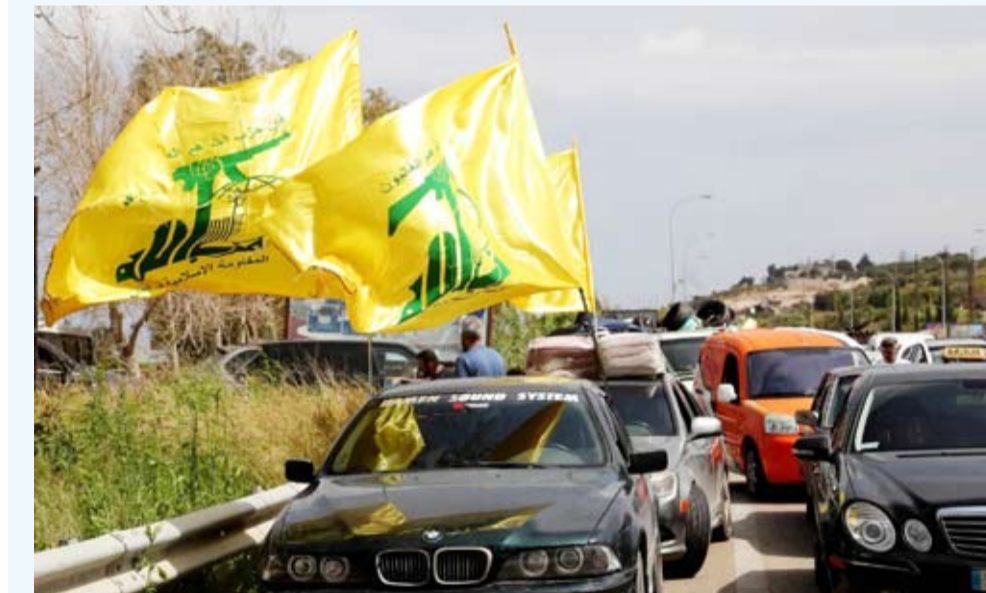
مؤيدو «حزب الله» على الطريق المؤدي إلى جنوب لبنان

حذّر الأمين العام لـ«حزب الله» اللبناني، نعيم قاسم، من أن عناصره سيردون على «خروقات» إسرائيل لاتفاق وقف إطلاق النار في لبنان، مشدداً على أن التزامه «يجب أن يكون من الطرفين».