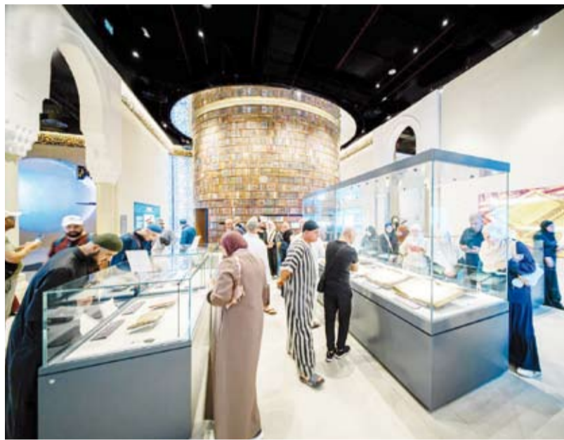
متحف القرآن الكريم يستقطب أعداداً كبيرة من الزوار