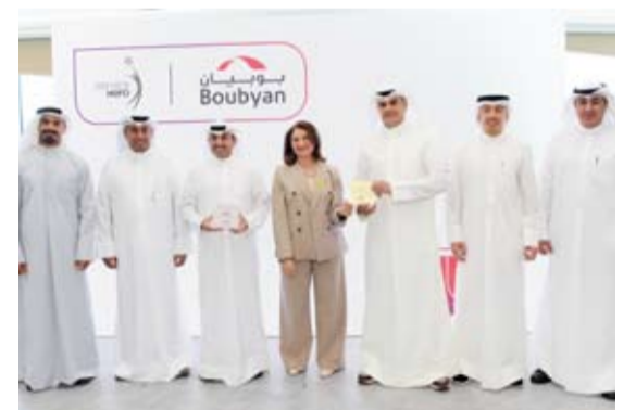
المجحد وابو غزالة أثناء تسليم جوائز سيرفس هيرو

رسّخ بنك بوبيان موقعه الريادي في مدى رضا العملاء، بعد حصوله على جائزة «أفضل بنك إسلامي في جودة خدمة العملاء في الكويت»، و«الأفضل في خدمة العملاء على مستوى كافة القطاعات في الكويت» لعام 2025، وذلك وفقاً لمؤشر «سيرفس هيرو» لقياس رضا العملاء، في إنجاز يعكس استمرارية البنك في تحقيق مستويات متقدمة من الأداء، في بيئة تتسم بتصاعد المنافسة وتغير توقعات العملاء.