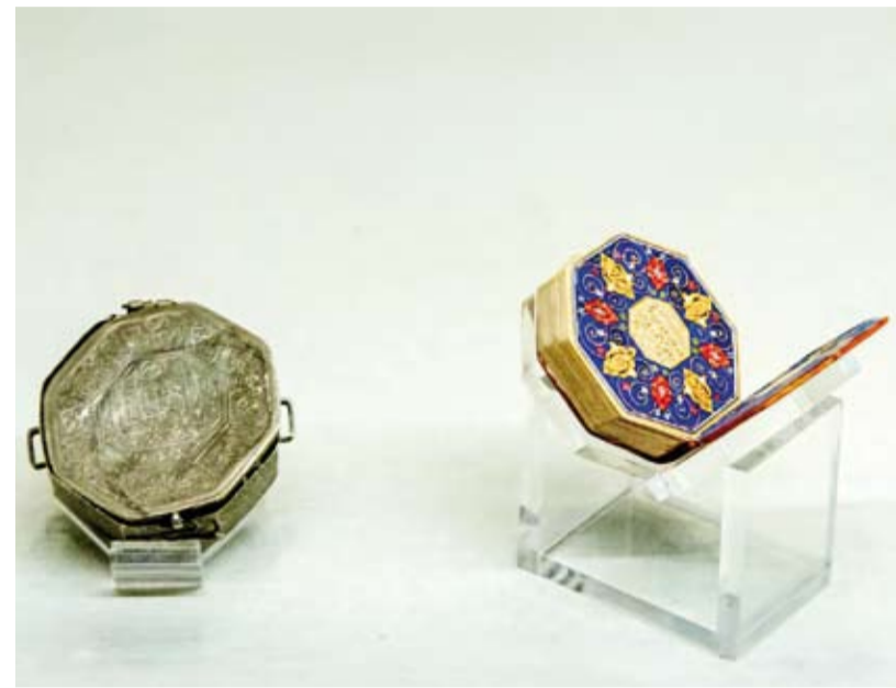
المصحف ثماني الاضلاع

ويتميز المصحف بتصميمه غير التقليدي؛ إذ صُنِعَ على هيئة ثماني الاضلاع وبحجم صغير، بما يسهل حمله والتنقل به، في دلالة على البعد العملي والجمالي الذي جمع الدقة الفنية والابتكار في إخراج المصاحف. ويعكس هذا الشكل الهندسي النادر تطور فنون التجليد والزخرفة الإسلامية في شبه القارة