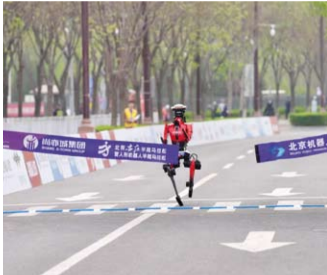
روبوت بشري يحطم الرقم القياسي العالمي

في أعداد المشاركات بمقدار خمس مرات تقريباً عن العام الماضي، مع انضمام أكثر من 100 فريق للمنافسة، بما في ذلك خمسة فرق من الخارج.