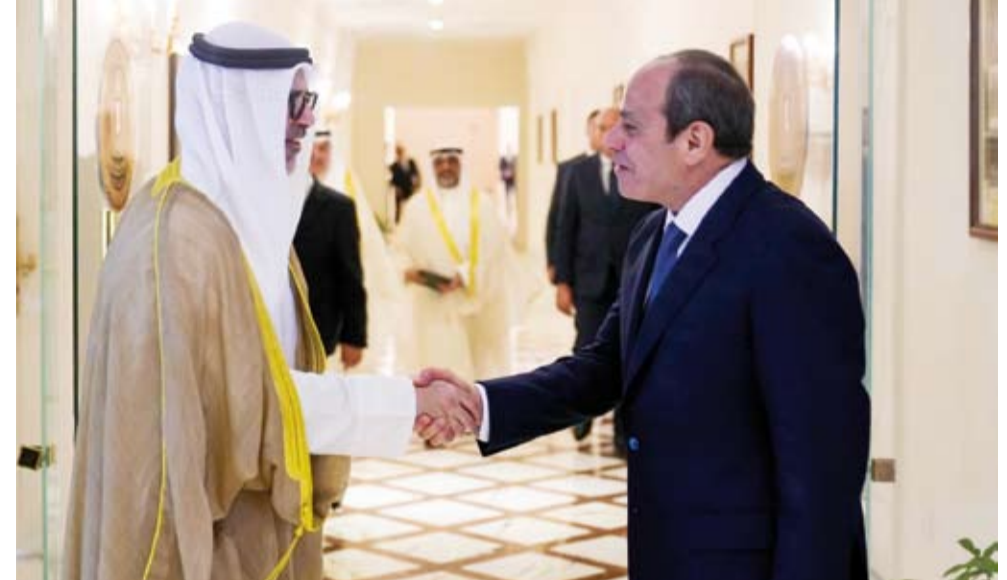
الرئيس المصري عبدالفتاح السيسي مستقبلاً وزير الخارجية الشيخ جراح الجابر

السيسي وأعرب عن اعتزازه بما تشهده العلاقات الثنائية من تقدم متواصل، ممتناً للمواقف التاريخية لمصر في دعم أمن وسيادة واستقرار الكويت ووقوفها الدائم إلى جانب أمن دول الخليج العربي. كما أعرب الشيخ جراح الجابر عن تطلع الكويت إلى تكثيف التشاور والتنسيق مع مصر بما يسهم في الحفاظ على السلم والاستقرار الإقليميين وصون أمن الدول العربية.