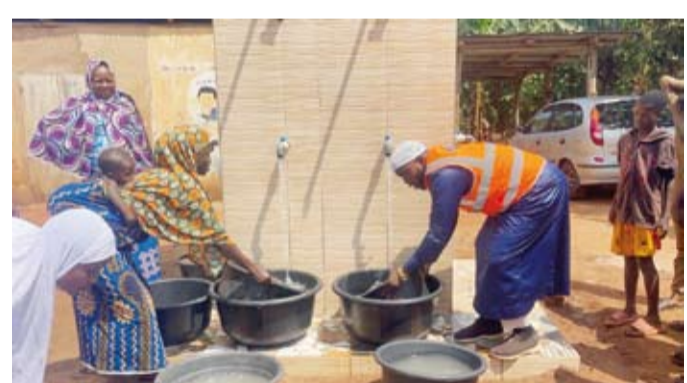
افتتاح أحد آبار المياه

المياه النظيفة وتقطع مسافات طويلة يوماً للحصول على المياه، مبيئاً أن هذه المشاريع تسهم بصورة مباشرة في تحسين الصحة العامة وحفظ كرامة الإنسان. وأوضح أن (نماء) تضع ضمن أولوياتها بناء المساجد في المناطق المحتاجة لتكون منارات دينية واجتماعية لأبناء المجتمع، مشيراً إلى أن القرى المستهدفة تعاني نقص المياه