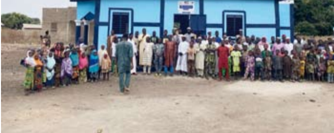
افتتاح أحد المساجد

«نماء الخيرية» تفتتح 15 مشروعاً تنموياً في «بنين»