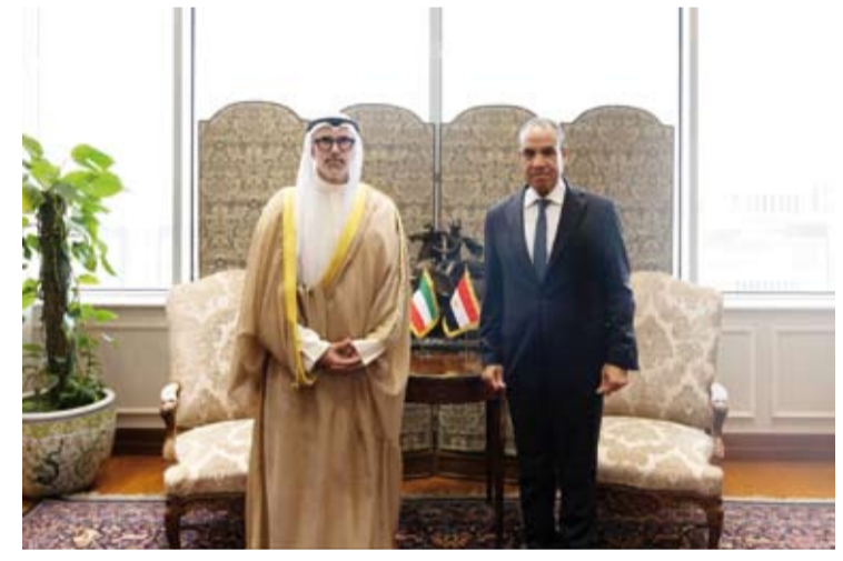
وزير الخارجية ونظيره المصري

وتنسيق في مختلف المجالات وعلى كافة المستويات تنفيذياً لرؤى وتطلعات قيادتي البلدين الحكيمتين. وأضاف أنه جرى بحث تطورات الأحداث في المنطقة والجهود الدبلوماسية المبذولة بشأنها، حيث شدد الجانبان على أهمية أن