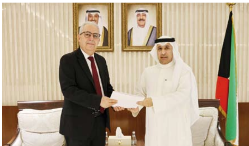
نائب وزير الخارجية السفير عزيز الديحاني يتسلم الرسالة من السفير المغربي علي بن عيسى

أن نائب وزير الخارجية بالوكالة السفير عزيز الديحاني يتسلم الرسالة، أمس، خلال استقباله سفير المملكة المغربية لدى دولة الكويت علي بن عيسى.