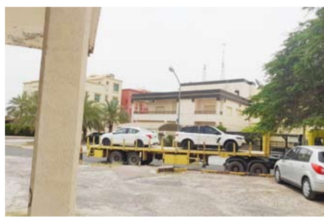
رفع سيارات مخالفة