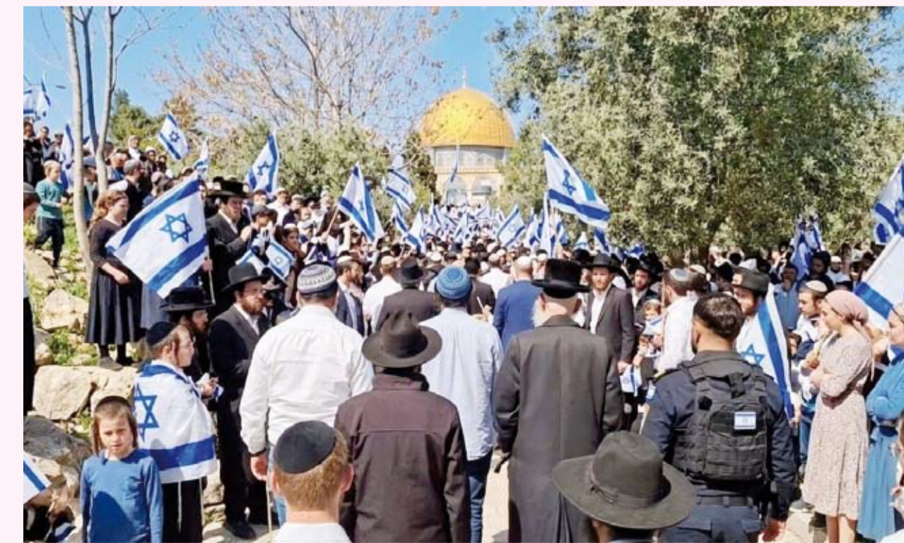
«جماعات الهيكل» تخطط لاقتحامات واسعة

ذكرت محافظة القدس أمس أن 177 مستوطننا اقتحموا المسجد الأقصى خلال الفترة الصباحية والمسائية تحت حماية مشددة من شرطة الاحتلال. وقالت المحافظة في بيان صحفي إن 177 مستوطننا اقتحموا المسجد الأقصى من باب المغاربة خلال الاقتحامات الصباحية والمسائية فيما دخل آخرون تحت مسمى السياحة وذلك بحماية مشددة من شرطة الاحتلال. وحذرت المحافظة في بيان منفصل من دعوات أطلقتها ما تسمى «جماعات الهيكل» لحشد أكبر عدد ممكن من المستوطنين وتنفيذ اقتحامات واسعة للمسجد الأقصى الأربعاء المقبل بالتزامن مع ذكرى تأسيس دولة الاحتلال بعد تشريد أبناء الشعب الفلسطيني من أراضيهم. وأكدت أن هذه «الخطوة استفزازية تمس بجرمة المكان» محملة سلطات الاحتلال المسؤولية الكاملة عن أي تصعيد قد يحدث.