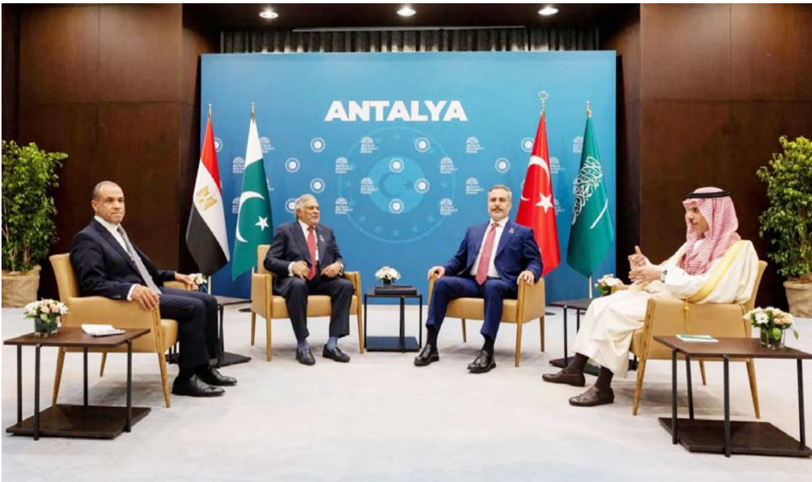
وزراء خارجية تركيا والسعودية ومصر وباكستان

ذكرت صحيفة «ول ستريت جورنال»، نقلاً عن مسؤولين أميركيين أقولهم إن الجيش الأميركي يستعد خلال الأيام المقبلة لمداخلة ناقلات نفط مرتبطة بإيران، والسيطرة على سفن تجارية في المياه الدولية. ووفق الصحيفة الأميركية، يستهدف الجيش بذلك توسيع نطاق حملته البحرية ضد إيران لتشمل مناطق خارج الشرق الأوسط. وتأتي هذه الخطوة في ظل استمرار الجيش الإيراني في تشديد قبضته على مضيق هرمز، حيث هاجم «الحرس الثوري» الإيراني عدة سفن تجارية، في المضيق، معلناً أن الممر المائي الحيوي يخضع «لسيطرة إيرانية مشددة». ويبحث وزراء خارجية تركيا والسعودية ومصر وباكستان جهود عقد جولة جديدة من المفاوضات لوضع نهاية لحرب إيران، وذلك في حين أعلنت طهران أنه لم يتم تحديد موعد لعقد جولة جديدة للمحادثات مع الولايات المتحدة، مؤكدة أنها لا تسعى إلى وقف مؤقت لإطلاق النار بل لإنهاء الحرب بالكامل. وعقد وزير الخارجية التركي ونظراؤه السعودي فيصل بن فرحان، والمصري بدر عبد العاطي، والباكستاني محمد إسحاق دار، اجتماعاً، على هامش الدورة الخامسة لمنتدى أنطاليا الدبلوماسي، لبحث سبل إيجاد حلول للمشكلات الإقليمية، وفي مقدمتها الحرب بين الولايات المتحدة وإسرائيل