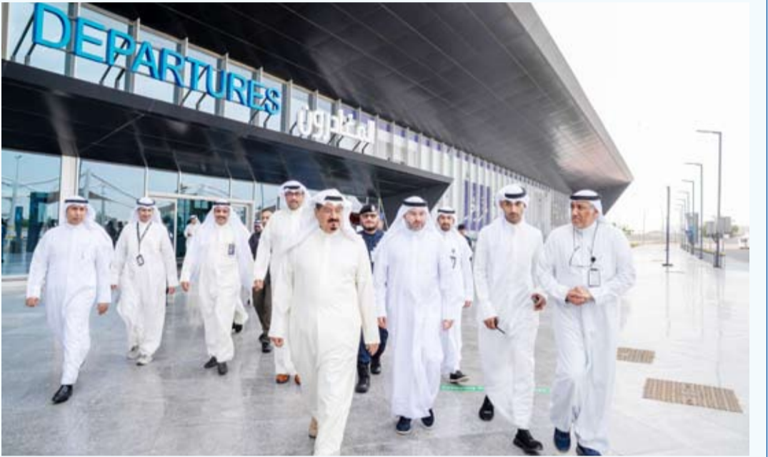
رئيس الوزراء: ضرورة التنسيق الكامل لضمان جاهزية المطار للتشغيل

تفقد سمو الشيخ أحمد العبدالله رئيس مجلس الوزراء أمس مطار الكويت الدولي برفقة وزير الدفاع الشيخ عبدالله العلي ورئيس الهيئة العامة للطيران المدني الشيخ حمود المبارك. وأكد رئيس مجلس الوزراء ضرورة التنسيق الكامل بين الجهات المعنية لضمان جاهزية مطار الكويت الدولي للتشغيل وفق الخطط المعتمدة وبما يسهم في دعم حركة النقل الجوي في البلاد مثمناً الجهود الكبيرة التي