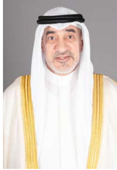
الشيخ فهد يوسف

أعلنت وزارة الداخلية، تنفيذها حملة أمنية ومرورية شاملة في منطقة (الفحيحيل) تحت إشراف مباشر من النائب الأول لرئيس مجلس الوزراء ووزير الدفاع ووزير الداخلية الشيخ فهد يوسف، استهدفت المخالفين والخارجين عن القانون.