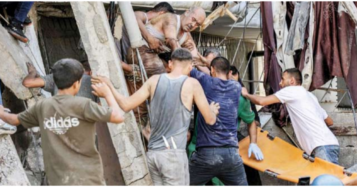
انتشال رجل تم من بين الأنقاض