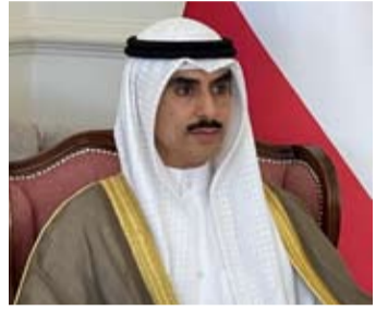
الشيخ ناصر جابر الأحمد الصباح

مشتركة وتحديات مقبلة انطلاقاً من مبدأ الشراكة الأخوية الراسخة التي تضرب بجذورها عمق التاريخ والجغرافيا وروح الأسرة الواحدة وبما يعزز دعائم الأمن والاستقرار والازدهار. ولفت إلى أنها ستشهد توقيع المزيد من الاتفاقيات ومذكرات التفاهم بما يخدم المصالح المشتركة بين دولة الكويت ومملكة البحرين ويعزز دعم مسار التكامل بشئتي مجالاته والتعاون الأخوي والدفع بهما نحو آفاق أوسع وأرحب.