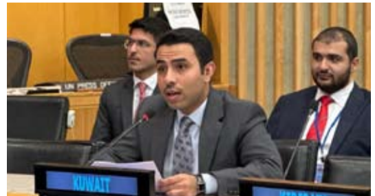
المحقق الدبلوماسي الكويتي شبيب العجمي

اعتبرت دولة الكويت، أول أمس، أن الشراكات الدولية تشكل وسيلة مثلى لتحقيق الأمن والسلام والعدالة بين الأمم، مؤكدة أنها ستظل داعمة لكل جهد يصب في مصلحة الشعوب وعدالة قضاياها ويساهم في تعزيز الاستقرار العالمي. وجاء ذلك في كلمة وفد دولة الكويت الدائم لدى الأمم المتحدة التي ألقاها المحقق الدبلوماسي شبيب العجمي أمام اللجنة الثانية للشؤون الاقتصادية تحت بند الشراكات العالمية. وقال العجمي: إنه في ظل التطورات المتسارعة والتحديات الخطرة على الأمن والسلام الدوليين التي يشهدها العالم تبرز أهمية الشراكات العالمية كحجر أساس لتحقيق الاستقرار ووصبم التعاون الدولي أمراً مهماً لمواجهة هذه التحديات.