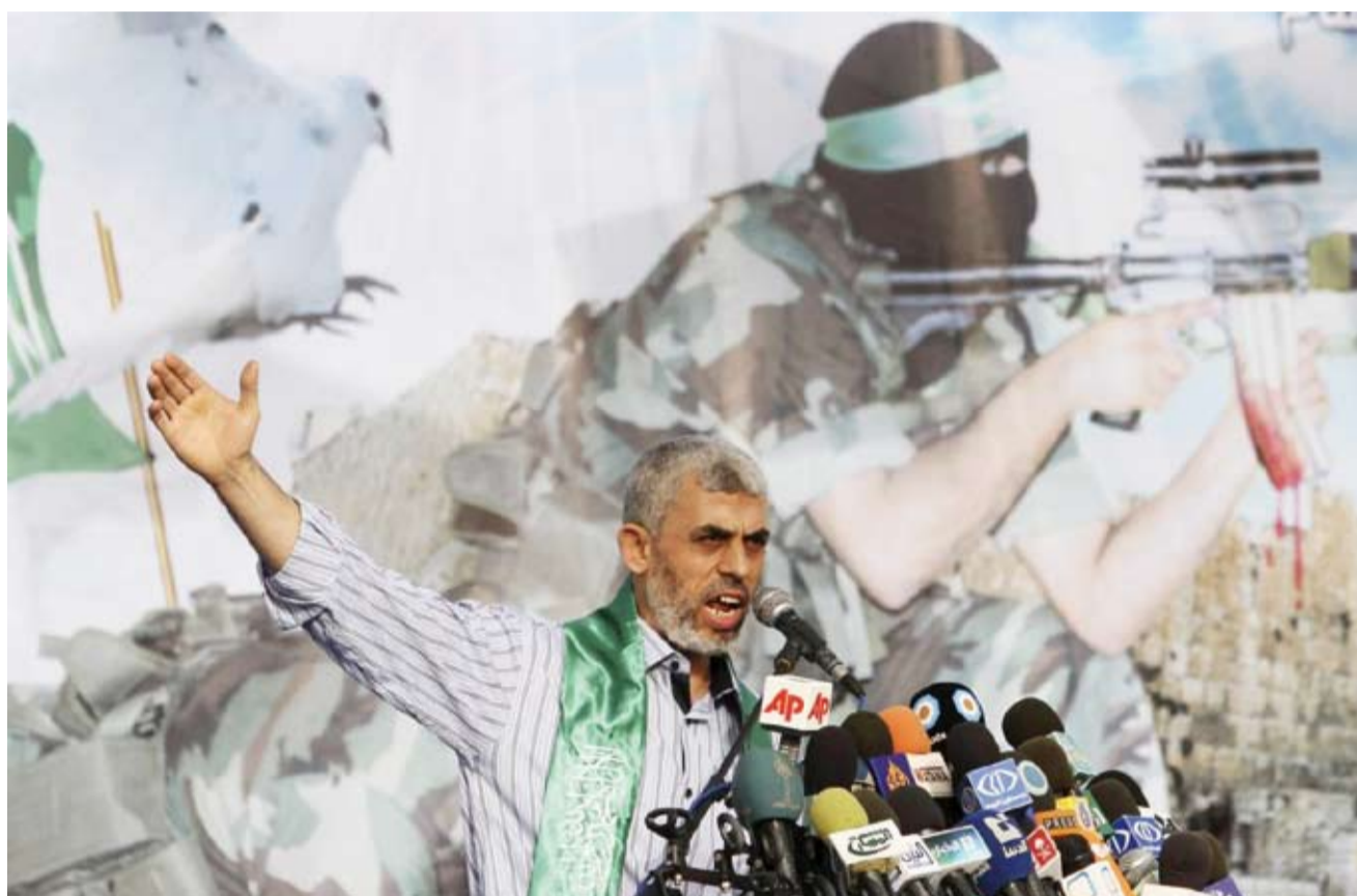
يجي السنوار مؤسس الجناح العسكري لحماس

«هكذا يموت الأبطال»... بهذه العبارة الموجزة وصف رجل يبلغ من العمر 60 عاماً في قطاع غزة اللحظات الأخيرة في حياة يحيى السنوار زعيم «حماس»، في ساحة المعركة، وهو يحاول صد طائرة مسيرة باستخدام عصا في يده. وبالتسوية لأخريين غيره، أصبح السنوار مثلاً يحتذى لأجيال قادمة حتى رغم حزن البعض على التكلفة الباهظة للحرب التي أشعلها السنوار مع إسرائيل. وقُتل السنوار يوم الأربعاء في اشتباك مسلح مع القوات الإسرائيلية بعد مطاردة استمرت عاماً، وأعلنت وفاته. كان السنوار العقل المدبر للهجوم الذي شنته حركة «حماس» على إسرائيل في السابع من أكتوبر 2023 والذي اشتعلت بعده الحرب في قطاع غزة. وظهر السنوار في لقطات فيديو مُلثماً ومصاباً بجرح قاتل في شقفة دمرها القصف وهو يحاول إلقاء عصا على طائرة مسيرة كانت تصوره. وأثارت هذه اللقطات للحظات الأخيرة في حياته شعوراً بالفخر والعزة بين الفلسطينيين.