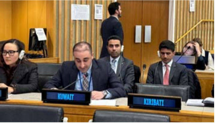
المحقق الدبلوماسي الكويتي عبد الله بوعباس

وأكد أن دولة الكويت داعم بلا هوادة للقضية الفلسطينية اقتصادياً ومعنوياً من خلال مؤسساتها الرسمية فضلاً عن أنها لم تدخر أي وسيلة في سبيل ذلك سواء في تنظيم الوفقات التضامنية أو تنظيم حملات واسعة تدعو إلى مقاطعة الشركات التجارية الداعمة للاحتلال. وختتم المحقق الدبلوماسي الكويتي كلمة البلاد بالتأكيد على الجهود الحميدة للأمم المتحدة بمساعدة ودعم الدول المتكوبة.