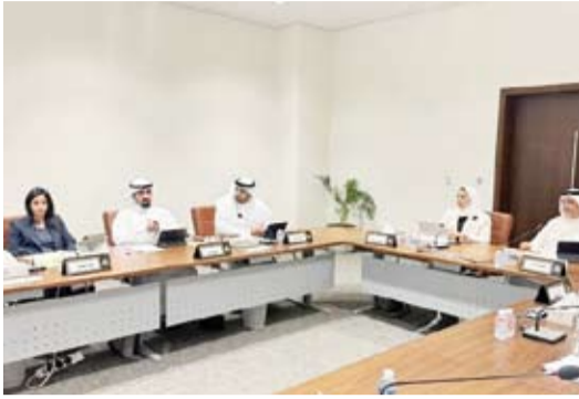
اجتماع سابق للجنة العاصمة