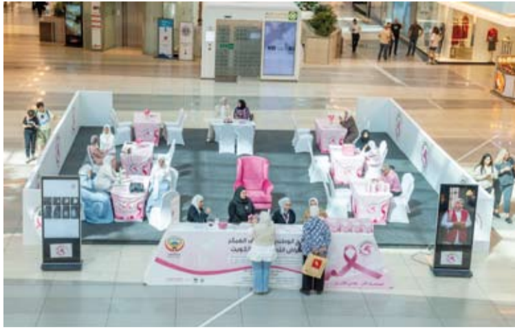
جانب من توعية زوار المركز التجاري