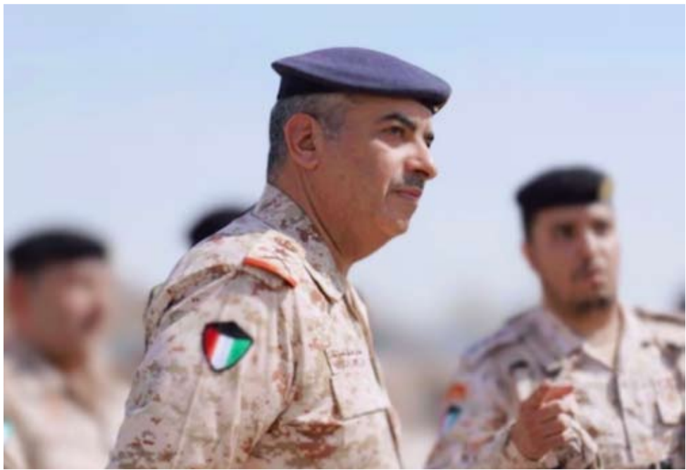
الفريق الركن طيار بندر المزين

قام رئيس الأركان العامة للجيش، الفريق الركن طيار بندر المزين، بجولة تفقدية صباح أمس الأول، شملت عدداً من المعسكرات والمواقع العسكرية استمع خلالها إلى إيجاز من أمار الأطقم والخفارات المناوبة عن بيان طبيعة الواجبات المناطة وآلية سير العمل والجاهزية. وقالت (الأركان) في بيان صحفي: إن الفريق المزين دعا خلال جولته إلى المحافظة على أعلى درجات اليقظة والجاهزية القتالية، متمنياً لهم دوام التوفيق والسداد بتنفيذ المهام الموكلة لهم للحفاظ على أمن وسلامة وطننا المعطاء.