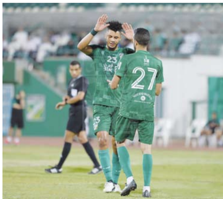
العربي يتطلع لعودة الانتصارات

يتطلع فريق العربي لطرة القدم لاستعادة توازنه في دوري زين الممتاز. عندما يلتقي اليوم مع اليرموك ضمن منافسات الجولة السابعة والتي تختتم بمواجهة كاظمة مع خطان. وتعرض العربي إلى الخسارة في الجولة الماضية أمام الكويت، كما أن المباراة ستكون بروفة قبل مشاركة الأخضر في بطولة كأس التحدي الآسيوي واعتبارا من 26 من الشهر الجاري أديبش عطا القيرغيز ستاني. وبالمنظر يأمل اليرموك الذي غاب عن الفوز منذ بداية الموسم، إلى تحقيق المفاجأة أمام العربي، وتحقيق نتيجة إيجابية أقلها التعادل.