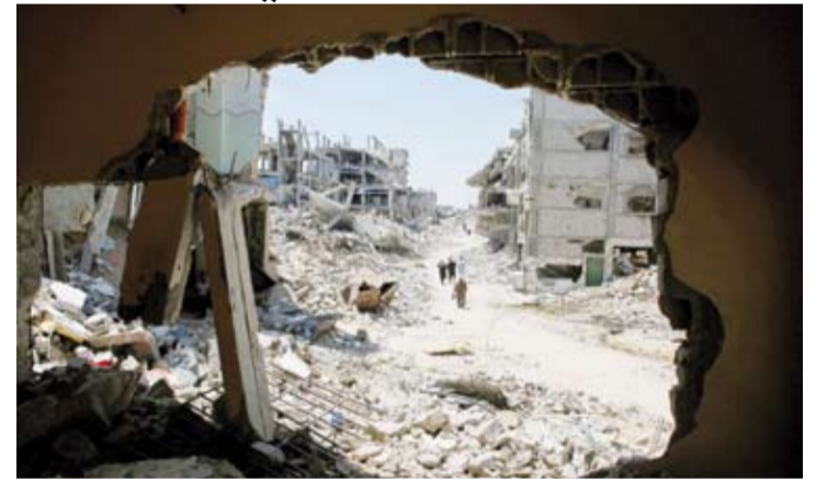
دمار كبير في غزة

غير القانوني في الأرض الفلسطينية المحتلة.