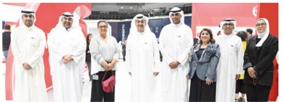
فريق زين في المعرض

المستقبل التي تُمكّن جوهر أعمالنا في زين». وأضافت بقولها: «نتجهج زين استراتيجية شاملة للغاية المؤسسية والموارد البشرية للاستثمار في العصر البشري، فنحن نحرص بشكل دوري على تعزيز قدرات ومواهب موظفينا في شتى أوجه ومجالات العمل بما يحقق النمو المستدام لسيرتهم الوظيفية، وبالأخص في المجالات الحديثة مثل التحول الرقمي، الذكاء الاصطناعي، الأمن السيبراني، البيانات الضخمة، وغيرها».