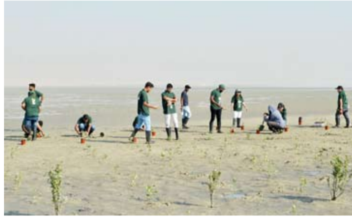
زراعة نباتات القرم في المحمية