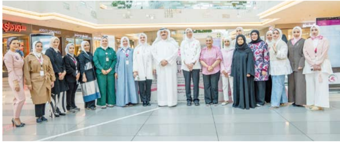
د. أحمد العوضي وعدد من المشاركين في الاحتفال

أعلن وزير الصحة الدكتور أحمد العوضي، أن البرنامج الوطني للكشف المبكر عن أمراض الثدي استقبل منذ إنطلاقته في العام 2014 نحو 40 ألف امرأة تم خلالها اكتشاف نحو 400 حالة مصابة بسرطان الثدي بعد عمل الماموجرام، مؤكداً أن الكشف المبكر يساعد على ارتفاع نسب الشفاء إلى نحو 98 في المائة.