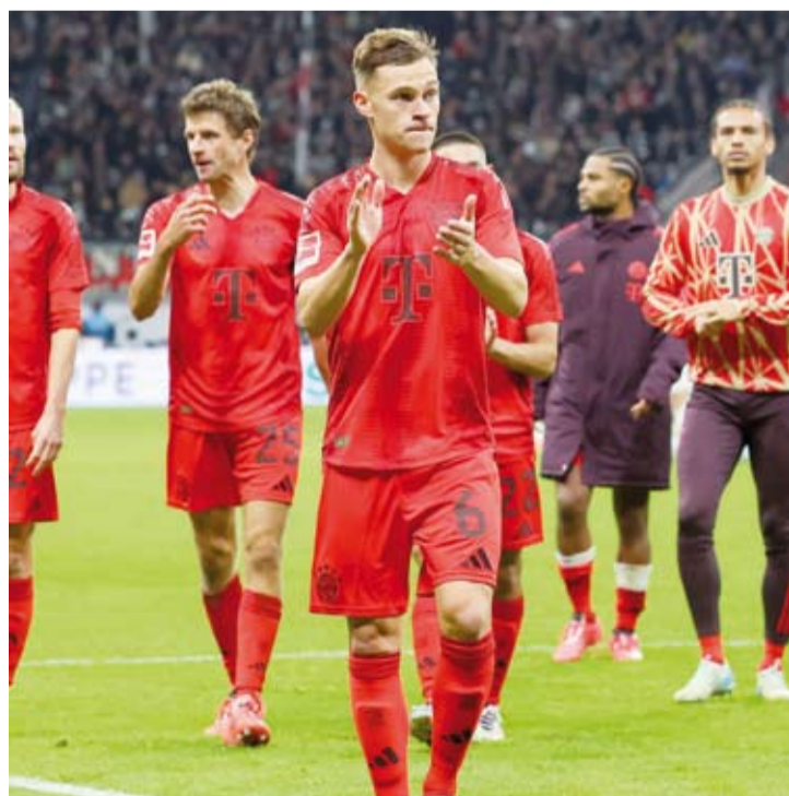
أداء غير مقنع لبايرن ميونيخ مع كومباني

قال فينسن كومباني مدرب بايرن ميونيخ المنافس في دوري الدرجة الأولى الألماني لكرة القدم إن الفريق لا يحتاج إلى تغييرات كبيرة مضيافا أن العودة لطريق الانتصارات باتت قريبة جدا رغم فشل الفريق في تحقيق الفوز في آخر ثلاث مباريات.