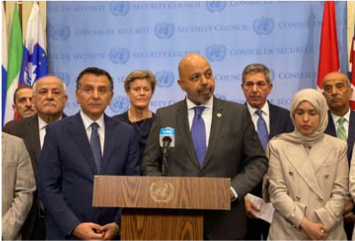
السفير طارق البنائي في مؤتمر صحفي

وقادت جهود المبادرة كل من دولة الكويت والأردن وسوليفنيا بمشاركة ذلك الوفود الدائمة لكل من الجزائر وبلجيكا والبرازيل وغيانا واندونيسيا وإيرلندا ولوكسمبورغ والفرويج والبرتغال وقطر وجنوب أفريقيا وإسبانيا وفلسطين