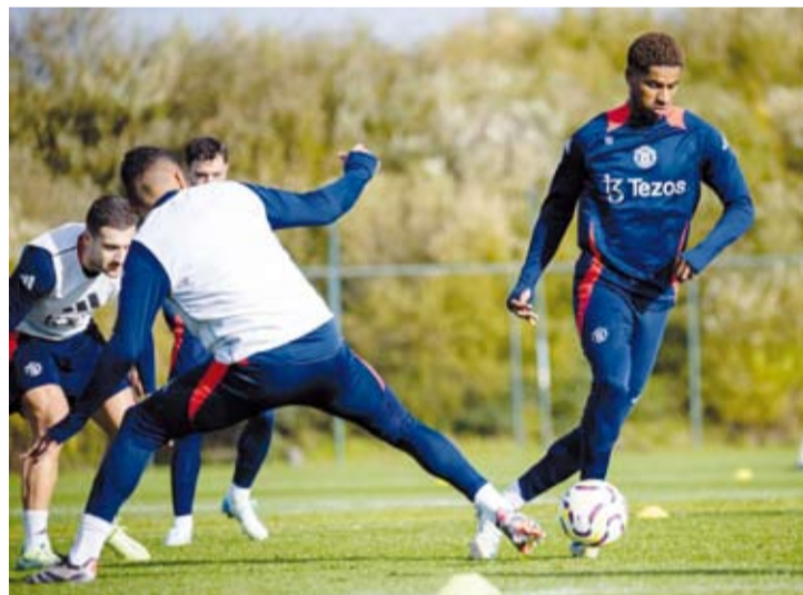
جانب من تدريبات مانشستر يونايتد

قال إريك تن هاغ، المدير الفني لفريق مانشستر يونايتد الإنجليزي، إن السير أليكس فيرغسون «هو مانشستر يونايتد، ويعتقد أنه سيظل متاحا لمساعدة الفريق للعودة للقمّة، رغم أنه ترك منصبه كسفير للنادي.