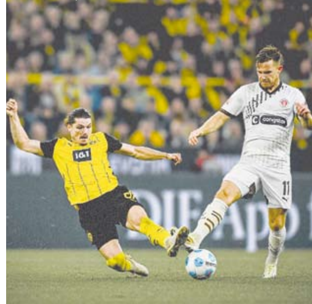
لقاء مفير في الدوري الألماني

أحرز سيرو جيراسي مهاجم دورتموند هدفا في الدقيقة 83 ليمنح فريقه الفوز 2-1 على ضيفه سانت باولي ليتقدم للمركز الرابع في دوري الدرجة الأولى الألماني لكرة القدم مؤقتا.