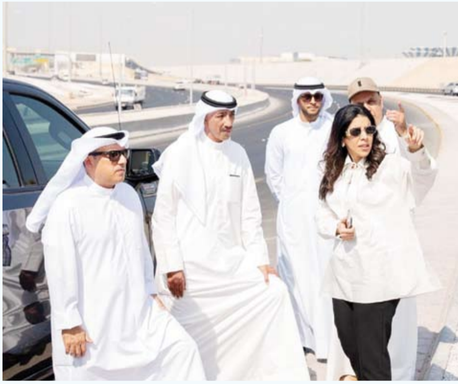
المشعان وبوشهري أثناء الزيارة الميدانية التفقدية للمطار الأميري وطريق المطار

أكدت وزيرة الأشغال العامة الدكتورة نورة المشعان، أن وزارة الأشغال ومهيئة الطرق بصدد الانتهاء من صيانة طريق المطار والمطار الأميري والإنهاء من جميع التجهيزات المطلوبة قبل موعد القمة الخليجية. ووجهت بضرورة تسريع وتيرة إصلاح الطرق المؤدية إلى المطار ومراعاة أهمية ذلك وتكثيف الأعمال لضمان سلامة وسلاسة الحركة المرورية لجميع الضيوف القادمين للكويت بالقمة الخليجية 45. طلبت المشعان خلال جولة تفقدية قامت بها أمس برفقة وزير الكهرباء والماء والطاقة المتجددة الدكتور محمود بوشهري، ومدير عام الهيئة العامة لشؤون الزراعة والثروة السمكية بالتكليف المهندس ناصر تقي في المطار الأميري وطريق المطار متابعة الاستعدادات لأعمال الدورة 45 للمجلس الأعلى لمجلس التعاون لدول الخليج العربية التي ستعقد في الكويت في ديسمبر المقبل، بسرعة إنجاز جميع الأعمال بالجودة والكفاءة المطلوبة وفقاً للمواصفات الفنية المعتمدة والالتزام بالبرنامج الزمني المتعهد به.