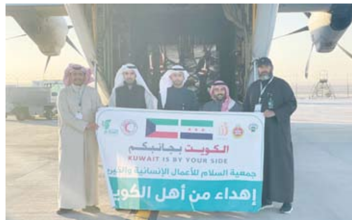
الجهات الرسمية المشاركة بالطائرة الإغاثية الثامنة إلى سورية

من المساعدات الإضافية بالتنسيق مع منظمة الهلال الأحمر العربي السوري لإستلامها وتوزيعها هناك. وأوضح العون أن نوعية المساعدات تحدد بالتنسيق مع منظمة الهلال الأحمر العربي السوري بعدها يتم معرفة وقياس الاحتياجات الأساسية وتزويد الجمعية من دول مختلفة للإسهام باستقرار سورية ومساعدتها على تجاوز الوضع الراهن. ويأتي هذا الجسر الجوي ضمن حملة (الكويت بجانبكم) وبالتزامن مع التسهيلات التي تقدمها الجهات الرسمية في البلاد ومنها وزارات (الشؤون) والدفاع مغلاً بالقوة الجوية والخارجية الكويتية تنفيذاً للتوجهات السامية لمساعدة الأشقاء السوريين.