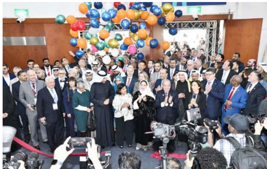
ختام فعاليات معرض «هورিকা الكويت

المنتجات الوطنية وتنوع مصادر الدخل وإعادة هيكلة الاقتصاد بتقليل الاعتماد على الإيرادات النفطية ورفع مستوى الإيرادات غير النفطية. وبهذه المناسبة، أشارت مدير عام شركة ليدز جروب للاستشارات ورئيس اللجنة المنظمة للمعرض نبيلة العنجري أن الاهتمام المتزايد للقطاع السياسي للمعارض الوطنية تجسد في زيارة النائب الأول لرئيس مجلس الوزراء ووزير الدفاع ووزير الداخلية الشيخ فهد يوسف سعود الصباح، بالإضافة لرعاية معالي وزير