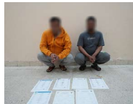
الأسويين بعد ضبطهما أمس

وأكدت الوزارة أنها ستدخذ كافة الإجراءات القانونية بحق المتهمين وإحالتهم إلى جهات الاختصاص مشيرة إلى استمرارها في التصدي بحزم لكل من تسول له نفسه العبث بأمن البلاد أو مخالفة القوانين.