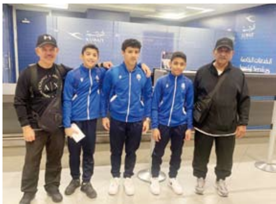
وقد منتخب الجيمباز الفني قبيل المغادرة إلى باكو

ودعمهم لهذه اللعبة التي فرضت نفسها بقوة في البطولات الدولية، مؤكداً أن الاتحاد ماضٍ في تطوير اللعبة بشقيها الفني والإيقاعي لتكون من أبرز الألعاب التي تحقق الإنجازات باسم الكويت.