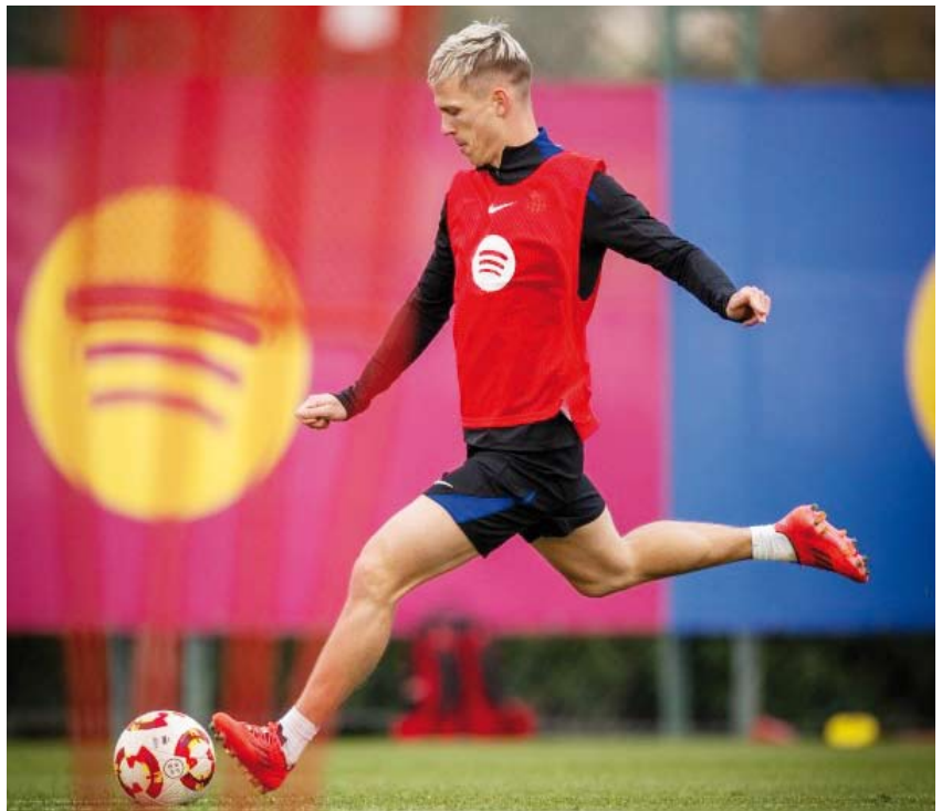
داني أولمو مصاب بالساق اليمنى

التي تعافيه». ودخل أولمو بديلاً في الدقيقة 62 من مواجهة فريقه برشلونة أمام مستضيفه خيتافي والتي انتهت بالتعادل (1-1) ضمن الجولة العشرين من الدوري الإسباني لكرة القدم. وسيغيب أولمو عن مواجهة برشلونة ومستضيفه بنفيكا