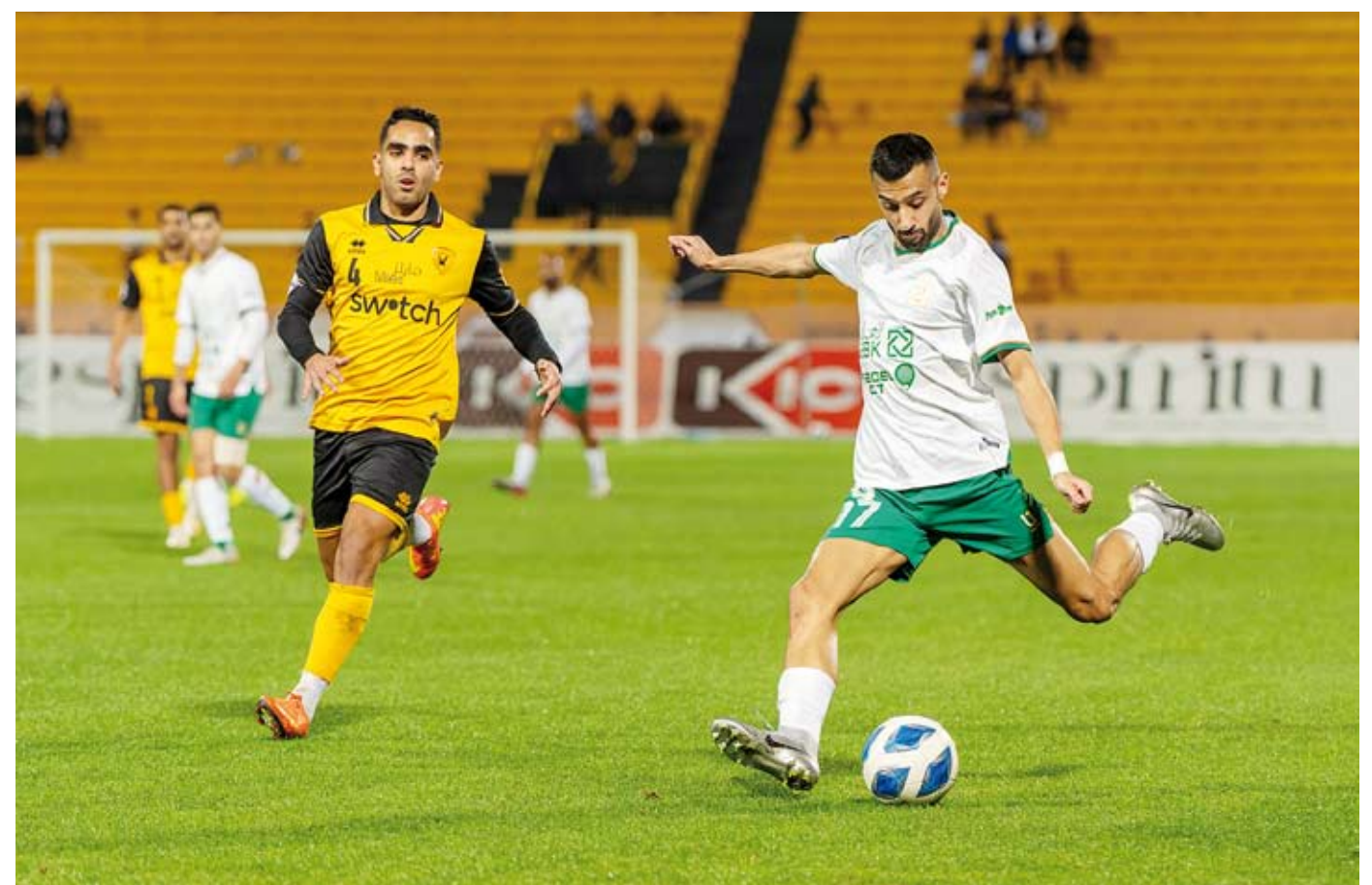
ريمونتادا تاريخية للاخضر أمام الاصرر القدساوي