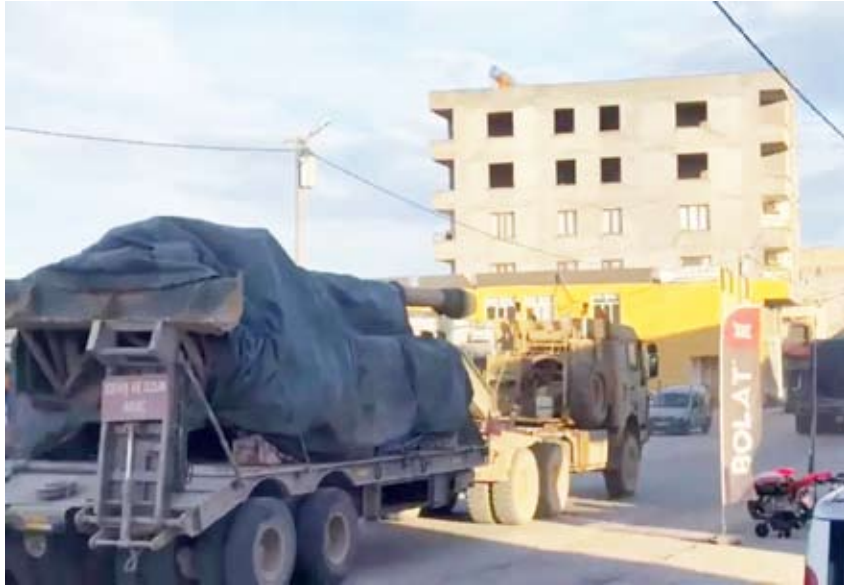
الجيش التركي أرسل معدات إلى عين العرب

مناطق شمال شرقي سوريا الخاضعة لسيطرة «قسد». وبالتزامن، قال وزير الدفاع في الإدارة السورية، مرفه أبو قصرة، إنه لن يكون من الصواب أن يحتفظ المسلمون بالبلاد المدعومون من الولايات المتحدة والمتركزون في شمال شرقي البلاد، في إشارة إلى