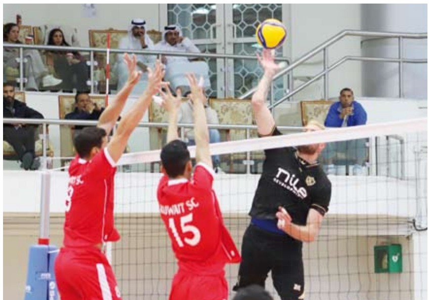
مباراة مثيرة بين الكويت والزمالك

يوم 25 يناير الجاري. وضمت المجموعة الأولى فرق السويحلي الليبي والسلام العماني وبني ياس الإماراتي فيما ضمت المجموعة الثانية كلاً من السيب العماني والكويت الكويتي والهلال الليبي والزمالك المصري. بينما ضمت المجموعة الثالثة فرق أربيل العراقي ودار كليب البحريني والأهلي المصري والشرطة القطري فيما ضمت المجموعة الرابعة فرق غزة الفلسطيني وبرقان الكويتي وقطر القطري والجزيرة الإماراتي.