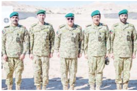
الفريق هاشم الرفاعي خلال جولته التفقدية

في المعسكر. واستمع الفريق الشيخ مبارك المحمود ونائب رئيس الحرس الوطني الشيخ فيصل السواف لتوفير كافة احتياجات الوحدات العاملة