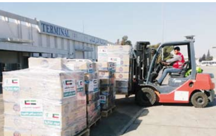
تحميل المساعدات في مطار دمشق