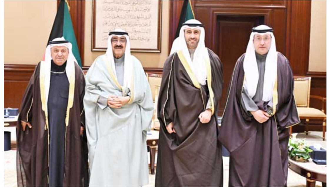
صاحب السمو أمير البلاد مستقبلاً وزير النفط ورئيسي مؤسسة البترول و«نفط الكويت»

أسيرات الاحتلال خرجن والابتسامات تعلو وجوههن، وبدأ آهتهن بصحة جيدة، وتم معاملتهن معاملة حسنة بلا عنف أو تعذيب، على الجانب الآخر بدأ الفلسطينيون المفرج عنهم سواء من الرجال أو النساء أو الأطفال وقد بدت عليهم آثار التعذيب والعنف والمعاملة السيئة، وتحدث عدد منهم عن طرق مختلفة للتعذيب طوال فترة اعتقالهم، حتى أن الإفراج عنهم في ساعة متأخرة من الليل، تم بشروط وبتعليمات مشددة لنزولهم تمنعهم من الاحتفال، وإلا أعيد اعتقالهم.