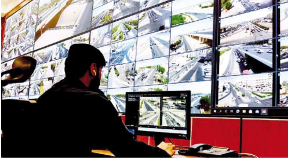
متابعة قسم العمليات لحركة السير بالطرق الرئيسية في البلاد

صدر يوم أمس الأول، المرسوم بقانون رقم (5) لسنة 2025 بتعديل بعض أحكام المرسوم بقانون رقم 67 لسنة 1976 في شأن المرور على أن يتم تنفيذ المرسوم والعمل به بعد ثلاثة أشهر من تاريخ نشره في الجريدة الرسمية.