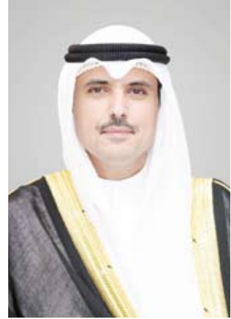
محافظ الأحمدى الشيخ حمود الجابر

الطرق الرئيسية لتحسين المظهر الجمالي وتوفير بيئة صحية أكثر اخضراراً تسهم في الحد من التلوث وتحسين جودة الحياة. وفيما يتعلق بتطوير الحدائق العامة أفاد أنه يجب أن تتضمن المبادرة إضافة مرافق جديدة داخل الحديقة كمسارات للمشي وأماكن للجلوس وزراعة الأشجار والنباتات الجديدة. وبالنسبة لإنشاء النصب التذكارية ذكر الشيخ حمود الجابر أن المبادرة يجب أن تتضمن بناء نصب تذكاري لتخليد حدث كبير وأن يعكس تصميمه القيمة التاريخية أو الثقافية للحدث وبالنسبة لصيغ الجسور يجب أن تتضمن المبادرة استخدام أصباغ مقاومة للعوامل الجوية للحفاظ على جودتها فترة طويلة. وكان مجلس الوزراء اطلع في اجتماعه الأسبوعي في 31 ديسمبر الماضي على عرض مرثى قدمه محافظ الأحمدى المواقع التي ستتم فيها المبادرات وتحديد التراخيص المطلوبة لكل منها وإعداد نماذج بخصوص الإجراءات التي يجب على المبادرين اتباعها مع الجهات الحكومية المعنية. ولفت إلى تضمين المبادرات التجميلية زراعة الأشجار والنباتات على جوانب