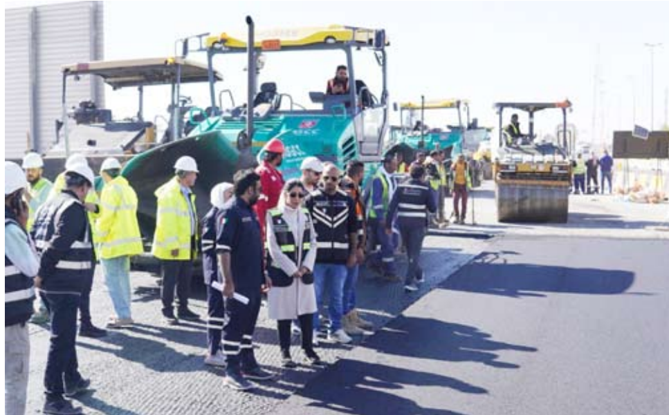
جانب من العمال في وجود وزيرة الأشغال نورة المشعان

وتطوير وتوسيع الطرق القائمة حالياً حسب القطاعات العرضية والتنظيمية المعتمدة وتوفير شبكات صرف أمطار نموذجية وأمنة في منطقة المشروع. وأشارت إلى أن نطاق الأعمال يتمثل في ربط شبكة الطرق الداخلية على الشبكة الرئيسية حيث يبلغ الطول الكلي للطريق 8.72 كم بالإضافة إلى تنفيذ شبكة صرف صحي وشبكة صرف أمطار.