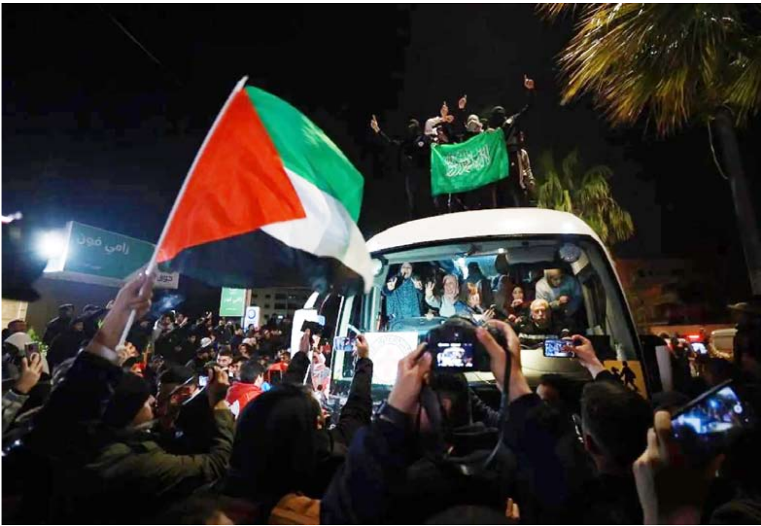
حافلة تحمل أسرى فلسطينيين

عاش قطاع غزة، أول يوم هادئ منذ 15 شهراً، مع دخول اتفاق وقف النار بين إسرائيل وحركة «حماس» حيز التنفيذ. وتُوجّ اليوم الأول من الهدنة بتبادل الأسرى، بعدما سلّمت حركة «حماس» 3 أسيرات إسرائيلية إلى الصليب الأحمر، ليسلمهن بدوره إلى إسرائيل، بينما أفرجت الأخيرة عن 90 من المعتقلين الفلسطينيين (أسيرات وأطفال)، وأعادتهم إلى منازلهم في الضفة الغربية والقدس. وتسيب تأخر «حماس» في تسليم قائمة بأسماء الأسيرات الخلال لأسباب «فنية»، كما قالت، بإقدام إسرائيل على شن قصف سقط فيه 15 قتيلاً في مناطق مختلفة من القطاع. وحاول الغزيون استعادة نمط الحياة التي دبت بسرعة في الشوارع والأسواق، خصوصاً مع إدخال مئات الشاحنات من المساعدات عبر