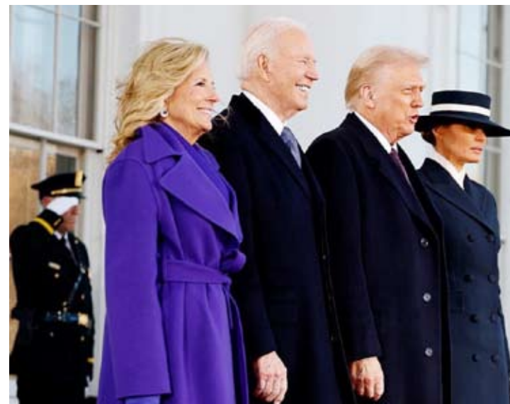
الرئيس الأميركي وعقبته في استقبال ترامب وميلانيا

استقبل الرئيس الأميركي جو بايدن خليفته دونالد ترامب، أمس، خارج مقر البيت الأبيض في تقليد يتكرر مع بدء مناصب تولي الرئاسة. وكان بايدن وعقبته جيل في انتظار ترامب وقرينته ميلانيا عند أبواب البيت الأبيض قبل التقاط صور فوتوغرافية للجميع وسط أجواء شديدة البرودة. وفي تعليق مقتضب، قال بايدن: «هذا يوم جميل، أهلاً بكم في المنزل». بينما علقت نائبة الرئيس، كامالا هاريس، بعبارة «هذه هي الديمقراطية».