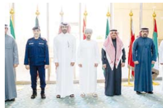
المشاركون في التمرين

المركز مساعد أو إسناد من دولة أخرى، مبيته أن الأهداف الثانوية للتمرين هي اختبار وسيلة الاتصال بالدول الأعضاء وتحليل المشاركين في التمرين للإدخالات. وأشارت إلى تحقيق تمرين (إسناد 1) أهدافه بنجاح جاهزية الفرق المشاركة إذ أتمت في 21 أكتوبر الماضي مهمة مطلوبة خلال 8 ساعات موضحة أنه تمت مناقشة النجاح الذي حققه التمرين والتوصيات التي تهدف لتحسين التجارب في التمارين القادمة.