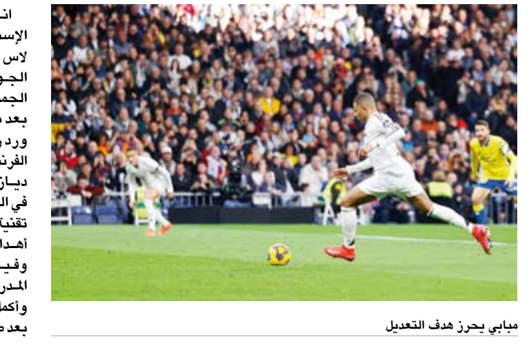
مبابي يحرز هدف التعديل

انفرد ريال مدريد بصدارة الدوري الإسباني لكرة القدم بفوزه على ضيفه لاس بالماس بنتيجة 4-1. ضمن منافسات الجولة العشرين. فاجأ لاس بالماس الجميع بهدف ميكر أحرزه فايو سيلفا بعد مرور 27 ثانية من بداية اللقاء ورد ريال مدريد بأربعة أهداف سجلها الفرنسي كيليان مبابي "ثنائية" وإبراهيم ديان ورودريجو وفيدريكو فالغويردي في الدقائق 18 و33 و36 و57. وألغت تقنية حكم الفيديو المساعد (فار) ثلاثة أهداف أخرى لمبابي وجود بيلينجهام وفيدريكو فالغويردي نجوم الفريق المردي في الدقائق 43 و73 و86. وأكمل لاس بالماس اللقاء بعشرة لاعبين بعد طرده لآعبه بيتينو راميريز في الدقيقة