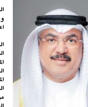
وزير التربية المهندس سيد جلال الطيباني

وأضافت أن هذا النهج يهدف إلى تعزيز المشاركة الفاعلة لأهل الميدان التربوي في صياغة اللوائح المنظمة للعملية التعليمية، والاستفادة من الخبرات المتركمة للمعلمين والإدارات المدرسية والموجهين الفنيين، بما يضمن إعداد لائحة واقعية وقابلة للتطبيق تستجيب لاحتياجات جميع المراحل التعليمية. ودعت وزارة التربية، جميع العاملين في الميدان التربوي، إلى المشاركة الفاعلة في الاستطلاع الإلكتروني وإبداء آرائهم وملاحظاتهم ومقترحاتهم المهنية، مؤكداً أن اللائحة الجديدة تمثل خطوة مهمة نحو بناء منظومة تعليمية أكثر كفاءة ومرونة واستجابة للتحديات والتغيرات المستقبلية، بما يحقق تطلعات الوزارة في الارتقاء بجودة التعليم وتحسين البيئة المدرسية في مختلف المراحل التعليمية.