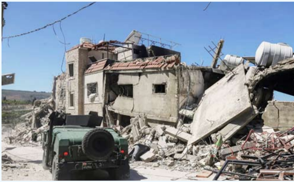
عناصر الجيش اللبناني بين ركام المنازل في بلدة القبلية

وقال رئيس الوزراء الإسرائيلي، بنيامين نتنياهو، إن إسرائيل «لن تتسامح مع أي هجمات على جنودها أو أراضيتها»، متوعداً «حزب الله» برد قاس عقب مقتل الجنود الأربعة. وأضاف أن القوات الإسرائيلية ستبقى فيما تسميه «المنطقة الأمنية» في جنوب لبنان ما دامت اقتضت الضرورة ذلك لحماية المستوطنات الشمالية. من جهته، أكد وزير الدفاع الإسرائيلي إسراييل كاتس أن الجيش سيبقى منتشراً من ساحل البحر حتى مرتفعات قلعة الشقيف، مضيفاً أن أي خرق لوقف إطلاق النار سيُقابل برد قوي للغاية.