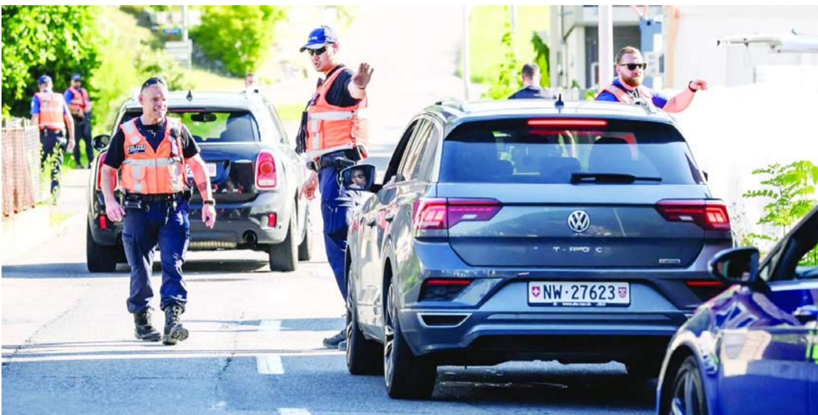
عناصر من الشرطة السويسرية أمام فندق بورغستوك

يوليو، الأمر الذي أزال الحاجة الملحة إلى عقد الاجتماع في مواعده المقرر. وقال إن اجتماع أرحى إلى موعد آخر، فيما تتواصل المشاورات عبر الوسطاء بشأن المرحلة المقبلة من المفاوضات الخاصة بصياغة الاتفاق النهائي.