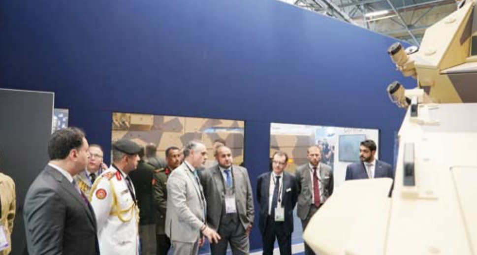
.. ويؤزر معرض يورو ساتوري 2026 في باريس