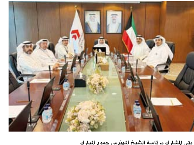
الوفد الكويتي المشارك برئاسة الشيخ المهندس حمود المبارك

من جهته، أعرب الوفد الكويتي المشارك برئاسة رئيس الهيئة العامة للطيران المدني الشيخ المهندس حمود المبارك عن تقدير دولة الكويت للدعم الذي حظيت به من منظمة الطيران المدني الدولي وأعضاء منظمة الطيران العمارة العربية، مؤكداً أن هذا الموقف يجسد التزام المجتمع الدولي بحماية الطيران المدني وصون أمن وسلامة المنشآت والمرافق المدنية.