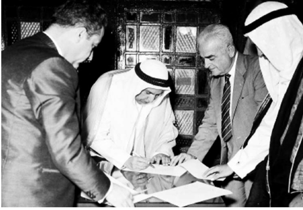
الشيخ عبدالله السالم يوقع على وثيقة استقلال الكويت في 19 يونيو 1961

وكانت البلاد -قبل الاستقلال- زاخرة بالعديد من الإدارات المنظمة تنظيماً جيداً والمهارة على مستوى البنية التحتية لمزيد من التوسع والإزدهار.