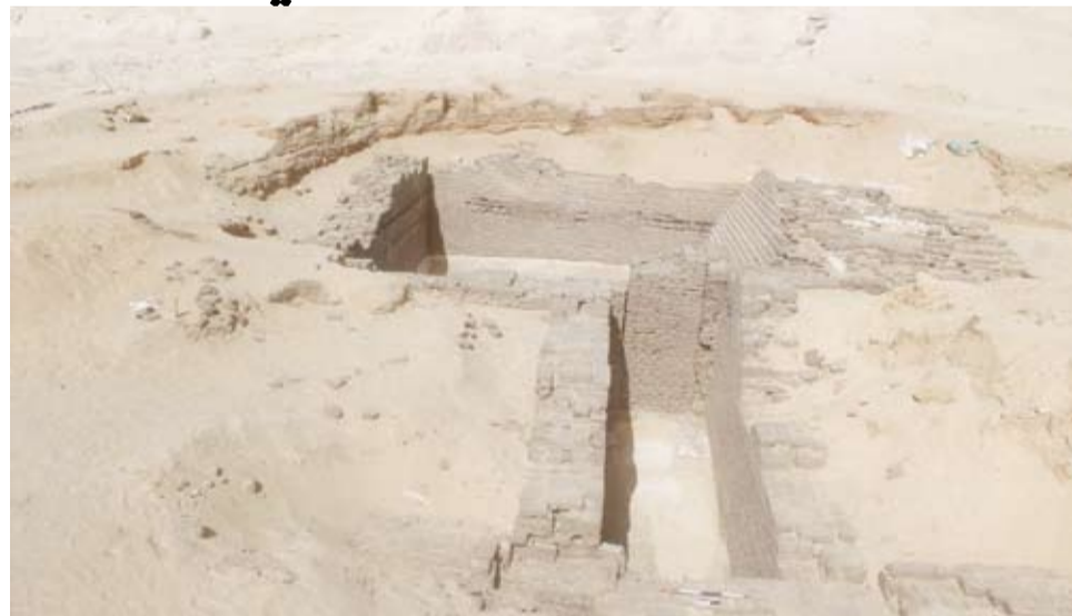
العثور على مقبرتين أثريتين من العصر العتيق