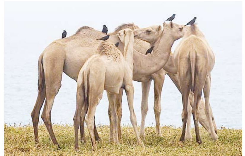
إحدى الصور المشاركة

المحتوى المعرفي الحر وإتاحته للجميع. وكانت مسابقة (ويكي تهوى الأرض في الكويت) أطلقت لأول مرة في عام 2025، حيث حصلت في تلك النسخة صورتان من الكويت على جوائز عالمية مما سلط الضوء على المناظر الطبيعية الفريدة التي تزخر بها البلاد. ويمكن للهواة والمحترفين المشاركة من خلال رابط الحملة، وتعد (ويكي تهوى الأرض) مسابقة تصوير فوتوغرافي دولية تنظم سنوياً على (ويكيبيديا كومنز) ويدعى فيها