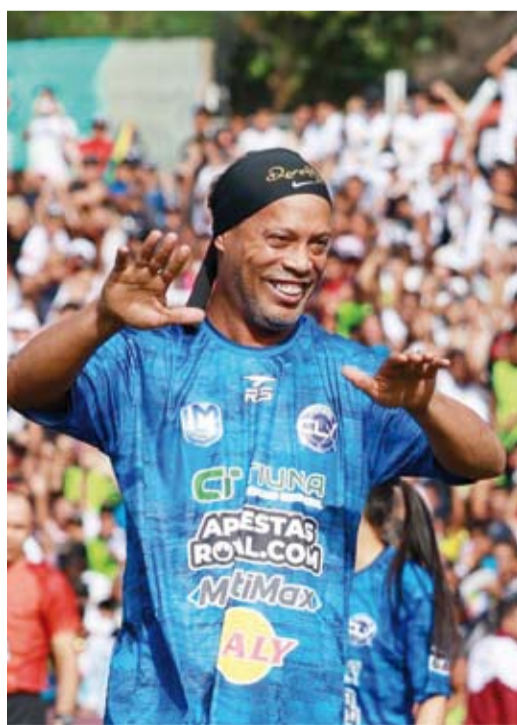
نجم كرة القدم البرازيلية رونالدينيو

كما أحرز لقب دوري أبطال أوروبا مع برشلونة بعد ذلك بأربع سنوات، وفاز بكأس ليبرتادوريس عام 2013 مع أنتليكو مينيرو.