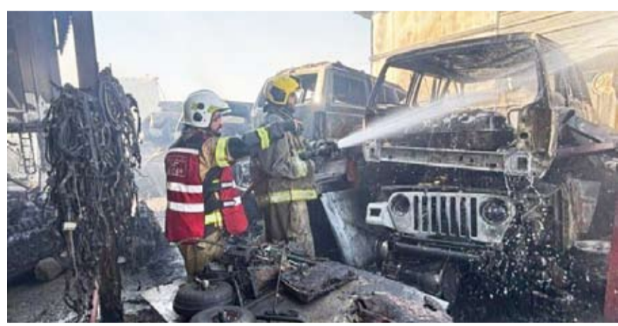
السيطرة على الحريق

أفادت قوة الإطفاء العام بأن 4 فرق إطفاء من مراكز الشقيا والجبراء الحرفي والقيروان والإسناد سيطرت يوم الجمعة على حريق في سكراب النعائم على طريق السالمي. وأوضح أنه تمت مكافحة الحريق والسيطرة عليه دون وقوع أي إصابات.