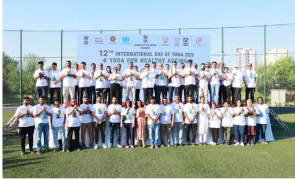
السفيرة الهندية متوسطة المنظمين