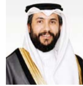
الشيخ الدكتور سلمان الصباح

وبيّن أن القرار أقر زيادة مرونة أوقات الزيارة لتصبح يوماً من الساعة الثالثة عصراً وحتى