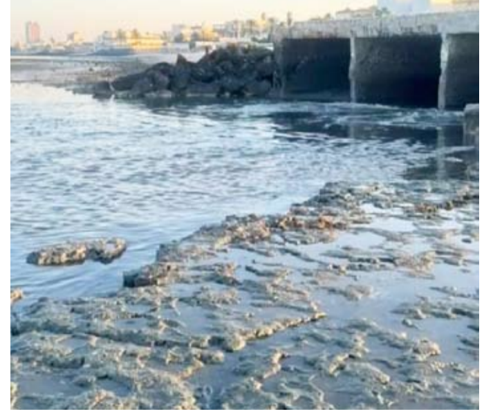
الهيئة أخذت عينات من المياه لإجراء الفحوص والتحليل المخبرية

أعلنت الهيئة العامة للبيئة أنها تابعت البلاغ المتداول عبر وسائل التواصل الاجتماعي بشأن رصد بقعة مائية داكنة اللون بالقرب من أحد مخارج تصريف المياه بمنطقة أنجفة. وقالت «الهيئة»، في بيان على منصة «إكس»، أن الفرق الفنية المختصة بالهيئة قامت بمعاينة الموقع ميدانياً، حيث لوحظت بعض المؤشرات البيئية بالموقع، بما استدعى استكمال أعمال الرصد والمتابعة وسحب عينات من المياه لإجراء الفحوص والتحليل المخبرية اللازمة، بالتنسيق مع الجهات الحكومية المعنية، وذلك للتحقق من طبيعة الحالة واتخاذ الإجراءات اللازمة وفقاً للاختصاص.