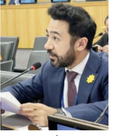
جاسم العامري متحدتاً

وفي هذا الإطار، أعرب السكرتير الثاني عن ترحيب البلاد بالتوصل إلى اتفاق حول مذكرة تفاهم بين الولايات المتحدة وإيران تقضي بإيقاف العمليات العسكرية، وأصفاً ذلك بأنه خطوة إيجابية نحو خفض التوترات وفتح المجال أمام الحلول الدبلوماسية. وشدد على تمسك دولة الكويت بأحكام الجزء الثالث من الاتفاقية ولا سيما المادة (37) المتعلقة بنظام المرور العابر في المضائق المستخدمة للملاحة الدولية لما تفضله من أهمية في ضمان أمن واستقرار حركة الملاحة العالمية. ونبه العامري إلى أن أمن الممرات البحرية الدولية يرتبط بشكل مباشر بأمن التجارة العالمية وسلاسل الإمداد والطاقة، داعياً إلى احترام الاتفاقيات والترتيبات القانونية القائمة بين الدول وحل الخلافات عبر الحوار وبحسن نية.