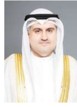
المستشار ناصر السميح

وبيّن أن الانخفاض في عدد القضايا المسجلة يمثل مؤشراً أولياً مهماً على الأثر العملي للقانون الجديد في ضبط مسار هذه القضايا وتحقيق توازن أفضل بين حماية الأسرة ومنع إساءة استخدام الإجراءات، وأضاف المستشار السميح،