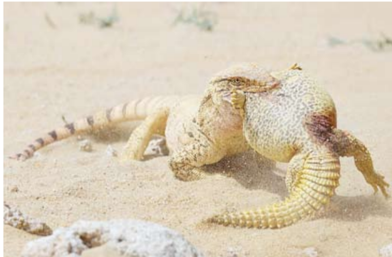
توثيق البيئة الصحراوية