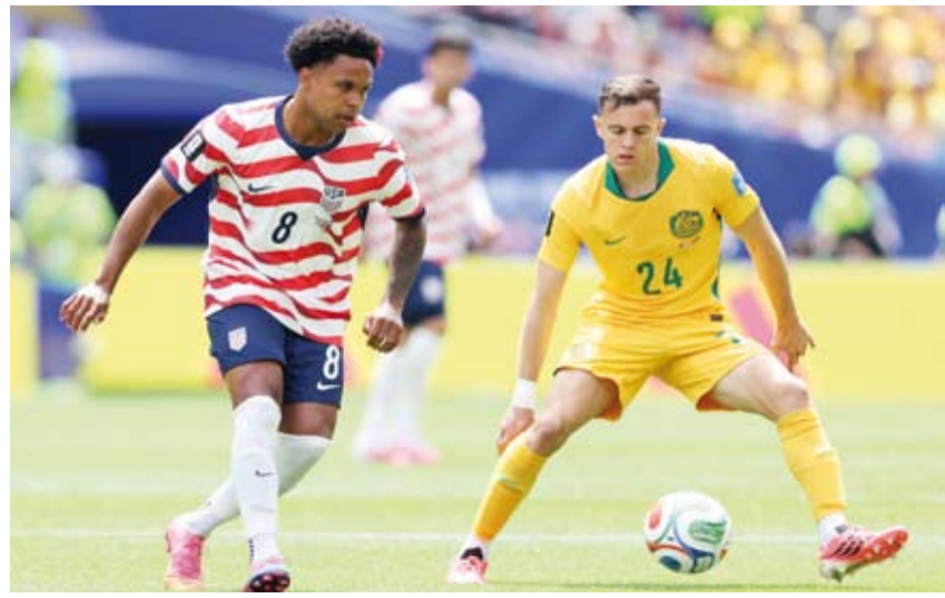
أميركا عبرت استراليا بفنائية نظيفة

ضمنت الولايات المتحدة تأهلها إلى دور الـ32 من نهائيات «كأس العالم 2026»، التي تستضيفها بالشراكة مع المكسيك وكندا، بعد فوزها على استراليا 2-0، في الجولة الثانية من المجموعة الرابعة. وباتت الولايات المتحدة ثاني المتأهلين إلى الدور