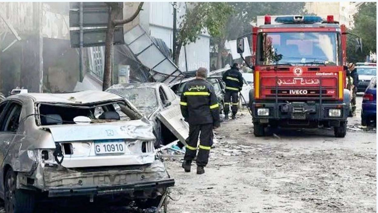
عدد المصابين ارتفع إلى 12121 جريحاً

أعلنت وزارة الصحة العامة اللبنانية أمس عن ارتفاع عدد قتلى العدوان الاحتلال الصهيوني على لبنان إلى 4057 شخصاً. وذكر التقرير اليومي الصادر عن مركز عمليات طوارئ الصحة التابع لوزارة الصحة أن هذا الرقم يمثل العدد الإجمالي لقتلى العدوان في الفترة من 2 مارس حتى 20 يونيو في حين ارتفع عدد المصابين إلى 12121 جريحاً.