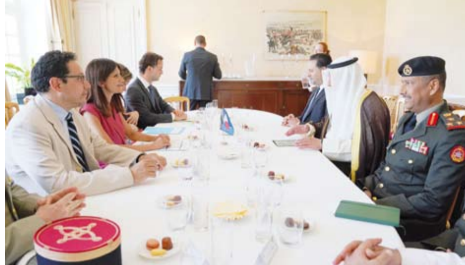
وكيل «الدفاع» يبحث مع كبار المسؤولين العسكريين الفرنسيين تعزيز التعاون

بحث ممثل وزير الدفاع الشيخ عبدالله العلي، وكيل وزارة الدفاع الشيخ الدكتور عبدالله مشعل الصباح مع عدد من كبار المسؤولين العسكريين في الجمهورية الفرنسية الصديقة موضوعات مشتركة. وقالت وزارة الدفاع في بيان صحفي أمس: إن الشيخ الدكتور عبدالله مشعل الصباح التقى على هامش زيارته معرض (يوروساتوري 2026) المقام في العاصمة الفرنسية باريس الوزير المنتدب لدى وزير القوات المسلحة وشؤون الحارين القدامى ليس روفو ورئيس الأركان الخاص لرئيس الجمهورية الفرنسية والمستشار العسكري لرئيس الجمهورية لشؤون الدفاع والأمن القومي الفريق أول فنان جيرو.