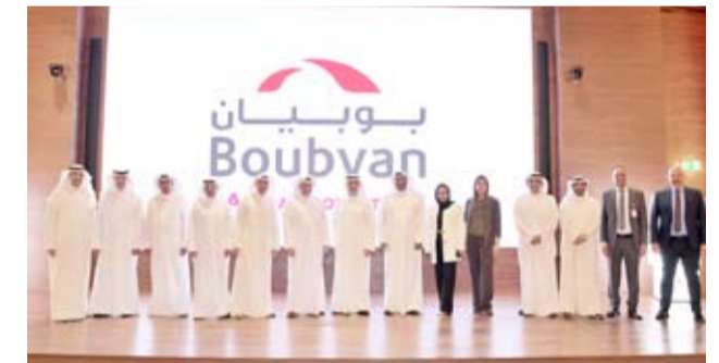
المجدد متوسماً القيادات التنفيذية للبنك

«بوبيان» يعلن عن تحوله المؤسسي في الذكاء الاصطناعي