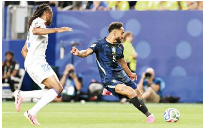
أداء قوي للسامبا أمام هايتي

وقضت البرازيل قدماً في دور الـ32، بعدما رفعت رصيدها إلى أربع نقاط في صدارة المجموعة الثالثة، متفوقة على المغرب الفائزة في وقت سابق على اسكو تلندا 0-1. بفارق الأهداف في المركز الثاني. وتأتي اسكو تلندا، التي تواجه البرازيل في مباراة حاسمة ضمن الجولة الثالثة والأخيرة من دور المجموعات، في المركز الثالث بثلاث نقاط، فيما تقبع هايتي في المركز الأخير من دون نقاط، وودعت النهائيات رسمياً.