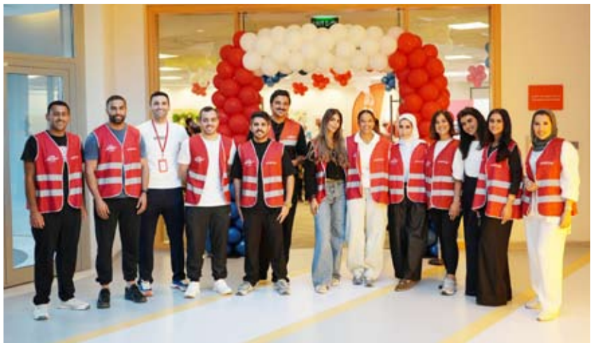
فريق سواعد الخليج التطوعي

بمناسبة الاحتفال باليوم العالمي للاب، وفي إطار دعمه المستمر للمبادرات الإنسانية والخيرية، قام بنك الخليج بزيارة مقر «بيت عبدالله لرعاية الأطفال»، المستشفى «KACCH»، بحضور عشرات الأطفال وأولياء أمورهم، وبمشاركة فاعلة من فريق «سواعد الخليج» التطوعي، الذي تفاعل مع الأطفال من خلال العديد من الأنشطة والفعاليات. تجسد هذه الزيارة جانباً من التزام بنك الخليج بالمسؤولية الاجتماعية ورغبته في رفع معنويات الأطفال، إذ تضمن برنامج الزيارة العديد من الفعاليات الترفيهية والتعليمية الممتعة التي تهدف إلى الترفيه عن الأطفال ورفع معنوياتهم. وحرص فريق سواعد الخليج التطوعي على إهداء الأطفال مجموعة من الألعاب