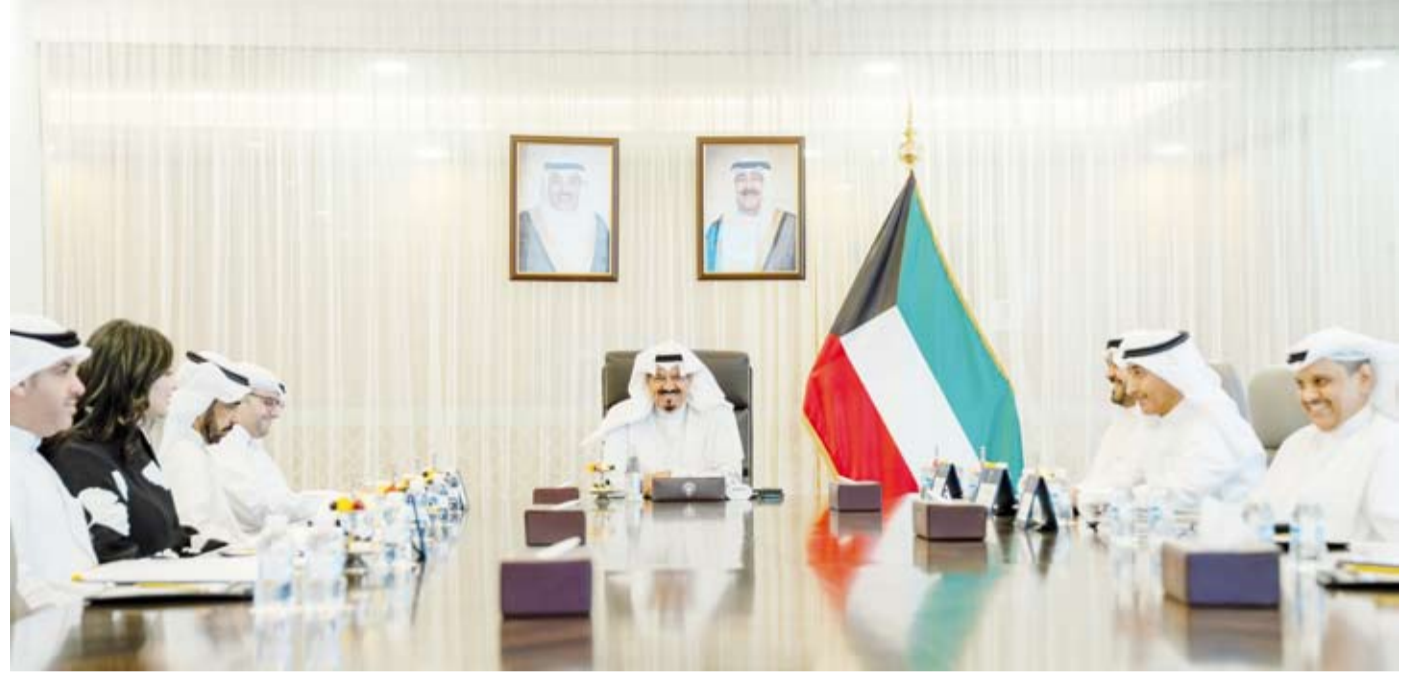
سمو الشيخ أحمد عبدالله يترأس الاجتماع

ترأس سمو الشيخ أحمد عبدالله رئيس مجلس الوزراء، اجتماعاً أمس، لمتابعة الأعمال التنفيذية الخاصة بالمناقصات العامة. وحضر الاجتماع وزير الدولة