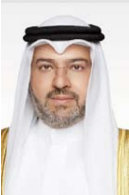
الشيخ المهندس حمود المبارك

والشؤون الإسلامية والإدارة العامة للجمارك إلى جانب حملات الحج الكويتية وشركات الطيران ومقدمي الخدمات الأرضية بما يسهم في إنجاح خطة تفويج الحجاج إلى الأراضي المقدسة. وذكر أن (الطيران المدني) تدعو الحجاج إلى الالتزام بالتعليمات والإرشادات المعلنة وفي مقدمتها الحضور إلى المطار قبل موعد الرحلة بثلاث ساعات والالتزام بحمل حقيبة واحدة داخل الطائرة إلى جانب التقيد بجميع الاشتراطات والتعليمات التي تفرضها شركات الطيران بهدف تسهيل إجراءات السفر وتسريع عمليات المغادرة بالتنسيق الكامل مع حملات الحج.