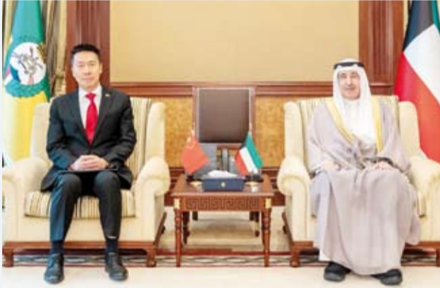
الشيخ مبارك الحمود مستقبلاً سفير الصين يانغ شن

بحث رئيس الحرس الوطني الشيخ مبارك الحمود مع سفير جمهورية الصين الشعبية لدى دولة الكويت يانغ شن موضوعات مشتركة. وذكر الحرس الوطني في بيان صحفي، أمس، أن الشيخ مبارك الحمود استقبل السفير شن وبحث معه خلال اللقاء عدداً من الموضوعات ذات الاهتمام المشترك بين الجانبين.