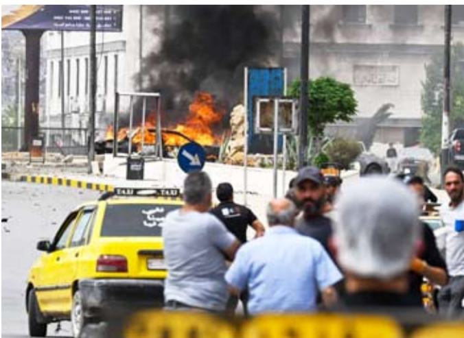
منديون يتابعون احتراق سيارة في موقع التفجير