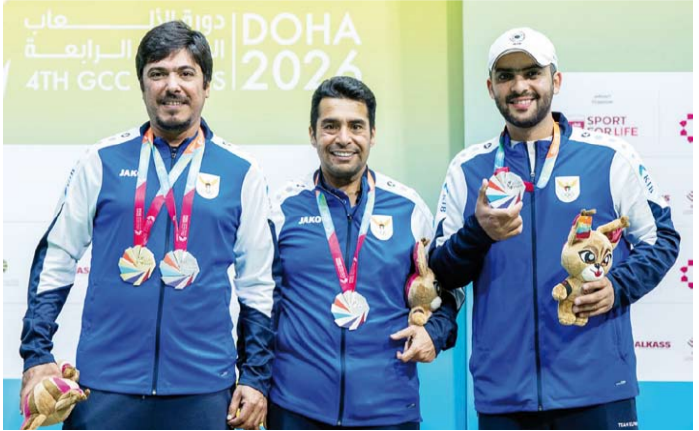
الكويت حصدت 11 ذهبية و16 فضية و24 برونزية

عززت دولة قطر صدارتها لفائمة الترتيب العام للميداليات برصيد 119 ميدالية متنوعة في ختام منافسات اليوم الثامن من دورة الألعاب الخليجية الرابعة «الدوحة 2026»، التي تستضيفها الدوحة وتتواصل منافساتها حتى الثاني والعشرين من مايو الجاري، فيما تقدمت الكويت إلى المركز الرابع برصيد 51 ميدالية متنوعة، وتوزعت الميداليات التي أحرزتها قطر في الدورة حتى الآن بواقع 43 ذهبية و44 فضية و32 برونزية، وذلك بعدما حصدت اليوم 9 ميداليات متنوعة بواقع 3 ذهبيات و6 فضيات في منافسات الرماية والسنوكر والكرة الطائرة. وجاءت السعودية في المركز الثاني