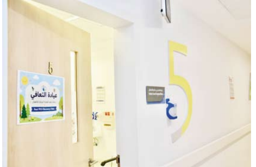
عيادة متخصصة للأطفال للتعافي ما بعد العناية المركزة

في الصميم موجة استياء وغضب كبيرين بعد مشاهدة مقطع فيديو للوزير المتطرف في حكومة الاحتلال ايتمار بن غفير، وهو يتباهى بإذلال ناشطي أسطول الصمود العالمي، فقد ظهر هؤلاء الأحرار بعد اعتقالهم واختطافهم في عرض البحر المتوسط، وهم مكبلي الأيدي ومطروحين أرضاً داخل ميناء أسدود. بن غفير تعمد إهانة عدد من الناشطاء والتعدي عليهم وحرص على إيدائهم واستخدام عبارات مسيئة وبذيئة بحقهم مهدداً أنهم سيقفون فترة طويلة في السجن... هذا هو الوجه الحقيقي للاحتلال المجرم.