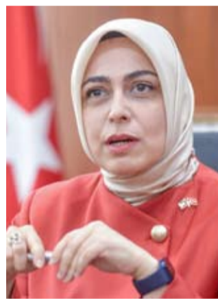
السفيرة التركية طوبى نور سونمز

بصفتي سفيرة الجمهورية التركية لدى الكويت، أرى في أسبوع المطبخ التركي جسراً هاماً