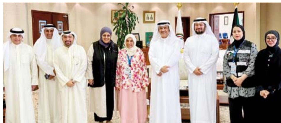
محافظ الجهراء حمد الحبشي مستقبلاً فريق «فخر وعطاء»

استقبل محافظ الجهراء حمد الحبشي، فريق «فخر وعطاء» التطوعي، حيث جرى خلال اللقاء الإطلاع على جهود الفريق وأبرز أعماله التطوعية والمجتمعية، وما يقوم به من مبادرات تهدف إلى خدمة المجتمع وتعزيز روح الانساني والتطوعي بين أبناء الكويت. وأشاد المحافظ بجهود الفريق ومبادراته الهادفة، مؤكداً دعم محافظة الجهراء للمبادرات الوطنية والمجتمعية التي تسهم في ترسيخ قيم التعاون والعطاء، وتعكس الصورة المشرفة لأبناء الكويت في خدمة وطنهم ومجتمعهم.