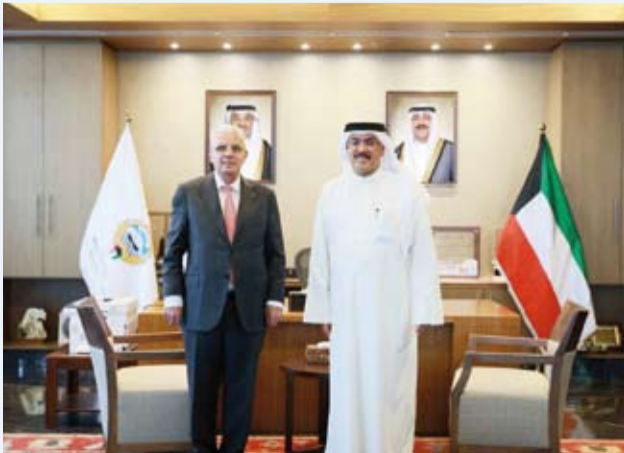
وزير التربية سيد جلال الطبطبائي مع سفير فلسطين رامي طهبوب

بحث وزير التربية سيد جلال الطبطبائي، أمس، سفير دولة فلسطين لدى البلاد رامي طهبوب سبل تعزيز العلاقات والتعاون المشترك بين البلدين الشقيقين في المجالات التربوية والتعليمية. وقالت الوزارة في بيان صحفي: إن اللقاء تناول عدداً من الموضوعات ذات الاهتمام المشترك إلى جانب سبل تعزيز التعاون انطلاقاً من عمق العلاقات التاريخية التي تجمع البلدين.