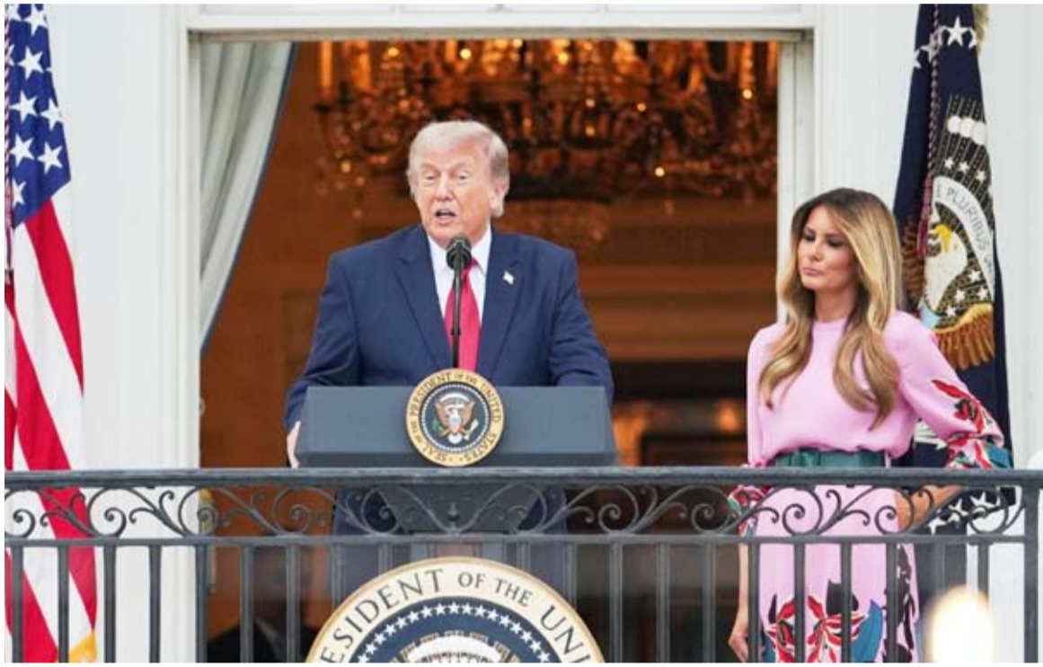
دونالد ترامب وميلانيا ترامب خلال زهرة الكونغرس

وشدد الرئيس الأمريكي على أن الولايات المتحدة ستهاجم إيران إذا قُضت الحياة الدبلوماسية، مشيراً إلى أنه وجه البيتاغون للبقاء في حالة تأهب قصوى لشن هجوم شامل على إيران، في حال عدم التوصل إلى اتفاق يلبى الشروط الأمريكية.