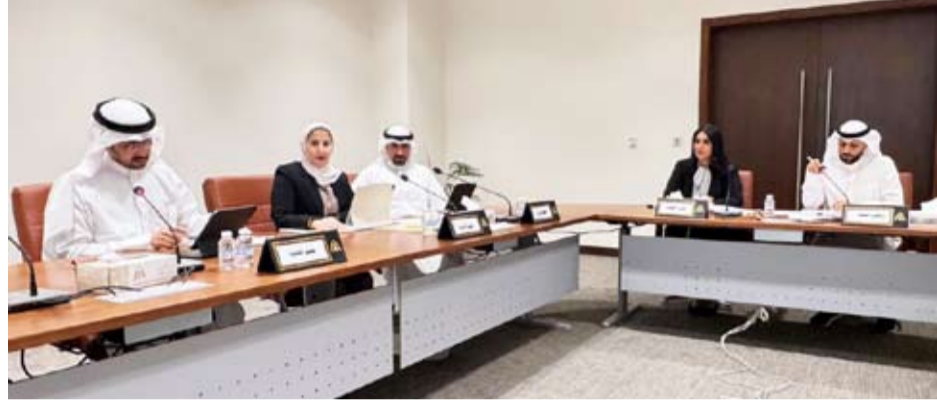
جانب من اجتماع لجنة الإصلاح والتطوير

التنفيذي لبلدية الكويت في التخطيط والدراسات المرورية. «أوصت اللجنة بتبني الحلول التقنية بتأخير إصدار تراخيص البناء من إدارة التراخيص الهندسية وتحفيز ودعم الكوادر الوطنية كما أوصت بتبني الحلول التقنية والتحول الرقمي في الإجراءات الخاصة بالدورة المستندية في بلدية الكويت بخصوص إصدار شهادة الأوصاف وعدد الإجراءات الأخرى المرتبطة بالعمل البلدي وتحفيز ودعم الكوادر الوطنية