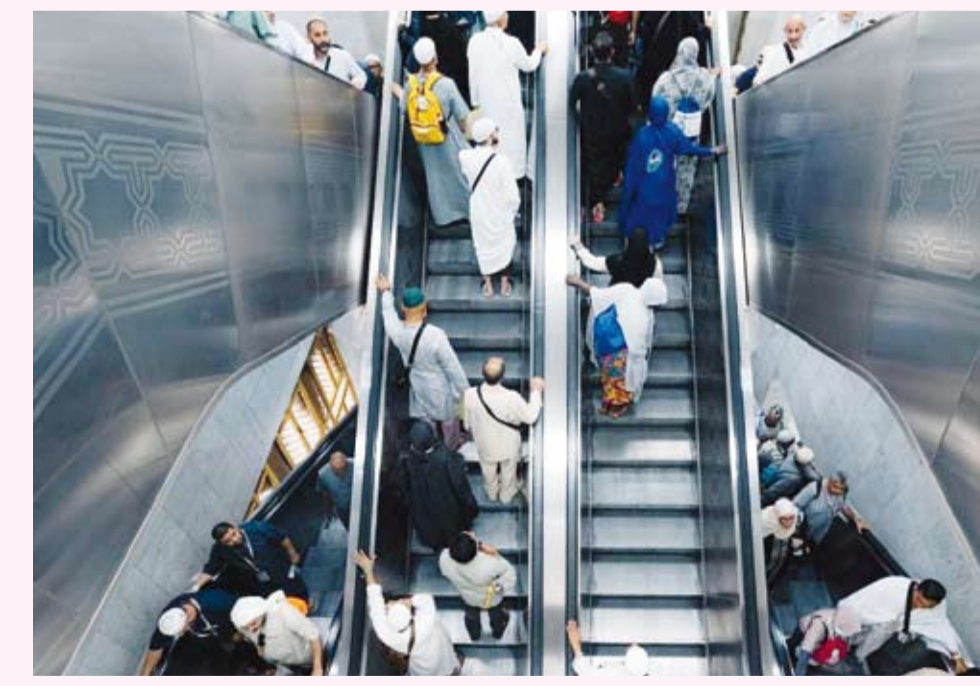
تسهيل التنقل عبر السلالم الكهربائية

تواصل الهيئة العامة للعناية بشؤون المسجد الحرام والمسجد النبوي تعزيز منظوماتها التشغيلية والتقنية، عبر تسخير أحدث الحلول العالمية لتوفير بيئة مريحة وآمنة لضيوف الرحمن داخل الحرم الشريفين وساحتهما، بما يواكب الكثافة العالية لموسم حج هذا العام، ويرتقي جودة التجربة التعبدية. ويشهد المسجد الحرام تشغيل إحدى أكبر منظومات التبريد في العالم، بطاقة إجمالية تصل إلى (155) ألف طن تبريد، موزعة بين محطتي الشامية (120) ألف طن، وأجباد (35) ألف طن، إذ تعتمد هذه المنظومة على تبريد المياه إلى درجات تتراوح بين (4) و(5) درجات مئوية قبل ضخها عبر شبكة متكاملة إلى وحدات مناولة الهواء في الغرف الميكانيكية، ليتم فيها إجراء عملية التبادل الحراري، ثم دفع الهواء النقي المبرد إلى جميع أرجاء المسجد الحرام. وجرى عمليات تجديد وتطوير وحدات مناولة الهواء، واستبدال جميع المبادلات الحرارية باخرى جديدة، إضافة إلى تغيير جميع الفلاتر الخاصة بتقنية الهواء بشكل دوري؛ للحفاظ على درجات حرارة مستقرة بين (22) و(24) درجة مئوية، وتدار هذه العملية عبر (77) حساساً حرارياً موزعة بدقة، تستجيب للتغيرات في الكثافة البشرية، خاصة خلال أوقات الذروة، إلى جانب أنظمة تنقية هواء متقدمة بكفاءة تصل إلى 95% مدعومة ببرامج صيانة وقائية مستمرة؛ لضمان الاستدامة التشغيلية.