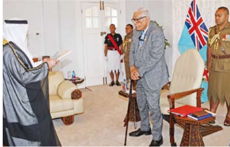
الشيخ صباح ناصر المالك الصباح يقدم أوراق اعتماده إلى رئيس فيجي

قدم السفير الشيخ صباح ناصر المالك الصباح سفير الكويت لدى نيوزيلندا، أمس، أوراق اعتماده سفيراً فوق العادة ومفوضاً غير مقيم لدولة الكويت لدى جمهورية فيجي إلى الرئيس راتو نايكاما تاواكيكولاتي لالابالافو رئيس جمهورية فيجي. وذكرت سفارة الكويت في ويلينغتون في بيان لـ (كونا)، أن ذلك جاء خلال مراسم رسمية أقيمت ونقل خلالها سفير الكويت إلى رئيس فيجي تحيات صاحب السمو أمير البلاد الشيخ مشعل الأحمد وتمنيات سموه بدوام التقدم والازدهار لجمهورية فيجي وشعبها الصديق.