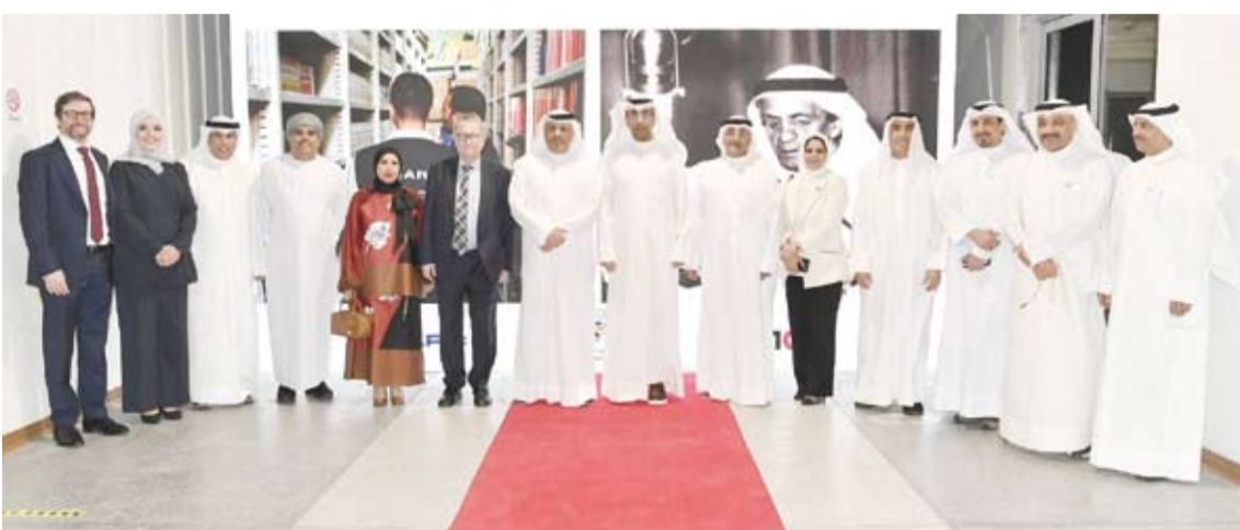
لقطة جماعية خلال حفل افتتاح المشروع