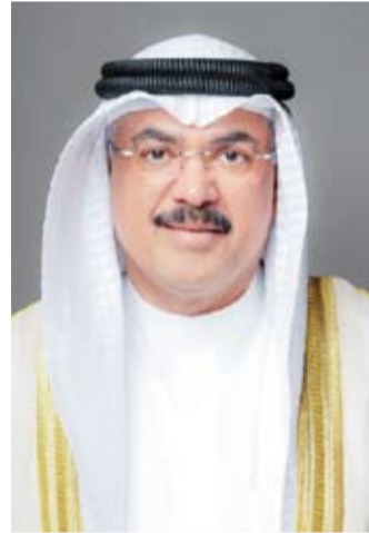
وزير التربية سيد جلال الطبطبائي

ترأس وزير التربية سيد جلال الطبطبائي، أمس، اجتماعاً موسعاً بحضور قيادات ومسؤولي الوزارة من مختلف القطاعات لمتابعة سير الأعمال والمشروعات التربوية والتعليمية والوقوف على آخر المستجدات المتعلقة بخطط التطوير وتسريع وتيرة الإنجاز استعداداً للمرحلة المقبلة. وأكد الوزير الطبطبائي في بيان صحفي صادر عن الوزارة، أهمية تكامل الجهود بين مختلف القطاعات والعمل وفق خطط زمنية واضحة بمؤشرات أداء دقيقة تضمن إنجاز المشروعات التربوية وفق المواعيد المحددة بما يعزز كفاءة المنظومة التعليمية ويرتقي بمستوى الخدمات المقدمة.