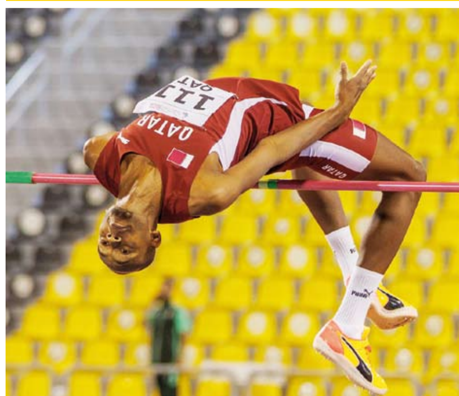
القطري معزز عيسى برشم يتألق في الصين

توج اللاعب القطري معزز عيسى برشم بالميدالية الذهبية لمسابقة الوثب العالي ضمن منافسات بطولة آسيا الأولى لخصصات القفز والوثب العالي، المقامة بمدينة شونغنينغ الصينية، بعدما حل في المركز الأول عقب تسجيله ارتفاعاً بلغ 2.23 متر. ونجح البطل الأولمبي والعالمي في حسم الصدارة متفوقاً على نخبة من أبرز واثبي القارة الآسيوية، ليواصل حضوره القوي على الساحة القارية والدولية ويضيف لقباً جديداً إلى سجله الحافل بالإنجازات. وشهدت البطولة، التي ينظمها الاتحاد الآسيوي لألعاب القوى، مشاركة واسعة من أبطال آسيا وسط منافسة قوية في مسابقات القفز والوثب، إلى جانب حضور جماهيري وتغطية إعلامية كبيرة. وتأتي ذهبية برشم امتداداً لمسيرته المميّزة في مسابقات الوثب العالي، بعدما سبق له التتويج بأربع ميداليات أولمبية، أبرزها ذهبية دورة ألعاب طوكيو 2020، إلى جانب فضييتي لندن 2012 وريو دي جانيرو 2016 وبرونزية باريس 2024، فضلاً عن إحرازه لقب بطولة العالم لألعاب القوى ثلاث مرات متتالية. ويعد برشم أحد أبرز الرياضيين في تاريخ ألعاب القوى القطرية والعالمية، بعدما حافظ لسنوات على حضوره بين كبار أبطال الوثب العالي على مستوى العالم.